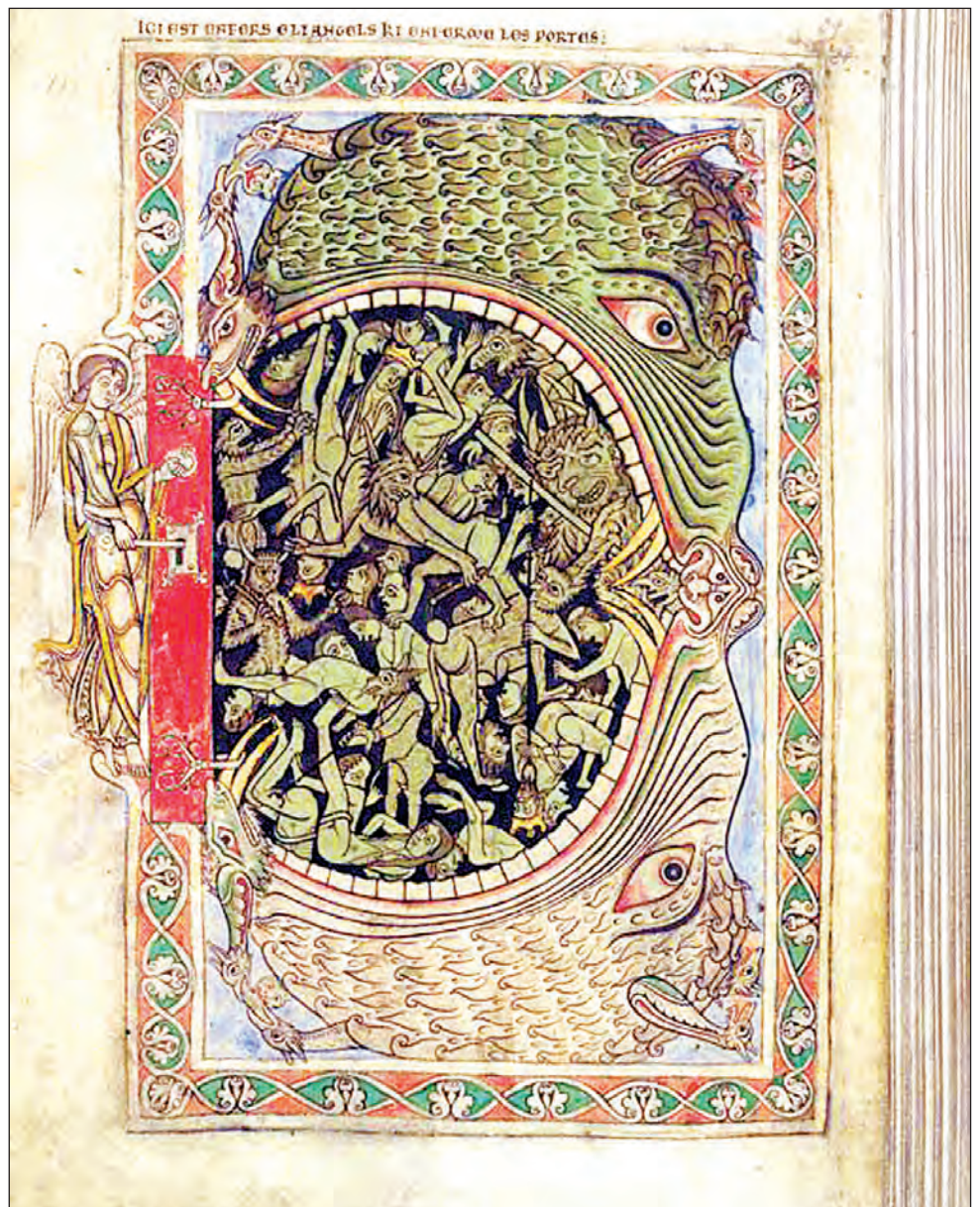
▲ Boca del Infierno cerrada por un arcángel, del Salterio de Winchester (libro de salmos), alrededor del año 1150, tomada del libro Hombres y mujeres de la Edad Media , del historiador medievalista y escritor francés Jacques Le Goff.

Catástrofes como la pandemia que azotó Europa fueron entendidas como castigos y pecados del hombre, y como pruebas del inmenso poder sobre el universo que Satanás recibió del pecado original. Desde entonces, el arte da testimonio en múltiples formas del miedo al diablo y sus acólitos que se apoderan de una civilización, añade Le Goff.