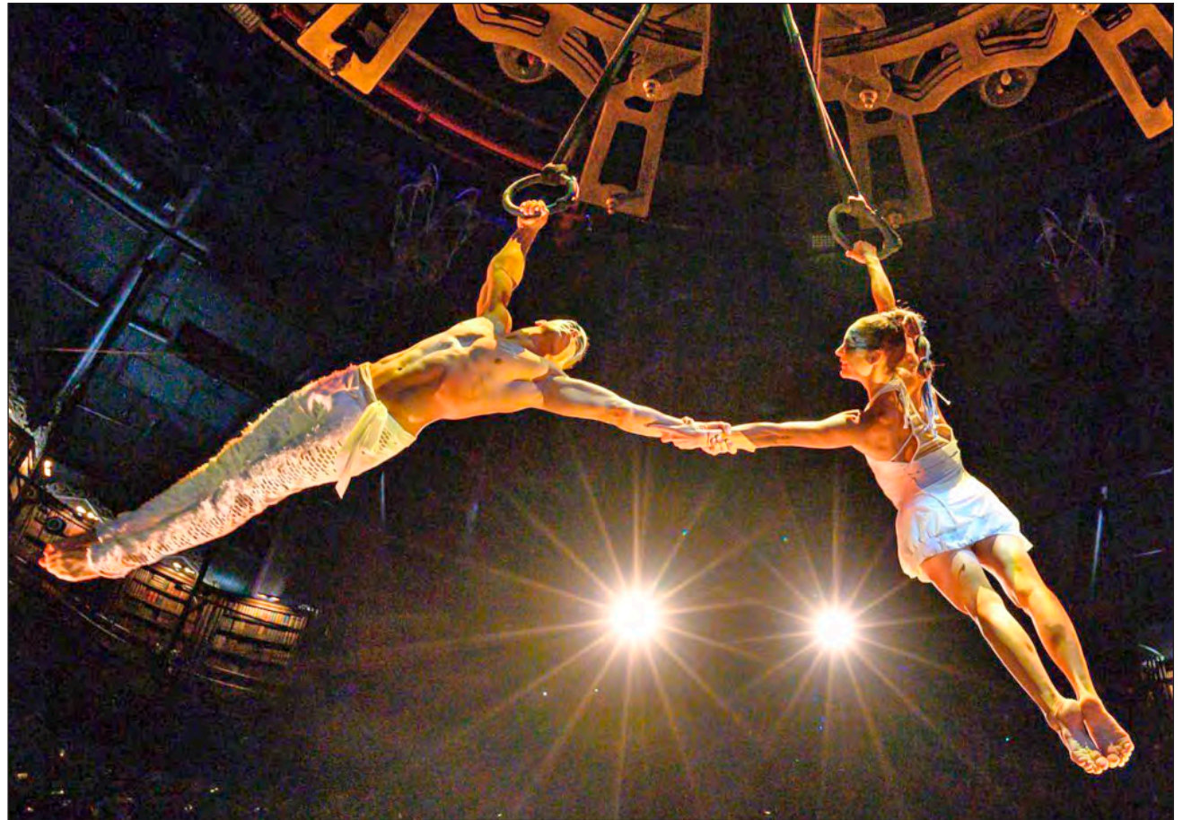
▲ JOYÀ es el primer espectáculo residente del circo en América Latina y se exhibe en un teatro construido especialmente para la obra, frente al complejo Vidanta.

JOYÀ, inaugurado en 2014 por la compañía canadiense Cirque du Soleil en sociedad con la cadena hotelera mexicana Vidanta, es el segundo espectáculo que reabre en el mundo. En ju-