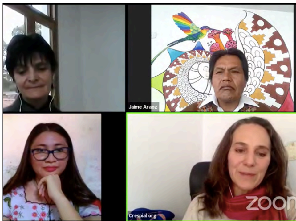
▲ El foro Miradas del patrimonio cultural inmaterial de Latinoamérica frente al COVID-19 reunió virtualmente a líderes indígenas de la Amazonía, Perú y Yucatán.

Los líderes indígenas expresaron que la pandemia en algunos casos ha generado mucho miedo y preocupación en las comunidades, ha ocasionado pérdidas de ancianos, de ancestros, pero por otro lado ha servido para generar una resistencia ante esta emergencia; muchas personas, por la crisis, han retornado a sus lugares de origen y se han conectado con otros pueblos