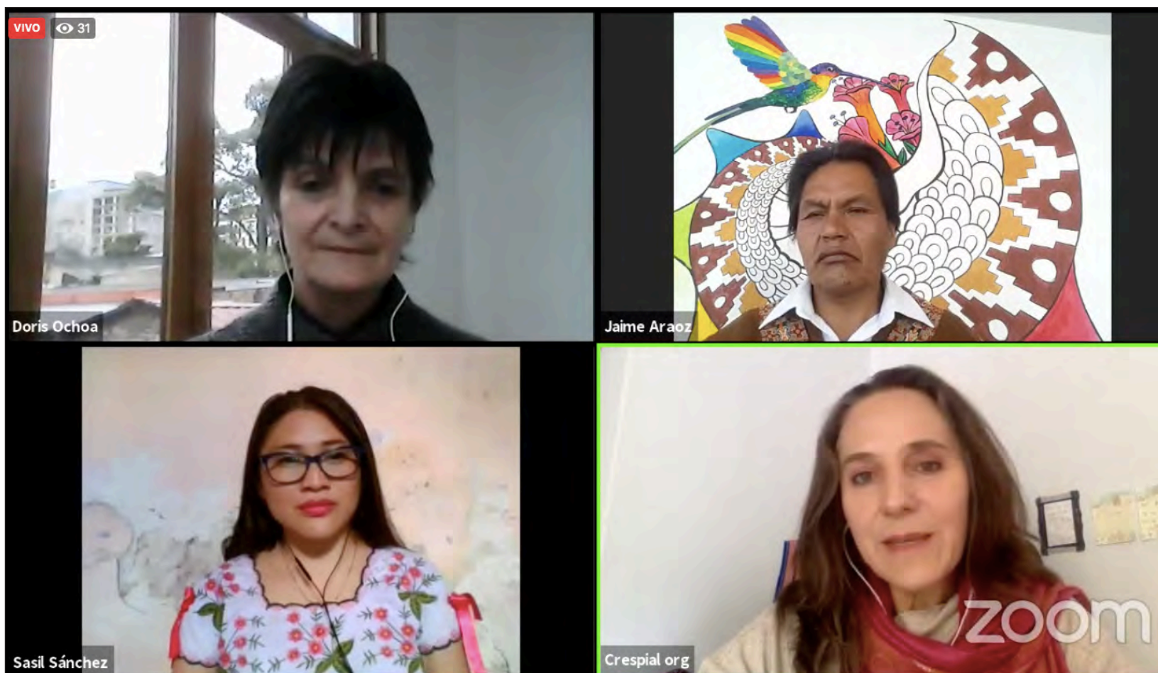
Oochel Captura de pantalla CRESPIAL

“Catástrofe cultural” por pandemia, advierten líderes indígenas en foro