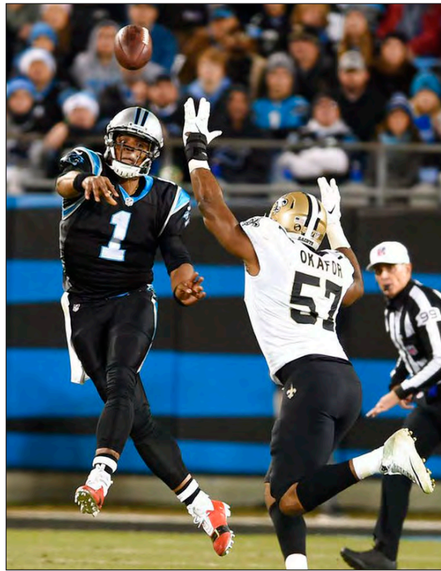
▲ Cam Newton tiene el potencial para darle gran dinamismo a la ofensiva patriota.

Con el joven Jarrett Stidham remplazando a Tom Brady, el panorama lucía complicado para los seis veces monarcas. Pero con Cam al 100%, los "Pats" tendrían un arma pocas veces vista en la NFL, un pasador con gran estatura, físico y habilidad para correr. El dé-