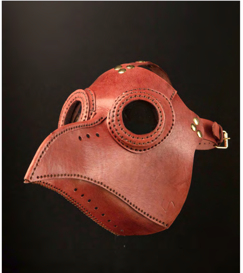
▲ Las máscaras son artesanales, hechas con cuero de vaca y cosidas a mano.

Son piezas artesanales, hechas con cuero de vaca y cosidas a mano. "Vienen con mi firma, tienen un certificado de autenticidad, están numeradas...", destacó José Rocha. Cada una le lleva desde unas cuantas horas hasta cinco días de trabajo. Los diversos modelos pueden consul-