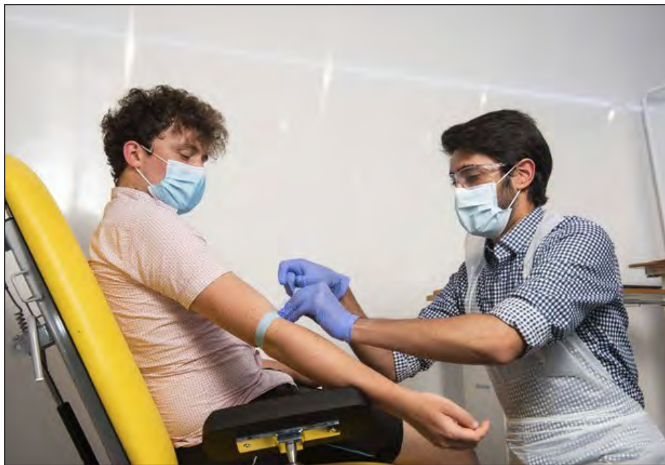
▲ Laboratorios como Johnson & Johnson y AstraZeneca se comprometieron a vender inicialmente sus vacunas sin obtener ganancias.