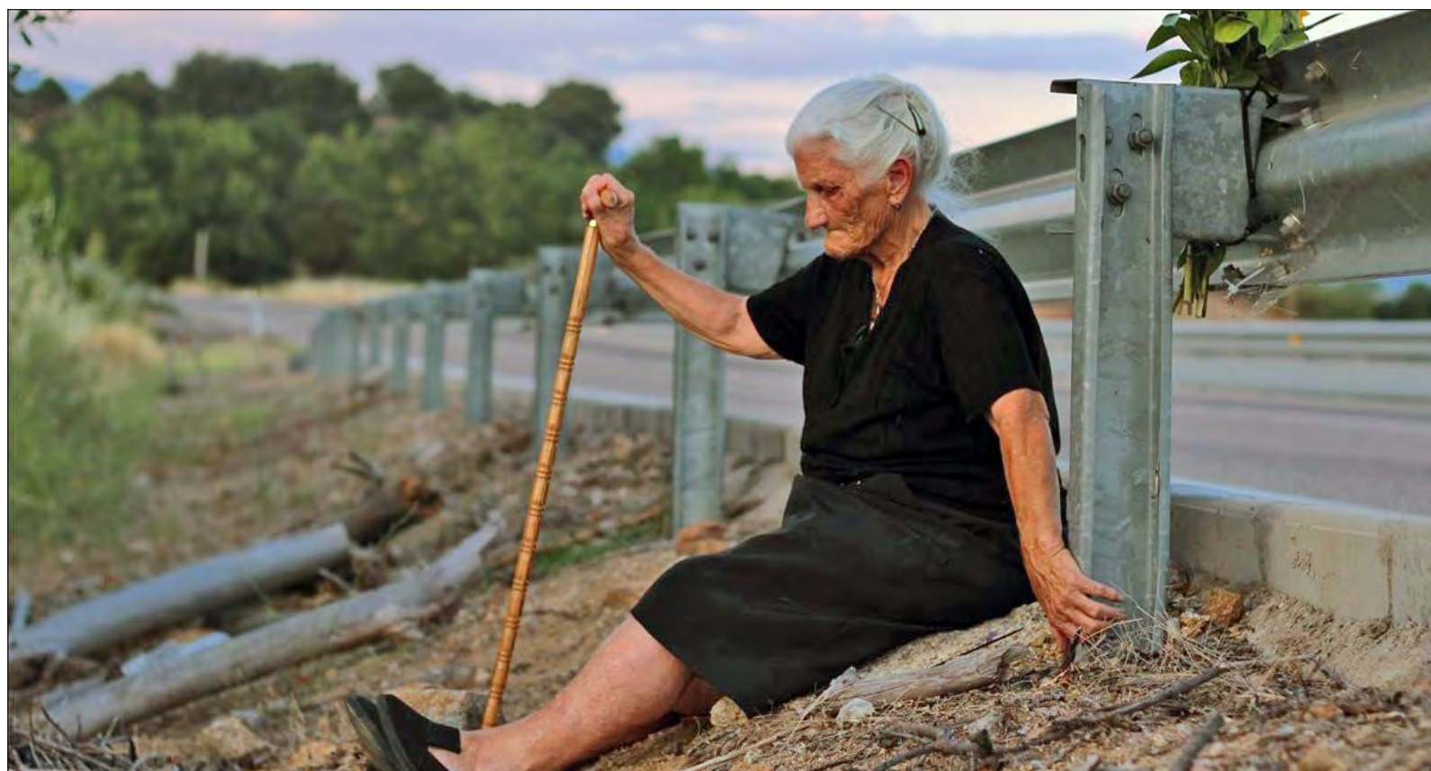
▲ El documental arranca con una anciana, casi sin voz, pero que rompe el silencio y señala el lugar de la fosa común en la que yace su madre. Foto fotograma de El silencio de los otros