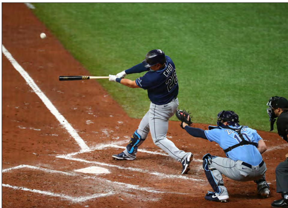
▲ Las Mantarrayas cuentan con el arsenal para pelear en la División Este de la Liga Americana con los Yanquis.

Charlie Morton, Blake Snell y Tyler Glasnow encabezan una rotación con argumentos para considerarse