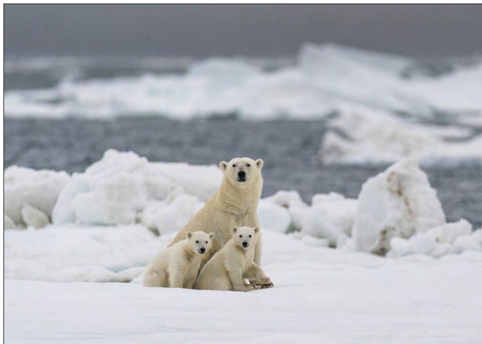
▲ El desafío es mayor para las hembras que entran en sus refugios para parir en medio del invierno y salen en la primavera con sus oseznos.

Con el calentamiento del planeta, dos veces más rápida en el Ártico, la falta de hielo dura cada vez más tiempo. Incapaces de hallar