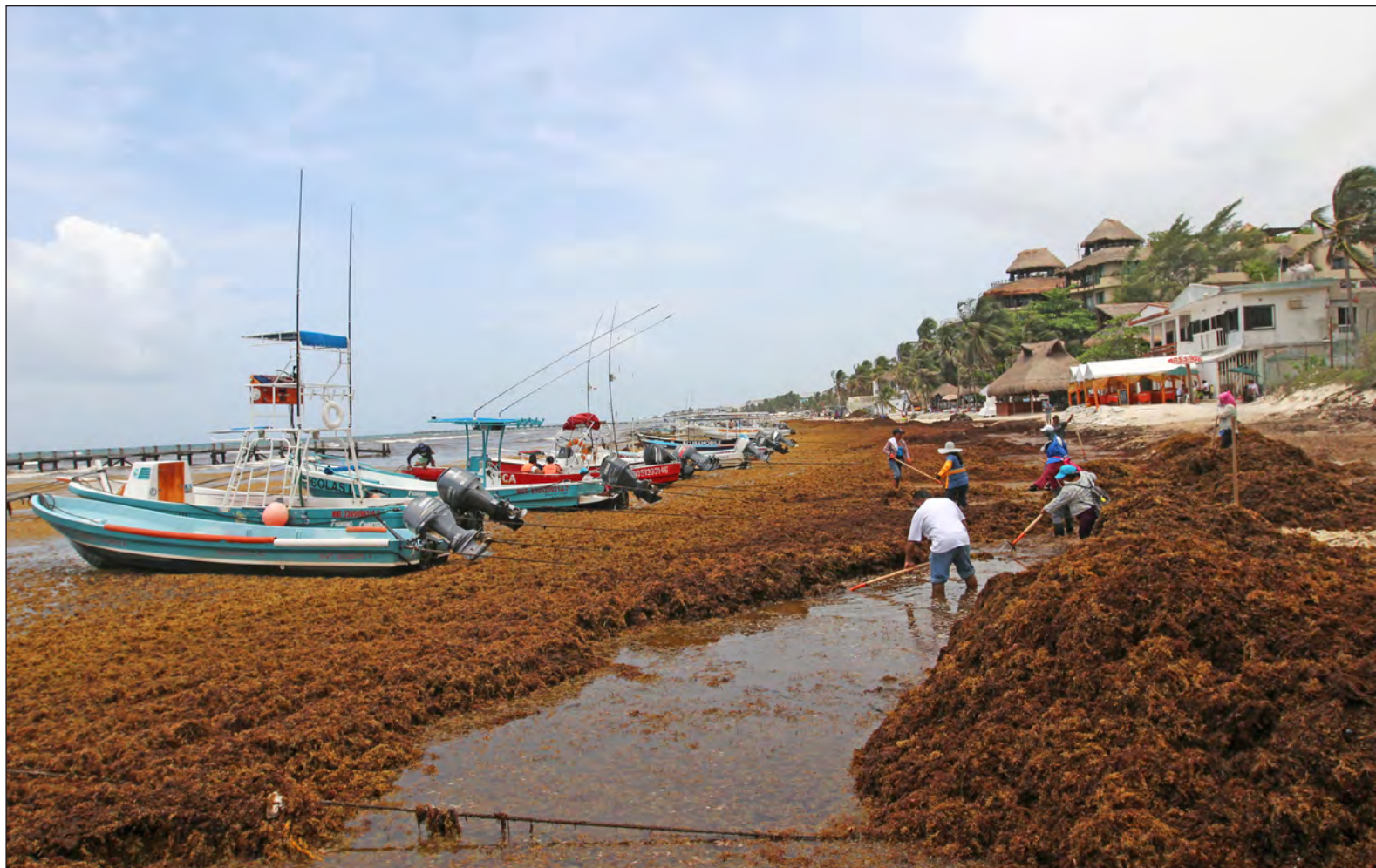
▲ De acuerdo a cálculos de expertos, se requieren 400 millones de pesos para trasladar las 500 mil toneladas de sargazo que llegan a las costas de Quintana Roo cada año.

*Premio nacional al Mérito Ecológico daldana@cinvestav.mx