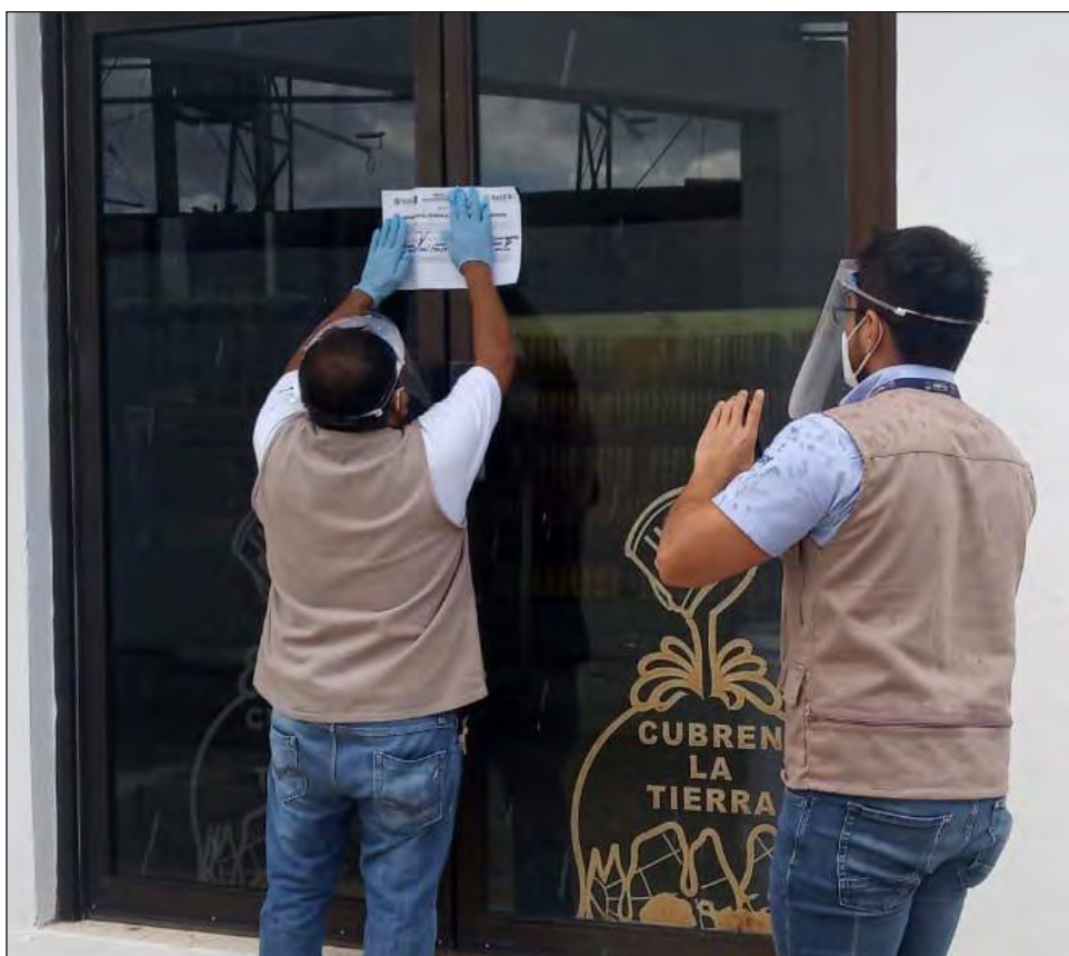
▲ Los cierres se realizaron luego de una primera revisión de la que resultó un apercibimiento.