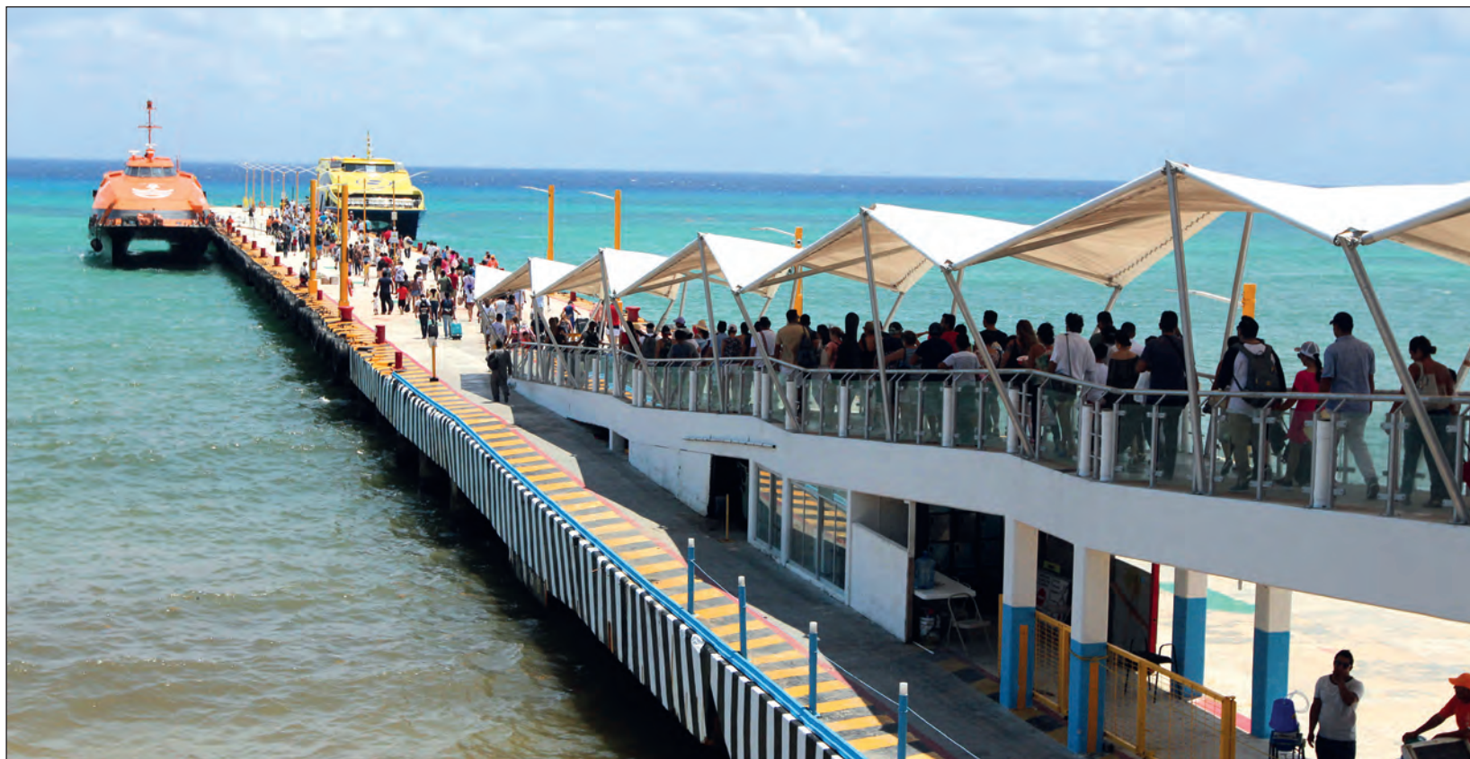
▲ Para la zona norte de Quintana Roo es fundamental el servicio de transporte marítimo ya que por esta vía se establece comunicación y traslado de pasajeros de y hacia Isla Mujeres y Cozumel. La imagen corresponde a abril del año pasado, en Playa del Carmen.

Ahora de nueva cuenta están en el ojo del huracán y de ser nuevamente responsables la Secretaría de Comunicaciones y Transportes (SCT) podrá emitir la regulación de tarifas en favor de la población usuaria y los visitantes al Caribe mexicano; apenas en noviembre pasado hubo un alza en los costos para los quintanarroenses de más de 100%, es decir, de 70 pesos que pagaban antes por un viaje sencillo, subió hasta 150 pesos, y el redondo pasó de 140 a 300 pesos.