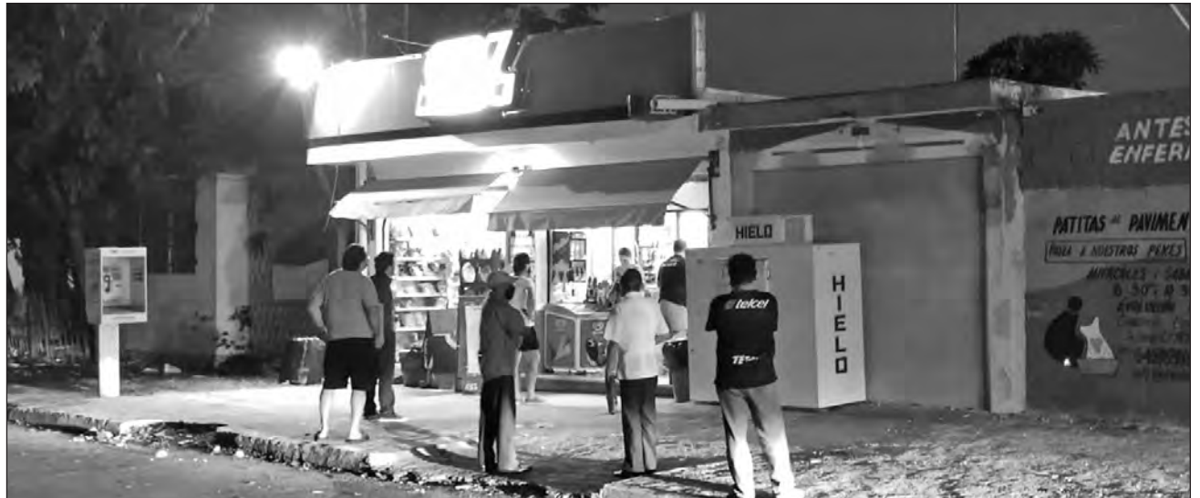
▲ Previo al anuncio del retorno de la ley seca , se observaron largas filas en supermercados y agencias de cerveza, ante el rumor del decreto de la medida.

Consideró que la ciudadanía ha confundido la reactivación económica con la social, por lo que emitió un “último llamado a tomar con seriedad una pandemia que ha causado muerte en el estado”.