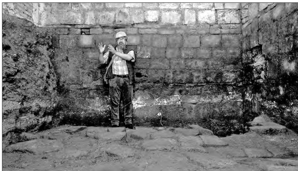
▲ Guiados por las fuentes históricas, los arqueólogos consideran que bajo los pisos del Nacional Monte de Piedad, ubicado a un costado de la Catedral Metropolitana de la Ciudad de México, se encuentran los cimientos del edificio que fue morada para la comitiva de Cortés a su llegada al corazón de Tenochtitlan.

Tras una inspección, con motivo de trabajos emprendidos en la mitad norte del inmueble histórico, el personal del PAU efectuó un salvamento arqueológico entre los primeros días de septiembre de 2017 y mediados de agosto