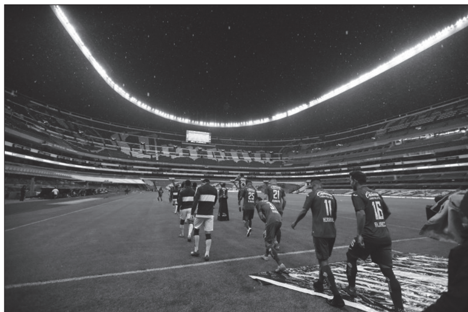
▲ Todo apunta a que en el próximo Apertura 2020 no habrá grandes fichajes en el fútbol mexicano.

Las Águilas también añadieron a los zagueros Luis "Hueso" Reyes y Adrián Go-