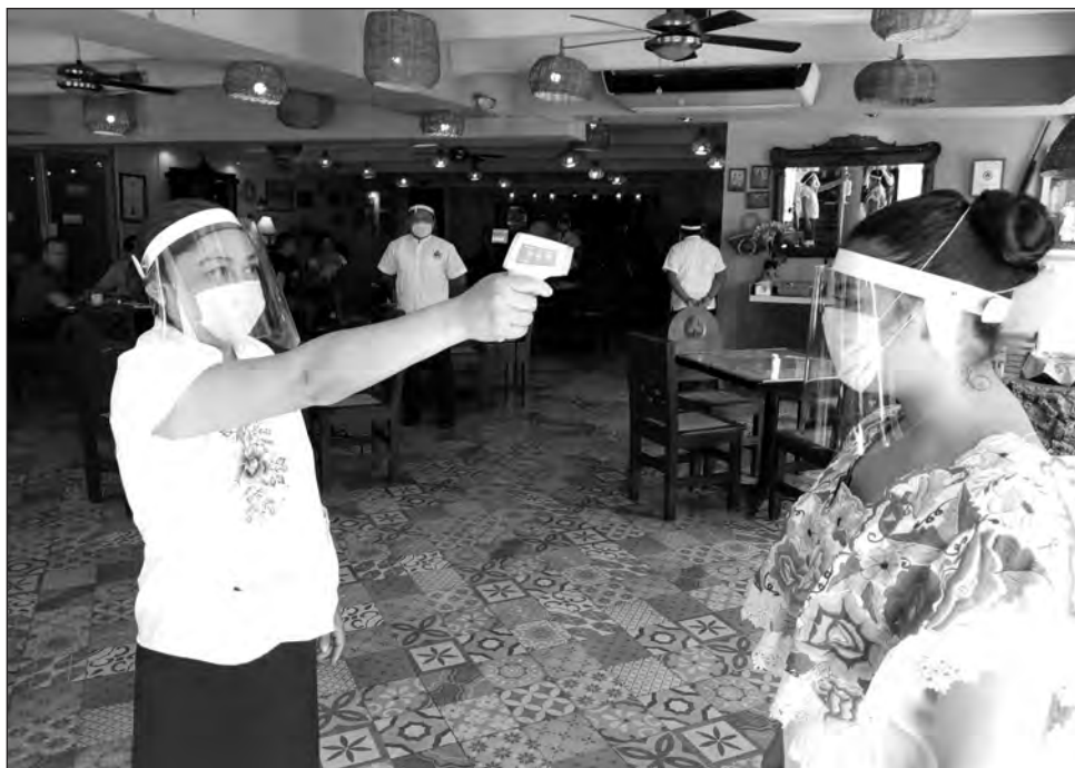
▲ Las empresas turísticas que busquen el sello Punto Limpio tendrán el aval de las secretarías federales de Salud y del Trabajo.