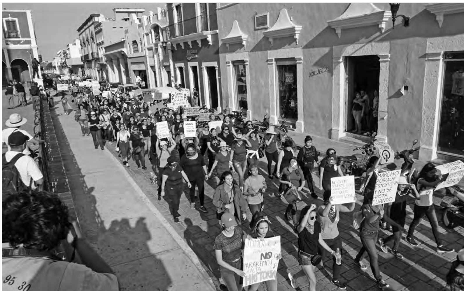
▲ Recordamos hoy el último abrazo colectivo el 8 de marzo del 2020, miles de feministas nos organizamos para una caminata, y caminando cantamos, gritamos, bailamos para exigir nuestro derechos.