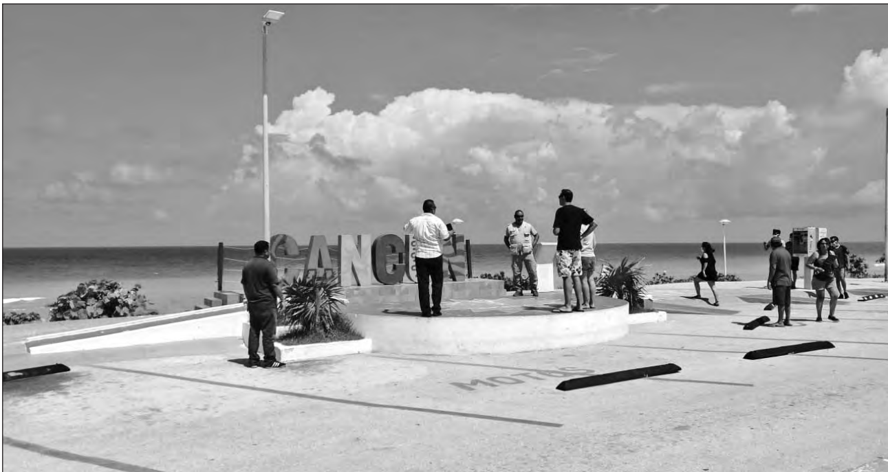
▲ El pasado 1º de julio, más de 12 mil 300 turistas durmieron en la zona de playas; a la fecha la cifra es mayor a los 20 mil 700, con estancias de cuatro y cinco días.

El pasado 1º de julio, más de 12 mil 300 turistas durmieron en la zona de playas; a la fecha la cifra es mayor a los 20 mil 700, con estancias de cuatro y cinco días. La industria sin chimeneas en el centro de la ciudad oferta actualmente poco más de 4 mil habitaciones de las más de cinco mil que operan en la ciudad, hoteles que iniciaron el mes con 13.5% de alojamientos rentados, porcentaje que ha incrementado hasta llegar a un 17.2%.