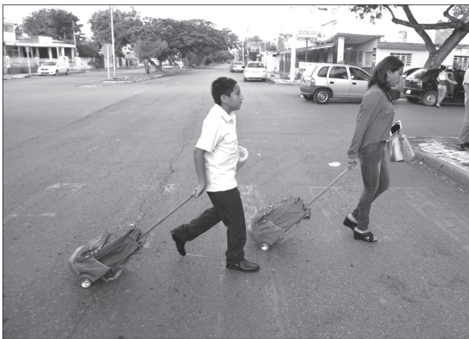
▲ En la nueva ley se reafirma que al Estado le corresponde la rectoría de la educación.

En materia de transporte alternativo, contempla la regulación y certeza jurídica para el llamado, también, transporte de "última milla", como mototaxis, calesas tradicionales y eléctricas, tricitaxis, motonetas, scooters y otras modalidades de transporte, se aprobó por mayoría el agregado de este capítulo a la Ley de Transporte.