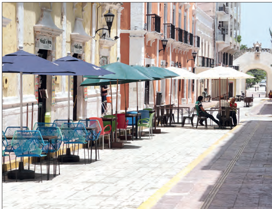
▲ Los meseros solían obtener su mayor ingreso de las propinas, pero ahora apenas hay mesas ocupadas, y cuando las hay sólo atienden a dos comensales.