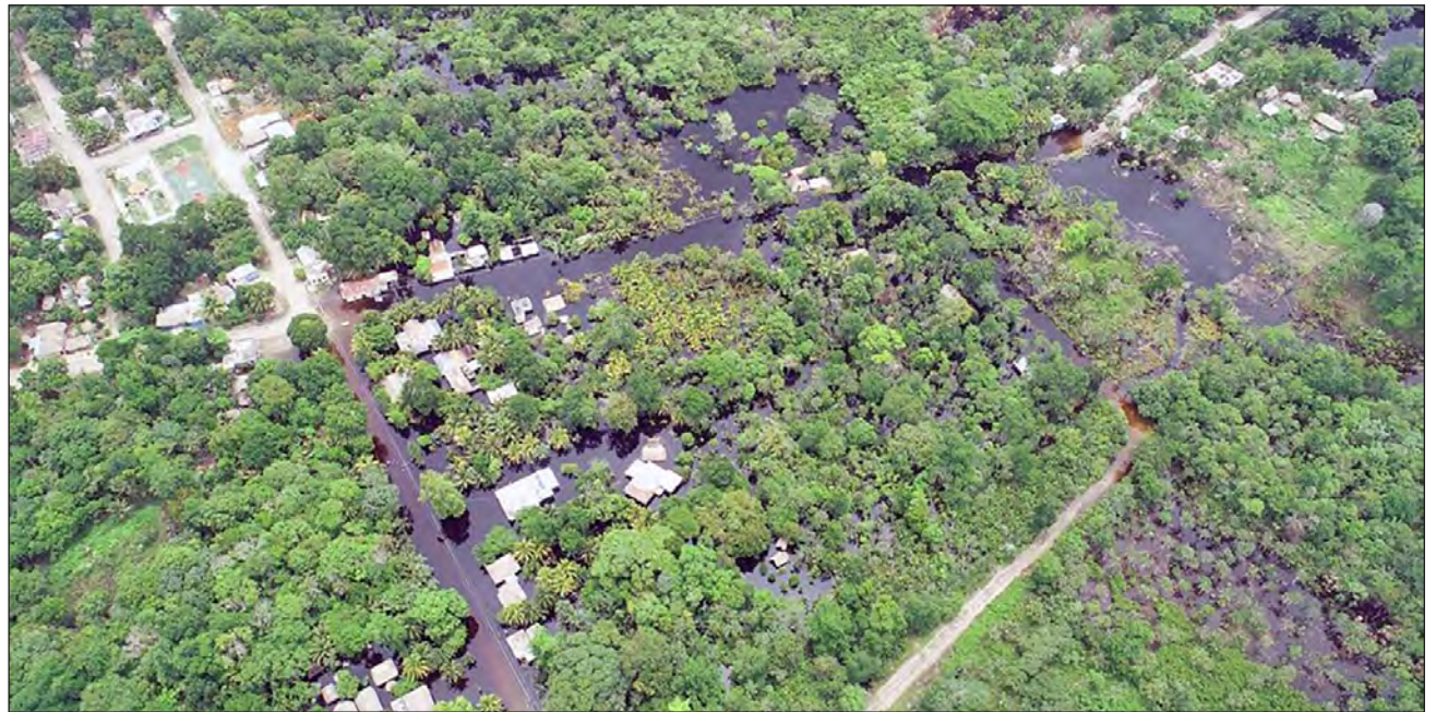
▲ Cerca de 14 mil hectáreas de tierras quedaron inundadas por la tormenta tropical Cristóbal.

Las lluvias causadas por la tormenta tropical Cristóbal dejaron pérdidas por 250 millones de pesos, perjudicando a 3 mil campesinos de más de 150 localidades del sur del estado; además cerca de 14 mil hectáreas de tierras quedaron inundadas, y hasta 7 mil colmenas sufrieron afectaciones, por lo que se dejó de producir 205 mil 920 kilogramos de miel, informó Luis Torres Llanes, titular la Secretaría de Desarrollo Agropecuario, Rural y Pesca (Sedarpe).