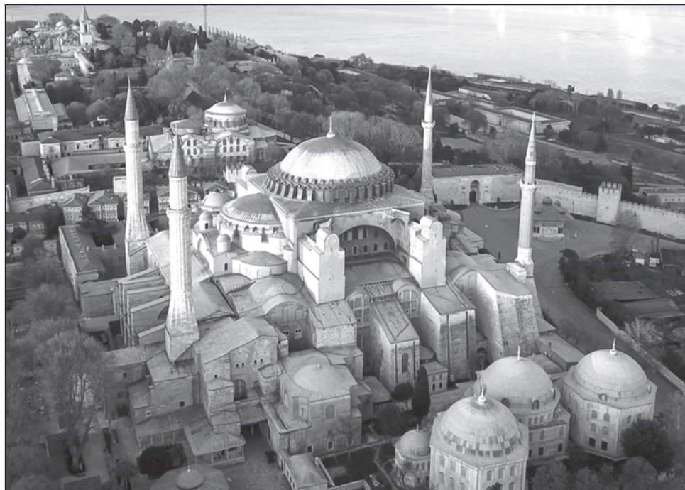
▲ La Dirección de Asuntos Religiosos de Turquía reveló que los frescos cristianos no obstaculizarán la oración musulmana en el templo

El discurso oficial de Erdogan en árabe difundido por el servicio de prensa incluye estas referencias, pero