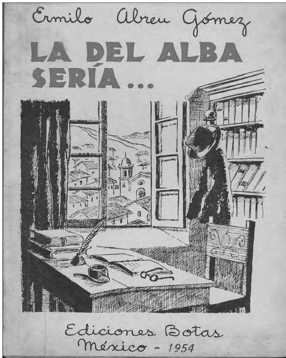
▲ Abreu Gómez solía referir la importancia que el clima de una época ejerce sobre las vocaciones creadoras, pero del mismo modo reconoció la influencia de una geografía específica en la formación del estilo. Portada del libro La del alba sería... de Emilio Abreu Gómez

Por su parte, el pulcro artífice de Canek refiere en sus memorias el aburrimiento que le produjo la lectura de los clásicos franceses en su juventud, si bien en su momento apreció en justa medida varios de ellos, como los escritos de Pascal y de