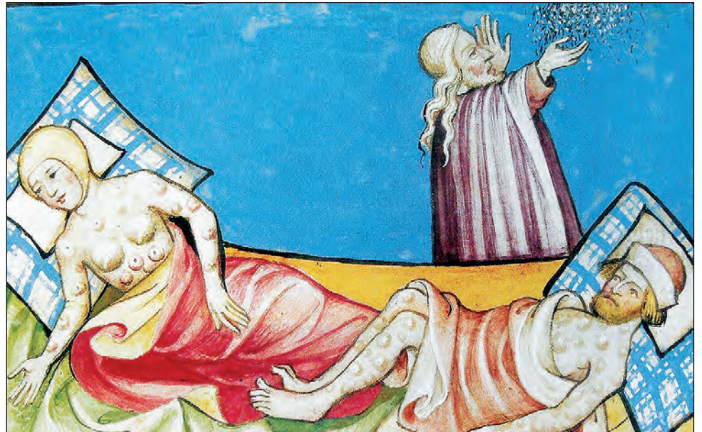
▲ Para el investigador, el reto de los gobiernos del mundo es garantizar que el bienestar del ser humano sea generalizado. En la imagen izquiera, ilustración de la peste en la Biblia de Toggenburg (1411); abajo, La danza de la muerte (1493), de Michael Wolgemut.

En América, justo hace 500 años, continúa en su texto el especialista, “en el verano de