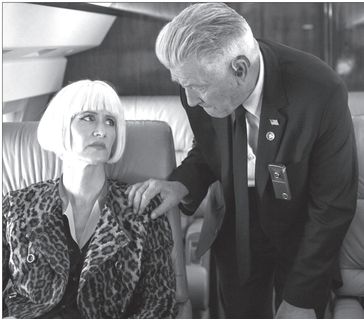
▲ Quizás sea tiempo de dar paso a esa nueva forma de mirar las cosas, exorcizar ese interminable pretexto de querer hacer algo y dejarlo para después. En la imagen, fotograma de Twin Peaks

A propósito de lo que me ocupa en este escrito y lo que quiero contar sobre “nada para después”, quiero recordar al detective Cooper, amante de las donas y del mejor café que pudiera encontrar en sus caminos de la vida, hay un extracto bellissimo donde la cámara se aleja y al fondo, en un pequeño restaurante, se ve al detective y al shérif departiendo una humeante taza de café. La frase fue: “Cada mañana hazte un regalo”, lo mismo puede ser una rica taza de café, una corbata, una tina de agua fresca, una rica cerveza, una amena charla. No importa nada más, allá afuera el mundo puede esperar.