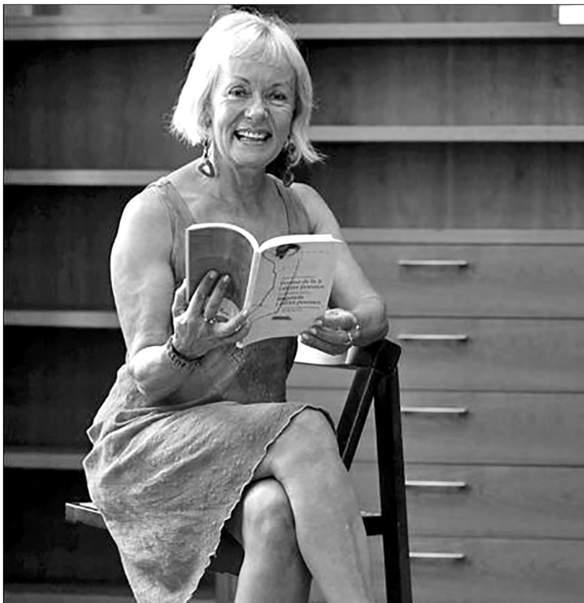
▲ Monika Zgustova plantea, con la historia de Svetlana, un síndrome: el de aquellas víctimas que sufrieron bajo una dictadura y la odiaron, pero al liberarse buscan ser vigiladas y controladas contra toda razón.

STALIN FUE UN padre tiránico, por donde quiera mirarse, que no sólo llevó hasta el suicidio a la madre de su hija sino que impidió dos relaciones amorosas que pudieron haber sido satisfactorias