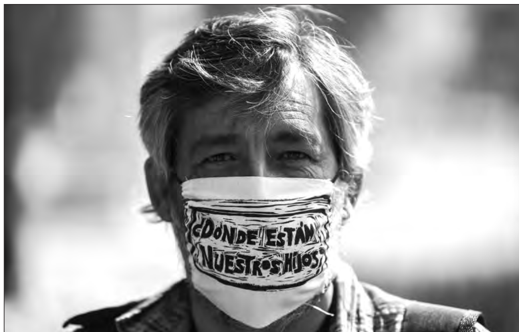
▲ Los datos presentados en el Informe sobre búsqueda, identificación y versión pública del registro de personas desaparecidas revelan la inmensa tragedia humana producida por la guerra contra el narco a partir del 2006.

En tal circunstancia resulta obligado recordar el compromiso del actual gobierno de procurar el esclarecimiento, la procuración de justicia y la reparación del daño “hasta donde sea humanamente posible”. De no cumplirse, resultará impensable superar la violencia delictiva y los hondos desgarramientos que ha generado en el tejido social, así como concretar la garantía de no repetición. Ha de reconocerse que las actuales autoridades han avanzado mucho en este camino, pero también debe admitirse que es mucho más lo que queda por hacer.