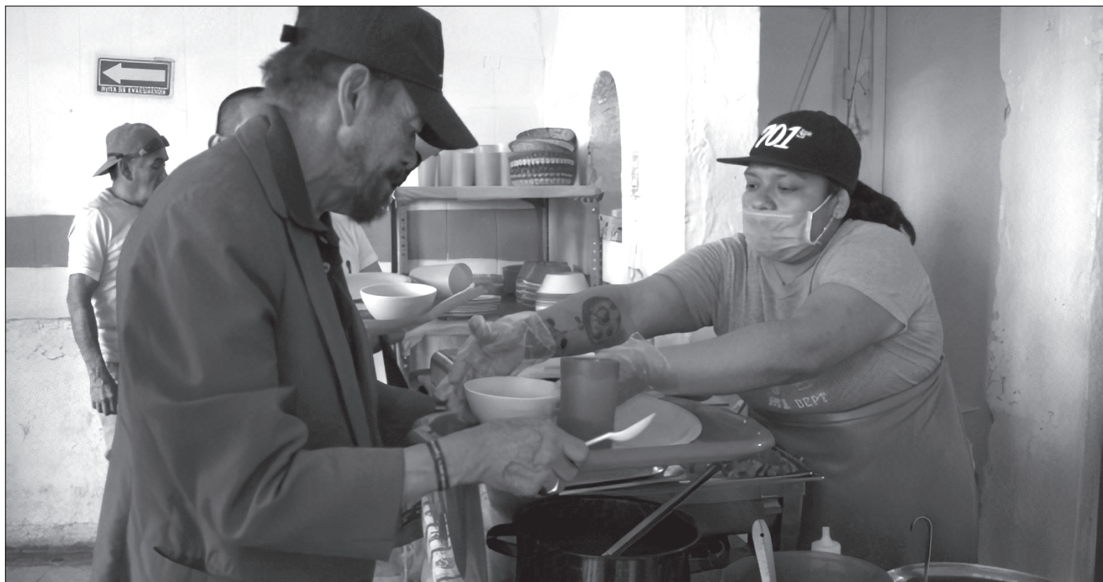
▲ La crisis del COVID-19 nos ha arrojado un recrudecimiento de las fallas estructurales de nuestra sociedad. En la imagen, uno de los mayores basureros de América Latina, en Brasil.