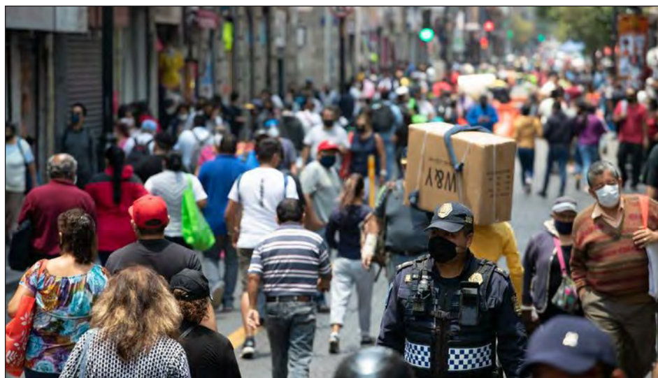
▲ Todos los sectores de la administración pública del país deben ser corresponsables para el tratamiento de la enfermedad y la información al respecto, dijo Olga Sánchez Cordero.

“Debe haber una corresponsabilidad muy clara para que se puedan tomar políticas y estrategias claras y precisas. Nosotros dependemos de la información que están subiendo las entidades federativas en estos temas”.