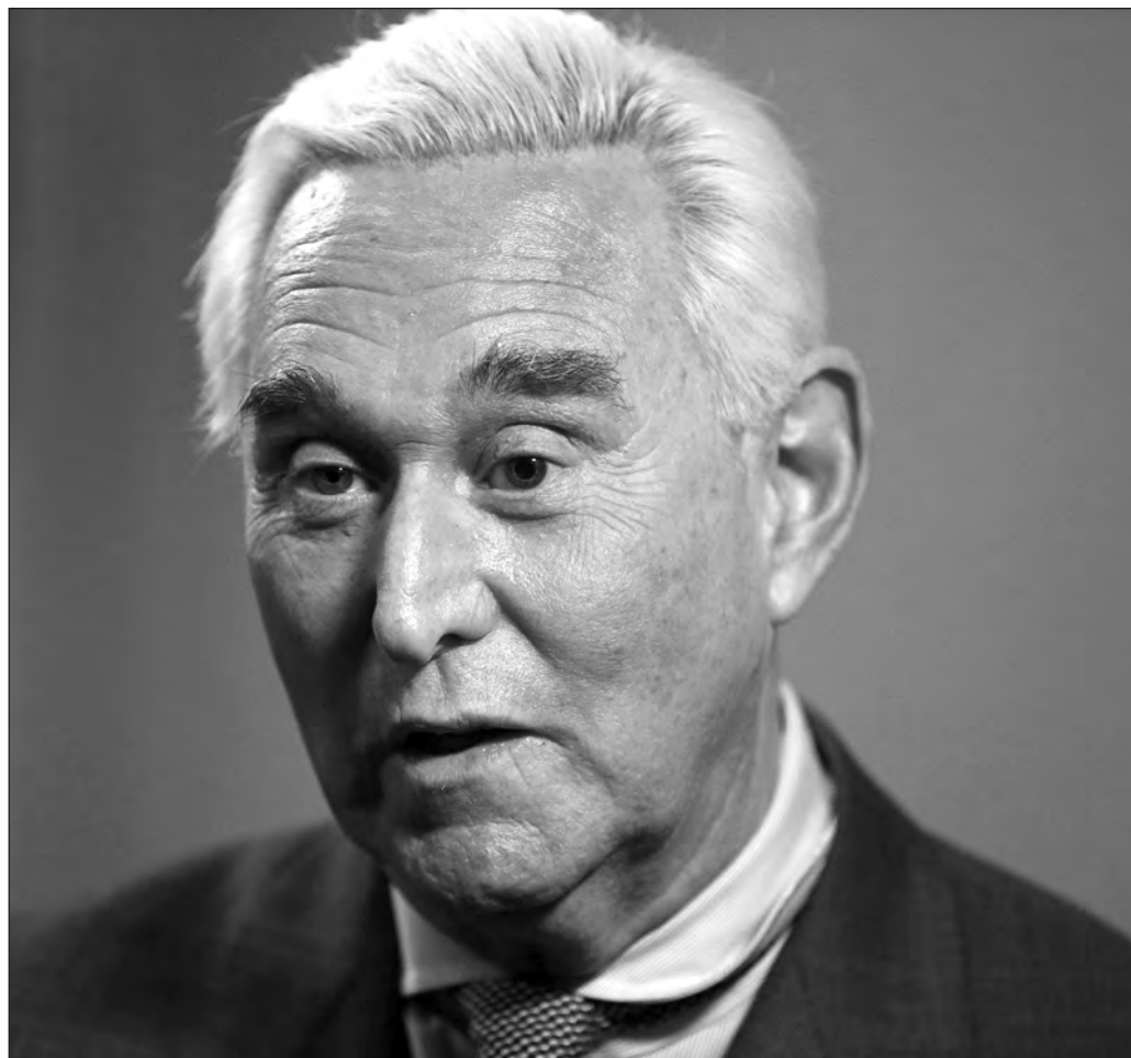
▲ Stone queda en una suerte de limbo jurídico, pues su culpabilidad no está a discusión. Simplemente es un criminal con permiso presidencial para permanecer en libertad.

El peligro evidente reside en la normalización de esta clase de acciones despóticas y abiertamente contrarias al espíritu de las leyes y de la justicia. El episodio, en suma, consolida la construcción, por parte de Trump, de una presidencia cínica.