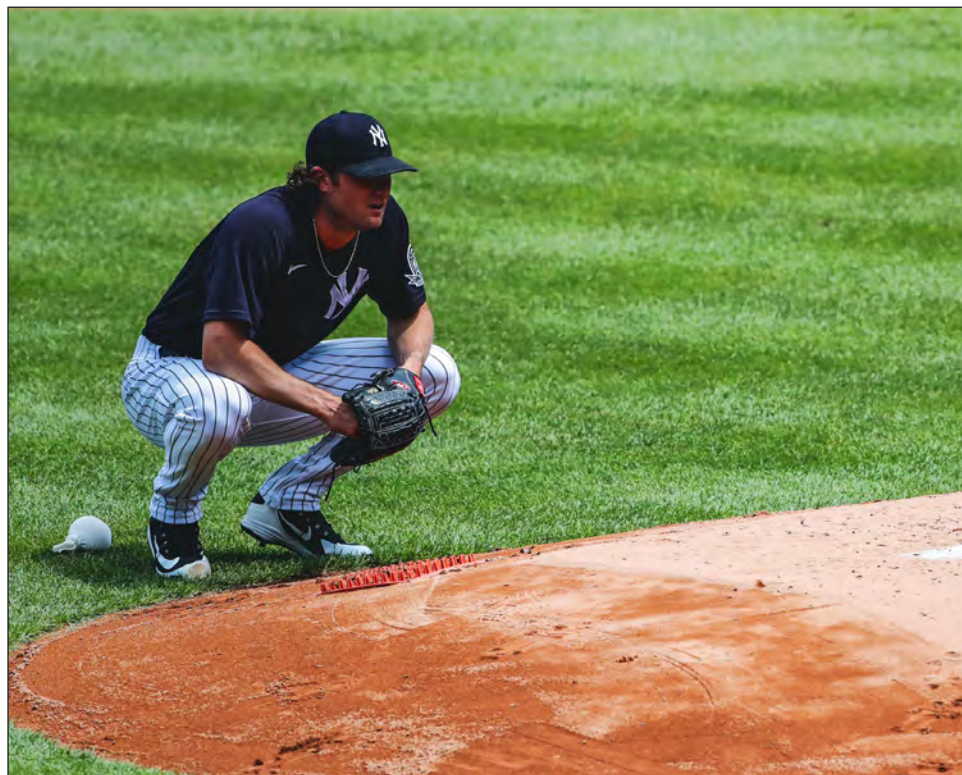
▲ El yanqui Gerrit Cole se alista para enfrentar a Max Scherzer y a los campeones Nacionales, en la noche inaugural, en Washington, el próximo día 23.

Según el mánager de los Yanquis, Aaron Boone, la recta de Cole lució mejor que en su primera salida del campamento de verano, sobre todo los pitcheos que estuvieron en la parte alta de la zona de straits. El timonel afirmó que Cole "probablemente" lance en