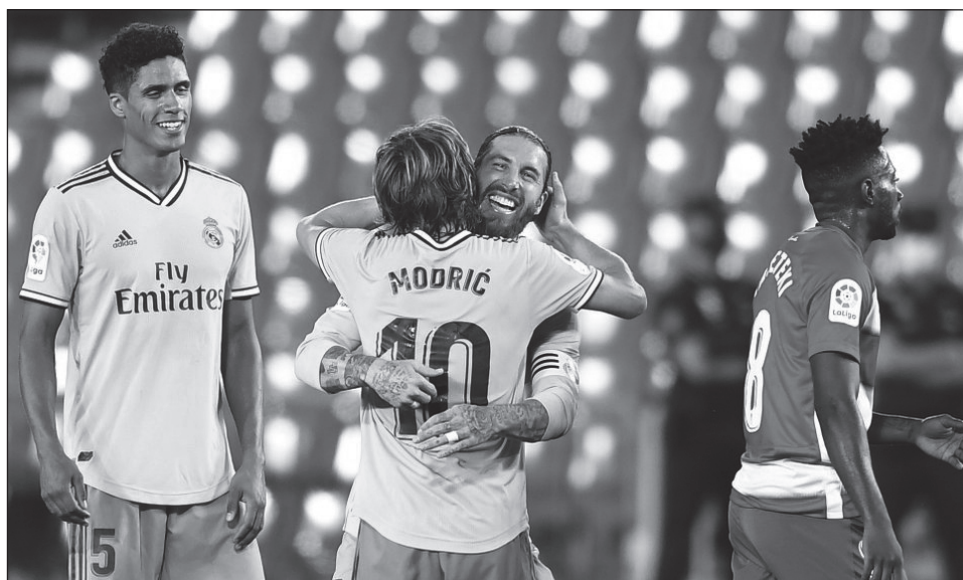
▲ Con su novena victoria consecutiva, el Real Madrid se colocó a un paso de su título 34 en la Liga de España.

Los merengues tienen la posibilidad de alzar el título este jueves si vencen al Villarreal, sin importar lo que haga el cuadro culé ante el Osasuna en la penúltima jornada.