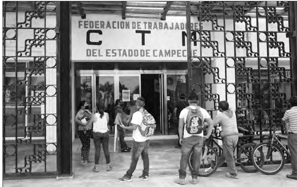
▲ En esta capital se formaron largas filas de aspirantes a trabajar en el Tren Maya, con riesgo de propagar el nuevo coronavirus.

Por ello mencionó que en reunión con comisarios municipales de algunos poblados y comunidades, resolvieron aumentar los puntos