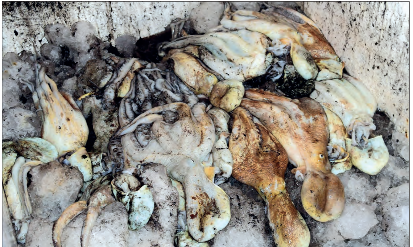
▲ La pesca de pulpo ha oscilado, en las últimas tres temporadas, entre 30 y 34 mil toneladas, de las cuales sólo el 30 por ciento se consume en el mercado nacional.

El también financiero de la Confederación Mexicana de las Cooperativas Pesqueras aseguró que otro ingrediente que se agrega a este oscuro pa-