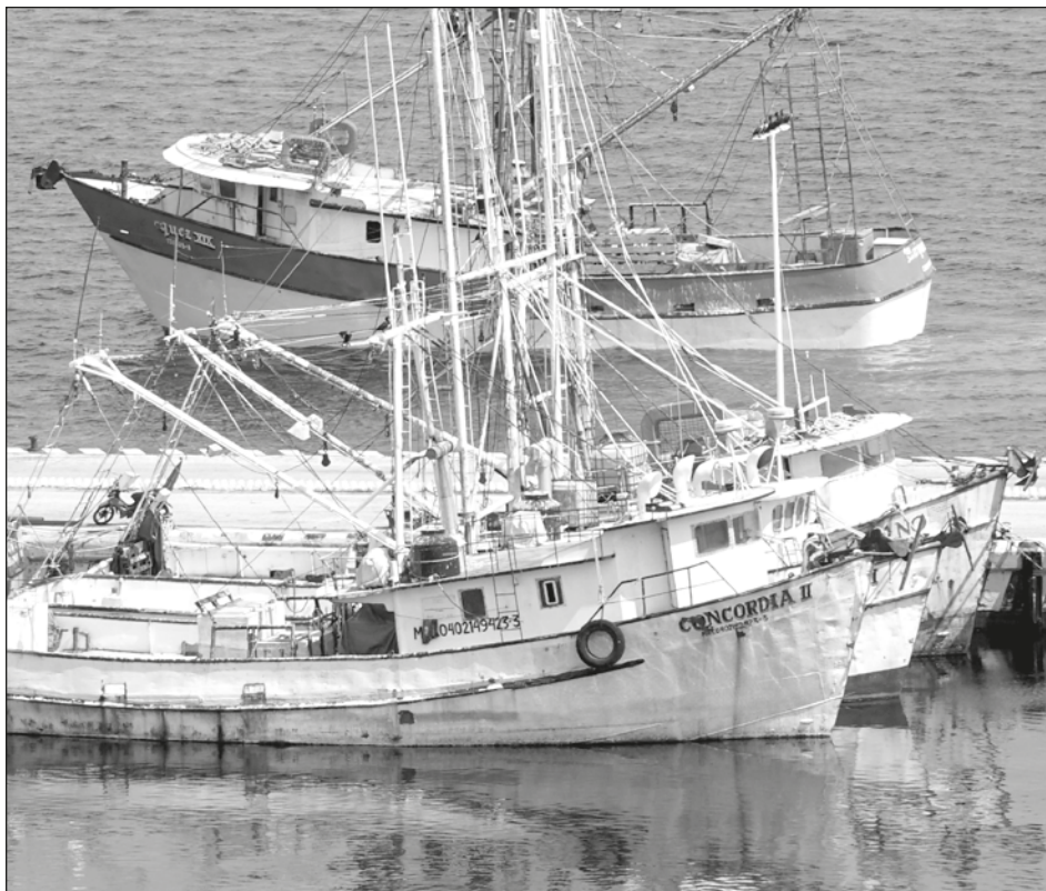
▲ La prohibición contempla la franja costera frente a Campeche y Tabasco. En la imagen, aspecto de la flota camaronera de Campeche.

Prohibición de pesca comenzó este domingo y concluirá hasta el 15 de septiembre