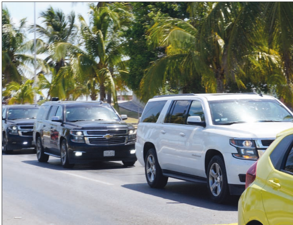
▲ La visita al suelo campechano no estaba contemplada en la agenda presidencial ni fue anunciada por el enlace de comunicación de la Secretaría de Bienestar.