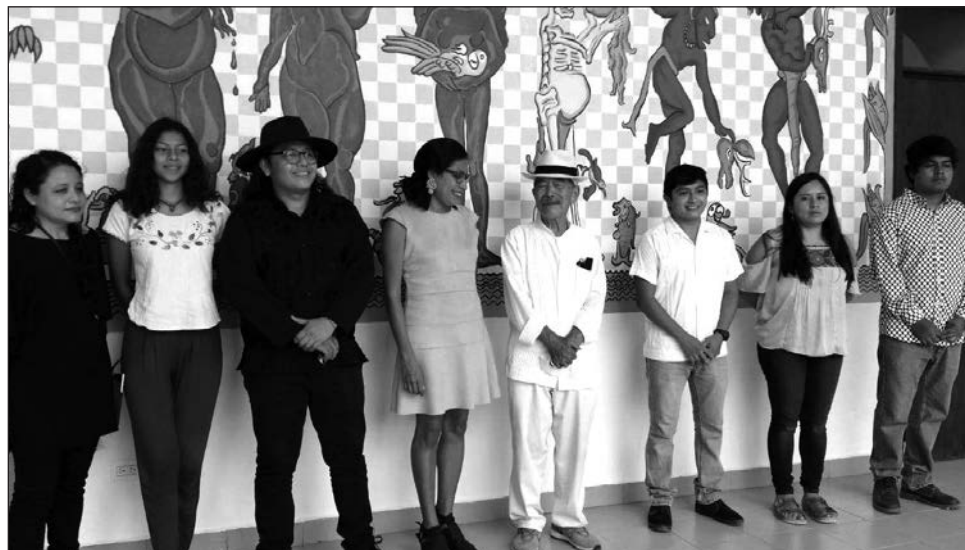
▲ El taller que estuvo a cargo de realizar la obra fue impartido por el artista Shinzaburo Takeda.

La actividad permitió plasmar, a través del arte, la enseñanza y experiencia del maestro Takeda, con quien