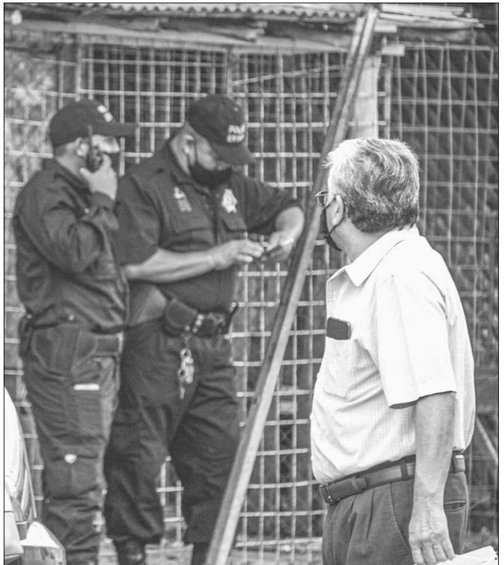
▲ Los candidatos a la alcaldía coinciden en la propuesta de sectorizar la isla y contratar más policías municipales.

También propuso la contratación de más elementos, de preferencia de personas del municipio para contar con una mejor identificación con la población.