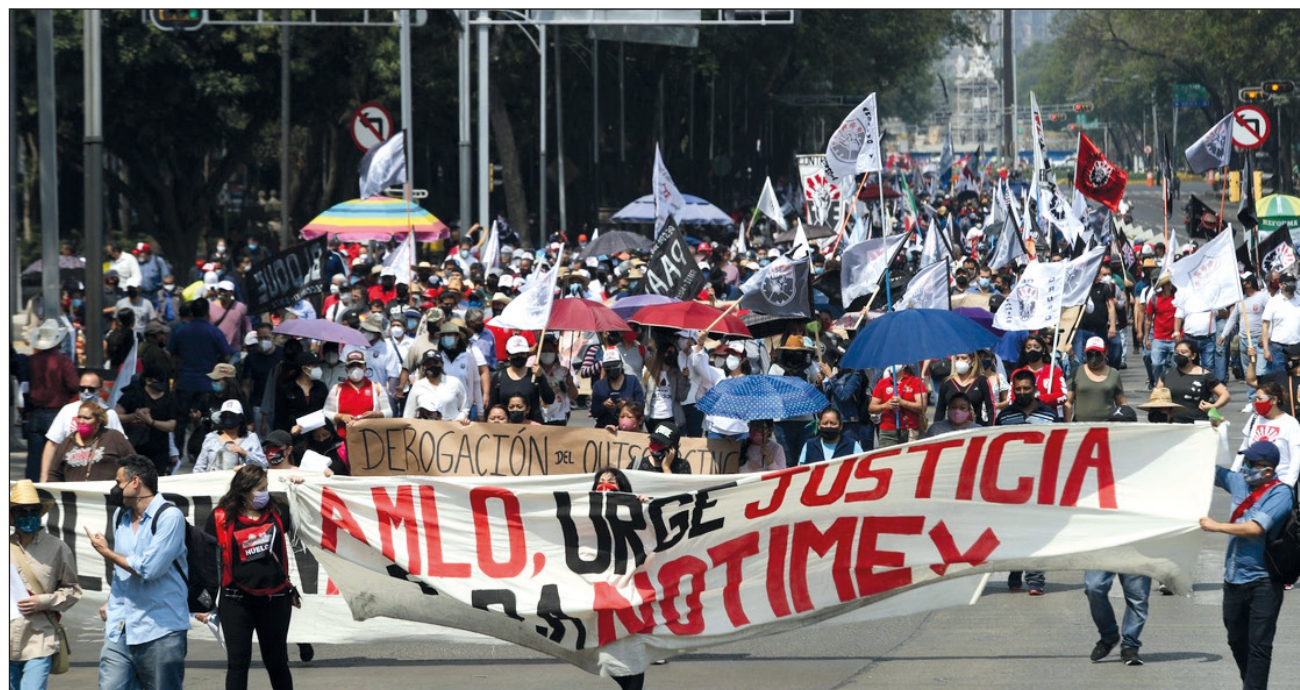
▲ Para conmemorar la fecha, cientos de integrantes de organizaciones sindicales realizaron una “marcha unitaria” en la que se manifestaron por la defensa férrea de la salud y los derechos laborales.

Desde un templete instalado frente a Palacio Nacional,