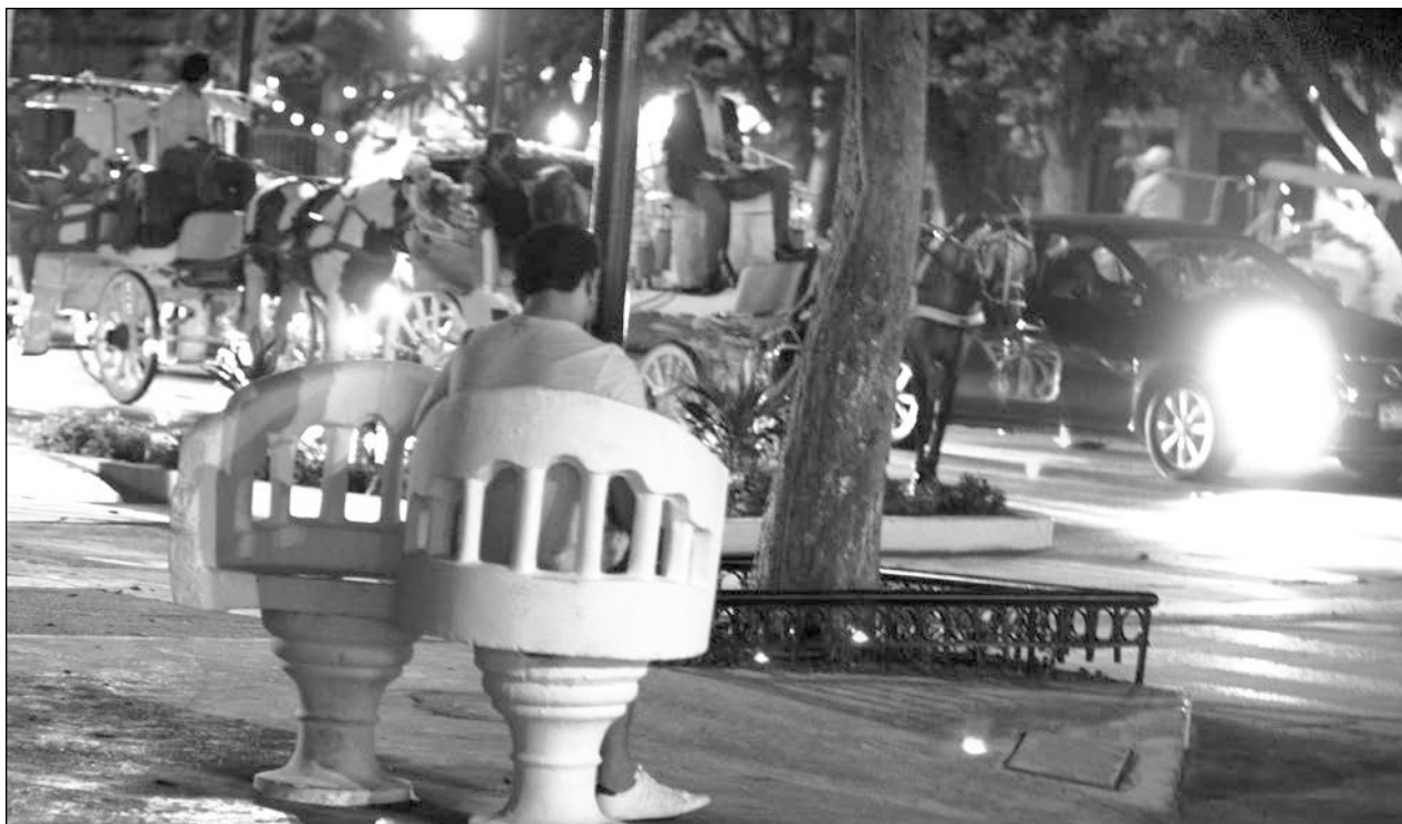
▲ Para la Asociación Mexicana de Hoteles en Yucatán, la restricción vehicular obstaculiza la llegada de visitantes, a quienes se les impide circular o entrar a Mérida.

Reiteró también que seguirá insistiendo ante las autoridades federales para se complete la vacunación a la población adulta mayor y se continúe con el resto de la población.