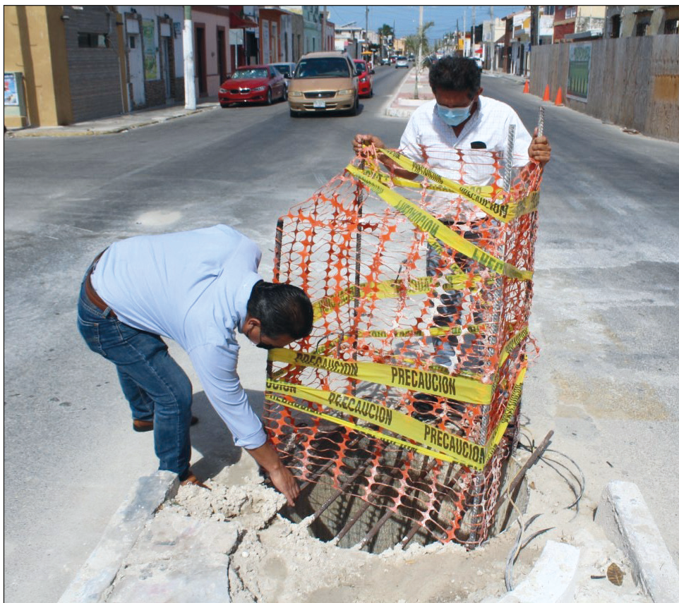
De acuerdo con el alcalde interino de Progreso, José Alfredo Salazar Rojo, las rejillas y pozos que se encuentren en malas condiciones serán atendidas rápidamente.

Finalmente, el Salazar Rojo externó: “la seguridad de los ciudadanos es prioridad para nosotros y tengan por seguro que estamos trabajando para que no se repita este incidente”.