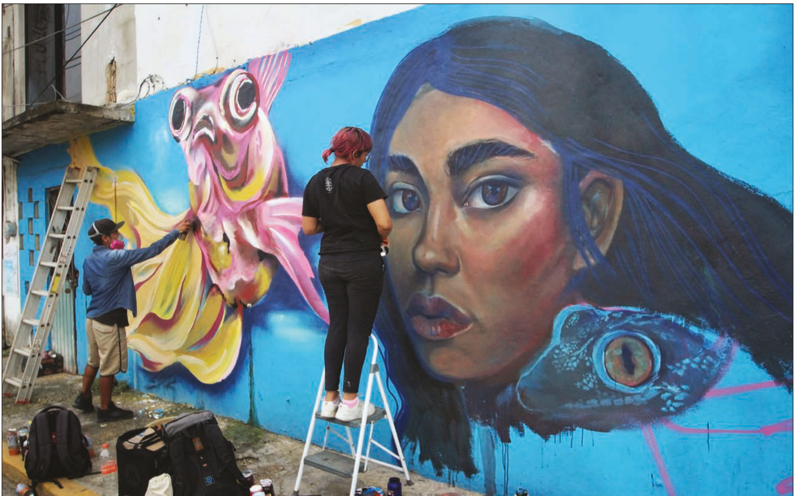
▲ En 2016, el Congreso de la Unión promulgó la Ley Nacional del Sistema de Justicia Penal para Adolescentes.

El Sistema Integral de Justicia Penal para Adolescentes cuya base es la reforma al artículo 18 de la Constitución Política de los Estados Unidos Mexicanos de 2005, establece una Justicia Penal Especializada acorde a los estándares internacionales contemplados en la convención de los Derechos de Niñas, Niños y Adolescentes.