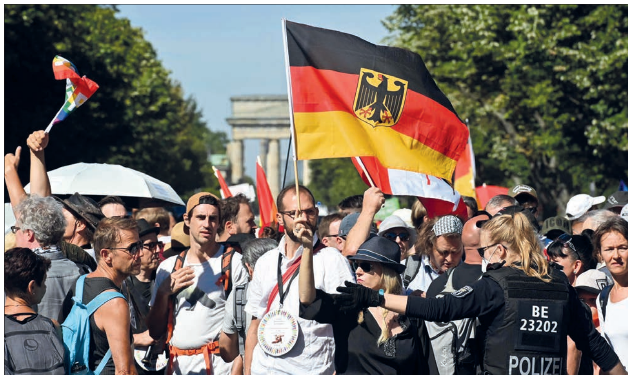
▲ Más de 20 movilizaciones recorrieron Berlín para celebrar el Día del Trabajo durante el sábado pasado.

El sábado se celebraron más de 20 manifestaciones distintas en la capital alemana, la mayoría pacíficas. Sin embargo, una marcha izquierdista de ocho mil personas por los vecindarios de Neukölln y Kreuzberg, que ha protagonizado altercados frecuentes en las últimas décadas, derivó en violencia. Los manifestantes lanzaron botellas y piedras a los agentes y