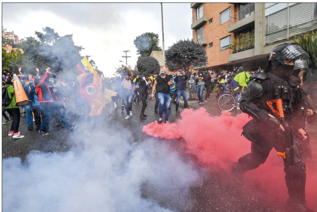
▲ Las causas del movimiento social contra Iván Duque, detenido por las medidas de confinamiento, permanecen vigentes y han cobrado mayor urgencia.

Está claro que no basta con la reformulación de la reforma tributaria anunciada el viernes por Duque, sino que se debe renunciar a ésta o a cualquier otra iniciativa que lesione la situación económica de las mayorías y las obligue a manifestarse de maneras que ponen en riesgo su vida.