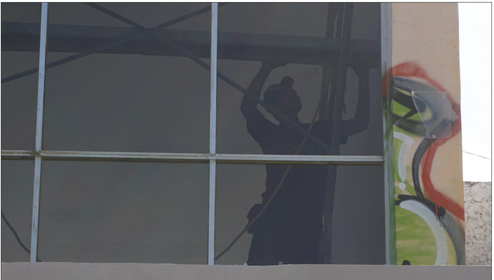
▲ El trabajo no es únicamente un medio para la producción de mercancías-objetos sino un fin en sí mismo deseado y buscado para su satisfacción.