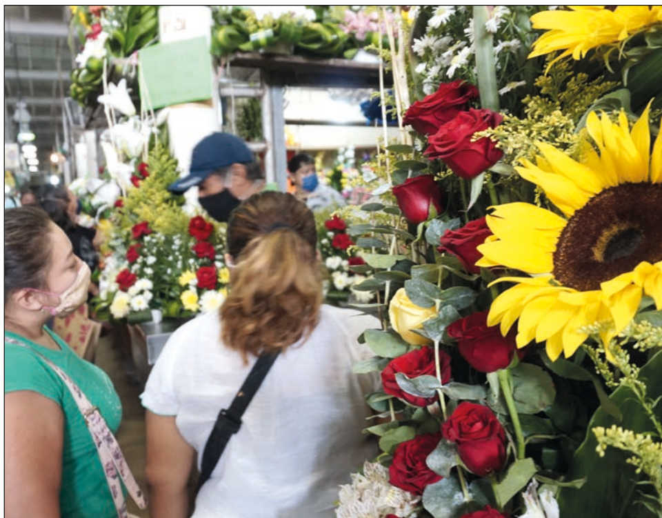
▲ Durante 2020, las ventas de todos los comercios fueron fuertemente afectadas por la pandemia de Covid-19 y el confinamiento masivo del segundo trimestre.

“Debido a que la celebración será el lunes se prevé que desde el fin de semana, 8 y 9 de mayo, empiecen a salir a festejar a las mamás, lo cual permitirá un mayor movimiento comercial, en sitios de esparcimientos y restaurantes”, destacó el organismo empresarial.