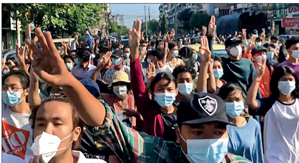
▲ Desde febrero y pese a una cruenta represión de la junta, las manifestaciones recorren el país.

El grupo rebelde, la Unión Nacional Karen (KNU), hizo un llamado a otras minorías étnicas de la región a unirse contra la "dictadura militar".