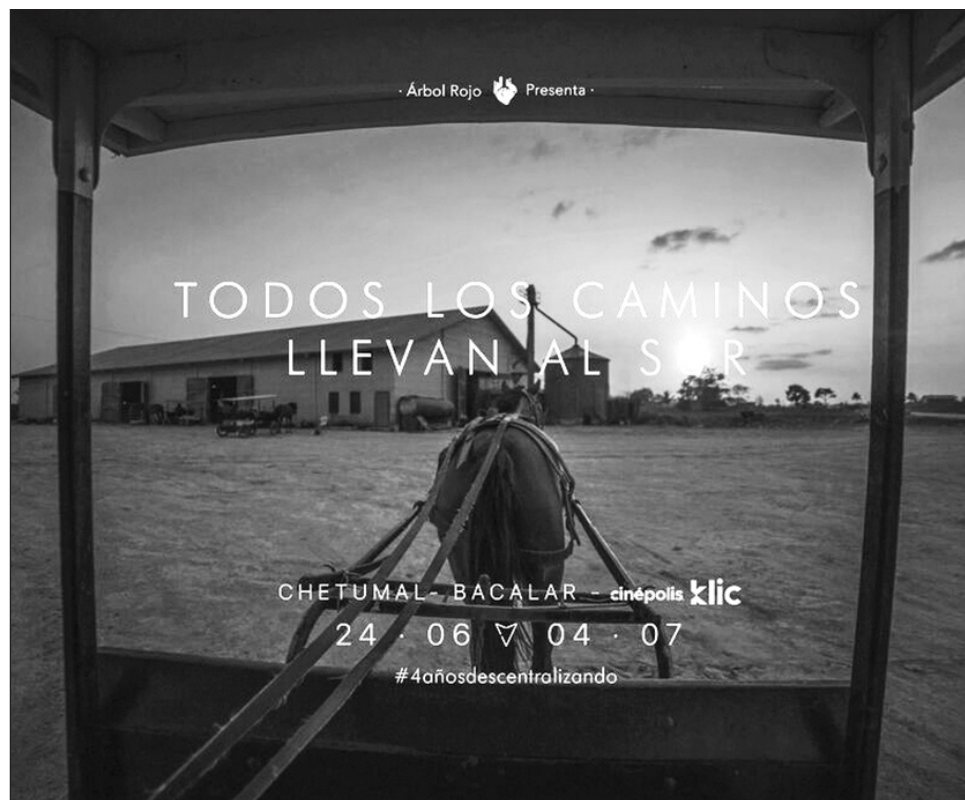
▲ Este año la apuesta es por una programación propia, con un catálogo que los represente.