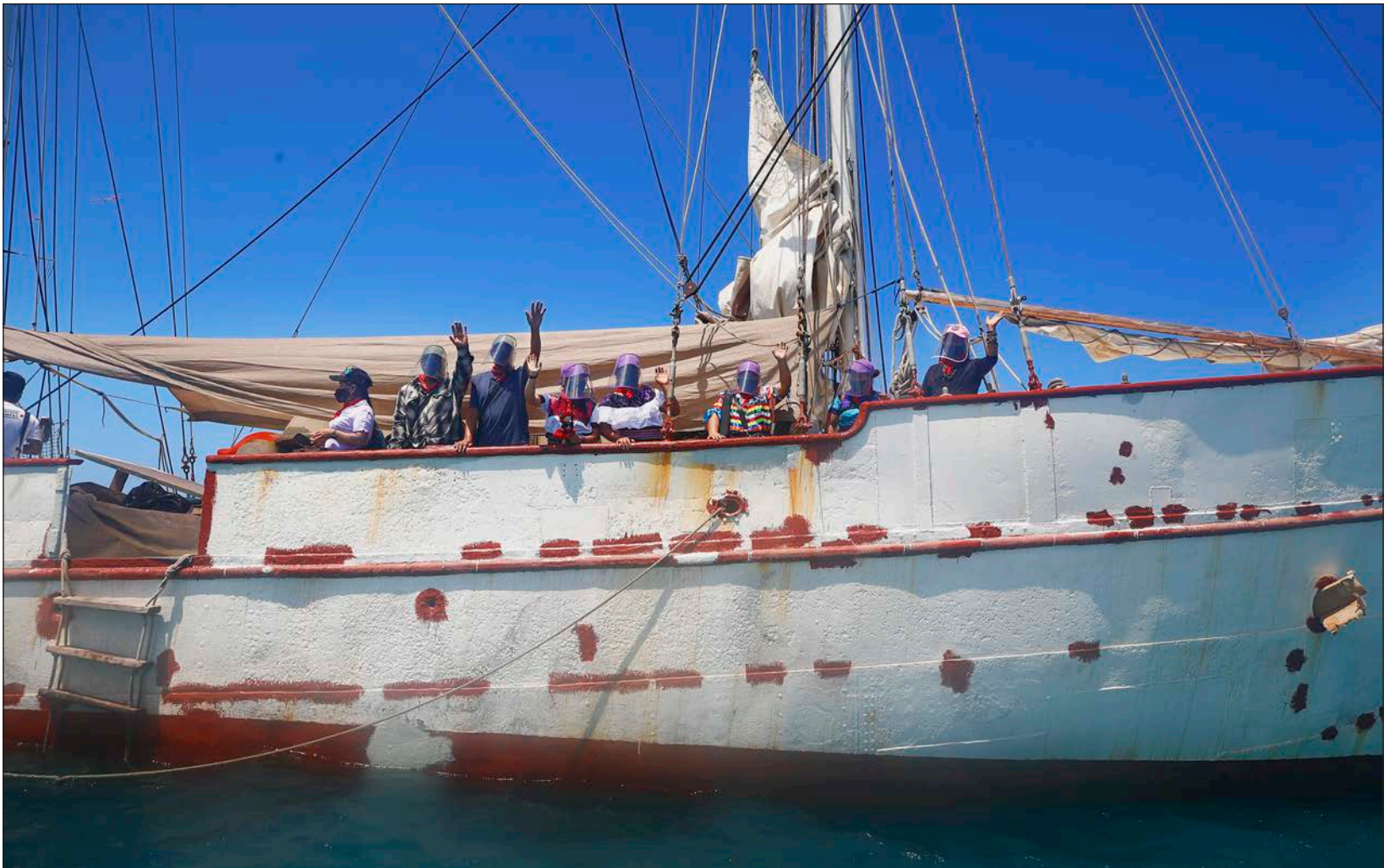
▲ A bordo de la embarcación llamada La Montaña , miembros del Ejército Zapatista de Liberación Nacional inician hoy su navegación para llegar al viejo continente.