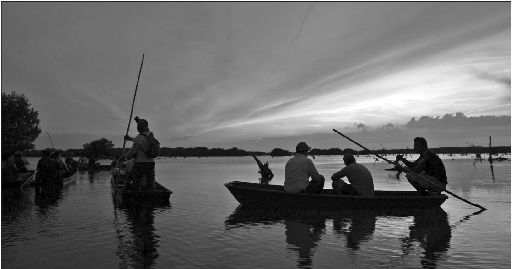
▲ Fomentar la economía inclusiva es una obligación, pues son iniciativas que pueden sacar adelante a localidades y estados.