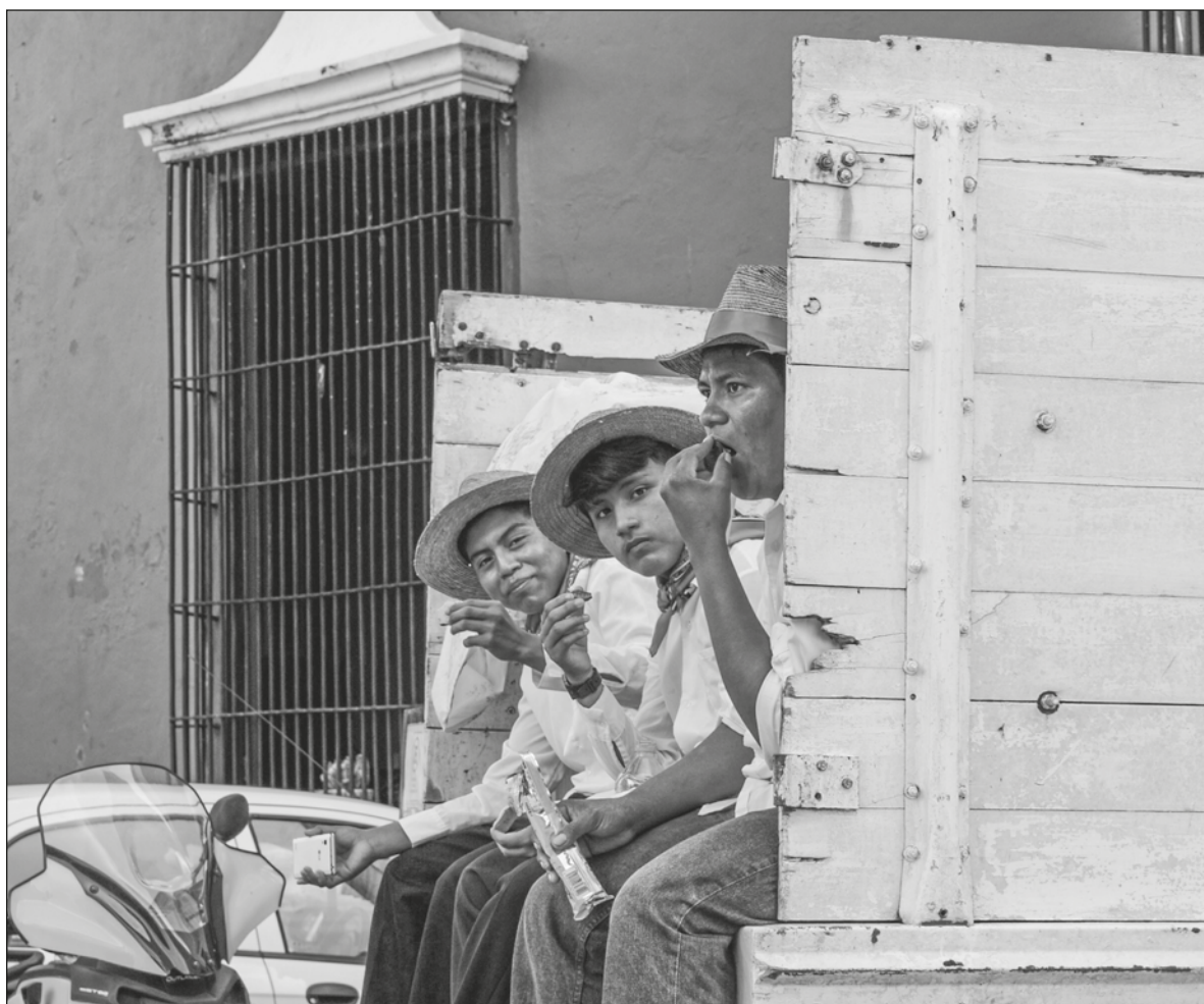
▲ Los ciudadanos son la razón de ser del Estado, es a partir de ellos que se deben encontrar los problemas y las posibles soluciones, mediante la deliberación y el diálogo oportuno.

¿POR QUÉ ES importante pensar la relación entre políticas públicas e interculturalidad? Pensando en Yucatán, prontamente podríamos ubicar al territorio yucateco como un territorio multicultural en el que habitan grupos socioculturales y étnicos diferentes entre sí; tal es el caso de la población maya -grupo étnico mayoritario- y la población Tsotsil, Tseltal, Zapoteca, Mixe, entre otros que habitan en el territorio. Ahora bien, la sola presencia de diversos grupos o culturas en un territorio no implica que éstas se encuentren en posiciones de igualdad respecto del resto de la población y tampoco que exista un respeto hacia