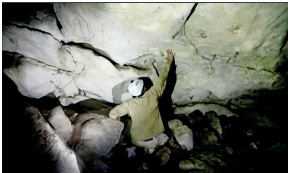
▲ La caverna se encuentra al norte de la península de Yucatán, debajo de una gran ceiba, que los mayas consideran sagrada.

La cueva está ubicada cerca del extremo norte de la península de Yucatán en México, donde aún se encuentran las imponentes pi-