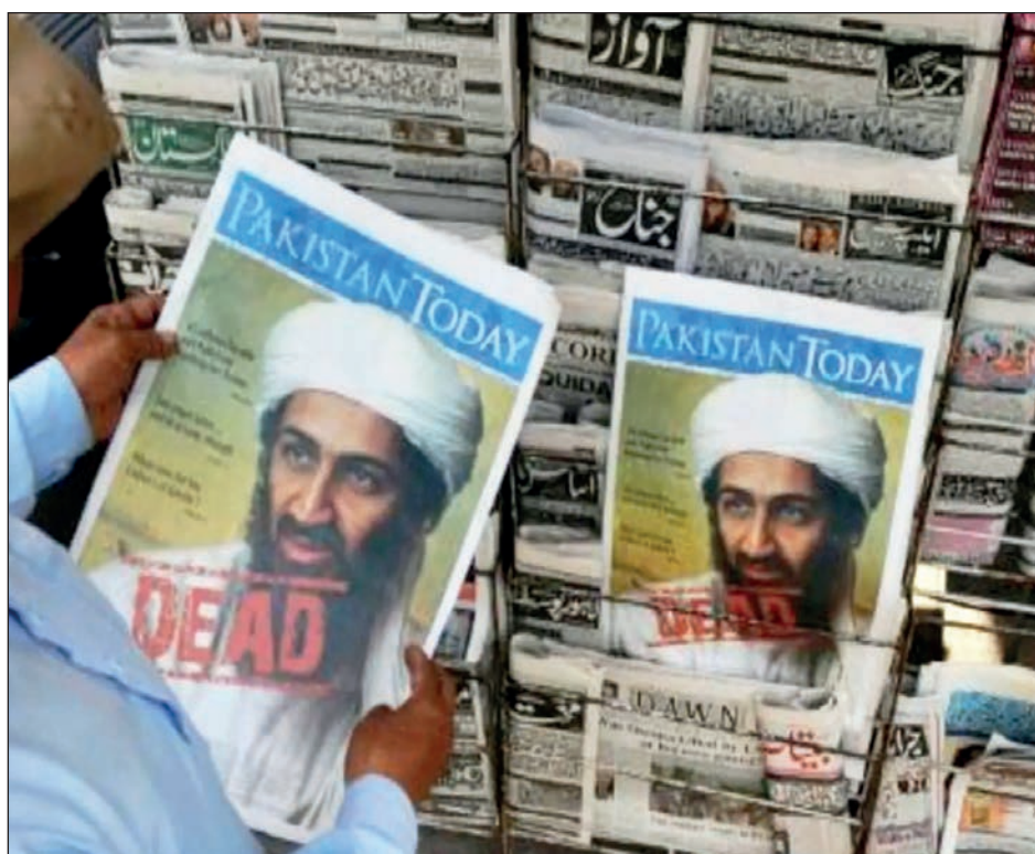
▲ A través de una operación especial en Pakistán, el entonces presidente de EU, Barack Obama, logró acabar con la vida del líder yihadista hace 10 años.

"Para algunos, la organización dirigida por Osama Bin Laden es una reliquia de una época pasada. Pero ha demostrado su resistencia en el pasado", dijo. "Es demasiado pronto para escribir el obituario del grupo", concluyó.