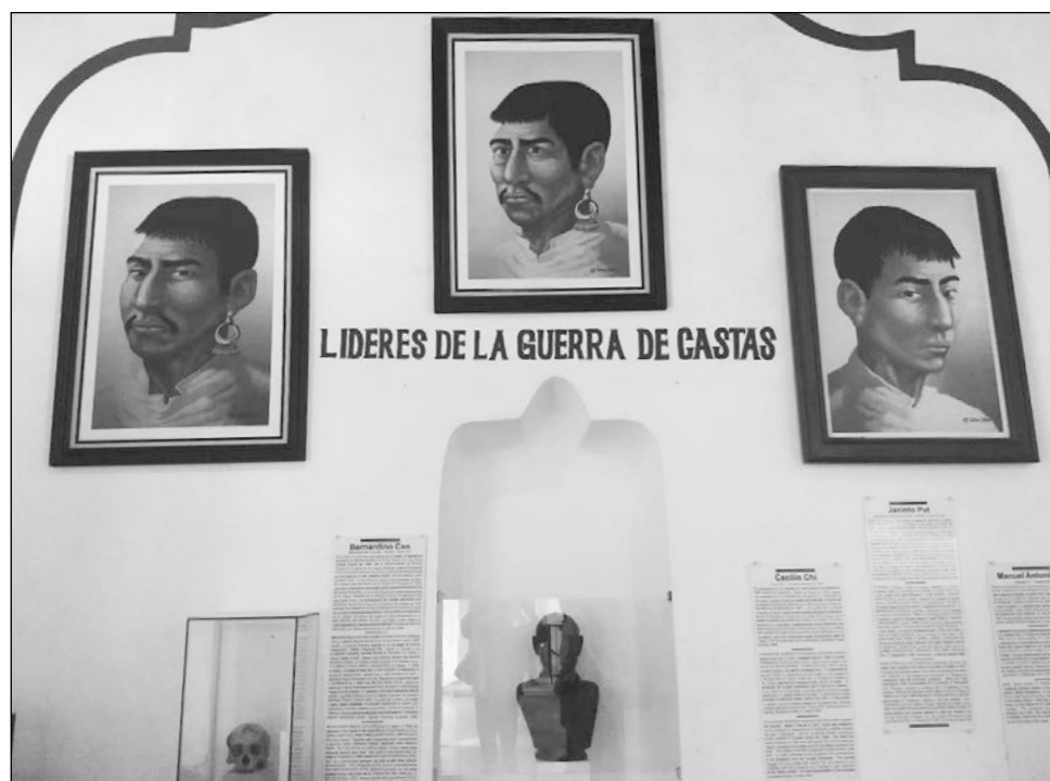
▲ El presidente de México realizará este lunes un acto de contrición en Tihosuco, por los agravios cometidos durante la guerra de castas.