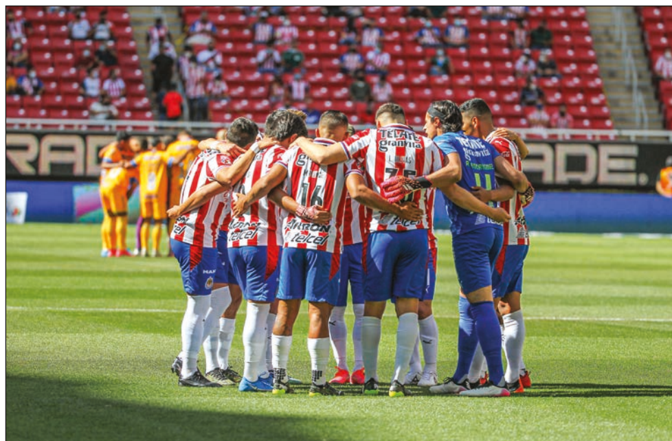
▲ El Guadalajara cerró bien el torneo para avanzar al repechaje.

En este torneo, Cruz Azul ya había empatado la marca de 12 triunfos consecutivos que poseían León (Clausura 2019) y Necaxa (1994-35). Antes de jugar, los celestes tenían asegurado el primer puesto en la liguilla del Clausura, donde procurarán ponerle fin a una sequía de títulos de liga que data desde el Invierno 1997.