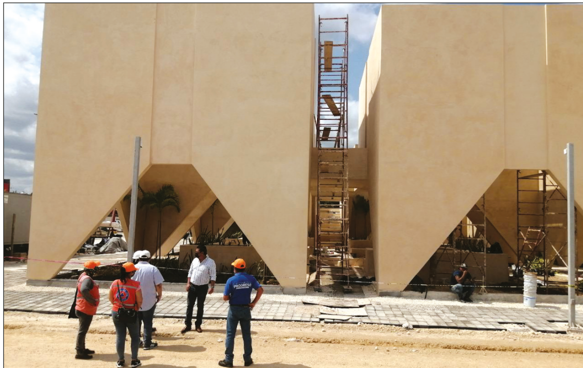
▲ Las obras deben cumplir con las normas de seguridad civil tanto para quienes las realizan como para los vecinos y visitantes del puerto.

Cabe destacar que hasta el momento los trabajos, que constan de la creación de 300 metros de