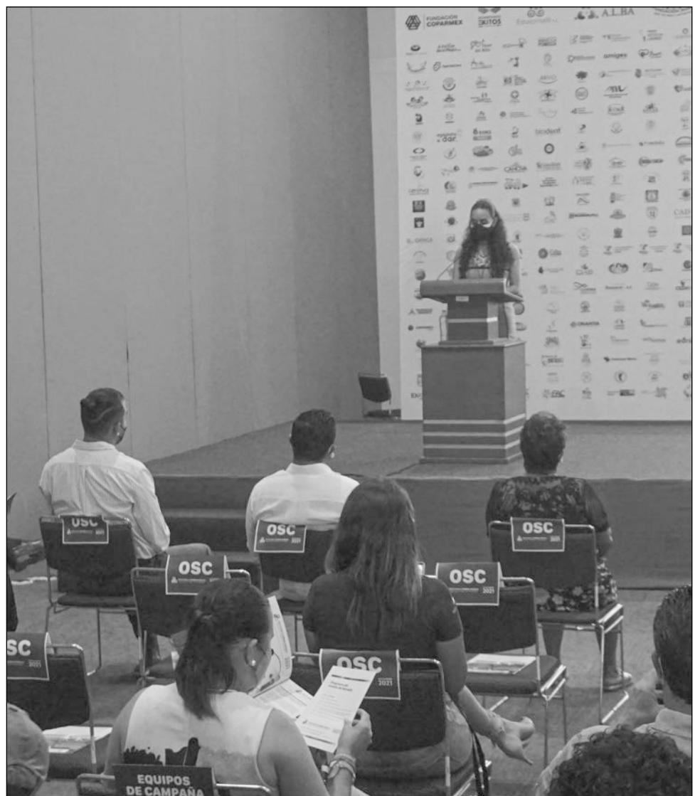
▲ La infancia debe quedar protegida, gane quien gane las elecciones.

Aunque no dieron un número exacto de niños que viven en el país, también afirmaron que 11 de cada 100 niños menores de cinco años padecen desnutrición crónica y que una tercera parte de los niños entre uno y cuatro años de edad sufre de anemia. Además, respecto a la educación, sólo siete de cada 100 niños asisten a algún programa de educación inicial.