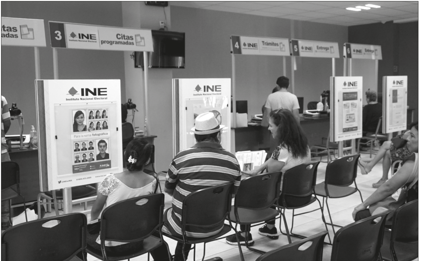
▲ El 4 de junio será el último día para recoger la credencial solicitada y poder sufragar en este proceso electoral.