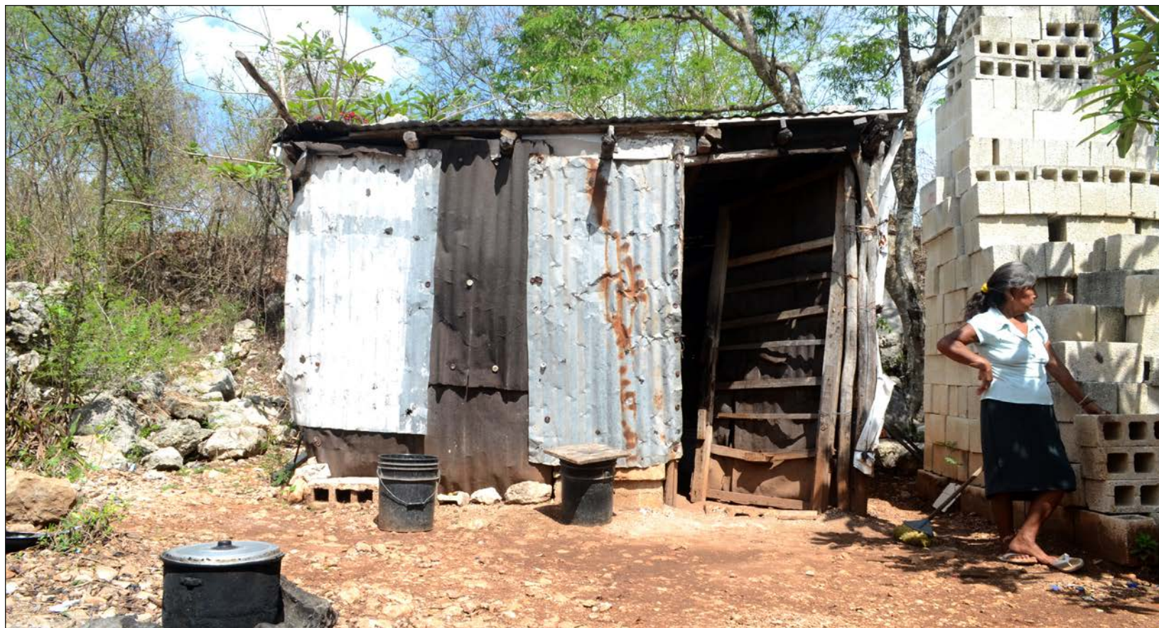
▲ Entre los factores que contempla el Índice de Rezago Social se encuentran el acceso a la educación y servicios básicos.