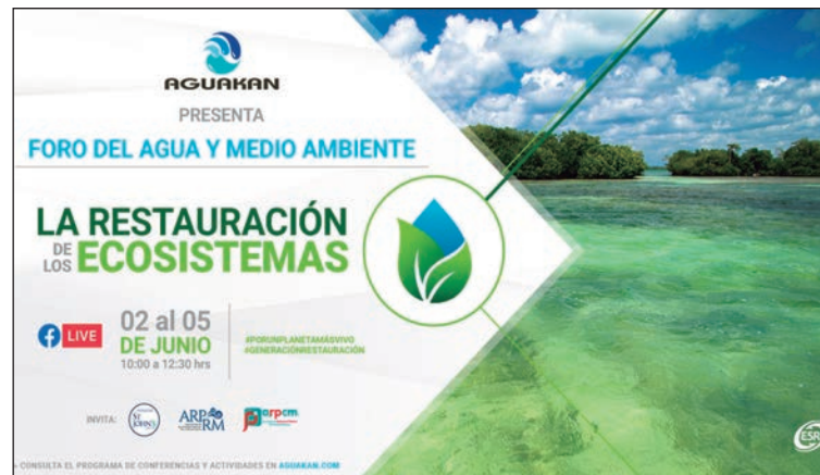
▲ El evento se realizará de manera virtual.