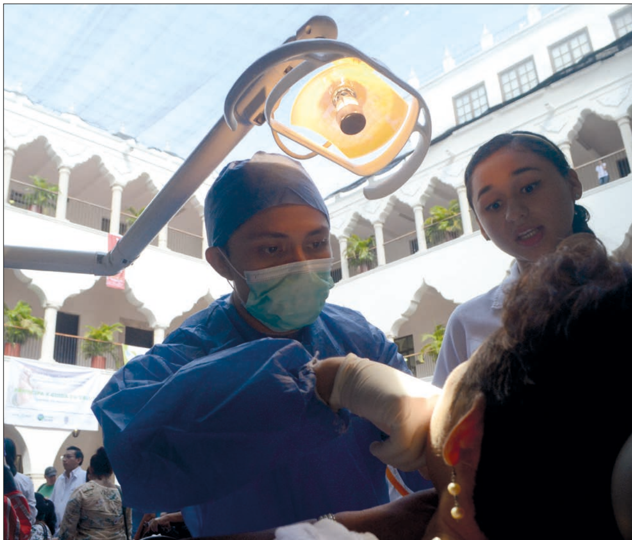
▲ Los odontólogos trabajan a menos de 45 centímetros de la boca de sus pacientes.