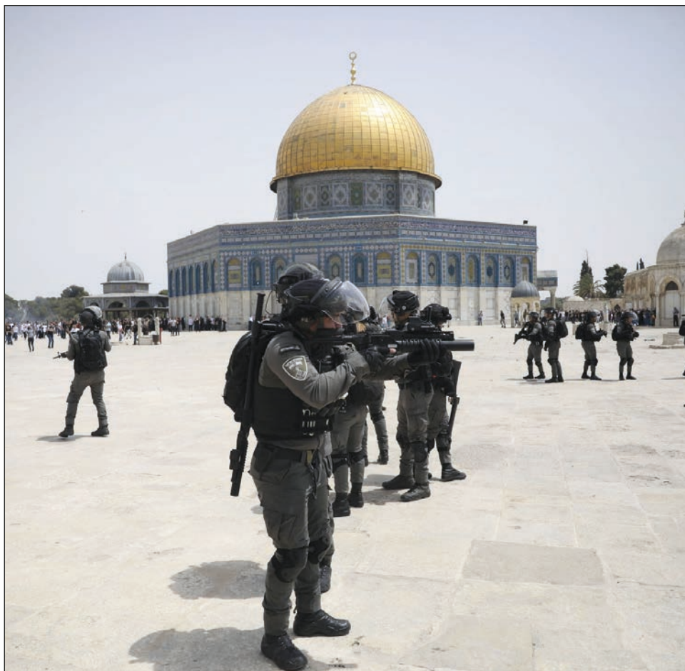
▲ La policía no informó de incidentes inusuales en el recinto de la mezquita de Al Aqsa, uno de los lugares más sagrados del Islam.

Médicos afirman que los lanzamientos de cohetes y un ataque con misiles del grupo militante mataron a 13 personas en Israel.