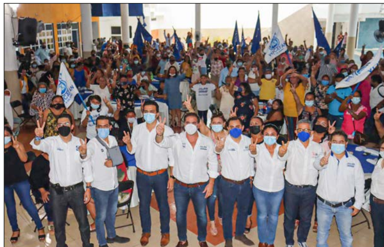
▲ El 2021 será un año de consolidación de proyectos.

Durante este ejercicio, el abanderado se dio la oportunidad de reiterar la serie de trabajos que realizaría al ocupar nuevamente el cargo, de los que se mencionan, dar continuidad al mejoramiento de calles, reforzar los servicios de salud con el módulo médico, reac-