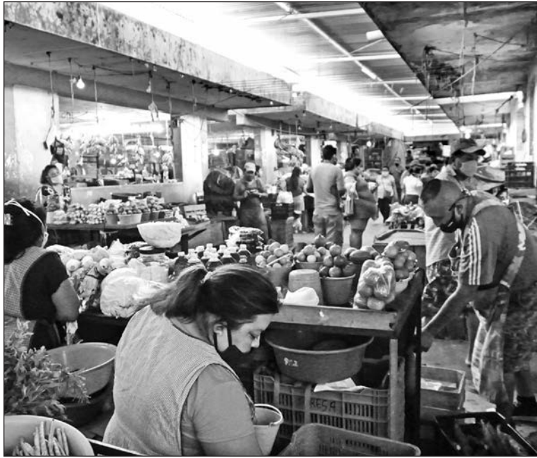
▲ Más allá de los aciertos y desaciertos de la 4T, lo cierto es que el sector que aglutina es uno históricamente marginado, saqueado y explotado.

No es que la propuesta habermasiana parezca absurda, ¿es acaso que no podemos deliberar? ¿Qué la posverdad se apoderó de nosotros? ¿Somos una sociedad cínica? Estas preguntas me llevan a dos breves disquisiciones. La primera es que David tiene razón, hay algo torcido en la moda de llamar polarizado el clima del debate público. El uso del término sugiere que los polos en cuestión corresponden grosso modo, por un lado, a las élites empresariales, mediáticas, académicas, etc., y, por otro, una gran masa popular aglutinada, en contra y a favor de AMLO, respectivamente. El carác-