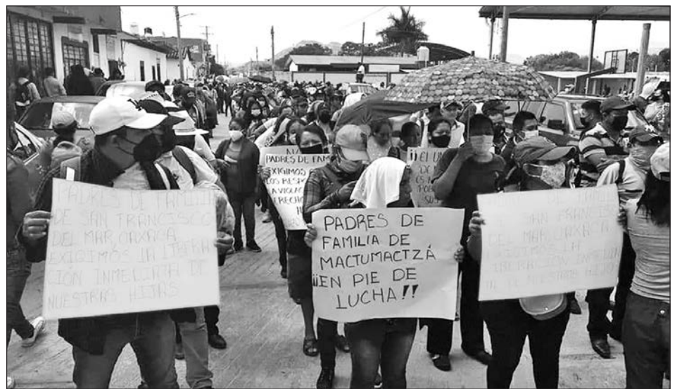
▲ La marcha de apoyo a los normalistas reunió a unas 200 personas.

Las fuentes de la Sección 7 señalaron que la noticia de la resolución del juez la