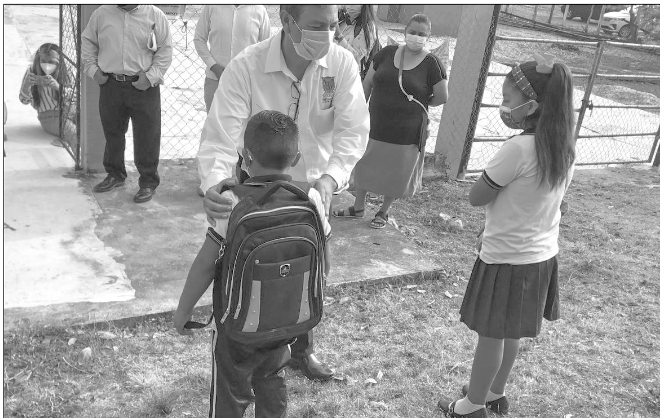
▲ La suspensión de clases presenciales es hasta nuevo aviso.