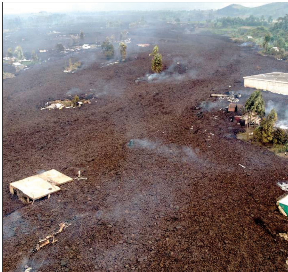
▲ El Monte Nyiragongo destruyó cientos de viviendas en localidades a las afueras de la ciudad congoleña.

Goma es un centro de muchas agencias humanitarias que trabajan en la región, así como de la misión de mantenimiento de paz de la ONU conocida como MONUSCO. Sin embargo, al mismo tiempo, el este del Congo ha sido azotado por la actividad de numerosas milicias que pugnan por el control de los recursos minerales de la región.