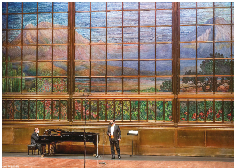
▲ La agrupación Solistas Ensemble interpretó obras del compositor italiano en un inusual concierto para conmemorar su 120 aniversario luctuoso.

El repertorio dos conjuntos de Seis canciones (Seste Romanze) se presentará hoy en un segundo recital en el salón de recepciones del Museo Nacional de Arte (Munal) a las 11:30 horas, con lo que