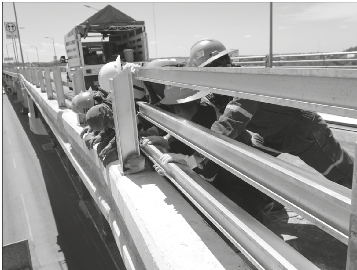
▲ El INEGI define que a la población ocupada la componen las personas con empleo remunerado o que ejercen una actividad independiente por al menos una hora durante la semana.

EN LOS MESES de mayores restricciones a movilidad y distanciamiento social, de abril a septiembre, observamos un disminución de 47 mil 464 en la POC, lo que significó una caída de (-) 4.4% en esta población. Los tres grupos más afectados fueron: a) Trabajadores industriales, artesanos y