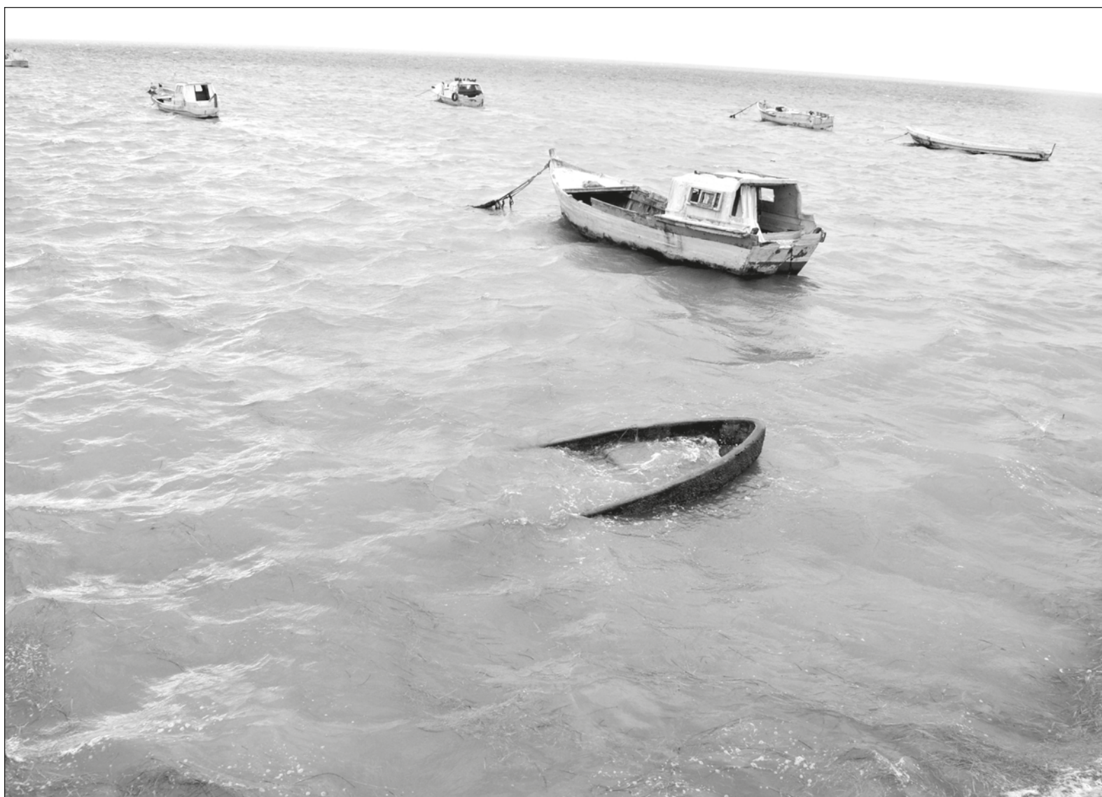
▲ En Tabasco, la gente solía tener un cayuco para poder hacer frente a las inundaciones, pero la modernidad eliminó la práctica.