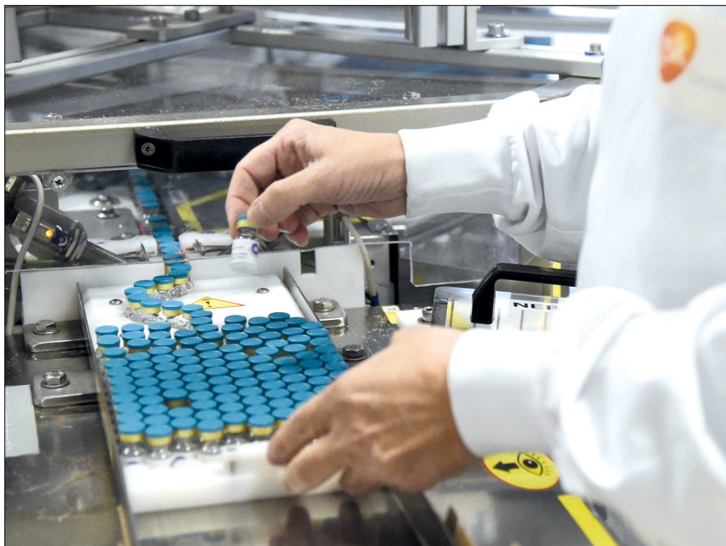
▲ La respuesta a la crisis que causó la propagación del Covid-19 consistió en inyectar liquidez a los mercados financieros y contratar deuda pública.

La crisis financiera mundial de 2007-2009 tuvo origen en el estallido de la burbuja de las hipotecas subprime en Estados Unidos; mientras, el actual retroceso o estancamiento de la mayor parte de las economías fue causado por la propagación del Covid-19 y el consecuente despliegue de medidas de confinamiento y distanciamiento social a fin de controlar la pandemia; sin embargo, uno y otro hecho tienen algo en común: la respuesta de política económica predominante para enfrentar ambas crisis consistió en inyectar liquidez a los mercados financieros y contratar deuda pública.