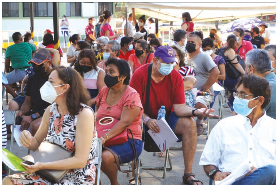
▲ Alrededor de 103 mil 455 vacunas de la farmacéutica Pfizer se destinaron a la población de 50 a 59 años de la capital yucateca.

Los requisitos que se requieren para recibir la dosis es que se registren en la página web https://mivacuna.