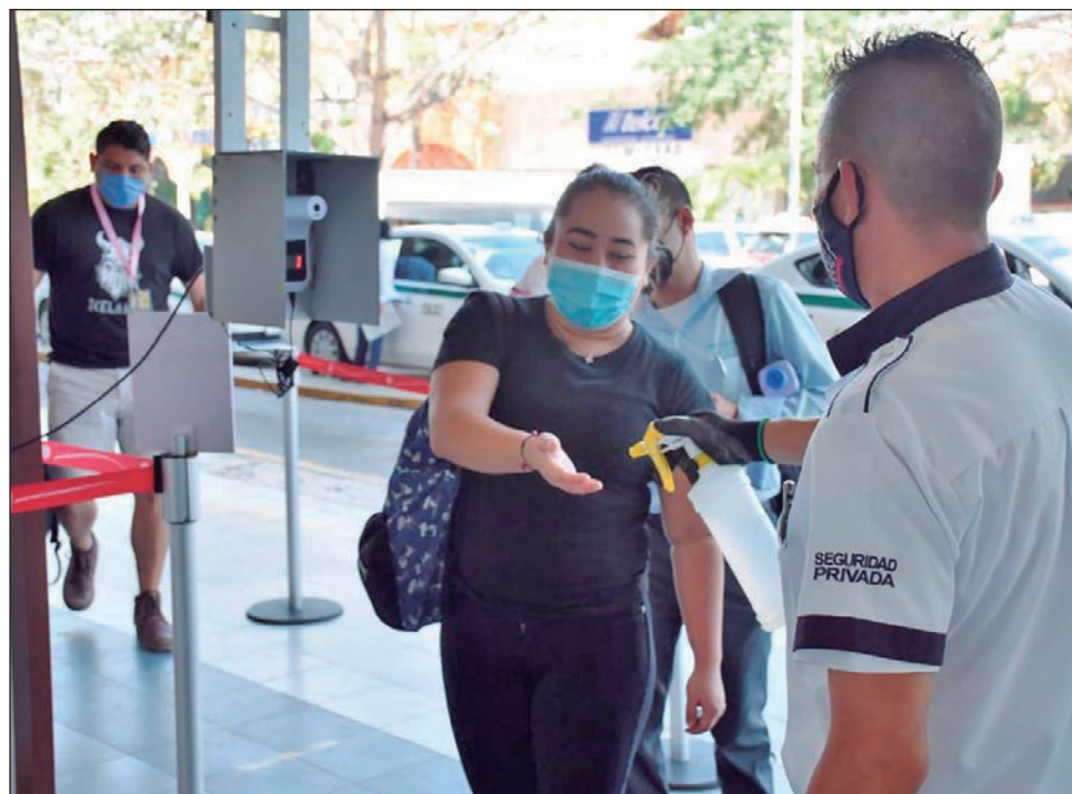
▲ La velocidad de crecimiento de casos en la zona norte es de 0.46.

El único que se conserva en naranja es Quintana Roo. Hasta el pasado 22 de mayo la Secretaría de Salud del estado reportó 25 mil 898 casos positivos de Covid-19 y 2 mil 724 defunciones. La velocidad de crecimiento de casos en la zona norte es de 0.46 y la ocupación hospitalaria de 23%; mientras que