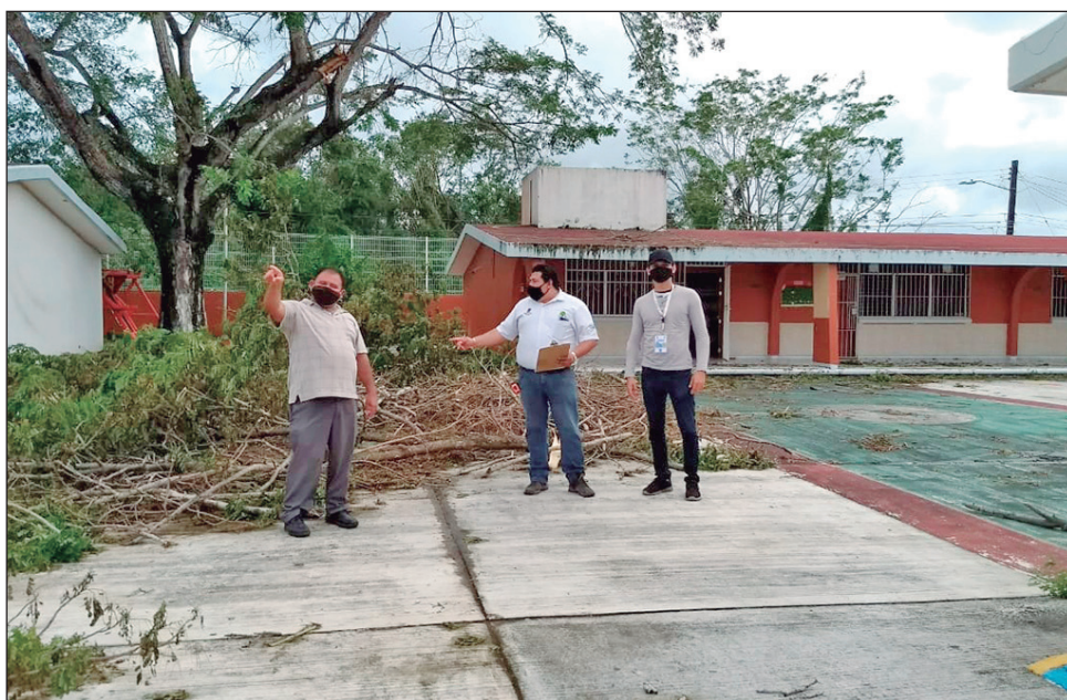
▲ Las escuelas dañadas están principalmente en municipios de la zona norte.