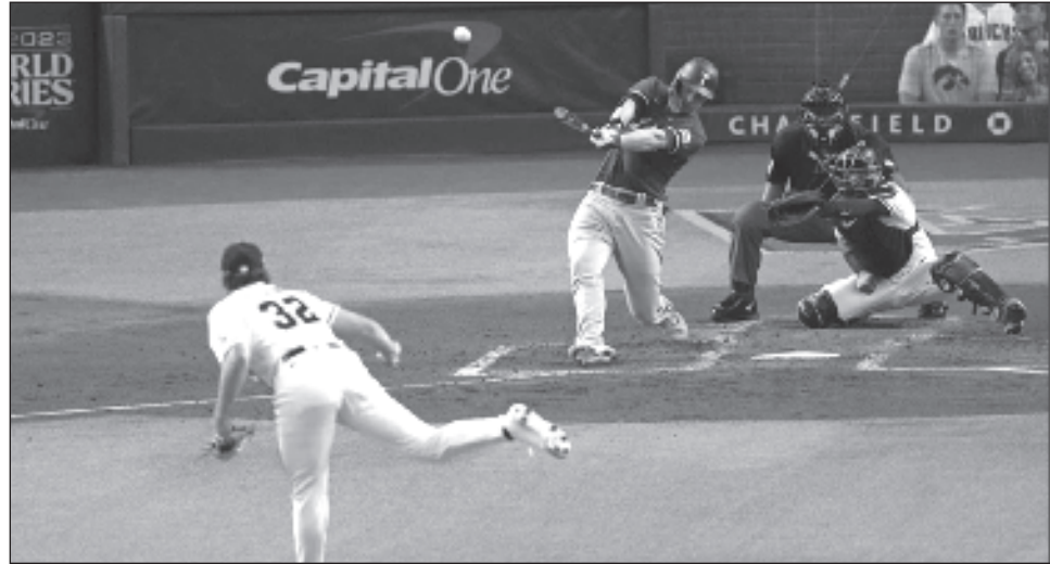
▲ Corey Seager se vuela la barda para coronar un ataque de tres carreras en la tercera entrada.

El torpedero reventó un cuadrangular de dos carreras a las gradas del jardín derecho como parte de una tercera entrada de tres carreras, después de que el abridor de los "Diamondbacks", Brandon Pfaadt, dejó colgado un cambio de velocidad. La pelota salió del bate de Seager a una velocidad de 184 km/h, que fue el cuadrangular más potente en la era de "Statcast" en el Clásico de Otoño, desde 2015.