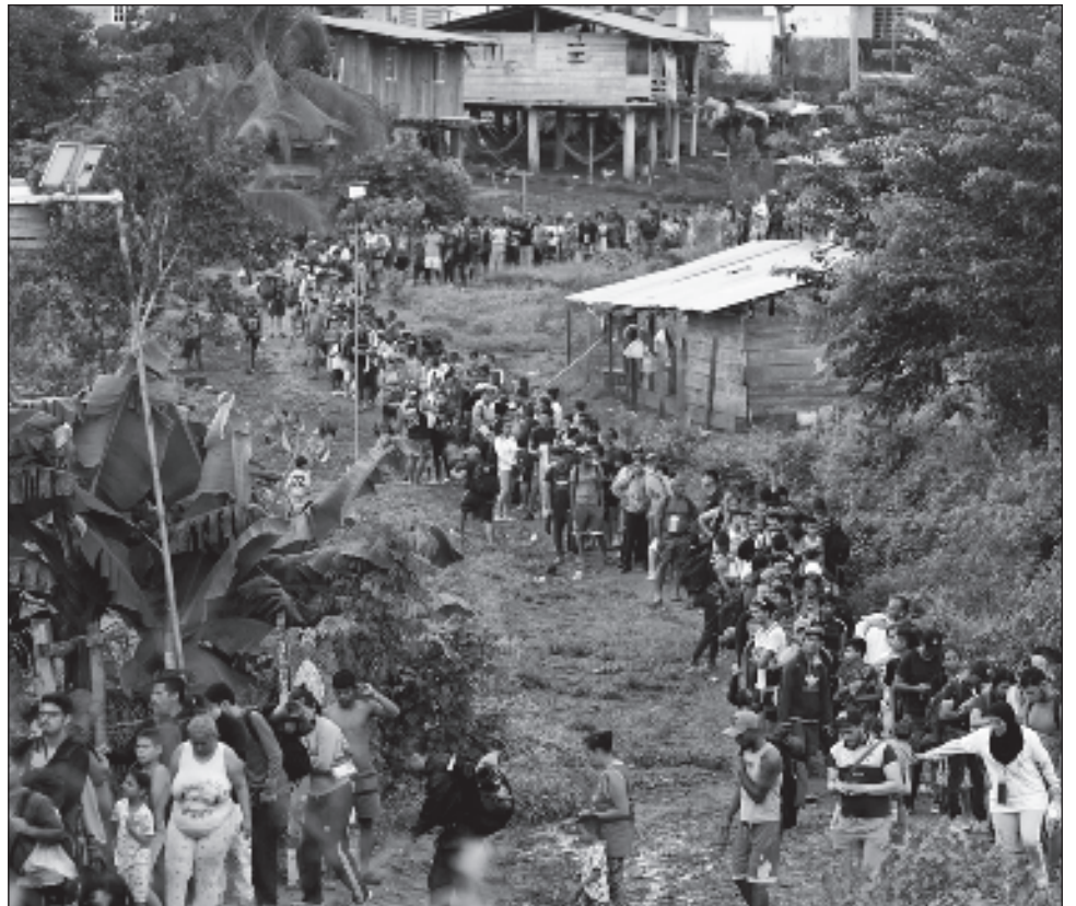
▲ En concreto, 2 mil 400 personas que se registraron en la oficina de movilidad segura en Guatemala, mil 150 en Colombia y mil 250 en Costa Rica han sido remitidas para un "posible reasentamiento" a EU, reveló Youth, encargada de la Oficina de Población, Refugiados y Migración.

El registro al programa se hace a través de una página web y sólo está disponible para ciertas nacionalidades, según cada país.