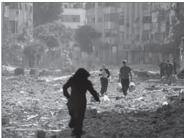
▲ "Antisemitism was a constant theme of the Soviet Union and its former satellites. But this was not at its origin. In fact, antisemitism predated communism and fascism by two millennia".

DESPITE THIS BEING the biggest mass murder of Jews since the Holocaust, protests erupted everywhere defending Hamas!