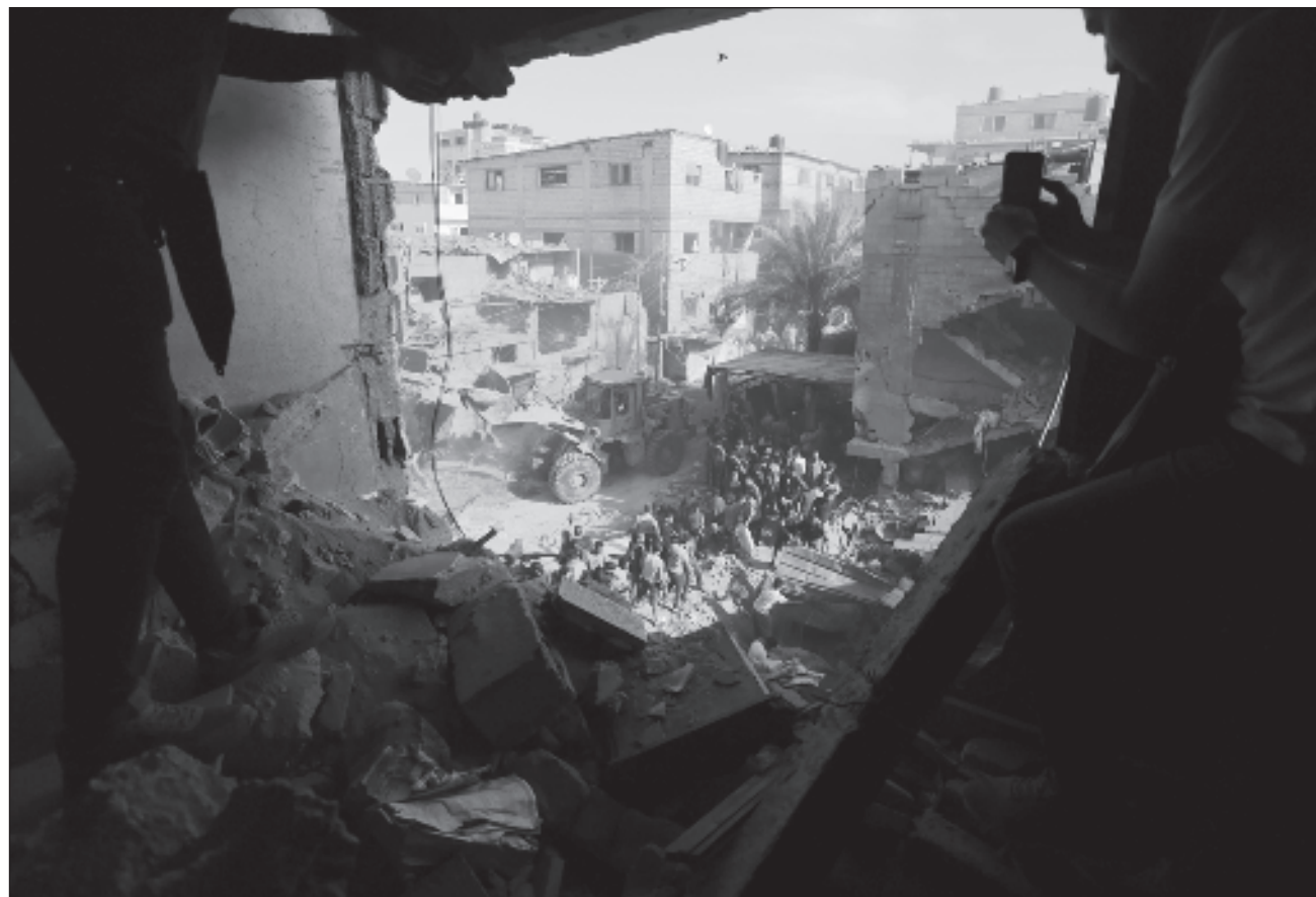
▲ El documento presentado por el Ministerio de Inteligencia de Israel recomienda realizar una campaña para los ciudadanos de Gaza que "los motivará a aceptar el plan" y les obligará a abandonar el territorio de forma permanente.

El documento, además, indica el plan de traslado en varias fases: en la primera, la población de Gaza debe ser "desalojada hacia el sur", mientras que los ataques