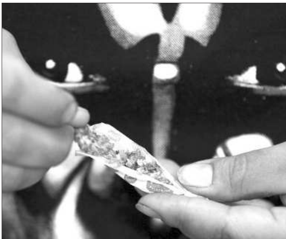
▲ La directora del centro señaló que “proporcionamos atención gratuita a personas con problemas de uso de sustancias psicoactivas, también su salud mental, ya que estos dos aspectos son indispensables para la recuperación de nuestros pacientes y así puedan evitar el estigma”.