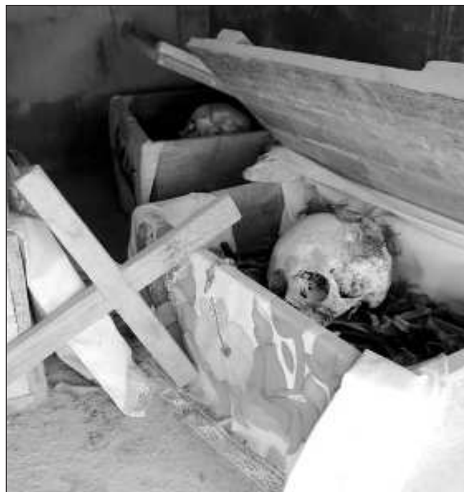
▲ Distingamos entre lo que se ha creado para el mercado de lo que tiene sus orígenes en rituales; lo primero es para generar derrama, lo segundo para crear tejido social sólido.

Ocurre que los pomuchenses ya han naturalizado el ser observados, fotografiados y filmados por los turistas, y lo que antes era un momento de intimidad con los ancestros ha dado paso a conversaciones con los visitantes y a apariciones en documentales, reportajes para televisión y canales de Internet, así como menciones en libros. Pueblo, población y restos áridos de antepasados se