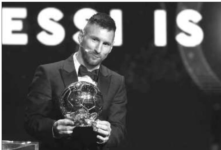
▲ Lionel Messi, del Inter Miami, recibe el Balón de Oro, ayer en París.

"A los compañeros de la selección argentina. Hoy puedo estar acá gracias a mis compañeros", dijo. Esto es un regalo para todo el grupo, toda la gente. No me quiero olvidar de Haaland y de Kylian (Mbappé) por todo lo que consiguieron. Erling tuvo un año increíble y sé que ellos estarán acá en los próximos años. Veo a muchos jóvenes acá y no tengo dudas de que voy a disfrutar de muy