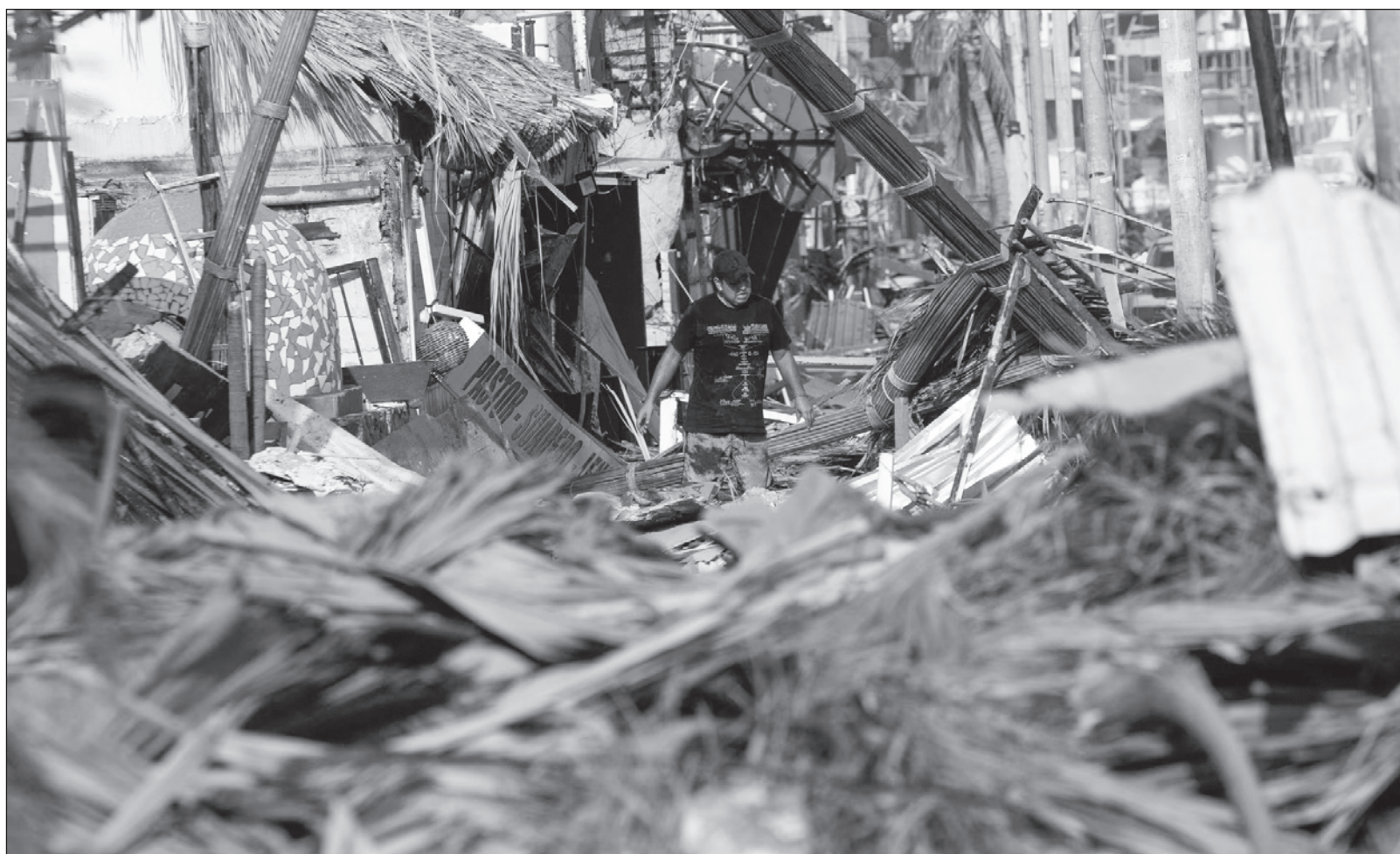
▲ "Otis demostró a México que no estamos exentos de desastres naturales atípicos como los que han ocurrido en otros países (...)" Necesitamos prepararnos para enfrentarlo juntos, la cantidad de recursos para ayudar a Acapulco y a Guerrero será gigantesca".