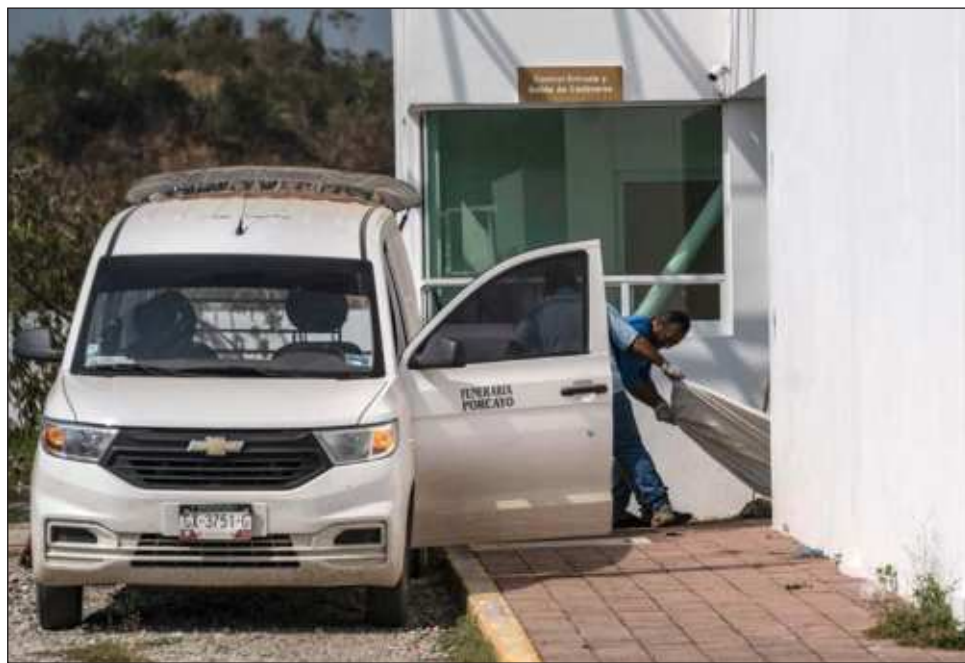
▲ Ante la inconsistencia en números, el presidente Andrés Manuel López Obrador dijo que el dato comprobado de la FGE es el de 45, aunque puede ser que haya reportes de más muertos, pero hasta que no se corrobore por la Fiscalía no se da como cifra oficial.

López Obrador dijo que en los términos para la reconstrucción, la prioridad es