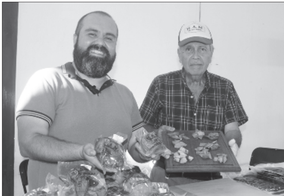
▲ HAM Charcutería funde el tradicional estilo español con ingredientes mexicanos.

Para una excelencia en la preparación de los embutidos que producen, inician con la cría de los animales,