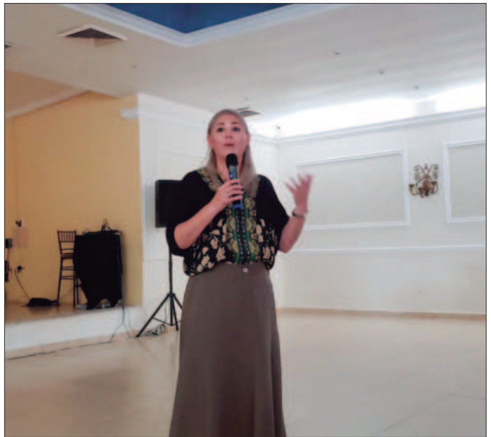
▲ La senadora Verónica Camino sostuvo una reunión con mujeres periodistas y compartió información sobre lo que sucederá en los próximos días camino al proceso electoral.

Además, reconoció que el gobernador de Yucatán, Mauricio Vila, haya permitido el paso de la Cuarta Transformación en el estado, pues llegaron obras de infraestructura como el nuevo Hospital O’Horan, el Parque de la Plancha, las dos termoeléctricas, entre otros.