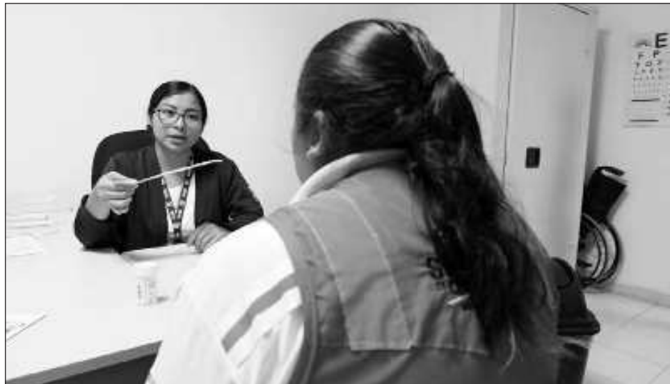
▲ Invitan a que más personas se hagan la autoexploración mamaria, que es con las manos, cada mes, pues dicen que 80% de las mujeres que detecta el cáncer lo encuentra de esta manera.

"Ahorita estamos trabajando con un proyecto de donar cabello, trenzas, para pelucas que serán para pacientes oncológicas. Es para el público en general, vamos a estar como centro de acopio para recibir a las perso-