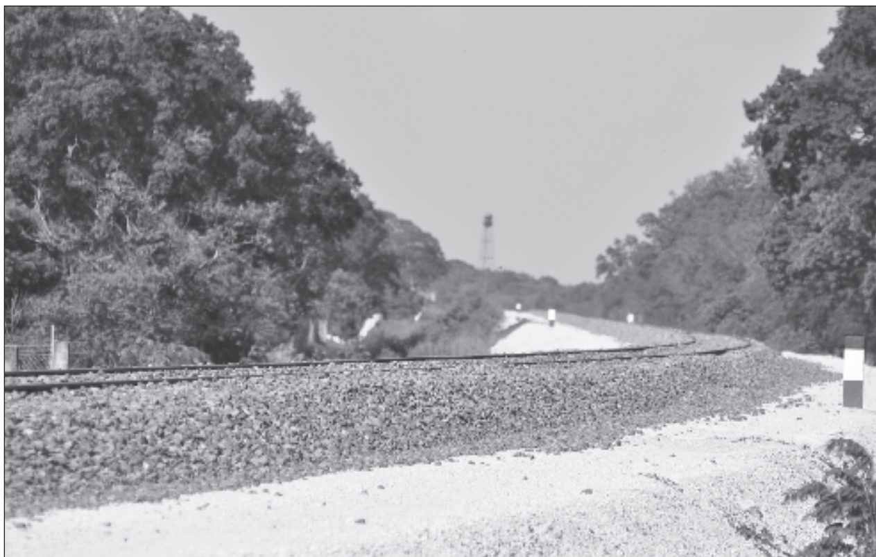
▲ La estructura, que se levanta sobre el río Usumacinta, junto a un emblemático puente de más de 70 años de historia, es parte total para conectar el tramo 1, que va de Palenque, Chiapas, a Escárcega, Campeche, a través de 226 kilómetros.

Así, Fonatur deberá pagar “por concepto de indemnización por la superficie que se expropia, la cantidad señalada en el avalúo”. Sedatu procederá cuando Fonatur Tren Maya haya acreditado el pago.