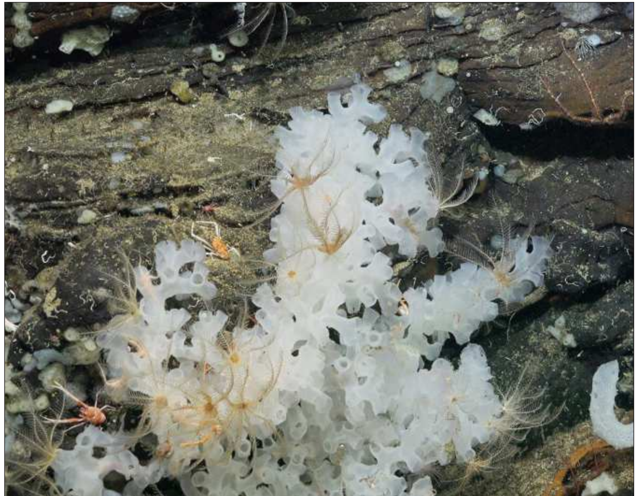
▲ Le ba'ax ila'abo' mina'an mixtu'ux uláak' ti' yóok'ol kaab, le beetik k'a'anantak.

Beey túuno', tu winalil abril máaniko', kaxta'ab xan uláak' jump'éel áaresife