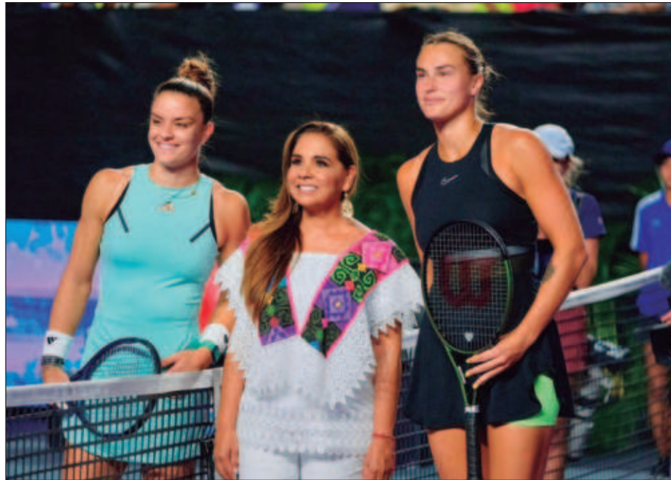
▲ Hasta el 5 de noviembre, el Caribe Mexicano es sede del mayor evento de tenis femenino del mundo, en el que compiten por la copa las ocho mejores jugadoras del orbe.

El domingo, en lo que fue el primer día de competencias, la tenista número uno del mundo, Aryna Sabalenka, hizo su presentación en las GNP Seguros WTA Finals Cancún de forma arrolladora. Sabalenka enfrentó a una consentida de la afición mexicana, la griega Maria Sakkari, a quien derrotó con un contundente 6-0 y 6-1.