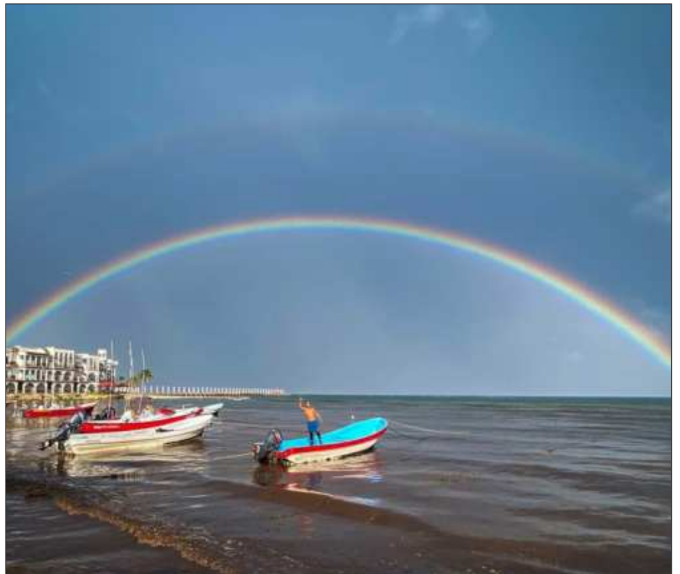
▲ El ITAE incorpora información preliminar de distintas actividades económicas, como las agropecuarias, industriales, comerciales y de servicios.

Los resultados del ITAE están homologados con los del Producto Interno Bruto Trimestral (PIBT), los del Producto Interno Bruto por Entidad Federativa (PIBE) y con las cifras del Sistema de Cuentas Nacionales de México (SCNM), cuyo año base se actualizó a 2018 para garantizar la comparabilidad regional y nacional.