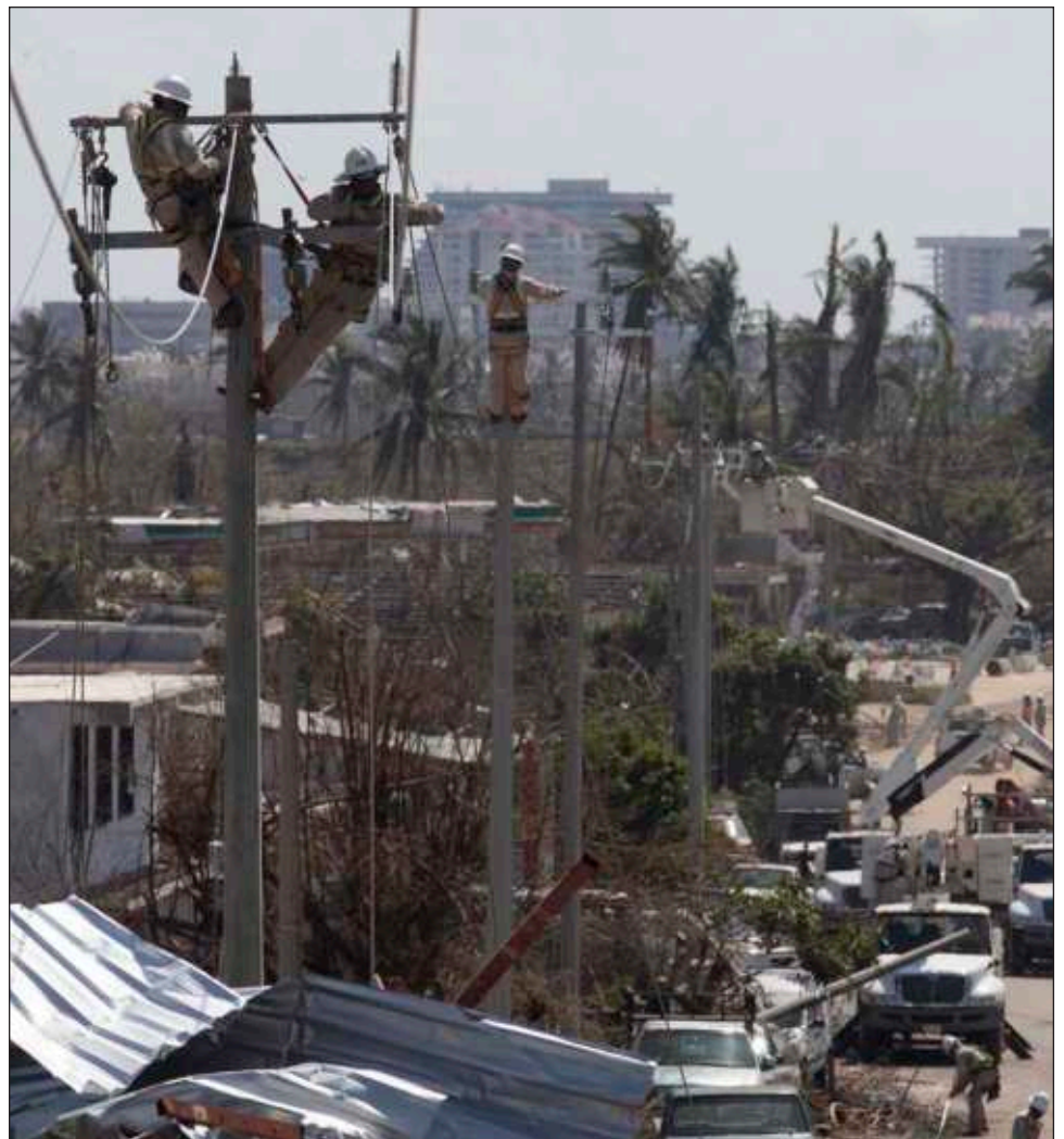
▲ La Comisión Federal de Electricidad detalló que de las 38 líneas de alta tensión que resultaron dañadas se han restablecido 19, lo que significa un avance de 50 por ciento.

La CFE explicó que en la madrugada de este lunes, logró energizar 12 bombeos de agua en San Marcos y Copala, así como los bombeos adjuntos a Pozos Raney del Papagayo y Salsipuedes, que son estratégicos para beneficio de Acapulco y poblaciones aledañas, también la central de Telmex que permitirá mejorar la comunicación en la ciudad principal de Guerrero.