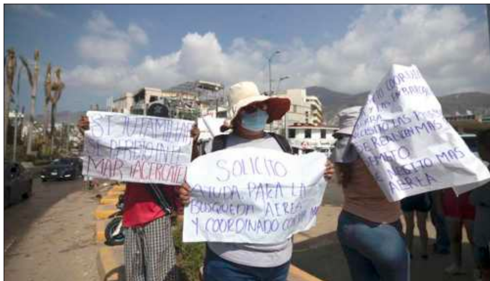
▲ En la Glorieta de La Diana Cazadora, los manifestantes indicaron que hay tripulaciones integradas por entre tres y cinco personas que no han sido ubicadas.

Indicaron que hay tripulaciones integradas por en-