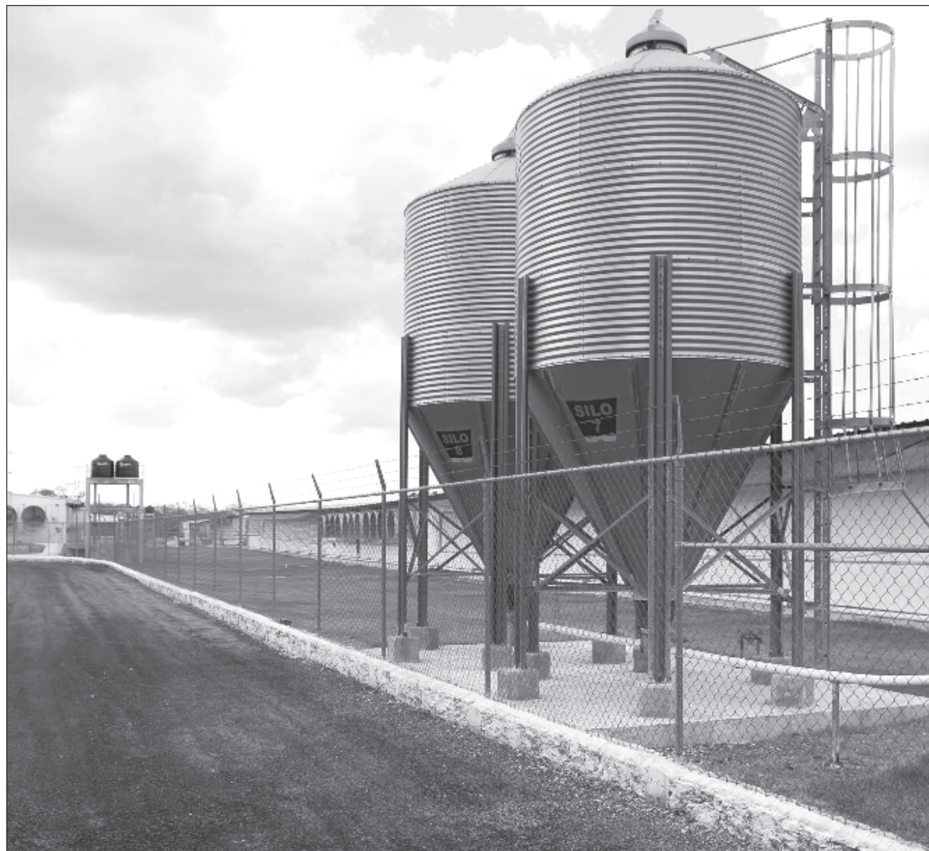
▲ El año pasado, la porcicultura tuvo una producción de un millón 730 mil toneladas.

El funcionario federal expuso que la porcicultura es una agroindustria esencial dentro de la actividad pecuaria nacional y el año pasado tuvo una producción de un