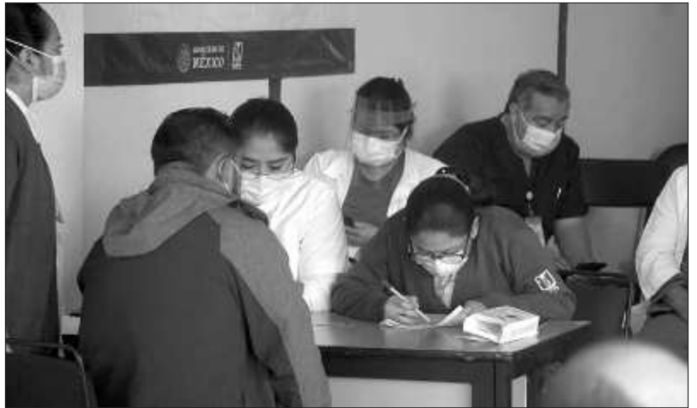
▲ La asociación civil Conciencia Crítica retomó el tema de desabasto de medicamentos en las clínicas de la entidad, pues preocupa la falta de fármacos controlados y básicos.

También retomó el tema de desabasto de medicamentos en las clínicas del