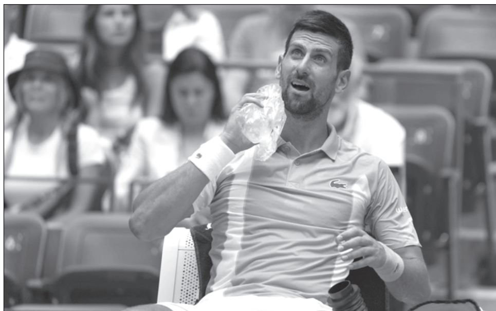
▲ Novak Djokovic se refresca durante el partido contra el español Bernabé Zapata, ayer en Nueva York.

Hace un año en Flushing Meadows, la carrera de Tiafoe cambió al igual que su vida. Derrotó a Rafael Nadal en la cuarta ronda y alcanzó las semifinales de un grande por primera vez, exigiendo