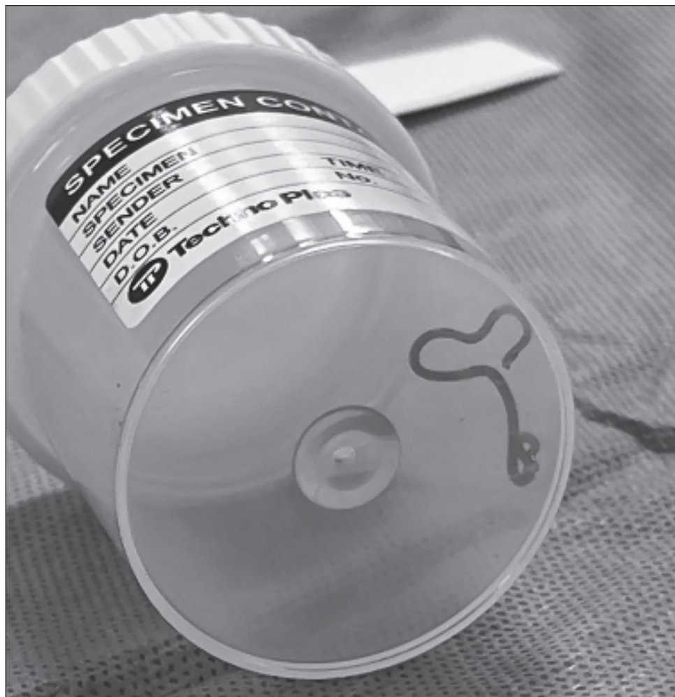
▲ Senanayake agregó que la infección contraída a través del gusano Ophidascaris robertsi no se transmite de persona a persona y no provocará una pandemia como el ébola.

Los científicos suponen que el parásito abandonó su pitón hospedador en las heces y después la paciente lo contrajo al tocar las hierbas o después de comer un plato con ellas. Senanayake agregó que la infección no se transmite de persona a persona.