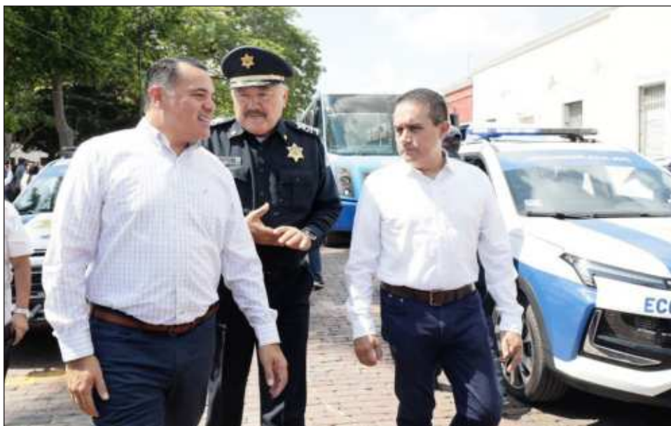
▲ Las unidades entregadas por el presidente municipal se asignarán a las direcciones de Gobernación, Policía Municipal y Servicios Públicos Municipales.

“Esto representó una inversión superior a los 9 millones de pesos. Estamos en un momento histórico para la Policía Municipal de Mérida, en sus 20 años de conformación, nunca se había realizado una inversión similar en la compra de unidades”, acotó.