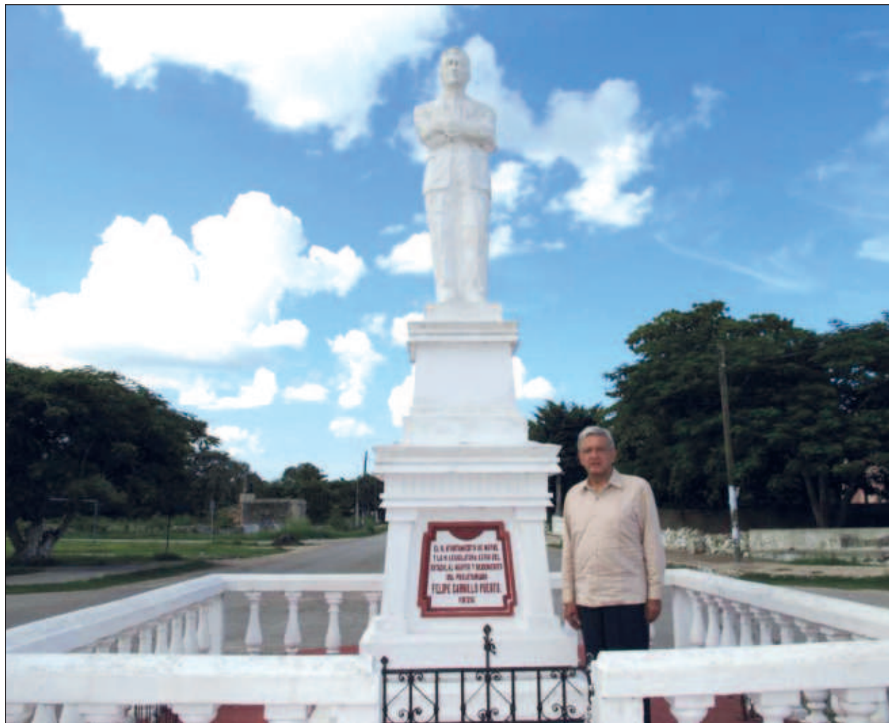
▲ El jefe del Ejecutivo afirmó que el Humanismo Mexicano, modelo ideológico de la 4T, está inspirado en la historia y la grandeza cultural de México, así como las enseñanzas de luchadores sociales y personajes excepcionales.

Tras realizar el diagnóstico, los especialistas canalizarán a las personas de la tercera edad a otras áreas específicas para mejorar su calidad de vida.