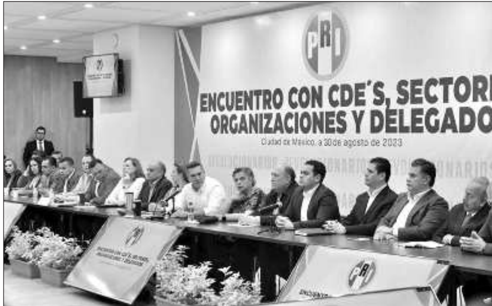
▲ Alejandro Moreno detalló que se reunieron con Beatriz Paredes y con toda la estructura nacional para hacerle conocer la posición de las dirigencias priistas.

Luego de reunirse por un par de horas con Beatriz Paredes en la sede nacional