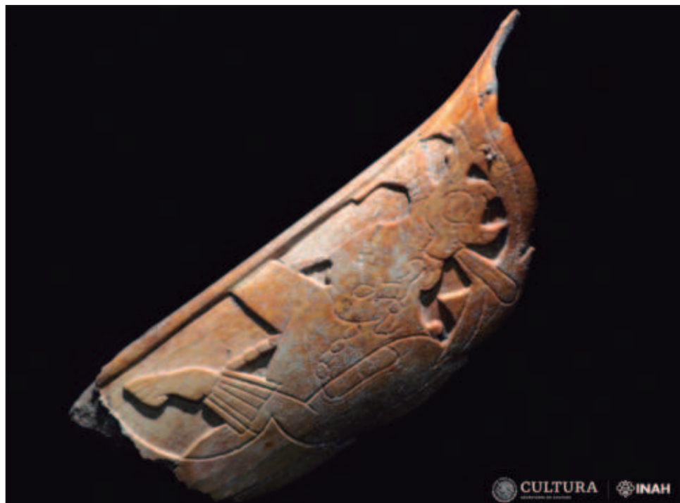
▲ La pieza era usada por los mayas para comunicarse con dioses y antepasados.