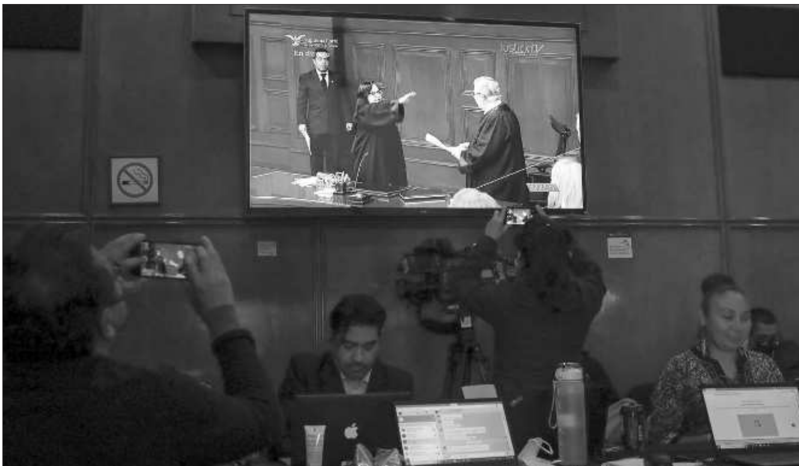
▲ "Las amenazas de la presidente de la SCJN Norma Piña de parar el Poder Judicial si no le otorgan un presupuesto de más de 84 mil millones de pesos, está fuera de lugar, más cuando cargan con el rechazo del pueblo soberano y el descrédito social. El golpismo trasnochado sólo puede conducirlos a un mayor fracaso".