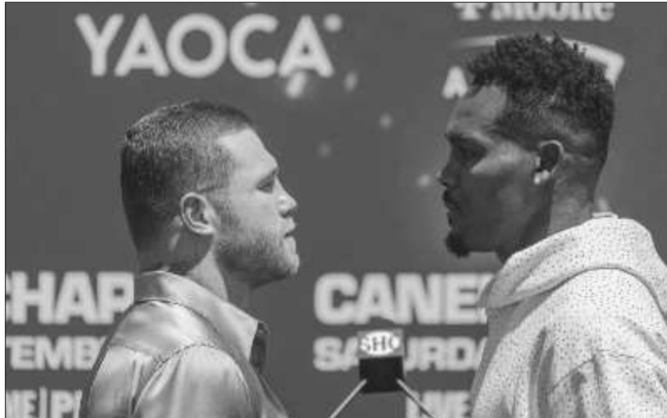
▲ Saúl Álvarez y Jermell Charlo, en una conferencia de prensa en Beverly Hills.

“Ya puedo tirar mi mano fuerte en el ‘sparring’ y con mucha confianza, que era lo que me hacía falta, antes no podía porque seguía