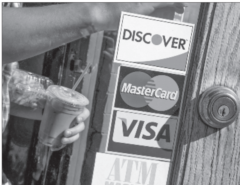
▲ Las acciones de Mastercard subían 1.21 y las de Visa 0.79 por ciento.

Según el WSJ, muchas de los aumentos se aplicarán a las compras por Internet. Visa y Mastercard no respondieron de inmediato a las peticiones de Reuters para hacer comentarios.