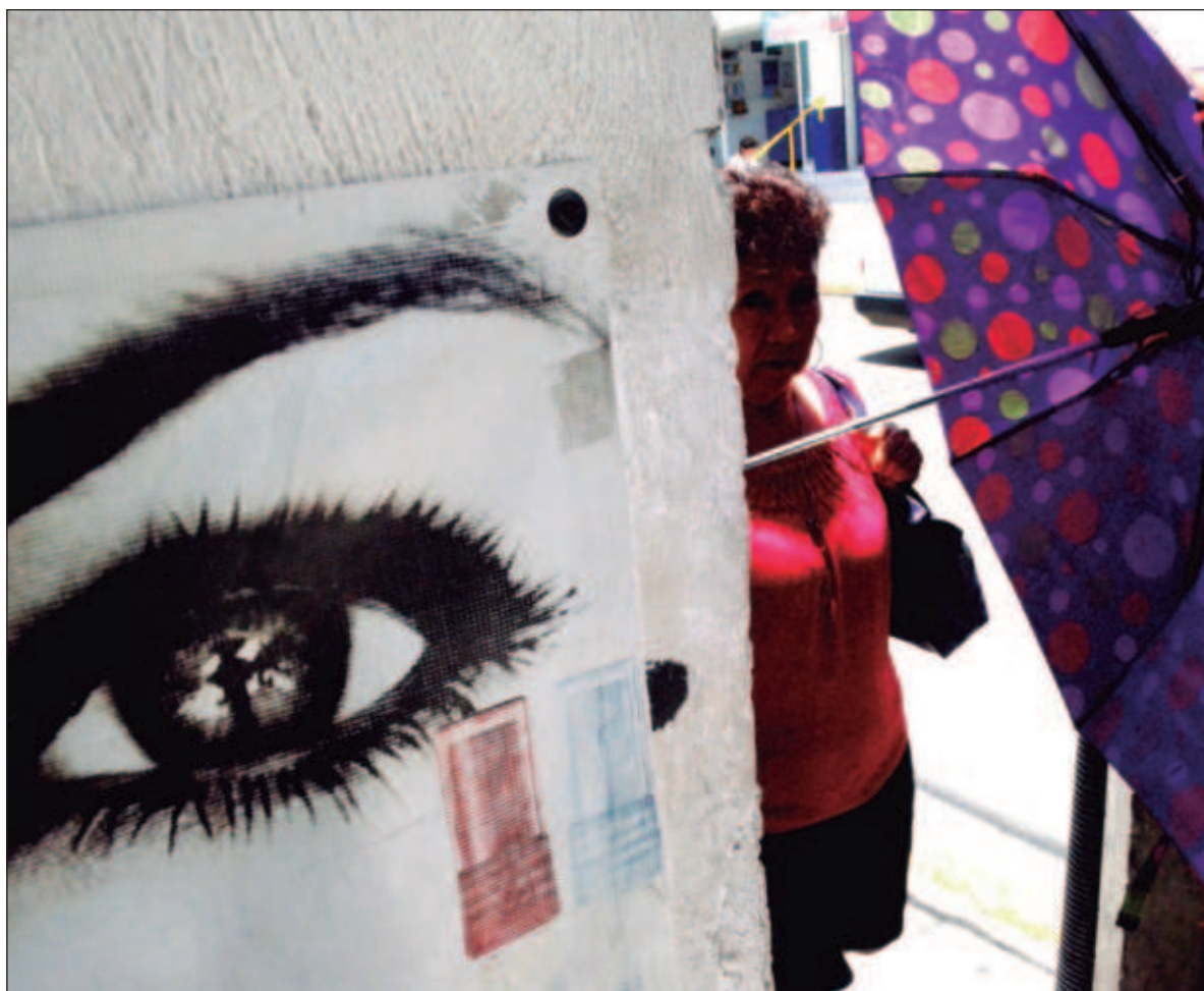
▲ "Given the 'black box' nature of artificial intelligence, and every government's propensity for secrecy, civil society will have to develop the tools and skills to monitor government use of AI".

THROUGH A SYSTEM of incentives and penalties, this system aims to monitor, evaluate, and control the financial, social, mo-