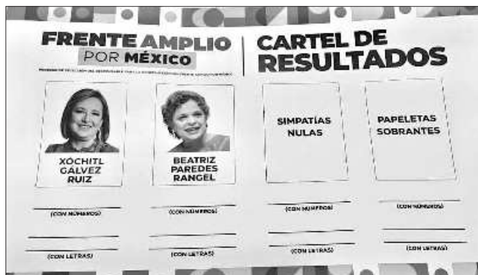
▲ Los resultados fueron presentados la tarde de este miércoles por el comité organizador horas antes de la que la dirigencia nacional del PRI diera a conocer su postura.

Ante el mensaje que daría el PRI en el que, algunas versiones dentro de los partidos del bloque opositor perfilan que se podría anunciar la declinación a de Paredes, el Comité organizador afirmó que contenía con los preparativos para las