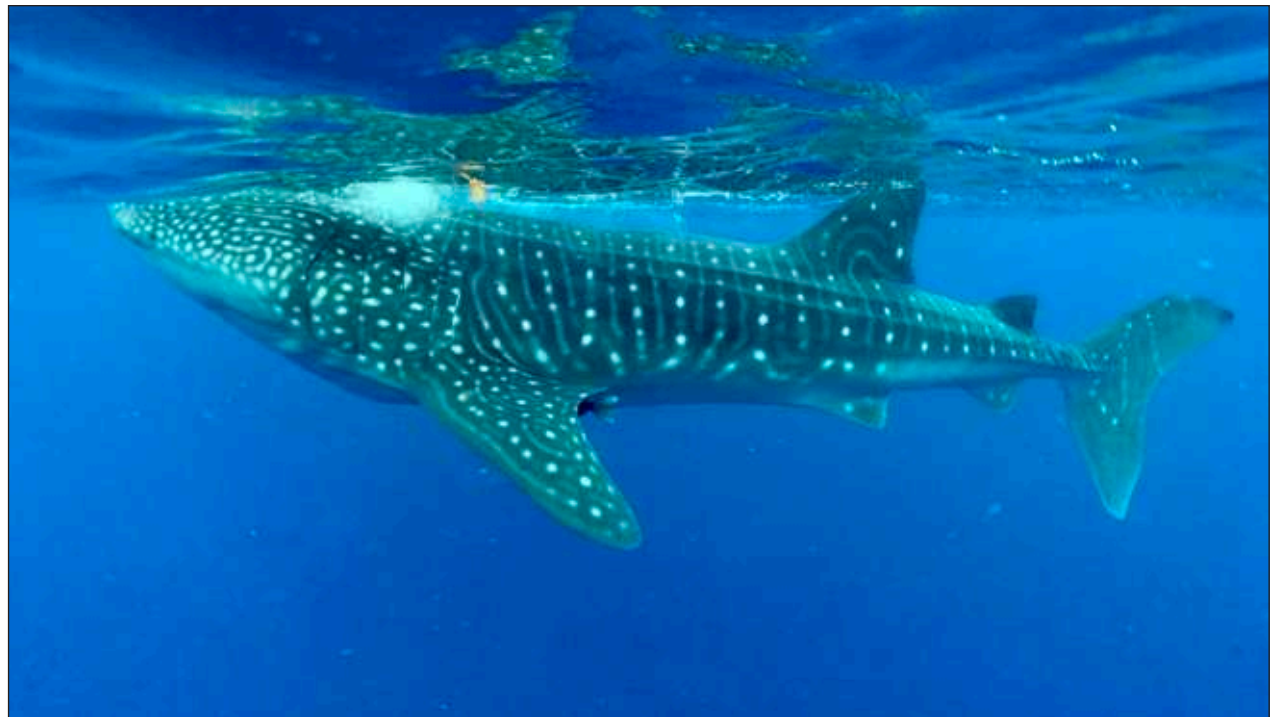
▲ Año con año, estos pacíficos gigantes se congregan en las zonas de alimentación, por lo que muchos turistas llegan en busca de tours para conocer y acercarse al tiburón ballena, generando una enorme derrama económica.

“Estos animales pueden vivir entre 80 y más de 100 años, hasta 130, y no tenemos el derecho de molestarlos, sino de preservarlos y ser responsables para tener este espectáculo de la naturaleza para siempre”, finalizó.