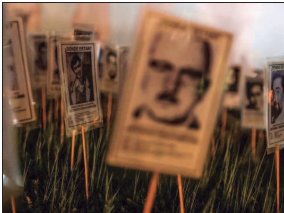
▲ Tras décadas de búsqueda se encontraron e identificaron los restos de 307 personas y falta encontrar a otras mil 162, según las últimas cifras oficiales.

El plan "busca que esa responsabilidad (de búsqueda) sea una obligación permanente del Estado", señaló el ministro de Justicia, Luis Cordero, durante su lanzamiento en el palacio presidencial de La Moneda. "Fue el Estado con sus funcionarios quienes cometieron esos crímenes y es el