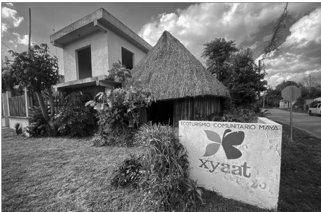
▲ Nueve de cada 10 visitantes que llegan a las zonas rurales de Quintana Roo provienen de Europa.