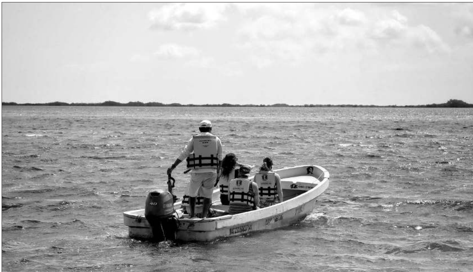
▲ En las 30 localidades que conforman Maya Ka'an, hay muchas empresas comunitarias que han estado haciendo turismo por 15 años.