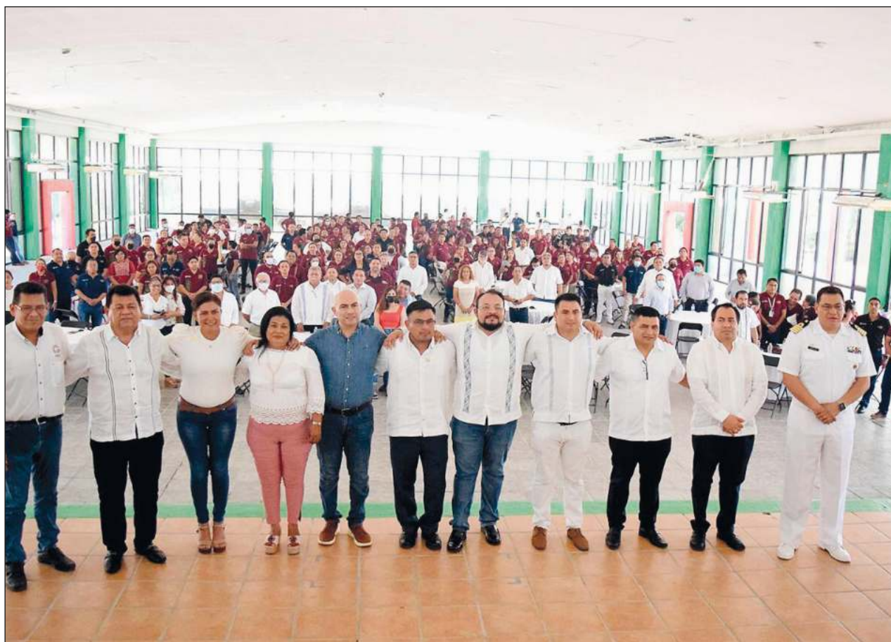
▲ En la ceremonia conmemorativa participaron 220 trabajadores de la Universidad Tecnológica.