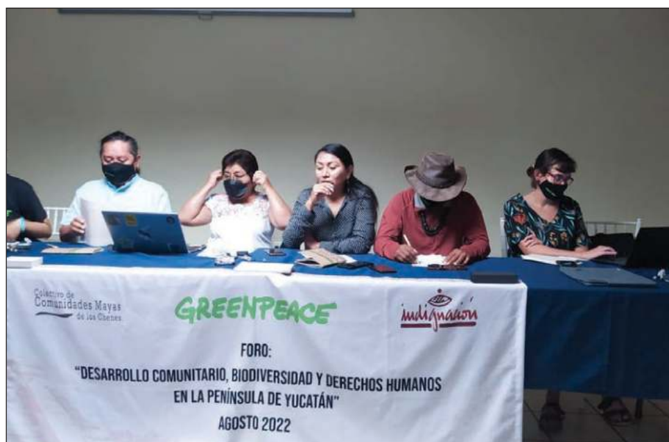
▲ Los especialistas señalaron que los megaproyectos han agravado la crisis de pérdida acelerada de biodiversidad y profundizado el impacto social y cultural.

Como parte de las conclusiones del foro Desarrollo Comunitario, Biodiversidad y Derechos Humanos en la