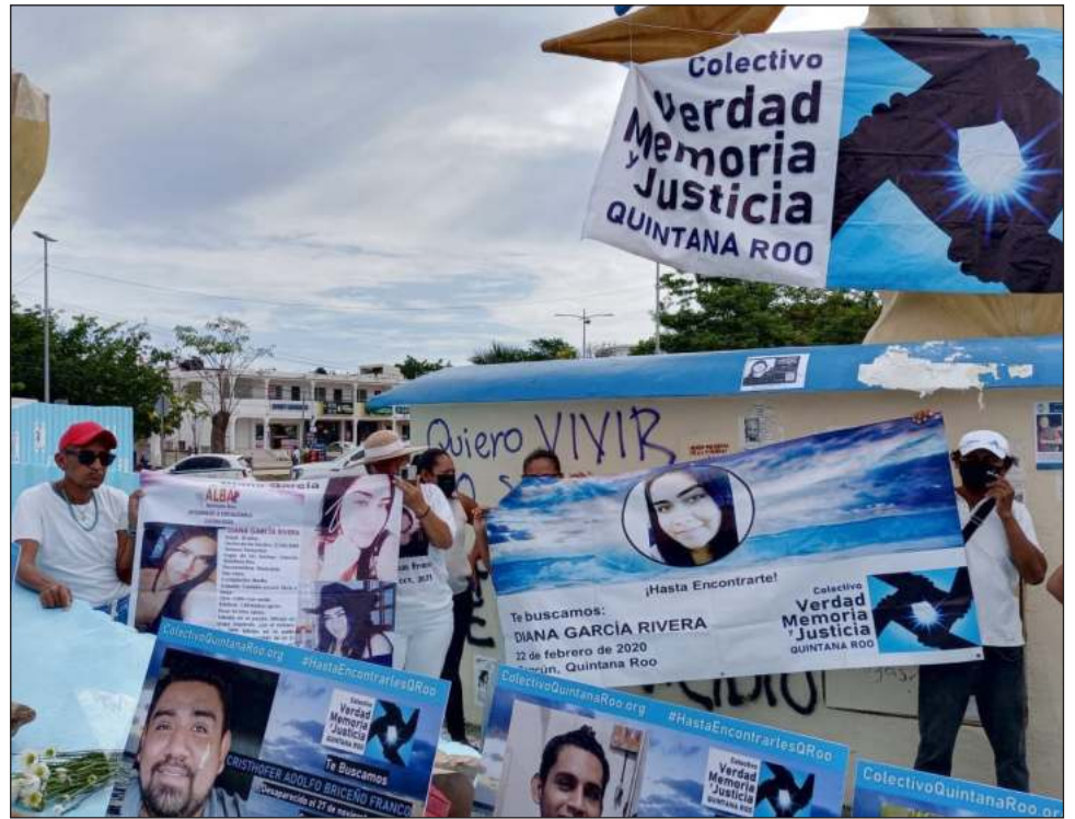
▲ Familiares de personas desaparecidas anunciaron que presentarán un pliego petitorio a la gobernadora electa Mara Lezama, una vez que tome protesta, para la implementación de varios puntos, como la creación de la comisión estatal de búsqueda de personas.

Estos puntos se presentarán tanto a la gobernadora electa como a todos los diputados y diputadas que están por entrar en funciones, con el objetivo de ser escuchados y se inicien nuevos trabajos para una búsqueda eficaz de todas las personas desaparecidas.