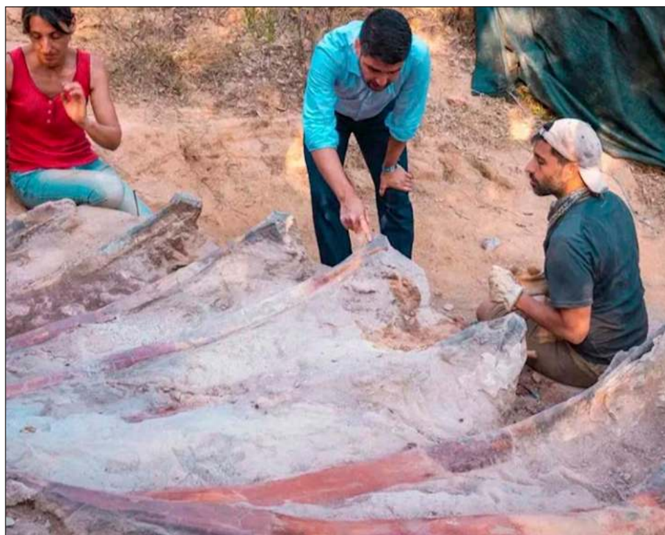
▲ El fósil está increíblemente bien conservado. Las costillas de la criatura parecen estar intactas y el esqueleto ha mantenido su posición anatómica original.

Los restos desenterrados en Portugal podrían pertenecer al saurópodo más