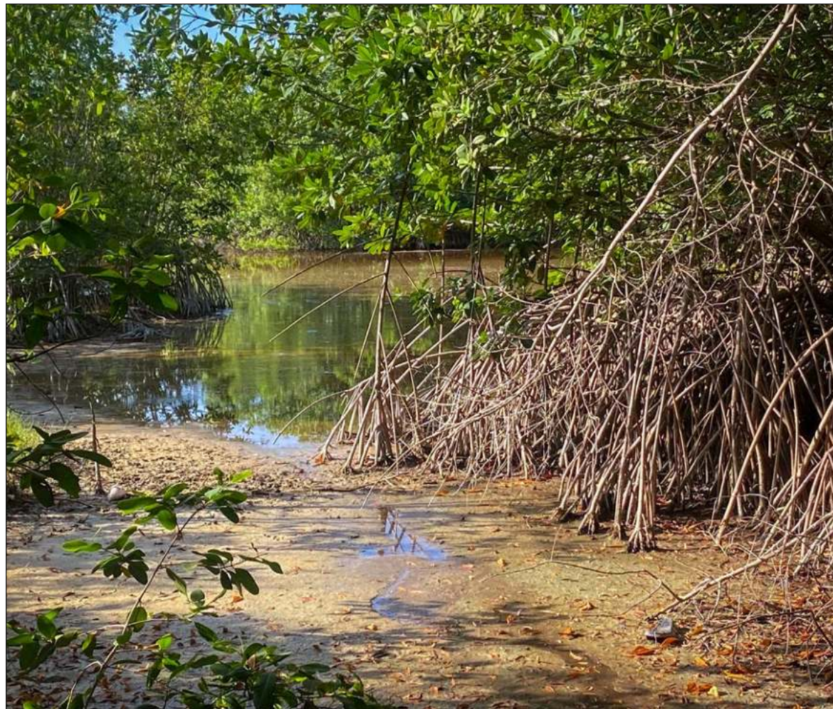
▲ “Cada vez me queda más claro la necesidad de incrementar las acciones de ciencia ciudadana, para que toda persona conozca qué hacer y qué no hacer ante fenómenos ambientales, como la marea roja”.

En los océanos hay ciclos bioquímicos (del griego bio = vida y geo = tierra) que son la conexión de flujos de energía entre los elementos vivos y los no vivos de los ecosiste-