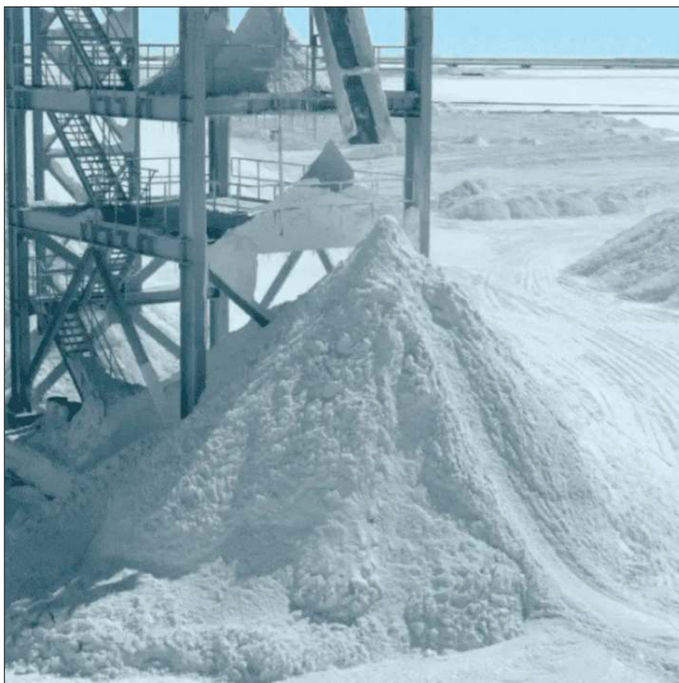
▲ Según el gobierno federal, la empresa Lito México se instalará en Sonora.

"El objeto de Lito para México es la exploración, explotación, beneficio y aprovechamiento del litio, ubicado en territorio nacional, así como la administración y control de las cadenas de valor económico de dicho mineral", señaló la Secretaría de Energía (Sener) en la mencionada publicación del decreto.