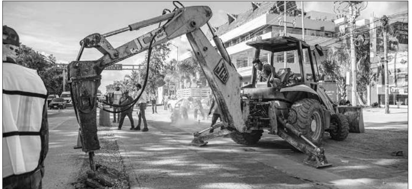
▲ El alcalde de Tulum pidió comprensión por las molestias que puedan ocasionar los trabajos.

"Para mi esta obra es una de las más importantes, independientemente de todas las obras que tenemos que hacer para dignificar las