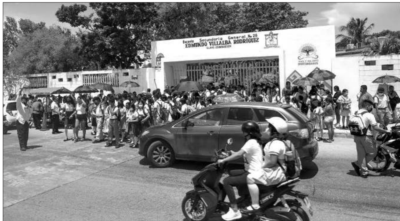
▲ Cerca de 50 mil alumnos de educación básica regresaron a las aulas en Solidaridad.

Durante el mensaje que dirigió en la secundaria técnica, la presidente celebró el aniversario de este plantel, el cual se creó hace 11 años, incentivando a sus directivos a seguir adelante. "Hay que disfrutar mucho el estudio, porque todo lo que hoy atesoren, ese estudio y conocimiento, se va a convertir en su futuro; con la práctica de ese conoci-