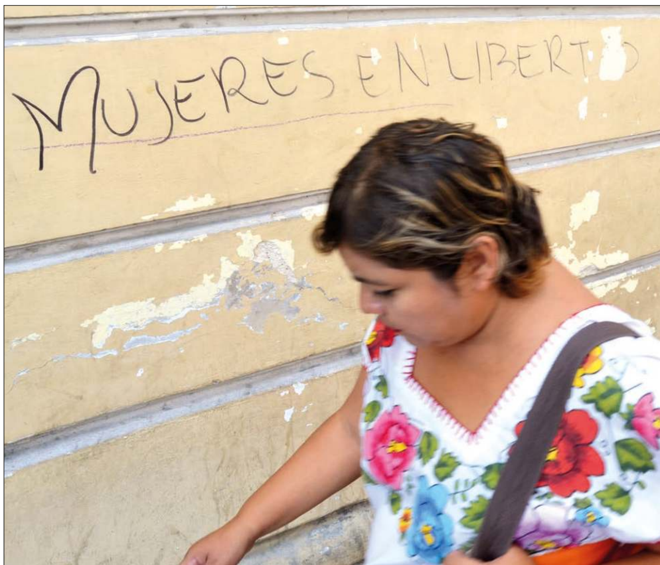
▲ A nivel peninsular, la violencia contra las mujeres de 15 años o más predomina en Yucatán, con 71.4 por ciento; Quintana Roo registra 70.4 por ciento, mientras que en Campeche, la encuesta arroja 67 por ciento.

Las mediciones arrojan que en el caso de Yucatán la violencia a lo largo de su vida de estudiante, en las mujeres de 15 años o más es de 30.5 por ciento; en el ámbito laboral, 27.1 por ciento; en el comunitario, 46.6 por ciento; y en violencia de la pareja, 45.1 por ciento.