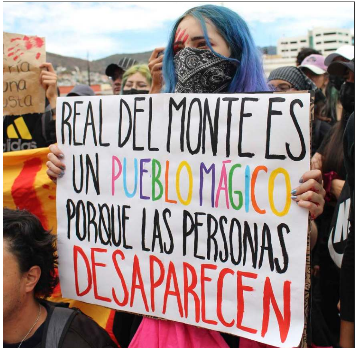
▲ "Las detenciones de los más de 60 jóvenes no habían sido a las afueras de la fiesta de bienvenida, sino en distintos puntos del pequeño municipio con un sólo objetivo: aprehender a estudiantes."

Al darse a conocer el caso, el edil desmintió la versión de más de 60 personas y alegó que la detención se dio en un sólo punto y eran acusados de sacrificar a un gato como parte de un ritual, y más tarde diría que también estaban señalados de herir a una mujer. Ninguna de estas dos ver-