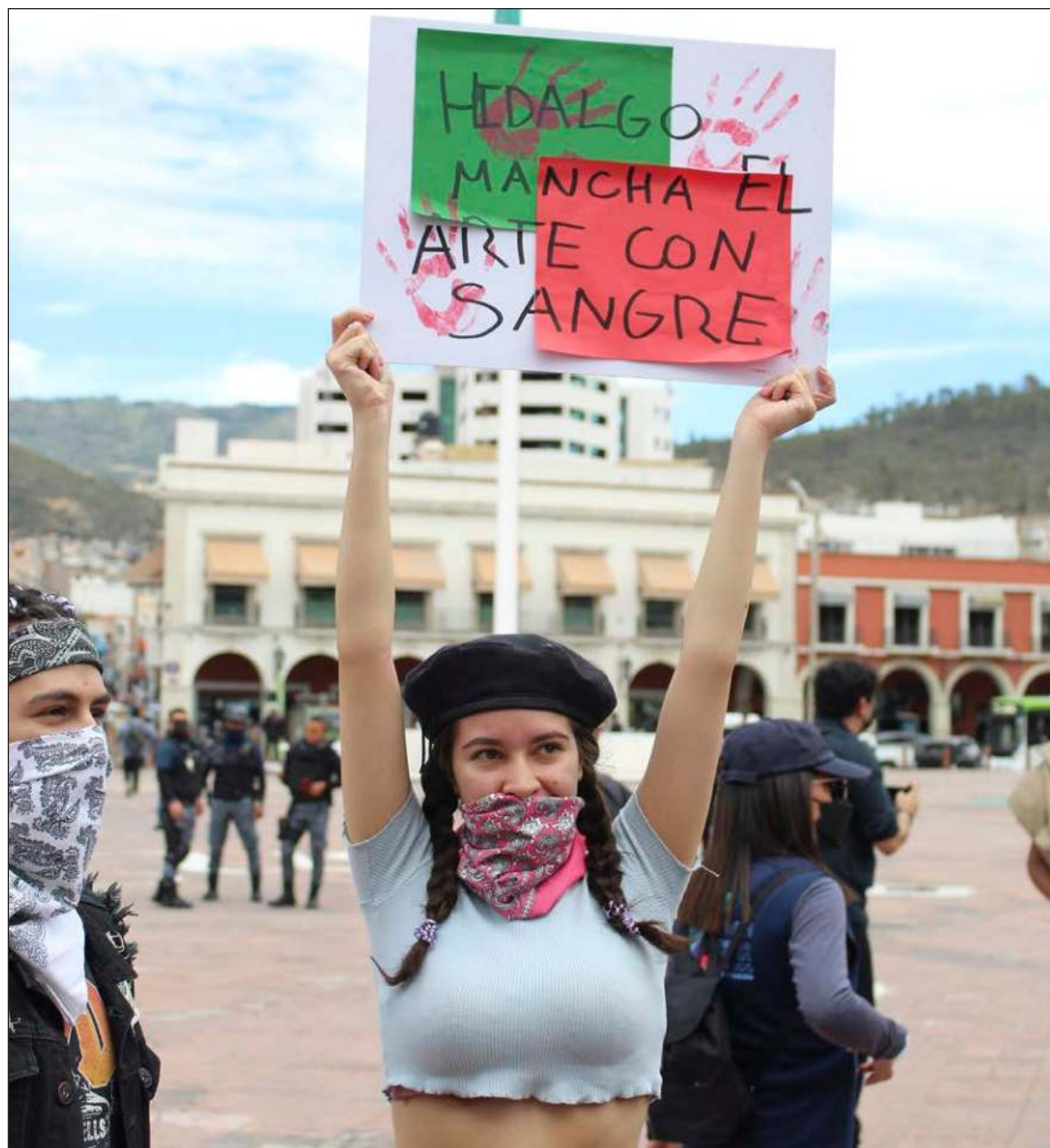
▲ “En enero animalistas protestaban en la entrada del pueblo mágico de Real del Monte, cuando el alcalde junto con comerciantes y funcionarios reprimieron a golpes y amenazas a los manifestantes”.

Ante ese caso, Omar Fayad, gobernador priista, dio a conocer que se iniciarían las investigaciones pertinentes; sin embargo, sobre la detención de los 62 estudiantes, no dio ninguna postura ni mencionó el incidente, contrario a su postura casi inmediata