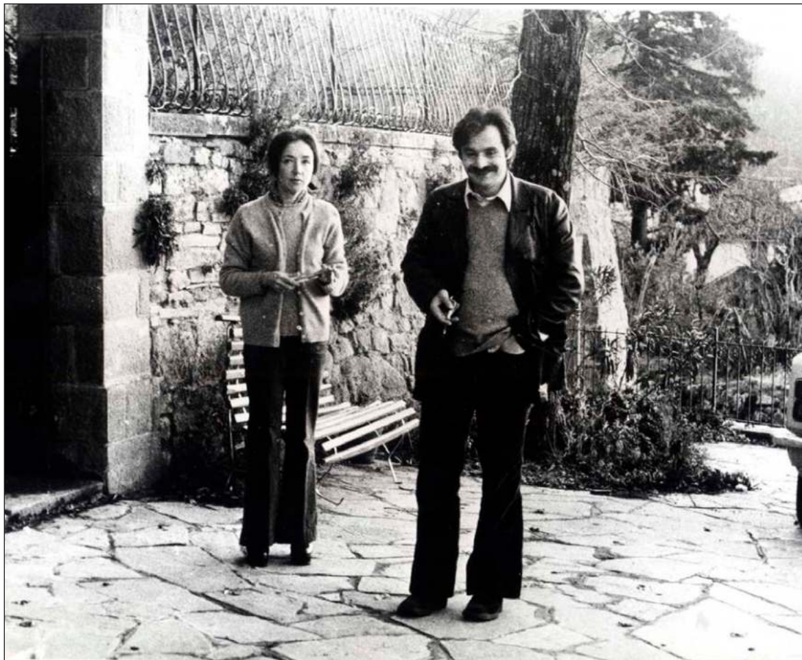
▲ “Un Ulises apátrida, incrédulo a los dioses, espera en Ítaca la llegada de su Penélope, que sin saber que la entrevista se convertiría en amor encuentra en él el motivo de su irremediable hambre de héroes y heroínas”. Foto Facebook Oriana Fallaci

Parte del martirio que el griego sufrió fue la postergación de su ejecución, a última hora, un sin-