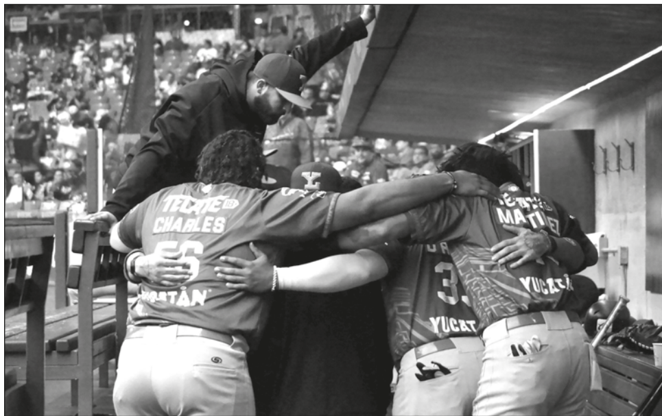
▲ Los bicampeones del Sur, antes del encuentro de anoche.