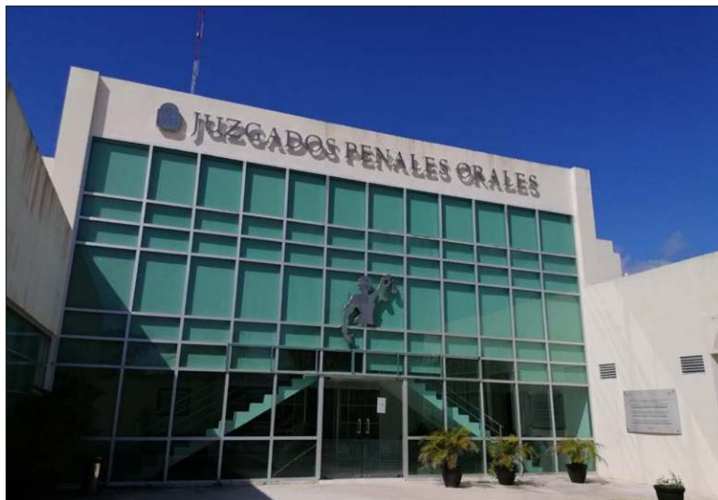
▲ Es claro que los vicios, inercias y extravíos que exhibe el tratamiento de estos dos casos –el de Vallarta-Cassez y el de Ayotzinapa– se repiten en miles de otras causas penales.

Esta situación exasperante y angustiada hace necesaria la realización de una reforma a fondo del Poder Judicial y de las fiscalías del país; resulta deseable, por ello, que la legislatura federal tome cartas en el asunto a fin de construir los instrumentos legales que se necesitan para emprender tal reforma.