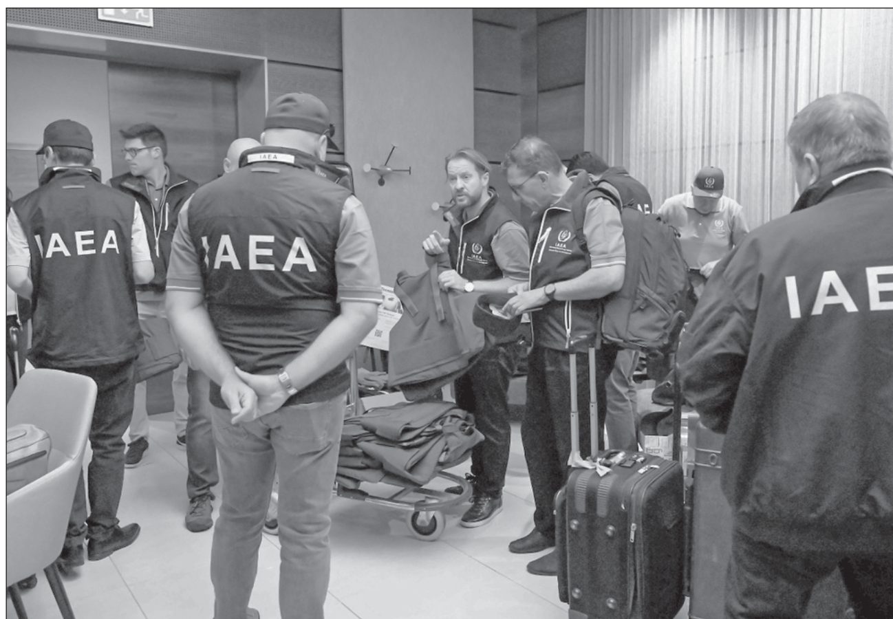
▲ La semana pasada, la central nuclear de Zaporíyia fue brevemente desconectada de la red eléctrica por primera vez en su historia, después de que varias líneas de suministro resultaran dañadas por bombardeos.

“Debemos obtener de Rusia una desmilitarización”