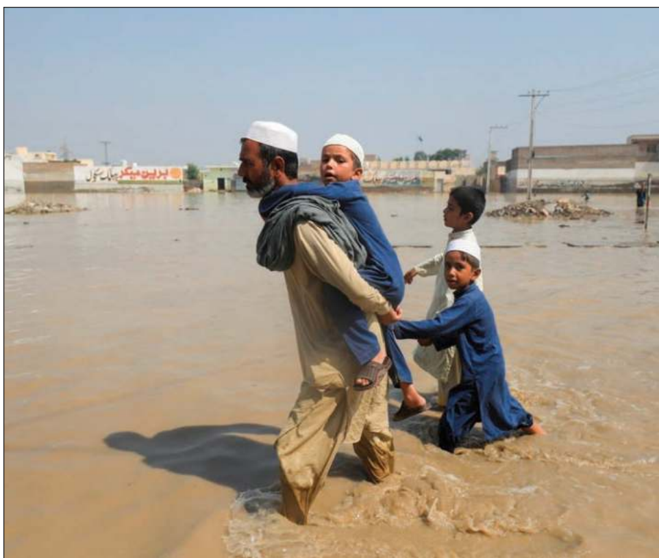
▲ El gobierno paquistaní estima hasta ahora en 10 mil millones de dólares los daños.

Por su parte, el ministro de Relaciones Exteriores de Pakistán, Bilawal Bhutto Zardari, señaló que miles de mujeres, niños y hombres han sido desplazados por las aguas y se ven obligados a pasar días y noches en campamentos y áreas abiertas.