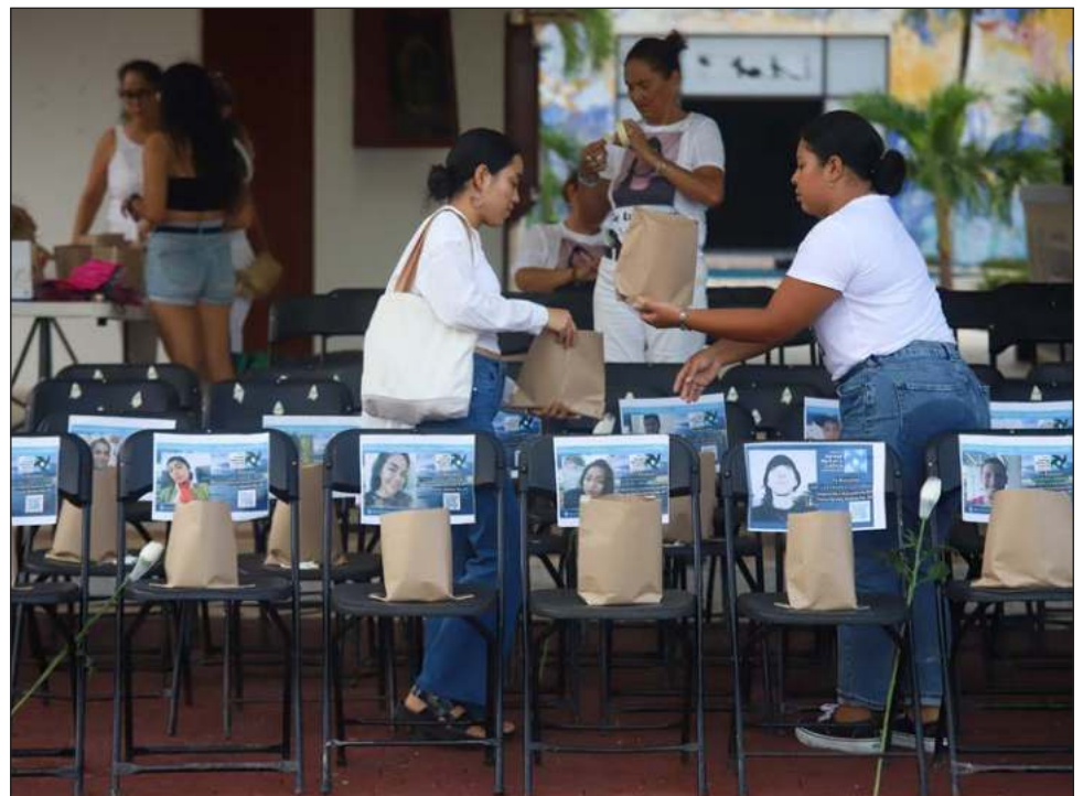
▲ Activistas y familiares de desaparecidos colocaron una ofrenda y sillas vacías en los bajos del palacio municipal de Solidaridad para

representar a aquellas personas que han sido privadas de su libertad y de las que aún se desconoce su paradero.