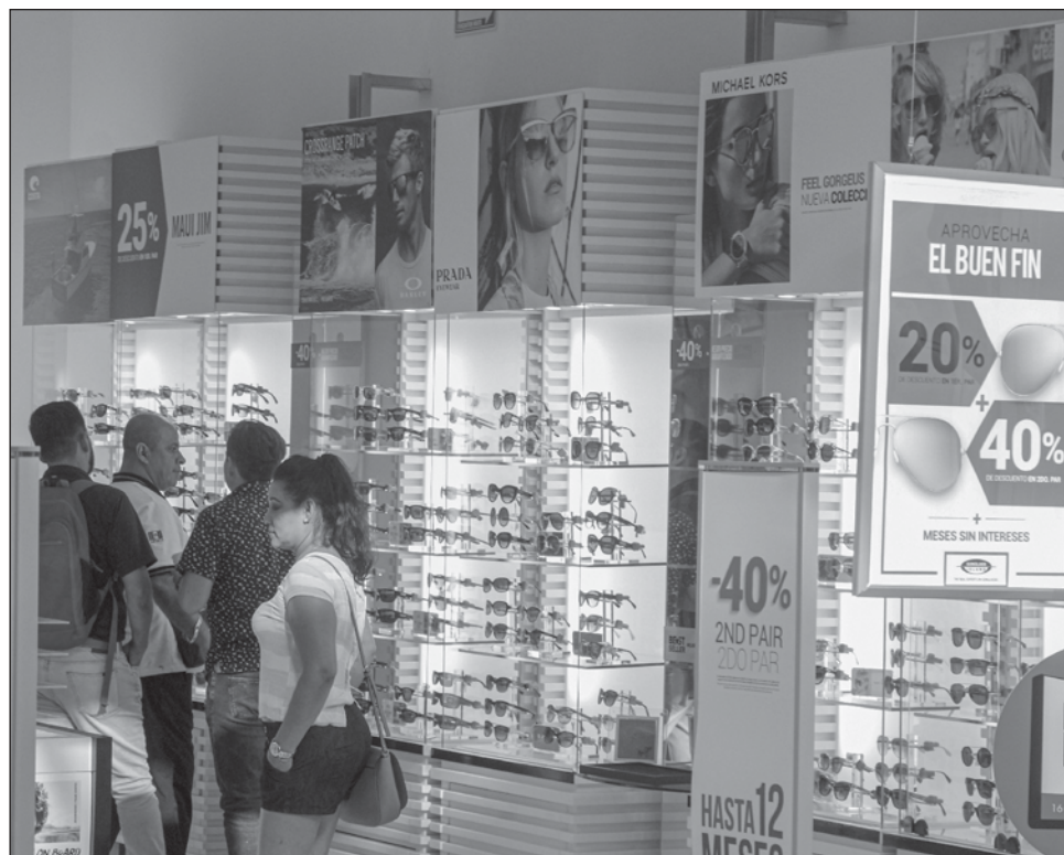
▲ Datos del Inegi revelan que más de 99 por ciento de los establecimientos del país son micro, pequeños o medianos y generan siete de cada 10 empleos.