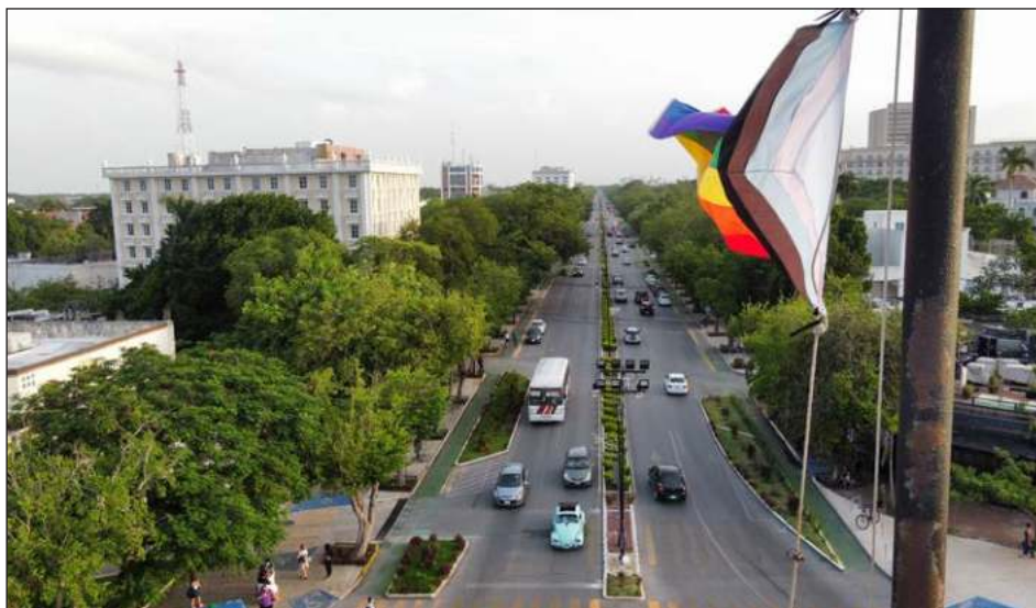
▲ Llevar Cinema Queer México a diferentes ciudades abre la oportunidad a relacionarse para conocer lo que ocurre en diferentes contextos.

Desde el Instituto Mexicano de Cinematografía