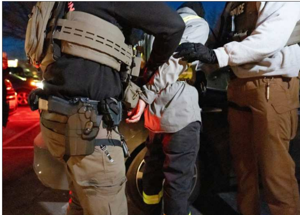
▲ Sheinbaum anunció que a partir de ahora no sólo se presentarán notas diplomáticas para inconformarse por estos hechos, sino que se realizarán otras acciones de protesta.

La presidenta Claudia Sheinbaum Pardo confirmó que uno de los cuatro obreros atrapados en la mina Santa Fe, en Sinaloa, fue res-