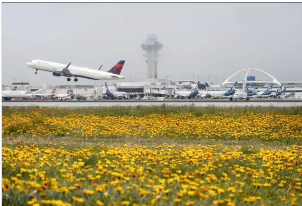
▲ El Consejo Mundial de Viajes y Turismo advirtió que están en riesgo cerca de 130 millones de traslados y que más de medio millón de pasajeros han dejado de volar debido a las restricciones.

Se trata de una nueva alerta que se suma a la que fue lanzada el 11 de marzo, en la que el organismo estimó que la situación en esa parte del mundo deja pérdidas diarias de 600 millones de dólares en la industria turística. "Se estima que 135 millones de viajes a nivel global están en riesgo en 2026, incluidos 116 millones de