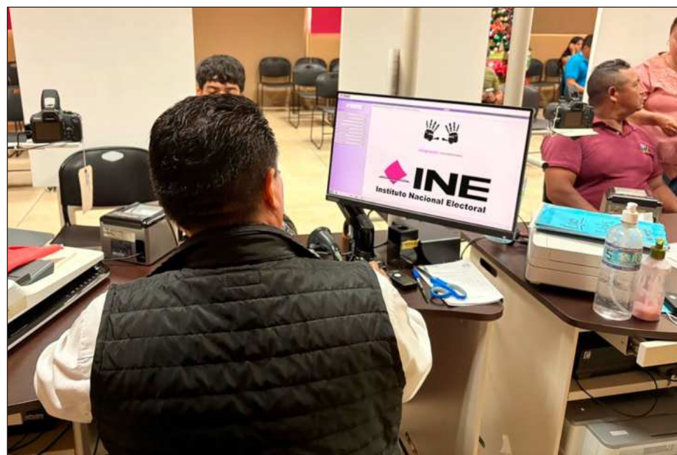
▲ Al 31 de diciembre de 2025, el INE registró 2.3 millones de peticiones de credenciales para votar en las ventanillas consulares, y casi todas fueron tramitadas en EU.

“Este volumen sostenido de solicitudes no sólo evidencia el interés de nuestra ciudadanía migrante por ejercer sus derechos, sino que pone