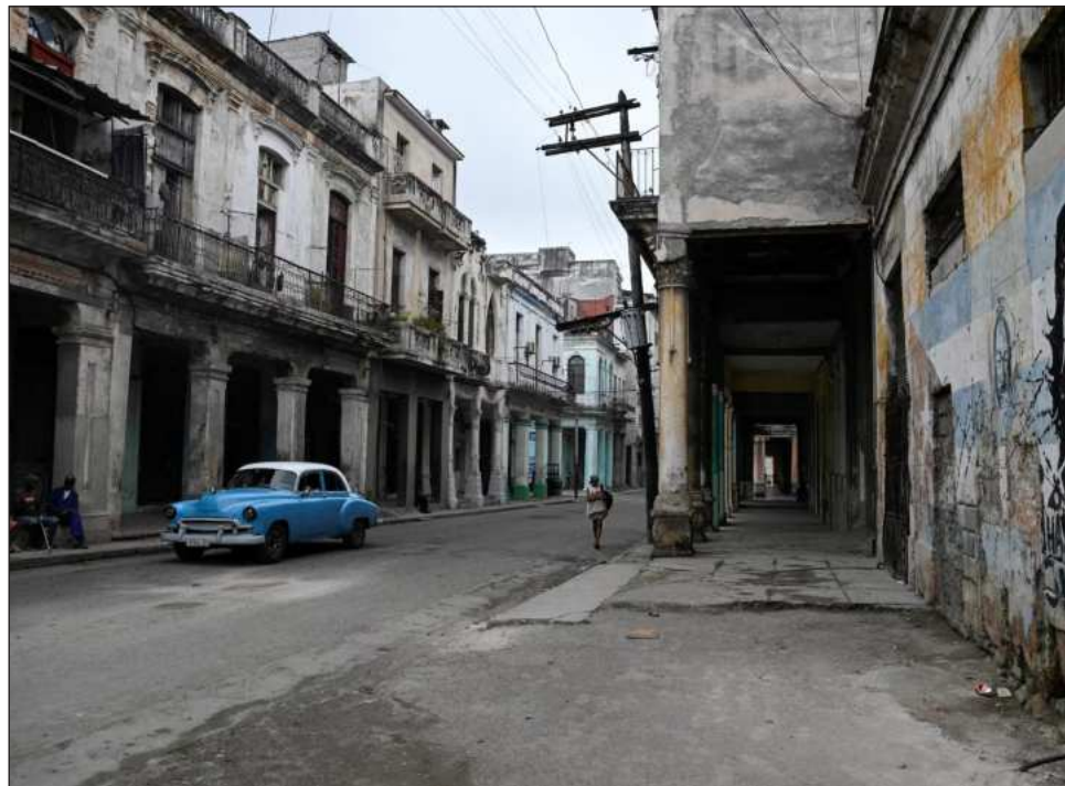
▲ EU señaló que la llegada del buque fue permitida por “razones humanitarias”.

Se anunció la llegada del barco ruso —que pertenece a la empresa Sovkomflot, sancionada por Washington desde 2024, y que partió del puerto