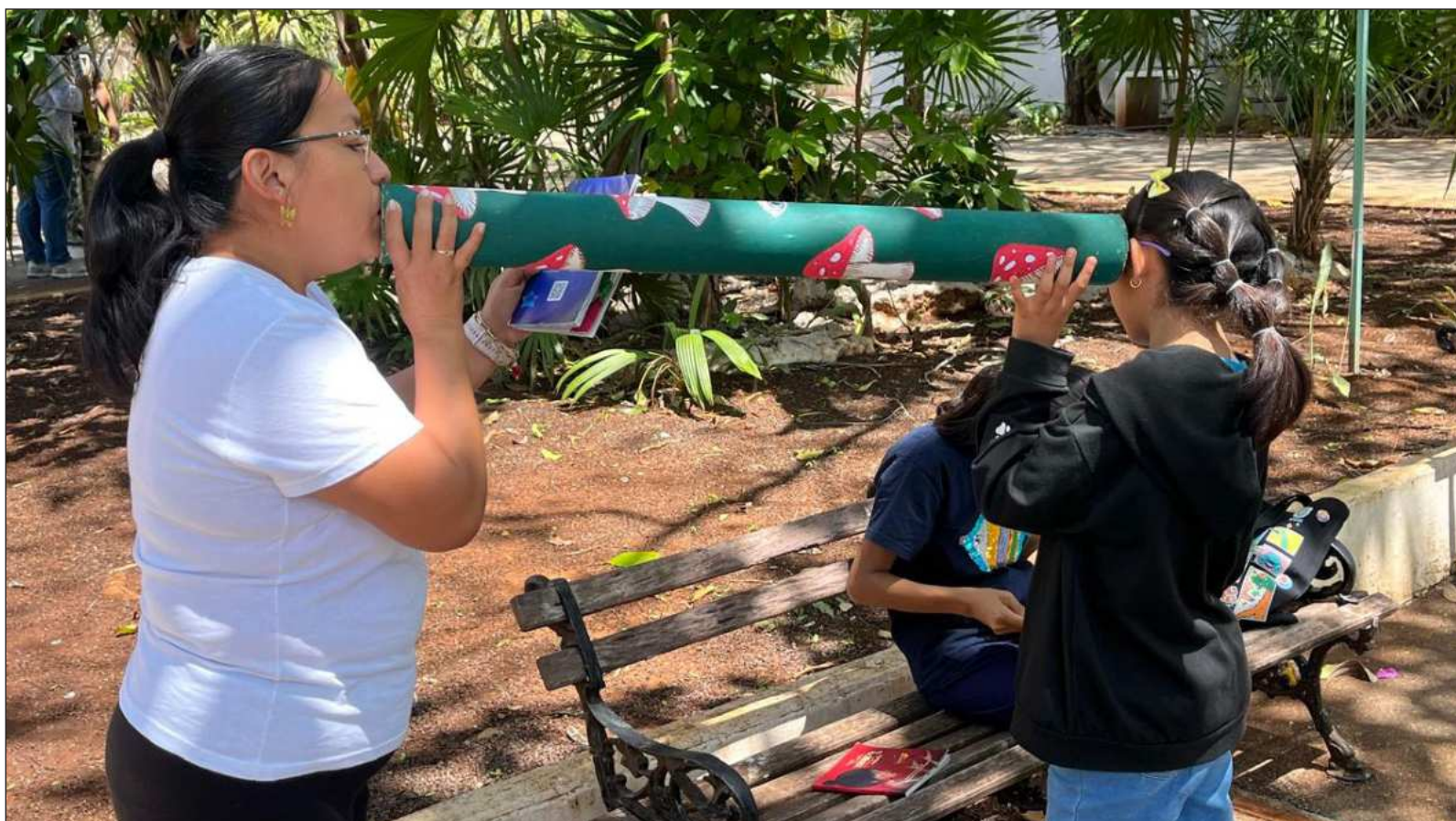
▲ "Este día se celebra en muchos países con lecturas públicas, talleres, festivales literarios para acercar la poesía a personas de todas las edades".