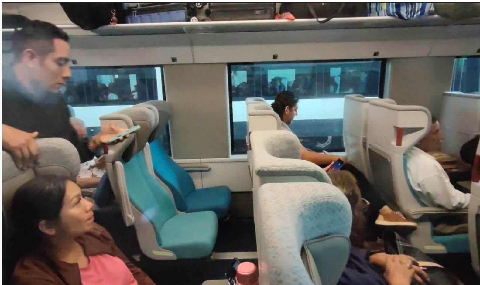
▲ ““Queda claro que para Einstein todas las leyes de la naturaleza, de la materia o de cuerpos luminosos, son siempre idénticas”.