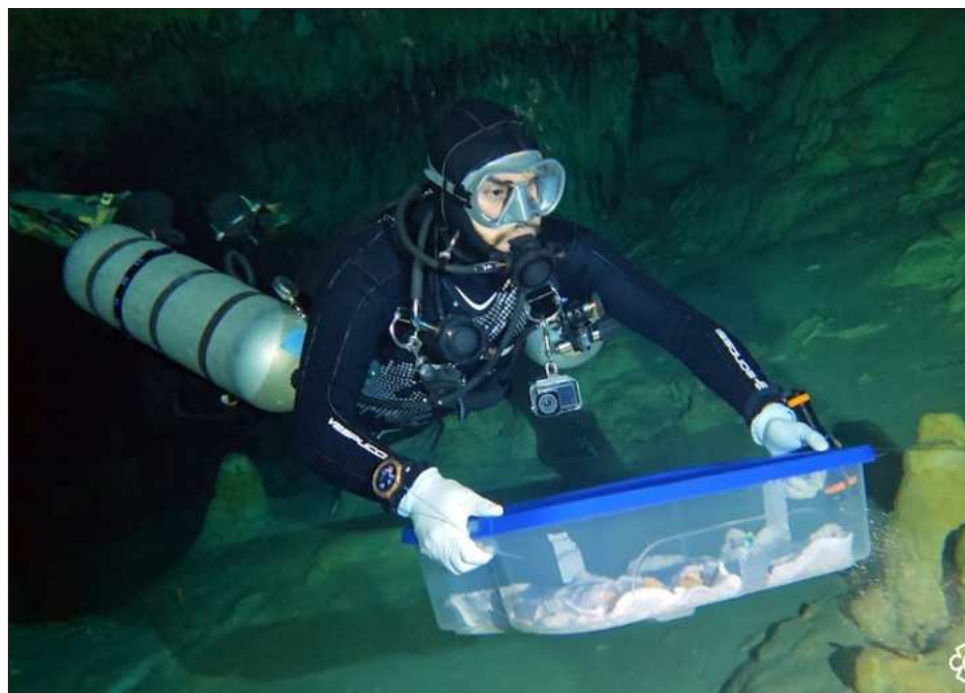
▲ Calculan que fue recuperado 40 por ciento del esqueleto, con partes del cráneo, algunas costillas y vértebras, las clavículas, el omóplato derecho, fragmentos del coxal y de huesos de extremidades.

La pieza llegó embalada en cajas herméticas para proteger su conservación y prevenir cualquier contaminación. Fue entregada al antropólogo físico Arturo Talavera González, responsable de dicha área y