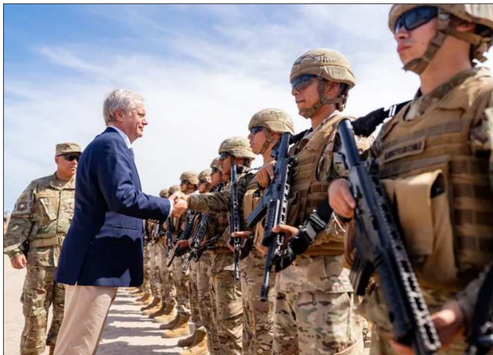
▲ Los ataques armados en escuelas son inusuales en el país sudamericano.

El viernes un chico de 18 años protagonizó un ataque con arma blanca en un colegio del norte de Chile que causó la muerte de una inspectora de 59 años y heridas a otras cuatro personas, entre ellas otra trabajadora y tres alumnos. Una de las víctimas permanece ingresada en riesgo vital, mientras que el agresor está detenido.