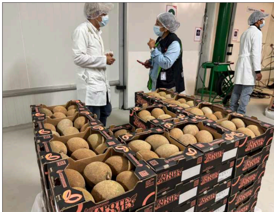
▲ Desde Akil, se enviaron dos toneladas de producto al mercado británico.

Añadió: “El cliente tiene que recibir la fruta, esperar