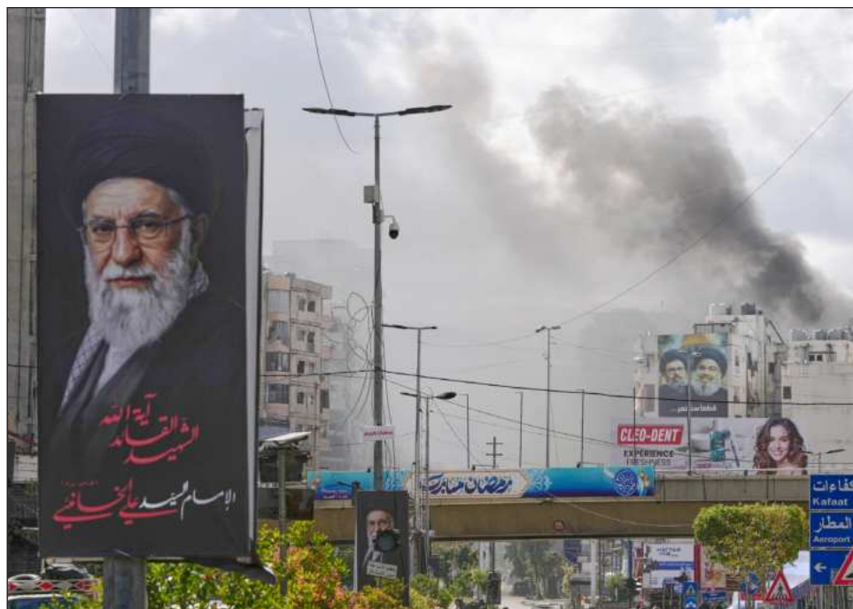
▲ Estados Unidos e Israel lanzaron ayer una nueva oleada de ataques contra Irán.

La nueva amenaza de Trump se produjo en una publicación en redes sociales. Comentarios anteriores en una entrevista con el Financial Times sugerían que tropas estadounidenses podrían tomar el centro de exportación de petróleo de la isla iraní de Kharg. Ha afirmado repetidamente que está logrando avances diplomáticos —aunque Teherán niega negociar directa-