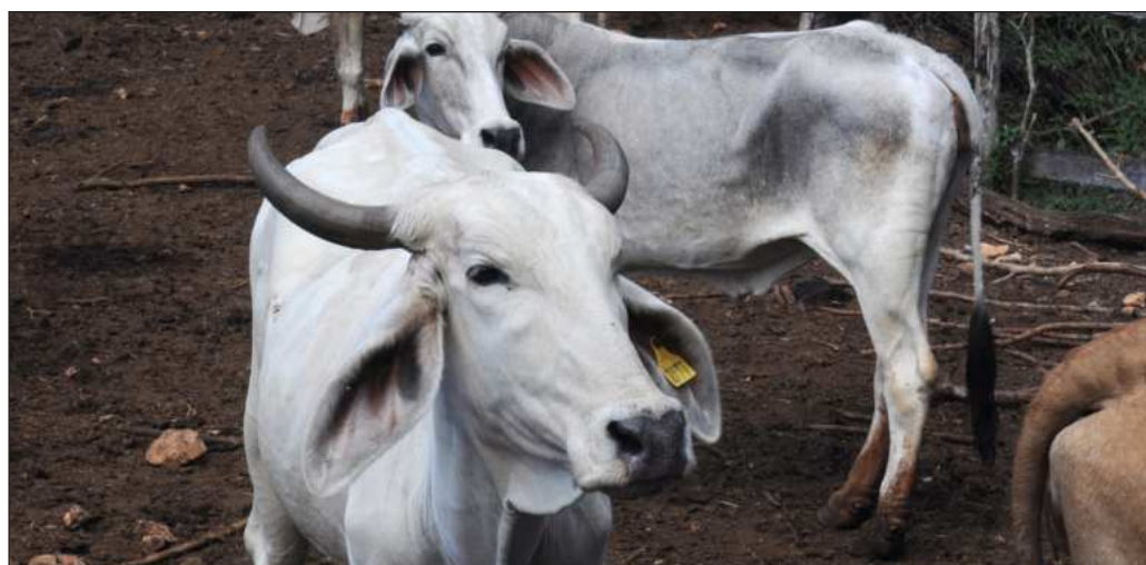
▲ Parece que la Seder no ha querido o no ha podido extender su coordinación hacia la SSY, o esta última no considera que el gusano barrenador sea un asunto de salud pública.

Cuando además existe una enorme dependencia del abasto de energía por parte de la Comisión Federal de Electricidad, otra paraestatal que insiste en aumentar la capacidad de producción pero no en actualizar su red de distribución, el pronóstico de apagones y falta de agua se refuerza peligrosamente. Reconocer que se ha sido rebasado es insuficiente, porque tampoco se ven acciones por parte de la Japay para aportar a una solución. Todavía no empieza el calor, y las protestas pueden llegar a niveles que tienen mucho de no verse en Yucatán.