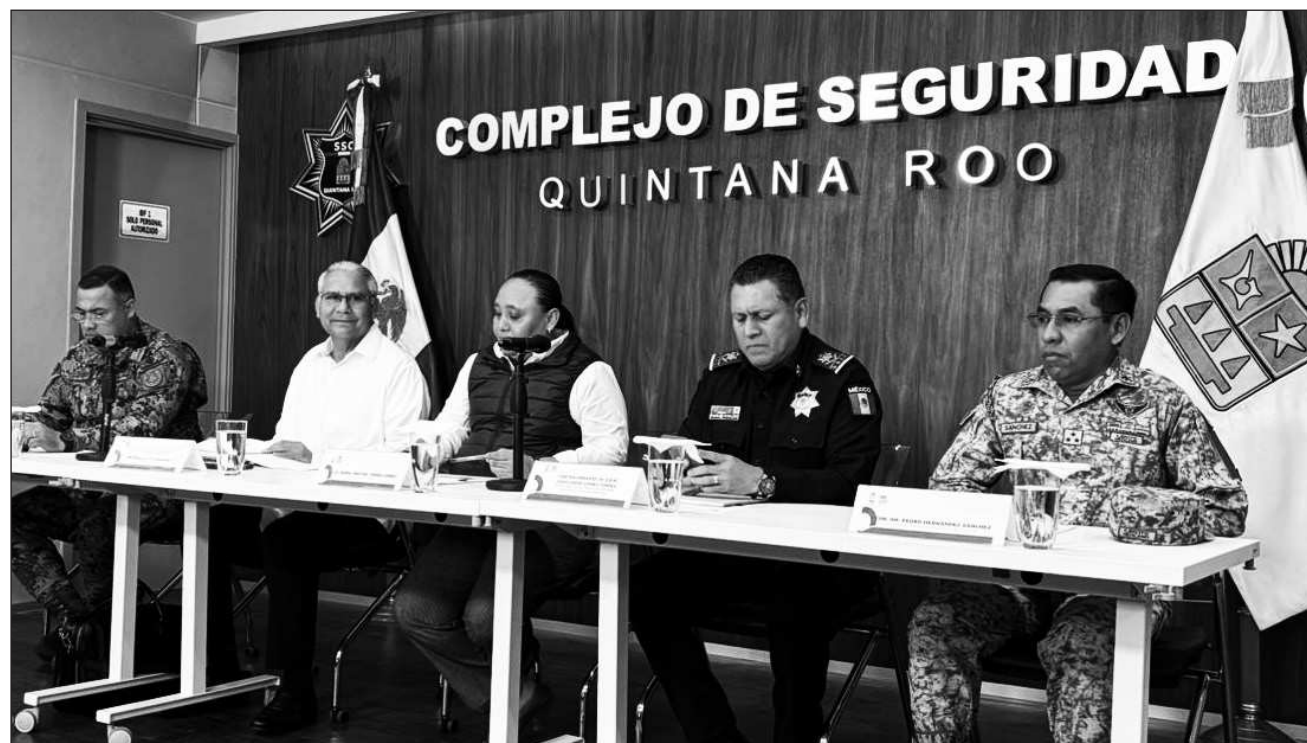
▲ Desde un inmueble de la supermanzana 46 en Cancún, los implicados usurpaban la identidad de empresas turísticas legales para estafar a usuarios, utilizando documentos digitales de apariencia oficial.

“La meta del estado es de más de 65 mil viviendas,