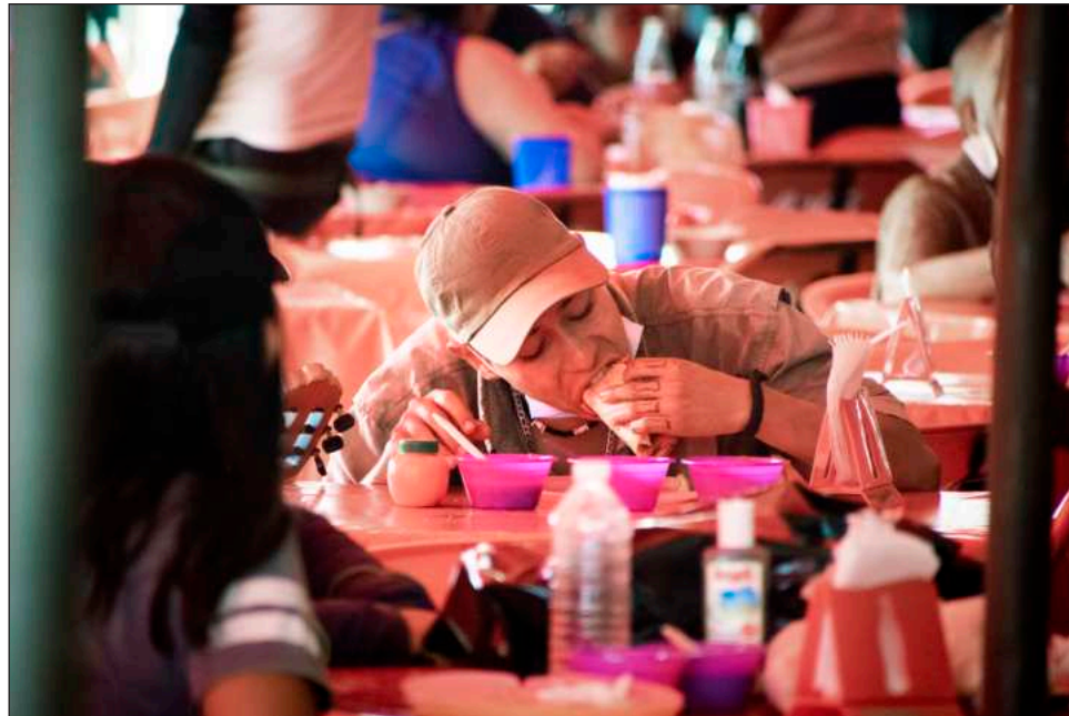
▲ “Predominan los tacos clásicos de taquería, pero una parte significativa de los mexicanos consume versiones como los de guisado y el placer”, señala estudio.

“Lo que evidencian los datos es que el taco se consolidó