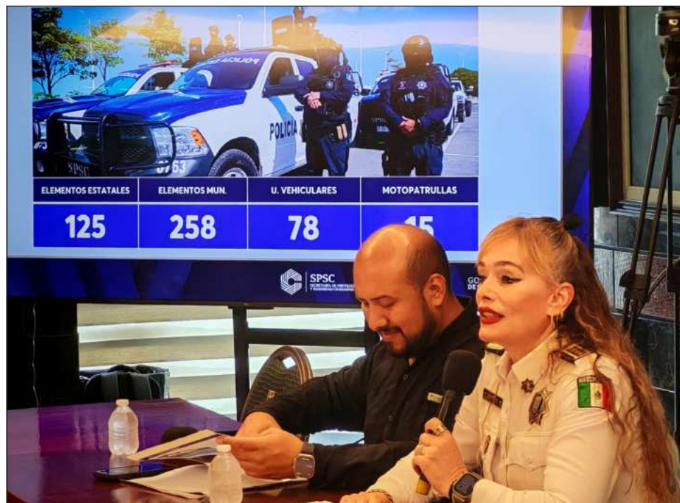
▲ La titular de la Secretaría de Protección y Seguridad Ciudadana destacó que "las estadísticas no mienten, y la entidad se mantiene como una de las ciudades más seguras del país".

En este sentido, recordó que para la seguridad de los ciudadanos, así como también de los policías de Campeche, las BodyCam funcionan adecuadamente como lo han hecho desde su implementación pues ha sido a través de estas que han detectado denuncias falsas contra los agentes, así