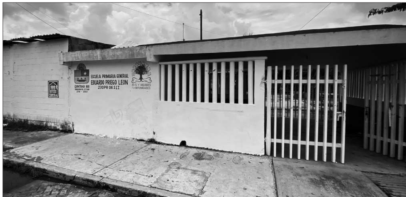
▲ De acuerdo con Xix Euan, “es una alianza con los padres de familia que desde 2024 nos ha dado mucho resultado (...) han jugado un papel muy importante sumando voluntades para que las escuelas estén resguardadas y cuidadas”.

Un total de 468 mil 800 estudiantes de 2 mil 770 planteles educativos en Quintana Roo entraron en receso, mientras autoridades educativas refuerzan estrategias de seguridad, procesos de asignación escolar y protocolos de atención en distintos frentes del sistema educativo.