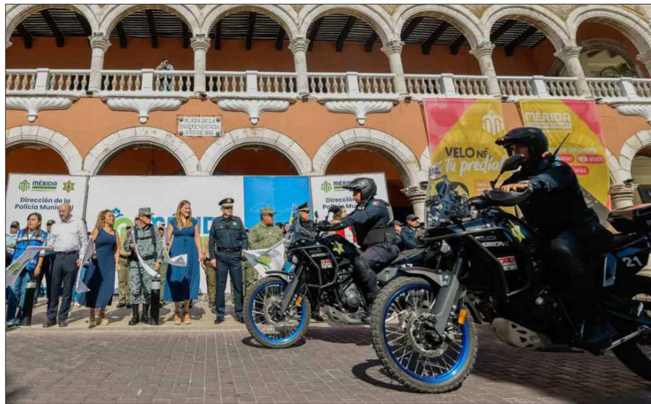
▲ El operativo reforzará la vigilancia en puntos estratégicos, principalmente en el Centro Histórico.

Durante la audiencia inicial, celebrada ante la juez de Control del Segundo Distrito con sede en Kanasín, la FGE imputó el delito y expuso los datos de prueba para solicitar la vinculación a proceso; sin embargo, el encausado solicitó que su situación se