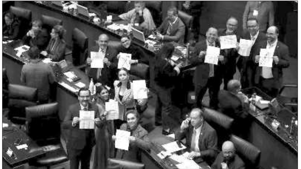
▲ El pleno aprobó por 70 votos a favor de Morena y sus aliados, y 44 en contra de la oposición, el dictamen de idoneidad de la terna que envió el ejecutivo para elegir una nueva ministra de la SCJN, la cual está integrada por Bertha Alcalde, Lenia Batres y María Estela Ríos.

Durante el debate, el senador Germán Martínez, del Grupo Plural, insistió en que la tercera no cumple con los requisitos para ser ministra al ser consejera jurídica de la presidencia, un cargo equivalente a secretaria de Estado. Dijo además que no ha demostrado certeza pues los casos en los que ha liti-