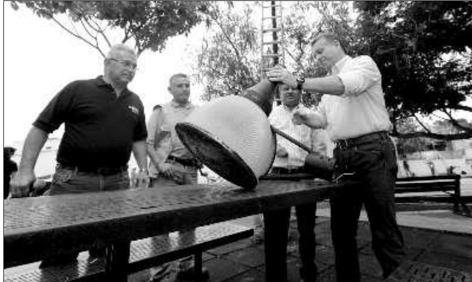
▲ Con la supervisión integral en Los Reyes el ayuntamiento inicia el cambio a luminarias de tipo led en 70 parques, campos deportivos y unidades deportivas del municipio.

“Hay que recordar que el cambio de lámparas de alumbrado público convencionales a led inició al principio de la actual administración municipal, co-