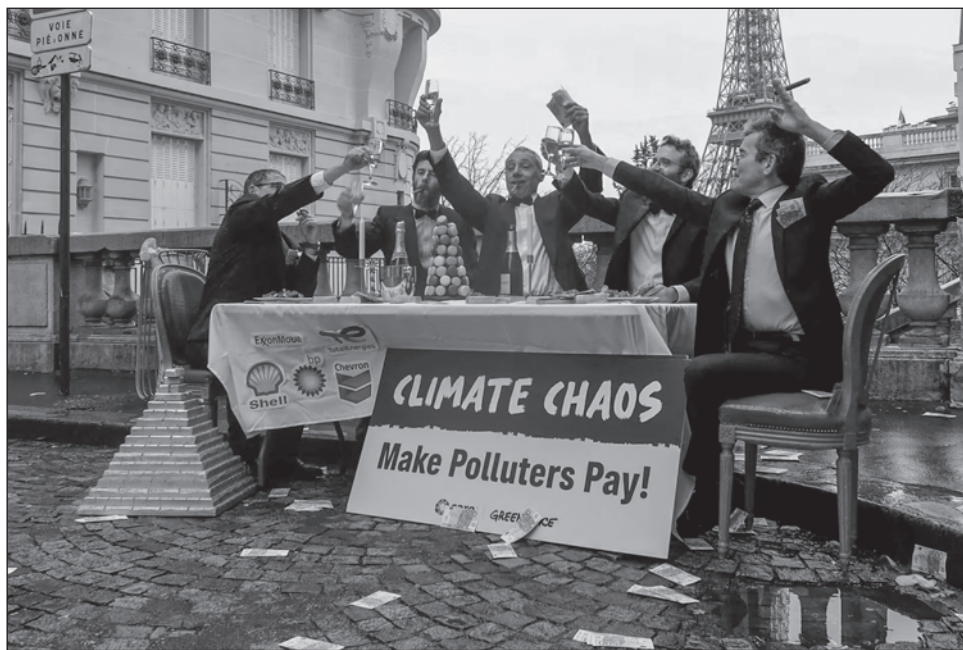
▲ Los numerosos documentos revelados por Centre for Climate Reporting y la BBC contenían menciones de las dos compañías que dirige Sultan Ahmed Al Jaber, Adnoc y la empresa de energías renovables Masdar, las cuales se usaron en reuniones con casi 30 países.

Pero los numerosos documentos revelados el lunes por el grupo de investigación Centre for Climate Reporting y la BBC lo ponen en duda. Los archivos, transmitidos por un "denunciante", son informes destinados a Al Jaber donde aparecían