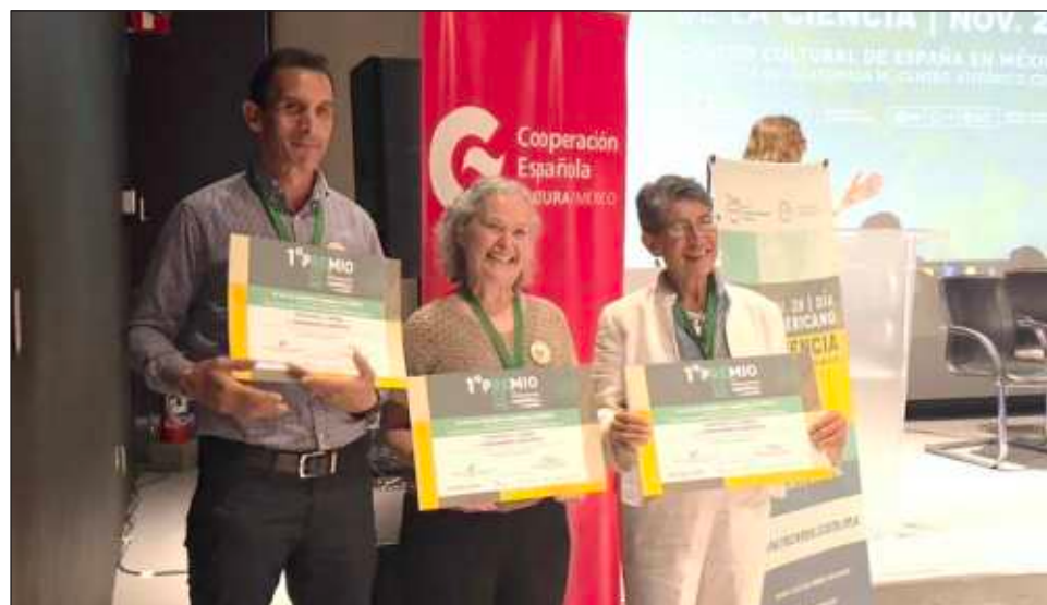
▲ El Pasaporte al camino del conocimiento científico busca la divulgación a nivel nacional, sobre todo en zonas rurales de México. Actualmente atiende a cerca de 7 mil niños, niñas y adolescentes.

Desde el Centro Cultural de España, en la Ciudad de México, la investigadora del Cinvestav Mérida destacó