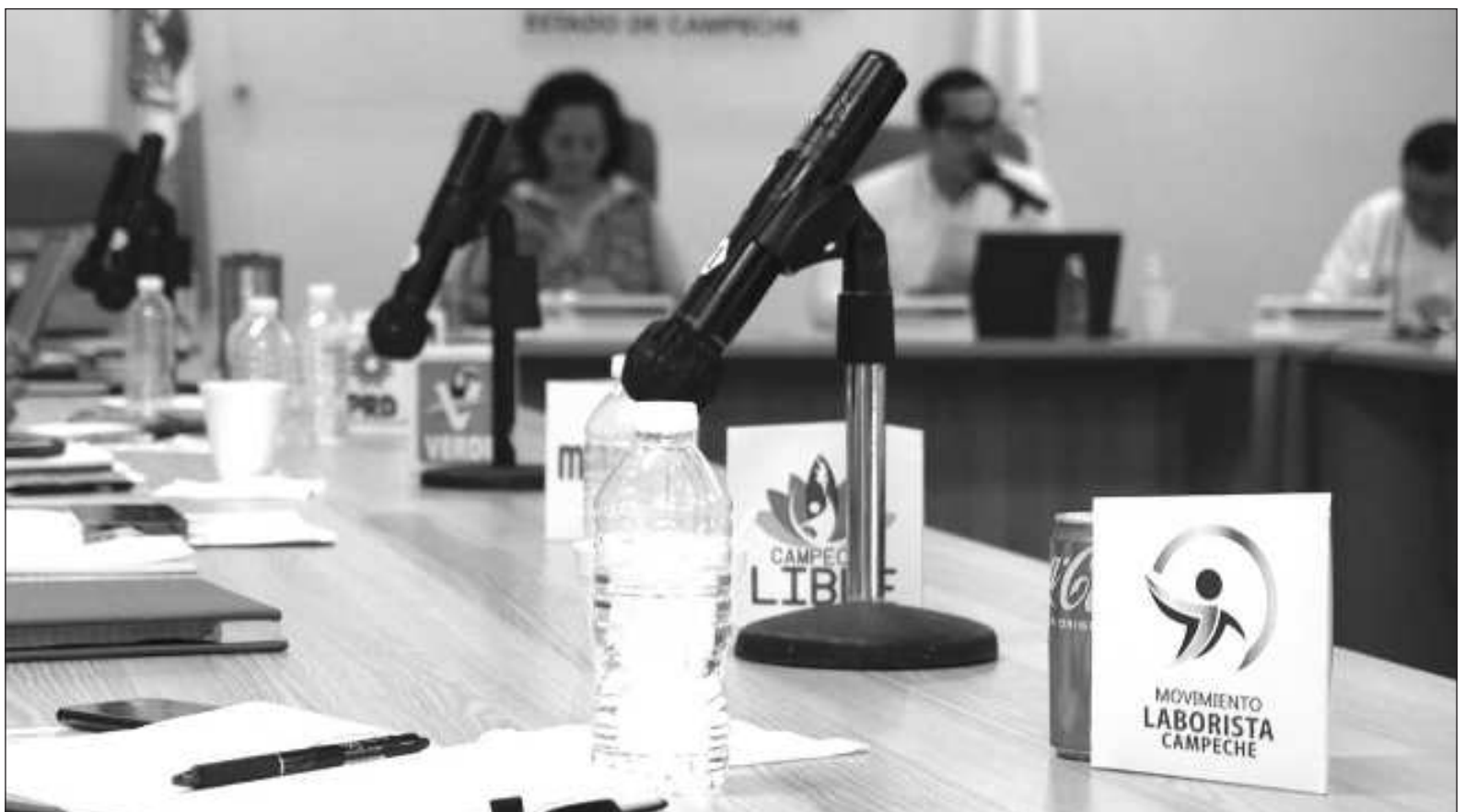
▲ “El chapulineo confunde a los votantes, atropella la meritocracia partidista, es una clara muestra del maquiavelismo imperante –el fin justifica los medios– y denigra la política al evidenciar que no existen ideales ni valores”.