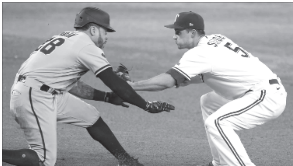
▲ El cascabel Tommy Pham es puesto fuera por Corey Seager, tras una revirada en el segundo juego del clásico. Pham se fue de 4-4, con dos anotadas, en la victoria de Arizona, 9-1.

"Cuando la defensiva juega beisbol limpio: levanta la pelota y la lanza, hace cortes, todas las pequeñas cosas, es difícil que haya una entrada grande", dijo Walker. "Hay muchos auts que se pueden hacer en el transcurso de un juego si te mantienes en posición para permitir que eso suceda".