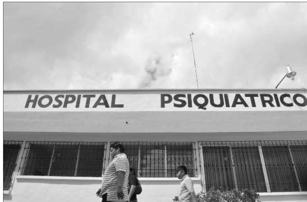
▲ El estado de Yucatán ocupa el tercer lugar a nivel nacional en suicidios entre los 18 y 59 años.

Uno de los temas que ocasiona más ansiedad a los varones, es la estabilidad laboral, pues en ocasiones, de ellos depende el sustento familiar. “La ansiedad es un malestar brutal que incide en la in-