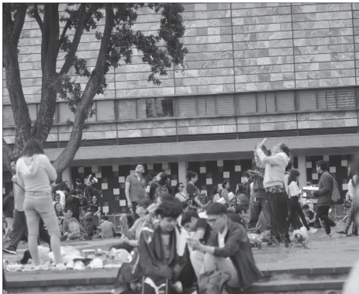
▲ La universidad pública representa el lugar en el que se termina de educar a las grandes mayorías, particularmente, es la llegada al ejercicio pleno de la ciudadanía de los jóvenes.