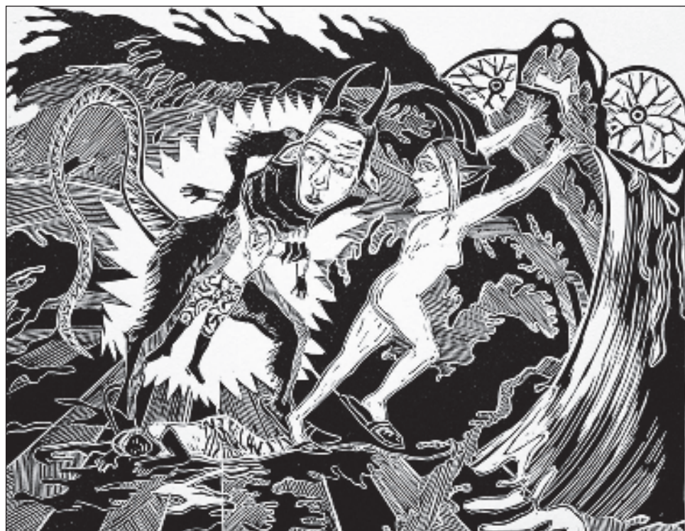
▲ La muestra Cuerpo diverso animal reúne más de 100 obras en diferentes técnicas, recreando ambientes de ficción y fantasía, atípicas, metamórficas y absurdas. Foto crédito

Se trata de una colección de piezas que alude a la diversidad de los cuerpos de todo ser vivo y sus analogías al cuerpo