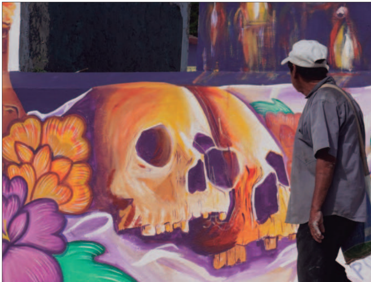
▲ El proceso de limpieza de huesos tiene reglas y está estructurado de la siguiente manera: comienza por los pies y piernas, luego el torso y brazos para finalmente limpiar la cabeza y acomodarla encima de todo.

“Cuando vienen los turistas, parece que los difuntos los están observando”, relata Doña Carmen