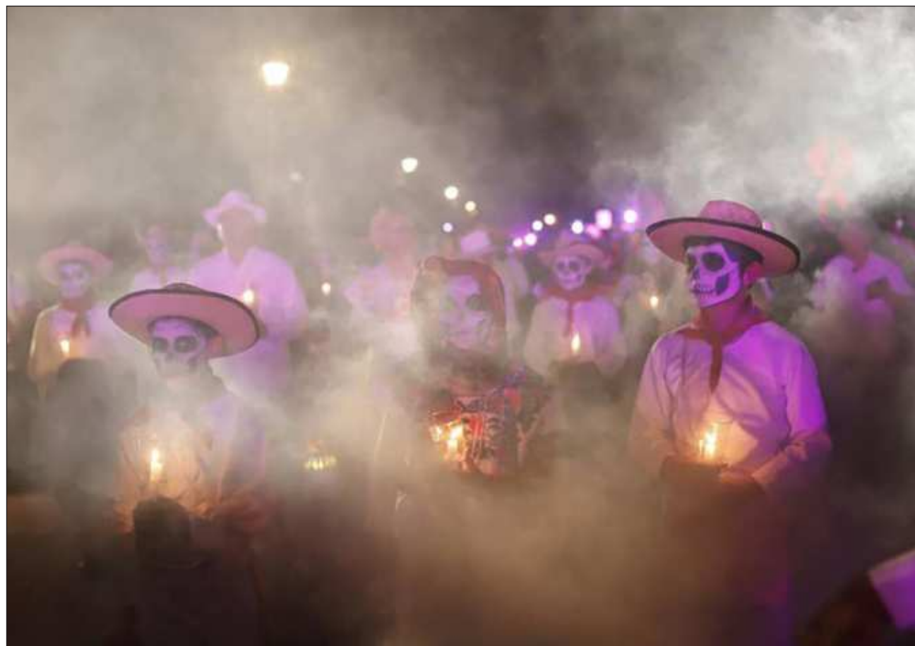
▲ Fotografías llenas de nostalgia, el olor del incienso, el aroma de los pibes, flores de la región, así como la decoración de los altares, hicieron de este Paseo de Ánimas una réplica de cómo se vive el Día de Muertos en Yucatán. Fotos ayuntamiento de Mérida