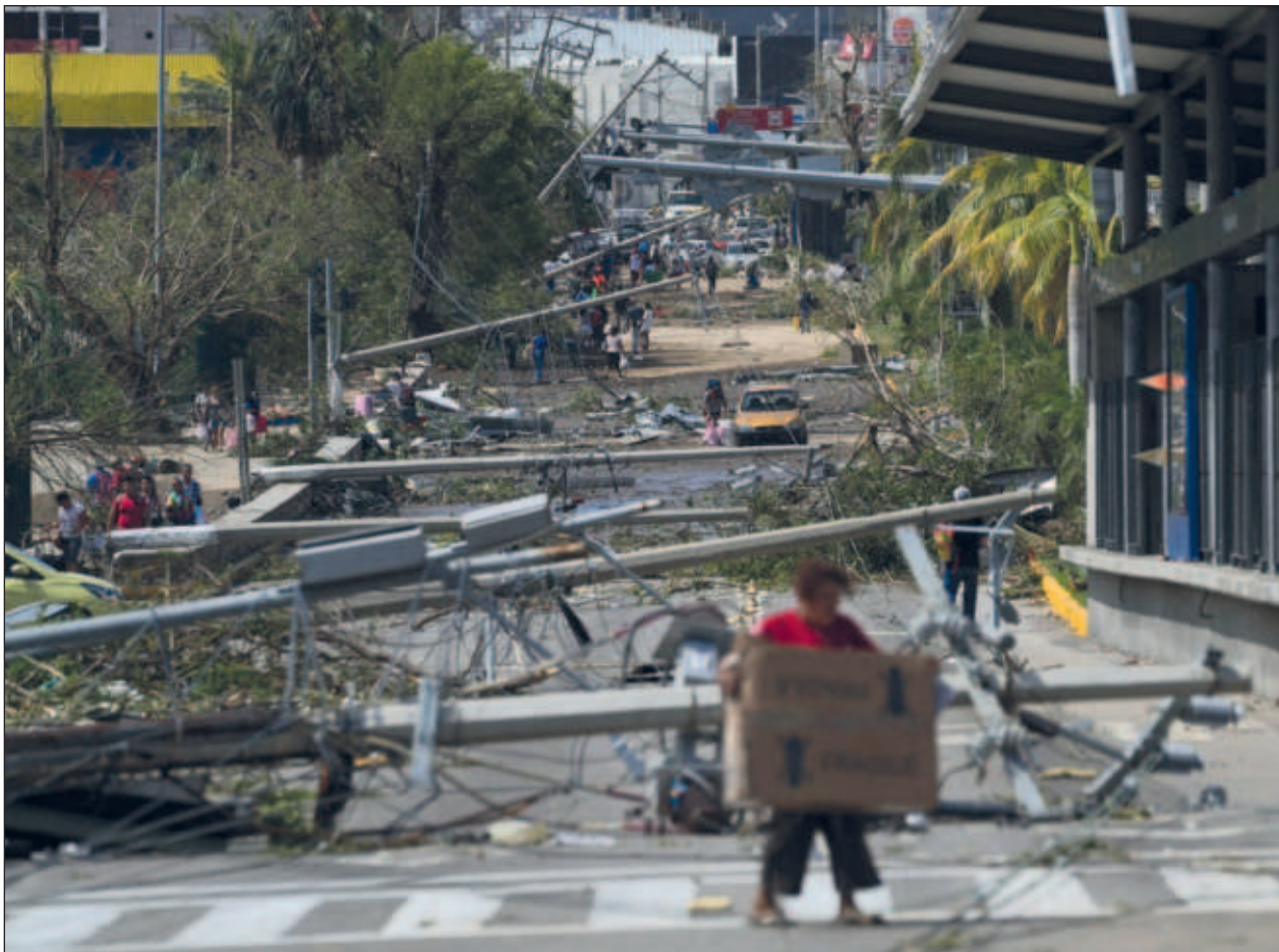
▲ La Comisión Federal de Electricidad informó que 60 por ciento del servicio eléctrico fue restablecido, mientras que de 38 líneas de alta tensión afectadas, 18 se encuentran restablecidas al 100 por ciento y 20 en proceso.

“Agua, alimentos, luz y hielo” para conservar la comida, son las necesidades.