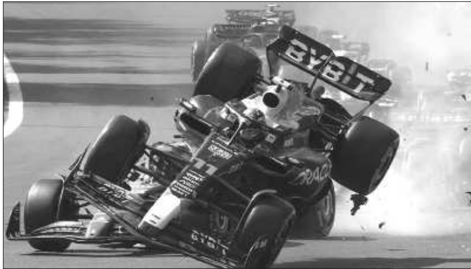
▲ Sergio Pérez (primer plano) estrella su Red Bull contra el Ferrari de Charles Leclerc.

Hamilton fue segundo, seguido de Leclerc.