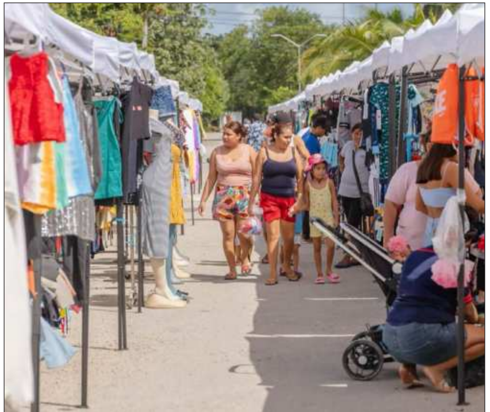
▲ En este tianguis participan 35 comercios que ofrecen diversos productos y servicios los fines de semana en horario de 9 a 18 horas.

Actualmente “están participando 35 comerciantes, mujeres y hombres que están confiando en sus autoridades y que quieren impulsar al municipio de Tulum, con este proyecto de reubicación, donde, además, la presente administración les dio el toldo para que estén establecidos, tienen a seguridad y protección y hasta eventos culturales”, citó el funcionario.