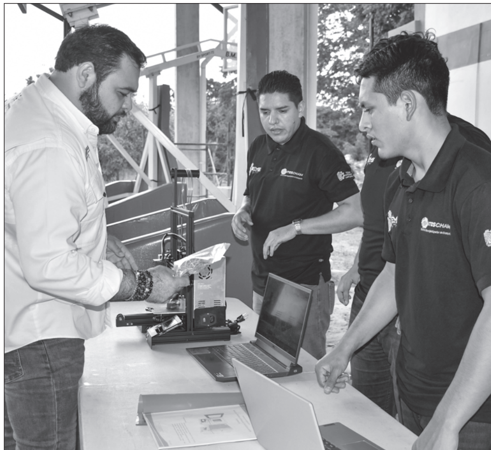
▲ El Itescham consiguió el jueves la acreditación de sus seis ingenierías vigentes como parte del programa de educación de los Tecnológicos Nacionales.

Destacó también que en dos años de estancia, no sólo ha bajado una cantidad histórica de recursos para beneficio de la escuela, sino que también es la primera vez en los 17 años de vida de la institución que se acreditan