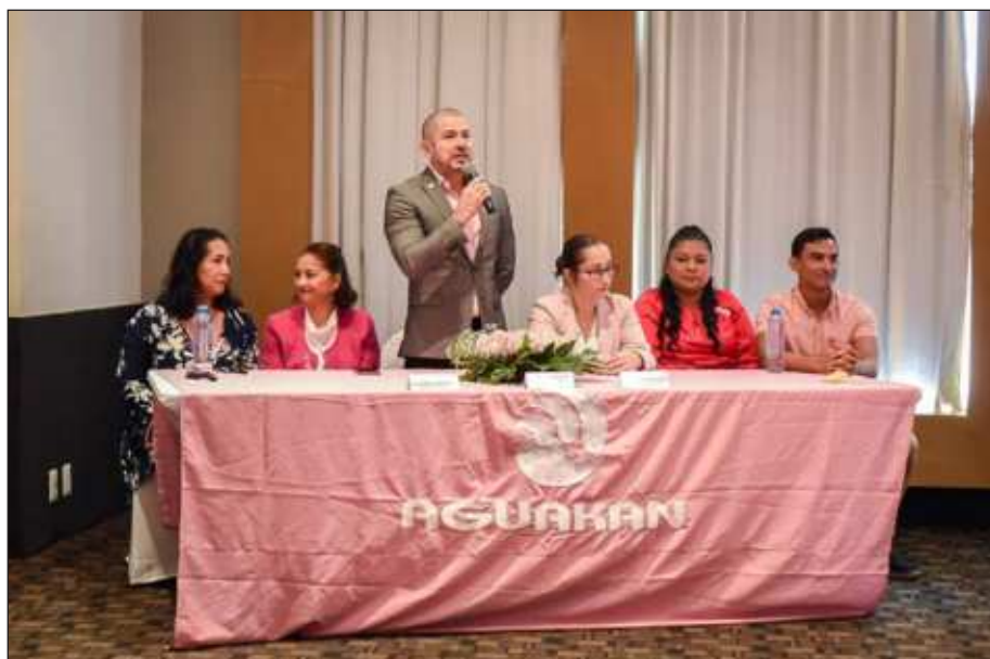
▲ Los asistentes intercambiaron diferentes puntos de vista sobre la importancia de tomar conciencia sobre esta enfermedad y de motivar a las mujeres a realizarse la autoevaluación.

Durante la reunión se abordaron temas sobre el empoderamiento femenino como vía para erradicar todos los posibles obstáculos y tabúes para entender al diagnóstico temprano como una oportunidad y no como una amenaza.