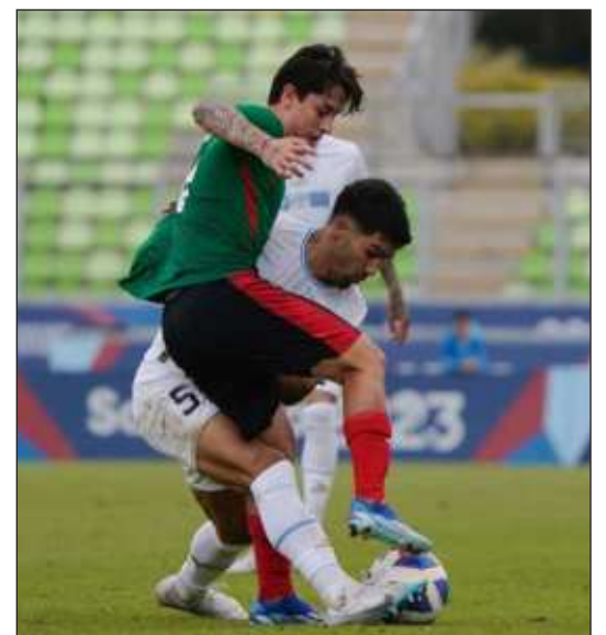
▲ Tu taal u ts'o'okol u keetil u futbolil xiibe', Trie' yaan u báaxal tu táan Brasil úuchik u máan táanil ti' Uruguay, 1-0.