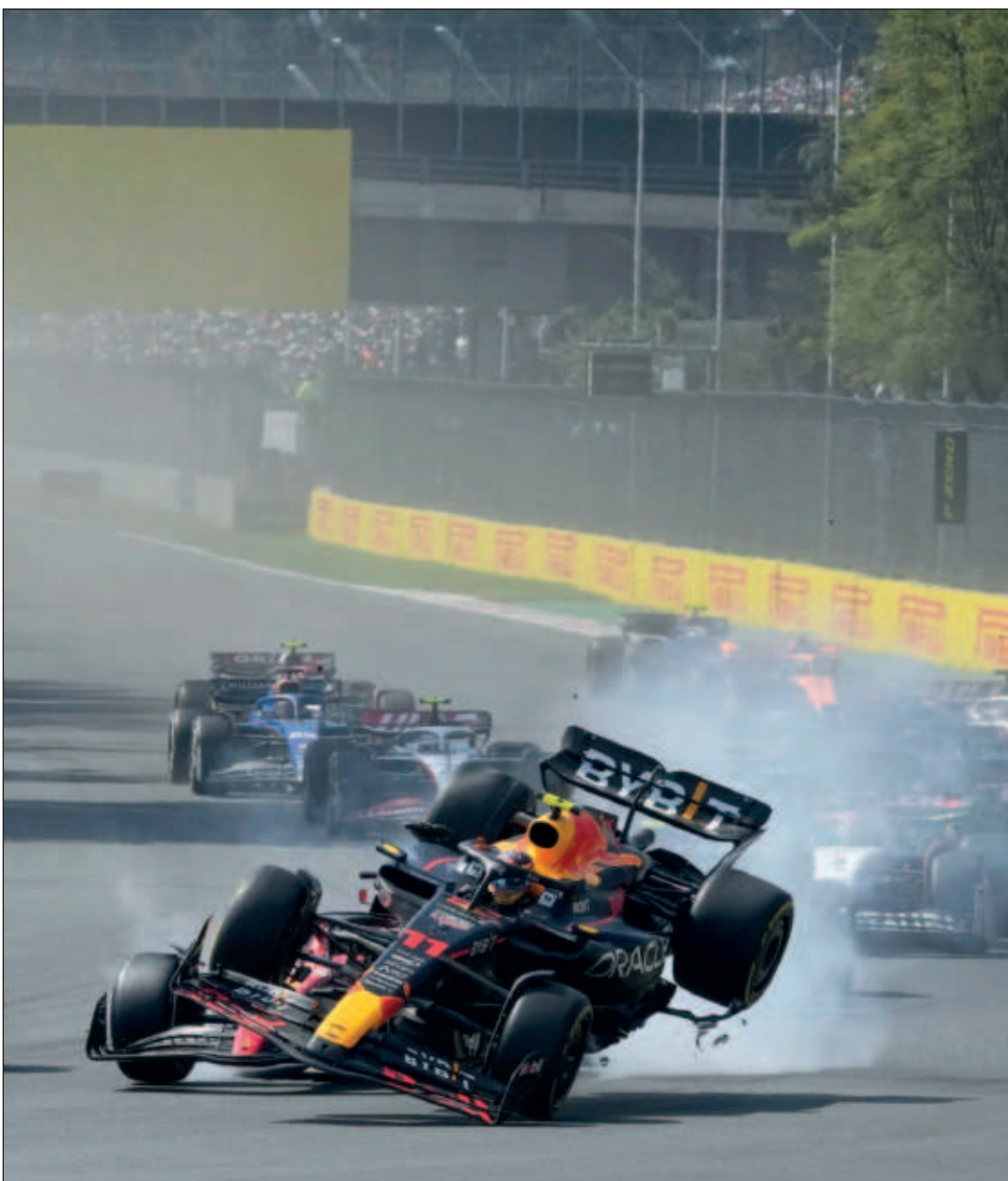
▲ U noj áalkabil GP Méxicoe' náajalta'ab tumen Verstappen; beyaxn tu ka'a yéetel tu yóox kúuchile', jp'áat Hamilton yéetel Charles Leclerc.

Accidente de Checo Pérez lo saca de competencia