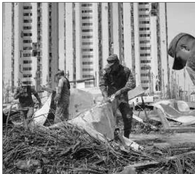
▲ Se ha buscado, por ejemplo, instalar la percepción de que las pérdidas humanas y la destrucción material son resultado de la negligencia de las autoridades.

Se ha buscado, por ejemplo, instalar la percepción de que las pérdidas humanas y la destrucción material son resultado de la negligencia de las autoridades en alertar a la población e implementar un plan de respuesta; cuando todos los expertos han señalado que era imposible prevenir el fortalecimiento de una tormenta tropical hasta convertirse en un huracán de la máxima categoría en apenas 12 horas. Asimismo, se ha machacado con la especie de que los guerrerenses se encuentran en el desamparo debido a que el gobierno federal desapareció el fideicomiso que administraba el Fondo de Desastres Naturales (Fonden). Dicha mentira se enmarca en la campaña permanente de desinformación con que las derechas defienden esos instrumentos financieros, los cuales fueron usados de manera sistemática por los gobernantes anteriores para sustraer colosales cantidades de dinero público del escrutinio social y para enriquecer a la iniciativa privada mediante jugosas comisiones por su manejo. Desafortunadamente, estos bulos son replicados por muchos ciudadanos, pero en esta época de omnipresencia de videocámaras y redes sociales la realidad habla por sí misma: como se observa en las imágenes capturadas por los propios habitantes de la zona afectada, la ayuda llega de forma constante, y en