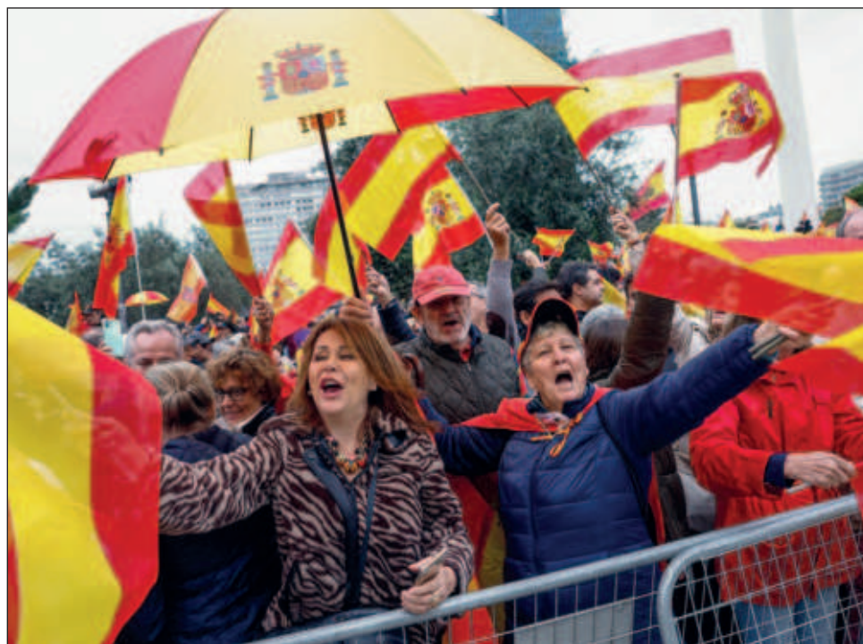
▲ Muchos manifestantes denuncian que el proyecto de amnistía podría beneficiar a Carles Puigdemont, quien encabezó un intento fallido de secesión de Cataluña en 2017.

Esta última formación estuvo detrás de un intento fallido de secesión de Cataluña en 2017, que sumió a España en su peor crisis política en varias décadas, tras el cual su líder Carles Puigdemont huyó a Bélgica para escapar de la justicia.