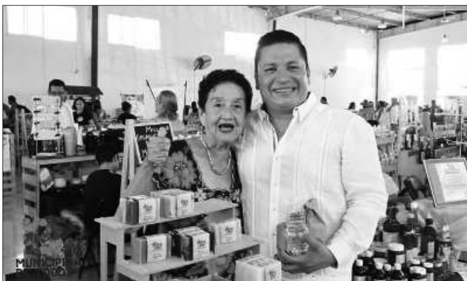
▲ “Hemos logrado acercar y vincular a los productores, con clientes potenciales, que requieren sus productos, permitiendo mejorar de esta manera, los ingresos y el nivel de vida”.