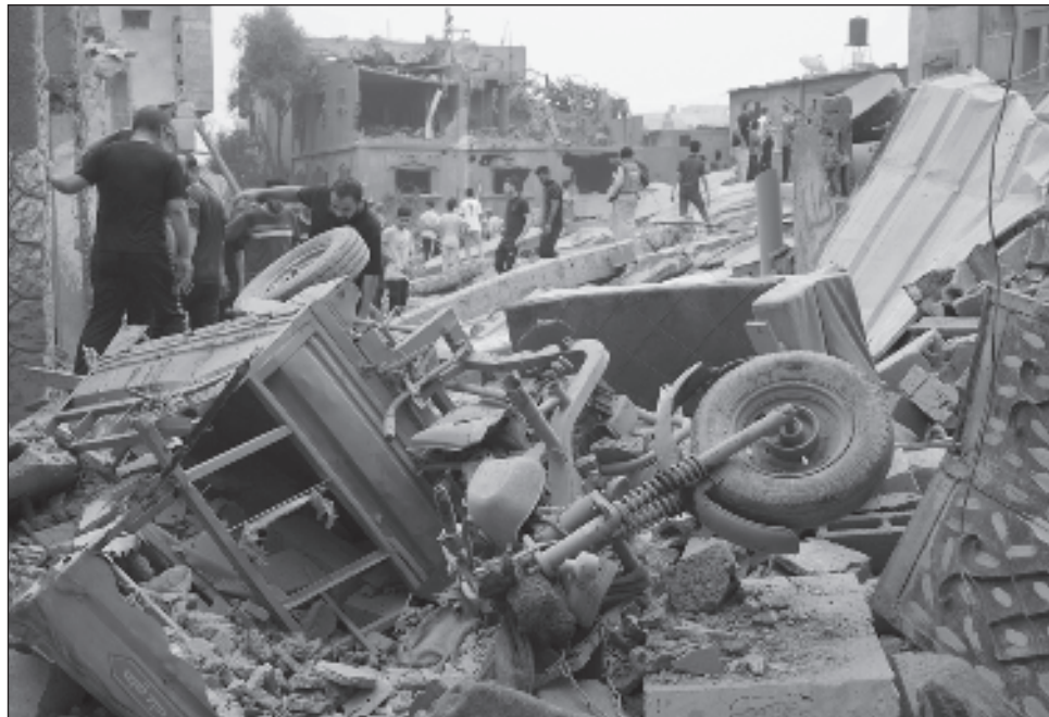
▲ “Tenemos investigaciones activas en curso en relación a los crímenes presuntamente cometidos en Israel el 7 de octubre y también en relación con Gaza y Cisjordania”, anunció el fiscal Khan, que añadió que “este es un momento de objetividad, de reflexión silenciosa”.

“Tenemos investigaciones activas en curso en relación a los crímenes presuntamente cometidos en Israel el 7 de oc-