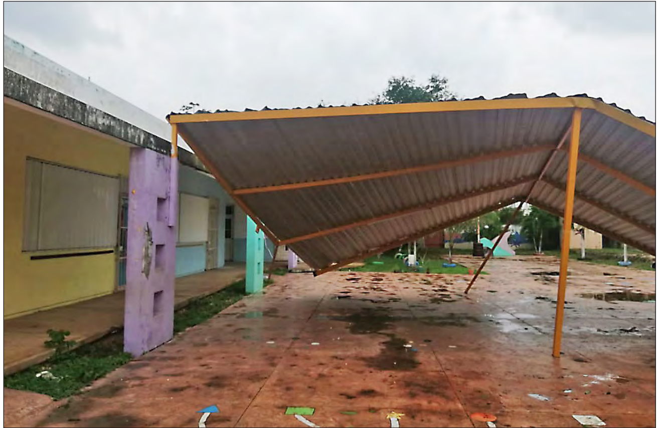
▲ El Instituto de Infraestructura Física Educativa de Quintana Roo realizó la inspección y evaluación de daños, que para presentar los expedientes al gobierno federal.

El gobernador Carlos Joaquín realizó recorridos de supervisión en los que observó muchas escuelas con bardas caídas, árboles sobre aulas y otros daños en infraestructura, por lo que pidió al Instituto de Infraestructura Física Educativa de Quintana Roo (Ifeqroo) la inspección y la evaluación de daños para presentarlos ante la federación a fin de poder acceder a los apoyos del Fondo de Desastres Naturales (Fonden).