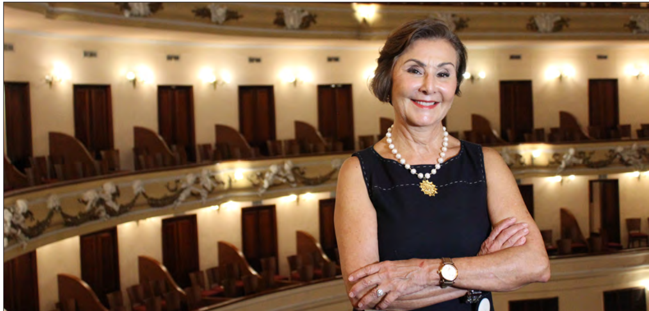
▲ Entre los músicos de la Sinfónica de Yucatán hay varios egresados de la Escuela Superior de Artes (ESAY); hay una generación que no sólo va a crecer con la orquesta, también será parte de ella.

“Existe la creencia que es un grupo de élite; no es cierto, cualquiera puede tener ac-