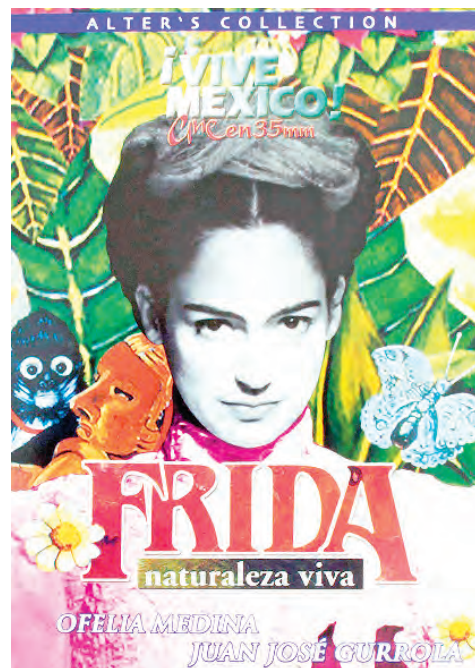
Cartel de Reed. México insurgente, 1970-1971 y Frida: naturaleza viva, 1984.

personalidad y psicología de sus protagonistas. En ellas no existe el arco tradicional de una biografía, sino cuadros breves que avanzan a través de los sentidos y rara vez llegan al puerto esperado: ni en Reed vemos batallas ni en Frida a una pintora frente al lienzo; conocemos en cambio a dos seres retirados en la intimidad, cuyo destino se decide en esos tiempos muertos en los que no hay descargas de balas ni de pinceles.