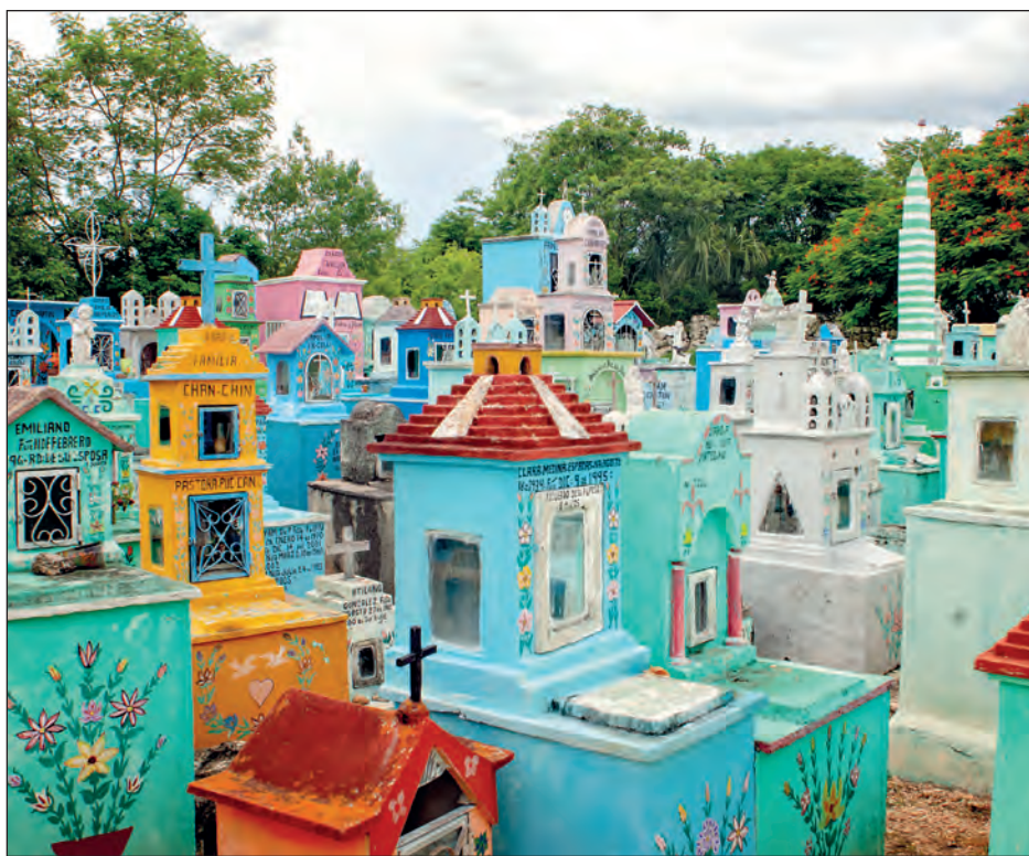
Las cenizas del ser querido van dentro de la urna, que contiene una biocápsula de germinación; ésta asegura que cualquier semilla que se coloque en su interior, germine.