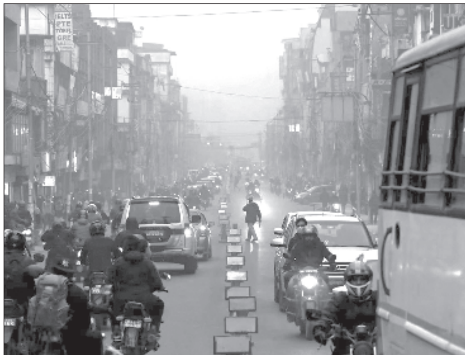
▲ La amenaza es peor en el sur del Asia, su epicentro mundial: Bangladés, India, Nepal y Pakistán son, en ese orden, los cuatro países más contaminados.

Si el mundo redujera de forma permanente estos contaminantes hasta alcanzar el límite fijado por la Organización Mundial