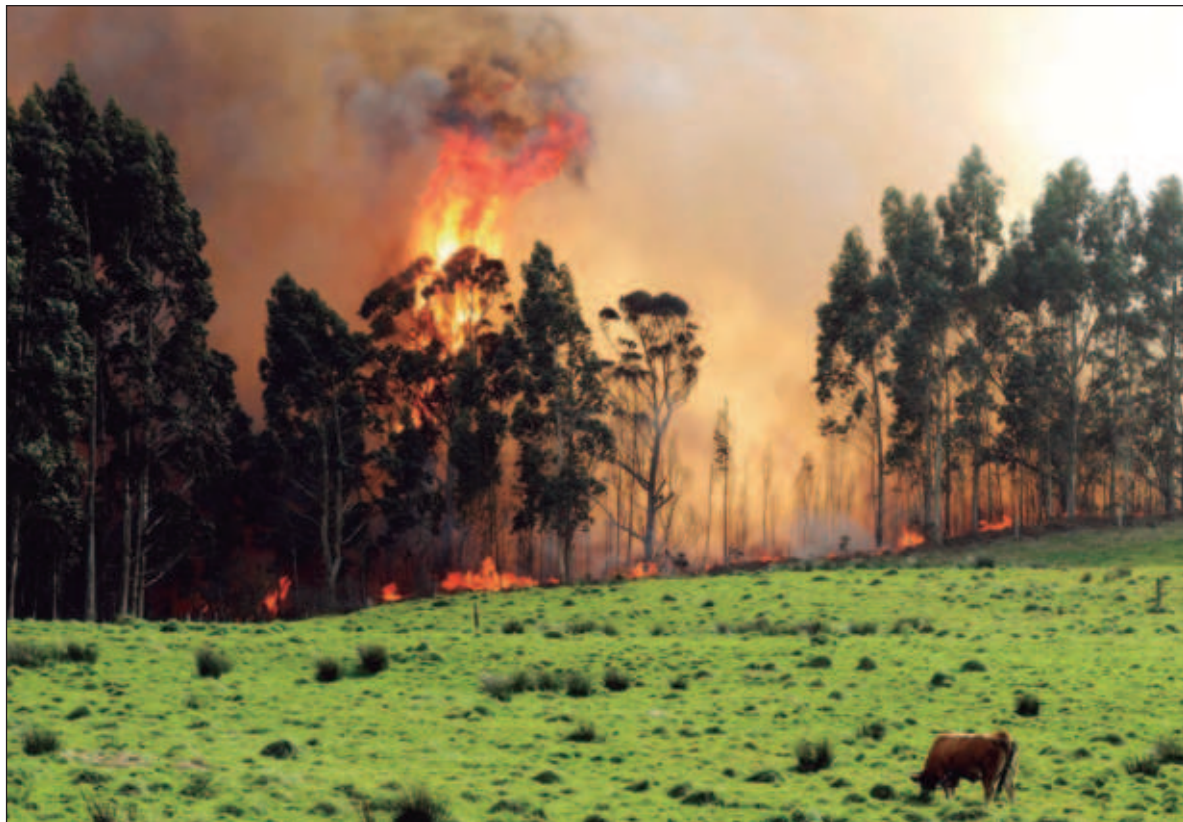
▲ “Ahí está el esfuerzo dedicado desde hace décadas a la reforestación de los bosques asturianos con eucaliptos, una especie de origen australiano (...) que secreta aceites que impiden la germinación de semillas locales”.

Habrà que ver entonces lo que hay detrás de las treinta mil y tantas hectáreas, y aquí hay mares enteros de especulación que explorar. Ahí está el esfuerzo dedicado desde hace décadas a la reforestación de los bosques asturianos con eucaliptos, una especie de origen australiano que conocemos por alelopática (esto es, que secreta al entorno aceites esenciales que impiden la germinación de las semillas de muchas especies locales), mala para retener y generar suelo, y gran demandante de agua, con una medara que cualquier minero seba – y mire usted que en Asturias hay, o hubo mineros – sirve para poca cosa más que para obte-