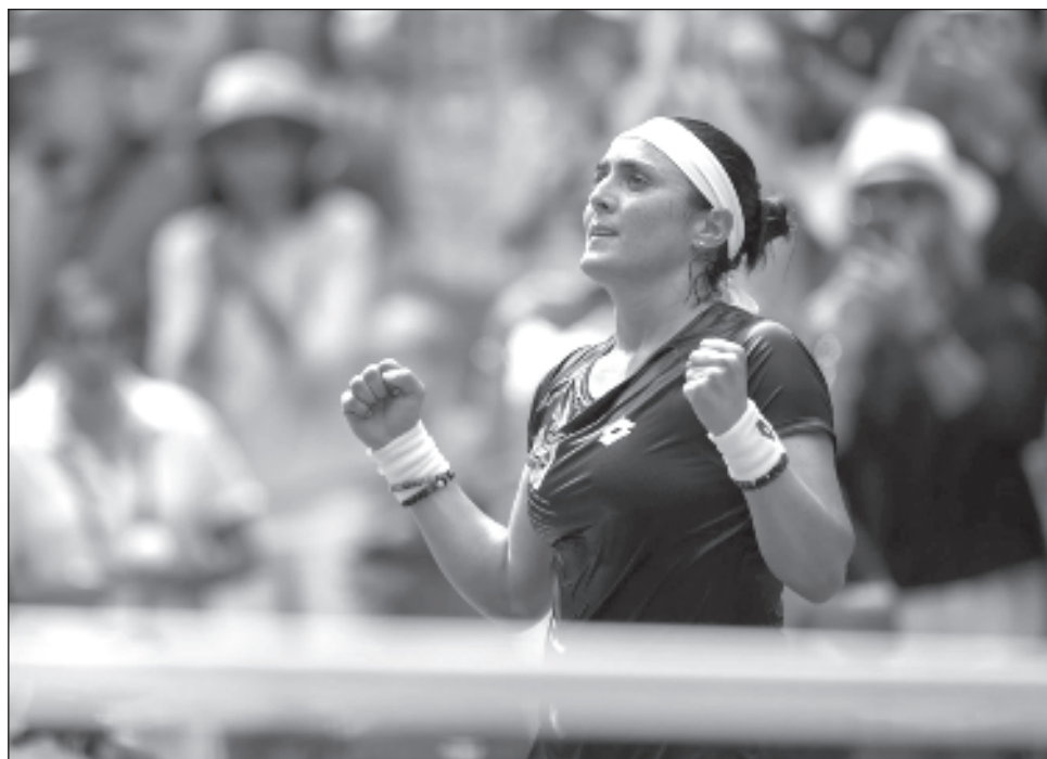
▲ Ons Jabeur reacciona tras vencer a Camila Osorio, en el Abierto de Estados Unidos.

Hace poco más de un mes, Alcaraz venció a Djokovic para consagrarse campeón de Wimbledon. El español se desquitó de una derrota ante Djokovic en las semifinales de Roland Ga-