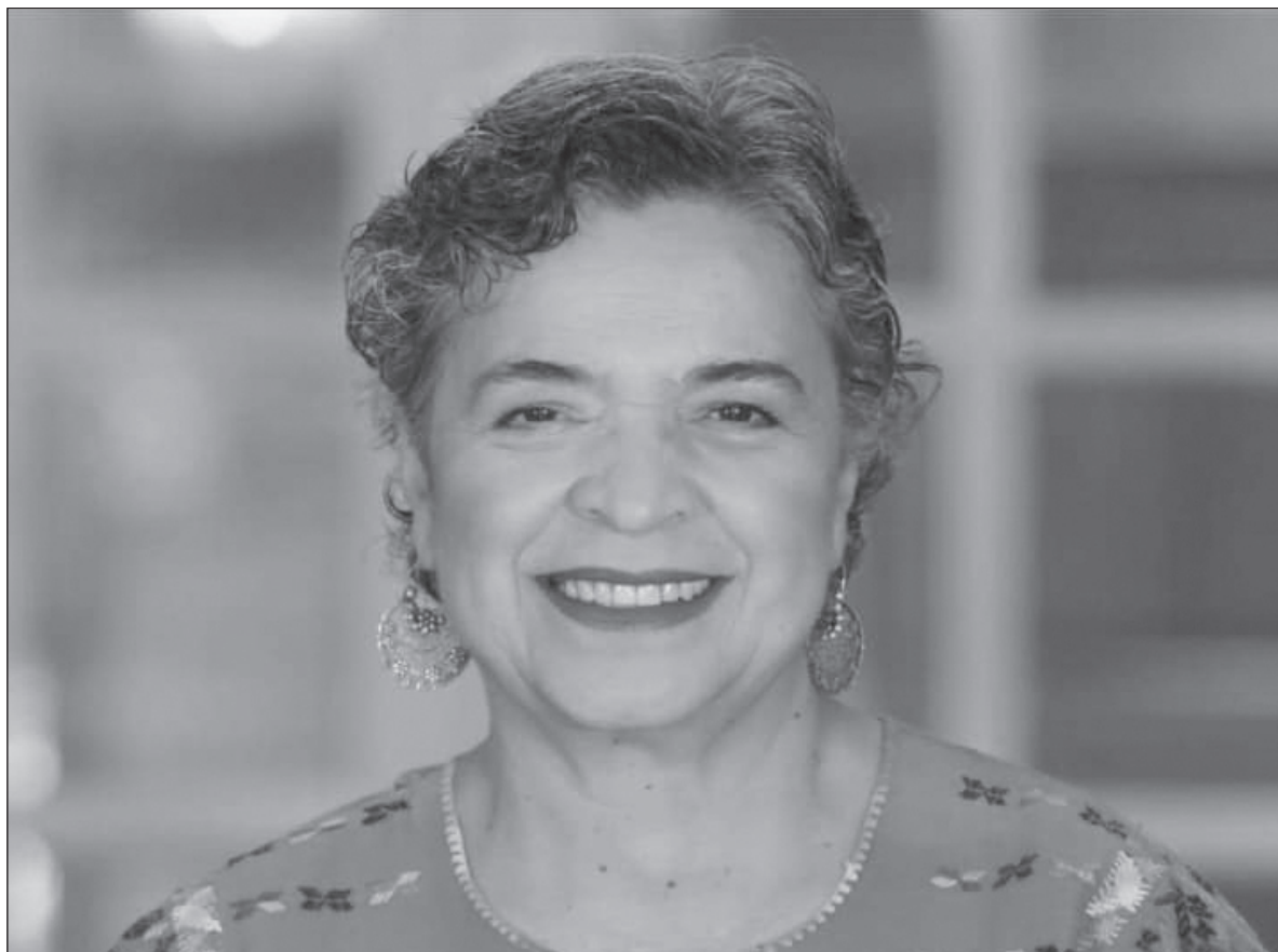
▲ “En particular resalta que Beatriz Paredes haya podido situarse casi a la par de Xóchitl en encuestas (...) Vaya ironía: la representante del partido electoralmente más repudiado casi habría empatado a la ‘revelación’ del año”.

YA A ESTAS ALTURAS, la construcción de la candidatura de Xóchitl implica una fila de adversarios internos caídos en aras de blindar un triunfo predeterminado: el panismo empujó a Santiago Creel a declinar, para no dividir el voto blanquiazul; el PRD, al que ni siquiera dejaron contar con aspirantes (Silvano Aureoles y Miguel Ángel Mancera), acabó decantándose abiertamente por