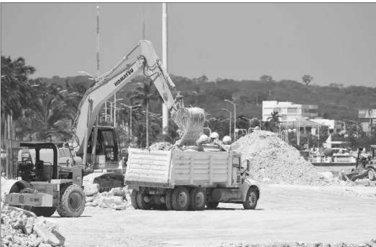
▲ Los transportistas piden la implementación de medidas que garanticen su seguridad, atención a las denuncias sobre abusos y extorsiones de policías, así como emplacamiento para vehículos de carga y turismo.

La marcha que anunciaron será parte de un movimiento nacional anti libros de texto gratuitos y en Cancún será en el centro de la ciudad, en las inmediaciones del parque Las Palapas y el municipio, el próximo sábado 2 de septiembre, a las 16:30 horas.