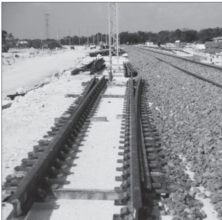
▲ "El corredor ferroviario de casi mil 600 km tiene el potencial de reconfigurar la dinámica socioeconómica y territorial de la península".

En el primer ámbito, de 2019 a la fecha se han construido más