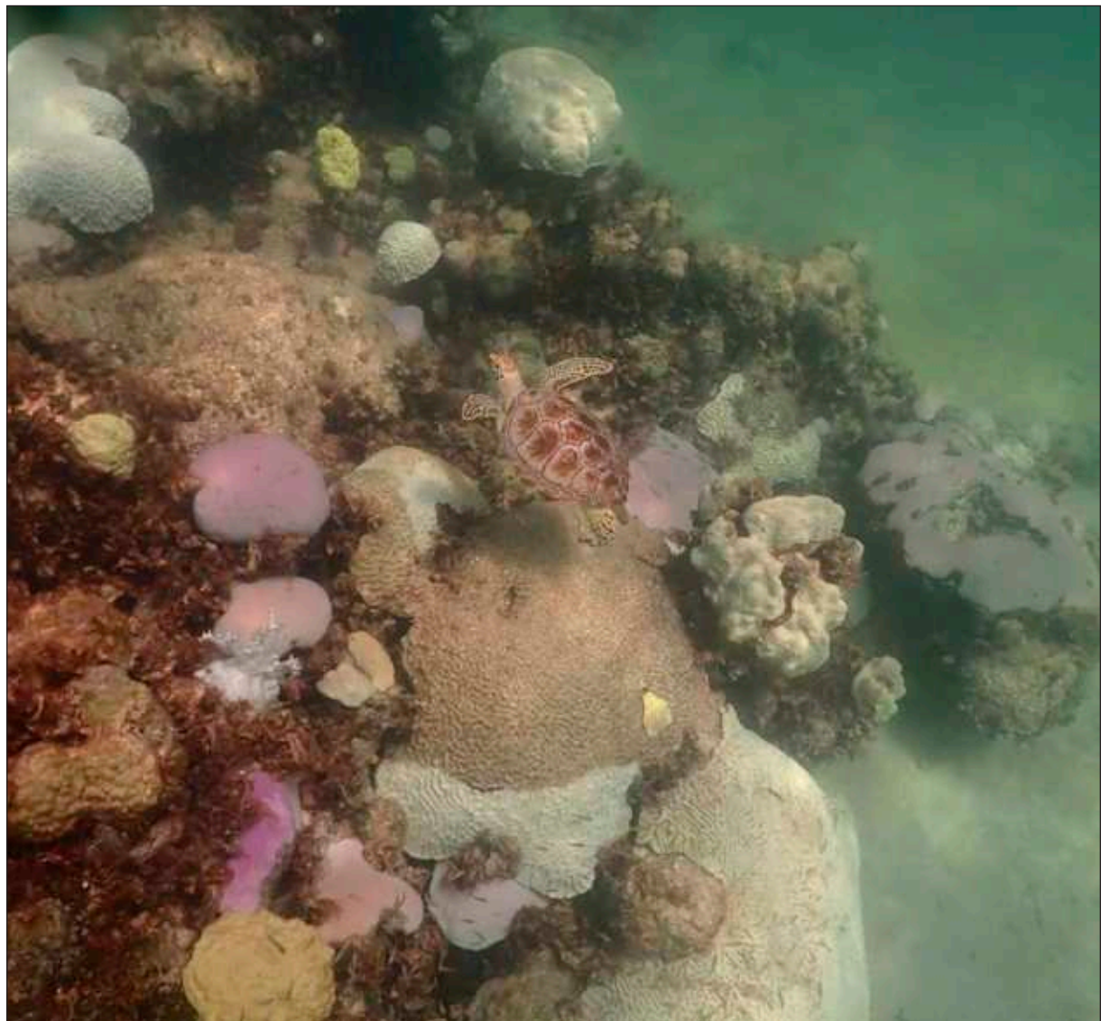
▲ Te'ela' ku chíikpajal bix ts'ook u k'as saktal jump'él koral. Oochel Ap

Kex tumen ma' óofisyaal rejíistros beta'an yóok'olal u chokolil ja'e', tu ja'abil 2020e' beeta'ab jump'él xaak'al tu'ux ts'íibta'abe' u ja'il Kuwaite' k'uch tak 99.7 gradóos (37.6 Celsius) tu winalil julio ti' u ja'abil 2020, te'e k'inake' leti'e' asab chokoj ja'il ojeelta'ab yanchaj ichil tuláakal yóok'ol kaab.