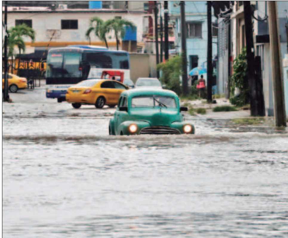
▲ Idalia también azotó Cuba con lluvias torrenciales lunes y martes, causando inundaciones en Pinar del Río, donde más de 60% de los habitantes se quedaron sin electricidad.

Idalia se fortaleció la tarde del martes a huracán de categoría 2, con vientos de 155 kilómetros por hora. Se pronosticaba que el huracán toque tierra firme el miércoles temprano como un ciclón de categoría 3 con vientos sostenidos de hasta 193 km/h