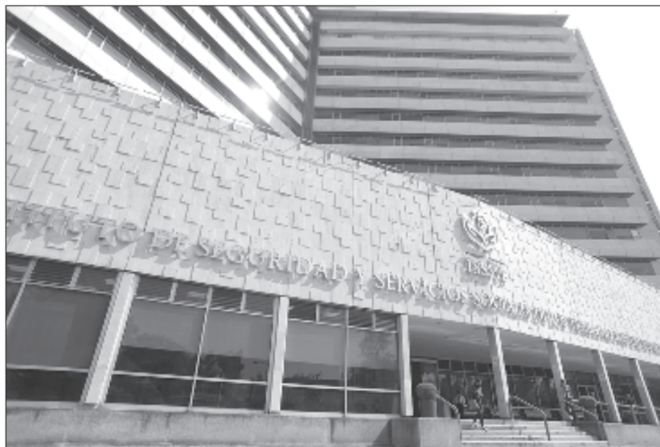
▲ El tipo de contratos fue dejando al instituto sin capacidad ni autonomía para brindar una correcta atención a derechohabientes y redujo su operatividad al mínimo.

La funcionaria federal, designada por el presidente Andrés Manuel López Obrador como cabeza del grupo encargado del rescate del ISSSTE, explicó que este tipo de contratos fue dejando al instituto público sin capacidad ni autonomía para brindar una correcta atención a los derechohabientes y redujo su operatividad al mínimo.