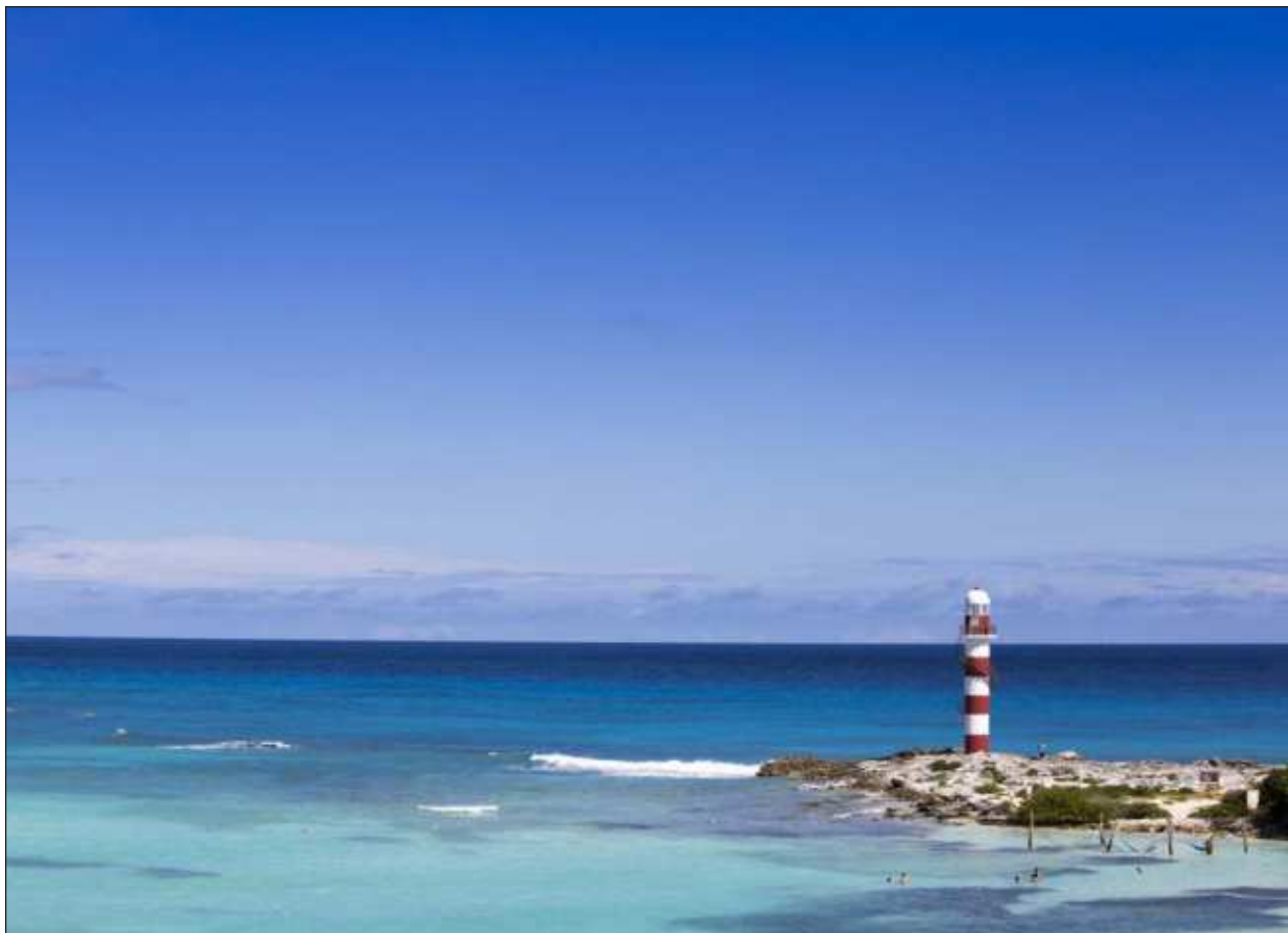
▲ El secretario de Turismo recalzó que estos reconocimientos son un testimonio del esfuerzo, pasión y dedicación de los prestadores de servicios turísticos, hoteleros, restauranteros, entre otros.

Dijo desconocer el número total de ferias en las que estarán participando, pero tan sólo en una reunión que sostuvo con líderes hoteleros este lunes en Cancún les mostró un calendario lleno.