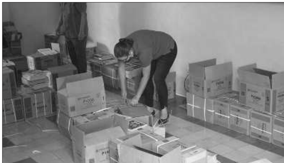
▲ La Seduc dejó en claro que los centros educativos en los que se entregó el material previo a la notificación jurídica se podrá trabajar de manera normal pese al amparo, ya que el ordenamiento es para la distribución de la Secretaría a las escuelas, no en contra del uso de los libros.

Destacaron que seguirán ingresando firmas en los días siguientes, pues con el ingreso de la solicitud de amparo el pasado viernes, padres de familia de todos los municipios han mostrado interés en sumarse a los amparos pues les notificaron durante el día que este martes harían las entregas de los libros en las diversas escuelas