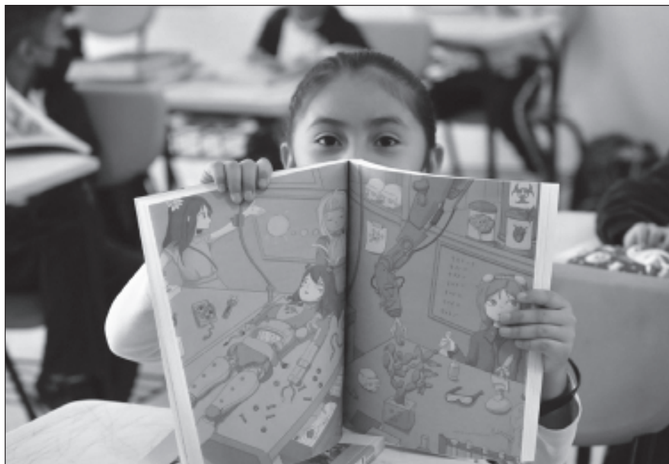
▲ Andrés Manuel López Obrador, en su conferencia de prensa, agradeció a las autoridades, maestros y padres de familia "porque se entregaron los libros, o están en las escuelas ya distribuyéndose los libros en 30 estados, sólo dos no entregaron".

Agradeció a los gobernadores que ayudaron para que se realizara el reparto, y en el caso de los estados donde los gobiernos estatales anunciarán que entregarán cuadernillos complementarios, vio la medida como buena, ya que los mismos profesores lo recomiendan. "Que se tengan los libros de texto es muy