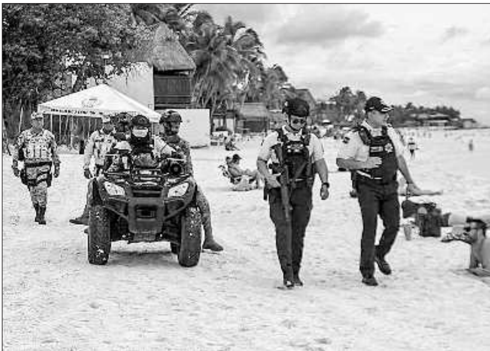
▲ La Policía Preventiva atendió los reportes de auxilio y reforzó la vigilancia.

Por su parte, el GEAIVIG y la Dirección de Participación Ciudadana y Cultura de Paz reforzaron los diversos sectores con presencia pedestre y en cuatrimotos en plazas, zonas comerciales y bancos, para evitar robos y extorsiones, así como dar atención pronta y oportuna a la población, mientras que la Dirección de Tránsito Municipal desplegó un operativo especial de control vial y concientización en diversos puntos de la ciudad, principalmente en la Avenida 10.