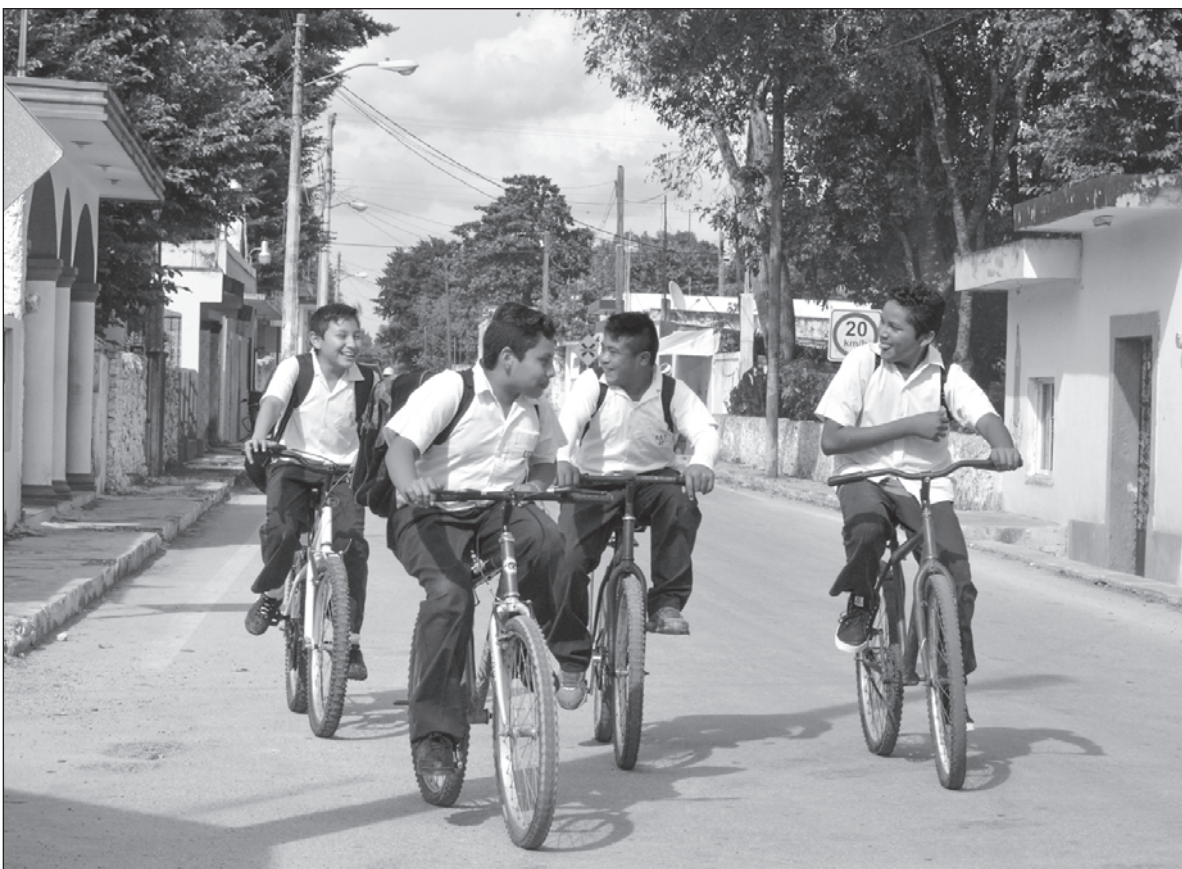
▲ "El 'knockout challenge' es sólo una más de un catálogo de estupideces que se multiplica como epidemia".

TikTok, en un caso extremo, es una academia de ocurrencias, un instituto de ociosidades