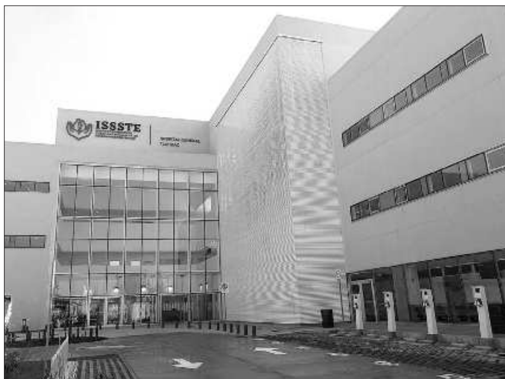
▲ Cuando se mantienen mañás como el cobro de diezmos o el retraso en el pago a proveedores es señal de que la corrupción no se ha erradicado y que la lucha contra esa hidra requerirá de más de un San Jorge.

Que las finanzas del ISSSTE se hayan saneado y de adeudar más de 20 mil millones de pesos y ahora se pueda invertir en bienes muebles y equipamiento es beneficioso para los trabajadores del Estado, pero cuando se mantienen mañás como el cobro de diezmos o el retraso en el pago a proveedores es señal de que la corrupción no se ha erradicado y que la lucha contra esa hidra requerirá de más de un San Jorge.