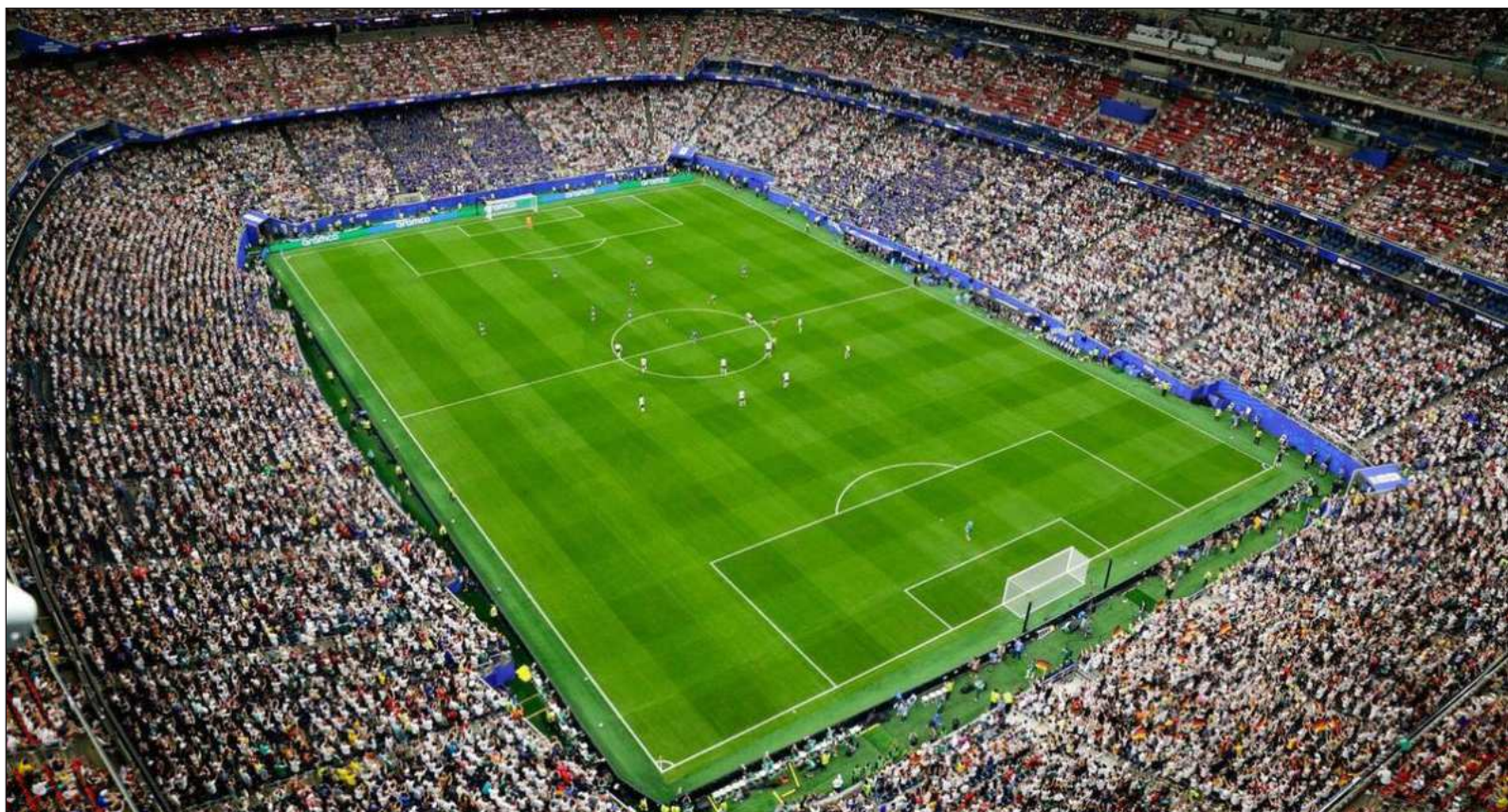
▲ "La FIFA obtendrá entre 8 mil y 10 mil millones de dólares en ingresos, lo que la convertirá en el evento deportivo más rentable de la historia, superando a Qatar 2022".