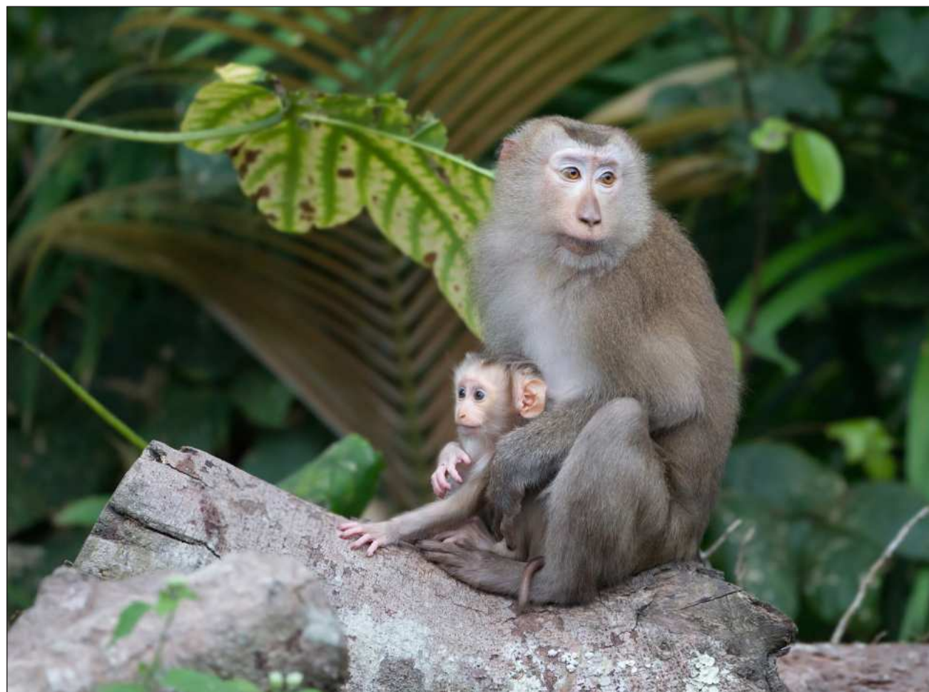
▲ Algunas especies han compensado las dificultades obstétricas con adaptaciones como la posición de la cabeza fetal, la relajación de los ligamentos pélvicos y la flexibilidad de la cabeza del recién nacido.

El nuevo estudio analizó el encaje cefalopélvico (re-