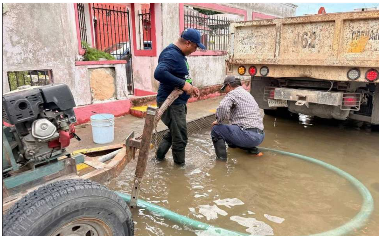
▲ La presidenta municipal Cecilia Patrón Laviada sostuvo que el ayuntamiento reforzará las acciones para reducir las inundaciones que afectan, principalmente, al poniente de la ciudad, trabajando “de la mano con la naturaleza”.

La alcaldesa adelantó, además, proyectos específicos para atender puntos críticos como Plaza Las Américas, donde se construirá un nuevo macroaljibe y se reforzará la supervisión para que plazas comerciales y negocios cumplan con las normas de manejo de aguas pluviales.