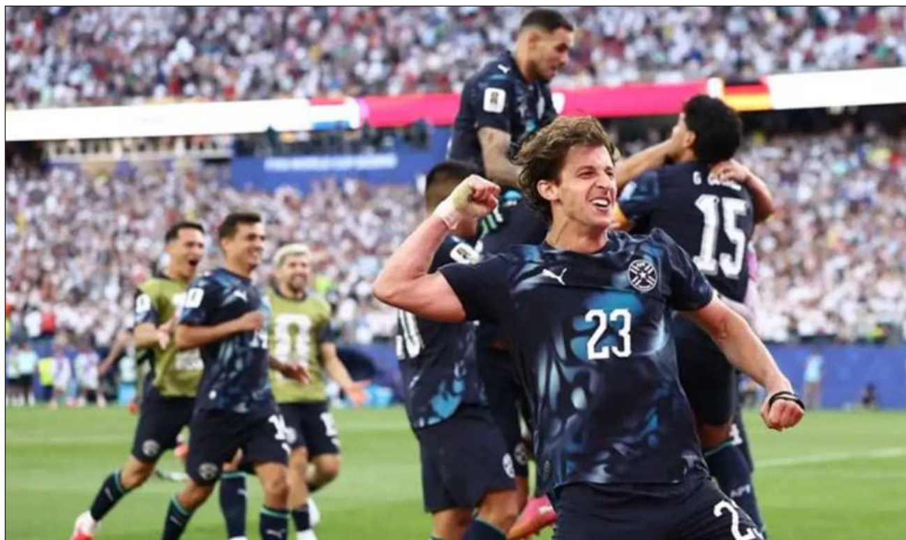
▲ El conjunto guaraní decidió afianzarse en el estilo de juego que por décadas le ha permitido competir en las eliminatorias sudamericanas y estableció un férreo muro defensivo que la tetracampeona del mundo no pudo superar.

La Albirroja decidió afianzarse en el estilo de juego que por décadas le ha permitido competir en las eliminatorias sudamericanas y estableció un férreo muro defensivo, que una Alemania