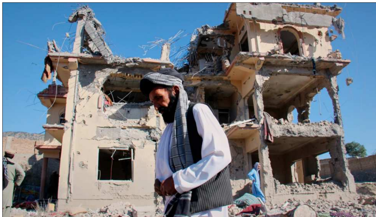
▲ Testigos denunciaron que el Ejército paquistaní realizó segundos ataques letales cuando vecinos intentaban rescatar heridos.

“El domingo por la noche, hacia las 23:30 hora local, un ataque aéreo en el distrito de Chamkani, provincia de Paktya, causó la muerte de al menos 22 civiles y heridas a otros 47. Aproximadamente al mismo tiempo, otro ataque aéreo en el distrito de Gyan, provincia de Paktika, mató a seis civiles; un tercer ataque aéreo, en el distrito de Marawara, provincia de Kunar, hirió a dos niños (...) un tercer ataque aéreo, en el distrito de Marawara, provincia de Kunar, hirió a dos niños”, dijo