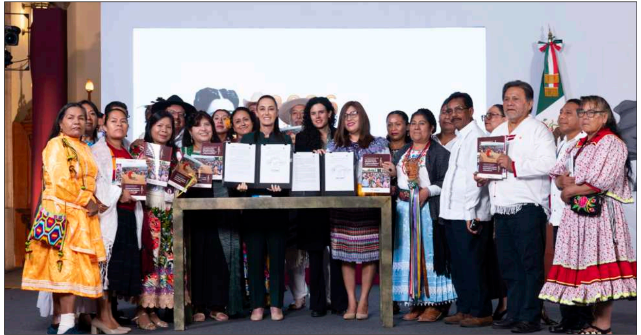
▲ Sheinbaum subrayó que los pueblos indígenas conforman uno de los pilares de la identidad nacional que están reconocidos en la Constitución, pero con esta ley se busca establecer mecanismos específicos para garantizar su cumplimiento.

El gobierno federal iniciará, del 1 de julio al 6 de agosto, un proceso de consulta dirigido a los pueblos indígenas y afroamericanos para la elaboración de la nueva Ley General de Derechos de los Pueblos Indígenas y Afroamericanos. Una vez incorporadas las propuestas surgidas de este ejercicio, la iniciativa será presentada al Congreso de la Unión el próximo 12 de octubre.