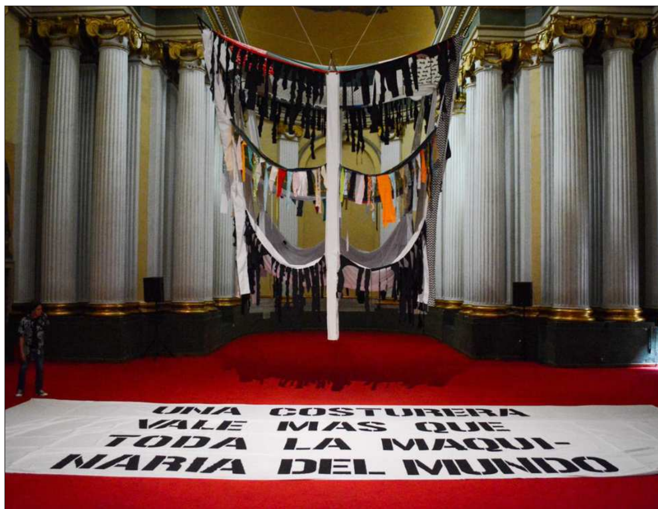
▲ En la zona de la capilla, se encuentra la instalación denominada Una textilera... , en el que se rinde homenaje a las costureras que fallecieron durante el terremoto de 1985, elaborada por Frank López, especialista que lleva más de 15 años trabajando en telas.

La exposición está en casa permanecerá abierta al público hasta el 30 de agosto en el Ex Teresa Arte Actual, ubicado en Licenciado Verdad 8, colonia Centro, CDMX.