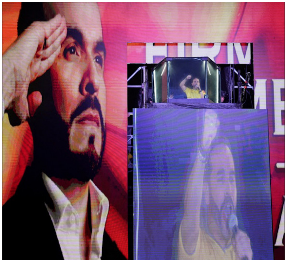
▲ "Las sociedades en las que tendremos elecciones en años venideros debemos aprender de los cambios en otros países".