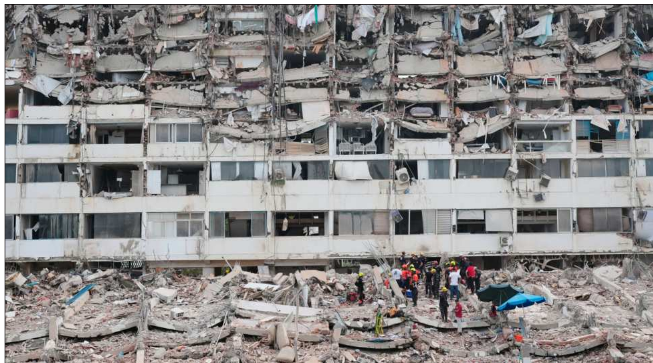
▲ El doble sismo ocurrió en un país sumido en una profunda crisis política y económica; separados por segundos de diferencia, fueron de los más fuertes y devastadores registrados en América Latina. Rescatistas no pierden la esperanza en hallar sobrevivientes.

“No tenemos reportes de daños adicionales en ninguna parte del territorio nacional”, afirmó Jorge Rodríguez, presidente de la Asamblea, en un mensaje de Telegram.