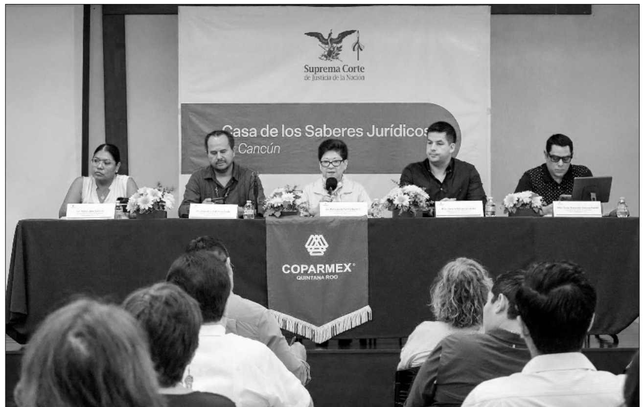
▲ Como parte de su sesión ordinaria de consejo, se formalizaron estas alianzas que buscan dotar a las empresas de herramientas para enfrentar los retos normativos actuales y promover un estado de derecho sólido en la entidad.

Como parte de su sesión ordinaria, se formalizaron estas alianzas que buscan dotar a las empresas de herramientas para enfrentar los retos normativos actuales y promover un estado de derecho sólido en la entidad.