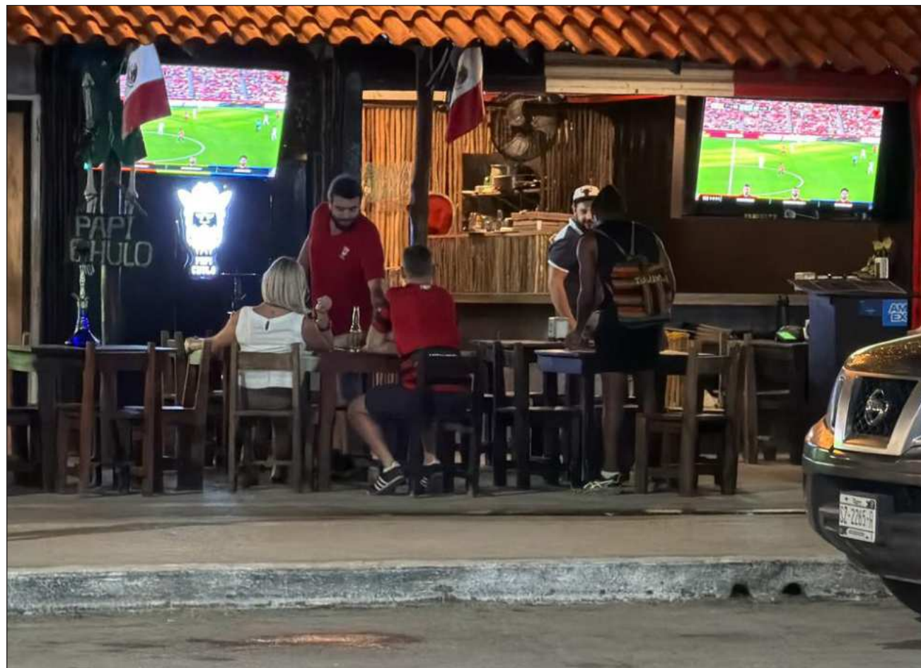
▲ Los establecimientos registran entre dos y cuatro horas de intensa actividad durante los partidos para posteriormente regresar a los niveles habituales de operación correspondientes a la temporada.

Indicó que, además del combinado nacional, selecciones como Francia, Inglaterra, Alemania, Brasil, Argentina y Estados Unidos también han atraído una importante cantidad de aficionados, lo que se ha reflejado en mayores con-