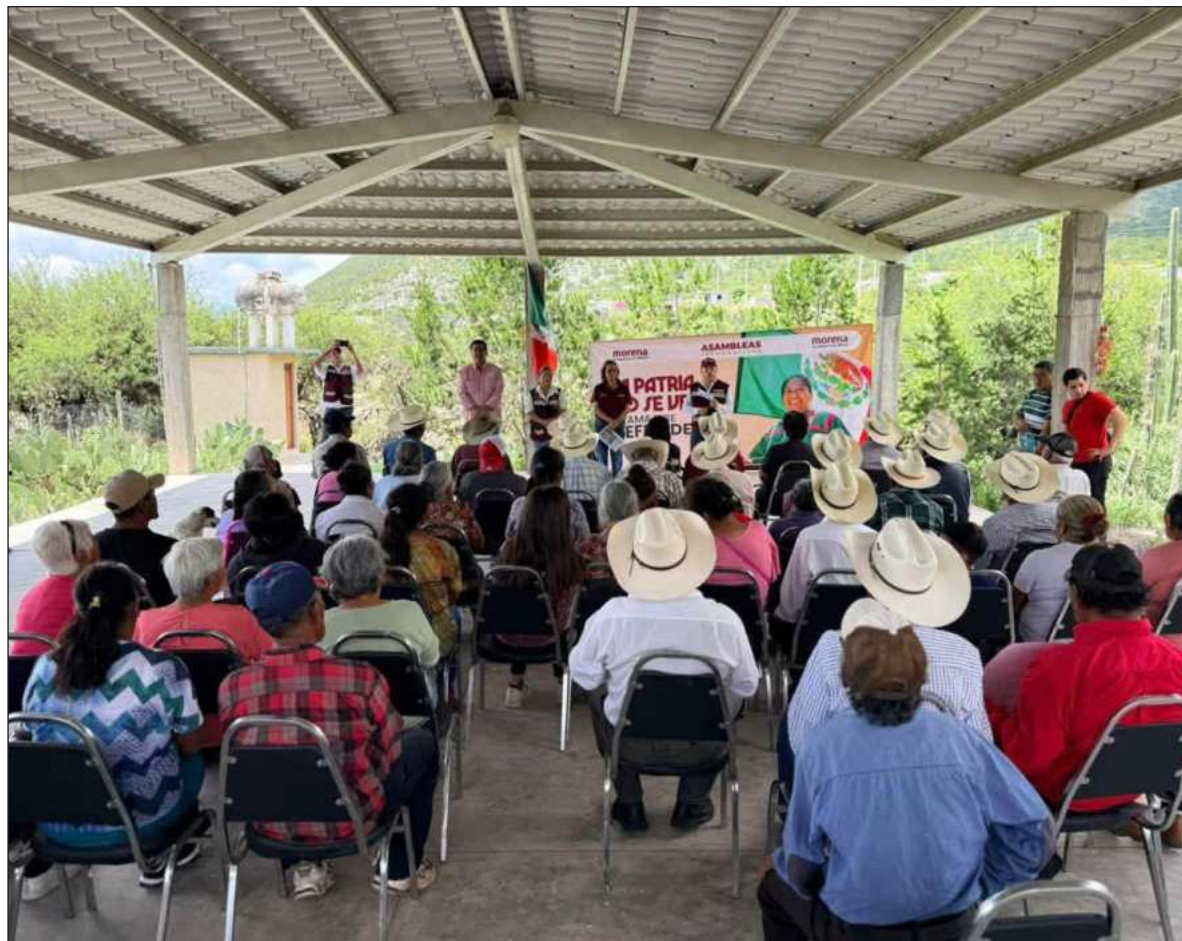
▲ “Nada de nepotismo explícito en candidaturas del bienestar, aunque en algunos casos se vaticinan jugadas bajo presión”.

X: @julioastillero Facebook: Julio Astillero juliohdz@jornada.com.mx