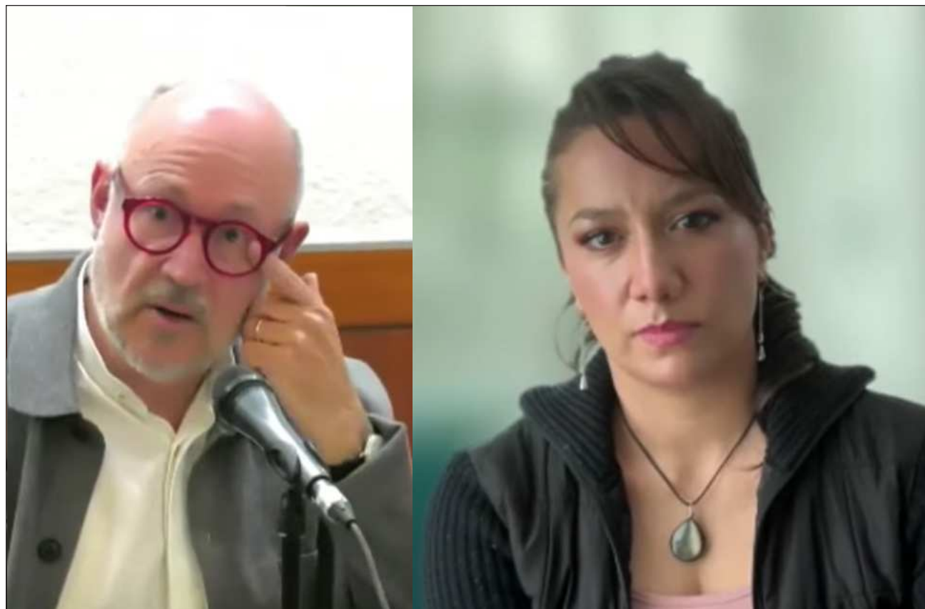
▲ La integración de este nuevo equipo de defensa y la creación de la Red responden al atoramiento judicial del caso y fue dado a conocer desde la sede de la Comisión de Derechos Humanos de la CDMX, en conferencia de prensa.