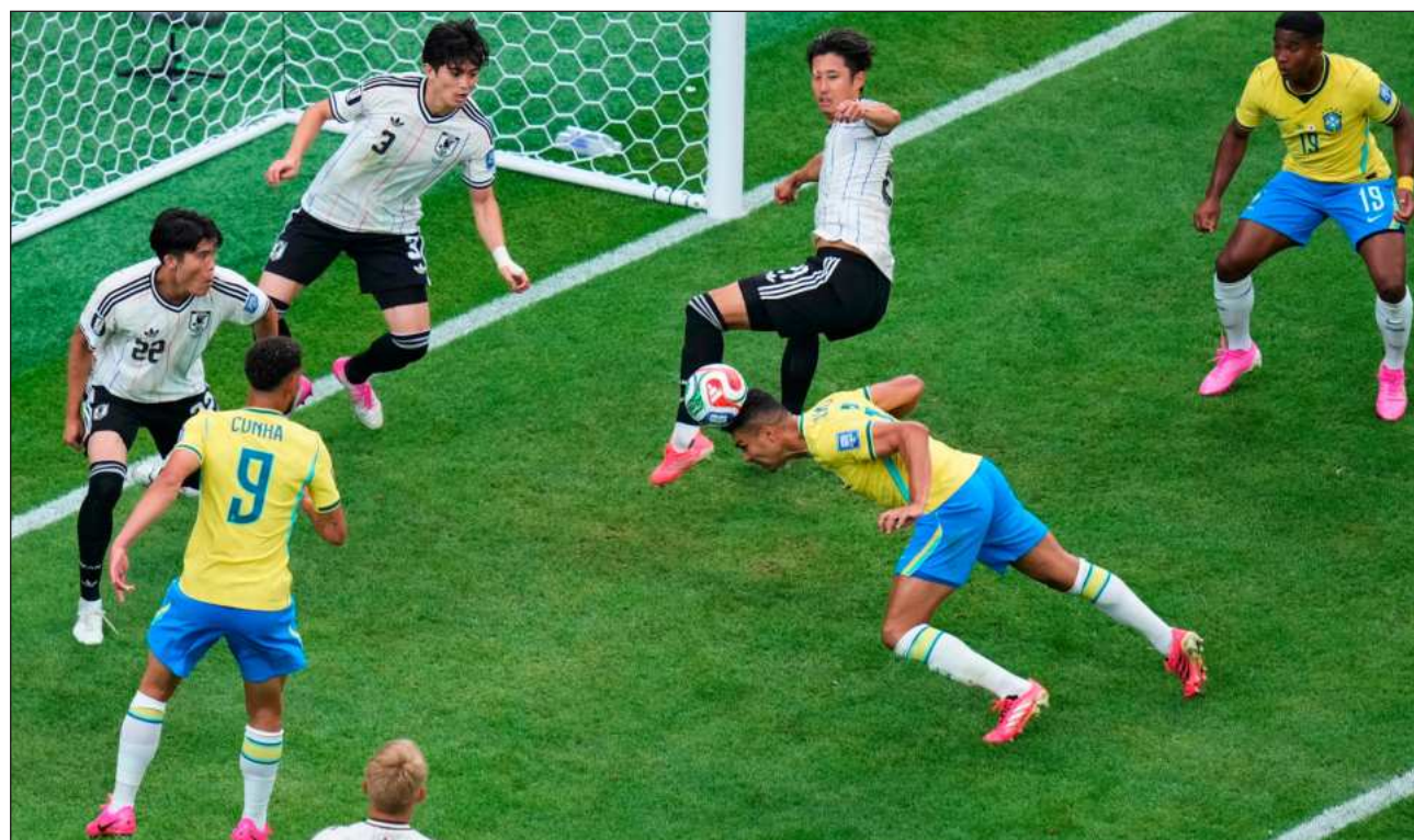
▲ El equipo de Carlo Ancelotti empató en el minuto 55, cuando Casemiro remató de cabeza un centro de Gabriel.

El equipo asiático rozó una hazaña histórica al adelantarse en el marcador a la media hora de juego