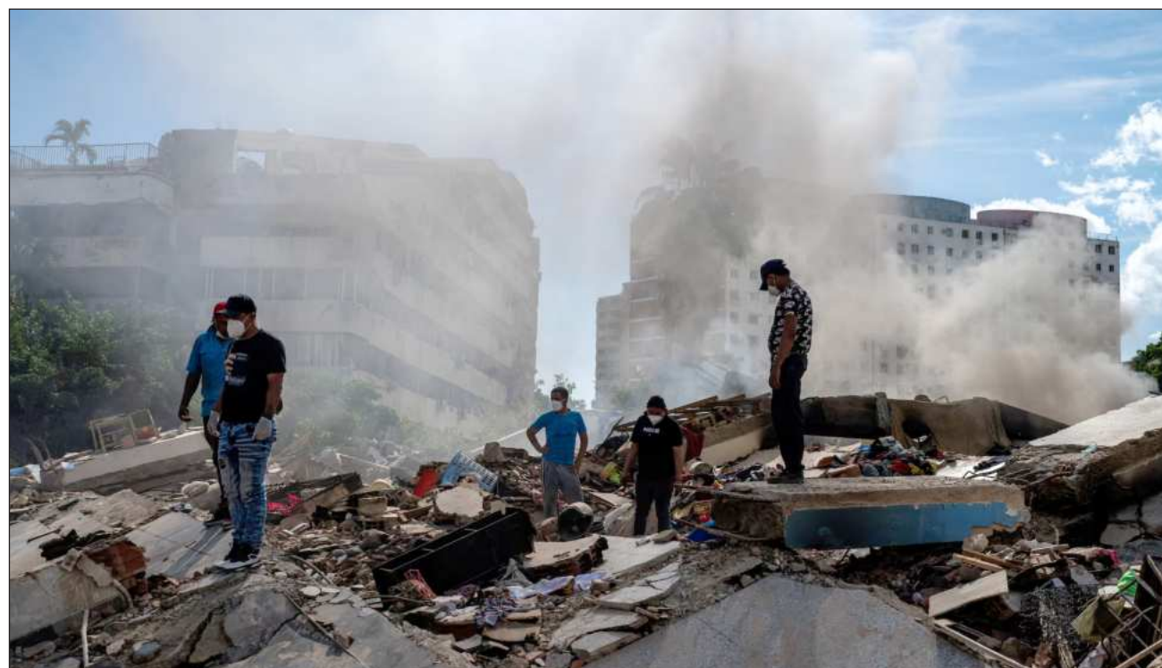
▲ Cientos de cadáveres se encuentran en morgues improvisadas en depósitos del puerto de La Guaira, a 40 km de Caracas y que fue la zona más golpeada por los terremotos, constataron reporteros de la Afp.

Cientos de cadáveres se encuentran en morgues im-