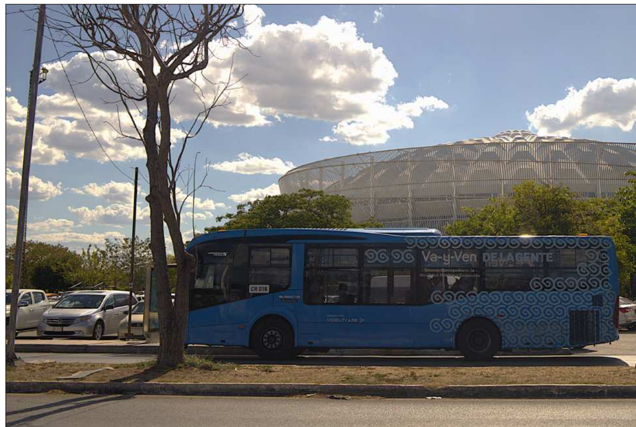
▲ El concepto de kilómetros mínimos garantizados fue una figura incorporada en Yucatán sin antecedentes similares.

El especialista recordó que la Ley de Movilidad y Seguridad Vial aprobada en 2022 no contemplaba los kilóme-