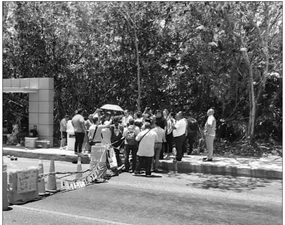
▲ La dirección municipal de Tránsito intervino en la protesta para garantizar la movilidad en la zona, quedando el bulevar Kukulcán con un carril bloqueado y uno liberado.