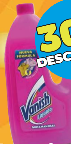
Removedor de manchas de ropa VANISH de 925 ml

VIGENCIA ÚNICAMENTE EL 30 DE MAYO DEL 2024.