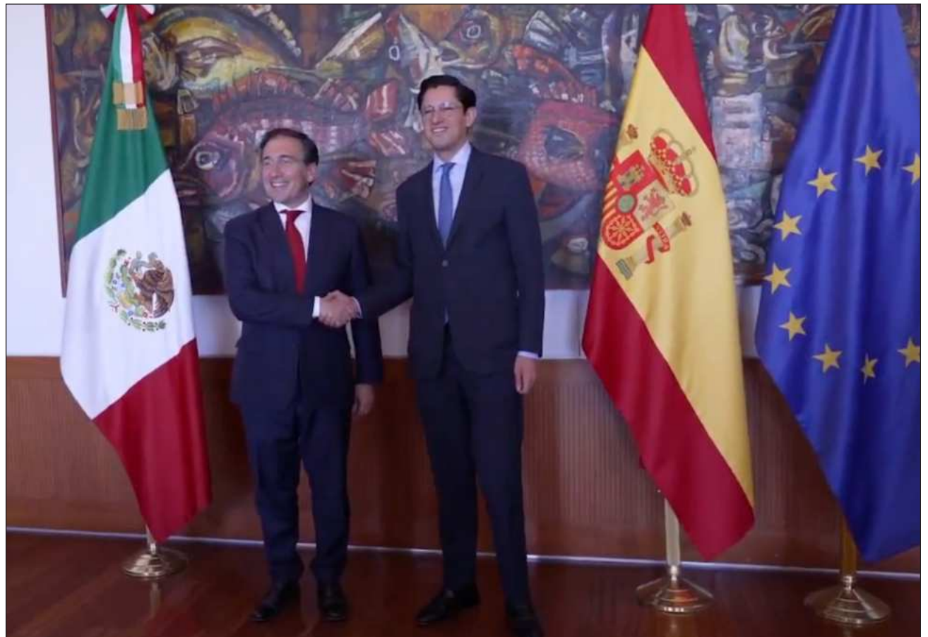
▲ Albares destacó que su visita —la tercera— permitió reafirmar la “afinidad y sintonía” entre ambos países.

Albares destacó que su visita —la tercera que realiza a México como ministro— permitió reafirmar la