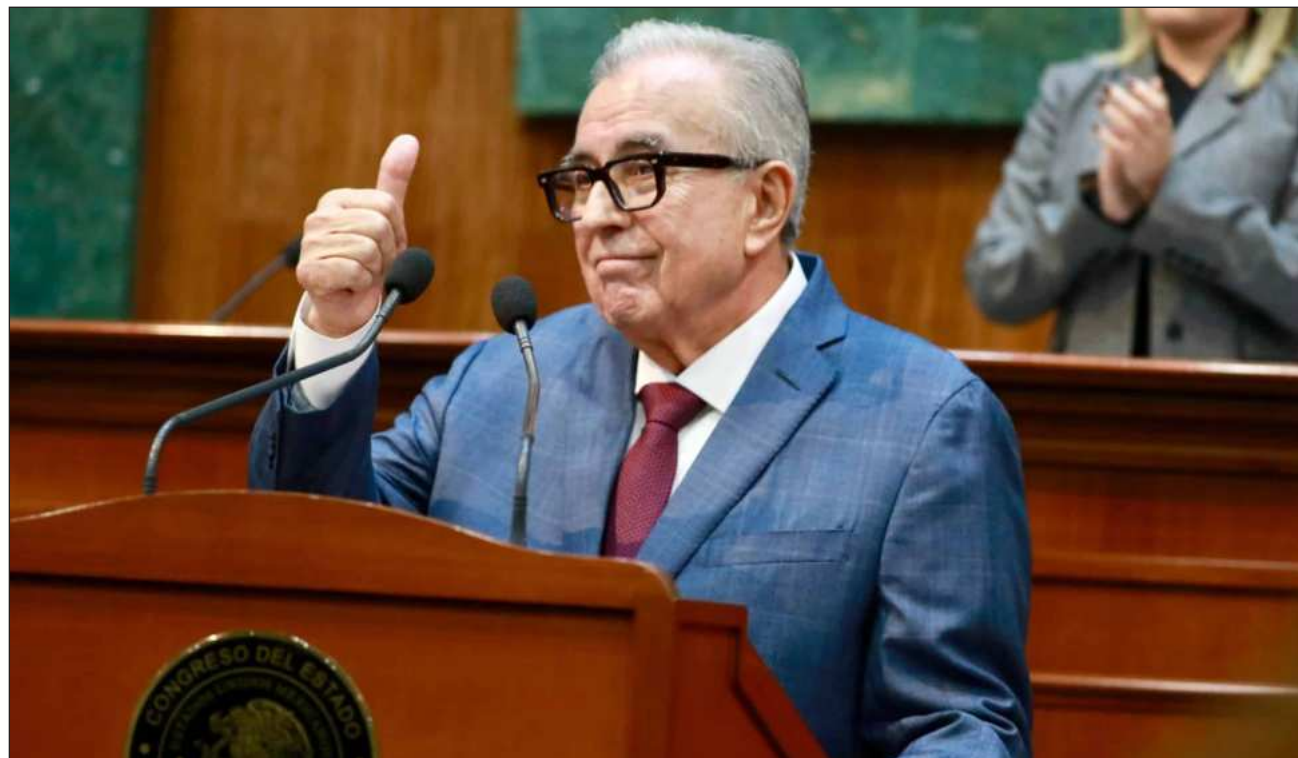
▲ Junto a Rocha Moya fueron imputados nueve perfiles que han trabajado para dependencias de Sinaloa.