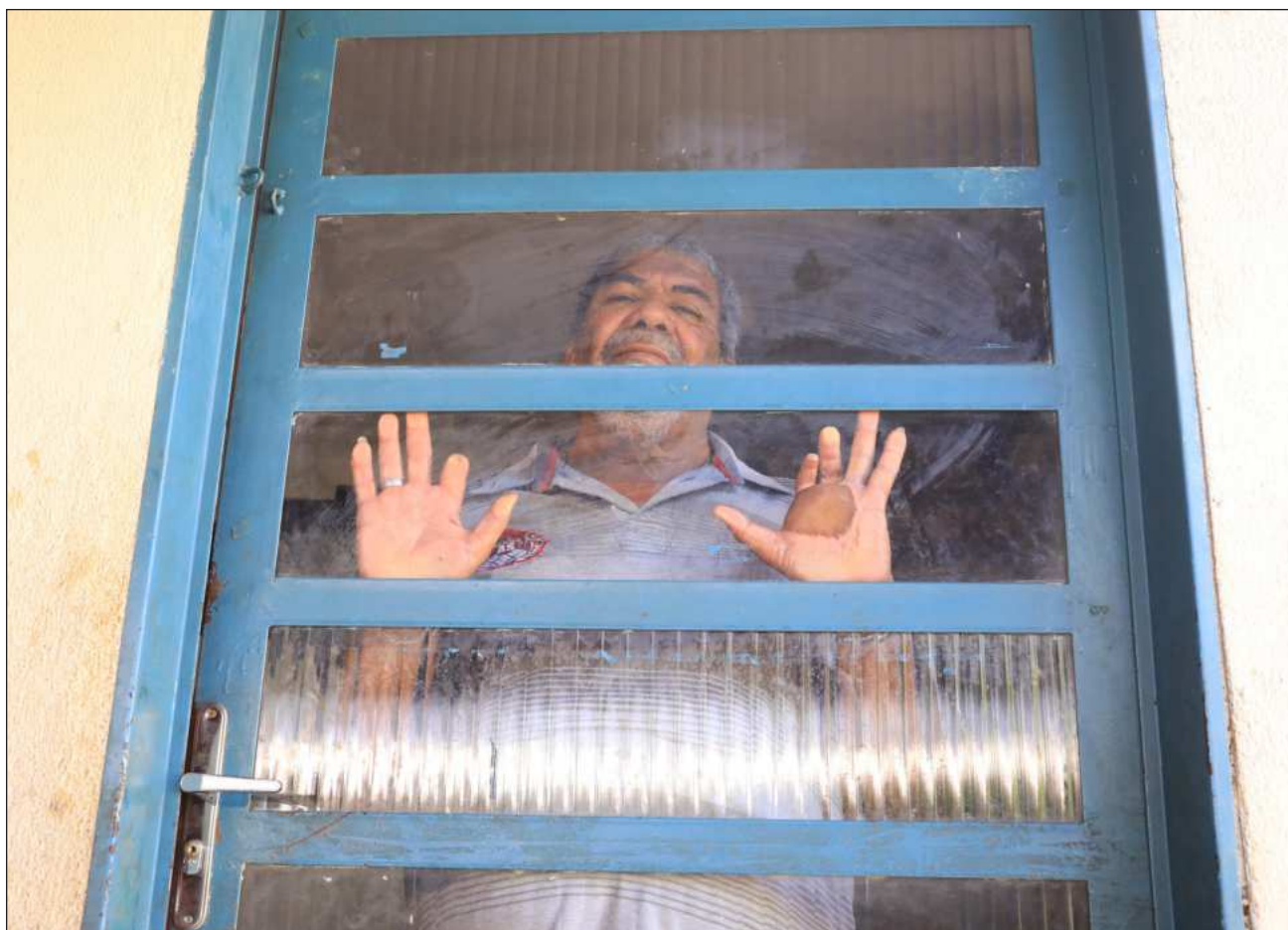
▲ Casi 40 años después de uno de los más graves casos de contaminación radiológica, la sociedad sabe poco sobre el accidente.

"Deberían mostrar la realidad para que los prejuicios disminuyan y nadie huya de nadie en la calle, porque al final también somos seres humanos", zanja.