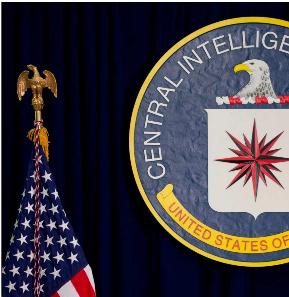
▲ “No era ni es un secreto, la vocación entreguista del Partido Acción Nacional hacia los Estados Unidos, de sus gobiernos y sus cúpulas actuales y las del pasado, por ejemplo: los ex presidentes Vicente Fox y Felipe Calderón, su dirigente actual Jorge Romero y su ex dirigente Marko Cortés, etcétera”.