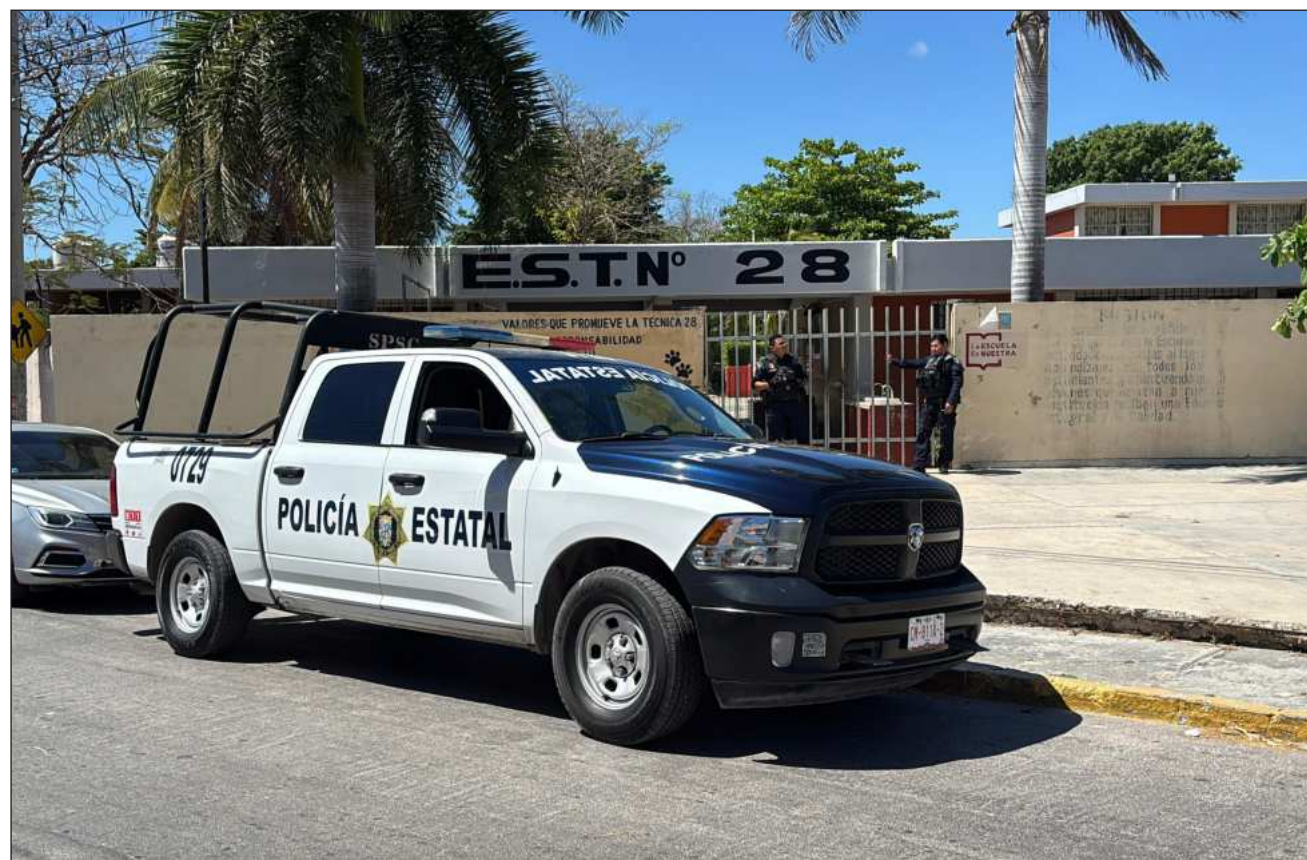
▲ En redes sociales, de manera anónima, señalaron que las escuelas son objetivo de células criminales locales.

En la secundaria general 7, una de las que reportaron amenazas, fue solicitada el ingreso de los elementos policiales, pues se percataron de la presencia de un objeto extraño.