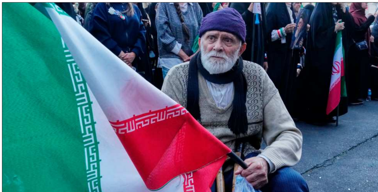
▲ Estados Unidos comenzó a atacar Irán el 28 de febrero de este año; actualmente mantienen actualmente un frágil alto el fuego.