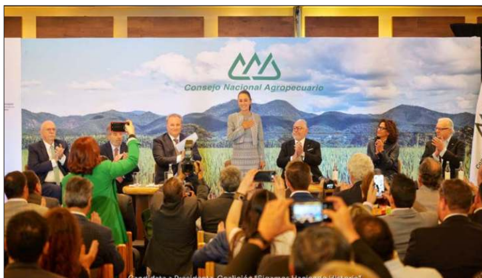
▲ Frente al sector agrícola que ocupa 75 por ciento del agua en el país, la morenista llamó a revisar las concesiones y permisos del vital líquido, y distribuirlo de mejor manera.

Agregó que la tecnificación del campo mexicano pasa por revisar las concesiones y permisos de agua, y distribuirla de mejor manera. "Hay una sequía que no sabemos cuándo va a ter-