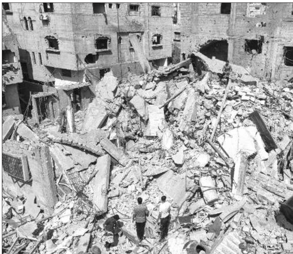
▲ "Espero que Hamas acepte este acuerdo y, francamente, toda la presión del mundo y todos los ojos del mundo deberían estar puestos hoy en ellos para decirles que acepten ese acuerdo": David Cameron.

"Hay que considerar un futuro político para el pueblo palestino, pero también hay que considerar la seguridad para Israel y esas dos cosas tienen que ir juntas", añadió.