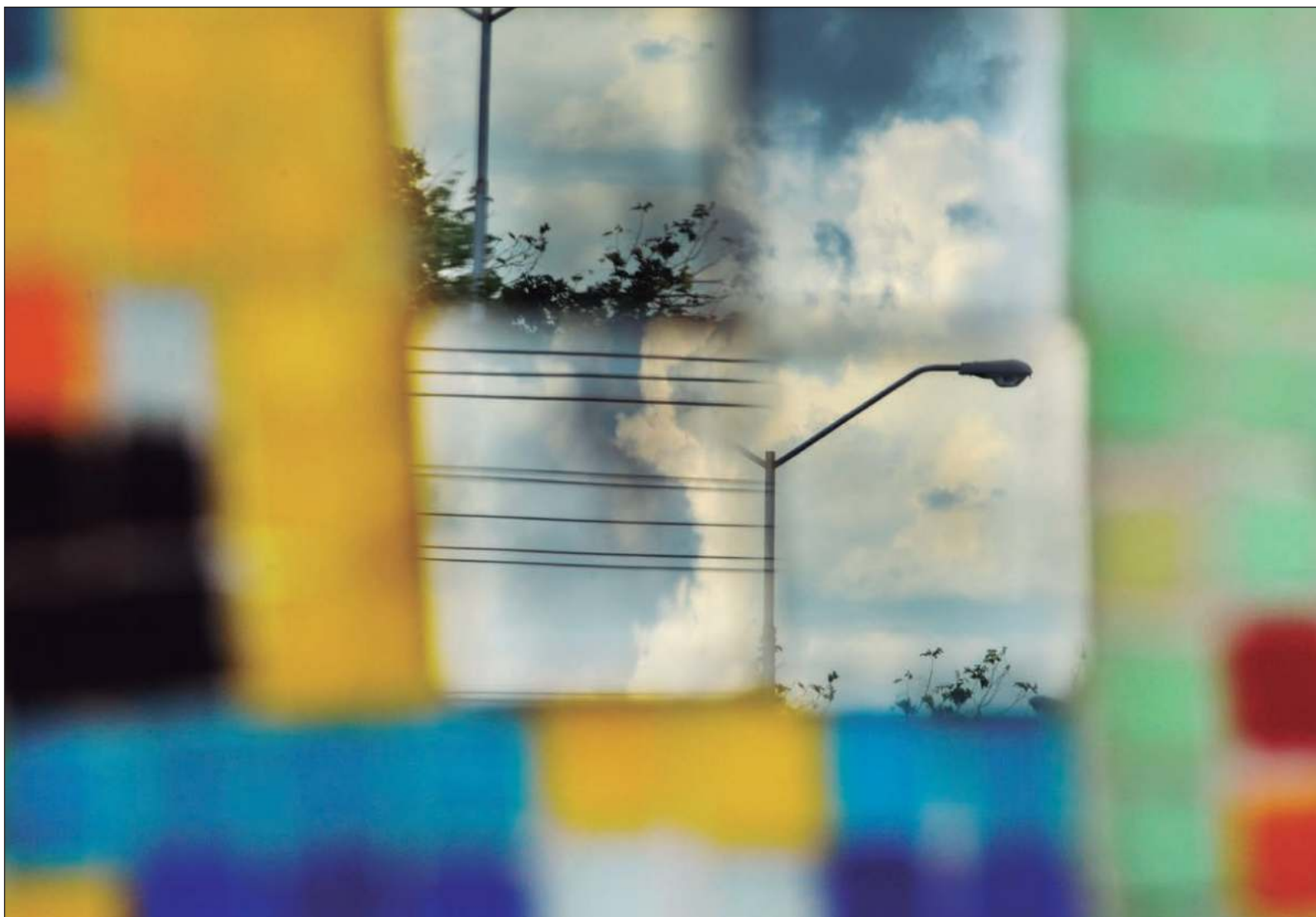
▲ “Ojalá las campañas, que hacen lo mejor que pueden con lo que tienen, también hagan lo mejor que puedan para realmente resolver los problemas locales”.