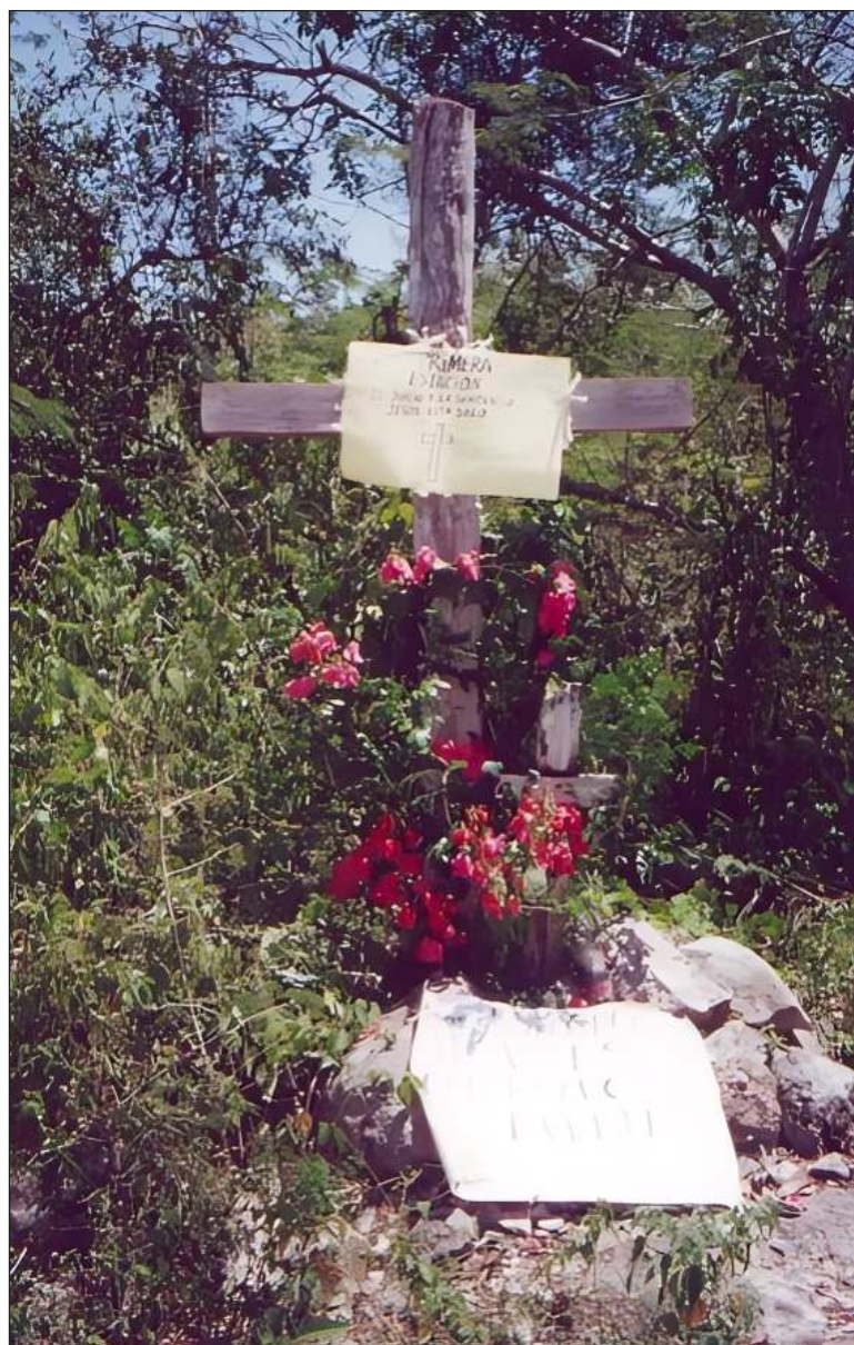
▲ Cruz de báalam , Dzitnup, Valladolid, Yucatán.

con el exterior, ya sean estos caminos que conducen hacia la cabecera municipal ( nojoch bejo'ob ), carreteras o "caminos reales", hacia otras comunidades cercanas ( uchben bejo'ob o caminos antiguos), hacia los campos de cultivo, ranchos o colmenares ( t'ul bejo'ob o caminos angostos), entre otros. Finalmente, es importante mencionar que la modernización de las carreteras en el estado ha resultado en la remoción de antiguas cruces de báalamo'ob , las cuales en ocasiones no son reinstaladas siguiendo el procedimiento ritual adecuado. Ante esta situación y en línea con la misma cosmovisión, los residentes locales consideran que la falta de estas cruces protectoras en las