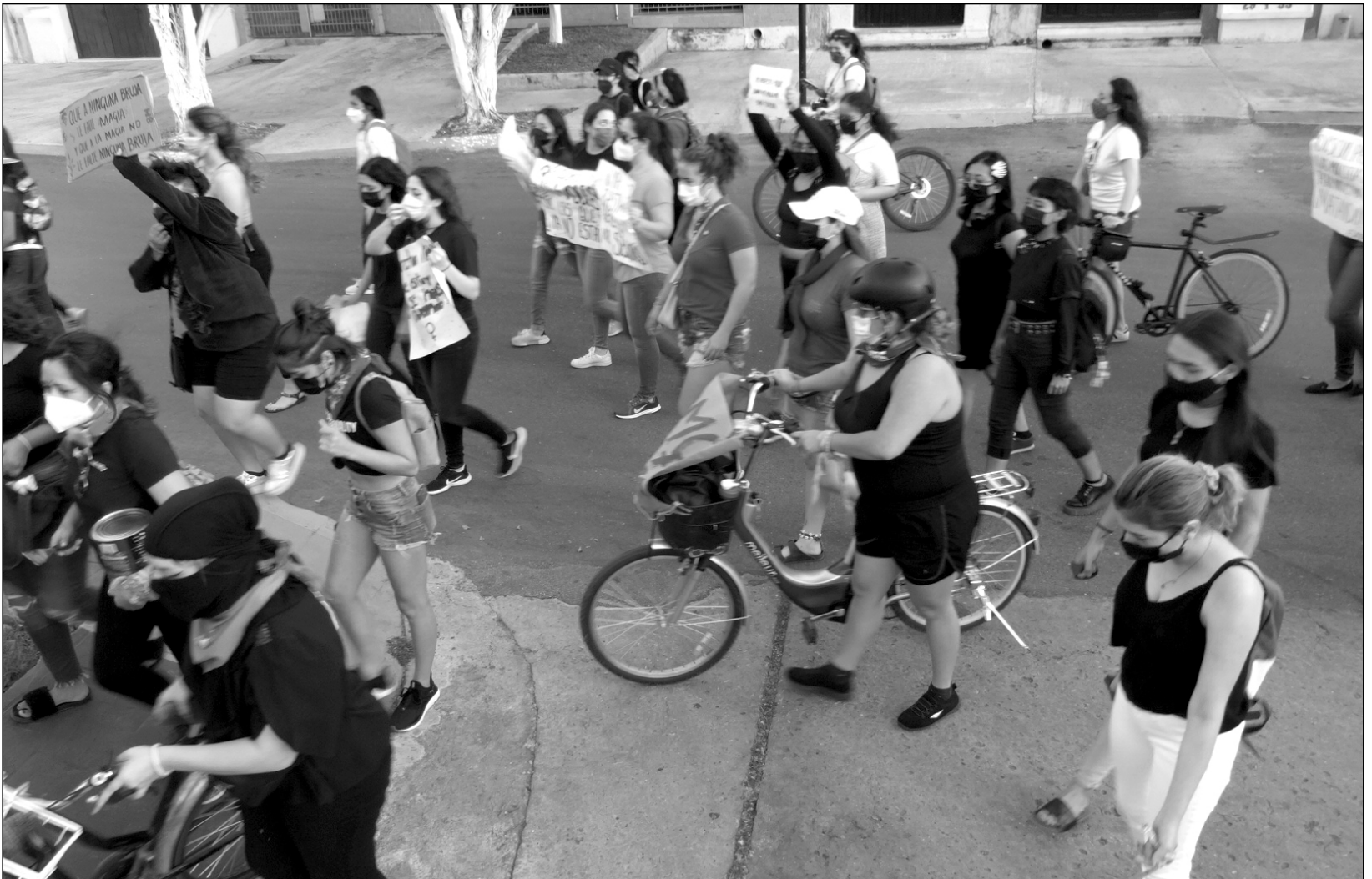
▲ Tan solo este domingo, recuerdan las organizadoras, hubo cuatro feminicidios en Quintana Roo.

Es necesario pedir un alto a la violencia en la península, señala Kelly Ramírez