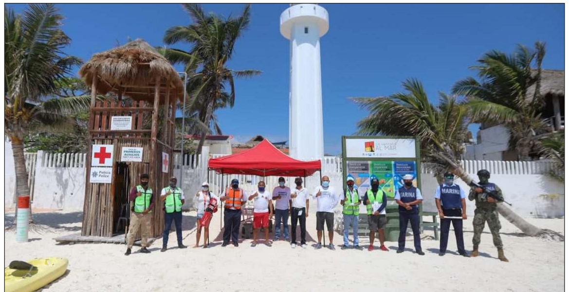
▲ El ayuntamiento intensificó la campaña de prevención contra el coronavirus.

"El objetivo trazado es que tengamos un periodo vacacional exitoso en todos los sentidos. Queremos que la recuperación económica y turística siga avanzando a paso firme, y que tengamos saldo blanco, sin incidentes que lamentar y, por su puesto, procu-