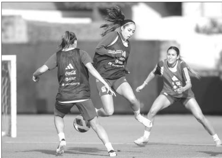
▲ La selección mexicana de fútbol femenino se prepara para la Copa Oro.

No lo asumen como un ajuste de cuentas, pero sí como la oportunidad de probarle a las demás naciones que el Tricolor es capaz de ser protagonista.