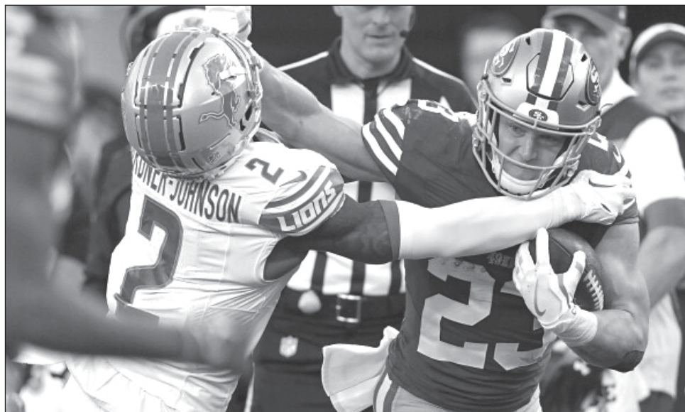
▲ El corredor Christian McCaffrey, pieza clave en el estelar y profundo ataque de los 49's.

Mahomes y los Jefes revertieron un déficit de 20-10