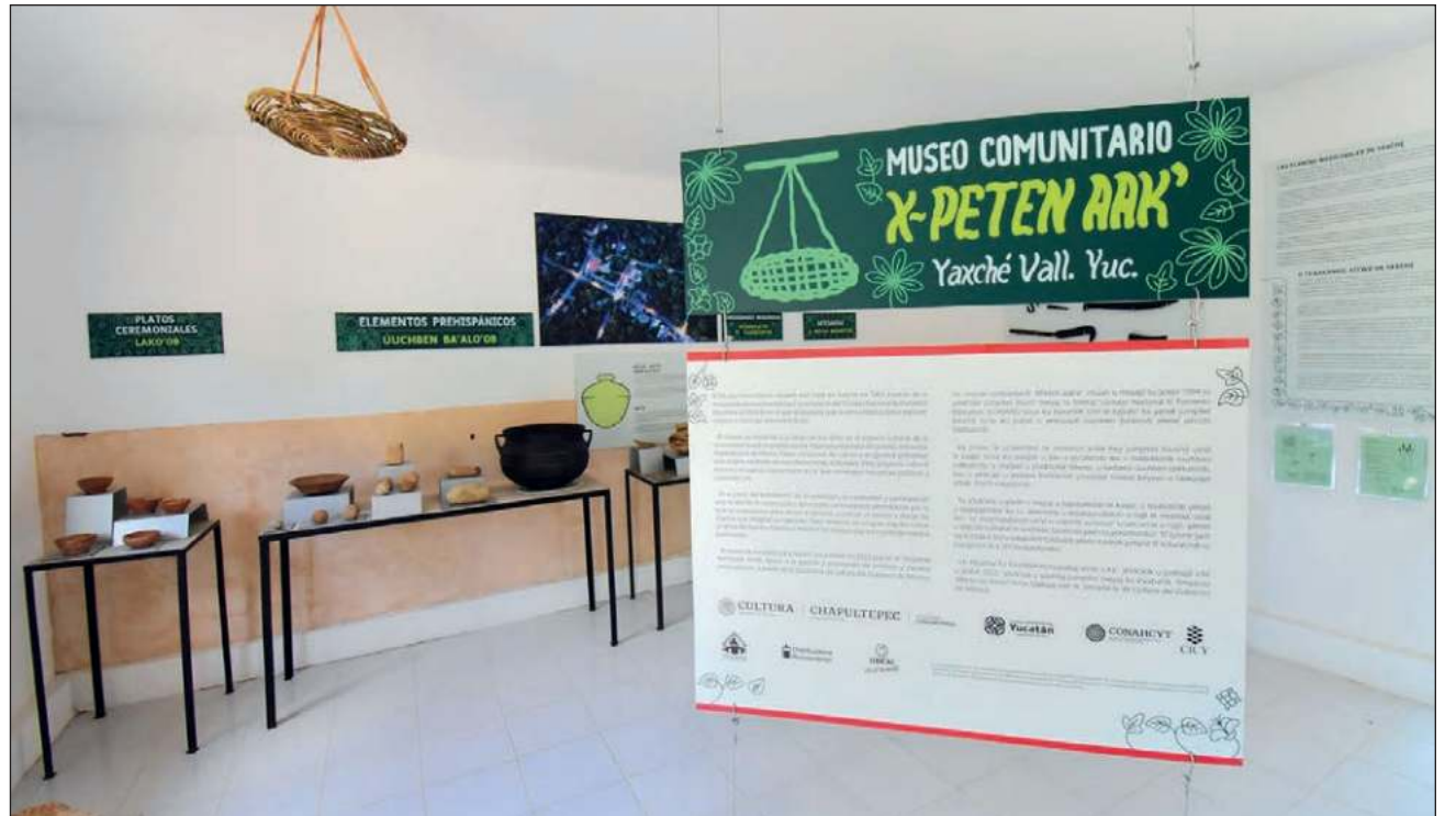
▲ El recinto, ubicado al oriente de Yucatán, es también un punto de encuentro para contar historias y leyendas del pueblo, presentar espectáculos de interés y realizar concursos de cuento, entre otras manifestaciones.

"Hay muchas piezas prehispánicas y coloniales; hay jícaras, hay batidor, también batea; hay una máquina de coser antigua, lámparas, machetes, coas, recipientes y las medicinas tradicionales", detalló Victoriano sobre los elementos en exhibición,