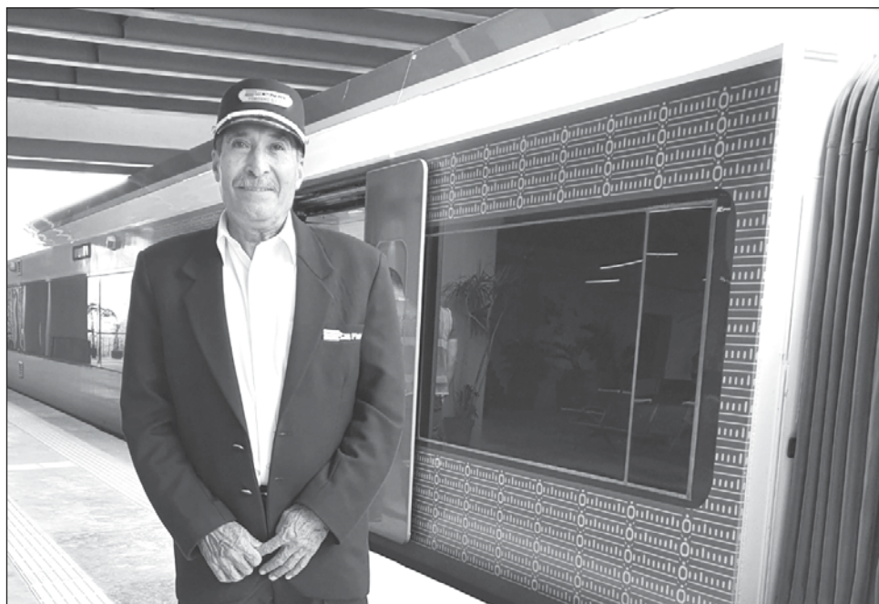
▲ Los recorridos son: de la estación Cancún Aeropuerto hacia Playa del Carmen a las 9, 12 y 15 horas y de Playa del Carmen a Cancún a las 10:30, 13:30 y 16:30 horas.

La empresa ICA reportó que la interconexión entre los tramos 4 y 5 está lista. Es un ramal de 2.1 kilómetros (km) construido a vía doble donde fue necesaria la colocación de 12 aparatos de vía que dan servicio tanto a los