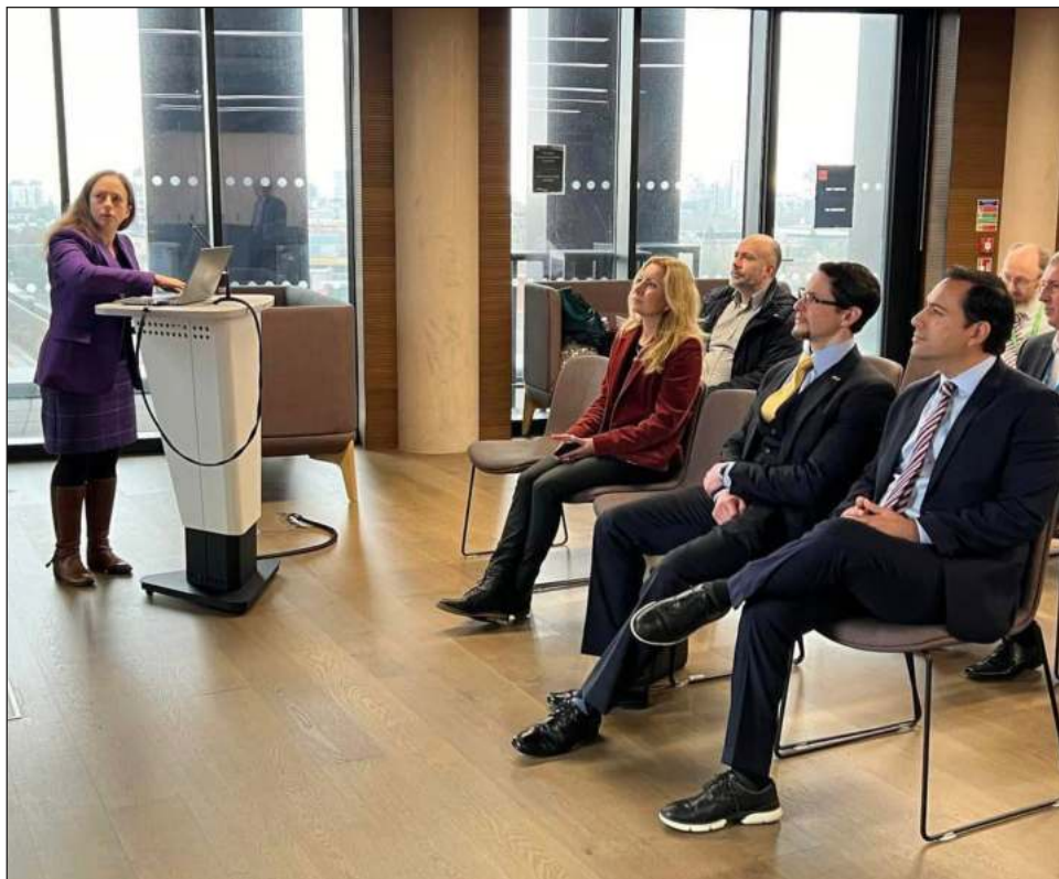
▲ En gira de trabajo, el gobernador Mauricio Vila Dosal conoció la Escuela de Ciencias de la Computación e Informática de la Universidad de Cardiff, en Gales.

Vila Dosal aseguró que a través de estas acciones busca seguir fortaleciendo la educación superior en Yucatán.