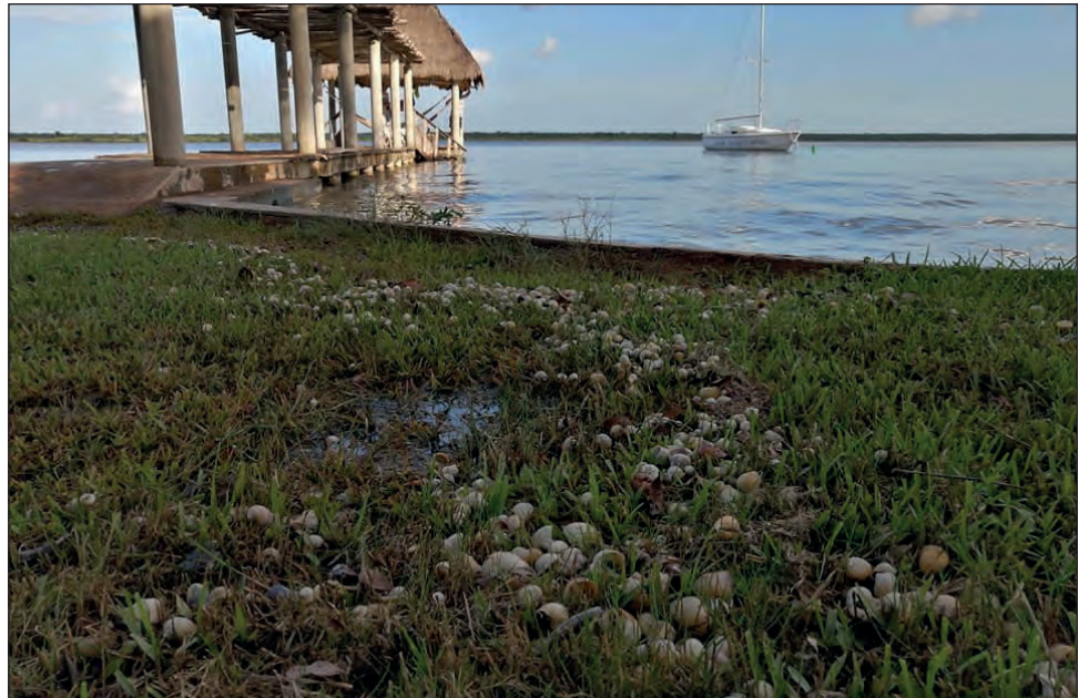
▲ En los últimos días, han aparecido muchos caracoles muertos en las orillas del cuerpo de agua.

“Estuvimos de acuerdo en que aquí no se puede usar zapatos de agua porque al usarlos perdemos sensibilidad y no sentimos el sedimento, ni a los caracoles y su concha es muy frágil, podemos romperla; además de ello no se puede