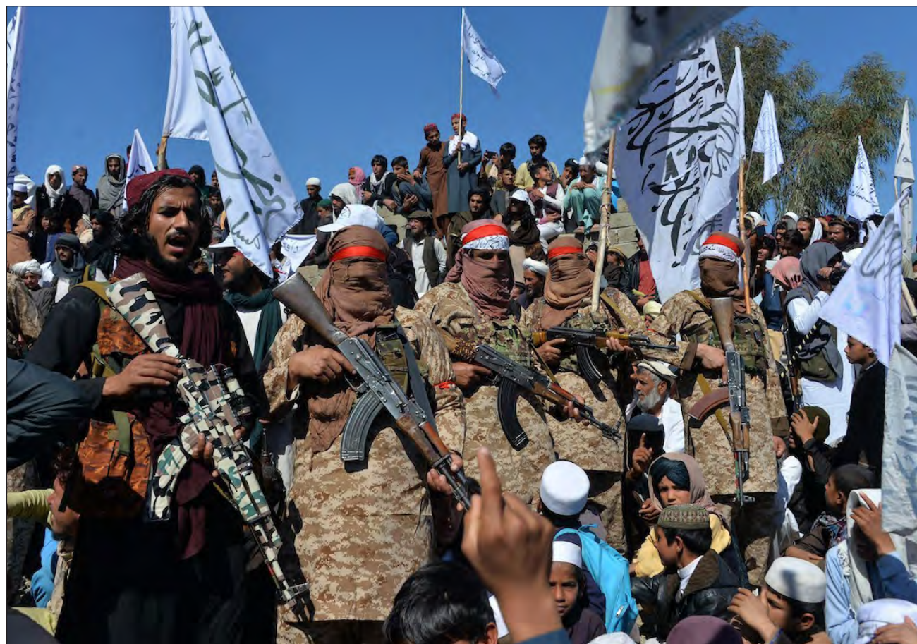
▲ El grupo musulmán cominó a sus miembros a detener todas las operaciones ofensivas contra las fuerzas enemigas.

Asimismo, resaltó que, si bien se trata de "un paso sig-