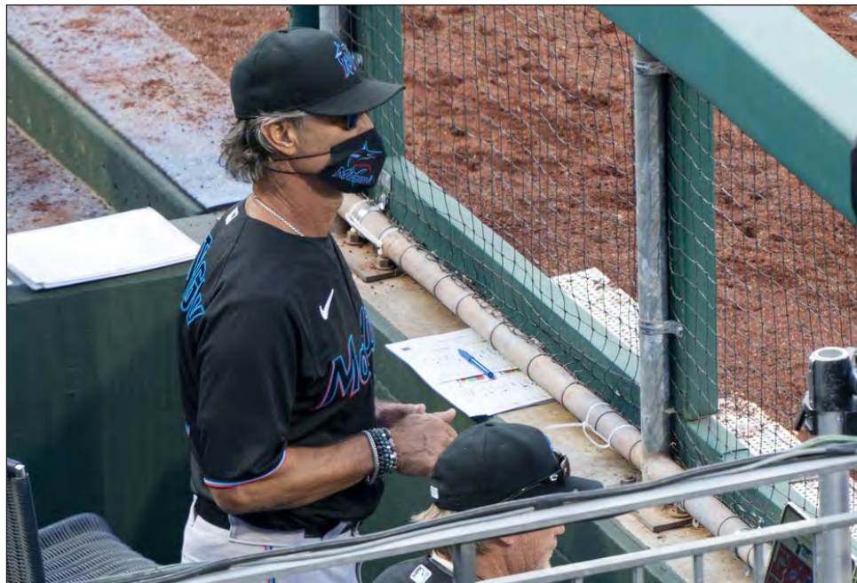
▲ Don Mattingly, mánager de los Marlins, durante el juego del sábado en Filadelfia.

Se suponía que los Filis recibirían lunes y martes a los Yanquis, y los visitarían miércoles y jueves. En vez de ello, los peloteros de Nueva York se dirigieron a Baltimore para comenzar hoy una serie frente a los Orioles. Por los Mulos, que tenían programada una práctica anoche en