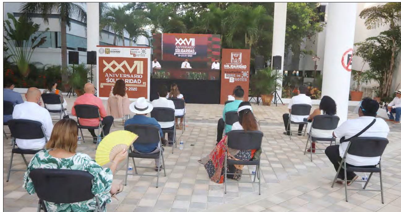
▲ La sala Leona Vicario del nuevo palacio municipal fue adecuada para cumplir con los estándares de sana distancia.

Recordó que en 1988 se fundó la primera colonia