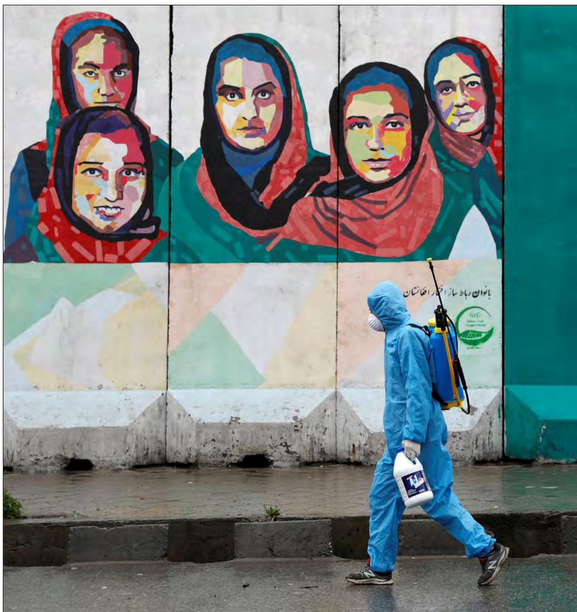
▲ Today we face a major pandemic that has taken hundreds of thousands of lives and cost us billions of dollars in economic losses.

OLIVER WENDELL HOLMES once noted that “the main part of intellectual education is not the