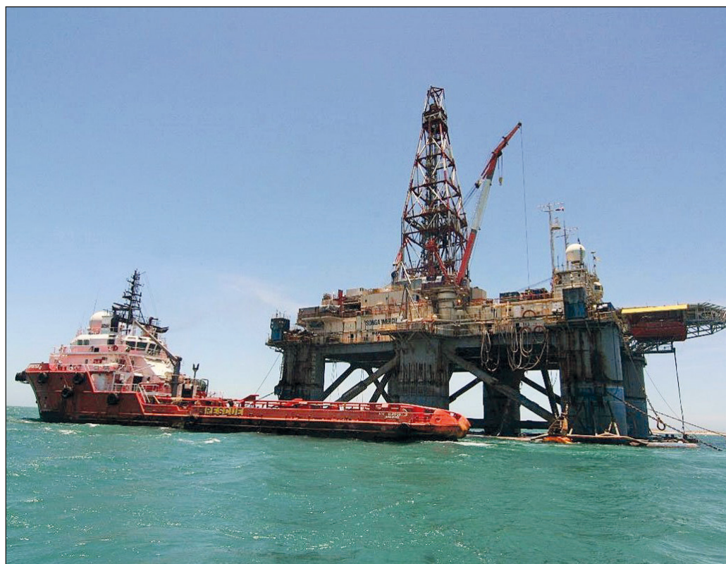
▲ La reforma a la Ley de Hidrocarburos suma al avance en el cumplimiento de la promesa de campaña, de revertir la Reforma Energética del sexenio pasado.

En medio de la disputa judicial en torno a la Ley de la Industria Eléctrica aprobada a principios de mes, el viernes el presidente Andrés Manuel López Obrador envió a la Cámara de Diputados una iniciativa de reforma a la Ley de Hidrocarburos en la que se plantea como un imperativo el fortalecimiento de las empresas estatales de energía Petróleos Mexicanos (Pemex) y Comisión Federal de Electricidad (CFE) “como garantes de la seguridad, así como de la soberanía energética y la palanca del desarrollo nacional para detonar un efecto multiplicador en el sector privado”.