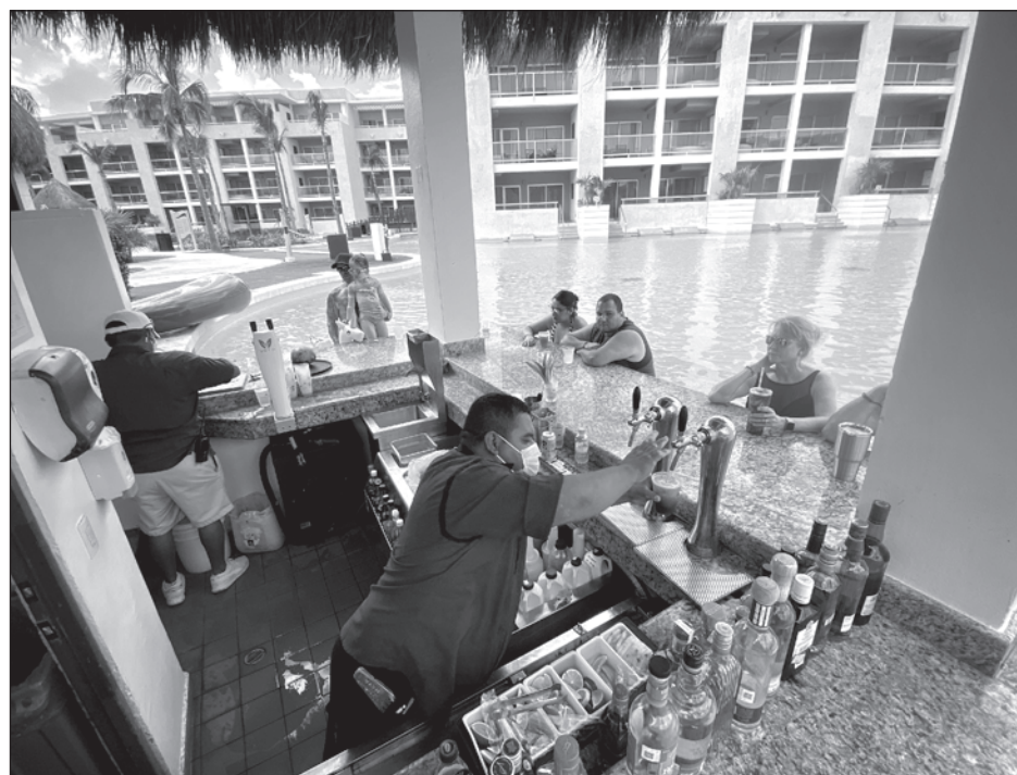
▲ Pese a las restricciones, la actividad turística va en aumento.

Rodríguez Gasque, consideró que la activi-