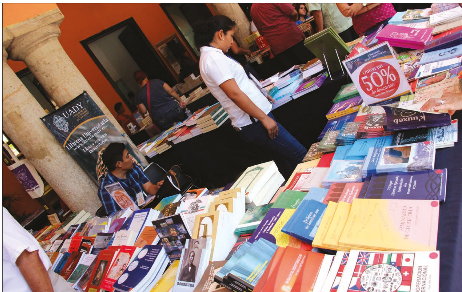
▲ El que no tiene palabras, golpea, mata. No tiene capacidad de expresión.