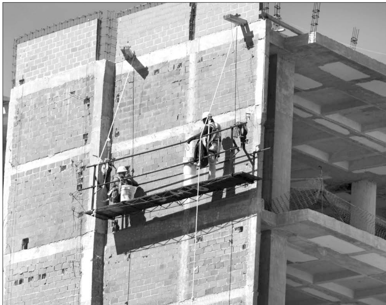
▲ La Sedatu planea realizar obras por aproximadamente mil millones de pesos en el estado.

Sólo nos quedamos mirando cómo pasan los recursos, acusan