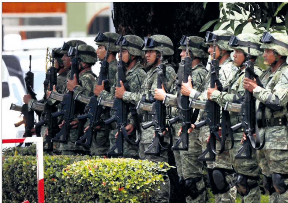
▲ Según el comisionado del INM, la gente sigue cruzando formal e informalmente por distintos puntos de la frontera sur.

El gobierno de México “tiene la obligación de ga-