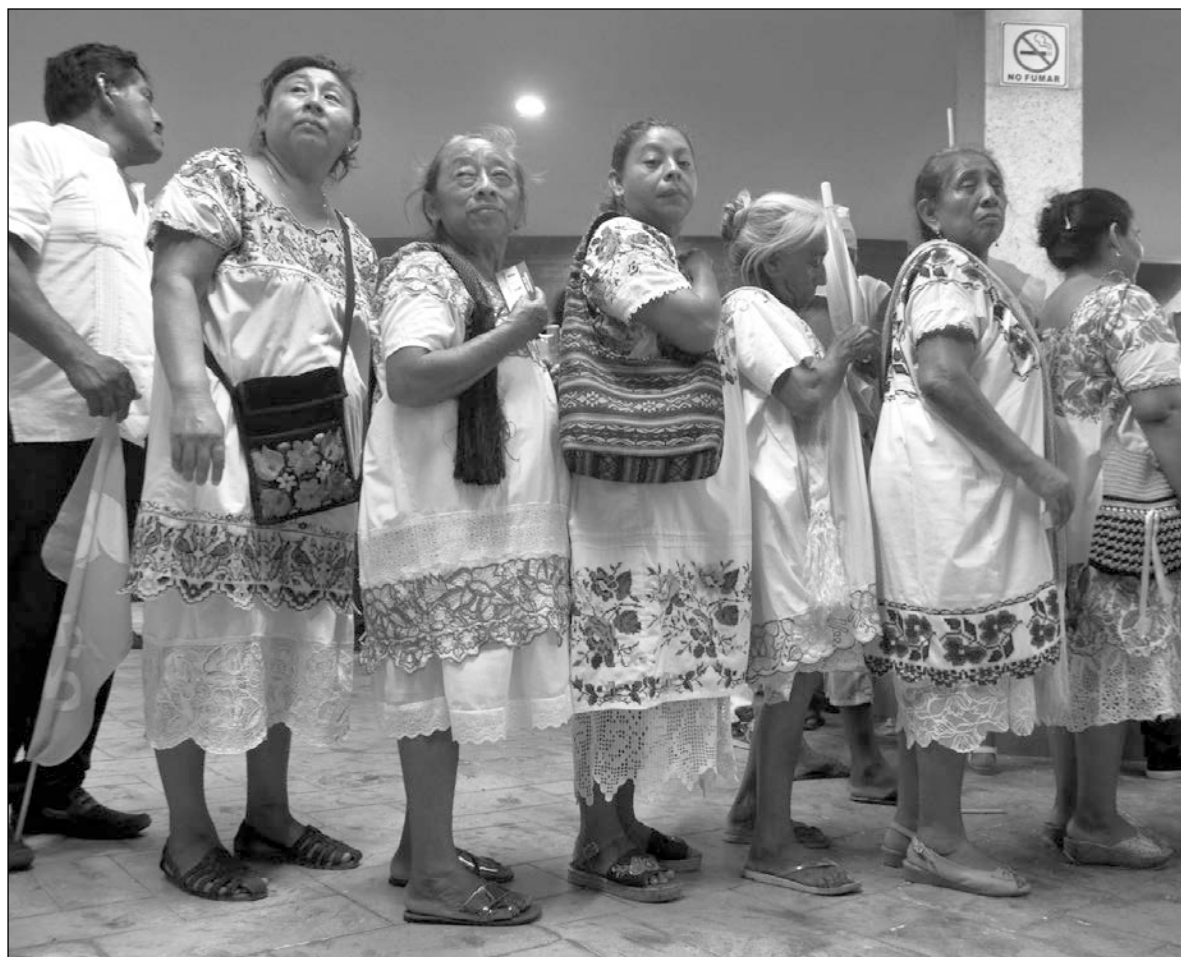
▲ Atrás debe quedarse aquella mirada que identifica casi de manera exclusiva al sujeto indígena, en este caso maya, como un ciudadano únicamente portador de carencias.

CON EL PRÓXIMO inicio de las campañas y el carácter étnico del territorio yucateco vale la pena preguntarse y poner sobre la