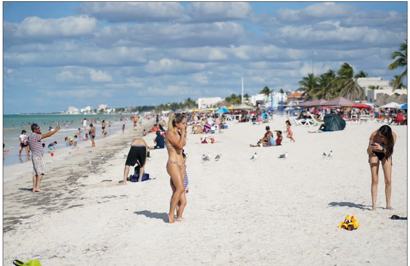
▲ En épocas normales, en el malecón de Progreso caben hasta 100 mil personas.

"Hay que invitar a la gente a hacer una reactiva-