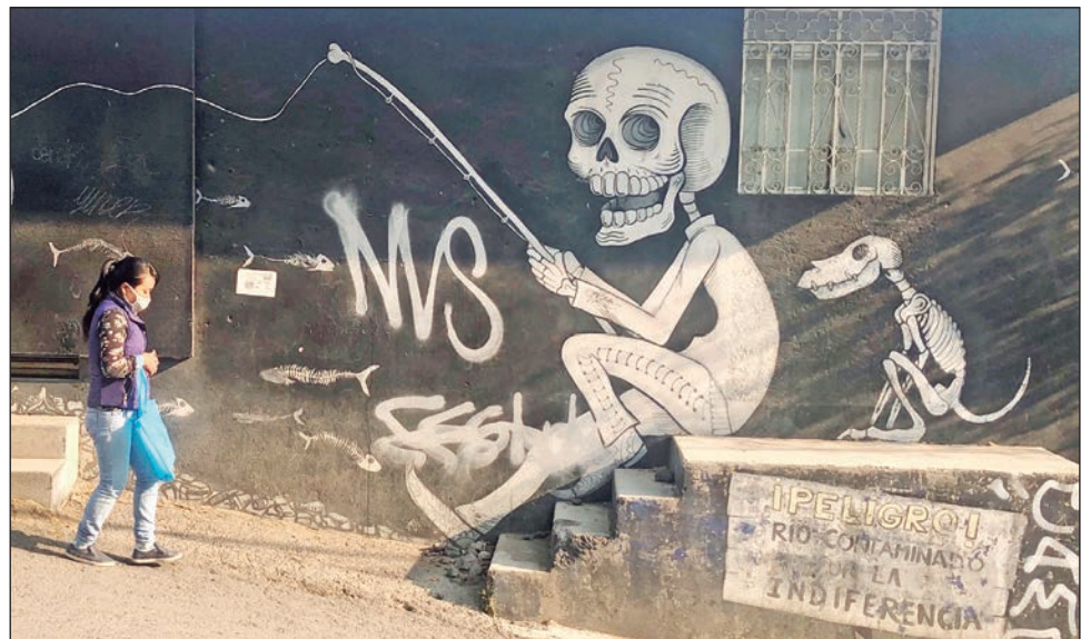
▲ Los murales retratan a caudillos revolucionarios como símbolo de resistencia o a la muerte, en pleno semáforo rojo, lista para la pesca de almas.

El investigador añade que tuvieron que transcurrir varias décadas antes de que el Dr. Atl volviera a ocuparse de la pintura mural en el Casino de la Selva de Cuernavaca, Morelos. Un fragmento de esa obra, titulada Vista arquitectónica de la Ciudad de Puebla, se