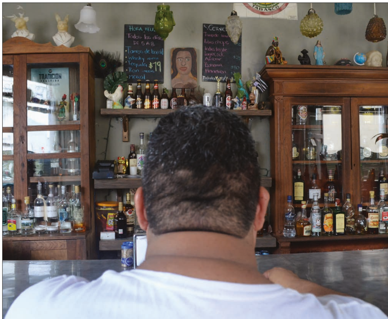
▲ El acuerdo fue suscrito entre empresarios y el secretario general de Gobierno.

Los ajustes permiten que los restauranteros puedan vender alcohol hasta la una de la madrugada, y los establecimientos de lunes a sábado.