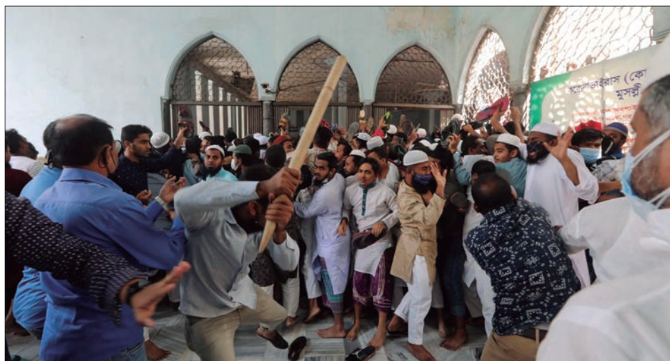
▲ Pese a que Narendra Modi abandonó Bangladesh el sábado por la noche, las protestas por la llegada del dirigente indio continuaron el domingo en gran parte del país. Foto Afp y Ap

Las protestas en Bangladesh iniciaron el viernes pasado, cuando llegó al país el primer ministro indio, Narendra Modi, para celebrar el aniversario 50 de la independencia nacional.