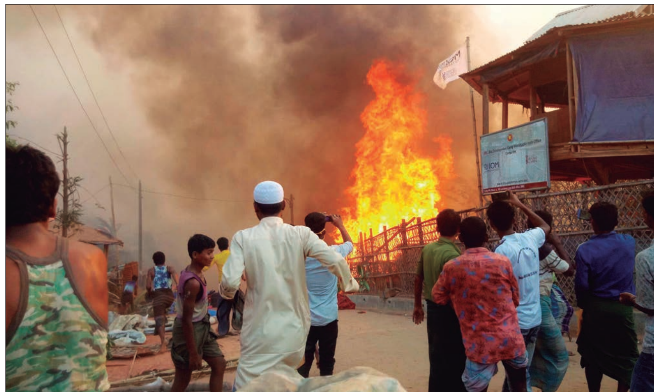
▲ La Organización de las Naciones Unidas estima que 45 mil refugiados en Kutupalong perdieron todo por los incendios que azotaron al campo de refugiados durante la semana pasada.

Pese a que preparar a la población y a la infraestructura para la llegada de las lluvias torrenciales y los fuertes vientos es clave, estos últimos días se han tenido que "desviar" los recursos desti-