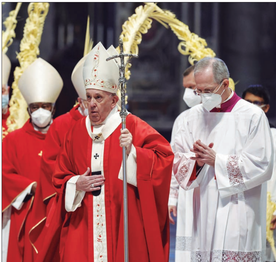
▲ Por segunda vez en la historia reciente, la Iglesia Católica celebró el domingo de ramos sin multitudes de creyentes debido a la pandemia.

Francisco puso fin a su homilía invitando a rezar por las víctimas de un ataque suicida ante una abarrotada catedral católica en Indonesia cuando terminaba una misa del Domingo de Ramos. Al menos 14 personas resultaron heridas, según la policía de la nación asiática.