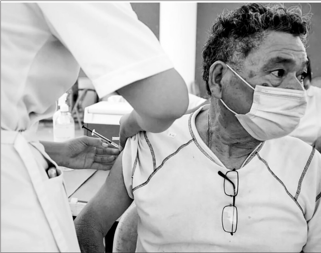
▲ Hasta el pasado 26 de marzo, se han aplicado 56 mil 667 vacunas en 10 de los 11 municipios.