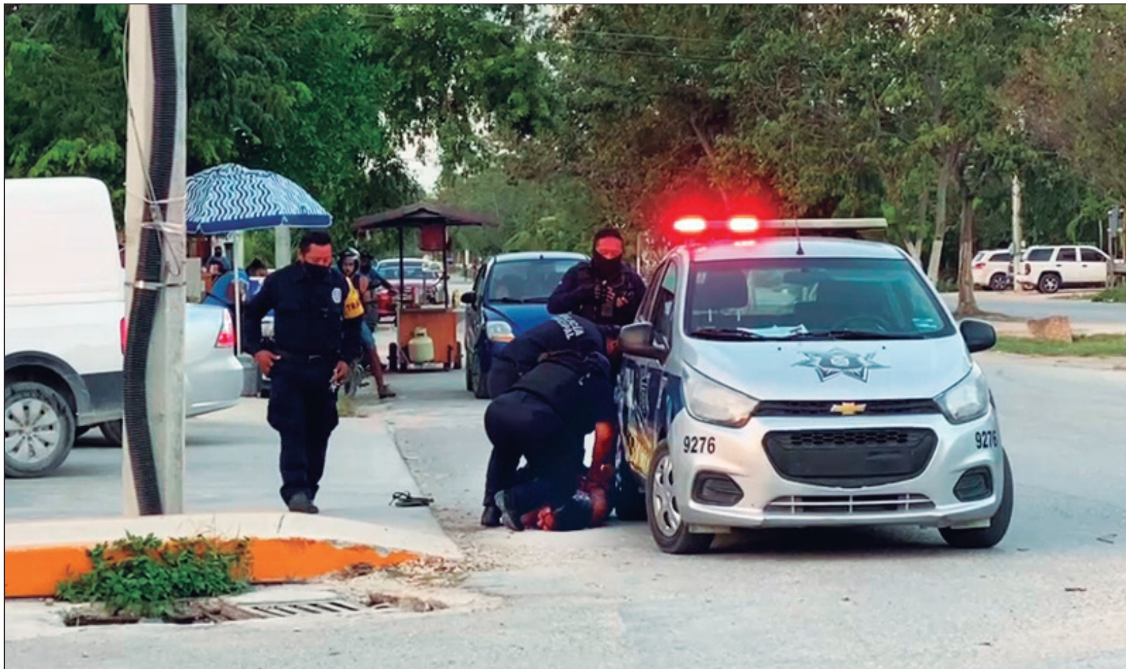
▲ Fiscalía General del Estado (FGE) ti' u noj lu'umil Quintana Roo tu ts'áaj k'ajóoltbile', ts'o'ok u káajal u meyajtik u tsoolju'unil xaak'al "yaan ba'al u yil yéetel péech'ool kíinsa' beeta'ab yóok'ol juntúul wiinik ma' k'a'ayta'an máaxi, úuch tu taal u chíinil k'iin le sábado máanika, tu méek'tankaajil Tulum".