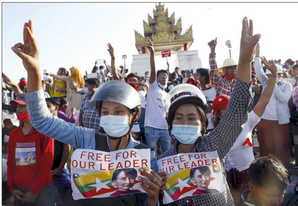
▲ Desde el inicio de las protestas por el golpe de Estado, 420 manifestantes han sido asesinados por las fuerzas del estado birmano.

Entre las defunciones hay una niña de 13 años, según las fuentes de Myanmar Now , así como un joven de 21 años, identificado como