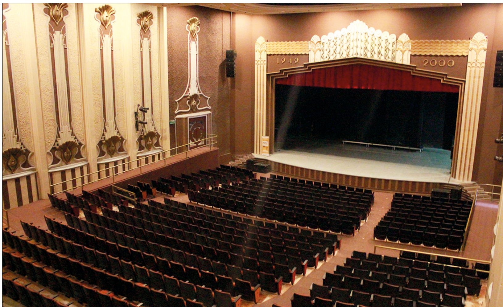
▲ Pese a que el Teatro Armando Manzanero permanece cerrado, sigue recibiendo mantenimiento de manera continua y periódica, tratando de conservar las condiciones adecuadas para cuando vuelva a subir el telón.

De igual modo, con el apoyo a las instituciones estatales de cultura, mediante Axiograma, y el programa de artes escénicas para la profesionalización y desarrollo de audiencias, se ha dado continuidad al