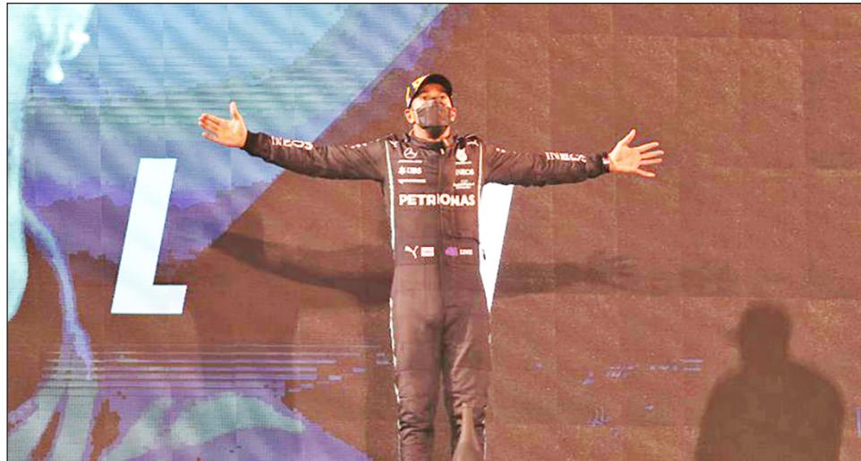
▲ Lewis Hamilton comenzó con el pie derecho la defensa del título.

11 en su debut con Red Bull. Su vehículo se detuvo segundos antes del comienzo, perdió su posición en la parrilla y se vio obligado a iniciar desde la línea de pits, pero logró recuperarse para cruzar detrás del McLaren de Lando Norris, quien terminó en el cuarto sitio.