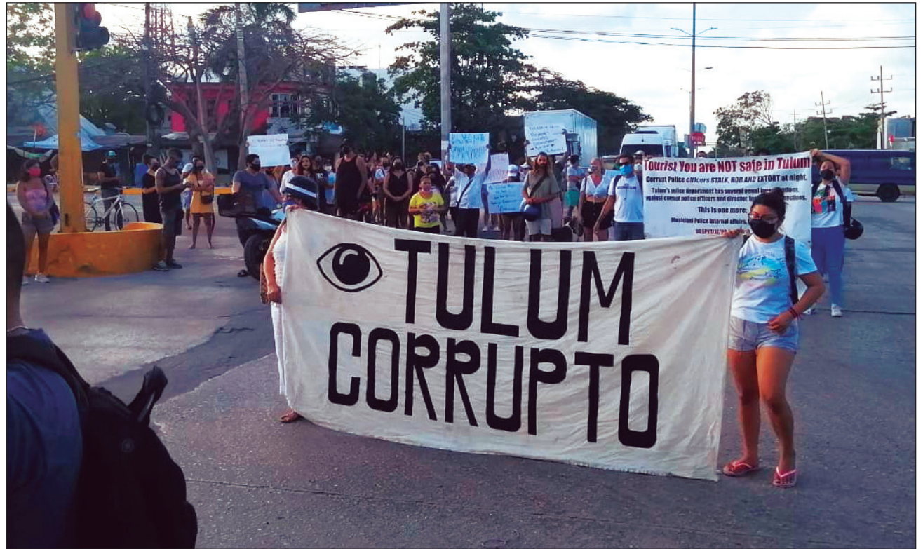
▲ Más de un centenar de personas marcharon para exigir justicia para Victoria.

Reiteró que los policías involucrados han sido separados del cargo y están bajo investigación de la Fiscalía. Destacó que dio instrucciones a las autoridades estatales y solicitó a las municipales co-