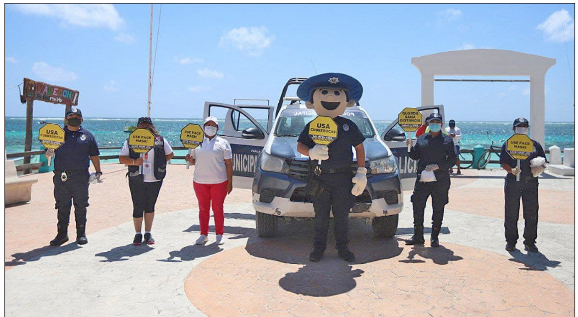
▲ Elementos de la policía, acompañados por el personaje “Polipuerto”, realizan recorridos a pie en las playas públicas, advirtiendo sobre la importancia de seguir las medidas de higiene.

“Estamos invitando a los bañistas a disfrutar del día, pero respetando las medidas de prevención, como es