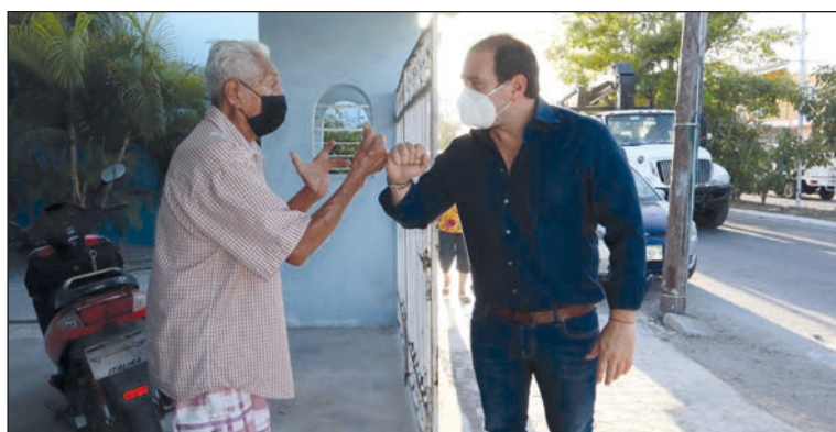
Algunos vecinos esperaban al alcalde.

Finalmente, el edil reiteró a los ciudadanos que es necesario seguir las medidas de prevención ante la actual contingencia sanitaria, asimismo agradeció la participación ciudadana y la amabilidad de los ciudadano