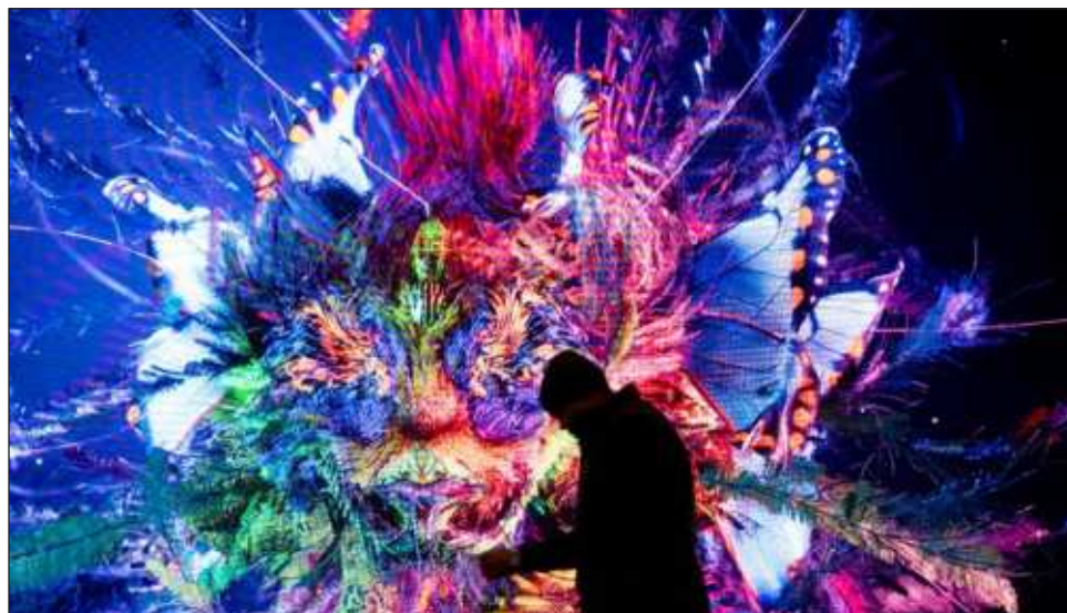
▲ Identificar la suplantación de identidad de una persona es, para cualquiera, prácticamente imposible, y el trabajo que hacen las empresas del sector está enfocado en prevenir cualquier ataque o fraude.

Los expertos en ciberseguridad consultados por este medio indican que identificar la suplantación de identidad de una persona