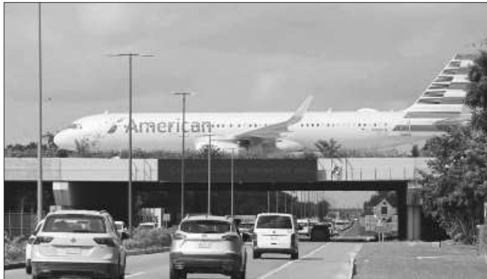
▲ La Secretaría de Gobernación puntualizó que la principal vía de internación fue la aérea, luego la terrestre y por último la marítima.

De esos casi 40 millones de personas, tanto mexicanas como extranjeras, 15 millones 860 mil 324 arribaron a Quintana Roo, un alza de 14.7 por ciento en comparación con el año anterior. Le siguen la Ciudad de México, con 7 millones 641 mil 842 personas y Jalisco, que re-