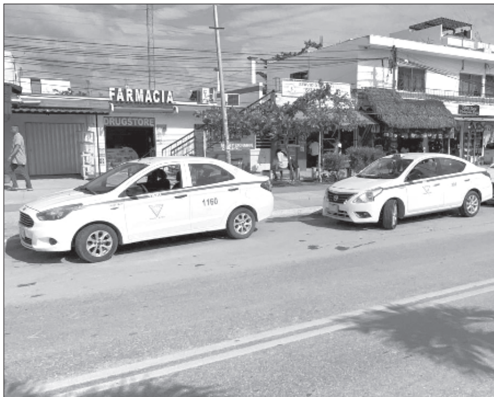
▲ Los sindicatos tienen que presentar un estudio técnico que sustente la necesidad de ampliar el número de placas, dio a conocer Rodrigo Alcázar.

Apuntó que existe mucha mala información y mal entendimiento, porque algunos trabajadores del volante lo ven como un derecho, como si hubiera la obligación del estado de entregar concesiones, cuando la realidad es que es en base de