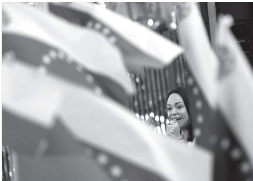
▲ La ex legisladora que busca medirse con Maduro en los comicios de 2024 arrasó en las elecciones primarias opositoras, luego de obtener más de 90% de los votos.

El gobierno venezolano ha sido crítico de la OEA, organismo que abandonó en