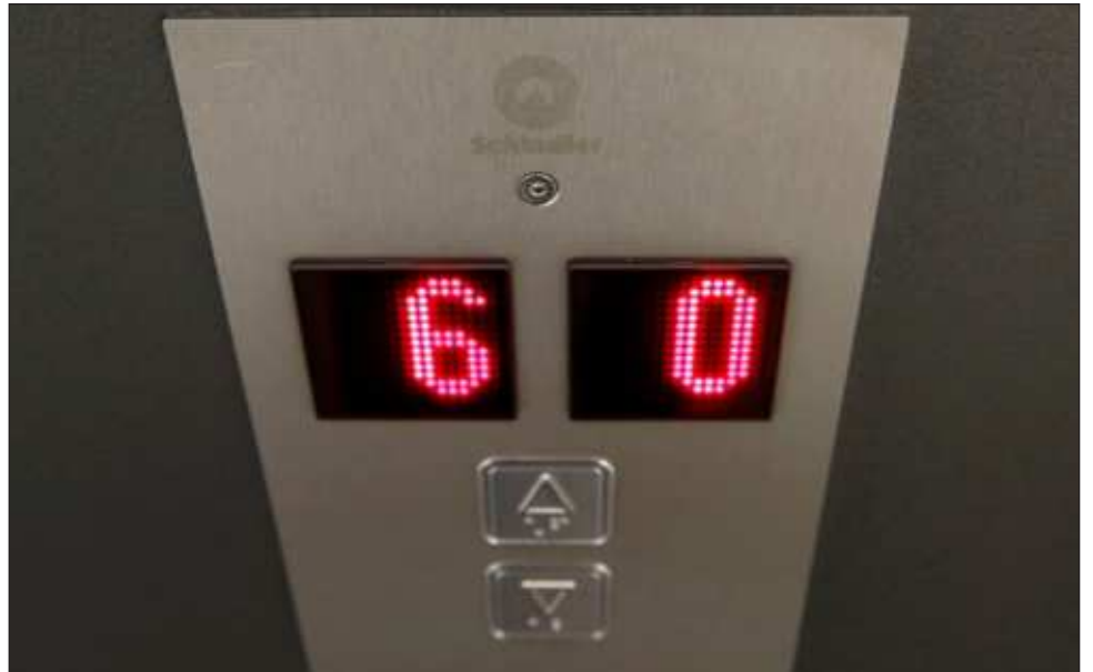
▲ La bitácoras de mantenimiento pueden incluir desde transformador hasta equipo que utilice gas y obviamente deben demostrar que los elevadores tienen un mantenimiento preventivo.

En el caso de esta institución, aclaró el director de Protección Civil, le compete directamente a la federación, quienes también deben hacer revisiones de bitácoras. “Se procedió a clausurar el elevador. Hay que mencionar también que nosotros, como ente municipal, no tenemos jurisdicción en las oficinas federales, por lo que será la Coordinación Nacional de Protección Civil y las mismas áreas de Protección Civil del IMSS los que van a determinar, pero por estar en nuestro ayuntamiento, les dejamos acta y lo clausuramos”, explicó.