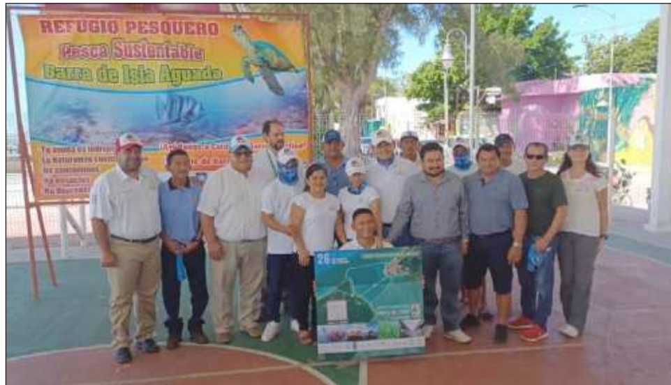
▲ El refugio pesquero consta de mil 19 hectáreas de mar que serán protegidas de las capturas con redes o de arrastre para evitar más daños a los arrecifes.

"Muchas reuniones se realizaron de forma virtual por el