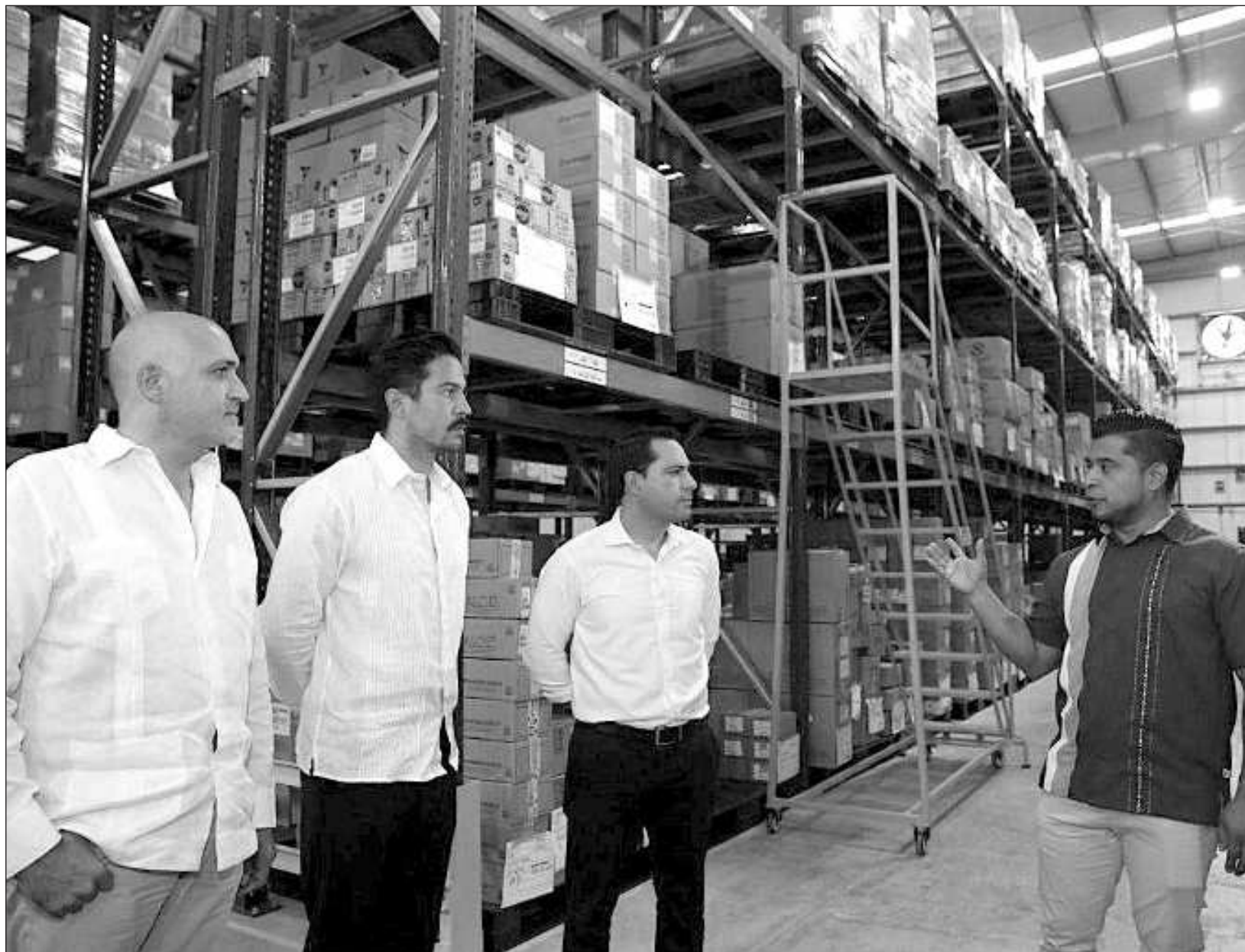
▲ De acuerdo al reporte del Inegi, el estado avanzó cuatro posiciones en el ranking nacional respecto de diciembre de 2022.