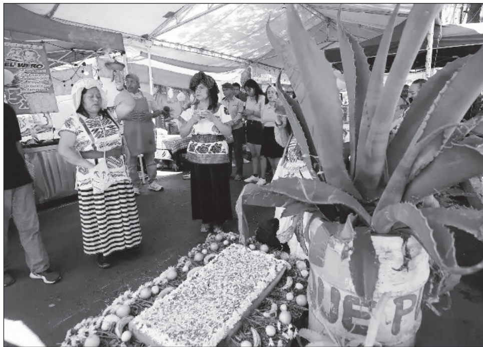
▲ El Festival Gastronómico Artesanal del Maguey es una iniciativa de los propietarios de las pulquerías La Gloria, La Reina Xóchitl y Nichos, del barrio de San Pablo, Iztapalapa.

“Es un plan de salvaguarda del maguey, el pulque y las pulquerías. Se promovió que fueran dictaminados patrimonio biocultural intangible, con lo que el pulque deja de ser consi-