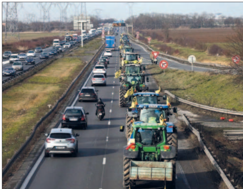
▲ Agricultores franceses presionan al gobierno para que responda a sus exigencias de una mejor remuneración por sus productos, menos trámites burocráticos y protección contra importaciones.

"¿Qué es lo más importante?", exclamaron. "¿El arte, o el derecho a una comida sana y sostenible?"