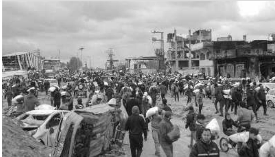
▲ Catar, Egipto y Estados Unidos ya intervinieron en la negociación de un cese el fuego que permitió la liberación de un centenar de rehenes a cambio de presos palestinos a finales de noviembre.

La guerra comenzó cuando el grupo islamista atacó el sur de Israel el 7 de