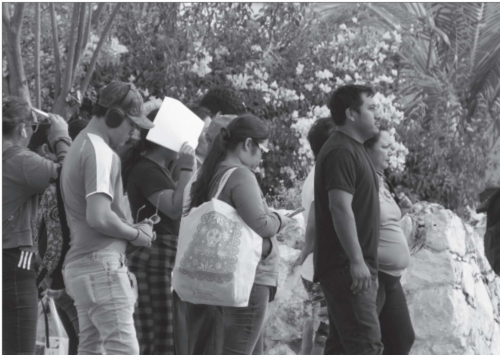
▲ "La tesis de que la pobreza tiene su origen en la holgazanería de los individuos no puede sostenerse desde ninguna perspectiva económica ni sociológica seria y rigurosa; este discurso oculta una especie de ardid semántico en que se confunde la individualidad con el individualismo".