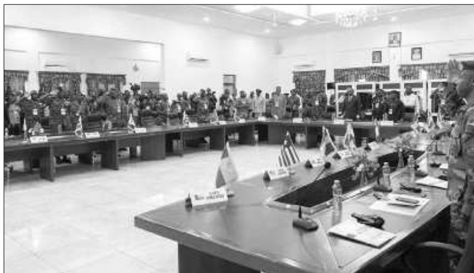
▲ En partes de África, la CEDEAO está perdiendo eficacia y respaldo entre la población, y muchos consideran que solo sirve a los intereses de las élites y no de las masas.

“La CEDEAO, bajo la influencia de potencias extranjeras, ha traicionado sus prin-