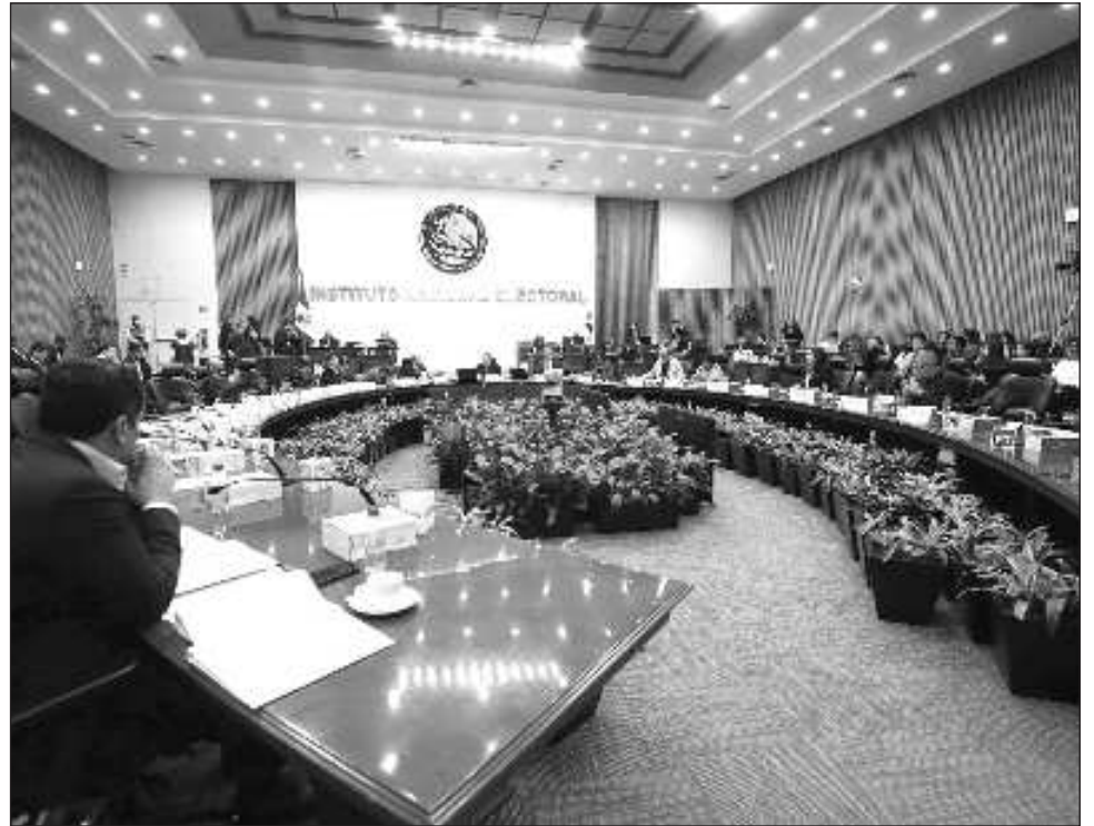
▲ El tema de las quejas presentadas y su atención tiene relevancia si se considera que una causal de anulación de registro de alguna candidatura es precisamente la confirmación del acto anticipado de campaña, si así lo ratificara el TEPJF.

También alude al carácter institucional de la propaganda de instancias