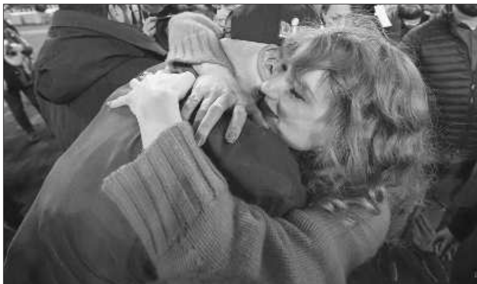
▲ Taylor Swift, con su novio, el ala cerrada, Travis Kelce, héroe de la victoria de los Jefes.

Kelce atrapó 11 pases para 116 yardas, y un touchdown, y ahora la gran pregunta rumbo al "Super