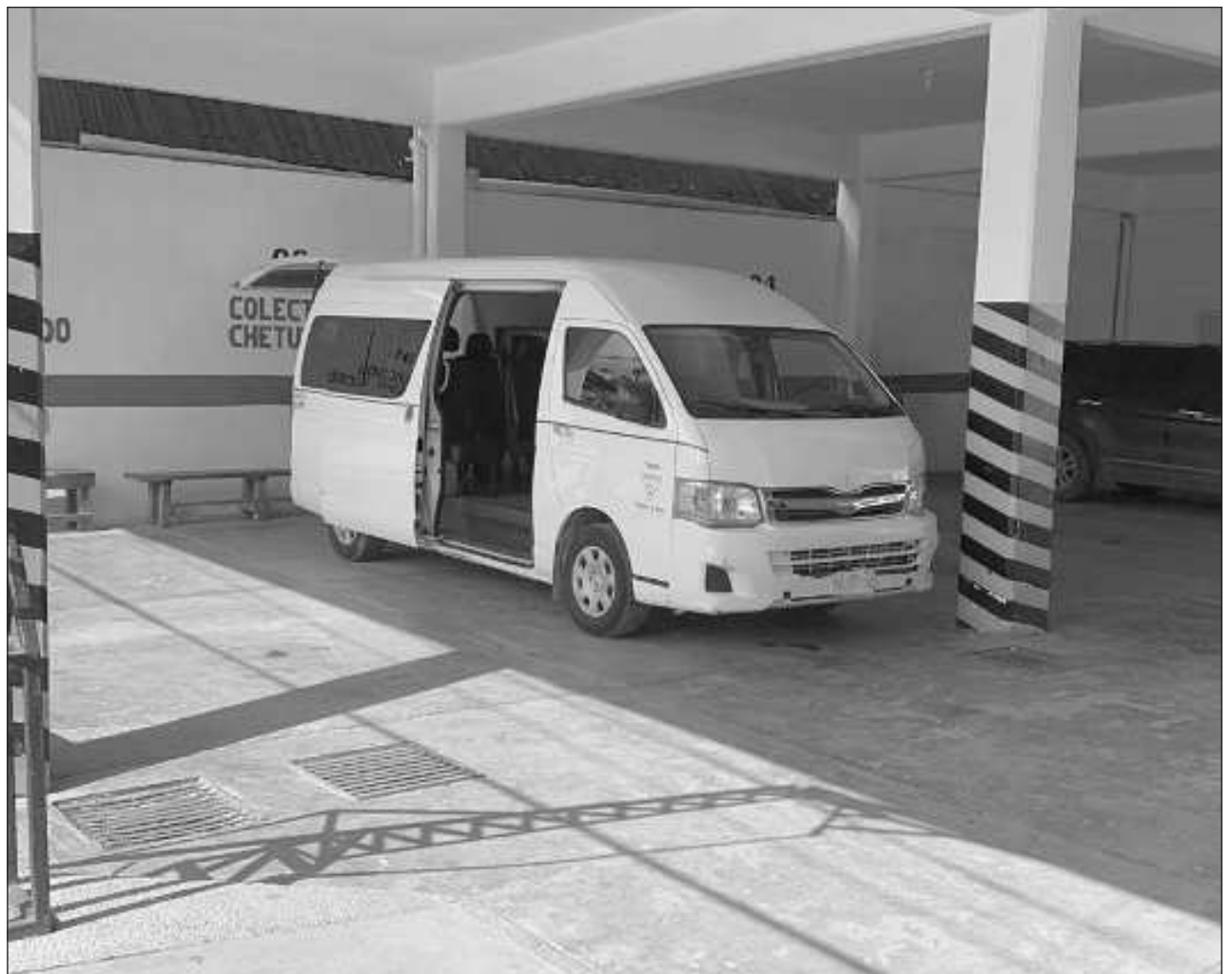
▲ El punto de salida de esta nueva ruta será las instalaciones del gremio, ubicadas en el centro de la ciudad.

Cabe mencionar que de Tulum a la entrada principal del Aeropuerto Internacional Felipe Carrillo Puerto son aproximadamente 28 kilómetros, adicional a los 13 kilómetros de distancia del acceso sobre la carretera 307 hacia las salas de abordaje, trayecto que se hace en un tiempo aproximado de entre 30 y 40 minutos.