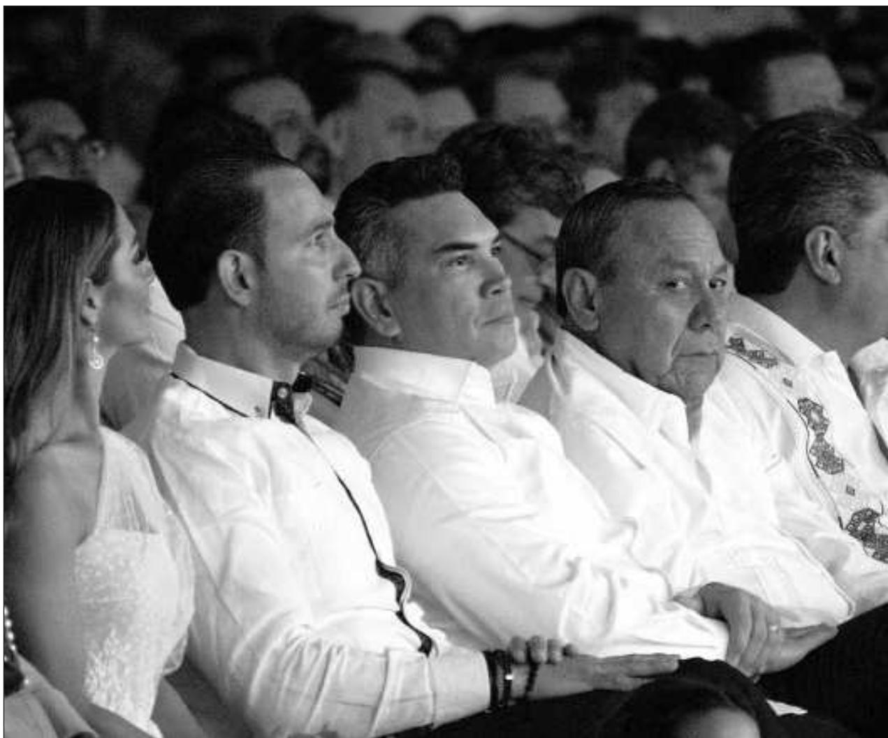
▲ Mario Delgado, líder nacional de Morena, destacó que la "bandera ciudadana que utiliza la candidata del PRIAN es una mentira, pues las listas plurinominales de la derecha representan el pasado de corrupción (...) sus partidos no representan nada".