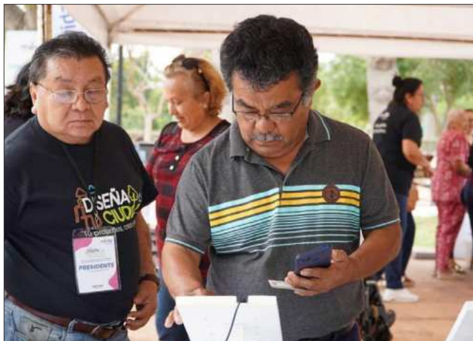
▲ Los habitantes eligieron este domingo los proyectos ciudadanos de mejoras en parques y áreas deportivas en los cuatro puntos cardinales de Mérida.