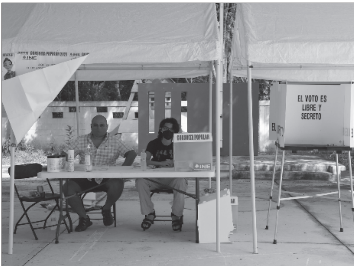
▲ "Es bien sabido que nuestro sistema político mexicano tiene patrones culturales específicos que urge cambiar. Modificar la 'servidumbre voluntaria' implica mayor intervención ciudadana en las relaciones de poder".

SEÑALAR A LA política pública como la mera acción aislada y vertical de un ente llamado gobierno habla en sí mismo de una cultura política implícita. Tener políticas verdaderamente públicas, implica una cultura política en la que los imaginarios, valores, símbolos, etcétera, reformulen las relaciones de poder entre dominantes y dominados. De este modo podemos dar cuenta que tanto las políticas auténticamente públicas en su interrelación con la cultura política, reformulan y condicionan los patrones de conducta de una realidad social específica.