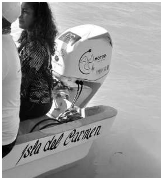
▲ Un refugio pesquero y un motor eléctrico fuera de borda marcan el derrotero para una estrategia novedosa y amigable para el aprovechamiento de especies marinas y el ecoturismo.

En Tabasco, Yucatán y Quintana Roo, las pesquerías se encuentran más o menos reguladas, aunque las zonas protegidas son más bien la excepción. El parque nacional Arrecife Alacranes es el área