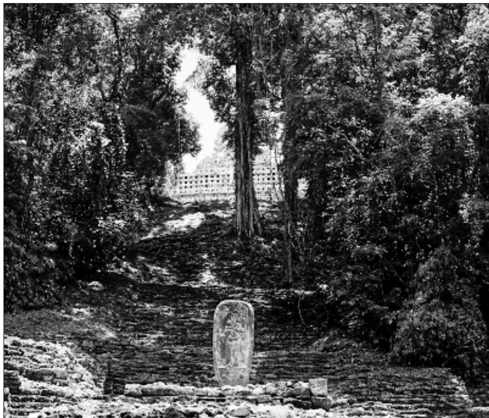
▲ A causa de la presencia de cárteles , los habitantes de Frontera Corozal anunciaron que no dejarían pasar gente extraña y que se suspendían las operaciones turísticas.

Castellanos expresó que a la zona arqueológica de Yaxchilán, situada también