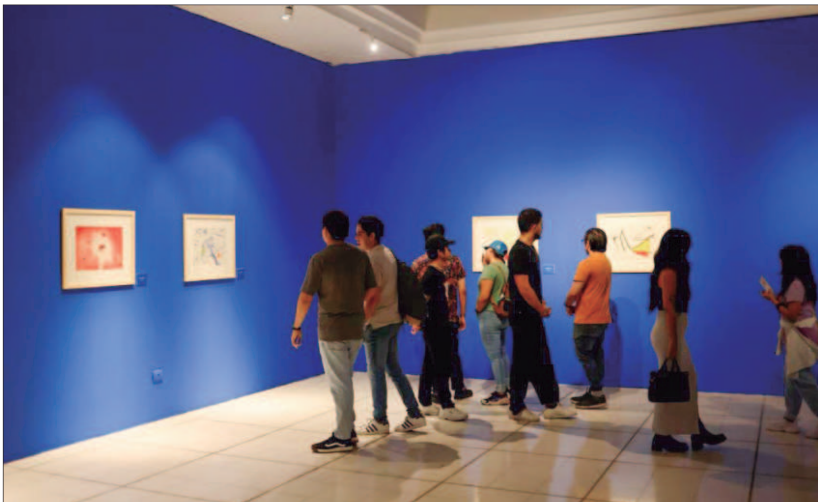
▲ La muestra, en la que se espera la visita de 20 mil personas, permite ver la evolución del arte gráfico creado en el siglo pasado.