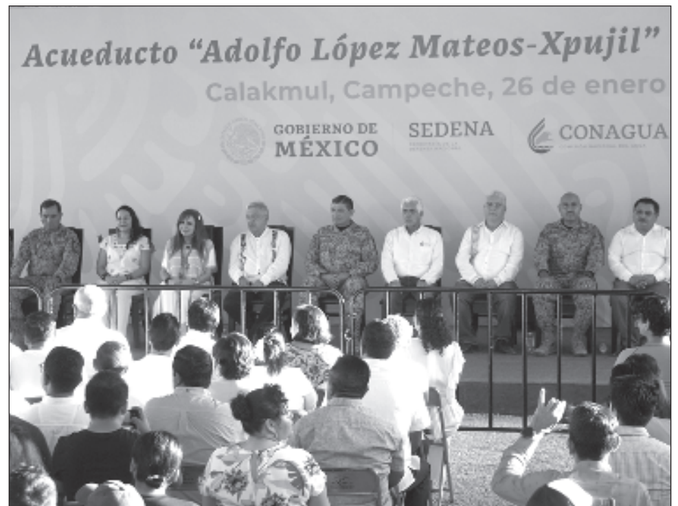
▲ El acueducto Adolfo López Mateos-Xpujil permitirá el suministro de 230 litros de agua por segundo, en beneficio de más de 71 mil habitantes de la región.

Los tanques están llenos, se está bombeando, pero las tuberías de distribución estuvieron obsoletas por mucho tiempo y van a tener muchas fugas, por ello se hace necesario cambiarlas ante una población creciente de más de 70 mil habitantes, pero sí se resolvió el problema del agua, y agradezco a quienes