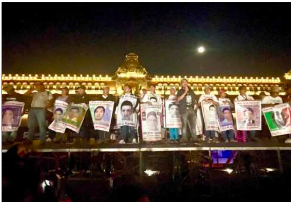
▲ En una breve referencia a las críticas de los familiares de los 43, López Obrador aseguró que para su gobierno lo más importante es saber dónde están los jóvenes.

"Todavía me queda un año y vamos a dedicarnos. Lo estamos haciendo, no hemos abandonado el caso. Es por los padres, por la justicia y por nuestros principios".