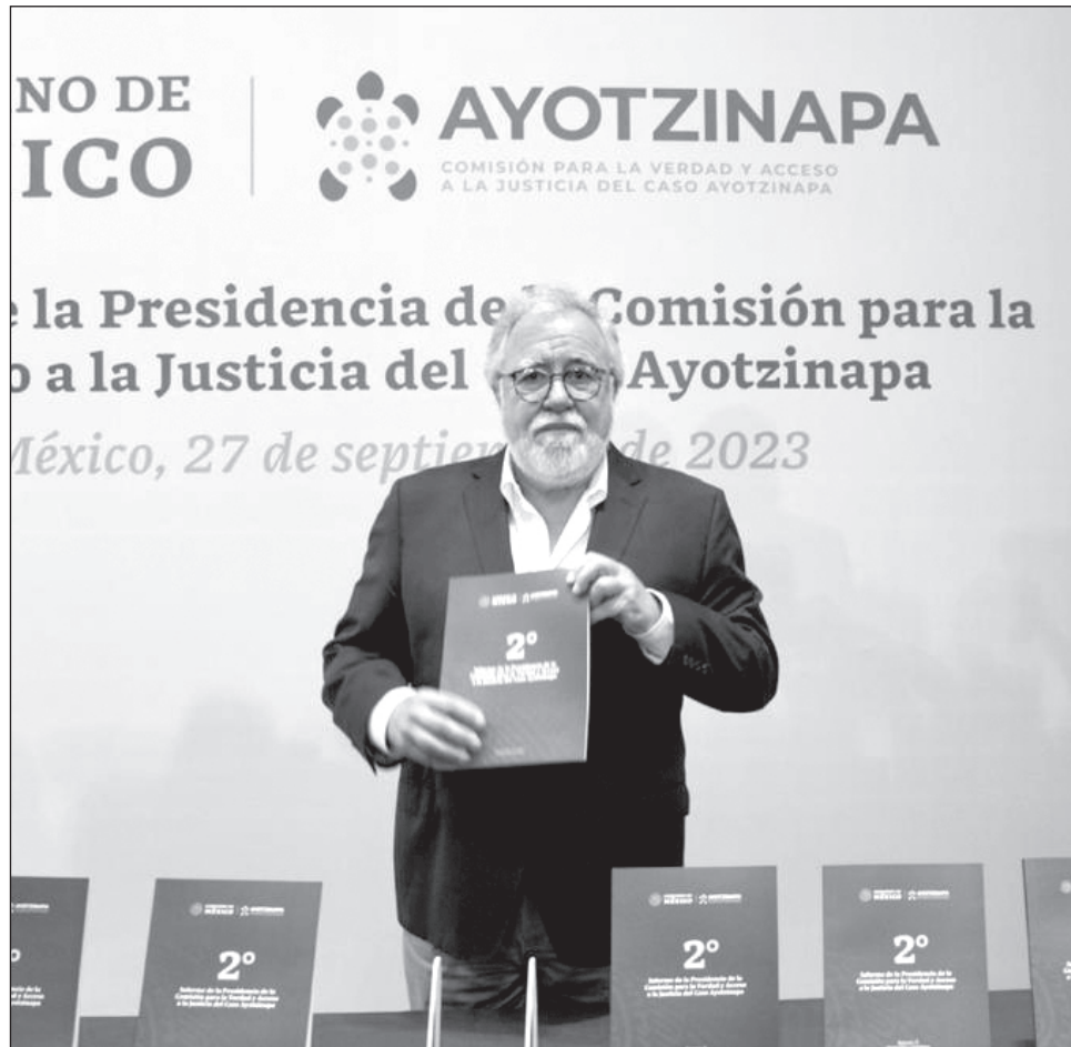
▲ El subsecretario de DH de la Secretaría de Gobernación presentó ayer el segundo informe de la Comisión para la Verdad y el Acceso a la Justicia del Caso Ayotzinapa.

A pregunta expresa sobre la intención del ex jefe de la Secretaría de Seguri-