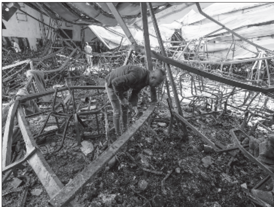
▲ Las autoridades señalaron que la presencia de materiales inflamables contribuyó al desastre, que dio inicio cuando los recién casados comenzaban su baile.

Esta misma estrategia, pero a mucha más escala, pretenden aplicar México y Estados Unidos ante la crisis en su frontera.