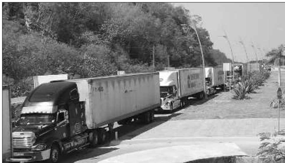
▲ Esta disposición es parte de las normas adoptadas en gran parte del país y que en Ciudad del Carmen se estará aplicando para mejorar el tráfico vehicular, detallaron autoridades.

El incumplimiento de la norma se sancionará conforme al artículo 171 del Reglamento de Seguridad Pú-