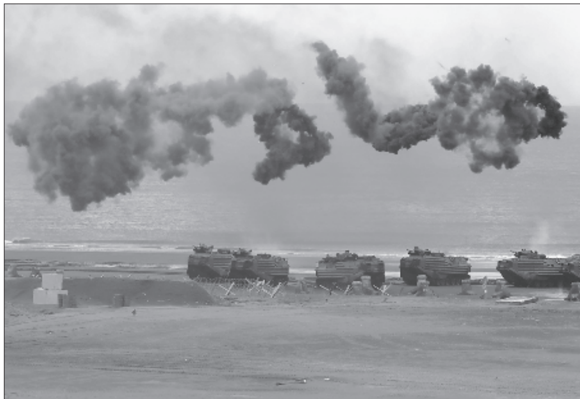
▲ "The state of the globe is fragile and getting more unstable. Let us hope that somewhere some leaders are learning from history and will make it their mission to avoid the slippery slope that could lead to a global calamity. World War I began with a series of accidents that led to global conflict."

GIVEN THE NUCLEAR capability of many nations, the consequences of a third world war would be catastrophic, surpassing the devastation witnessed in previous conflicts. The use of nuclear weapons,