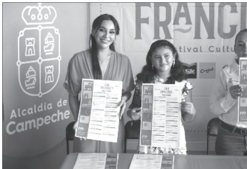
▲ La apertura formal de la feria será el próximo miércoles 4 de octubre, contando con la participación del grupo Tropicalísimo, además de distintas actividades culturales, recreativas y deportivas durante los días siguientes.