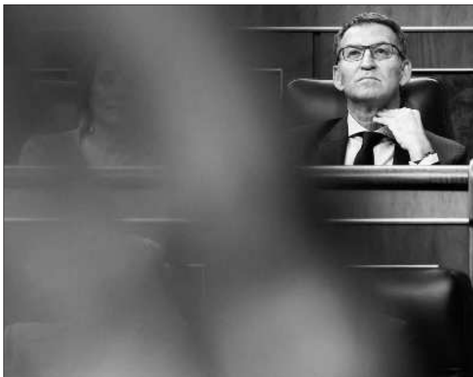
▲ Los 178 votos en contra de Alberto Núñez Feijóo cerraron el paso al que hubiera sido el primer gobierno de coalición de la derecha con la extrema derecha de Vox.

Alberto Núñez Feijóo, líder del derechista Partido Popular (PP), perdió de forma inequívoca en la primera votación de su investidura como presidente del gobierno, con 178 votos en contra frente a los 172 a favor. El conjunto del bloque progresista más las dos formaciones nacionalistas de derechas -el Partido Nacionalista Vasco (PNV) y Junts per Catalunya (JxCat)- cerraron el paso a un posible gobierno de coalición entre el PP y la extrema derecha de Vox, su principal aliado, al tiempo que se abre la puerta a una futura investidura de reelección del actual presidente del gobierno en funciones, el socialista Pedro Sánchez, quien durante el debate parlamentario se ha mantenido en silencio y sin explicar sus potenciales acuerdos con el separatismo