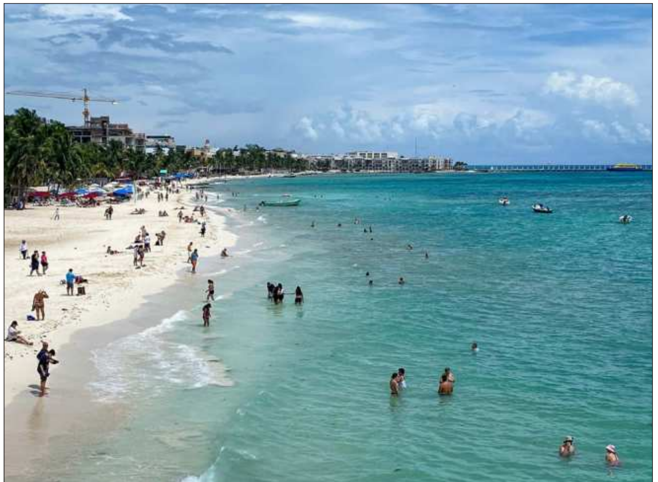
▲ La afluencia de turistas al Caribe Mexicano registró un aumento de 13.7% con respecto al año pasado.