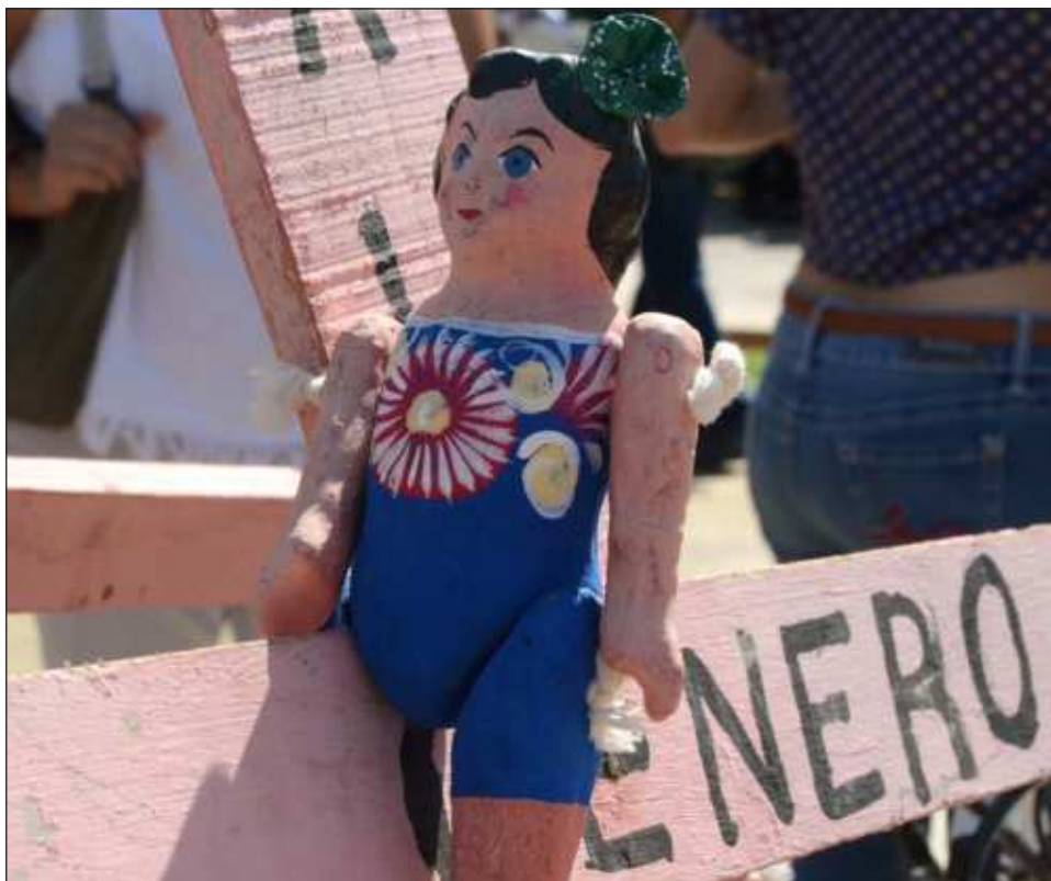
▲ Las colonias que en agosto registraron mayor incidencia de violencia de género fueron Centro, Morelos y la Manigua, siendo esta última, junto con la 23 de julio, las que acumulan más casos.

Explicó que ante esta situación, se propone el de-