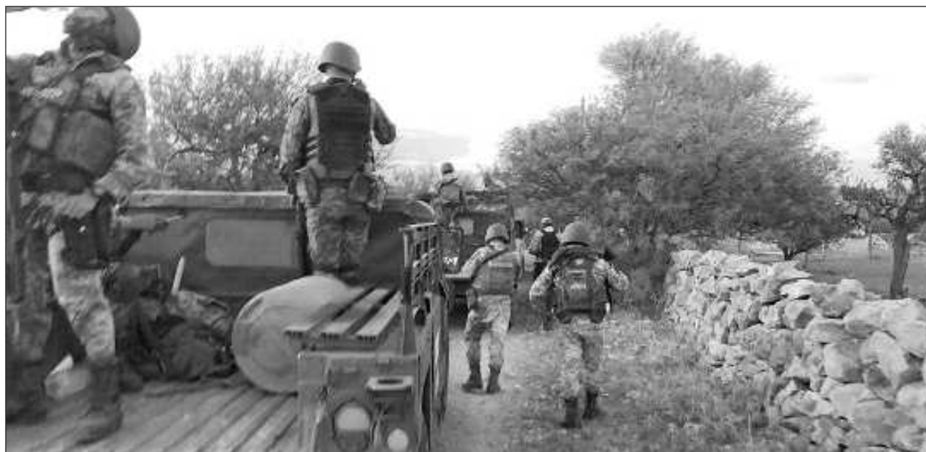
▲ La mañana de este miércoles los padres de los siete desaparecidos, junto con otros de sus familiares, habían reanudado el bloqueo carretero, donde policías y militares mantienen vigilancia permanente.