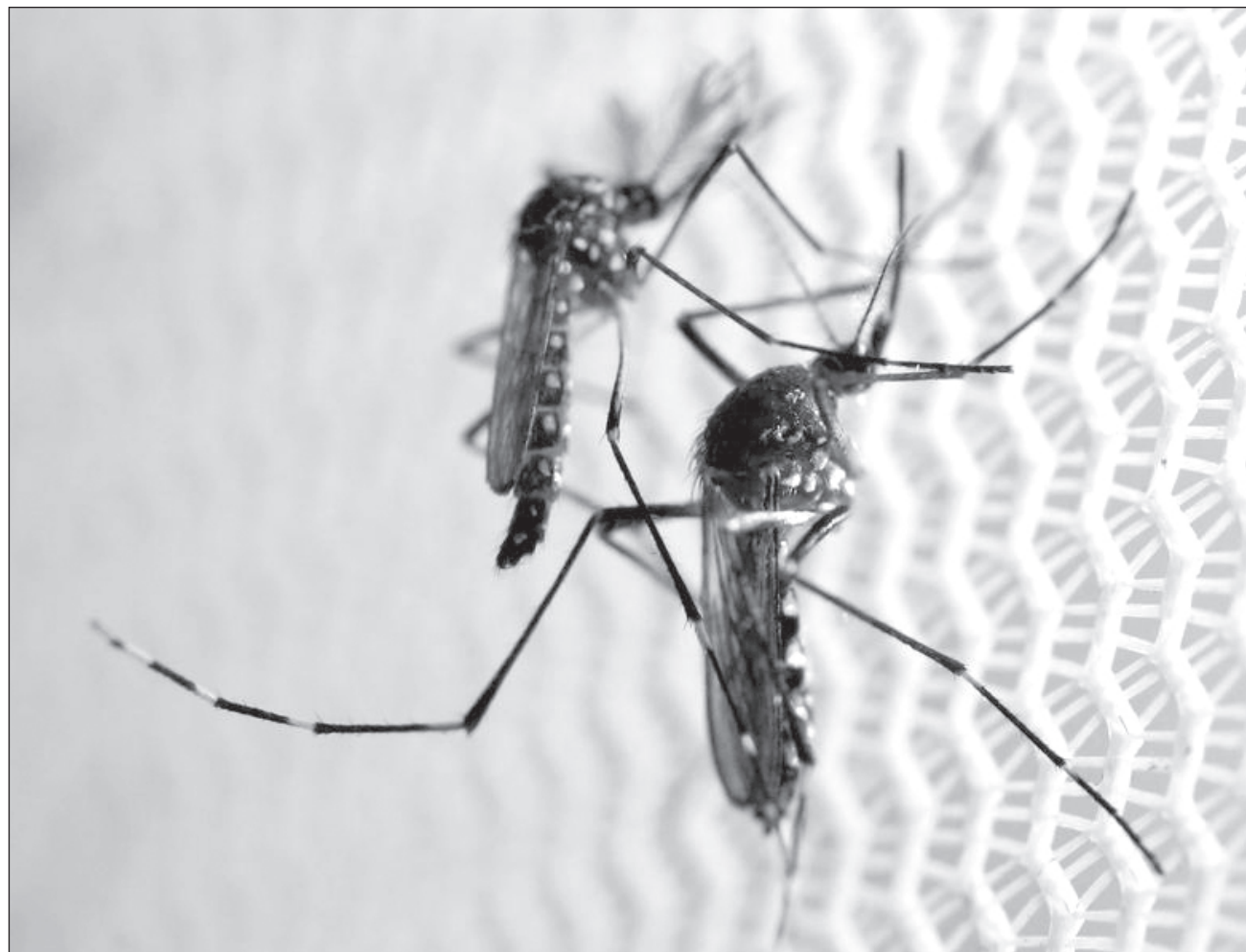
▲ La mayoría de los casos documentados por el sector salud corresponden a Dengue con Signos de Alarma (DCSA).

El documento de la Secretaría de Salud federal detalla