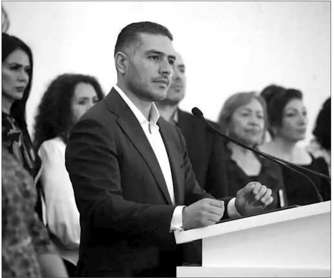
▲ El aspirante a coordinar los trabajos de la 4T en CDMX sostiene que su participación en las reuniones señaladas por el subsecretario de Derechos Humanos de Gobernación, Alejandro Encinas, fue para hallar a los jóvenes.

El organismo nacional exhortó una vez más a los integrantes del GIEI y de la CIDH para que le entreguen los documentos con los que hayan trabajado, así como los cuestionamientos que indican no haber sido solventados por el Gobierno Federal, para que, "desde nuestro ámbito, y en cumplimiento de los mandatos constitucionales, se continúen con los trabajos de investigación y esclarecimiento" de la desaparición forzada de los estudiantes el 26 de septiembre de 2014.