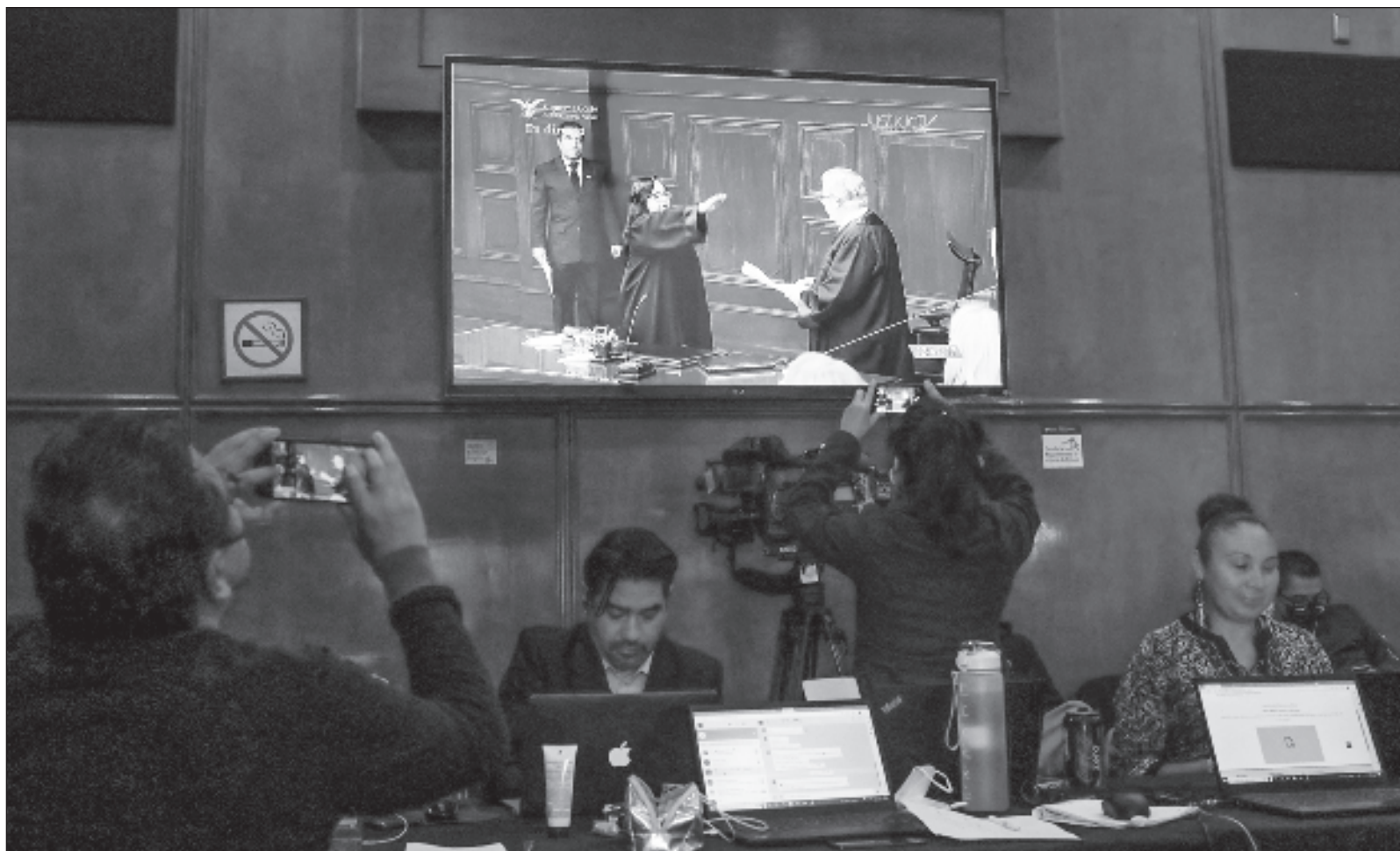
▲ "Ha quedado claro que con el arribo de la magistrada Piña a la presidencia de la SCJN, se ulceró la relación institucional entre poderes".