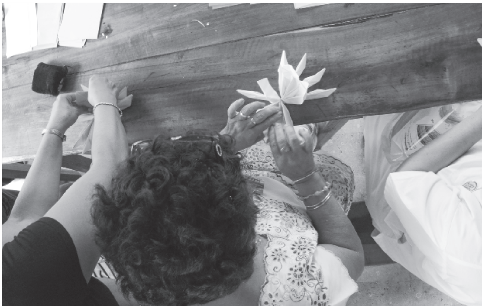
▲ “Más que formar artistas, que es lo menos importante, el programa Taller Itinerante de Arte Chúunpajal siempre buscó contribuir en la formación integral de niños y jóvenes, que les permitiera ser más humanos y mejores ciudadanos, más sensibles y más creativos en la vida”.