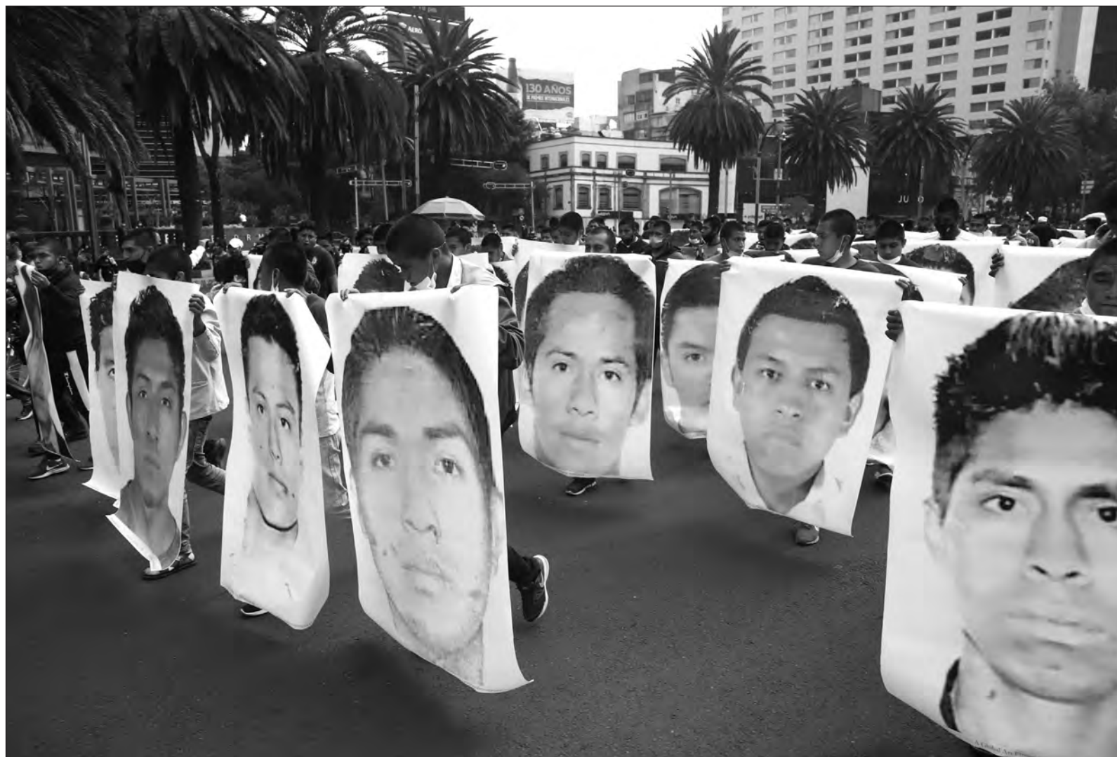
▲ Este sábado, la capital del país fue escenario de nueva manifestación por la desaparición de 43 estudiantes de la normal de Ayotzinapa.

se trata nada más de los efectos del narco-estado implantado décadas atrás, ni de un incidente circunstancial por la conjugación de la mala fortuna, las acciones perpetradas con alevosa organización responden a la planificación perversa de las estructuras sistémicas gobernadas por seres creyentes de su inagotable impunidad, aquellos que forman parte de la “verdad histórica”, ya sea por qué efectuaron los actos o los plañeron, ya sea por qué los encubrieron y divulgaron las mentiras convenientes para asegurar el crimen y su olvido, todos esos seres carentes de la mínima peculiaridad humana, serán condenados tarde o temprano por la historia y la verdad que abra de surgir de la misma perseverancia que aún sostiene el grito por la justicia y la aparición de los 43. Sin importar el paso del tiempo, superando los seis años de dolor y ausencia, Ayotzinapa sigue siendo esperanza y ejemplo.