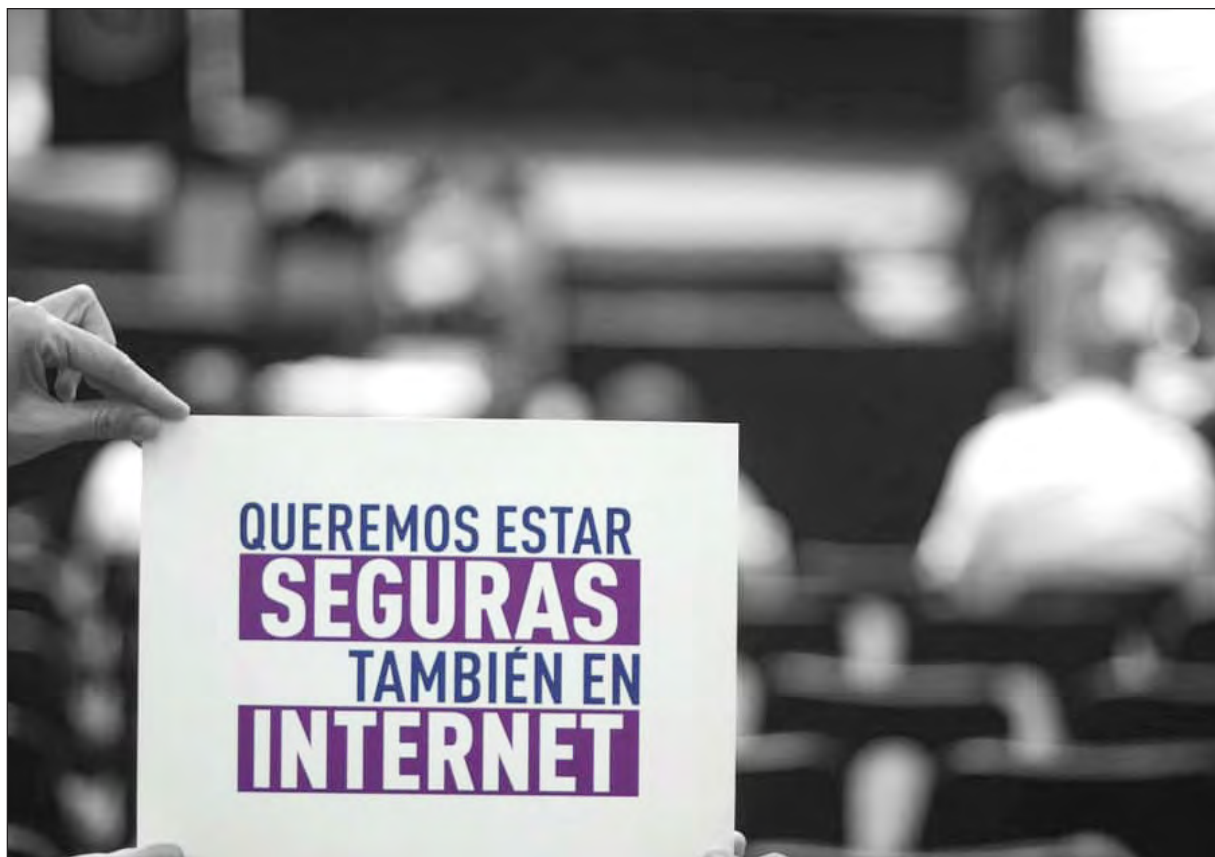
▲ Hemos aprendido a saber cuándo replegarnos frente a cierto acoso, no contestarles, incrementar nuestra seguridad digital; tenemos distintas estrategias para protegernos.

“Llevamos esta lucha desde antes que iniciaran las redes sociales y ahora ellas nos ayudan a visibilizar la importancia de adquirir este derecho