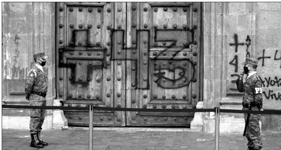
▲ Luego de seis años de la desaparición de los normalistas de Ayotzinapa, continúan las indagatorias para esclarecer el caso pero también las manifestaciones por parte de los familiares.

La evidencia recabada también revela que la diligencia en la que se encontraron fragmentos óseos en el río Cocula en octubre de 2014 -inspección fundamental en la teoría del caso que sostiene que los normalistas fueron incinerados en el basurero de Cocula, sus restos triturados, metidos en bolsas y luego arrojados a la corriente de ese afluente- fue un montaje en el que la agente del Ministerio Público encargada de dar fe de