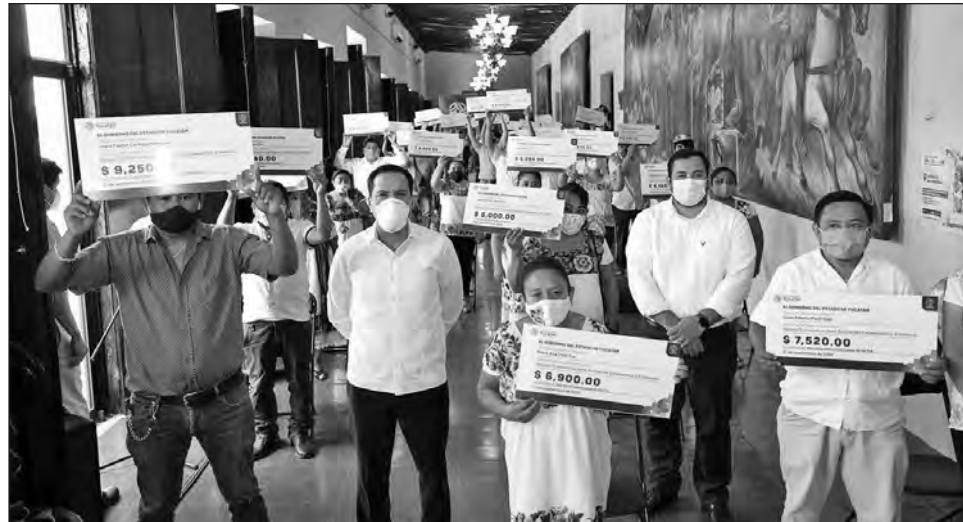
▲ Los beneficiarios se dedican a la fabricación de calzado, artículos de madera, accesorios, decoraciones y ropa típica.

les en los que nos sostuvimos gracias a la ayuda del gobierno del estado con las despensas, para poder quedarnos en casa y cuidar de nuestra salud, pero ahora que recibimos este apoyo, pues nos ayuda mucho porque nos quedamos sin capital, pero ahora ya tenemos para obtener materiales para elaborar nuestras artesanías", expresó la mujer, quien añadió que usará el dinero para comprar telas, hilos y materiales para sus creaciones.