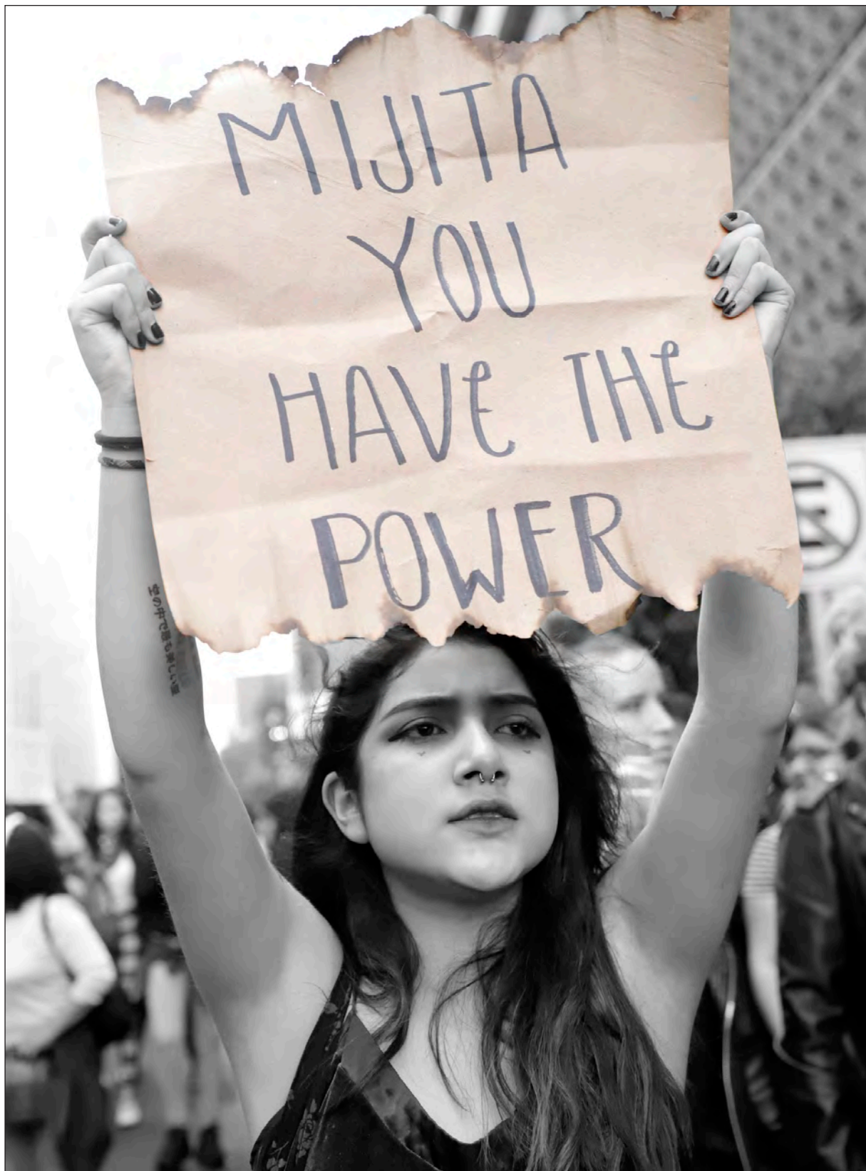
▲ Entre el 26 y 28 de septiembre Colectivas feministas de Yucatán organizan el “Pañuelazo virtual: 28S, por el derecho a decidir”.

El lunes 28 a las 18 horas, las asistentes leerán poesía y habrá la plática “Y tú, ¿cómo habitas internet?”, y a las 19 horas se llevará a cabo la mesa “Criminalización del aborto”.