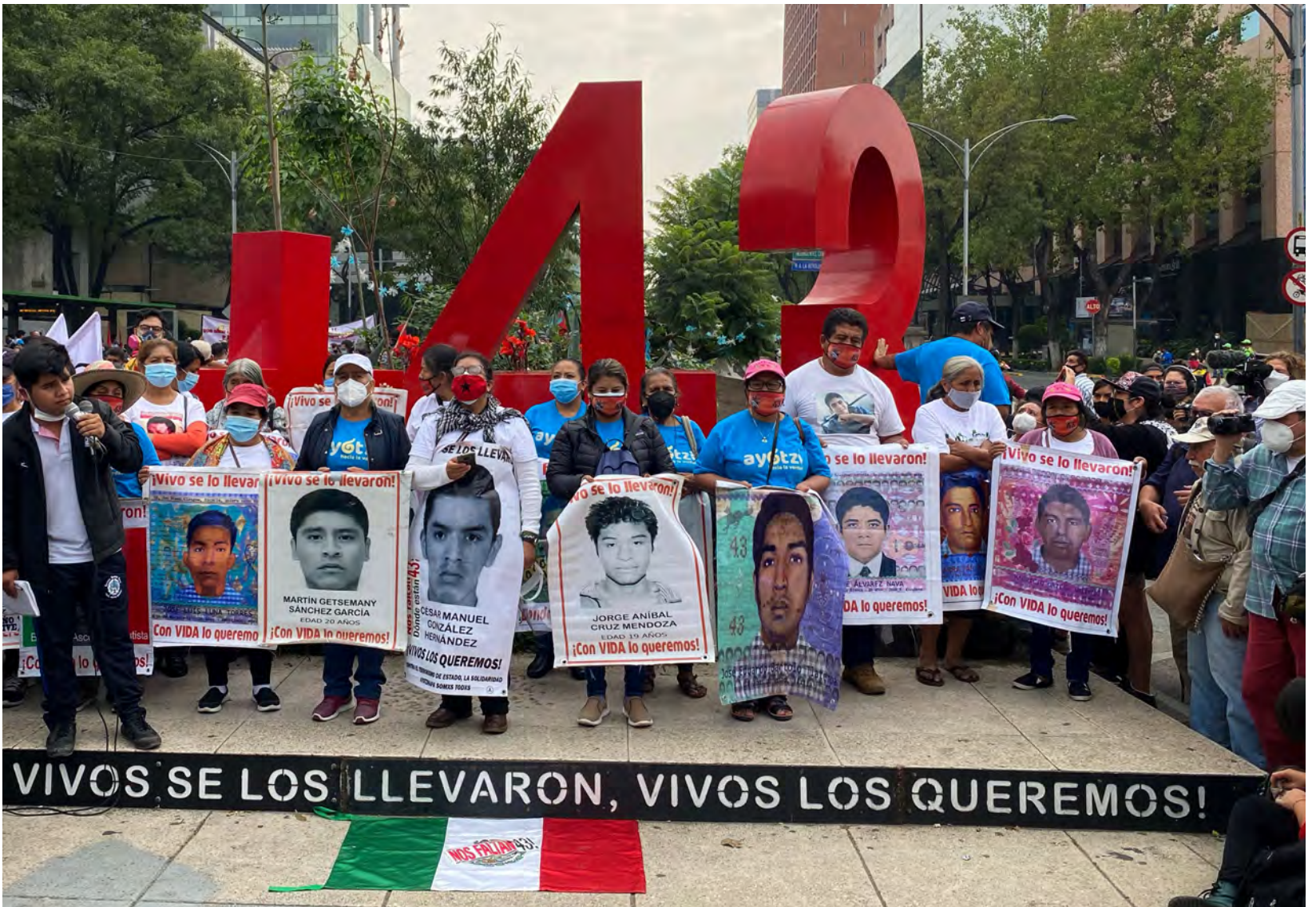
Marcha conmemorativa por el sexto aniversario de la desaparición forzada de los normalistas de Ayotzinapa.