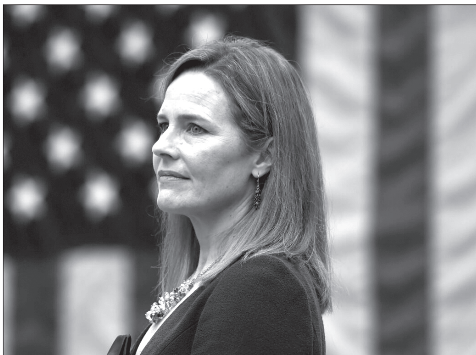
▲ Barret, de 48 años, es una jueza federal nacida en Indiana y conocida por sus opiniones católicas, conservadoras y antiabortistas.