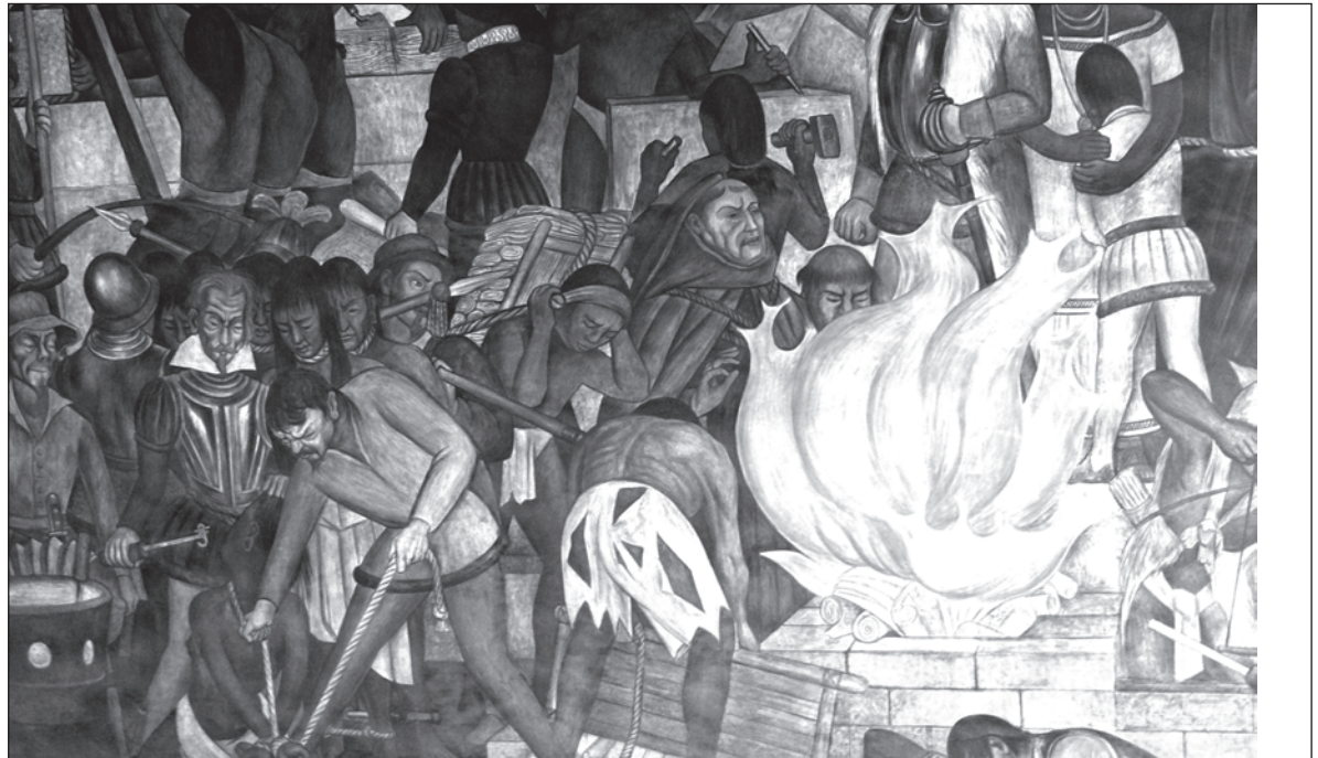
▲ Desde el Auto de Fe de Maní comenzó un transitar muy largo hacia el replanteamiento y (re)construcción de la literatura maya. Foto Mural de Diego Rivera (detalle)

La suma de esos esfuerzos puso en el mapa otras piezas para construir la literatura maya contemporánea pues -por ejemplo- en 2008 se creó la Escuela de Creación Literaria en Lengua Maya, en el Centro Estatal de Bellas Artes, de donde han salido varias generaciones de escritores mayas. Mientras que, como antecedente, hubo otra generación formada de manera autodidacta y se abrió paso con propuestas que nacieron de la revisión de letras y documentos históricos, aunado al tra-