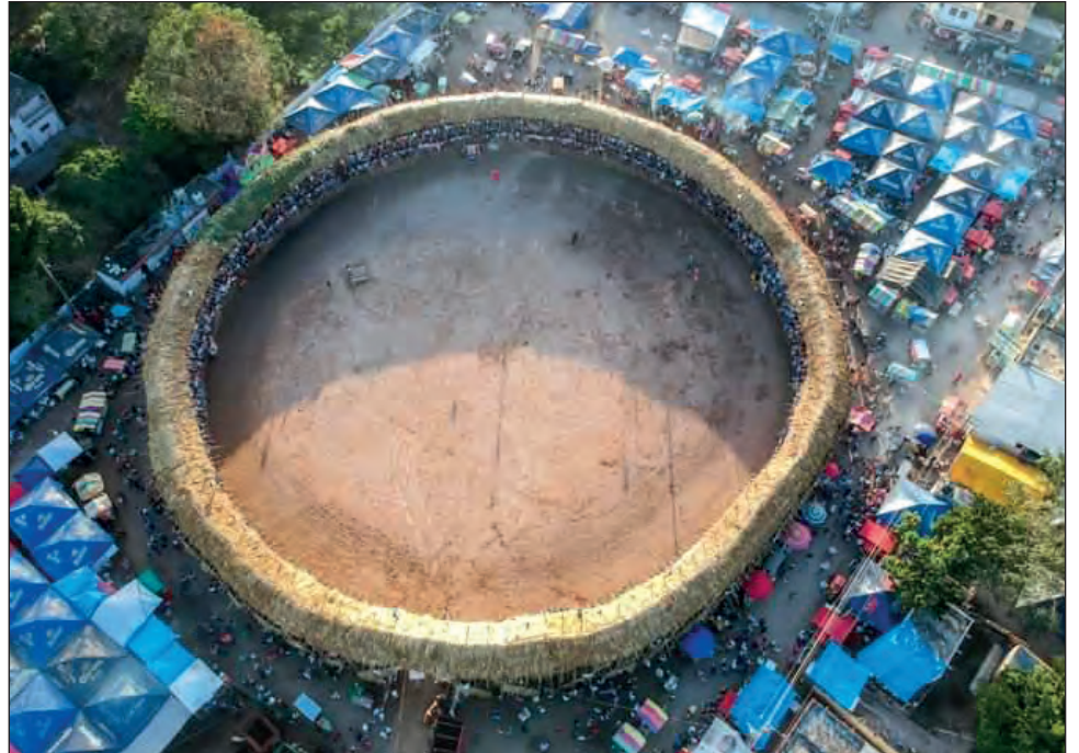
▲ Los llamados palqueros tienen 15 días para armar la estructura efímera de madera, labor que repiten año con año.

Sandra explica que en su mayoría los palqueros son gente humilde pero aman lo que hacen y, además, deja una buena derrama económica; mucha gente depende