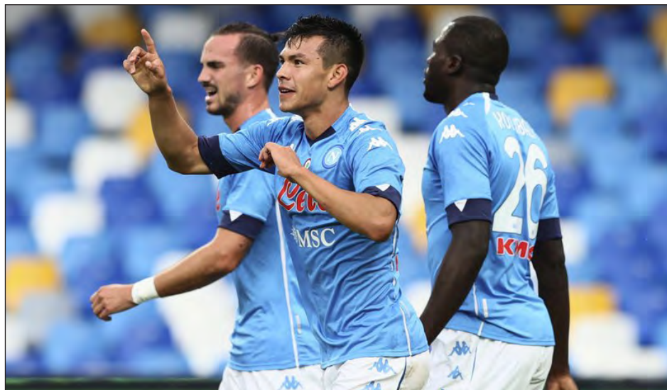
▲ Hirving Lozano se lució en la goleada del Napoli.

Juventus quedó con 10 a los 62 por la segunda ama-