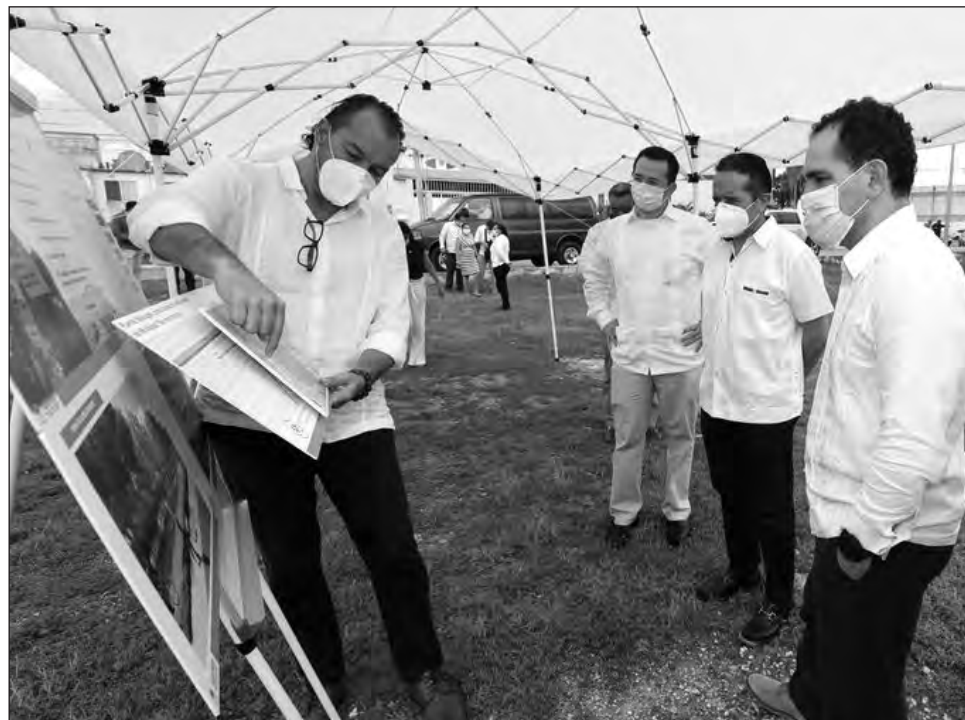
▲ El secretario de Hacienda, Arturo Herrera, conoció los proyectos del puente Nichupté y el Parque de la Equidad.

“No basta que proveamos recursos, estas giras nos sirven para entender la problemática específica”, dijo Herrera Gutiérrez y destacó que con la pandemia los estados que más sufrieron son los que tienen al turismo como su actividad primordial: “Ningún estado tuvo un impacto tan grande como Quintana Roo”.