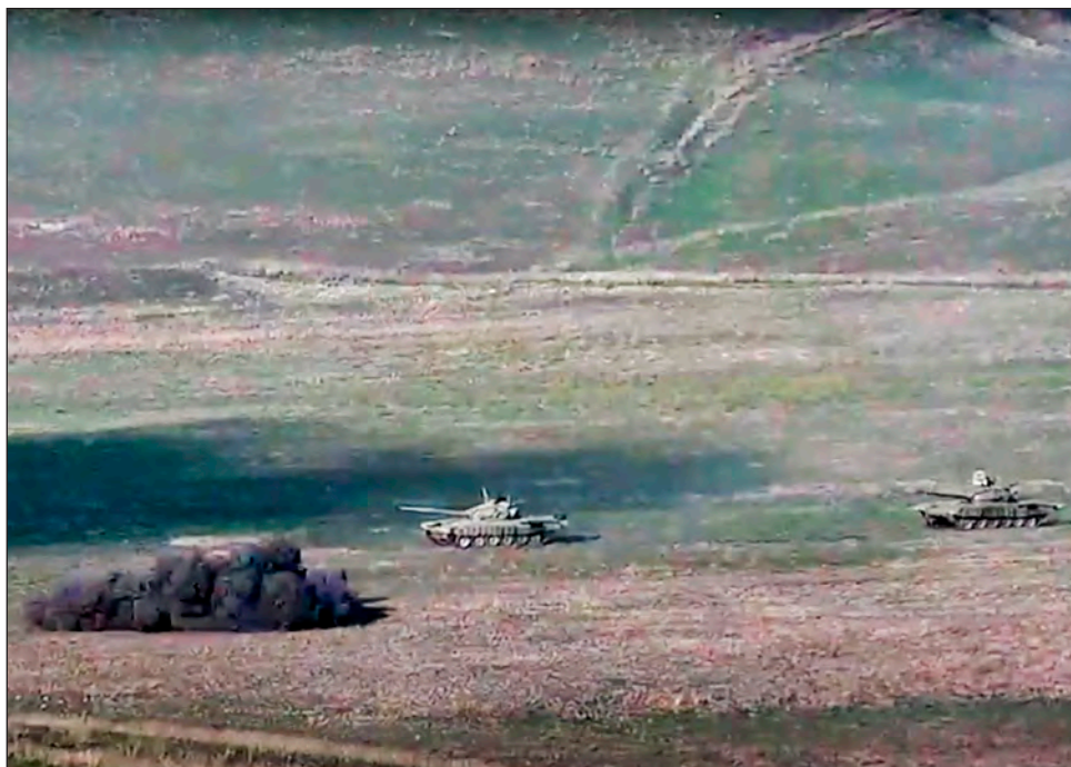
▲ El Ministerio de Defensa de Azerbaiyán aseguró que el conflicto fronterizo reinició tras un intenso ataque armenio contra posiciones del ejército azerí.

Aliyev finalizó su discurso asegurando que el gobierno de Armenia planea ocupar más territorios azeríes y denunció la "agresión" en Nagorno-Karabaj como una forma de dis-