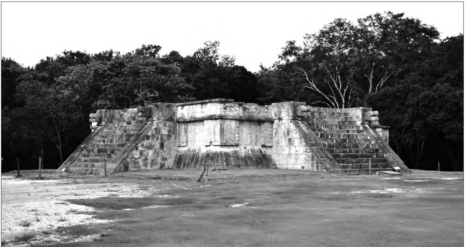
▲ En Chichén Itzá, Venus fue representado precisamente en la plataforma que lleva su nombre.

VENUS TUVO UN papel muy importante en las antiguas culturas y al parecer lo tendrá ahora para nosotros si se confirma lo descubierto por los científicos recientemente.