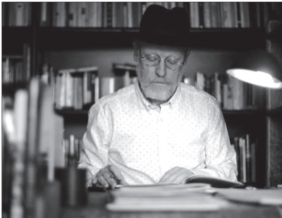
▲ Algunos de los poemas en lenguas originarias se publicaron en Hojarasca , suplemento de La Jornada coordinado por Hermann Bellinghausen.

Una literatura indígena que se desarrolló también a partir de las vindicaciones de los grupos originarios a partir de la conmemoración de los 500 años del descubrimiento