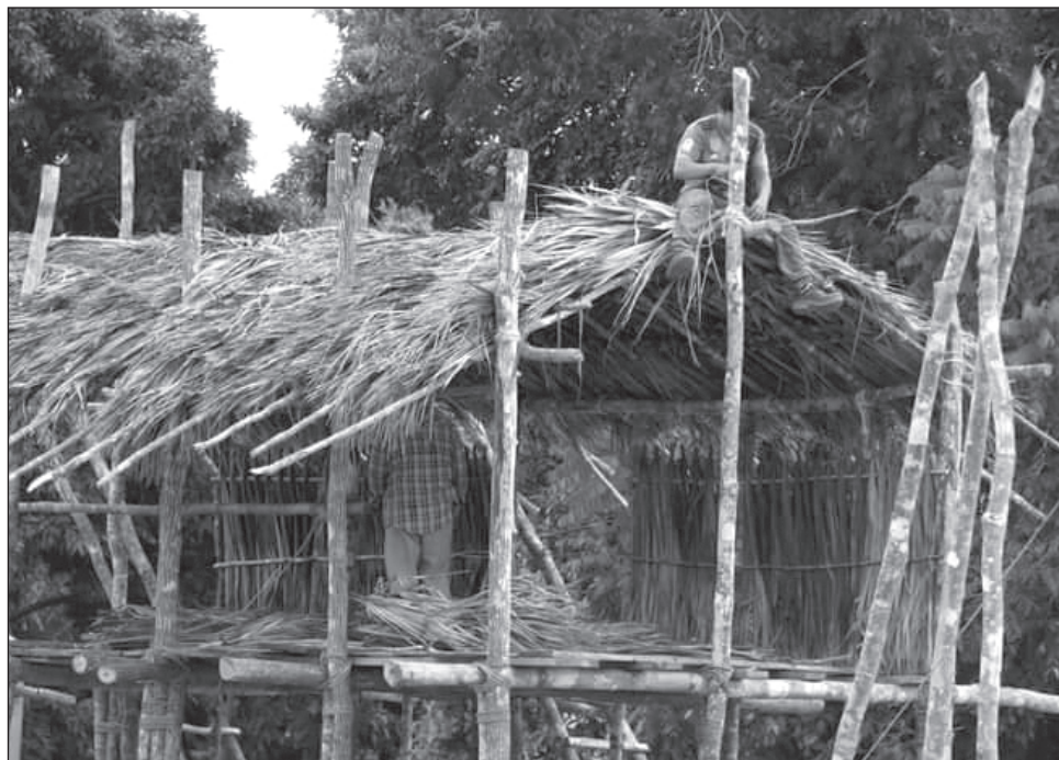
▲ El Coso Taurino de Tizimín se levanta una vez al año como preámbulo de la fiesta patronal de los Santos Reyes.