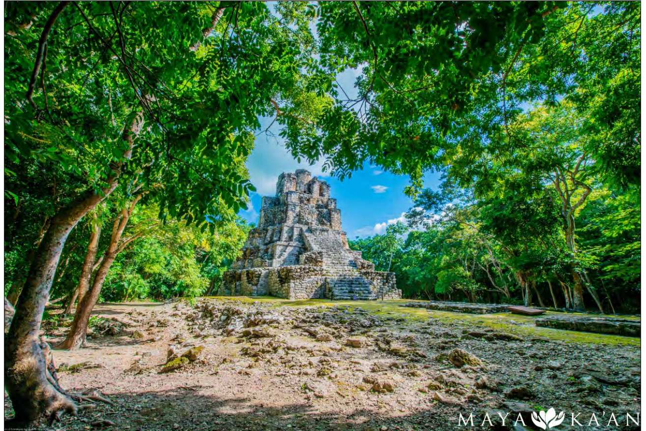
▲ En Quintana Roo, el turismo rural representa una alternativa para las comunidades rurales.

El lunes 28 lanzarán la Convocatoria Estatal de Reconocimiento a la Innovación del Turismo Alternativo en Quintana Roo a las 11:00 horas; el martes 29 se hará la presentación del programa Nuestros Héroes de la Salud a las 11:00 horas. Para el miércoles 30 está programada la conferencia Retos y Perspectivas del Turismo Rural en el Caribe Mexicano, a las 11:00 horas, la convocatoria al concurso de fotografía Turismo Rural en el Caribe