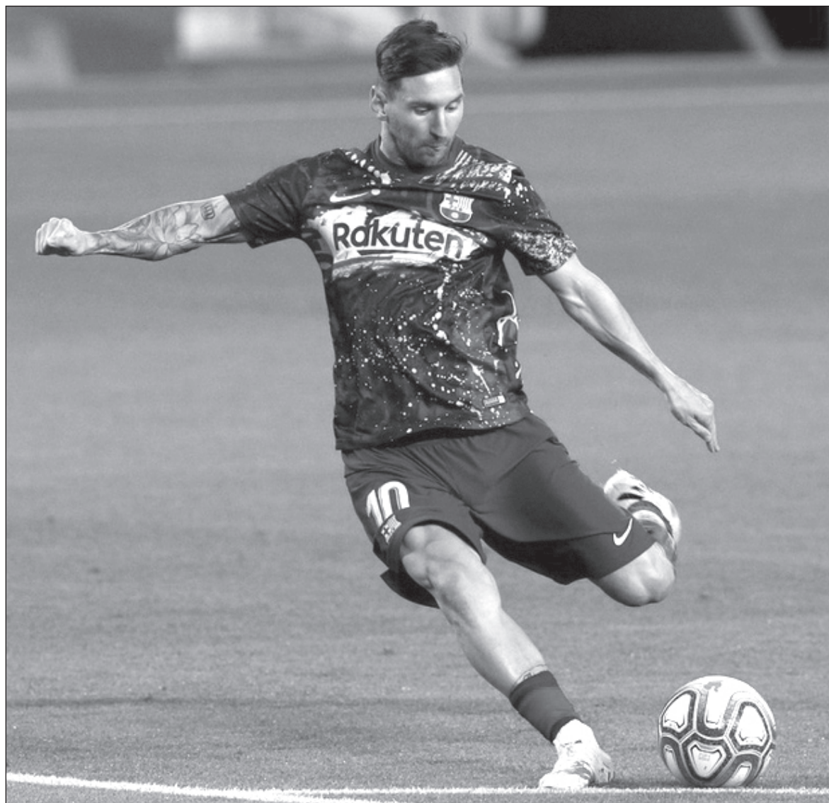
▲ El fútbol puede ser practicado por un regordete y no muy rápido y se llama Maradona, por alguien que estuvo a punto de padecer enanismo y es Lionel Messi.

Ya no hay Liga de Ascenso y sólo hay un torneo de expansión -que de anchura sólo tiene el