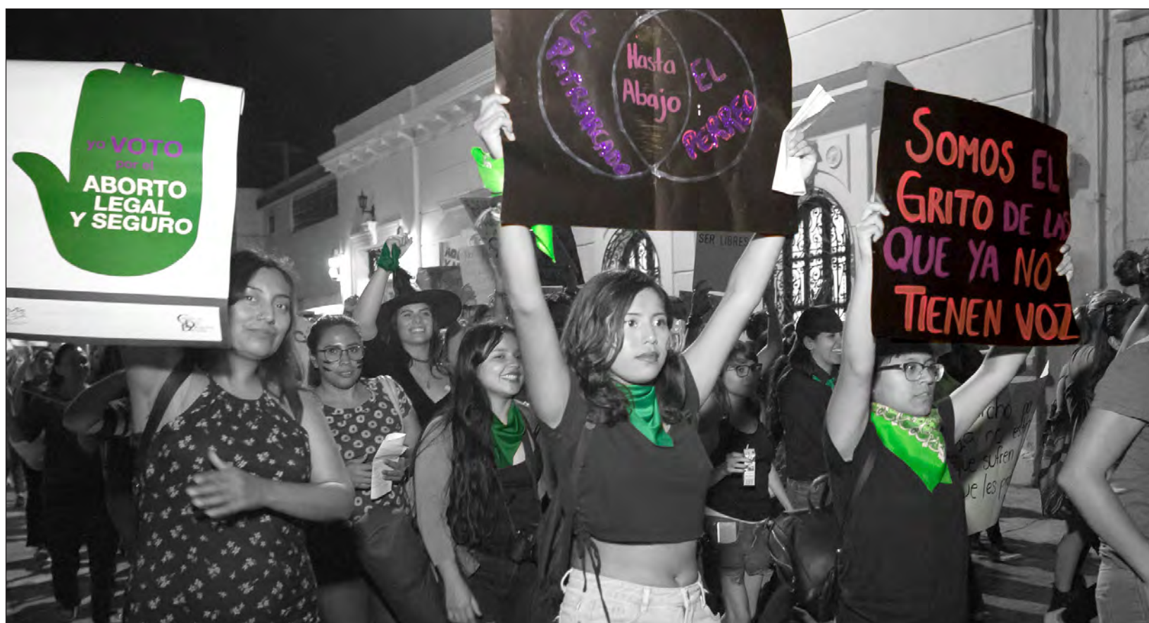
▲ Al igual que el 28 de septiembre del 2019, este año habrá movilizaciones en las principales ciudades de la península de Yucatán donde las mujeres manifiesten su posición a favor de la legalización del aborto.

Los índices de embarazo adolescente en Campeche son también un indicador de la falta de educación sexual integral y el reconocimiento de los derechos de la niñez y la adolescencia. El Observatorio ha trabajado en este tema con servidores públicos sobre todo en municipios del interior. “Hay voluntad en regiones no centralizadas porque reconocen el problema en las comunidades, es necesario armar una política integral para discutir el tema y saber a dónde se van los recursos etiquetados para la educación sexual de calidad, y qué resultados está dando. Estamos impulsando políticas públicas medibles, tanto en recurso como en resultado y no solamente en número”, explica.