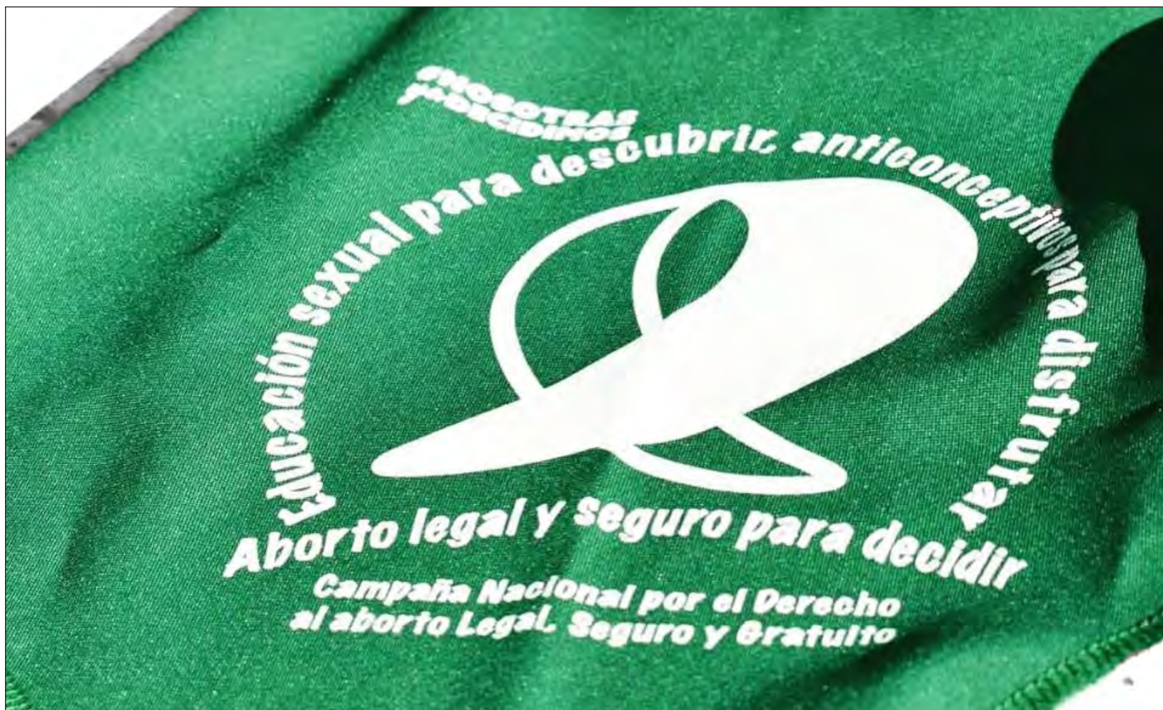
▲ El pañuelo verde como símbolo se utilizó por primera vez en Argentina, donde cobró fuerza la discusión por el aborto legal y seguro, en 2018.