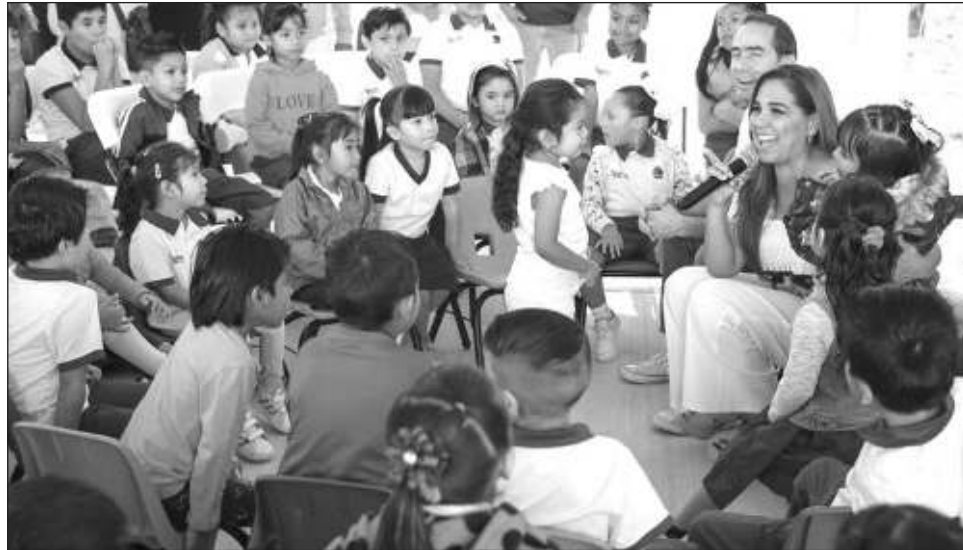
▲ La gobernadora destacó que se está "metiendo el acelerador" para hacer obras bien hechas, las que más se necesitan, bien cuidadas y con transparencia total.

Asimismo, Mara Lezama adelantó que en los próximos meses este fracciona-