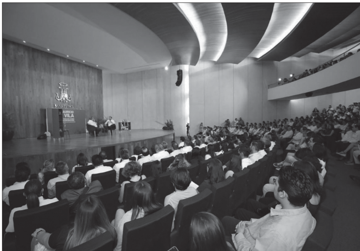
▲ “A fin de cuentas, es la mirada del otro la que nos define. El autor ahuyentó el monólogo y el relato se convirtió en una memoria colectiva, en donde las vivencias de uno se complementan y enriquecen con las anécdotas de otros”.

Una historia de cambio y transformación fue editado por Miguel Ángel Porrúa, y en breve estará a la venta. Tendrá un precio al público de 289 pesos. Se está editando, de igual manera, la edición digital, que podrá descargarse en las principales librerías electrónicas, a un precio más accesible que el de la versión impresa.