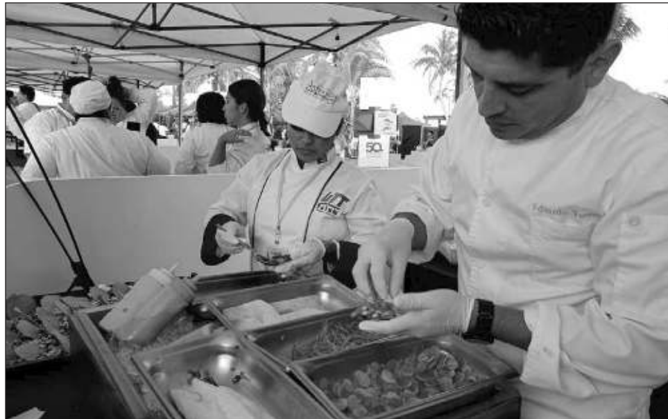
▲ El jurel es un pescado graso y suave que puede encontrarse en cooperativas tanto de Puerto Morelos como en Puerto Juárez, del lado de Cancún.

“De acuerdo a la convocatoria, que era trabajar con un producto local, lo que hicimos es una tostada con el pescado jurel, que es el protagonista de aquí del festival, lo que hicimos es curarlo en sal de Celestún, para que sea un poquito más suave, lo acompañamos con producto local, que es una martajada