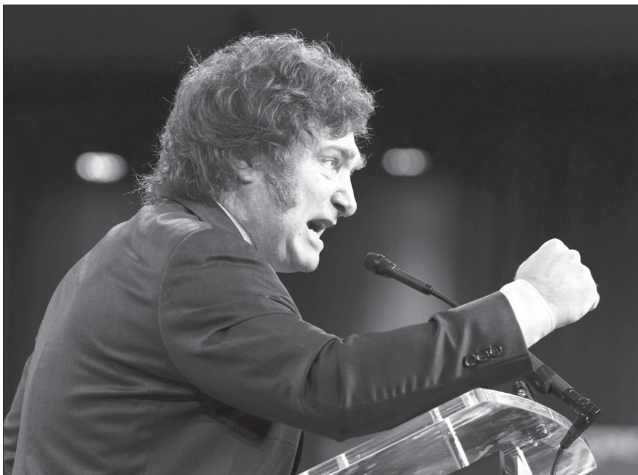
▲ Antes de llegar a la presidencia en diciembre, Milei llamaba a "dar la batalla cultural" contra el "adoctrinamiento del marxismo" al que considera responsable de haber acuñado la "ideología de género" y la "agenda ecologista".

A nivel de la UE, sólo están prohibidos nombrar productos vegetales con términos usados tradicionalmente para los lácteos, como yogur o queso.