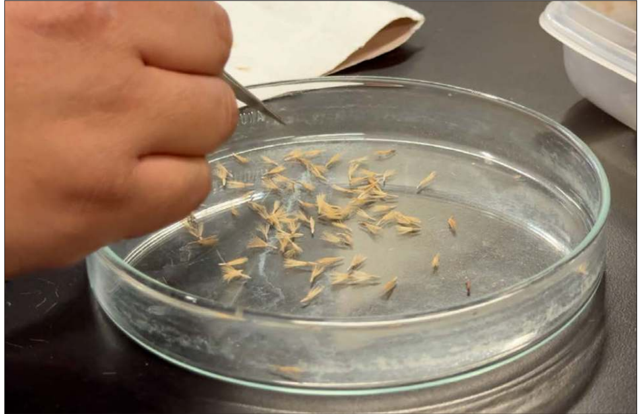
▲ Meyaje' chéen le jaaj yaan ichil tuláakal América Latina, mina'an u jeel je'ex lela'.

Kéen ch'a'abake', ku tikinkúunsa'al, tak keen ila'ak u chukik u 15 por sientoil úumedad,