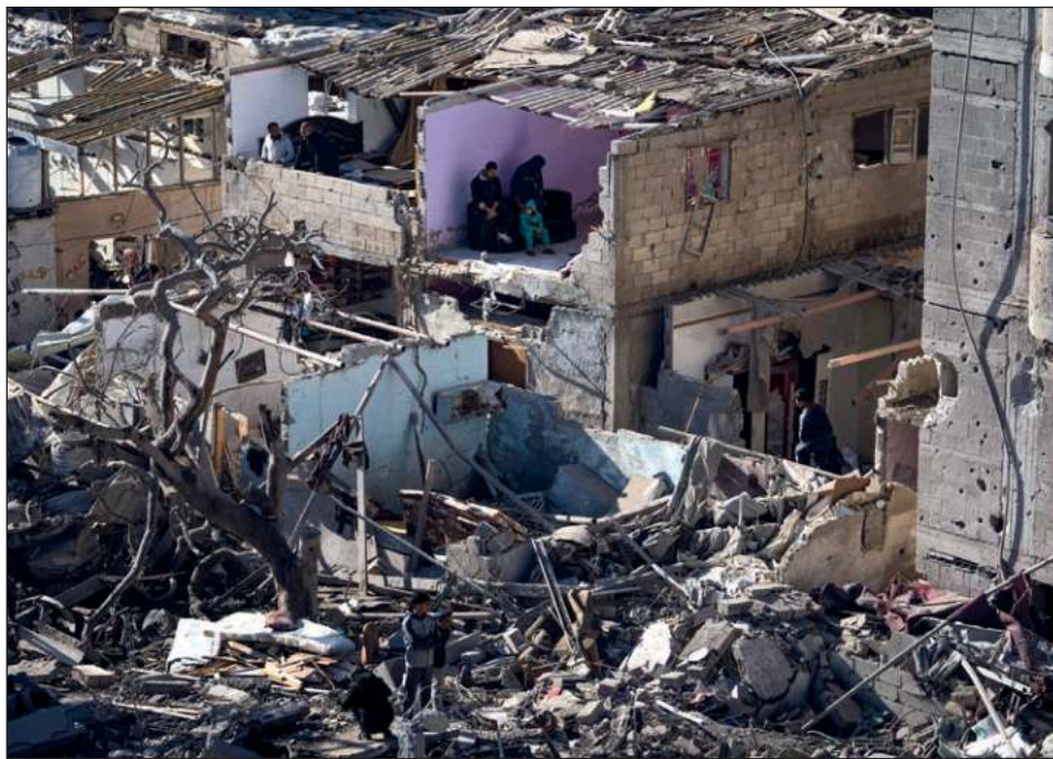
▲ Los ataques israelíes por aire, tierra y mar contra Gaza han provocado la muerte de miles de personas, ha borrado del mapa vastas zonas urbanas y ha desplazado a 80 por ciento de la atribulada población.