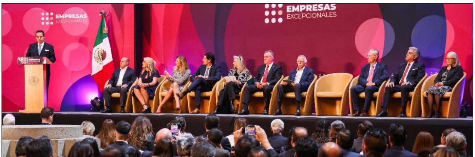
▲ La empresa Bepensa fue reconocida por su desempeño sobresaliente en la categoría Contribuir a los Objetivos de Desarrollo Sostenible en donde dio a conocer la forma en que lleva a cabo su programa permanente de acopio, ReQPET, práctica con más de una década de éxito en la península.

El Reconocimiento Empresas Excepcionales es un símbolo que representa el poder de la colaboración y una invitación abierta a todas las empresas del país a ser parte de la transformación positiva.