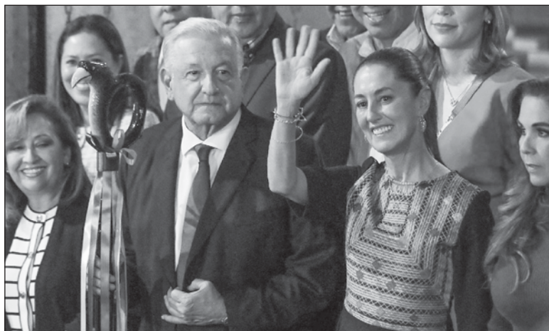
▲ "La negativa del presidente mexicano a alinearse y someterse con Washington (...) no se perdona en la Casa Blanca".

No menos importante, es el enojo del gobierno de Israel y del lobby sionista que controla en Washington a congresistas y senadores estadounidenses -vía donaciones de dinero, esto sí comprobado, por cierto- por las posturas del gobierno mexicano respecto a su campaña militar en Gaza. Desde el rechazo "a la tibieza" de la condena al ataque del 7 de oc-