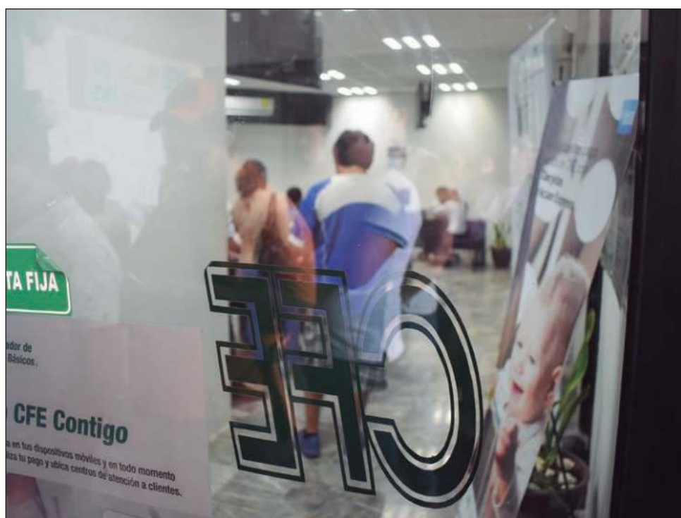
▲ La empresa estatal reportó los ingresos totales sumaron 644 mil 361 millones de pesos, lo que significó un aumento de 3.8 por ciento respecto a 2022. Foto Fernando Eloy

La mayor demanda de electricidad en 2023 se registró principalmente en los usuarios domésticos, industriales agrícolas y comerciales, en sintonía con el crecimiento de la economía mexicana.