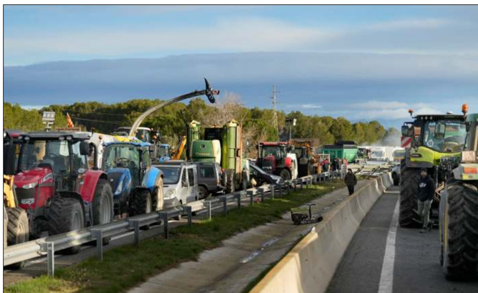
▲ Los agricultores exigen un acuerdo satisfactorio, sobre todo en las ayudas por las consecuencias de la sequía: buscan que el agua "sea equitativa para todos".

Días después de la crucial reunión en Bruselas de los ministros de agricultura de todos los países de la Unión Europea (UE), entre los agricultores españoles impera el escepticismo y el ánimo de mantener viva la llama de la protesta. Así lo hicieron patente en sus movilizaciones en el noreste del país, con un largo bloqueo de una de las carreteras más transitadas y que comunica con el sur de Francia. Además hubo