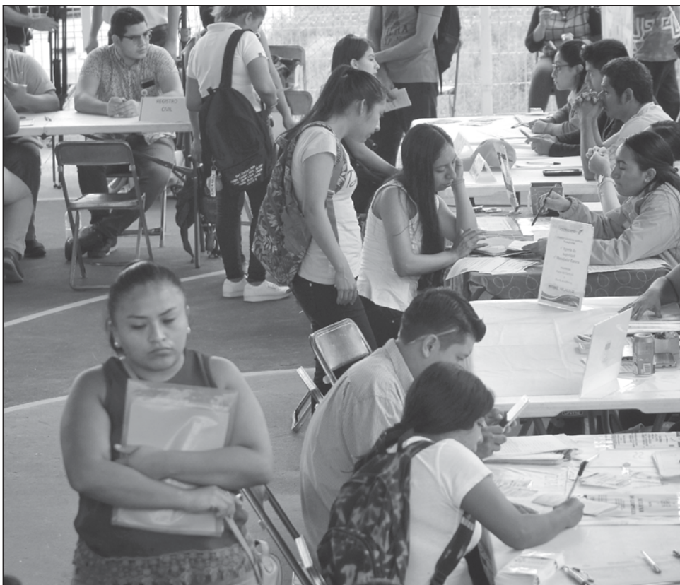
▲ La Secretaría de Fomento Económico y el Servicio Nacional de Empleo tienen el objetivo de reducir la brecha salarial y fomentar el trabajo formal.

Según el Instituto Nacional de Estadística y Geografía (Inegi) la población de las mujeres activas económicamente disminuyó mil 528 el cuarto trimestre del 2023 a comparación del mismo periodo en 2022. La población subocupada en Yucatán de hombres pasó de 51 mil 501 a 54 mil 643 y de mujeres de 31 mil 246 a 39 mil 712.