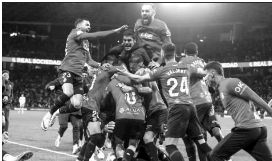
▲ El Mallorca, dirigido por el mexicano Javier Aguirre, celebra su pase a la final de la Copa del Rey.

"Nosotros no teníamos presión ninguna. No sé si me creerán o no, pero no ensayamos penaltis", reveló Aguirre. "Lo anotamos en nuestro programa día a día y por alguna razón, porque llovió, porque había viento, porque ya se fue el otro... por lo que sea, no tiramos penaltis. No estaba ese escenario contemplado. Cuando preguntas y todos quieren tirar, sabes que la cosa va bien. No se esconde nadie".