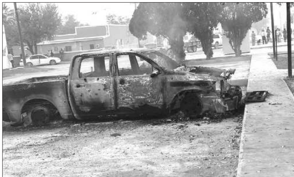
▲ Antes del amanecer del martes, la base de la Dirección de Protección Civil, a un costado de la Presidencia municipal, fue incendiada, también se registró el ataque contra vehículos oficiales.

Poco antes del amanecer la base de la Dirección de