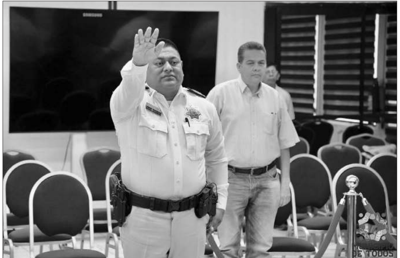
▲ El nuevo director de la Policía Municipal sostuvo que se habrán de implementar estrategias tendientes a disminuir los índices delictivos que se presentan en Carmen, para lo cual llevarán a cabo acercamientos con los ciudadanos.

Durante 2011, culminó satisfactoriamente el Curso de Alta Dirección en el