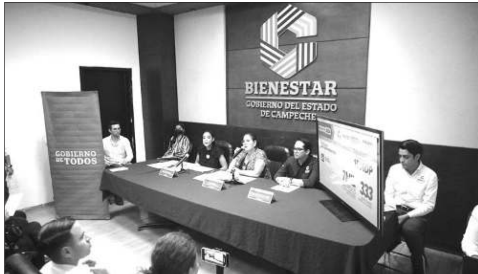
▲ La funcionaria destacó que realizarán un censo para entender cuáles son las necesidades específicas de cada zona, y será así que establecerán las estrategias de atención.

Por tiempos electorales, dijo que en el tema de apoyo a familias con el programa de comedores comunitarios