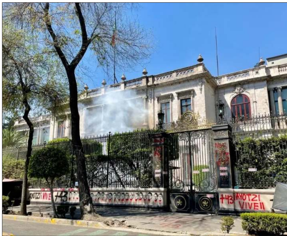
▲ El momento más tenso ocurrió al finalizar el mitin, cuando un grupo de encapuchados lanzó algunos petardos al interior de las instalaciones del Palacio de Covián.

Reiteró que el propósito de la reunión con el Presidente