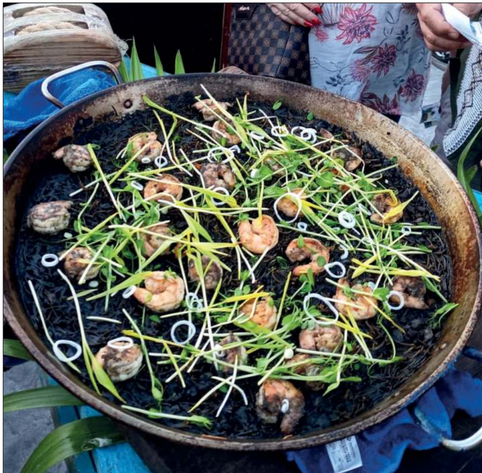
▲ El platillo incorpora mariscos capturados en el puerto, además de un recado negro hecho a partir de chiles quemados, ajo, cebolla, sal y orégano.

Al festival también llevaron un platillo hecho con longaniza negra de Temozón como ingrediente local y ostiones zarandeados, que si bien los ostiones no son locales, se prepararon con ingredientes y productos al alcance en esta zona.