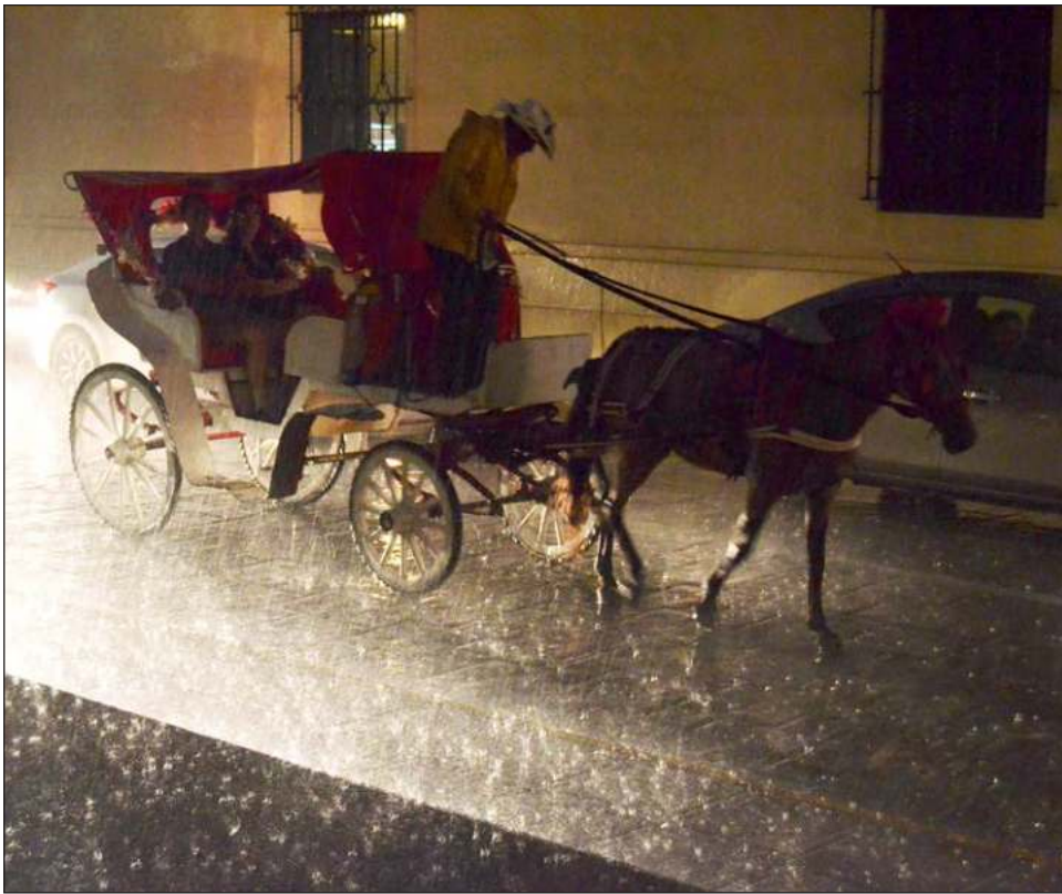
▲ La ley del estado ahora establece la prohibición de tránsito de animales en vialidades asfaltadas, para finalidades distintas a las relacionadas con las actividades agropecuarias.