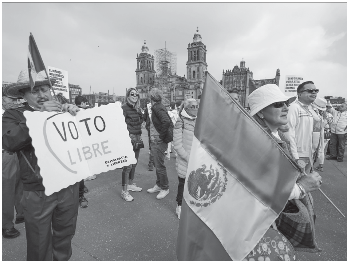
▲ "Por una parte, si no te vistes de rosa y vas a la concentración, no eres 'demócrata': hay que votar en tu contra. Por otra, aunque ya nos dijo el gran timonel que la marcha es democracia (y se entiende por tanto que acontece gracias a su disposición y permisividad democráticas), quienes acuden a ella y se visten de rosado están manifiestamente en contra del 'gran demócrata'".

Quienes convocaron a la marcha del domingo 18 de febrero invitaron a manifestarse a favor de la democracia. Más allá del contenido del discurso de Lorenzo Córdova (que por cierto fue muy bueno, y no tuvo desperdicio alguno), me quedo con dos señales que aportó el evento. Por una parte, si no te vistes de rosa y vas a la concentración, no