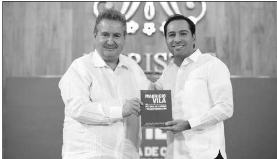
▲ El volumen es un vistazo a su vida como empresario, legislador local, alcalde de Mérida y gobernador, un “resumen de los últimos 10 años”.