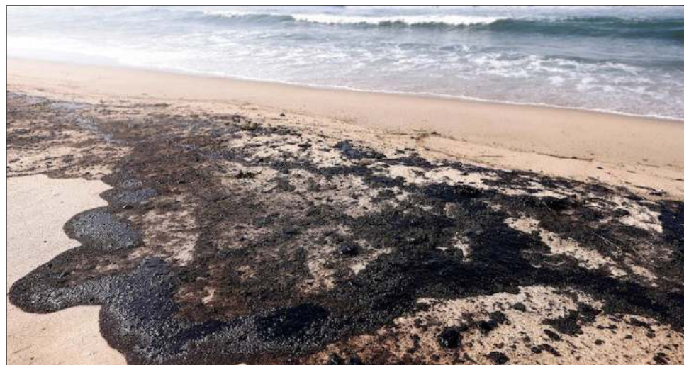
▲ Esta semana el panorama en Playa Azul y Playa Brasil es de quietud; pescadores se encuentran en sus casas esperando los ofrecimientos de Pemex para resarcir el daño.

Desde su restaurante, que regenta desde hace 44 años y que durante el pasado fin de semana estuvo vacío, Mendoza explicó que son altas las pérdidas económicas que representa el derrame de lo que él llama el chapopote (chapopote) para aproximadamente unos mil 500 pescadores de Playa