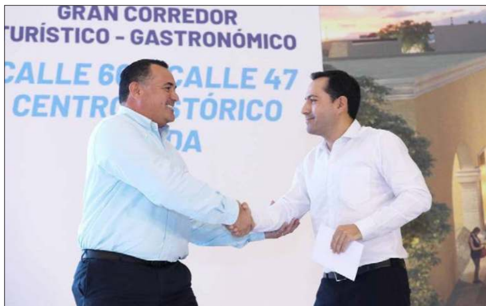
▲ El Gran Corredor Turístico-Gastronómico fue presentado por el gobernador Mauricio Vila y el alcalde Renán Barrera en el Centro Internacional de Congresos.

Desde el Centro Internacional de Congresos, Vila Dosal aseveró que sin infraestructura no puede haber desarrollo económico por lo que, se están generando las condiciones para el Yucatán del futuro con proyectos coordinados con los diferentes órdenes de gobierno como la construcción de 2 plantas de ciclo