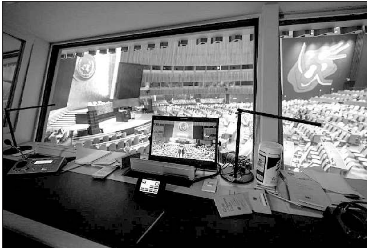
▲ "The United Nations is increasingly being perceived by some as the problem and not the solution".

RUSSIA HAS ATTEMPTED to penetrate Western democratic institutions and electoral processes by