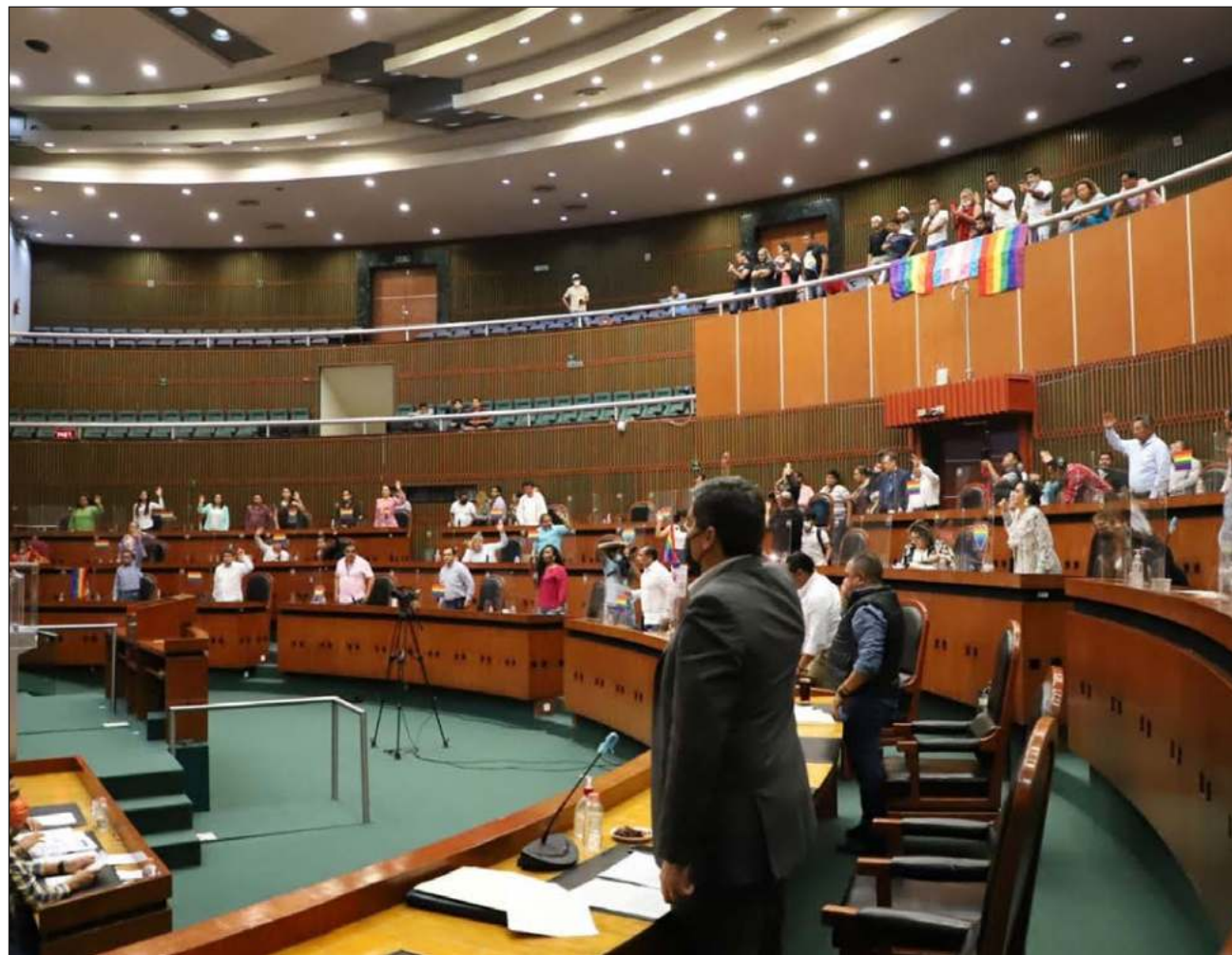
La votación de las reformas legales resultó en 38 votos a favor, seis en contra y dos nulos.