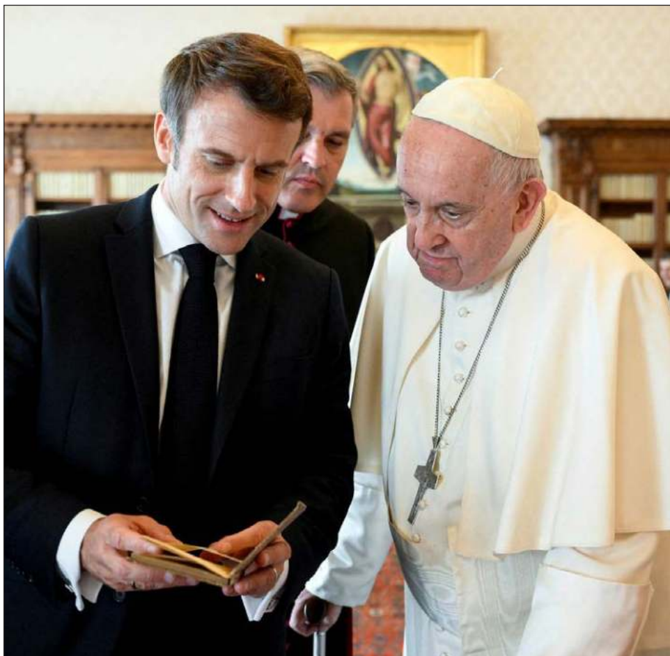
▲ El libro entregado por Emmanuel Macron al papa Francisco se trata de la primera edición de Sobre la paz eterna , del filósofo alemán Immanuel Kant, que data de 1796.

Cuando los funcionarios descubren un cuadro, libro u otro objeto cultural polaco, notifican a las agencias del orden del país donde fue encontrado.