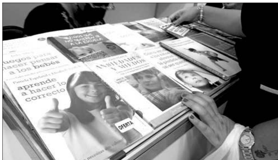
▲ El objetivo de la Feria Internacional del Libro del CNEIP es promover y fomentar la lectura, así como fomentar el conocimiento en psicología y la literatura.

Grapain Contreras precisó que la cultura de la paz se logra mediante el diálogo, la me-