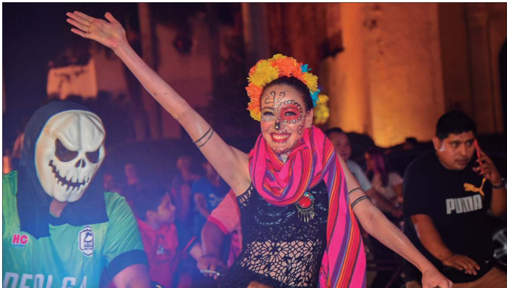
▲ Desde el Parque de Santa Ana en Mérida, cientos de ciclistas se dieron cita para formar parte de la Rodada de Ánimas encabezada por el colectivo CicloTurixes. Disfrazados con motivos de Janal Pixan, familias enteras se unieron al festejo anual de los fieles difuntos.