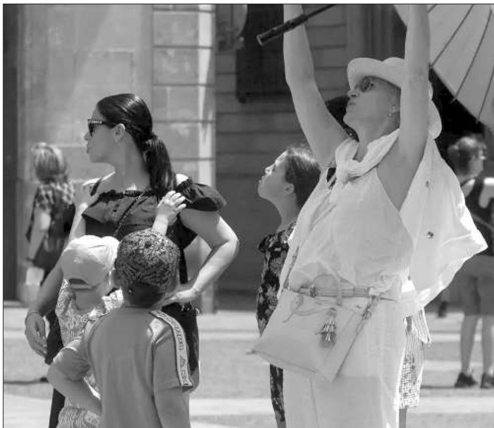
▲ Entre los motivos para suprimir el horario de verano se encuentran los señalamientos de la Secretaría de Salud, en cuanto a que éste produce trastornos como problemas cardiovasculares, somnolencia, irritabilidad, dificultad de atención, concentración y memoria.

Tras su aprobación en lo general y en lo particular, el documento fue remitido al Ejecutivo federal para sus efectos constitucionales.