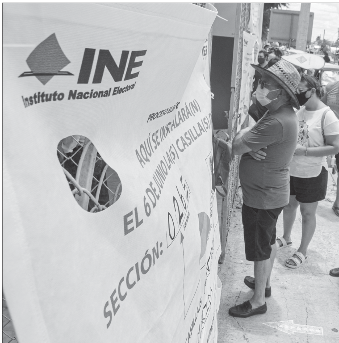
▲ "El camino de la democracia se ha desfigurado... confunde ser oposición con ser democrático".