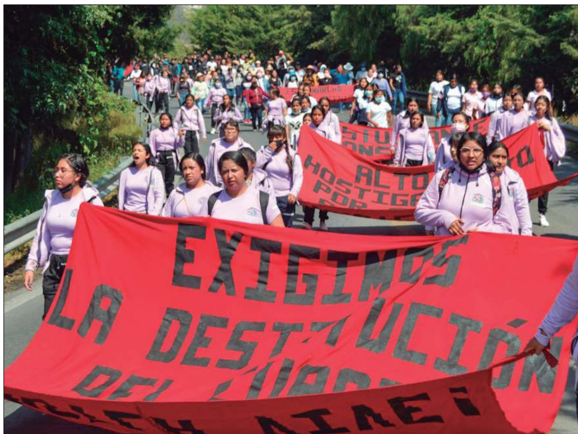
▲ "La Normal Rural Benito Juárez está integrada por alumnas que han demandado el cese de actos abusivos e irregulares en la administración del plantel y el cumplimiento de apoyos económicos comprometidos".