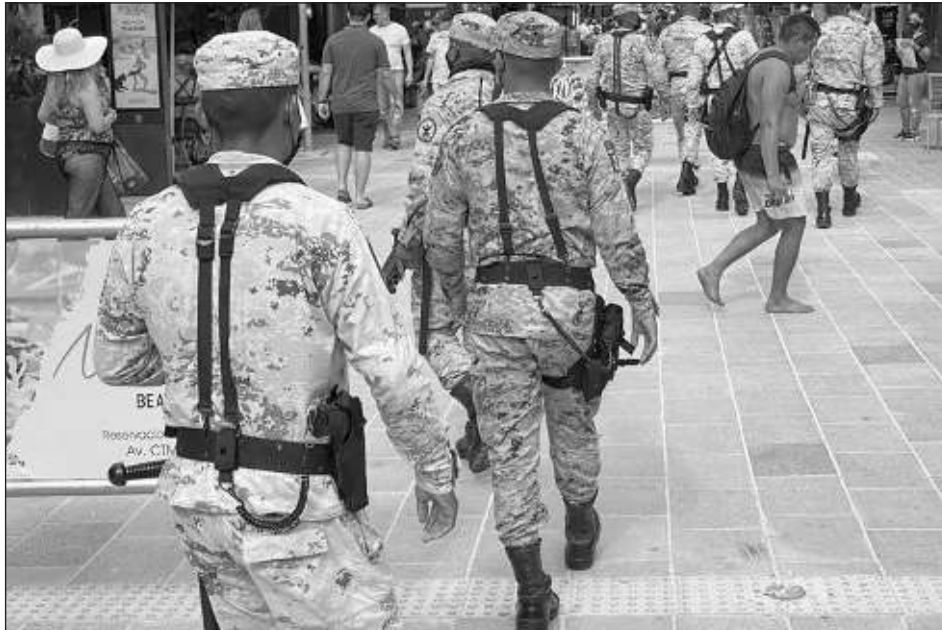
▲ El resultado de la votación en Quintana Roo será remitido al Congreso de la Unión, pues requiere el respaldo de la mayoría de las 32 legislaturas de los estados.

"Resulta evidente que con esta reforma constitucional se atiende de manera adecuada la problemática que se presenta en materia de seguridad pública tomando en consideración de igual forma el punto de