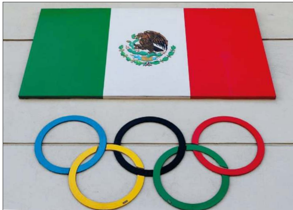
▲ La intención del gobierno mexicano, según el canciller Marcelo Ebrard, es realizar los Juegos Olímpicos sin endeudarse, otorgando sólo 10% de la financiación.

El titular de la Secretaría de Relaciones Exteriores del país reiteró la postulación del país para organizar unos Olímpicos y contradujo a la ex medallista olímpica en atletismo Ana Guevara, directora de la Comisión Nacional de Cultura Física y Deporte, quien aseguró el pasado mes que Andrés Manuel López Obrador, el presidente mexicano, rechazó la idea de realizar la justa.