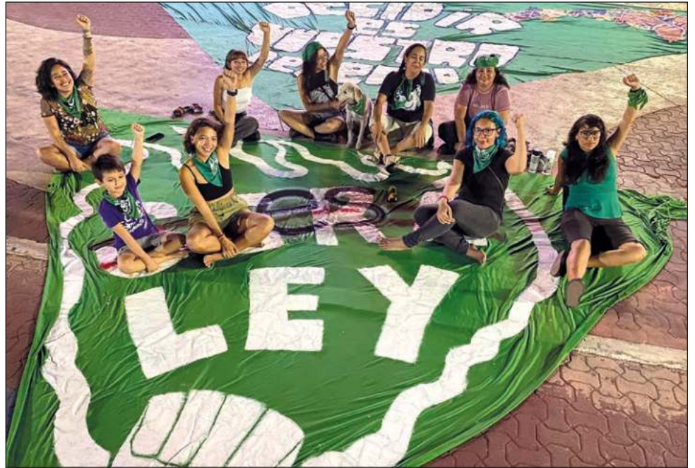
Con 19 votos a favor y tres en contra, los diputados locales aprobaron la despenalización del aborto en el estado hasta la semana 12 de gestación.

En la misma sesión, se dio lectura a la iniciativa mediante la cual se reforma el artículo 13 de la Consti-