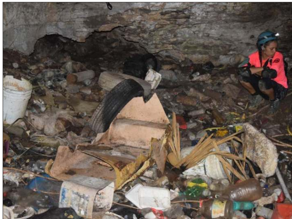
▲ El proyecto Vive Cenote está conformado por 10 voluntarios que, todos los lunes, dedican tres horas de su tiempo para limpiar estas cuevas.

Vive Cenote está conformado por 10 voluntarios que llevan desde marzo de este año haciendo limpieza los lunes de 8:30 a 11:30 horas. Hay cuevas y cenotes muy impactados con dese-