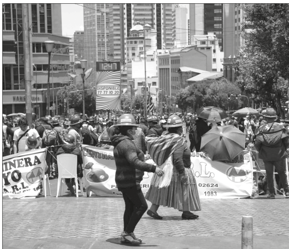
▲ Las avenidas de Santa Cruz permanecen bloqueadas y ha y suspensión de clases.

Arce afronta crecientes problemas sociales y conflictos políticos agravados por el desempleo y el desabastecimiento. La fuerte polarización del país se mantiene latente desde la crisis política de 2019 cuando las elecciones de ese año fueron denunciadas de fraudulentas por la Organización de los Estados Americanos (OEA), lo que detonó un estallido social con 37 muertos que forzó la renuncia del entonces presidente Evo Morales, a lo que se suman fuertes disputas al interior del oficialismo.