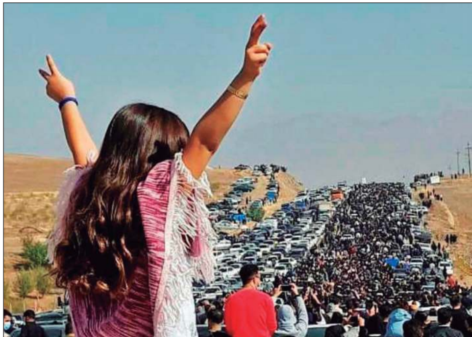
▲ Miles de personas conmemoraron la muerte de Masha Amini, en el cementerio del Kurdistán, donde yacen los restos de la joven asesinada por la policía moral de Irán.

“¡Mujer, vida, libertad!”, “¡Muerte al dictador!”, eran algunos de los lemas que coreaban cientos de mujeres y hombres reunidos en el