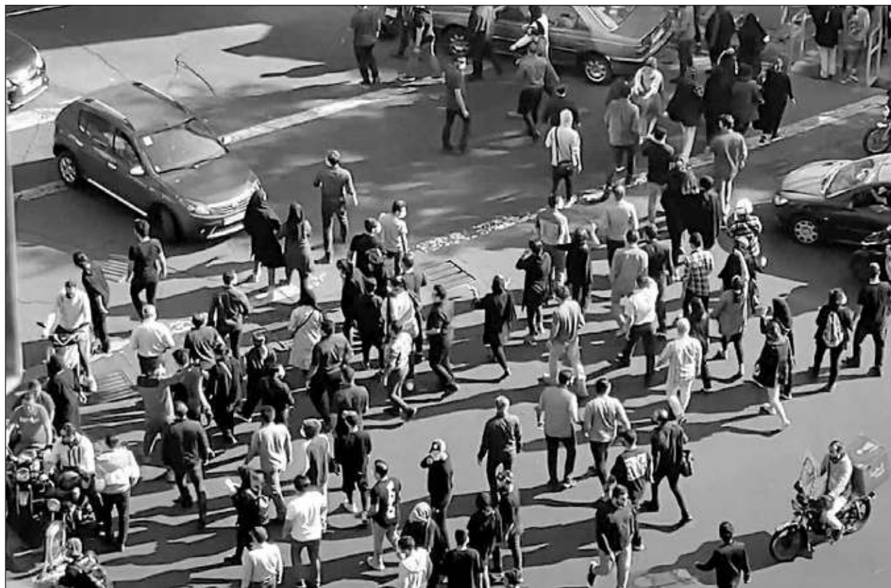
▲ Un combatiente de la organización yihadista suní tuvo como objetivo a los guardias de seguridad del santuario de Shahcheragh, y después ingresó con un rifle dentro del templo, donde empezó a disparar contra los fieles de la rama musulmana chií.

Este hecho sucedió en medio de las protestas que