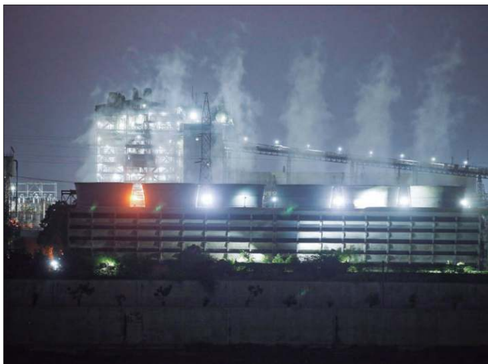
▲ Según científicos, las temperaturas aumentarán hasta 2.5 grados Celsius (4.5 Fahrenheit) por encima de los promedios preindustriales a finales de siglo XX.

“Todavía no estamos cerca de la escala y el ritmo de reducción de emisiones requerido para encaminarnos hacia un mundo de 1.5 grados Celsius”, señaló el director de la oficina, Simon Stiell, en un comunicado. “Para mantener este objetivo vivo, los gobiernos deben reforzar sus planes de acción climática ahora e implementarlos en los próximos ocho años”.