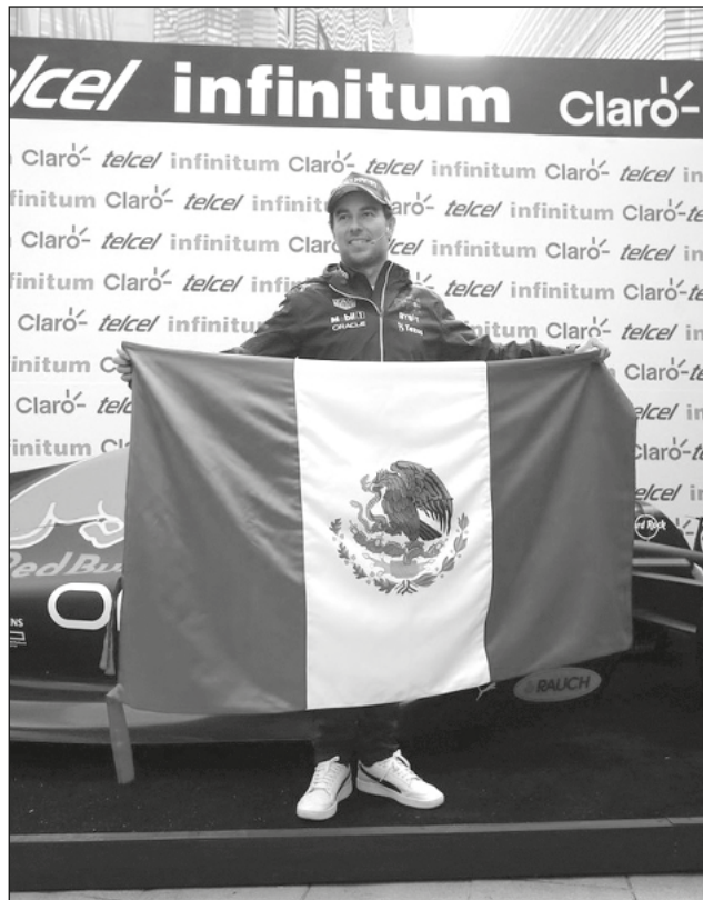
▲ Sergio Pérez, en plena lucha por el subcampeonato de la temporada 2022 de la Fórmula Uno, dijo que su prioridad es ganar el Gran Premio de México.

A sus 32 años, Checo vive la mejor de las 12 temporadas que lleva en la Fórmula