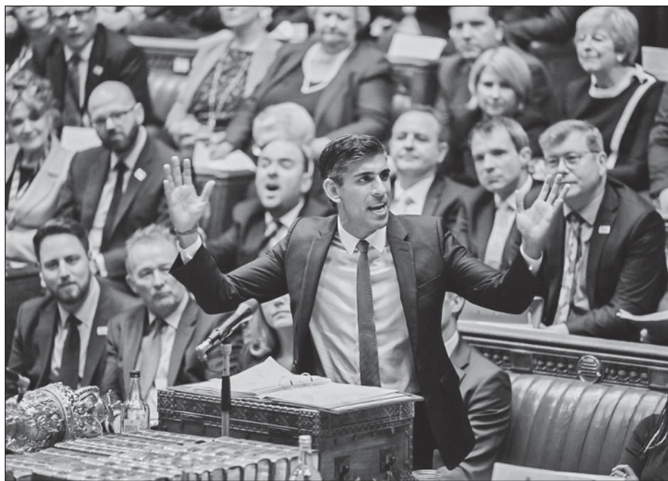
▲ Uno de los primeros actos de Rishi Sunak, de quien su partido espera establezca la economía, ha sido postergar hasta el 17 de noviembre una declaración económica clave.