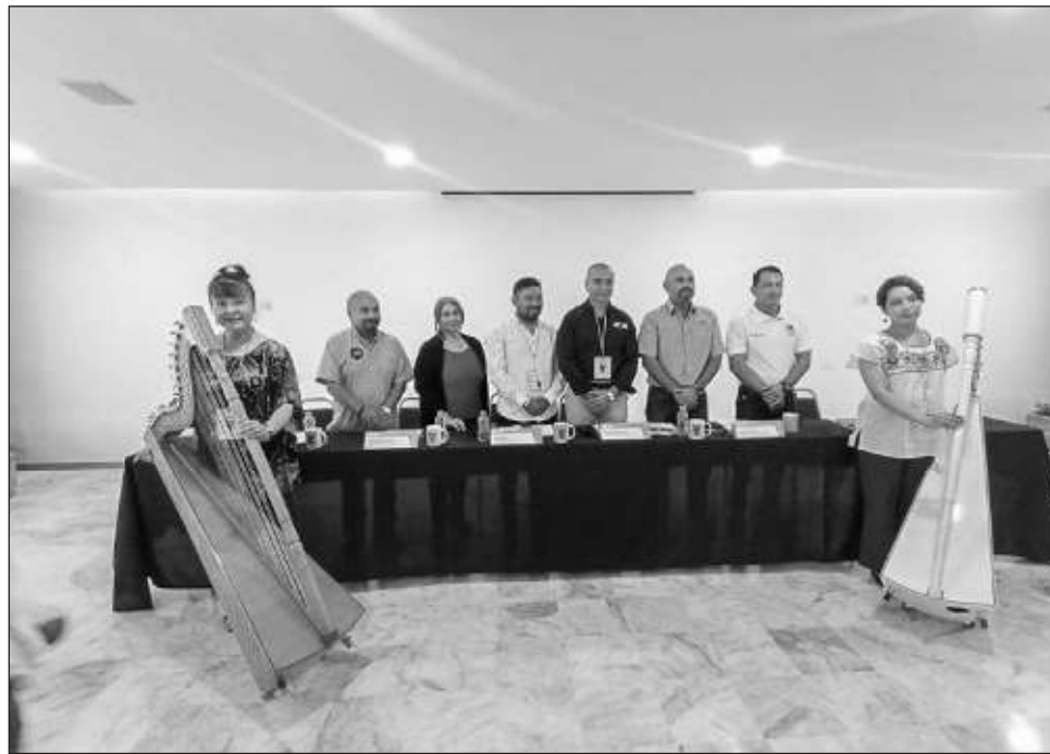
▲ Los conciertos de gala se llevarán a cabo en la Universidad Tecnológica de Cancún, mientras que el concierto de clausura se realizará en la ventana al mar de Puerto Morelos.

Para la clausura en Puerto Morelos esperan una importante afluencia de visitantes extranjeros, por ser un espacio completamente