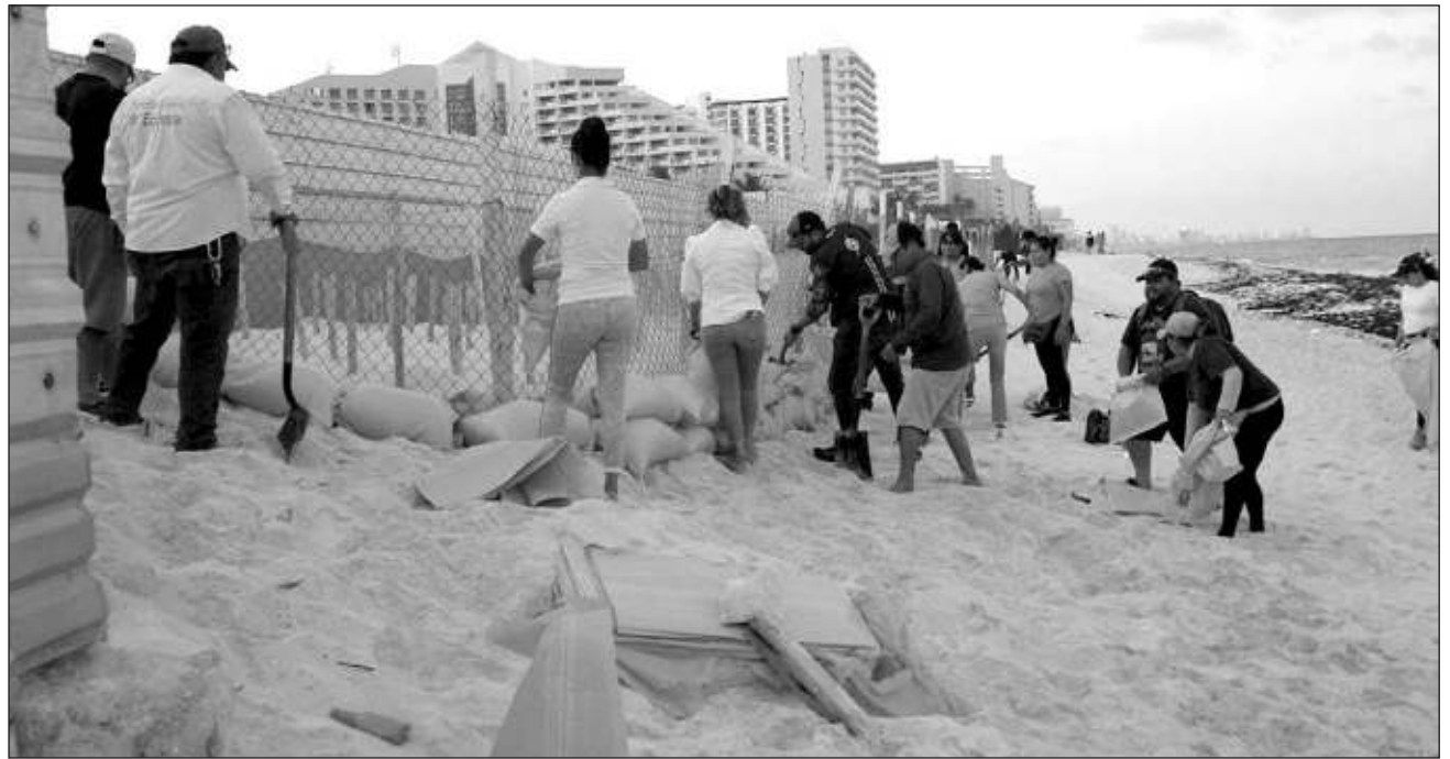
▲ Personal de la dirección de ecología municipal activó el plan de contingencia para la verificación de los 54 corrales de tortugas marinas y colocación de costales de arena al borde de ellos.

Exhortó a la gente a evitar compras de pánico, siempre atentos al desarrollo del meteoro, no hacer caso de rumores o noticias falsas y mantenerse informado solamente por los canales