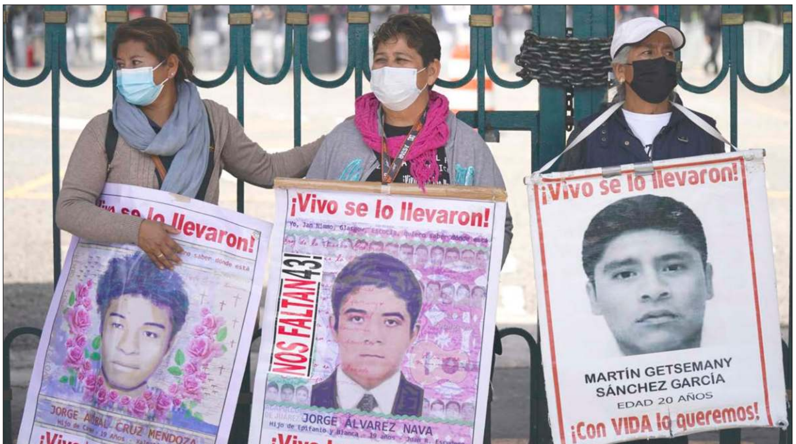
▲ "Lo primero que ha de preguntarse un periodista es si esa filtración favorece valores supremos, como en este caso la búsqueda de castigo a los perpetradores y cómplices de crímenes nefandos o si, por el contrario, se ayuda a romper y acaso dañar de manera definitiva esas expectativas justicieras".