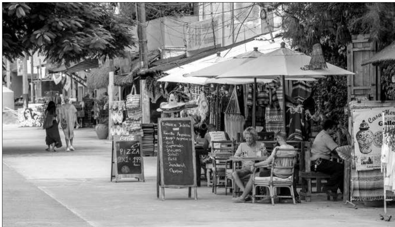
▲ El acuerdo logrado entre hoteleros, restauranteros y el ayuntamiento de Tulum incluye el cierre de los establecimientos dedicados a la venta de alcohol, que ahora es a la medianoche, y cuidar el nivel de los decibeles.

El acuerdo incluye el cierre de los establecimientos dedicados a la venta de alcohol, que ahora es a la media-