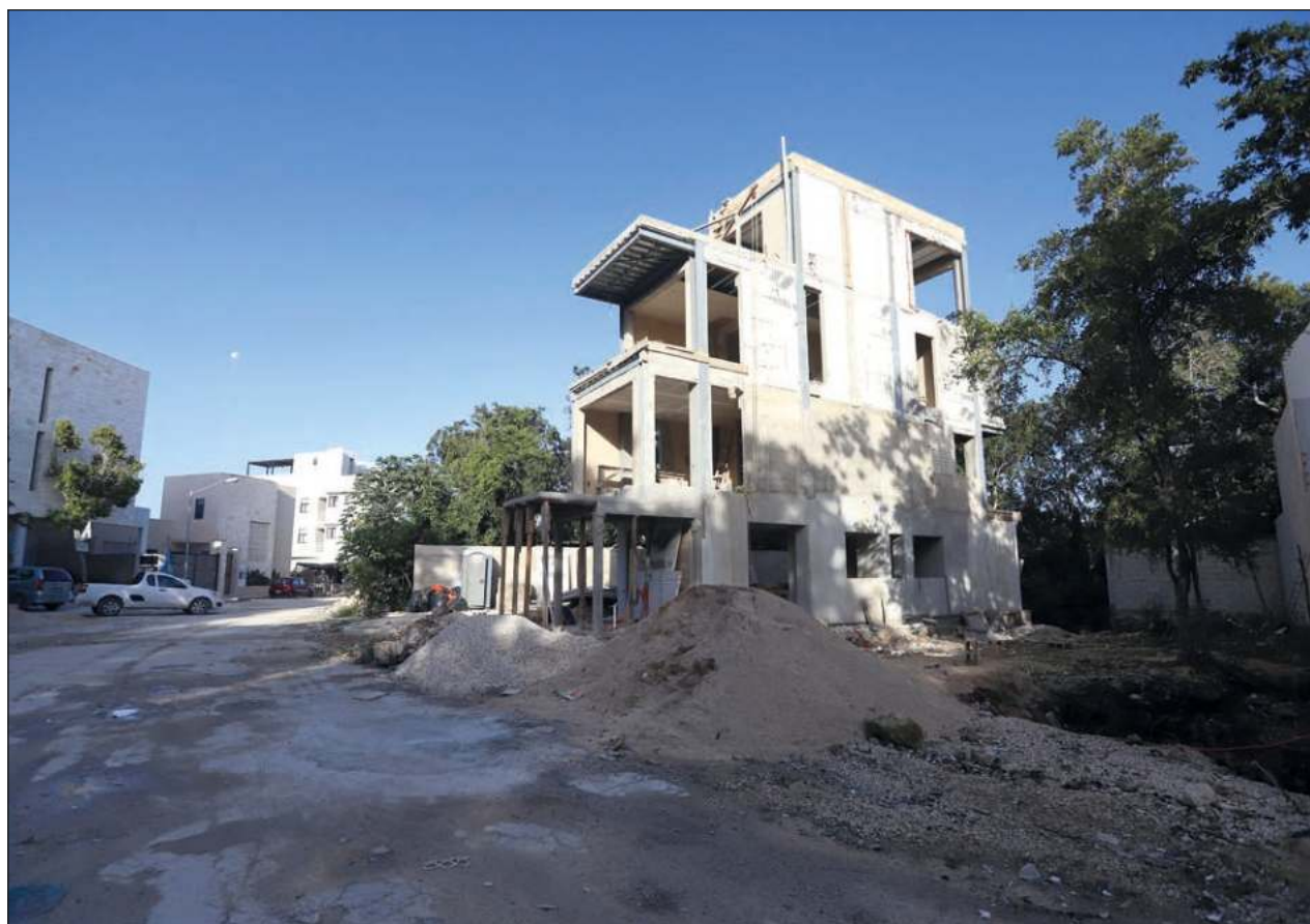
▲ La Asociación Mexicana de Profesionales Inmobiliarios trabajará de forma coordinada con el nuevo gobierno estatal, encabezado por Mara Lezama, para que el crecimiento del noveno municipio sea sustentable.

Hizo referencia a los proyectos grandes como el Aeropuerto Internacional de Tulum y el Tren Maya, que obligan a las autoridades y al sector inmobiliario a que los inversores sepan que hay un ordenamiento que tiene que cumplir para hacer inversiones que vayan acorde con las normas municipales, estatales y federales.