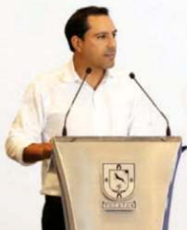
▲ Parte del proyecto consiste en crear una red de fibra óptica que permita llevar Internet a todos los rincones de Yucatán, reveló el gobernador Mauricio Vila.

Mérida, Yucatán, a 26 de septiembre de 2022