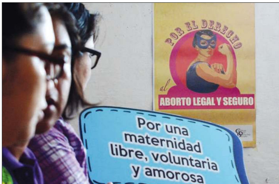
▲ Actualmente hay redes de acompañamiento para que las mujeres y personas gestantes puedan acceder al aborto de forma segura desde casa.

El próximo 27 de septiembre, desde las 19 hasta las 21 horas, impartirá el conversatorio vía Zoom, el cual estará dedicado a quienes fueron presionadas para abortar o para no hacerlo; las inscripciones pueden realizarse al: 9994525408 o a través del Facebook de La Morada Mx ( https://www.facebook.com/LaMorada-MxEdu ) o mediante el formulario: https://forms.gle/T9qfy5VJQimkmUzu6