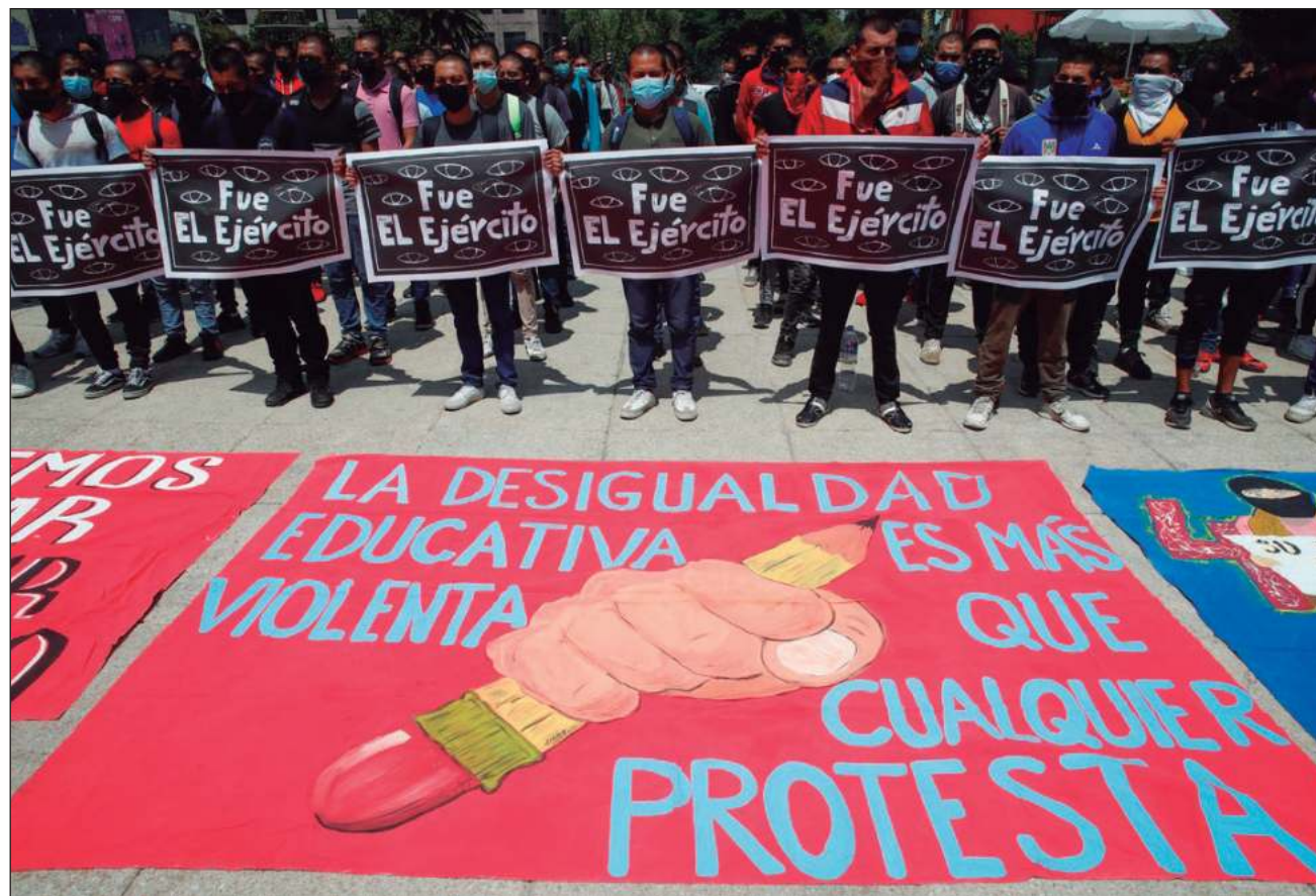
▲ Ante la falta de esclarecimiento de lo sucedido y para continuar los avances hasta ahora alcanzados, el Estado mexicano debe garantizar la independencia de la UEILCA, que parece haber sido desplazada de los trabajos ministeriales.

Sobre la UEILCA, indicó que ha recibido información preocupante indicando que esta unidad “estaría siendo objeto de desplazamiento en sus funciones ministeriales en el presente asunto. Al respecto, ha tomado conocimiento sobre la judicialización de carpetas de investigación relacionadas con los hechos del caso por parte de otras unidades