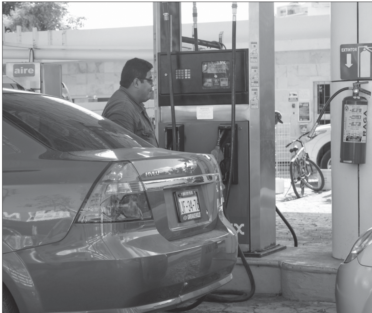
▲ El precio de la gasolina, al público, es de alrededor de 21 pesos en toda la república.

EL INSTRUMENTO A 91 días subió 12 puntos base a 9.49 por ciento (su mayor nivel desde