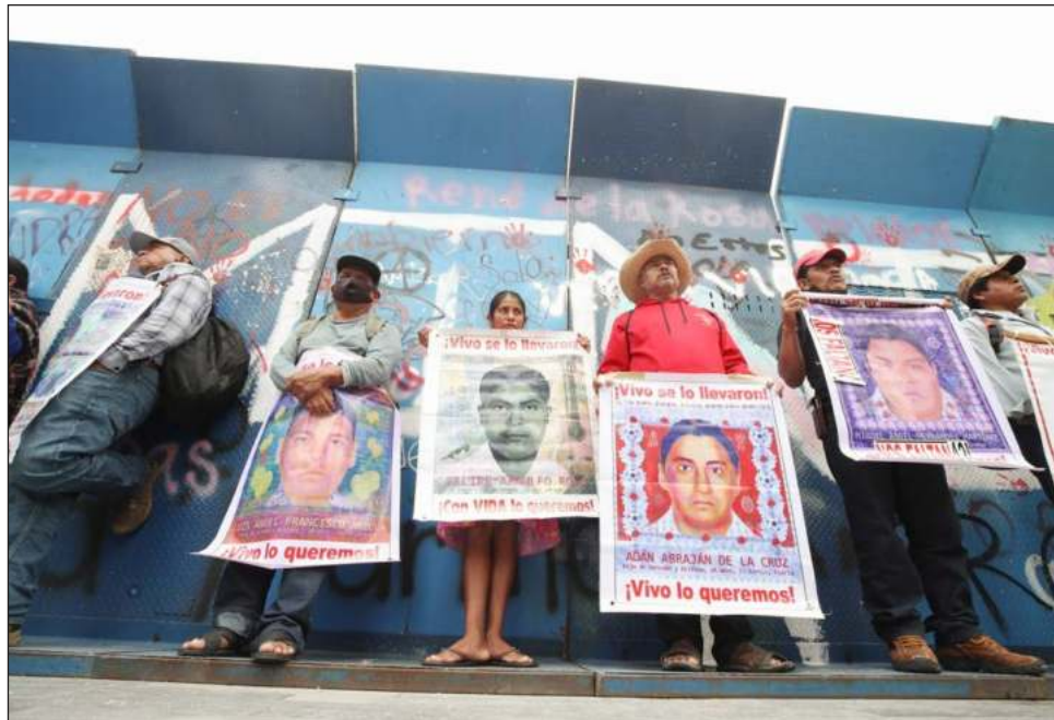
▲ Según indicó el presidente López Obrador, los padres de los estudiantes desaparecidos le plantearon la posible invalidez del proceso judicial por filtraciones de información. Durante la conferencia matutina de este lunes les ofreció disculpas.

A pregunta expresa de que la FGR ha detenido estas órdenes de aprehensión López Obrador rechazó la versión y dijo que en realidad es que “no les gustó que se actuara y que ya estén en la cárcel personas presuntamente responsables como militares, autoridades locales, como autoridades locales, como el ex procurador Murillo Karam. ¿Cuándo se