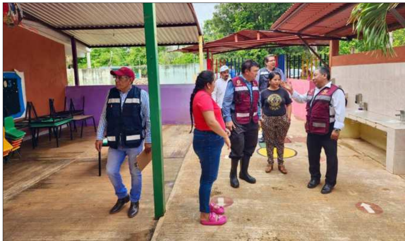
▲ Tras un recorrido al interior de la primaria, el personal de la Secretaría de Educación del estado realizó un levantamiento de las afectaciones a la infraestructura debido a las lluvias, así como los daños al material educativo.

Acompañado de docentes, directivos y padres de familia, el titular de la Seduc indicó que esta escuela recibirá mobiliario educativo y material escolar, así como la inversión necesaria para la reparación de la infraestructura y el sistema eléctrico para que las y los estudian-