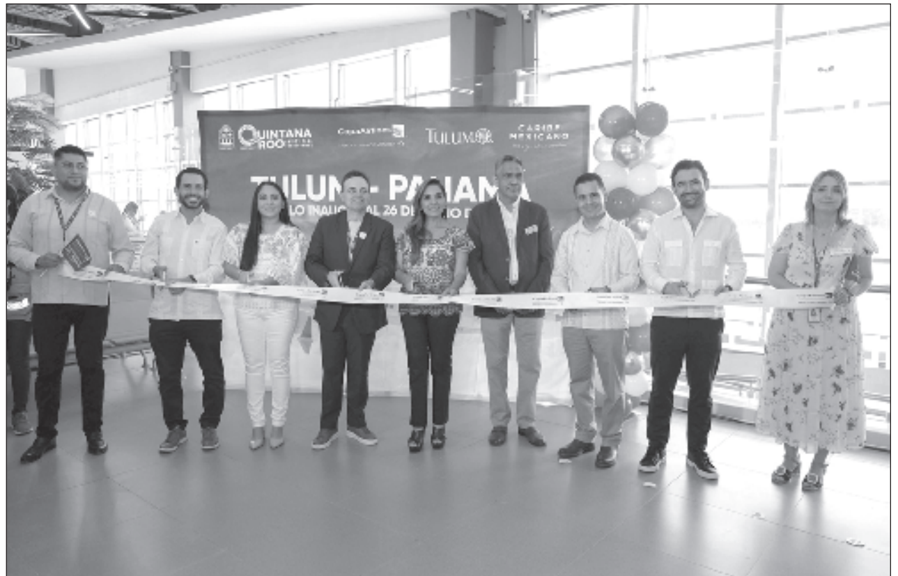
▲ La gobernadora Mara Lezama encabezó la recepción del vuelo en el Aeropuerto Internacional de Tulum, que a seis meses de operación, ya ha superado la cifra de medio millón de pasajeros, rompiendo todos los récords pronosticados.

Actualmente, el Aeropuerto Internacional de Tulum está conectado con nueve rutas a los Estados Unidos, seis nacionales, dos con Canadá y desde hoy, con Panamá. Se espera que en diciembre lo haga con Frankfurt, Alemania. Las aerolíneas que operan en esta terminal aérea son: American Airlines, Delta Airlines, United Airlines, Air Canada, Jet Blue y Copa Airlines. En diciembre se unirá Lufthansa/Discovery. Los vuelos nacionales son operados por Aeroméxico, Volaris, Mexicana y Viva Aerobus.