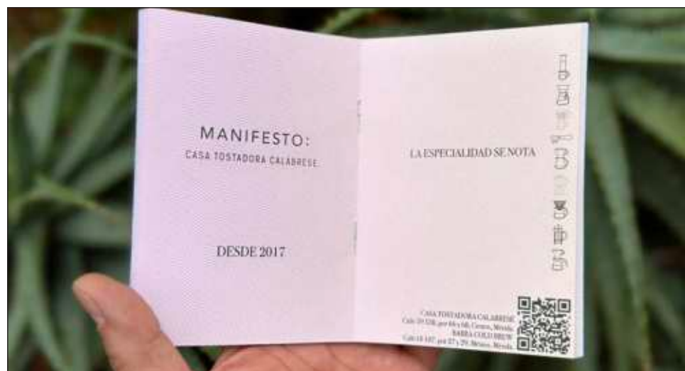
▲ Alrededor de 18 barras de Yucatán participan en el proyecto; el Pasaporte del Café de Especialidad tiene un costo de 150 pesos y una vigencia de un año.

Aunque Historias de Malta comenzó como un libro sobre