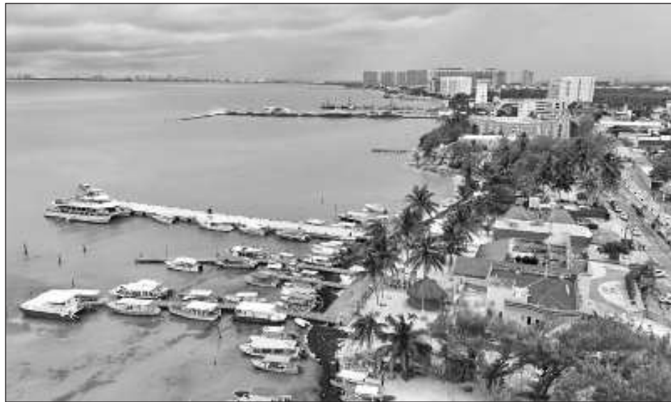
▲ El Travel Mart se llevará a cabo en el hotel Iberostar Selection de Cancún, del 23 al 25 de octubre, comprometidos con acelerar la acción en la lucha contra el cambio climático.

"La retribución será para los arrecifes, para la reforestación de los arrecifes. Se calcula todo lo generado y la retribución es para que se puedan reforestar los