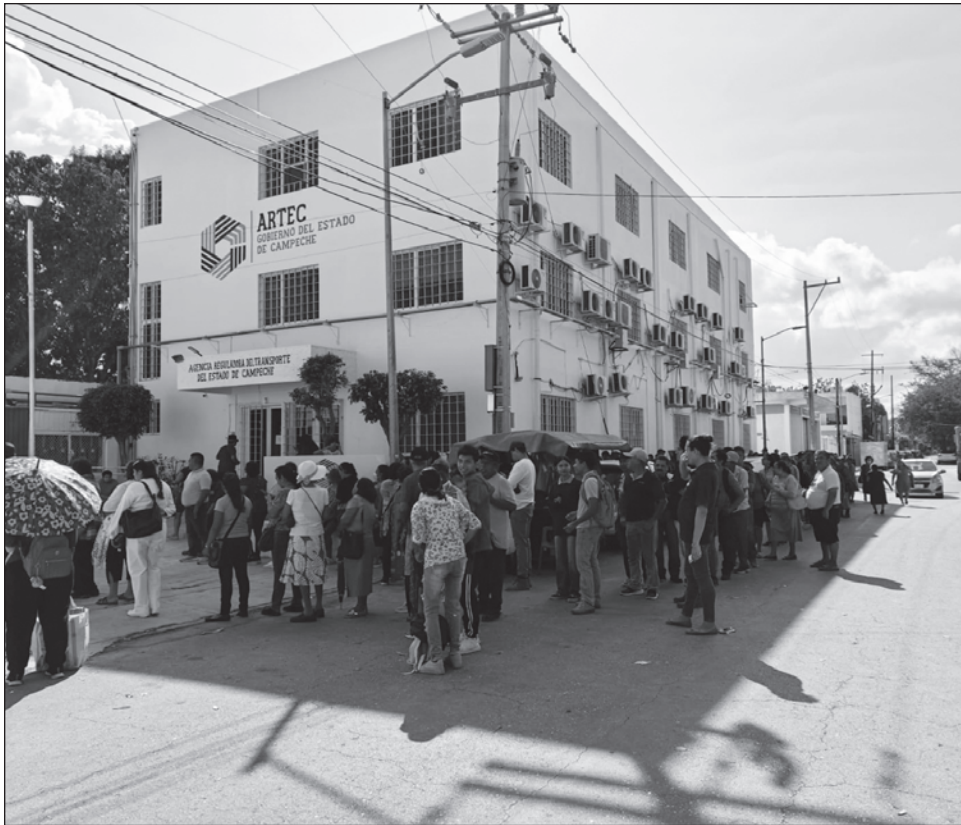
▲ Debido a los tiempos de espera, las y los campechanos tienen que pedir el día en sus lugares de trabajo para realizar la solicitud de tarjetas en las oficinas de la Artec.

El 1 de febrero iniciará el cobro del pasaje luego de meses de ofrecer servicio gratuito