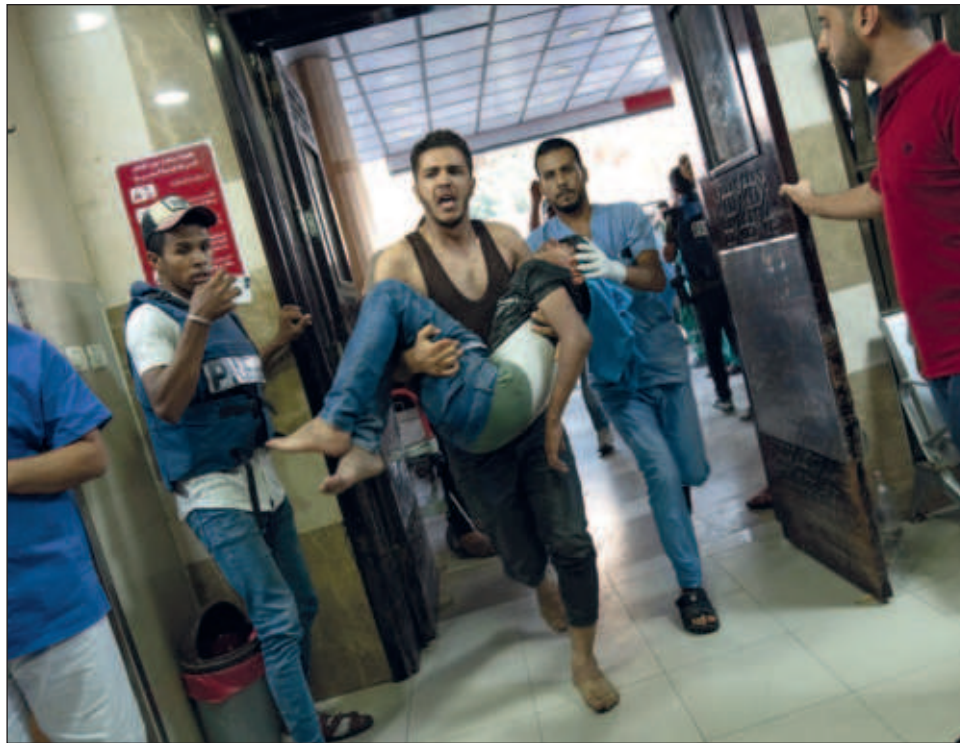
▲ De los 35 hospitales que hay en la Franja de Gaza, 12 han dejado de funcionar; mientras, los centros sanitarios trabajan a más de 250% por encima de su capacidad, Foto Ap

Asimismo, Al Mamlaka apuntó que este suministro es “el primero” de este tipo después de que la Agencia de las Naciones Unidas para los Refugiados Palestinos (UNRWA) alertara ayer de que este mismo miércoles se vería obligada a detener sus operaciones en caso de no obtener