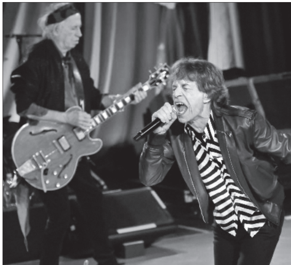
▲ Después de realizar su gira del 60 aniversario, llegó un concepto de sus días de formación: sesiones de estudio con una fecha límite estricta. El resultado: Hackney Diamonds .

Cuando Jagger les dijo a sus compañeros que debían terminar su nuevo disco para el Día de San Valentín, sólo tres semanas después de que comenzaran las fechas de gra-