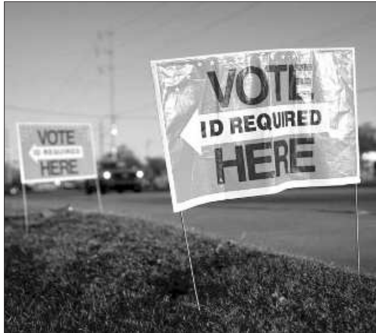
▲ "Trust empowers citizens to believe that their voices matter and that their participation can bring about meaningful change".

AUTOCRATIC LEADERS WHO use lies and innuendo instead of facts and have these amplified by the media and unchallenged by liberal democratic leaders and