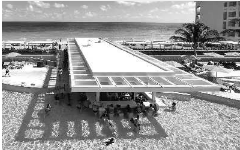
▲ Quintana Roo alcanzó ya las 130 mil habitaciones de hotel y se prevé que al concluir el año el número podría elevarse, porque comienzan a incorporarse nuevos proyectos.

Lo más importante, opinó, es que este crecimiento ha lle-