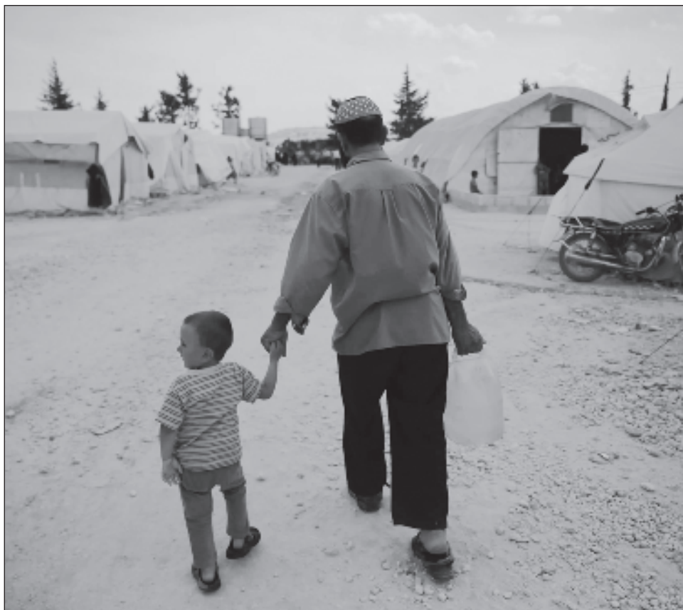
▲ “La atención del mundo se centra, con razón, en la catástrofe humanitaria de Gaza, pero demasiados conflictos están destruyendo vidas inocentes”, declaró Filippo Grandi.

Sin embargo, según la agencia, este número aumentó aún más en los tres meses siguientes, alcanzando los 114 millones a finales de septiembre.