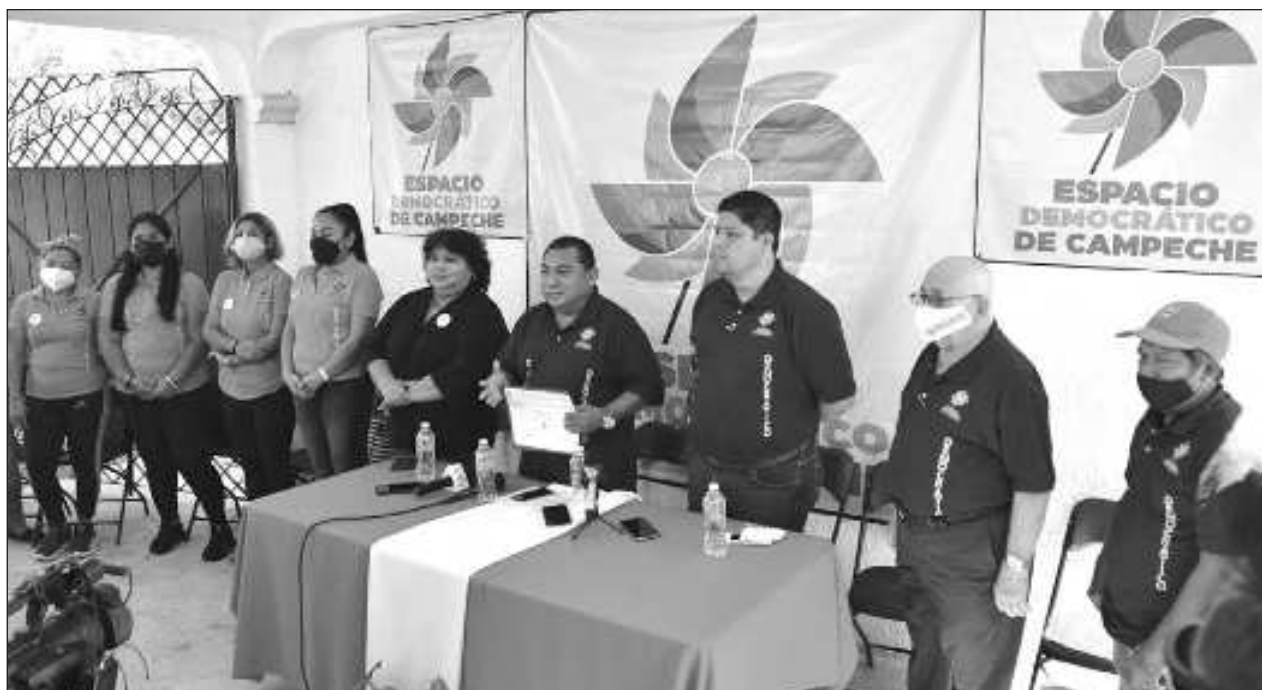
▲ La sesión de la Sala Regional se realizó el martes por la noche y la resolución se informó alrededor de las 22 horas.

Cuestionados sobre la denuncia por el delito de despojo del bien inmueble, señalaron que la Unacar es propiedad del pueblo, no de los funcionarios en turno, además de que no se han posesionado de la Rectoría, sólo mantienen la exigencia que se les pague.