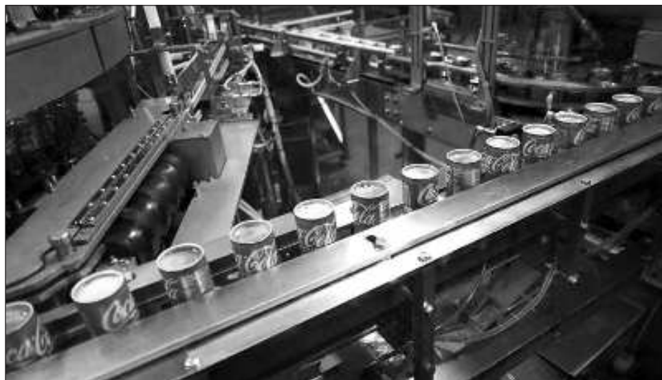
▲ La embotelladora más importante de Coca-Cola en AL registró un crecimiento de doble dígito en México, Guatemala, Colombia, Uruguay, Costa Rica y Nicaragua.

De acuerdo con su reporte trimestral, la emisora aseguró que su enfoque es-