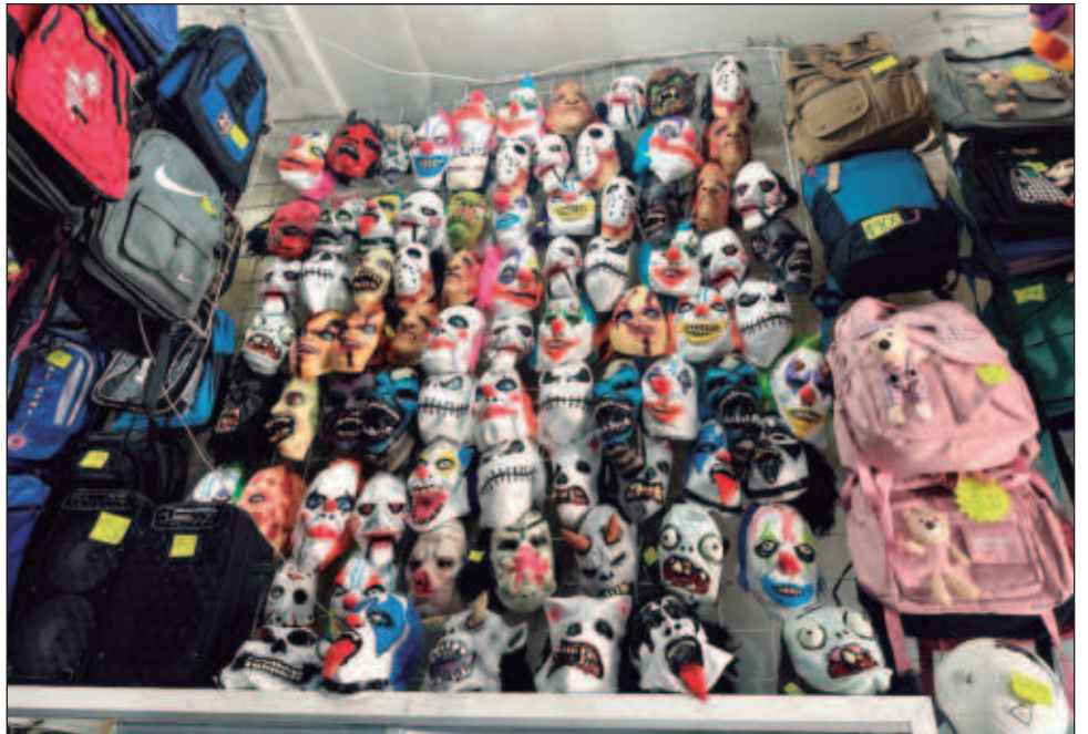
▲ Los comercios ya comenzaron a ofertar máscaras y disfraces, productos que suelen tener buena demanda en este destino turístico durante estas fechas.

Ambos entrevistados señalaron que esperan incrementar sus ventas durante el venidero fin de semana.