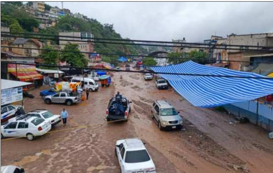
▲ En una de las entradas a la ciudad, en plena autopista cortada por los deslaves, familias enteras y mujeres cargando niños se quitaban los zapatos para meterse en el lodazal que atravesaban con el barro por encima de la rodilla y miedo en sus rostros.