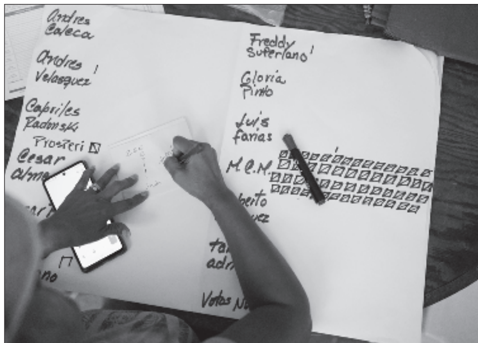
▲ Las internas opositoras realizadas en Venezuela, en las que se impuso la liberal María Corina Machado, fueron autogestionadas; el voto y el escrutinio fueron manuales.

Las internas opositoras, en las que se impuso la liberal María Corina Machado, fueron autogestionadas y no