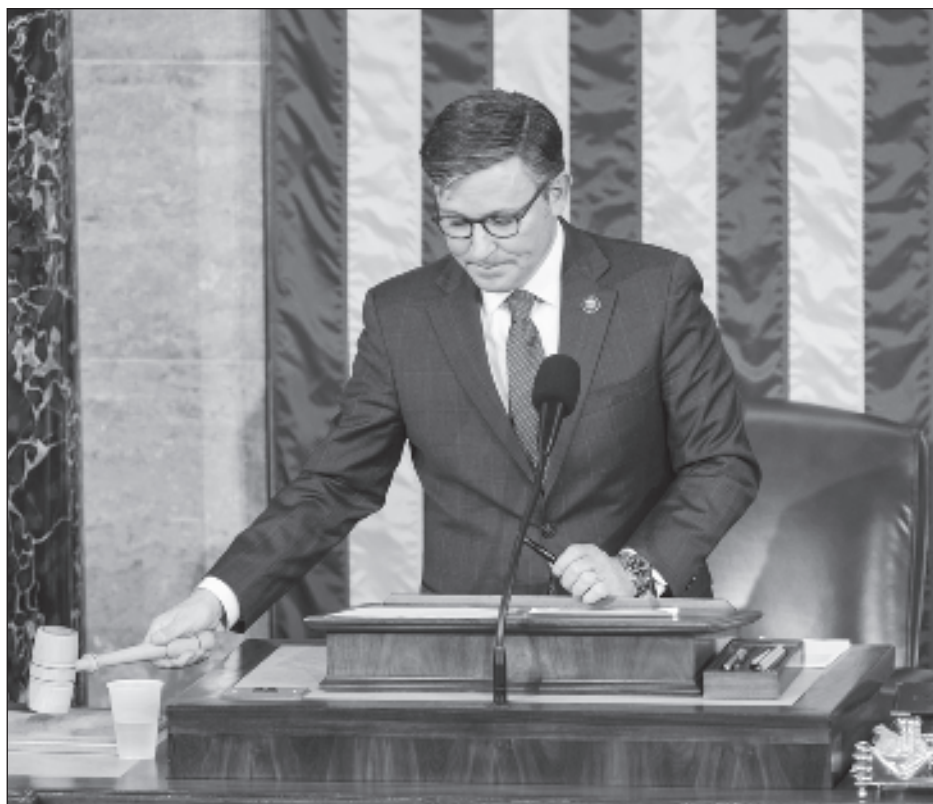
▲ Johnson, legislador por Luisiana, fue elegido con el apoyo de todos los republicanos, ávidos por dejar atrás las semanas de turbulencia y ocuparse de los asuntos de gobierno.

Los demócratas volvieron a postular al jefe de su bloque, Hakeem Jeffries, y criticaron a Johnson como arquitecto de gestiones legales de Trump para anular su derrota electoral de 2020.