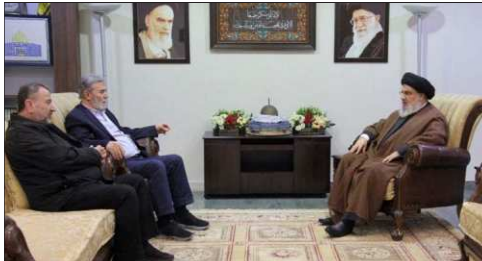
▲ Los tres hombres repasaron “los últimos acontecimientos en la Franja de Gaza desde el inicio de la operación Diluvio de Al Aqsa”, el nombre que Hamas le dio a la operación ejecutada pasado el 7 de octubre en suelo israelí, en la que murieron alrededor de mil 400 personas.

El anuncio se produce en un contexto muy tenso en el sur de Líbano desde que arrancó el 7 de octubre la guerra entre Hamas e Israel. Desde aquel día hubo enfrentamientos diarios de Hezbolá y sus aliados con las fuerzas israelíes en la frontera meridional de Líbano.