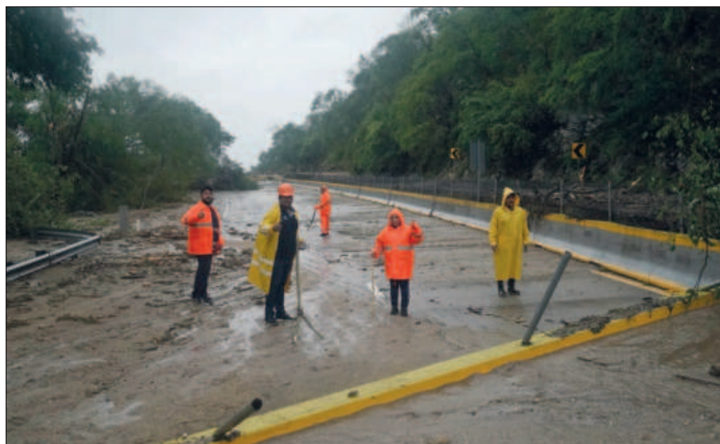
▲ Los daños irán apareciendo conforme avancen las horas, pero se ha sabido ya de la caída de la antena de una de las principales cadenas radiofónicas del país (...) pero aún no se sabe cómo está la gente.

Pero la principal lección ante los desastres naturales es que pierden más quienes menos tienen. Son golpes a los pies de la República, los que requieren de auxilio inmediato, de alimentos, atención médica y la pronta recuperación de un techo digno; cualquier discusión que implique reclamar lo que se pudo hacer con dinero en un instrumento del pasado es simple mezquindad.