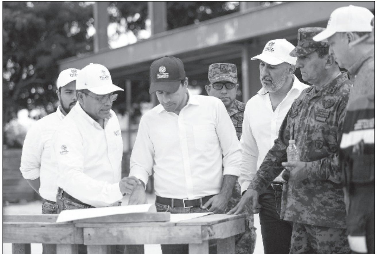
▲ En el Gran Parque de La Plancha convergerán las tres rutas del Ie-Tram, un transporte público 100% eléctrico y único en su tipo en Latinoamérica, que beneficiará a más de 1.1 millones de habitantes

Este espacio incluirá patio de carga, 5 bahías para autobuses, puertas de acceso a las bahías con validadores para pago electrónico,