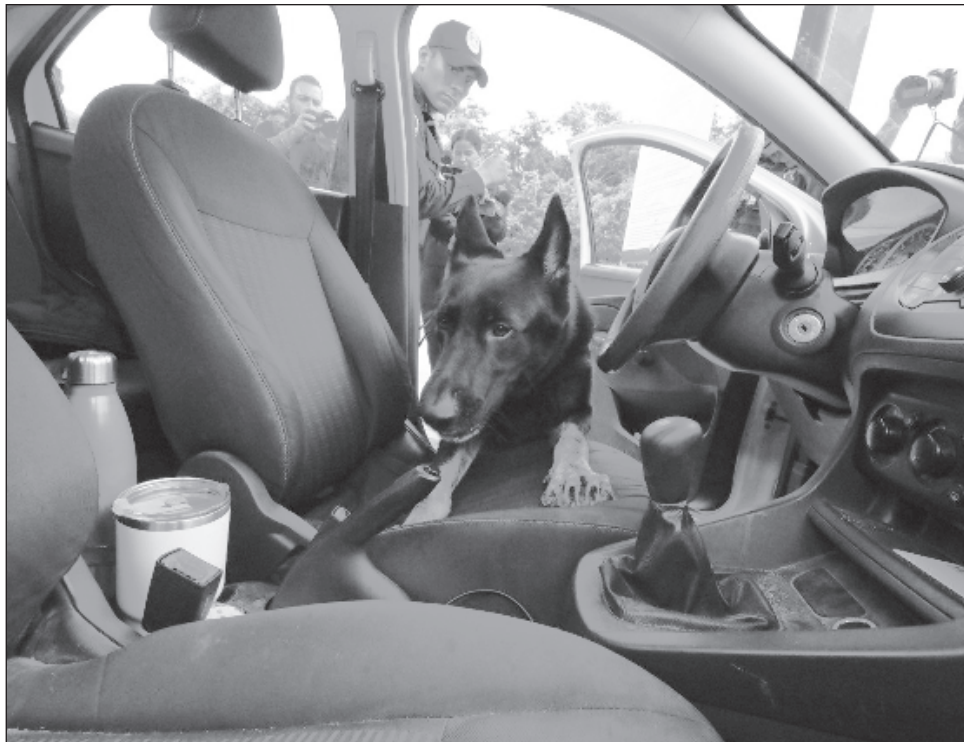
▲ Es un filtro policiaco que está avalado por la Secretaría de Infraestructura, Comunicaciones y Transportes y que cumple con las normas oficiales federales.

Cada filtro cuenta con reconocimiento facial y de placas, detector de veloci-