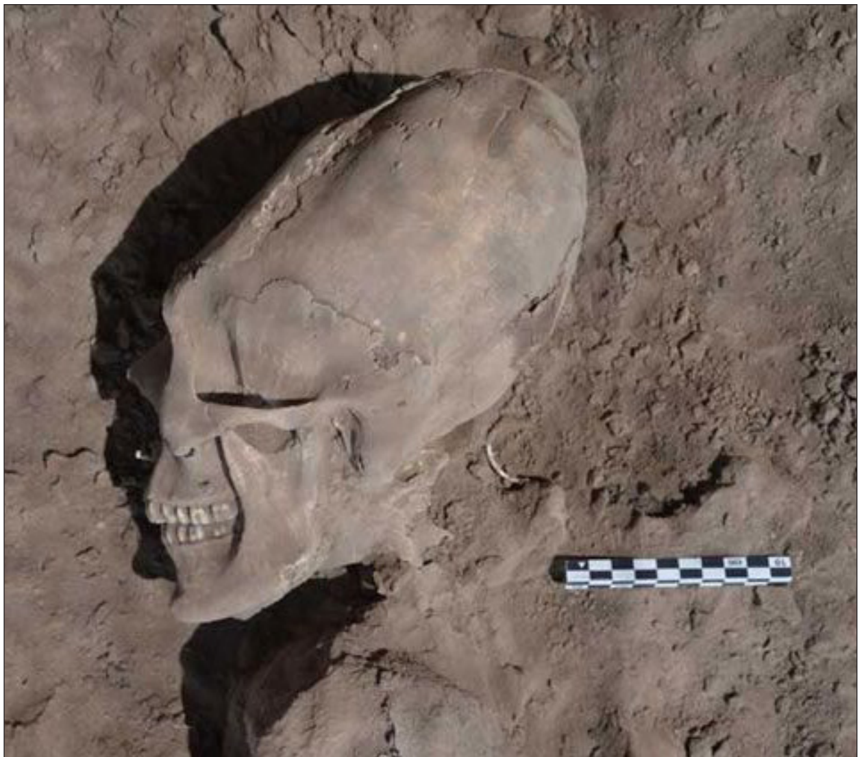
▲ K'eexile' ku beeta'al tu yáax ja'abilo'ob kuxtal, ts'o'oke' ku xáantal jayp'éeel ja'abo'ob táan.

Wiinkilalo'obe' úuchbentako'ob; ku tukulta'ale' kuxlajo'ob kex ichil u ja'abil 900 tak 1300 tu jaatsil ja'ab Nuestra Era, le beetik túune', ku béeytal u ya'alale' u kaajil Pimas máaxo'ob k'exik ka'ach u wiinkilalo'ob.