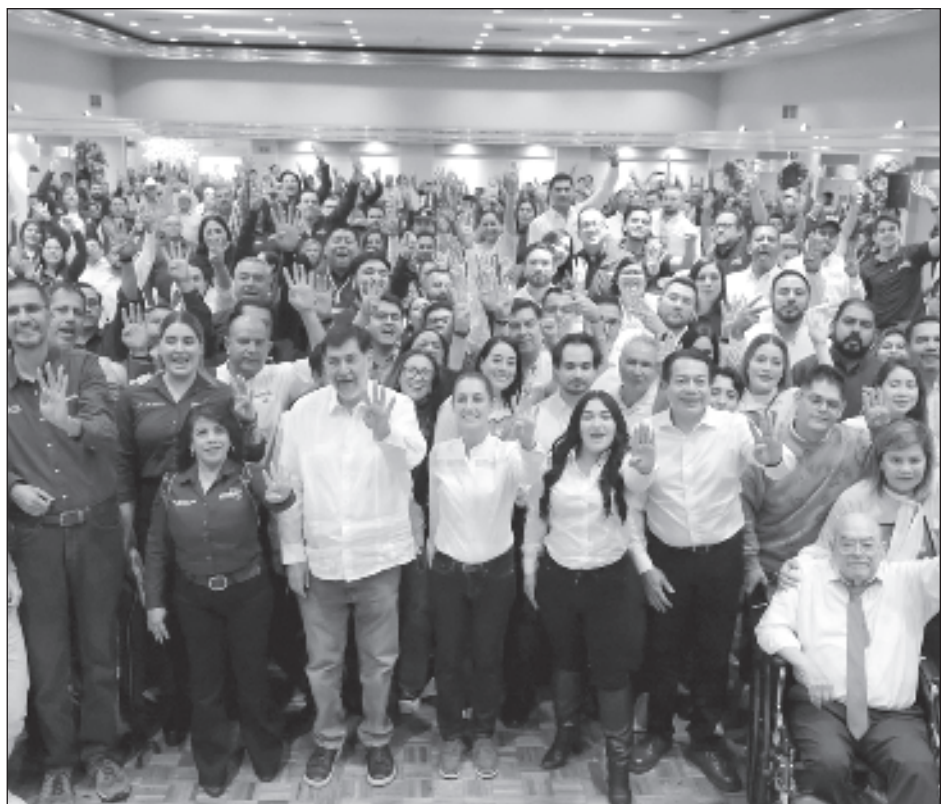
▲ Claudia Sheinbaum comentó que la movilización política por la extinción de los fideicomisos es parte del momento de definiciones y de búsqueda de bienestar.

En relación al evento del martes en la Ciudad de los Deportes, el cual tuvo que posponerse, lo desestimó y respondió que "a veces pasa que falta organización".