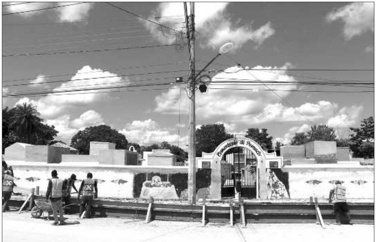
▲ La obra consta de trabajos de albañilería, así como de reparación de banquetas y de mobiliario urbano.

En el cementerio, se han realizado trabajos de albañilería, intervenciones en banquetas y guarniciones, y rehabilitación de mobiliario urbano. Así mismo, en la Calzada de los Muertos, los trabajos incluyen la demolición y colado de guarniciones, así como la colocación de bases y registros prefabricados junto con el tendido de tuberías. En el parque principal, se han realizado acciones similares, además de proteger los antiguos árboles del parque.