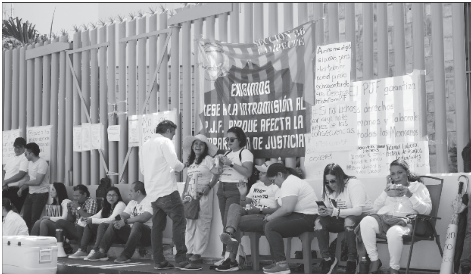
▲ “La Suprema Corte de Justicia de la Nación no anda con las mayorías (...) Casi todo el Poder Judicial anda de la mano de los poderes fácticos y los partidos políticos, ni siquiera opositores, más bien enemigos, del presidente Andrés Manuel López Obrador”.