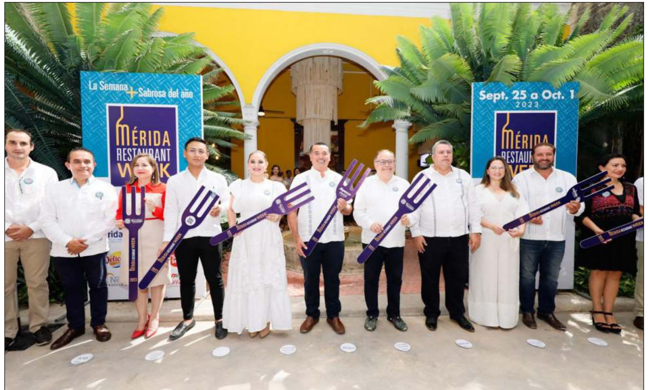
▲ Durante una semana, más de 300 restaurantes ofrecerán menús con precios especiales.