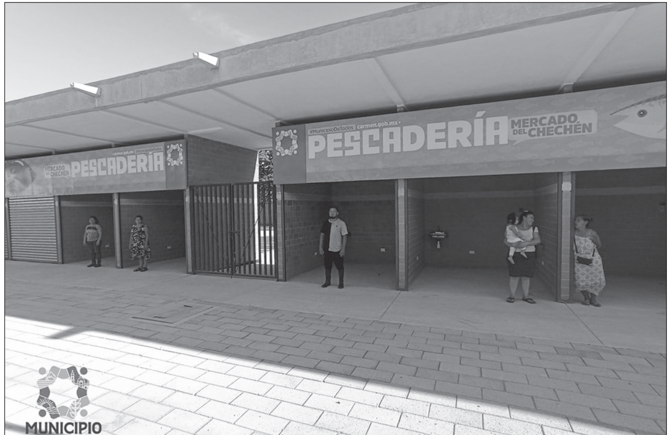
▲ El secretario de la comuna destacó el interés de las autoridades municipales por mejorar las condiciones de limpieza, orden y seguridad en que los comerciantes de la zona del Chechén realizaban sus actividades.