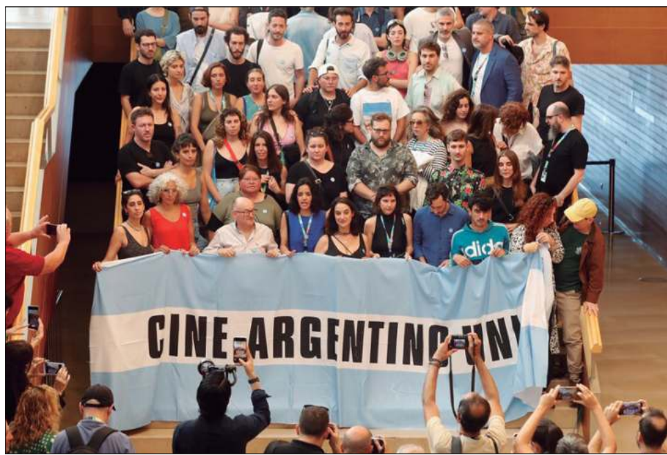
▲ Los inconformes posaron en la sede principal del Festival Internacional de Cine de San Sebastián con una bandera argentina, luego de que el candidato a las elecciones presidenciales, Javier Milei, amenazara con cerrar el Instituto Nacional de Cine y Artes Audiovisuales.

En un mensaje en la misma red social, el festival de San Sebastián quiso mostrar su apoyo al cine argen-