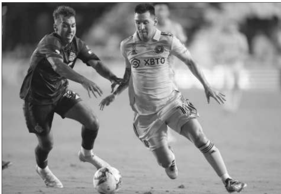
▲ Lionel Messi conduce el balón junto a Kobe Franklin, de Toronto, en Fort Lauderdale.

Con cinco duelos por disputar en la campaña regular de la MLS, Miami quedó a cinco puntos de alcanzar la última plaza que da acceso a un repechaje a los playoffs -ahora mismo con NYCFC y