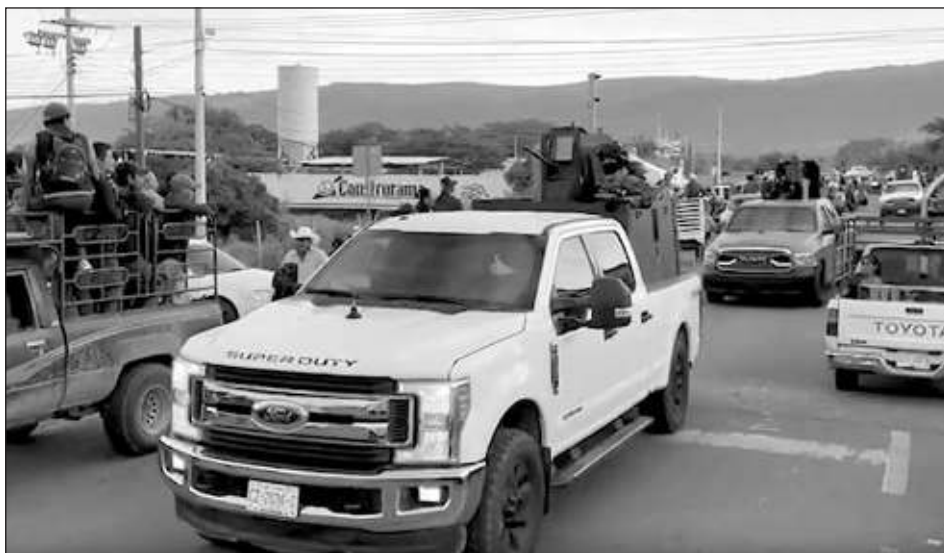
▲ Andrés Manuel López Obrador sostuvo la existencia de grupos de delincuencia organizada que pelean por territorio para tener dónde recibir la droga proveniente de Centroamérica. Foto captura de pantalla

Con la presencia del gobernador, Rutilio Escandón quien señaló que "en Chiapas estamos muy felices por la llegada del Tren Maya", el Presidente fue el que asumió todo el tema dijo que "afortunadamente no han habido muchos asesinatos en Chiapas en general y es ahí donde han habido estos enfrentamientos, pero ha habido mucha propaganda".