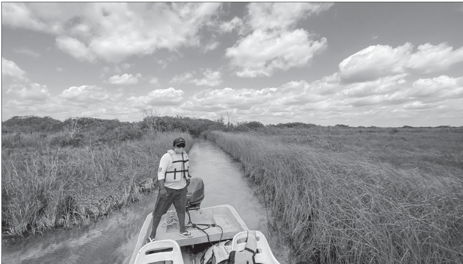
▲ Para algunos ejidatarios, la marca Maya Ka'an "excluye a las comunidades en los procesos de planeación, toma de decisiones y beneficio económico. Los comuneros consideran que todo proyecto de desarrollo de sus comunidades debe surgir de ellas, ser equitativa y participativa".