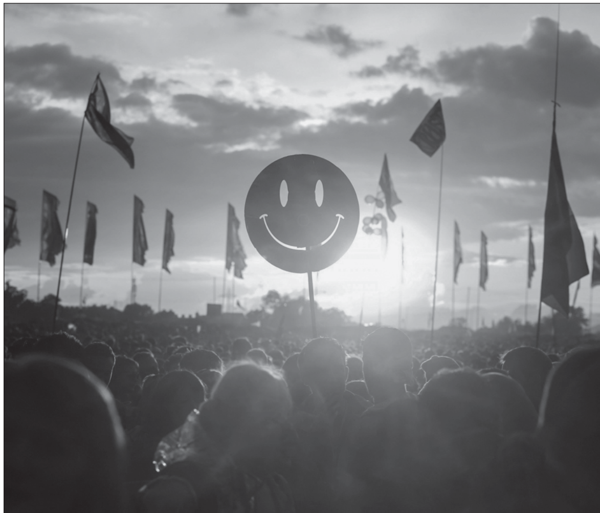
▲ "The index encourages policymakers to prioritize the well-being of citizens. Instead of solely focusing on economic growth, governments are prompted to consider the impact of their policies on the happiness of the population".

ONE OF THE key advantages of the happiness index is its ability to capture the intangible aspects of happiness. While material wealth is undoubtedly important, it is not the sole determinant of happiness. The happiness index recognizes