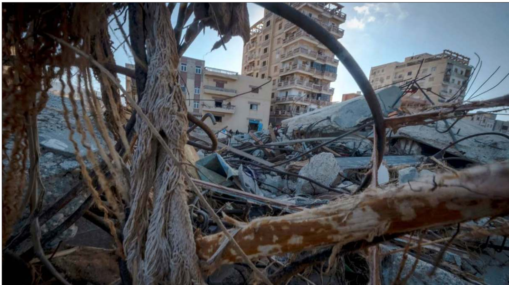
▲ Fiscalía alega que "las faltas que cometieron" y su "negligencia" en materia de prevención de los desastres "contribuyeron" a la catástrofe.

Pero empezó a dar señales de reapertura este mes, con la visita de su líder Kim Jong Un a Rusia y el envío de atletas a los Juegos Asiáticos de Hangzhou (China).