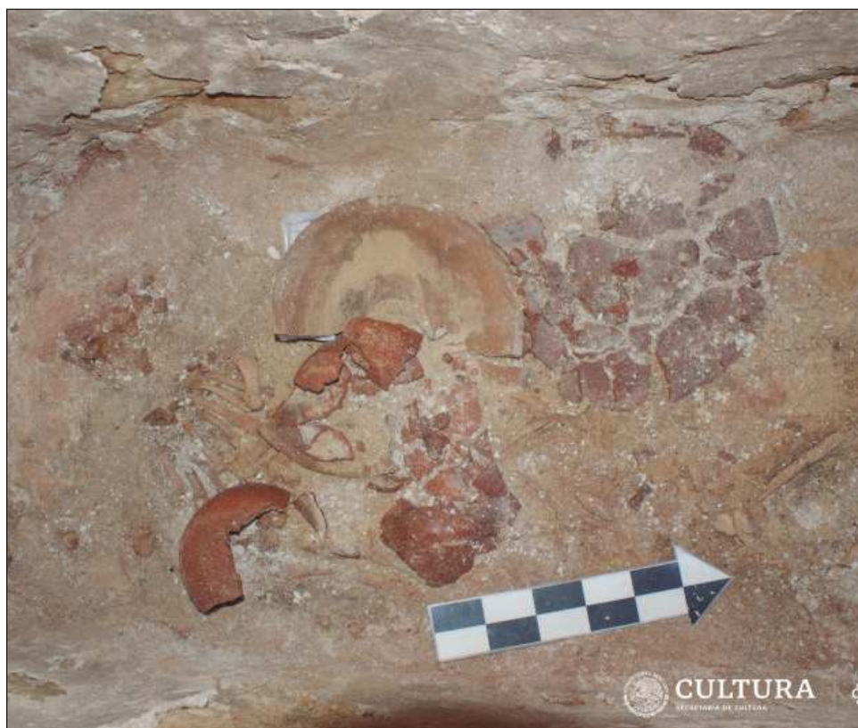
▲ La excavación hecha en el montículo principal del sitio arqueológico señala que el edificio fue construido ex profeso para contener la tumba del personaje.