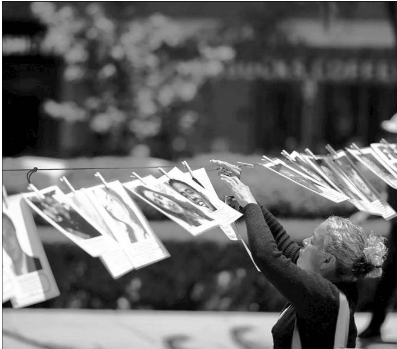
▲ El presidente Andrés Manuel López Obrador dijo que se está visitando casa por casa a los familiares para tener muy claro lo que está pasando en la República mexicana y se pueda identificar si hay personas con vida.

Por otro lado, el mandatario confirmó que este fin de semana realizará una gira para la supervisión de obras en el Estado de México: en Tecámac, Ecatepec, Chimalhuacán, Valle de Chalco, Texcoco e Ixtapaluca donde también sostendrá reuniones del Bienestar.