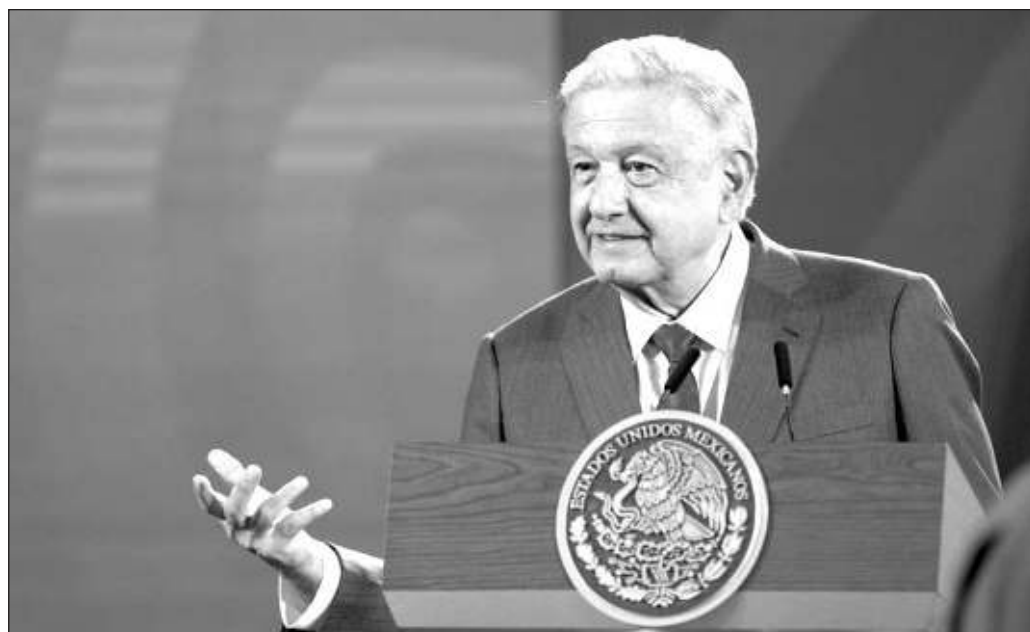
▲ El Presidente agrega que esta situación de propaganda va a continuar, porque es parte del proceso electoral del próximo año. Mientras, Comalapa quedó en vilo, a la espera de un convoy que no llegó.

Otra parte, tal vez mucho más importante, implica la presencia constante de cuerpos de seguridad, la persecución oficiosa y castigo puntual a la corrupción por parte de los gobiernos estatales, la evaluación y ajuste de las políticas de bienestar social, para hacer mucho más difícil la opción de ingresar a las filas del crimen organizado, y que las supuestas noticias de un convoy sean combatidas desde la percepción de una presencia fuerte de las instituciones del Estado para beneficio de la población más débil.