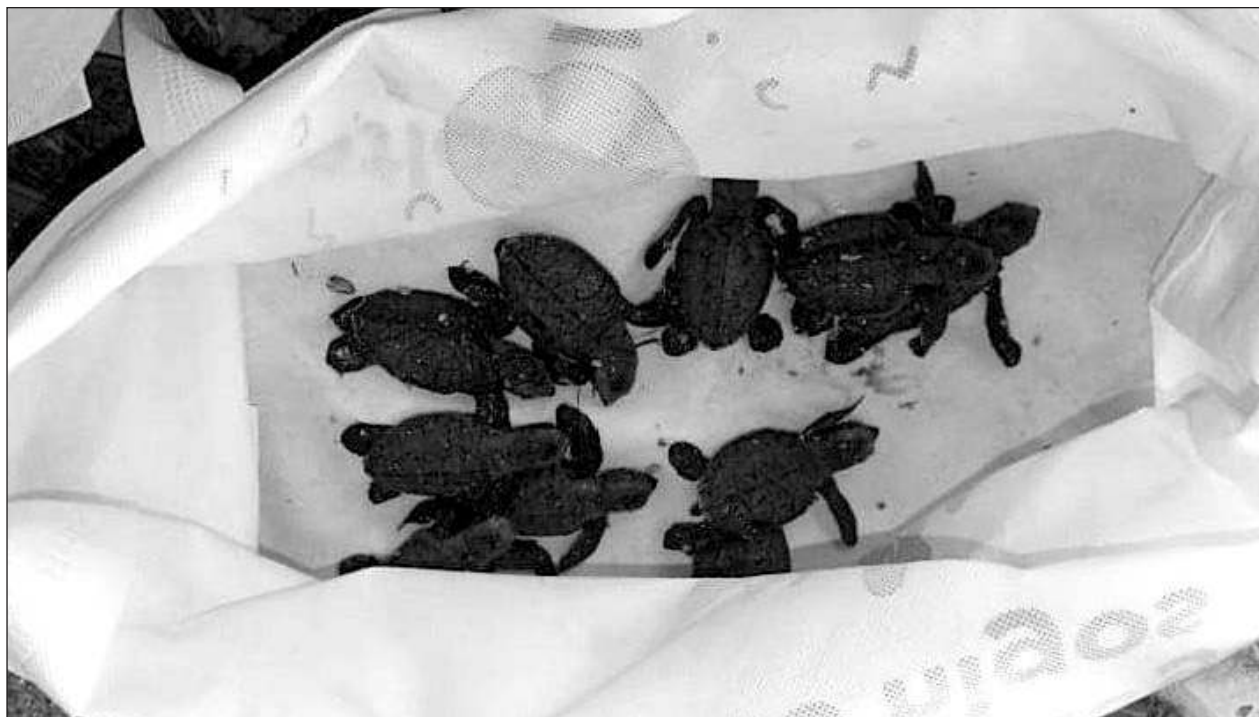
▲ Personal de la Policía Ecológica de Progreso rescató a 38 tortugas marinas recién nacidas que se encontraban en el sistema de control de una alberca en una casa de playa. Los

ejemplares se metieron en una zona de difícil acceso, lo que ponía en riesgo su vida. Sin embargo, los policías consiguieron resguardarlas para ser liberadas.