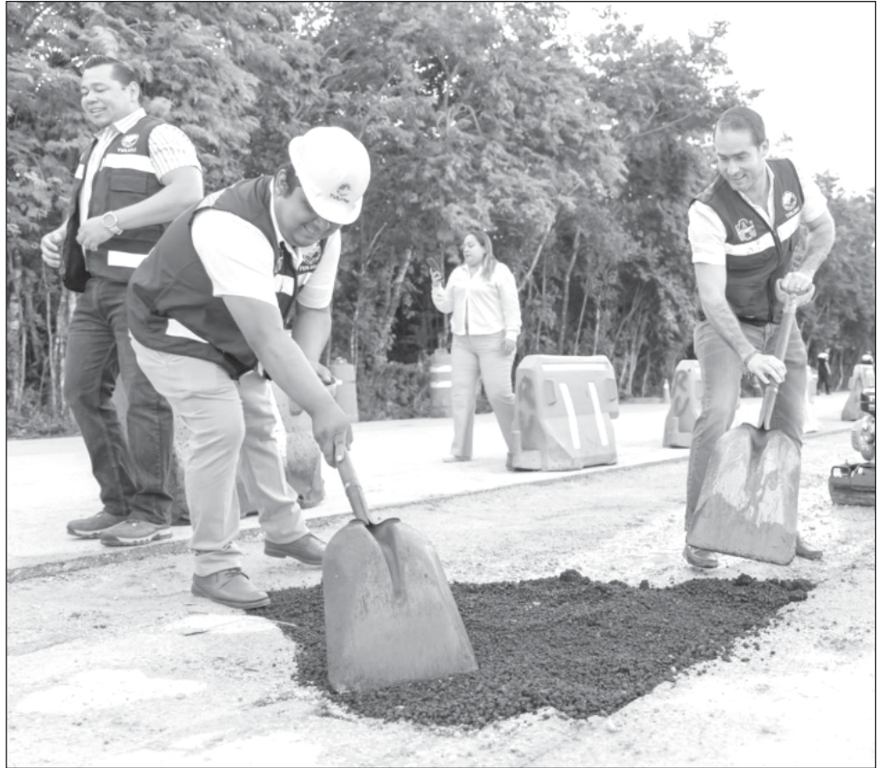
▲ Los trabajos serán divididos en cinco rubros: pavimentación; camellón central; ciclovía y jardineras; andador y cruces de acceso, y alumbrado público.