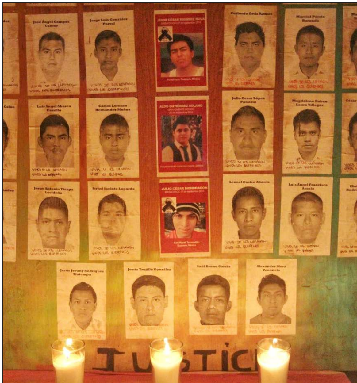
▲ “¿Dónde están?, es la pregunta desgarradora que flagela el alma de nuestra nación desde hace nueve años, un México consumido por la voracidad violenta de la sinrazón capitalista”.

Hoy, son ya nueve años, miles de horas de lucha por la verdad y la justicia, recordando, siempre recordando a los 43 normalistas. Los seis informes publicados por el Grupo Interdisciplinario de Expertos Independientes (GIEI) han dejado más que claro la participación directa, con alevosía y ventaja, de todas las estructuras del poder mexicano, las pruebas reveladas (y las aún ocultas también) comprueban lo que el Gobierno Federal de la 4T ha tenido que reconocer: “¡Fue el Estado!”, y el entonces presidente de México, Enrique Peña Nieto, sigue impune