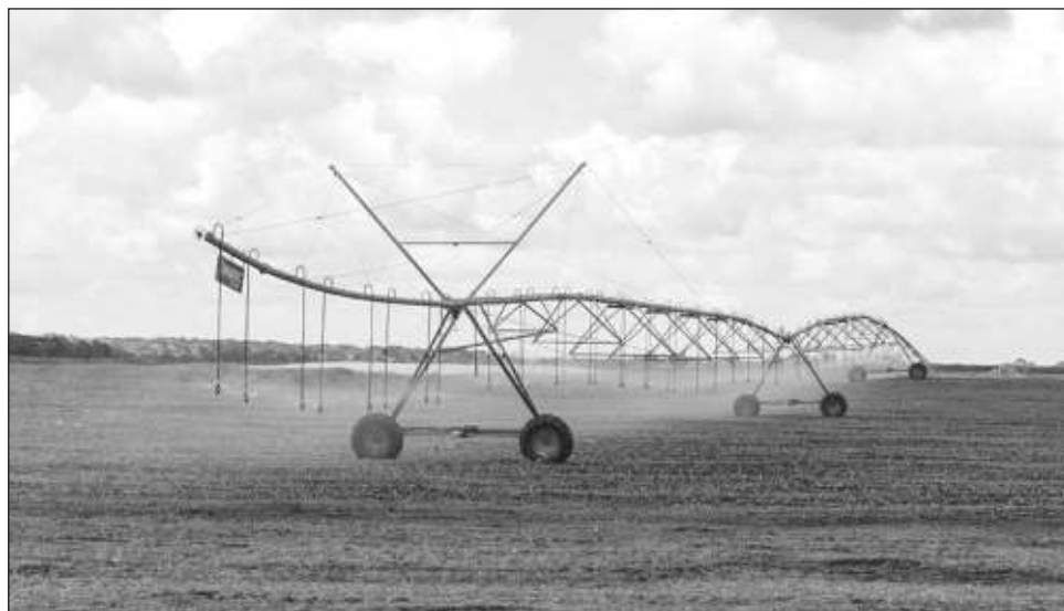
▲ La aseguradora destacó que México está altamente expuesto al incremento de las temperaturas durante los próximos 15 años, así como a los fenómenos hidrometeorológicos.

Al citar el informe del Banco de México: Riesgos y Oportunidades Climáticas y Ambientales del Sistema Financiero de México del Diagnóstico a la Acción , la aseguradora destacó que México está altamente expuesto al incremento de las temperaturas en los próximos 15 años y de los fenómenos hidrometeorológicos, por lo que es urgente combatir el impacto que tiene el cambio climático en la industria agroalimentaria y es importante crear soluciones innovadoras que respondan con