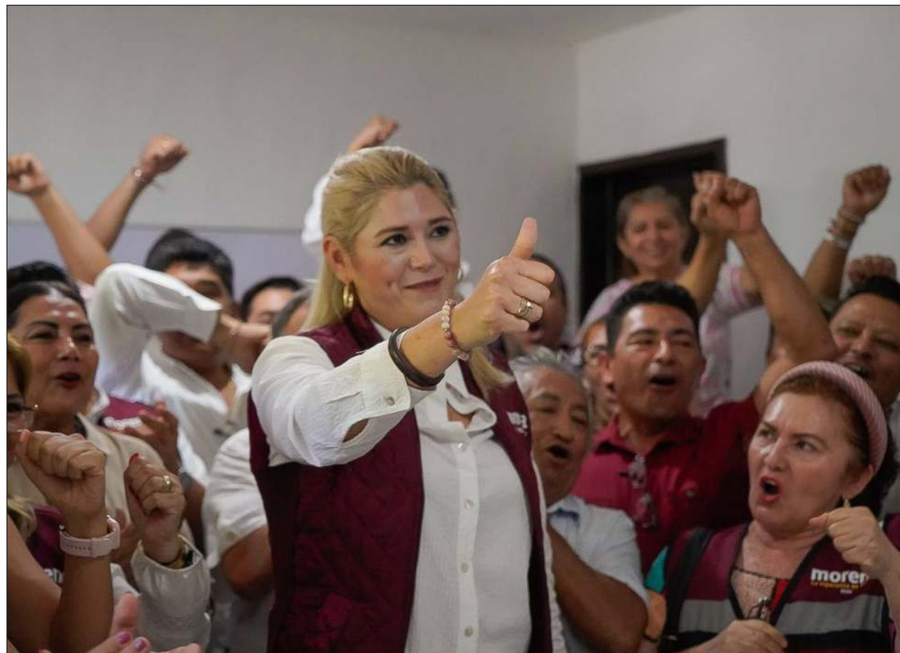
▲ La senadora Camino Farjat se registró en el proceso interno de Morena para ser la coordinadora de la Defensa de la Transformación en Yucatán con miras al proceso electoral de 2024.

Este es el momento, subrayó, para consolidar la 4T en el estado, para escribir una nueva historia dentro de la política, en donde la justicia social se vuelva realidad y los derechos sociales de los ciudadanos se