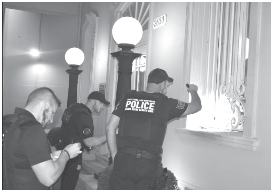
▲ Tras el ataque, Cuba dio acceso a las autoridades estadounidenses para que entren a la embajada y tomen muestras de los cócteles molotov.

El domingo por la noche, el ministro de Relaciones