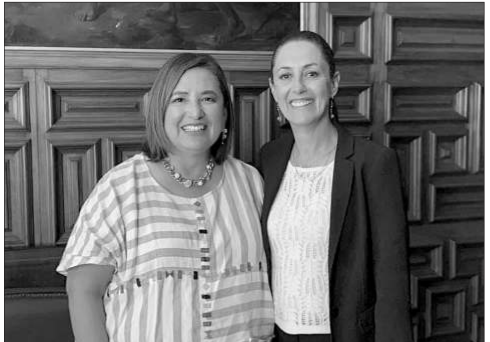
▲ Rumbo al proceso electoral se va a brindar seguridad a todo el que lo requiera, "tenemos que garantizarles su protección y evitar desgracias. Queremos que todo transcurra en paz".

Sobre el plan de protección, comentó que siempre en la historia de México los momentos de más efervescencia, divisiones y hasta violencia se presentan cuando se dan las transiciones, los cambios, renovaciones de poderes, si hay que cuidar. Hay que estar pendientes y no dar pie a que se enrarezca el ambiente. Y eso siempre tiene que ver con la llamada clase política y grupos de intereses creados, eso no es el pueblo.