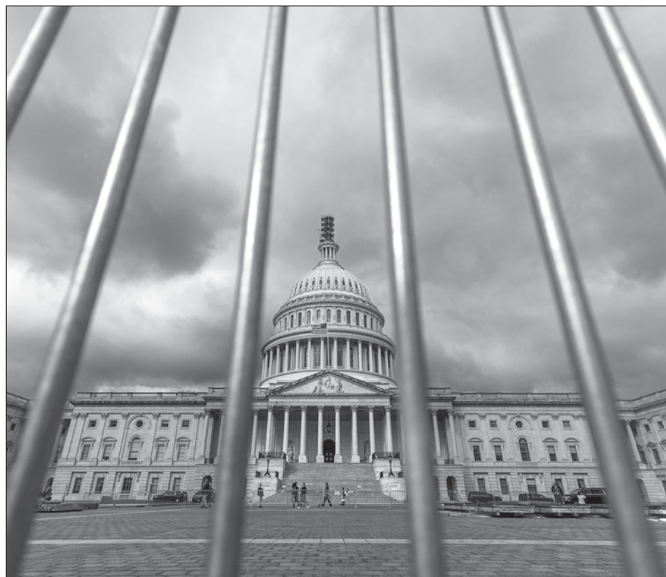
▲ Las primeras víctimas del entuerto serían unos dos millones de funcionarios federales que no recibirían su salario mientras dure lo que se conoce como shutdown o cierre de servicios públicos.

A poco más de un año de las elecciones presidenciales,