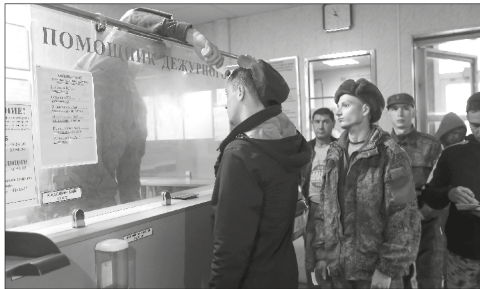
▲ Valeriy Fadeev, presidente del consejo de derechos humanos del Kremlin, citó el reclutamiento de 70 padres de familias numerosas en la región de Buriatia, en el extremo oriental, y de enfermeras y comadronas sin conocimientos militares a pesar de estar exentas.

Su hija publicó un video en las redes sociales que se hizo