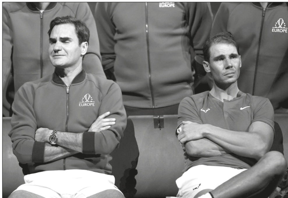
▲ Roger Federer y Rafael Nadal, tras el último partido de la leyenda suiza.

John McEnroe tenía récord de 0-4 como capitán de su equipo ante Bjorn Borg, su viejo rival y capitán del conjunto europeo. Ambos indicaron que volverán para la Copa Laver de 2023 en Vancouver, pero que sería su última.