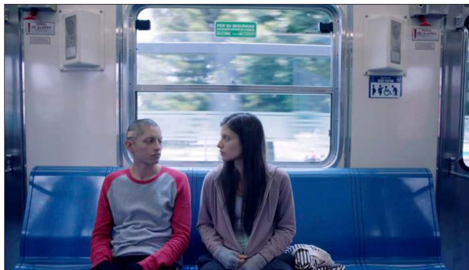
▲ El filme 50 (o dos ballenas se encuentran en la playa) refiere a los retos virales, particularmente uno al cual se le atribuyó la muerte de muchísimos adolescentes en el mundo. Foto Fotograma

Un rasgo característico de ambos personajes es que, explica, en un cierto momento, carecen de cejas, una característica facial que ayuda