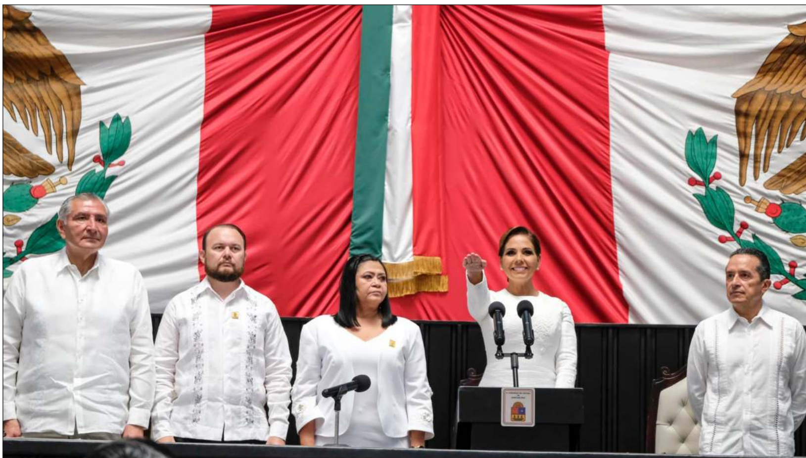
▲ La primera plana nacional y local de Morena arrojó a Mara Lezama, su segunda gobernadora en la península de Yucatán.