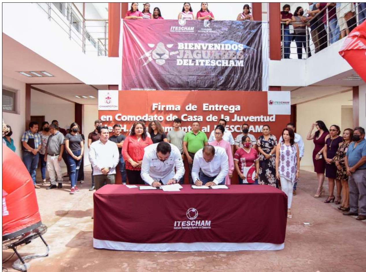
▲ La Casa de la Juventud Indígena permaneció abandonada tres años.

Según Cortés Moo, en el caso del inmueble recuperado, desde hace dos décadas o más aproximadamente, dicho edificio estaba entregado en comodato al PRI para que funcionara como oficinas de la representación municipal del partido, conocidos como Comités Directivos Municipales. Hoy permanece cerrado hasta culminar el proyecto con el gobierno estatal.