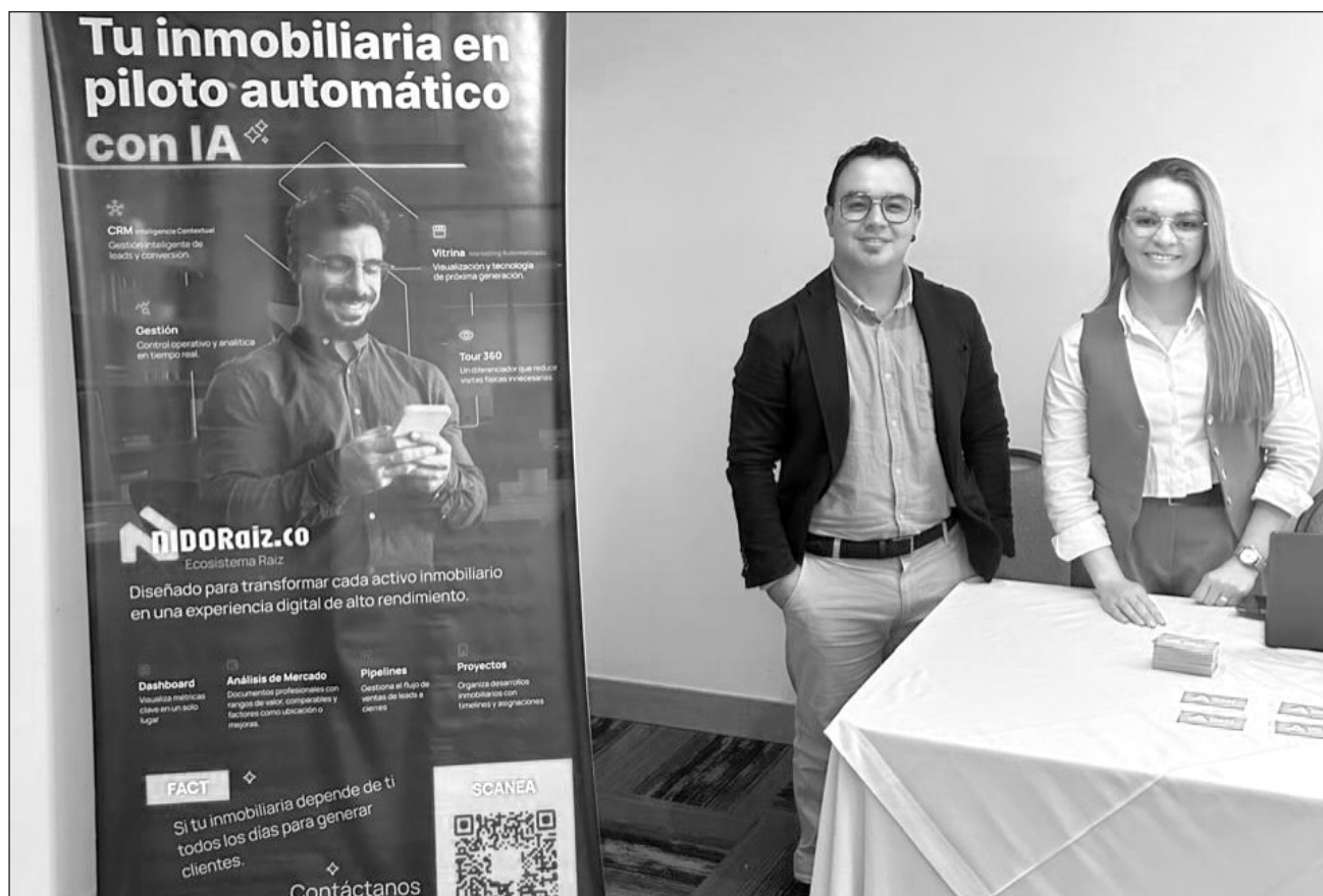
▲ La novena edición del Pro Tech Latam Summit Week abordará la transformación tecnológica del sector.

“Las reglas del juego están siendo rescritas por la tecnología, por nuevas formas de habitar, de construir, de