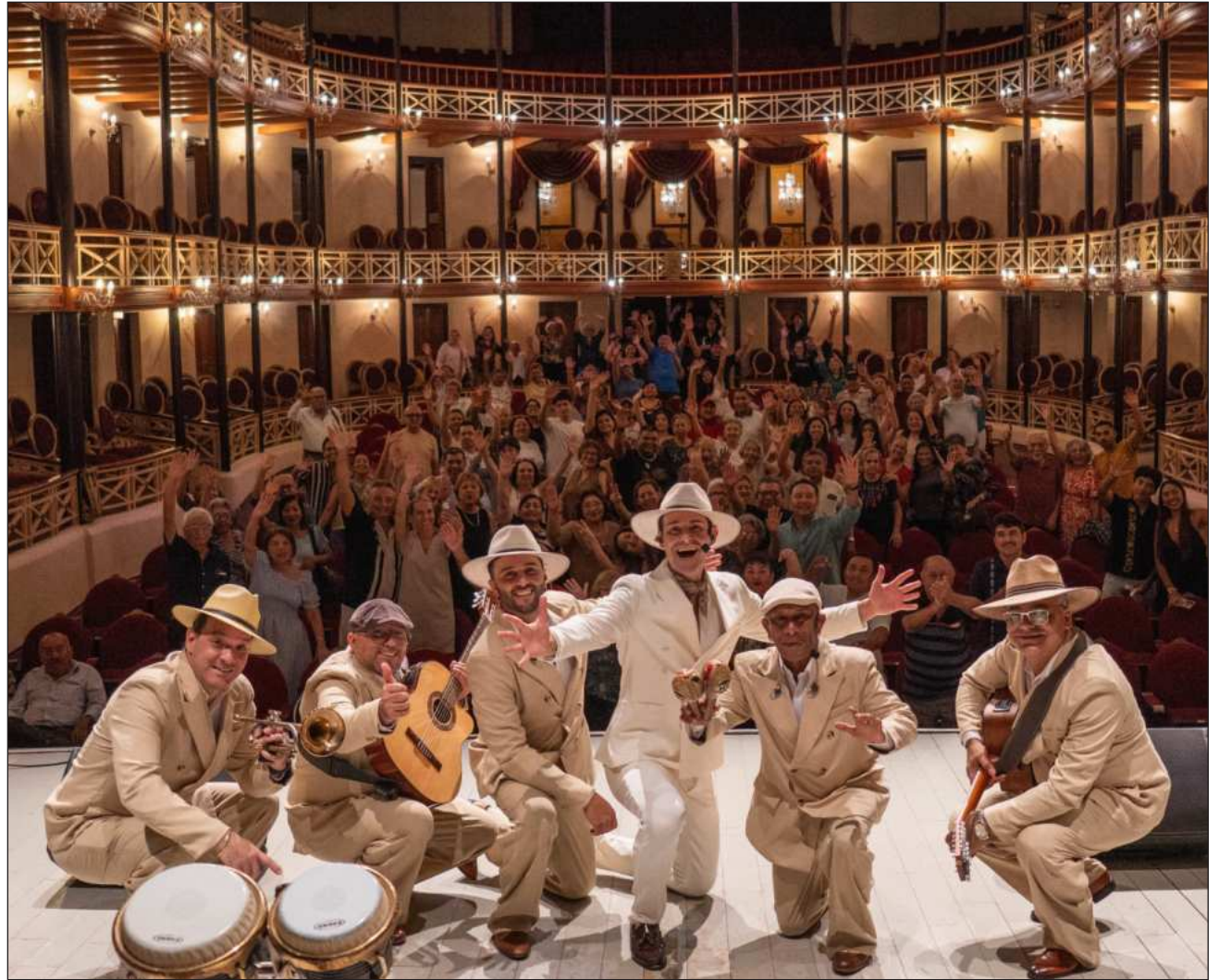
▲ Los asistentes conocerán las historias de las canciones mientras disfrutan de interpretaciones en directo.

Asimismo, indicó que Protección Civil de Tulum mantiene coordinación permanente con distintas dependencias municipales y con autoridades estatales, con el propósito de trabajar bajo la misma estrategia y compartir información actualizada sobre prevención y atención de emergencias.