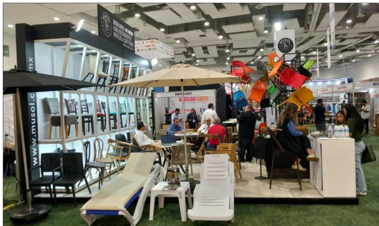
▲ Los proveedores son quienes suministran alimentos, químicos y servicios básicos a la industria hotelera.

Esta fragmentación administrativa obliga a las empresas a gestionar múltiples trámites individuales ante