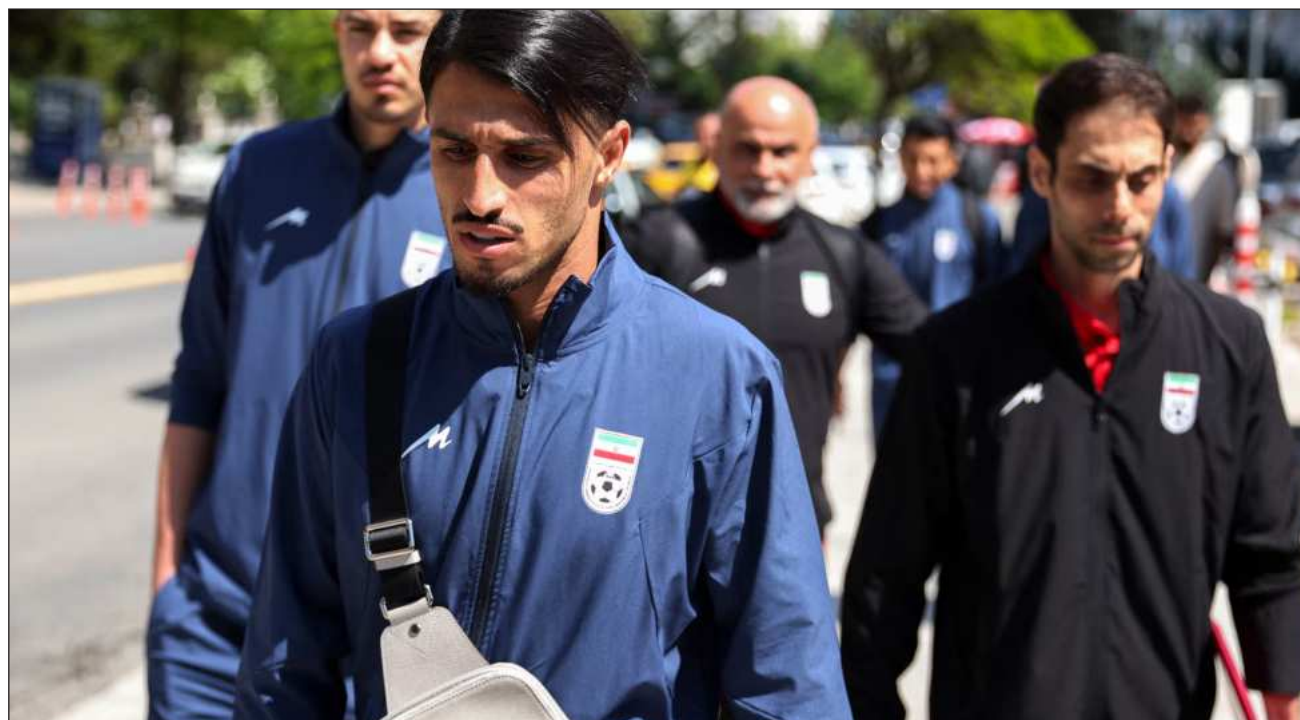
▲ Sheinbaum señaló que la FIFA expuso al gobierno mexicano que los juegos de Irán se mantienen en el país vecino

"Estados Unidos no quiere que la selección (iraní) se quede a pernoctar en ese país"