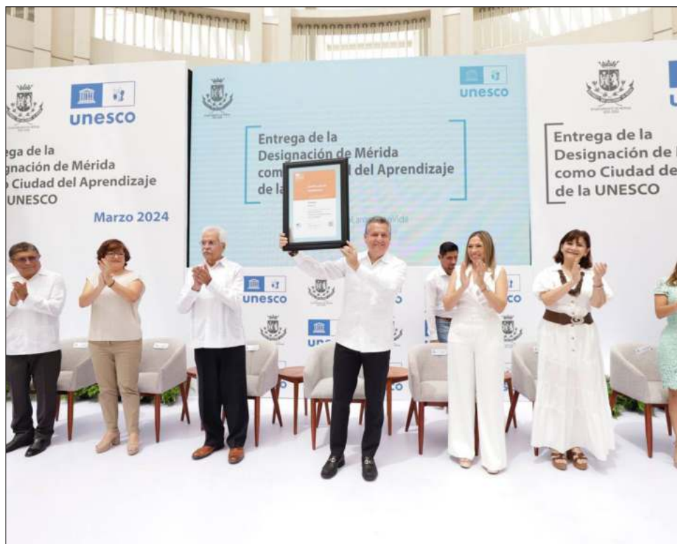
▲ Mérida presentó la mejor propuesta de toda la región ante la Organización Mundial para la Ciencia y Cultura, lo que le valió el reconocimiento.

El coordinador de Programa en el Instituto de la Unesco y director del Programa de la Red Mundial de Ciudades del Aprendizaje, Raúl Valdés, remarcó que cada ciudad se dedica también a mejorar las condiciones de vida urbana y la calidad del aire mediante la promoción de transporte alternativo y la gestión ambiental.