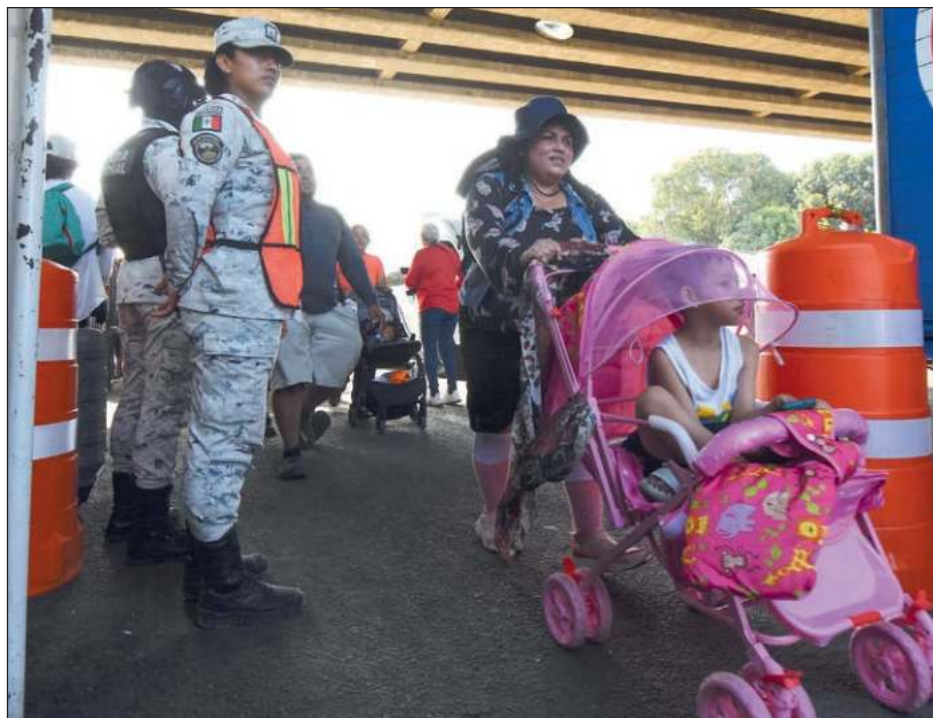
▲ Cerca de 2 mil personas de Centro, Sudamérica y Caribe conforman la caravana.

“Aquí va gente trabajadora, va gente honesta, aquí