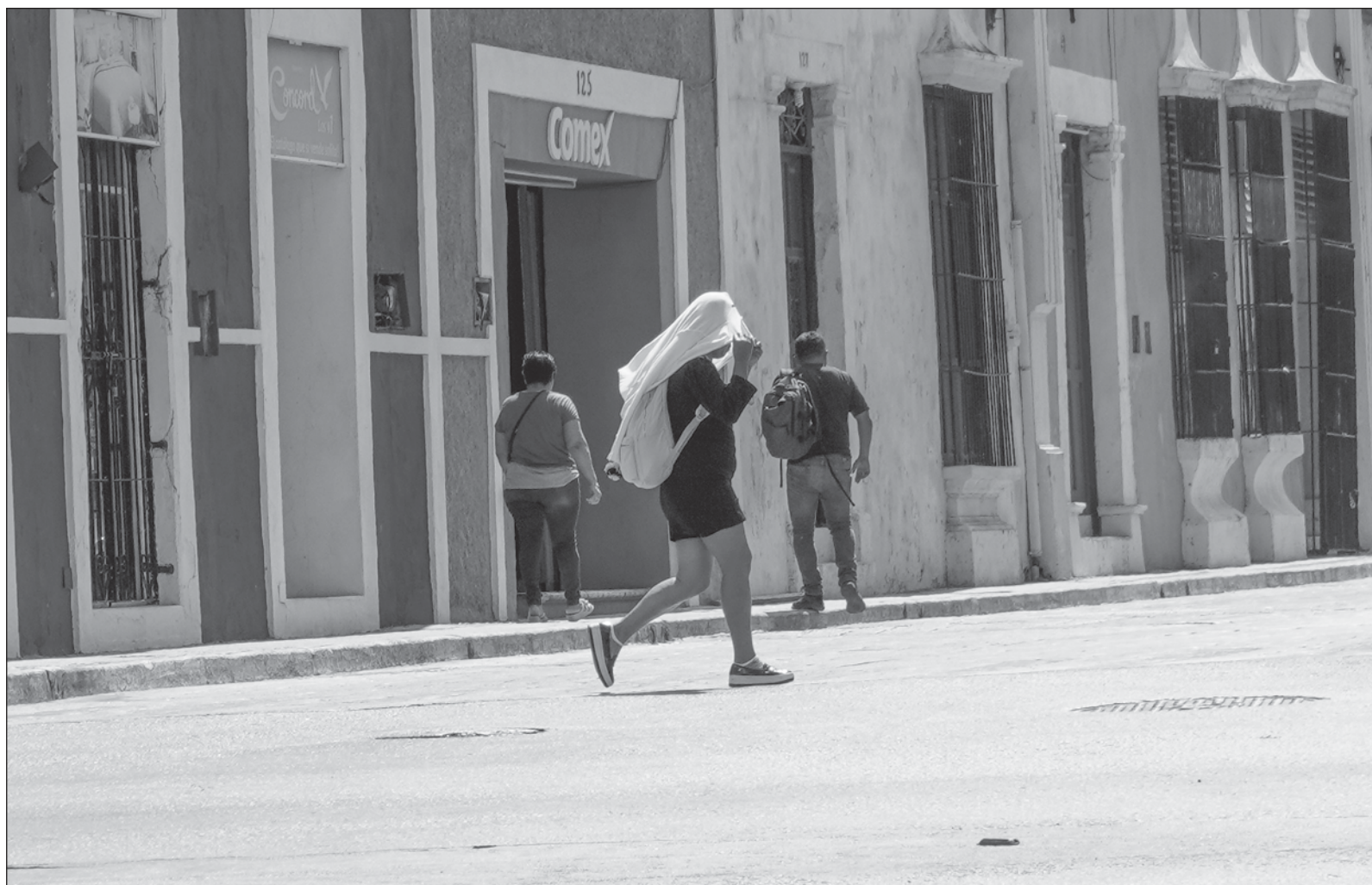
▲ "Para la primera quincena de marzo 2024, el porcentaje del territorio nacional con sequía moderada a excepcional fue de casi 60 por ciento".