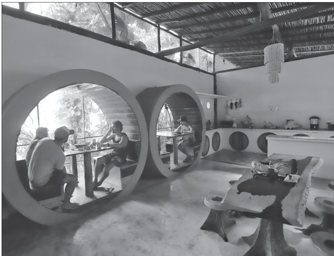
▲ El fin de semana largo fue un aliciente para los restaurantes: operaron arriba de 90 por ciento.

Muchos hoteleros y restaurantes de grandes cadenas, mencionó, tienen tasados sus salarios en dólares y parece ser que ya se adecuaron esas finanzas y empieza a sentirse ya una recuperación.