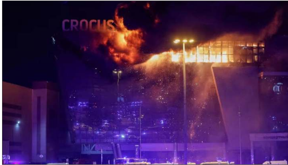
▲ “Sabemos que este crimen fue cometido por islamistas radicales con una ideología contra la que el mundo islámico ha estado luchando durante siglos”, dijo Vladimir Putin en una reunión del gobierno.

“Sabemos que este crimen fue cometido por islamistas radicales con una ideología contra la que el mundo islámico ha estado luchando durante siglos”, dijo en una reunión del gobierno retransmitida en te-