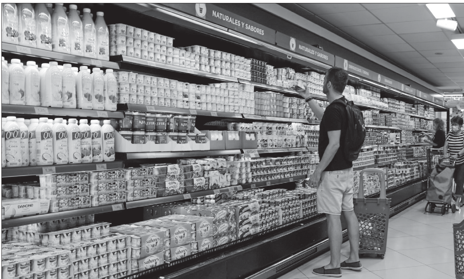
▲ "El ajuste a la baja fue acordado aún cuando la inflación aceleró levemente pero está por debajo de los niveles de 2022".

@MartinGonzama X: @galvanochoa Facebook: galvanochoa