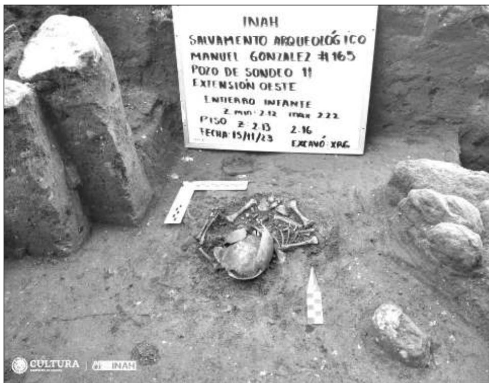
▲ Tlatelolco permaneció ocupada por población indígena, y no hubo un cambio inmediato de su modo de vida, como lo demuestra el hallazgo del entierro de un neonato.

La arqueóloga Xantal Rosales, quien explora el