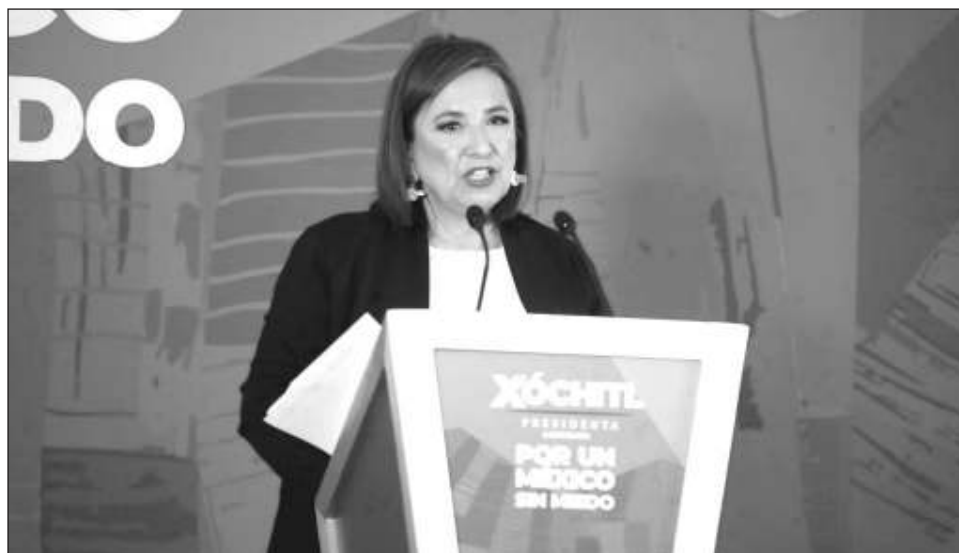
▲ La candidata de la oposición expuso que “podría vivir” en las cabañas de Los Pinos remodeladas por Vicente Fox, y las cuales también fueron ocupadas por Calderón.

Durante su conferencia de prensa, en su casa de campaña en la colonia Anzures, la abanderada de la oposición expuso que de haber las condiciones de seguridad, y en caso que ella fuera la ganadora de la contienda, llevaría las oficinas del Ejecutivo federal al completo de Los Pinos, que sirvió de casa presidencial en sexenios pasados y que desde 2018 fue abierto al público como complejo cultural.