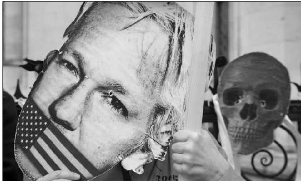
▲ La justicia de EU reclama a Assange haber publicado a partir de 2010 más de 700 mil documentos confidenciales sobre actividades militares y diplomáticas estadounidenses, en particular en Irak.

"Aquí estamos. Decisión mañana (martes)", dijo Stella Assange, la esposa de Assange, en la red social X.