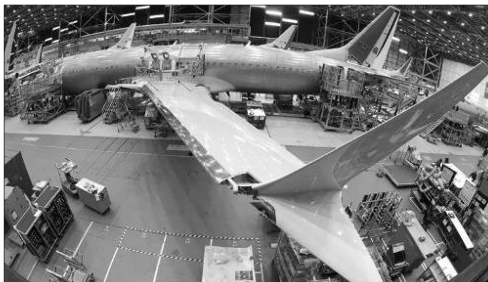
▲ David Calhoun asumió el mando cuando el fabricante de aviones buscaba recuperarse de crisis consecutivas, primero por los dos accidentes del MAX en 2018 y 2019 que mataron a 346 personas y luego por la pandemia, que lo cargaron con una deuda de 38 mil millones de dólares.

Sin embargo, la compañía luchó por deshacerse de los problemas de producción y las preocupaciones de seguridad durante su mandato, frustrando a sus aerolíneas clientes y provocando un mayor escrutinio por parte de los reguladores estadounidenses, así como de los legisladores.