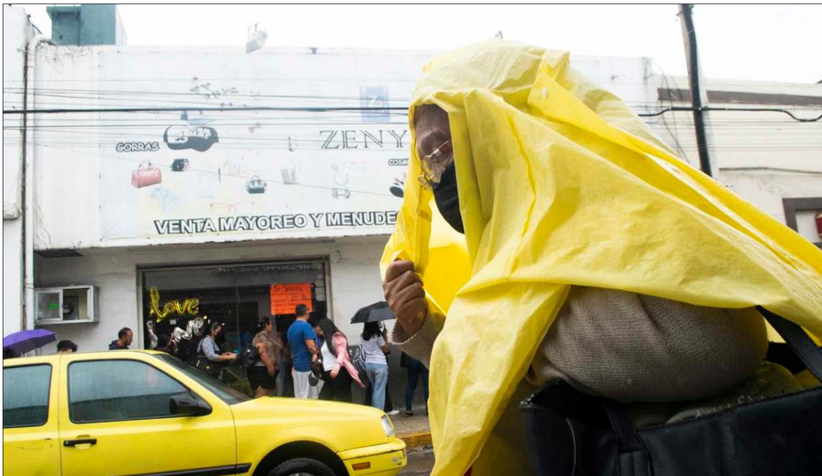
▲ Los efectos se sentirán principalmente en el oriente, centro y sur de Yucatán, sin descartar la presencia de chubascos dispersos en el noroeste.