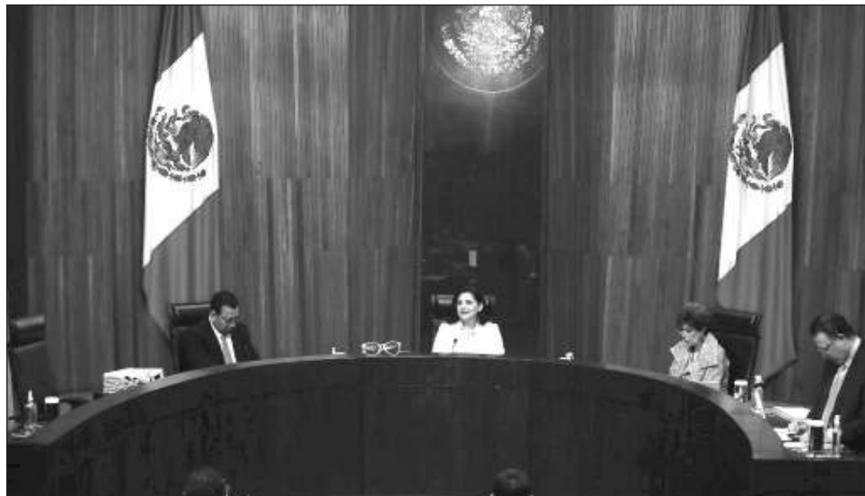
▲ En el desglose de multas, cada partido de la coalición Fuerza y Corazón por México deberá pagar multas por 134 mil 862 pesos; mientras que MC y Samuel García r 31 mil 122 cada uno.

En siete diferentes asuntos analizados y discutidos por el pleno de la sala regional especializada del Tribunal Electoral del Poder Judicial de la Federación (TEPJF) se aprobaron por unanimidad diversas multas, de las cuales los partidos políticos que tienen como candidata a Gálvez sumaron 404 mil 586 pesos por la falta al de-