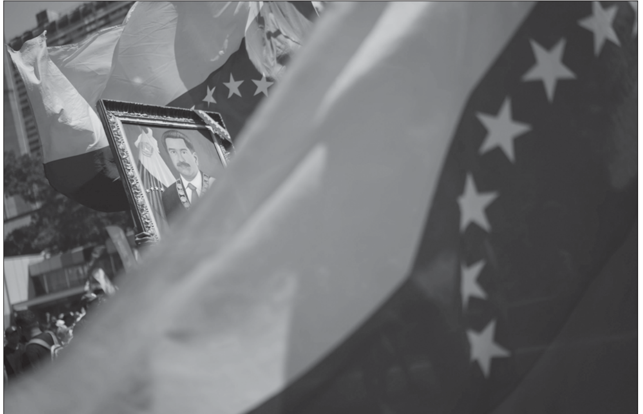
▲ Nicolás Maduro, de 61 años de edad, entra en una carrera para extender su poder por seis años más.

La principal coalición opositora, la Plataforma Unitaria Democrática (PUD), denuncia impedimentos para acceder al sistema e inscribir a su candidata, la historiadora Corina Yoris,