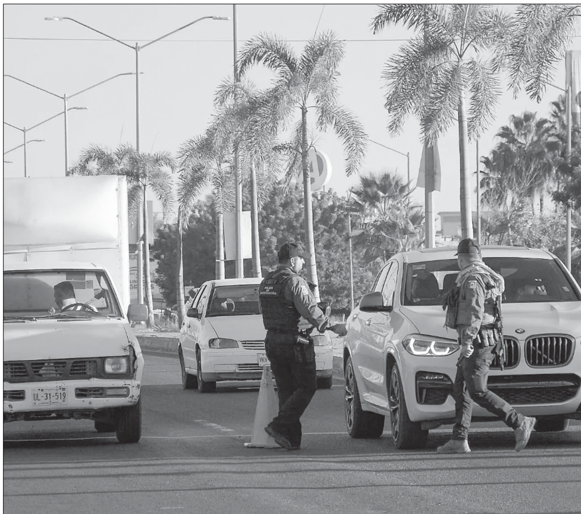
▲ “Los secuestros, que incluyeron a familias enteras (padre, madre e hijos, en varios casos), se perpetraron durante unas siete horas del viernes (...) pronto se anunció el arribo a la capital sinaloense de 300 elementos de la Guardia Nacional”.

ADEMÁS, LLEGARON 600 integrantes del Cuerpo de Fuerzas Especiales de la Secretaría de la Defensa Nacional, el grupo de élite, destinado a operaciones encubiertas o especiales, que hasta 2004 era llamado Grupo Aeromóvil de Fuerzas Especiales, Gafes. Recuérdese que un teniente de este Grupo, Arturo Guzmán Decena, enviado a Tamaulipas a “combatir” al crimen organizado, renunció al Ejército, desde donde brindaba protección al Cártel del Golfo , para fundar en 1997 Los Zetas .