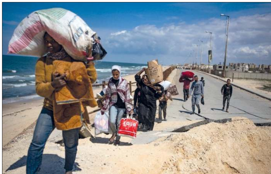
▲ El grupo islamista Hamas celebró la resolución del Consejo de Seguridad de la ONU que pide un "cese el fuego inmediato" en la Franja de Gaza y expresó su "voluntad de iniciar un proceso de canje" de rehenes.

"Hamas saluda el llamamiento del Consejo de Seguridad de las Naciones Unidas a un cese el fuego inmediato", indicó un comunicado del