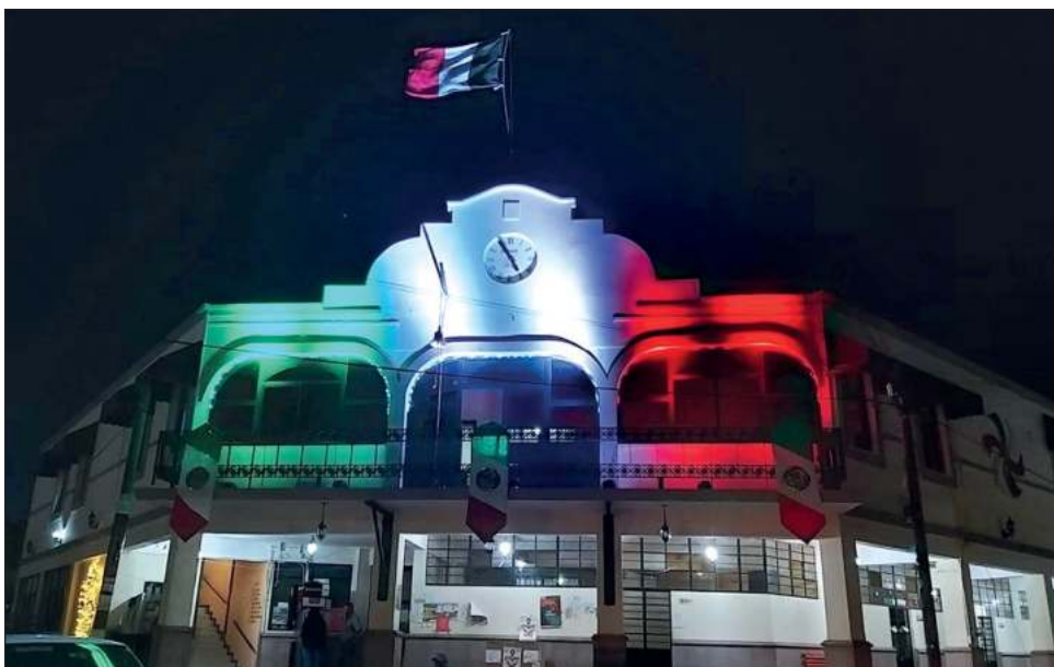
▲ La Fiscalía General del Estado de San Luis Potosí no precisó en su comunicado a los medios si los cuerpos abandonados presentaban huellas de violencia.

Dijeron que ya se realiza un operativo coordinado entre fuerzas estatales y federales.