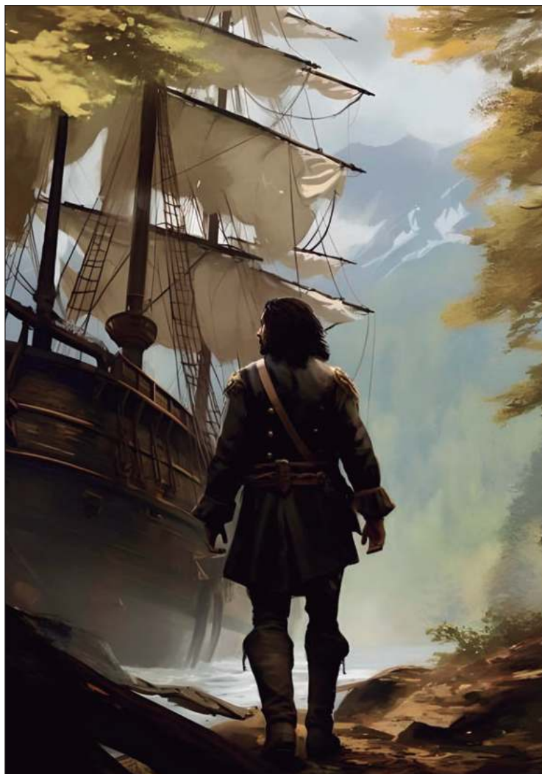
▲ “Aguilar se volverá un cristiano devoto, célibe y diácono. Guerrero en un detestable hereje ‘peor que indio’”.

AL ESCRIBIR SU Cuarta Década (1520) corrigió el error: sólo que la corrección salió peor. No eliminó el festín canibal, sino que lo trasladó a Yucatán. ¿Por qué lo hizo? No lo sabemos, pero tal corrección tenía un problema: ¿por qué si los indios eran caní-