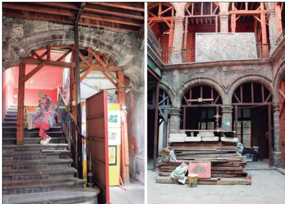
▲ El Museo de la Caricatura rescata y resguarda la obra de todos los miembros de la Sociedad Mexicana de Caricaturistas y de ilustradores más antiguos.

Entre abril y mayo de 2023, el inmueble del Antiguo Colegio de Cristo, actual sede del Museo de la Caricatura, resultó electo por el gobierno federal para recibir 3 millones 260 mil 581