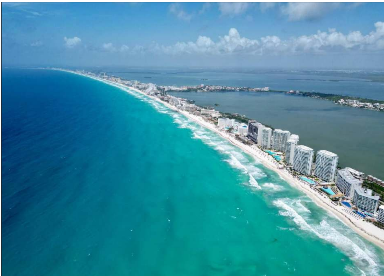
▲ Los gobiernos estatal y municipal han fortalecido las estrategias de seguridad para mantener saldo blanco a lo largo de esta temporada vacacionla, dio a conocer la Secretaría de Turismo en Benito Juárez.

“Es ver cómo podemos llegar a los turistas que vienen ya, que conozcan sobre el equipo pero en realidad que puedan tener su experiencia e incluir la experiencia de venta dentro del hotel para que puedan asistir a los partidos y también trabajar para que lleguen a Cancún y ya tengan sus boletos de entrada para el estadio, entonces sin duda es una de nuestras prioridades, tener presencia de nuestra marca en los hoteles”, acotó el vicepresidente del club.