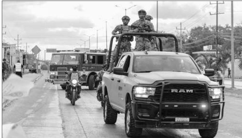
▲ En el operativo participan elementos de Protección Civil, Seguridad Pública, Sedena, Marina, Guardia Nacional y la Fiscalía General del Estado.

El municipio recalzó a las personas la importancia de los actos preventivos y evitar cualquier tipo de excesos tanto en consumo de alimentos y bebida como no manejar cansados o alcoholizados, y exhortó a pasarla bien en estas vacaciones, que son una temporada 100 por ciento familiar. Manifestó que Tulum cuenta con una gran variedad de lugares turísticos, como sus zonas arqueológicas, sus comunidades mayas, los cenotes, playas y zonas protegidas.