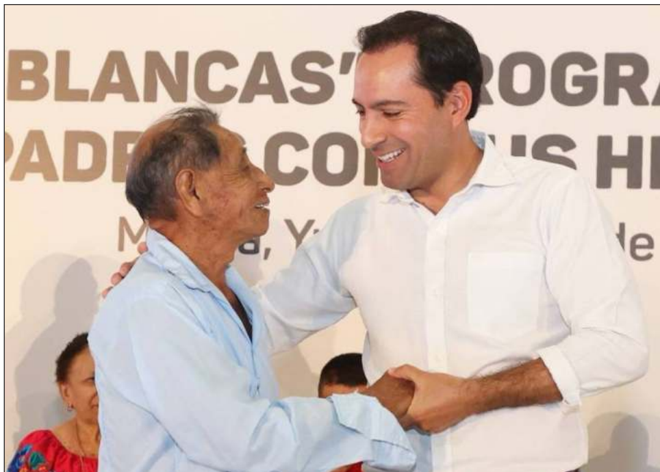
▲ Las madres y padres se reencontrarán con 127 hijos en ciudades como Alabama, Colorado, Las Vegas, Los Angeles, Louisiana, Missouri, Portland y Wisconsin.

Los viajeros se dirigirán hacia la Unión Americana con este esquema son originarios de 27 municipios: Abalá, Akil, Buctzotz, Cenotillo, Chacsinkín, Chapab, Chumayel, Dzan, Dzitás, Dzoncauich, Huhí, Mama, Maní, Mérida, Motul, Muna, Oxkutzcab, Peto, Pisté, Tunkás, Tekax, Ticul, Hunucmá, Tahdziú, Tetiz, Santa Elena y Valladolid.