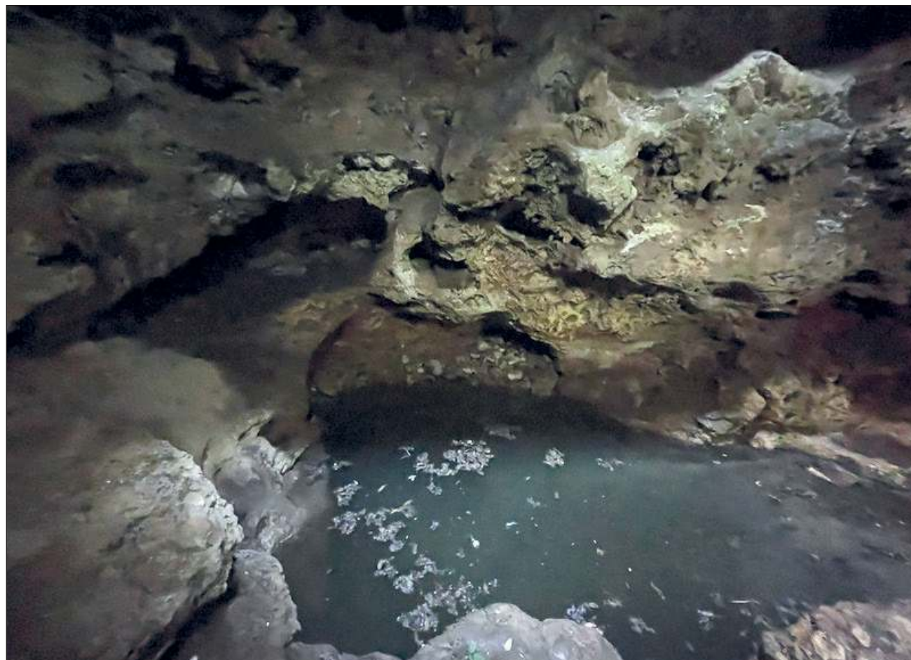
▲ Diversos estudios, elaborados desde la década de los 80 en Yucatán, documentan que el agua de pozos, cenotes e incluso en el agua entubada hay presencia de plaguicidas altamente peligrosos relacionados con cánceres y otros problemas de salud.

Ante esta crisis, han surgido grupos ciudadanos organizados que además de