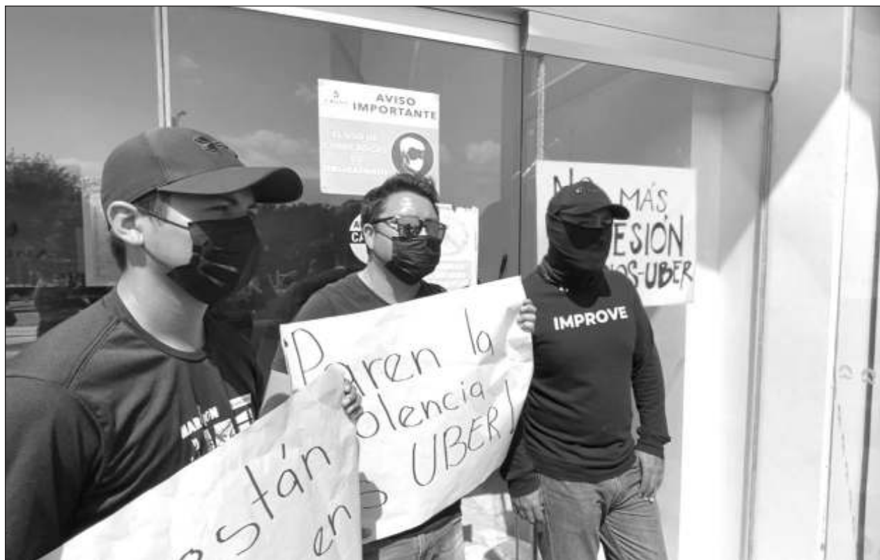
▲ Los conductores se manifestaron en la entrada de plaza Azuna, cerca de Malecón Tajamar, en donde se encuentran las oficinas del corporativo en Cancún, exigiendo acciones que les den confianza y protección para seguir haciendo su trabajo.

Sin embargo, advirtieron que si no se les da una cita segura, hoy martes se manifestarán nuevamente.