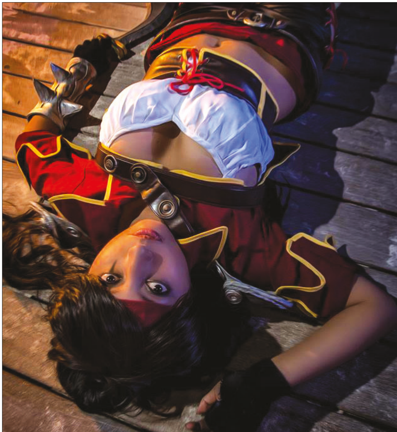
▲ Los personajes que forman parte de las narrativas resuenan en las comunidades a razón de sus similitudes, incluso en términos de genotipo; hay quienes se identifican con personajes que no son un hombre alto y caucásico.

En lo que respecta a la identidad de la cultura friki, la investigadora aclaró que