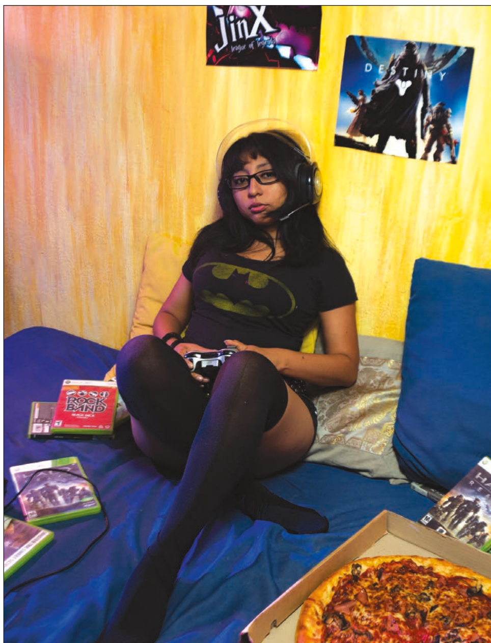
▲ En general, ser gamer es un asunto complicado; se tiene que hacer un balance entre el tiempo libre y las obligaciones.

“Cuando di el salto a PC, fue todavía más relajado. Es más común encontrarse chicas gamers en esta plataforma o simplemente a la gente no le interesa tanto acosar, aunque en el League of Legends (LoL) sí