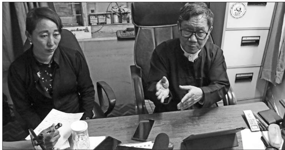
▲ La Premio Nobel y ex dirigente de Myanmar es una de las más de 4 mil personas detenidas desde el 1 de febrero pasado por los militares golpistas.

Antes de la vista, se mostró desafiante con la Junta, diciendo que su partido, la Liga Nacional para la Democracia (LND), “existirá mientras el pueblo exista,