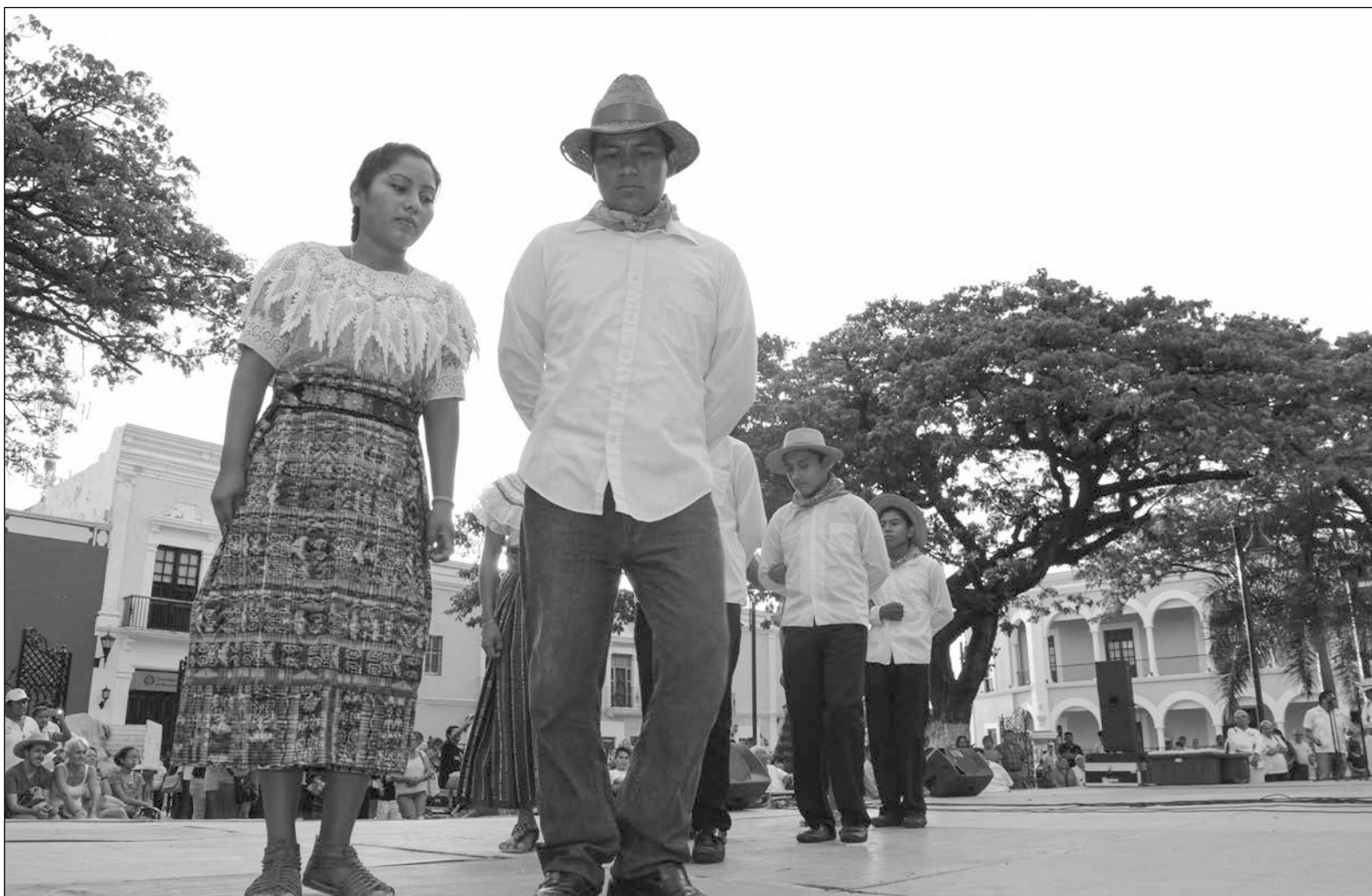
▲ No basta con la auto adscripción para candidatura indígena, hay que detener las malas prácticas que permiten la usurpación.