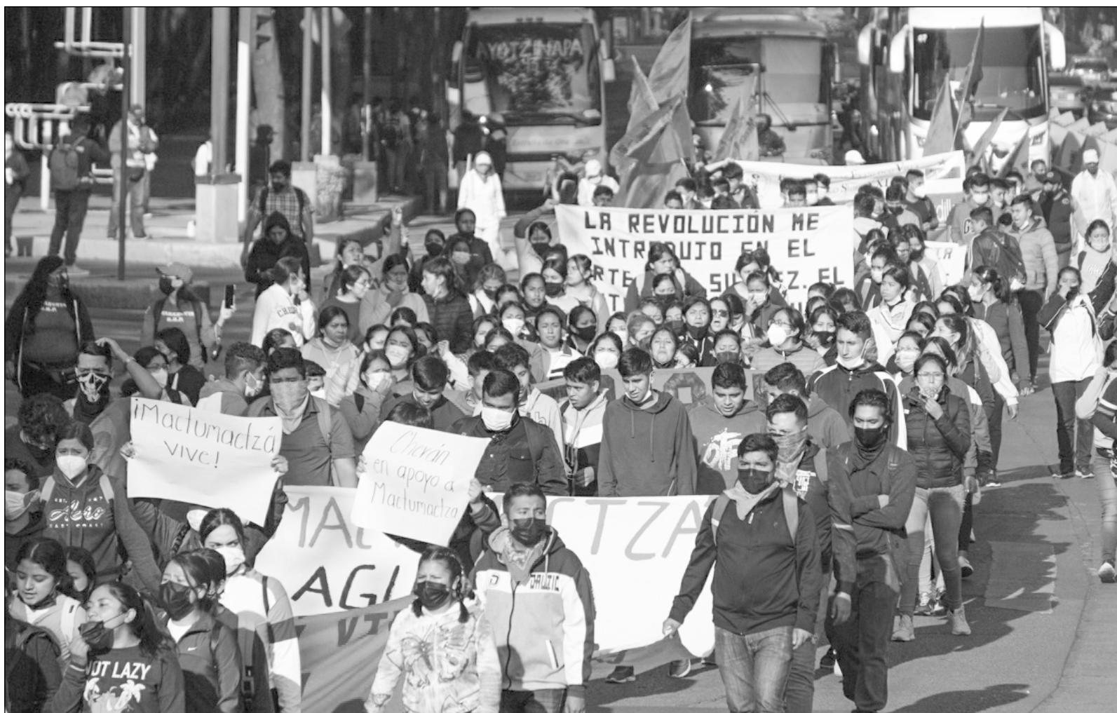
▲ Estos nuevos hechos de violencia contra el normalismo rural acrecientan la lista represiva del gobierno chipaneco.