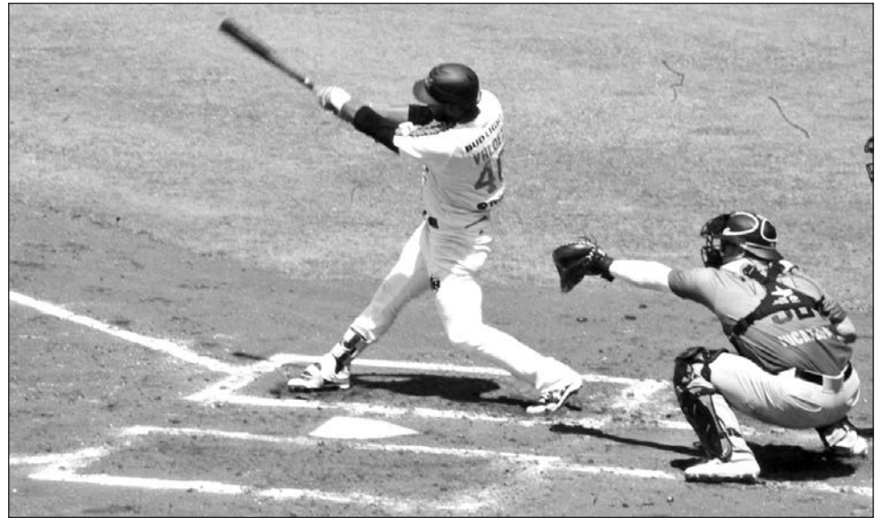
▲ Fieras y bucaneros se enfrentaron ayer en un día de apertura por primera vez desde 2014.

Hace unos días, los pupilos de Pedro Meré se impusieron 1-0 a los melenudos en duelo de pitcheo y luego resistieron un intento de reacción de los "reyes