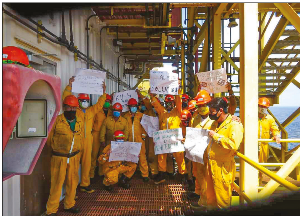
▲ Según los trabajadores, cada vez se suman más obreros a la protesta por las deficiencias en los servicios de hotelería y alimentación.

Agregaron que estas anomalías las han presentado a la administración, así como a los delegados sindicales correspondientes, pero hasta ahora no se ha solucionado