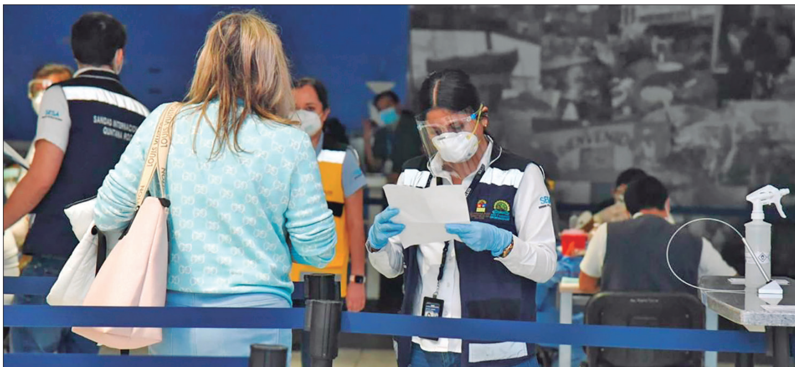
▲ Estamos en riesgo de frenar la recuperación económica si se continúa actuando de forma irresponsable, declaró la Secretaría de Salud.