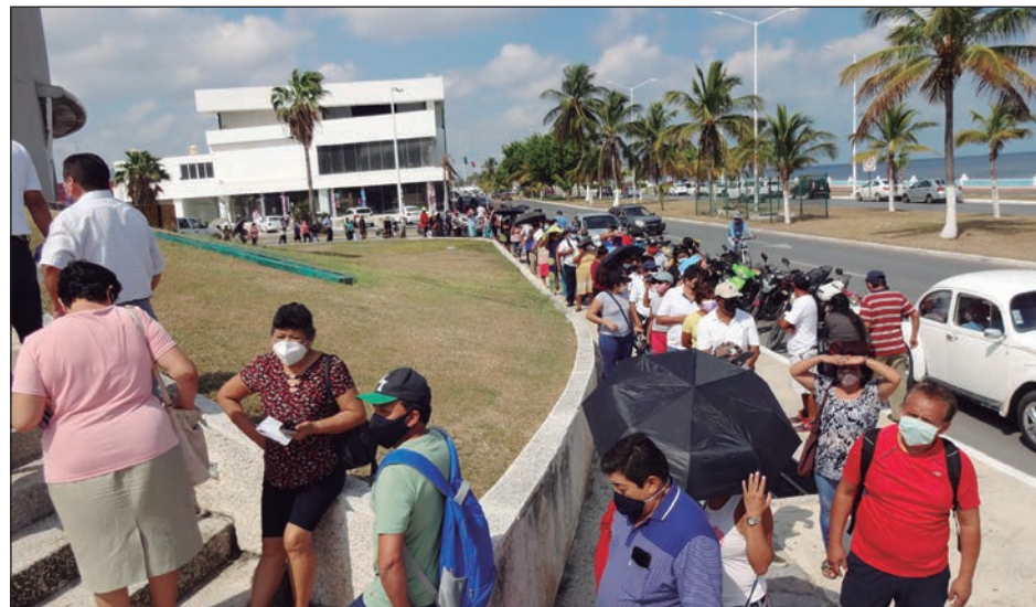
▲ En todo Campeche, la respuesta a la vacunación ha sido amplia.

Guerrero del Rivero explicó que durante los días jueves, viernes y sábado en que se llevó a cabo la vacunación masiva en Carmen, se estableció un punto de aplicación en el