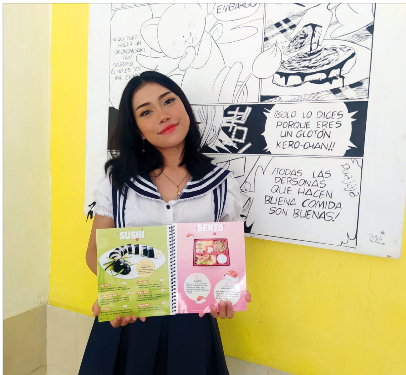
▲ La principal característica de Maid Café es la atención de cosplayers.

La cafetería insignia de los frikis meridianos se ha mudado en cuatro ocasiones