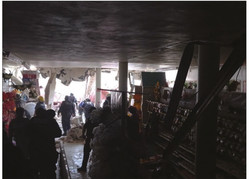
▲ Hasta el momento, se desconocen las razones del siniestro.

Hasta el momento, se desconoce las razones del porqué se desplomó el techo de Fantasías Miguel.