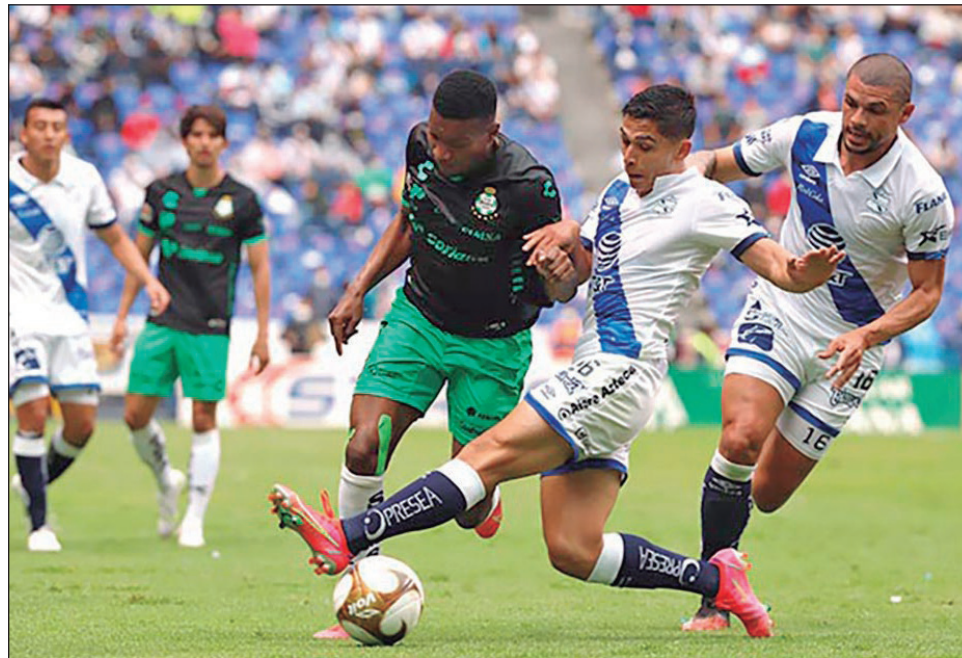
▲ Los Guerreros dejaron en el camino a Puebla para pactar su cita en la final con Cruz Azul.

El partido de ida se realizará pasado mañana en Torreón, mientras que la