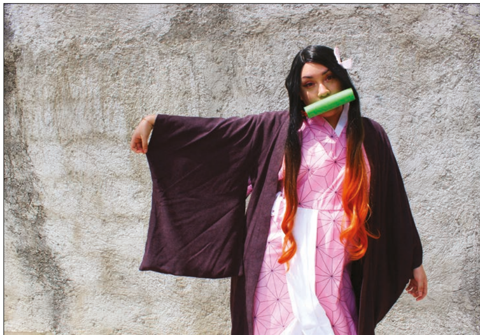
▲ Al hablar de ser friki, se habla de una cultura transgeneracional; no es exclusiva de un rango de edad.

"Es una amplia comunidad de fandom la que invo-