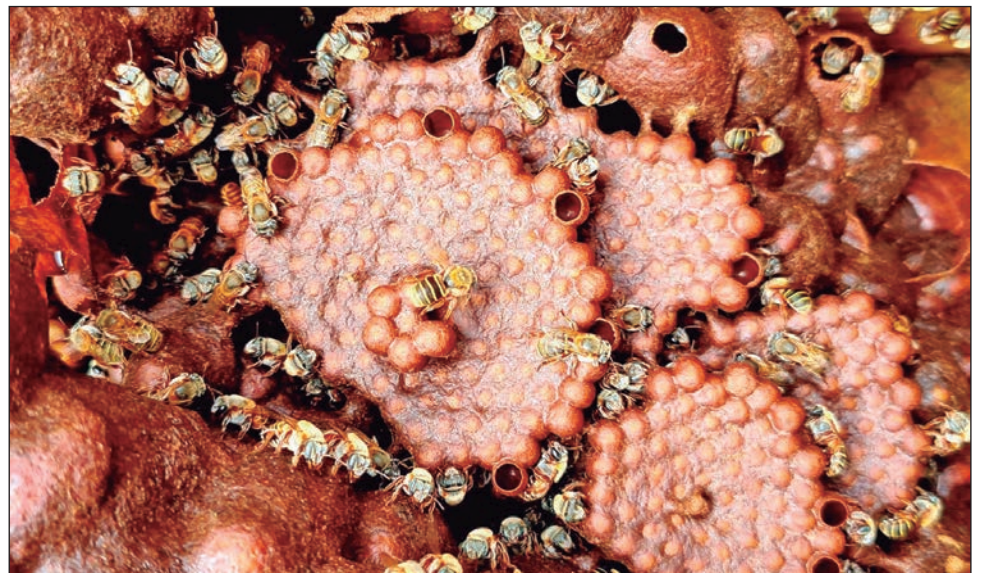
▲ Las abejas son consideradas el ente biológico más importado del mundo.

Señaló la importancia de conservar la salud de la