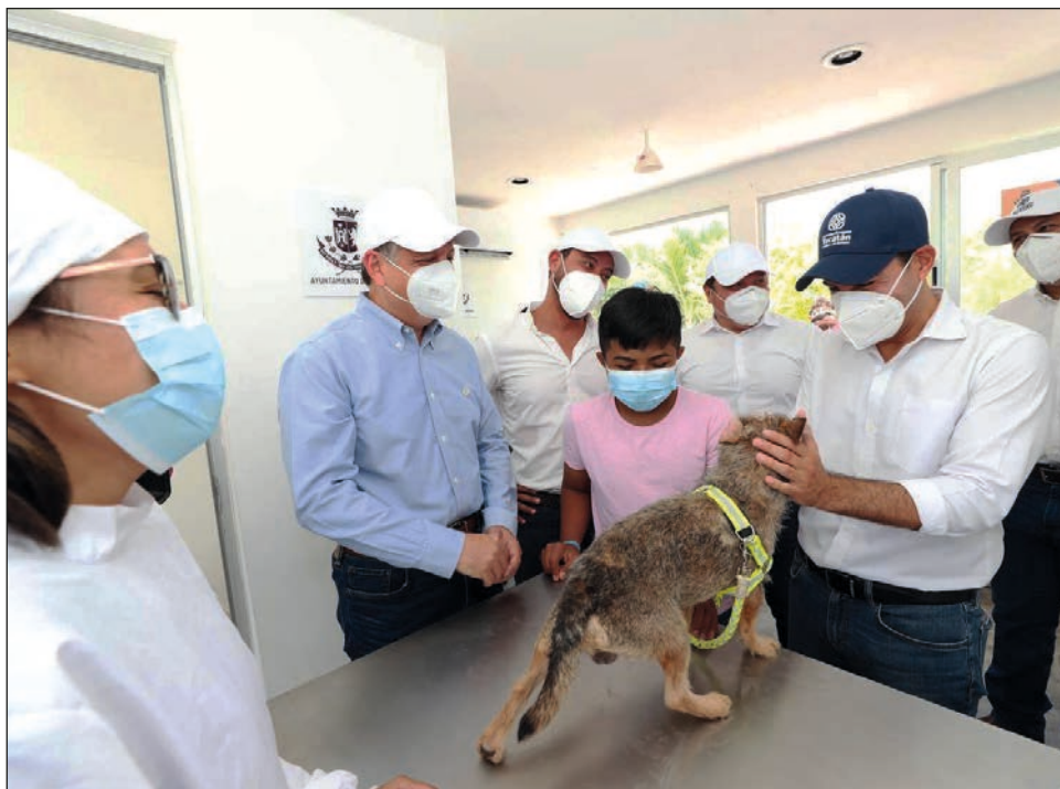
▲ La unidad especializada en el combate al maltrato de animales domésticos dependerá de la Vicefiscalía Especializada en Delitos Electorales y Medio Ambiente.

En su mensaje, Vila Dosal indicó que el ahora módulo veterinario y Pek Park era un área de parque destinada a estos animales al que se le daba poco uso, por lo que el gobierno del estado, a través del Instituto de Movilidad y Desarrollo Urbano Territorial (IMDUT), concedió al ayuntamiento de Mérida este espacio para la creación del módulo veterinario para