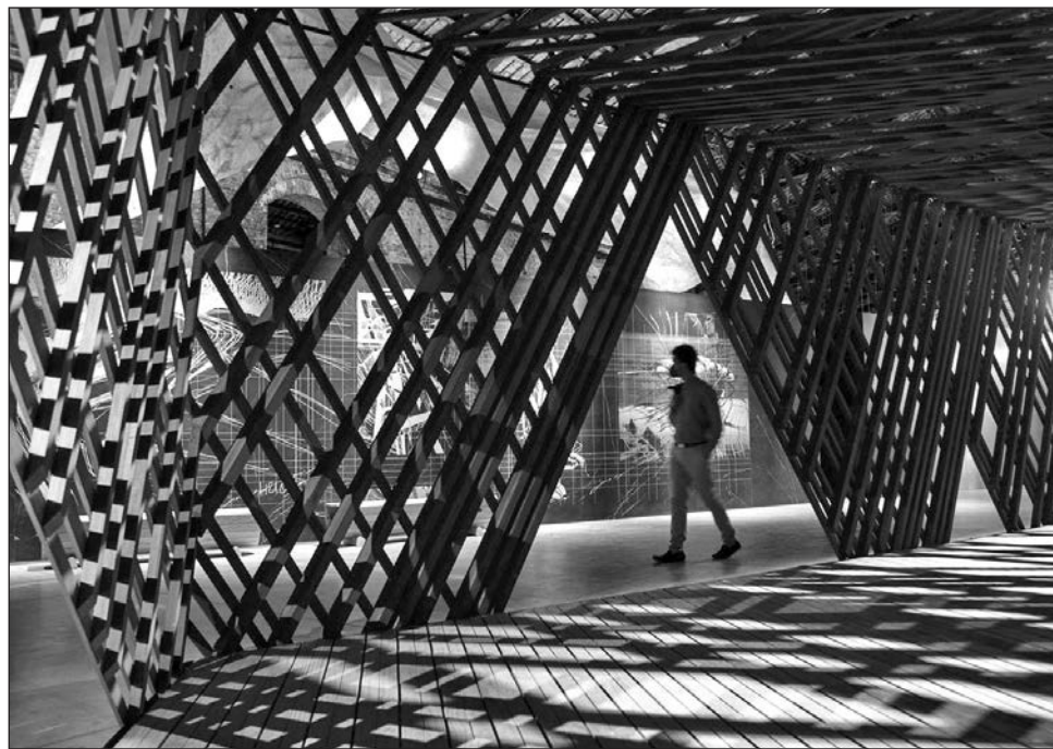
▲ La bienal abrió al público el sábado y permanecerá hasta el 21 de noviembre.

Ése es el tema central de la bienal, en la que participan 112 arquitectos y estudios invitados provenientes