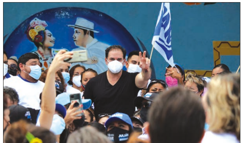
▲ El abanderado panista expresó que cada vez más percibe el respaldo de la gente.

En ese aspecto, el abanderado panista resaltó que, durante su cargo