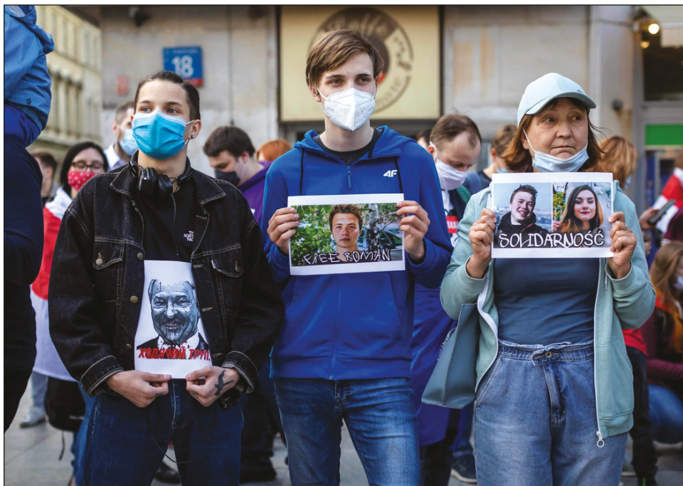
▲ En el vuelo de Ryanair viajaba Roman Protasevich, un férreo opositor del actual presidente bielorruso, Alexander Lukashenko.

Además confirmó que durante la reunión los líderes europeos examinarán las sanciones contra las personas involucradas en el aterrizaje del avión de Ryanair en Minsk, así como contra entidades y el sector aéreo de Bielorrusia.