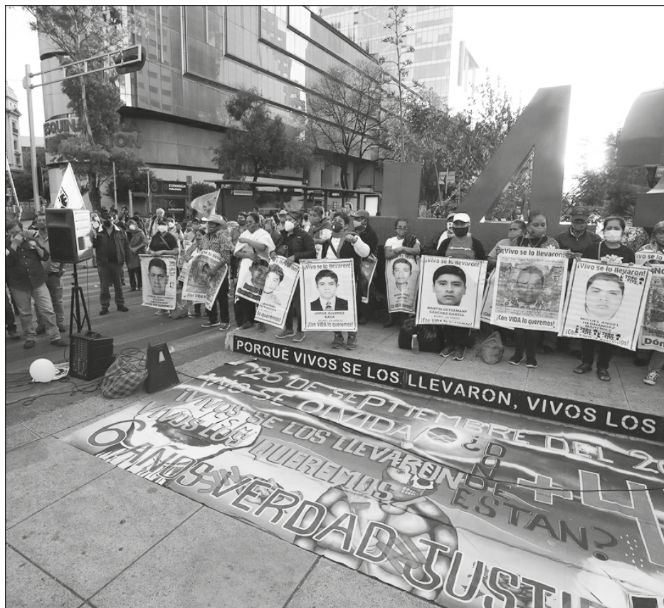
▲ El caso de los jóvenes normalistas desaparecidos en Guerrero es un de los temas que el Presidente prometió resolver y que aún tiene pendiente.

De acuerdo con la NASA, la Luna alcanza un tono rojizo durante el eclipse porque no recibe luz solar directamente sino que es filtrada por la atmósfera de la Tierra.”