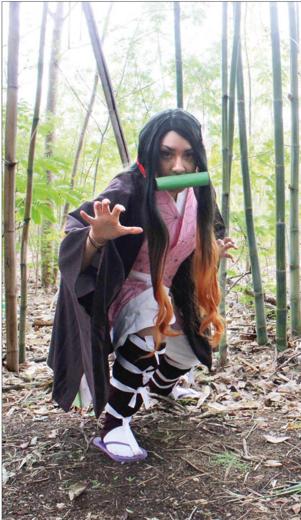
▲ Cuando comencé, se trataba de vestirse como el personaje y divertirse. Si alguien iba caracterizado de la misma serie, jugábamos y nos hacíamos amigos.

Además de la pandemia, Andrea atribuye el crecimiento de esta actividad a la facilidad que existe para conse-