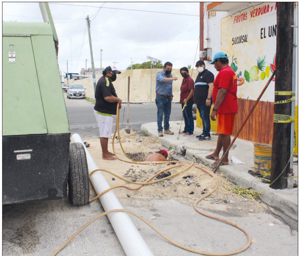
Esta semana se construirá otro pozo sobre la calle 29 para reforzar el sistema pluvial.

“Como equipo diariamente trabajamos para que la ciudad se encuentre siempre en las mejores condiciones, por ello invito a la ciudadanía a sumarse y reportar cualquier desperfecto”, finalizó.