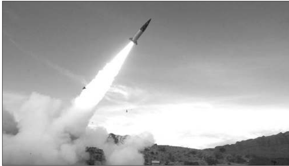
▲ Por meses, EU se resistió a enviar los misiles de largo alcance por preocupaciones de que Kiev pudiera usarlos para atacar territorios muy al interior de Rusia, lo que provocaría la ira de Moscú.

Uno de los funcionarios dijo que Estados Unidos está proporcionando más de este tipo de misiles en un nuevo paquete de ayuda militar promulgado por el presi-