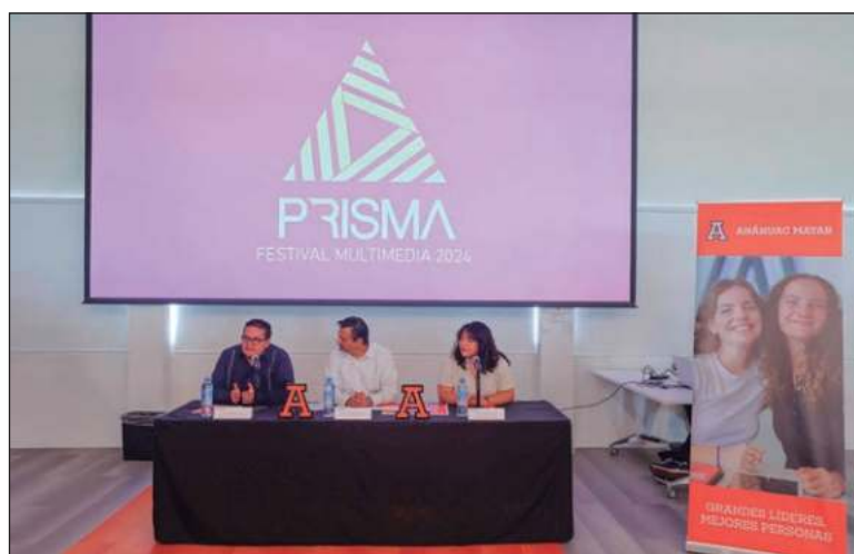
▲ El encuentro, a realizarse el 9 de mayo, fue organizado por alumnos de sexto semestre de la Licenciatura en Diseño Multimedia.

Durante la jornada se presentarán las conferencias: Del modelado 3D al demo reel , con Arturo Navarro (cortometraje animado SuperJirou ); Aún no has llegado a tu cúspide , con Jany Segura (Hue-