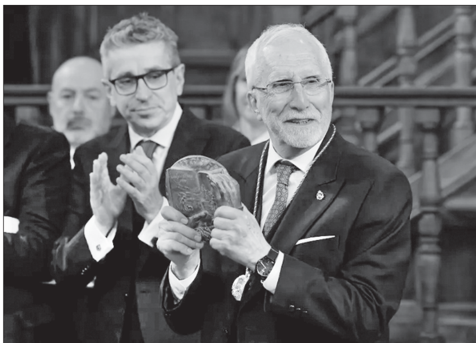
▲ El novelista y cuentista Luis Mateo Díez recibió en el paraninfo de la Universidad de Alcalá de Henares, el Premio Cervantes, consagrándose como un clásico vivo de la literatura en español.

Como es habitual en los discursos de recepción del Premio Cervantes, el galardonado hizo alusión a Don Quijote de La Mancha: El libro que escuché con mayor deleite y aprovechamiento