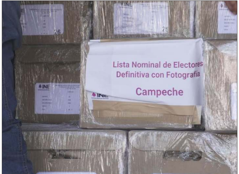
▲ El Consejo Local del INE entregó las Listas Nominales de Electores.

Es preciso señalar que en la Lista Nominal de Campeche se tienen registrados a 26 mil 147 jóvenes de 18 y