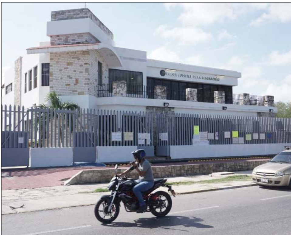
▲ El texto entrará en vigor tras su publicación en el Diario Oficial de la Federación y deja sin efectos el anterior código, así como cualquiera otro que haya sido aprobado por la SCJN.

Respecto de los alcances del nuevo Código y la posibilidad de investigar a todos los integrantes del PJF, se trate de servidores públicos con cargos menores o impartidores de justicia, desde jueces hasta ministros, se establece: el código de ética no busca imponer sanciones disciplinarias, sino generar buenas prácticas destinadas a mejorar la calidad en la prestación del servicio de impartición de justicia ética. A pesar de lo anterior, este documento cumple con la Ley de Responsabilidades Administrativas.