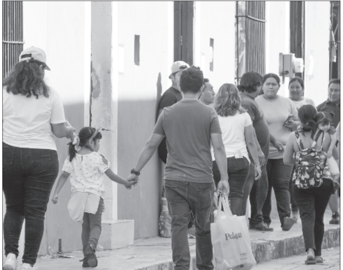
▲ “La democracia mexicana no será moderna ni políticamente eficiente en una mar de pobreza y desigualdad. Esto lo habrá aprendido ya el presidente López Obrador y habrá que insistirles a los aspirantes que lo hagan”.

Uno de sus más agresivos componentes es la desigualdad económica cuya persistencia, extensión y profundidad obliga a tener siempre presente sus raíces históricas: concentración secular de la riqueza, de la propiedad y del poder político. Y de ahí, la oprobiosa desigualdad