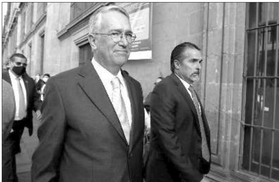
▲ El expediente divulgado por Presidencia muestra parte de la documentación sobre los presuntos adeudos por 63 mil mdp que el fisco mexicano reclama a Grupo Salinas.

“Se ha afirmado que Grupo Salinas no paga impuestos; aquí te decimos la verdad: Sí pagamos y pagamos MUCHÍSIMOS impuestos”, dice el primer mensaje del sitio web. Inmediatamente señala al SAT y a la PFF de extorsionar a Grupo Salinas “al igual que a muchos otros empresarios” mediante cobros dobles y excesivos y de usar su situación fiscal como un