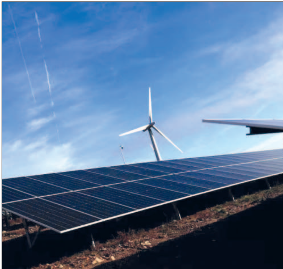
▲ Las fuentes renovables podrían abastecer a un país de toda la energía eléctrica que requiere, como ya sucede en algunas zonas que utilizan plantas interconectadas.

Abundó que la democratización de la energía lleva a la descentralización energética, por ello, resaltó, es importante diseñar nuevas políticas de distribución, debido a que la Ley de Transición Energética señala que, en 2024, México debe tener un 35 por ciento de energía limpia, pero hoy solo se tiene el 31 por ciento.