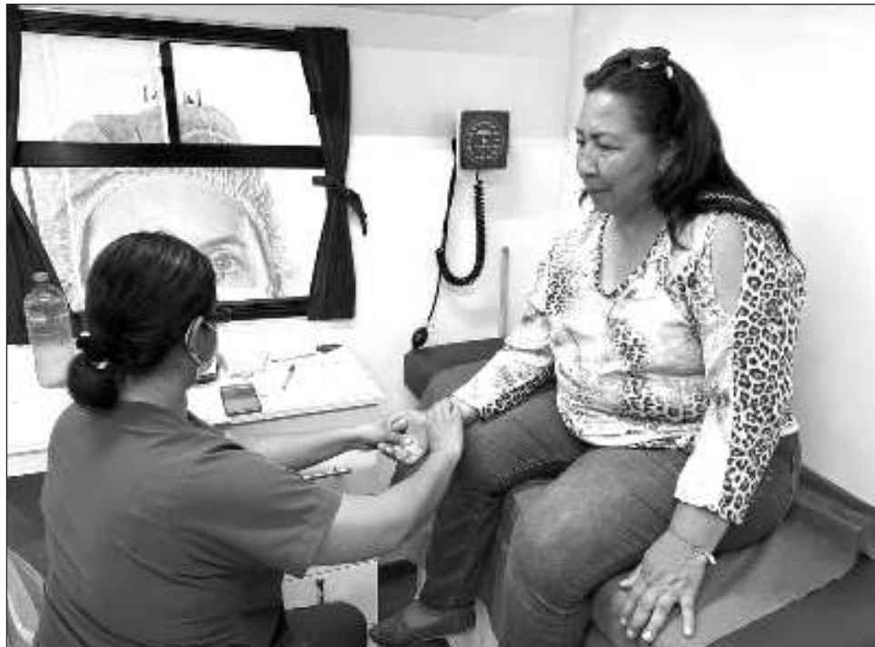
▲ Los CAPS ofrecen atención, así como medicamentos del cuadro básico sin costo, en un sistema de salud único en todo el estado.

Sin embargo, los de Villas del Sol y Puerto Aventura operan las 24 horas. Para mayor información pueden