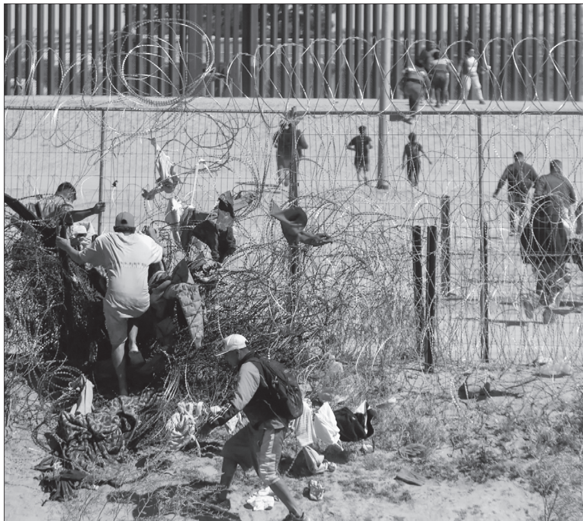
▲ "Con Biden se negocia la devolución de 30 mil migrantes mensuales de Cuba, Venezuela, Nicaragua y Haití, en el supuesto de que EU no puede deportarlos por no tener relaciones diplomáticas y México debe asumir esto".

El panorama migratorio ha cambiado sustancialmente en la última década. La migración centroamericana, que pasa por México, dejó de ser prioritariamente masculina y laboral y pasó a ser