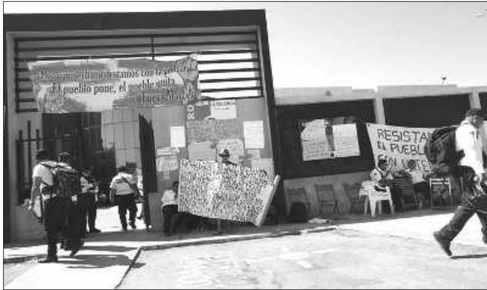
▲ Los reclamantes señalan que los 80 agentes beneficiados son de Asuntos Internos.

Dicho intento quedó en un acto de provocación y reto