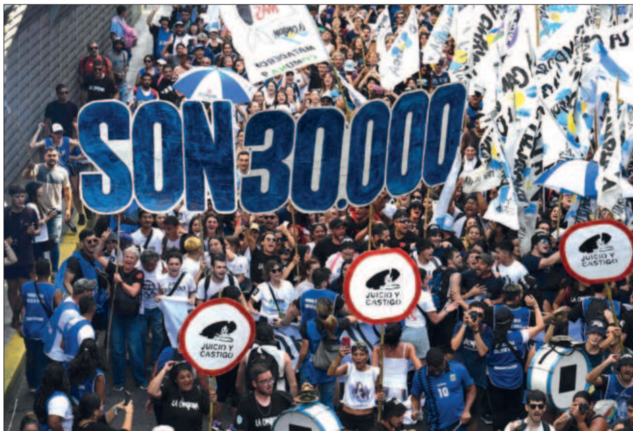
▲ Tanto el presidente Javier Milei como su vicepresidente, Victoria Villarruel, ponen en duda el número de desaparecidos consensuado por organismos de derechos humanos -30 mil- y aseguran que la cifra real es cercana a 8 mil 700.

La fuerza de Defensa Civil municipal advirtió de riesgos "muy altos" de deslizamientos el domingo.