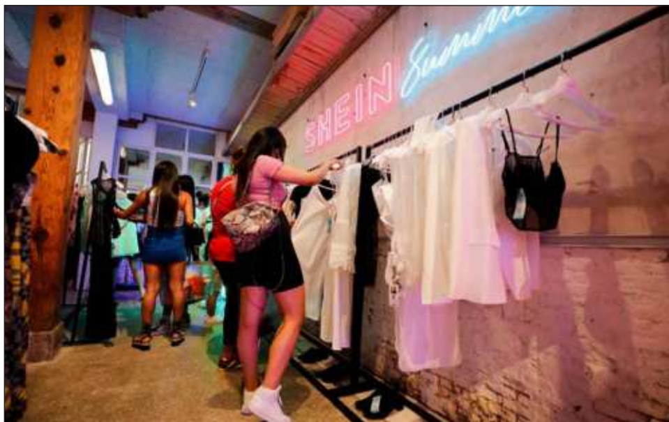
▲ La fast fashion se encuentra en un auge sin precedente; no obstante, el impacto medioambiental de la producción masiva ahora impulsa el surgimiento de modelos de economía circular.