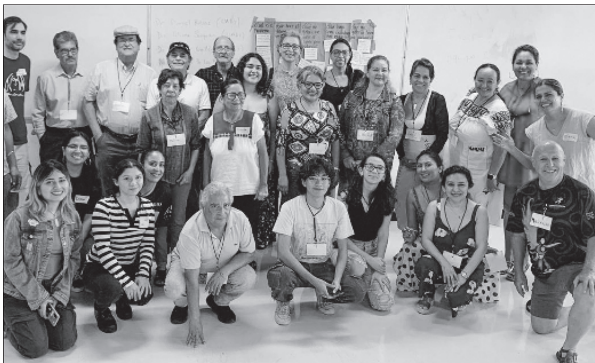
▲ “Los participantes elaboraron un planteamiento ciudadano donde plasmaron sus preocupaciones y demandas sobre la problemática, con el fin de presentarlo a los futuros tomadores de decisión”.

LOS DIÁLOGOS SE inspiran en las llamadas Conferencias de consenso , mecanismo de participación pública que propicia el acercamiento de la ciudadanía a temas y problemas tecnocientíficos complejos,