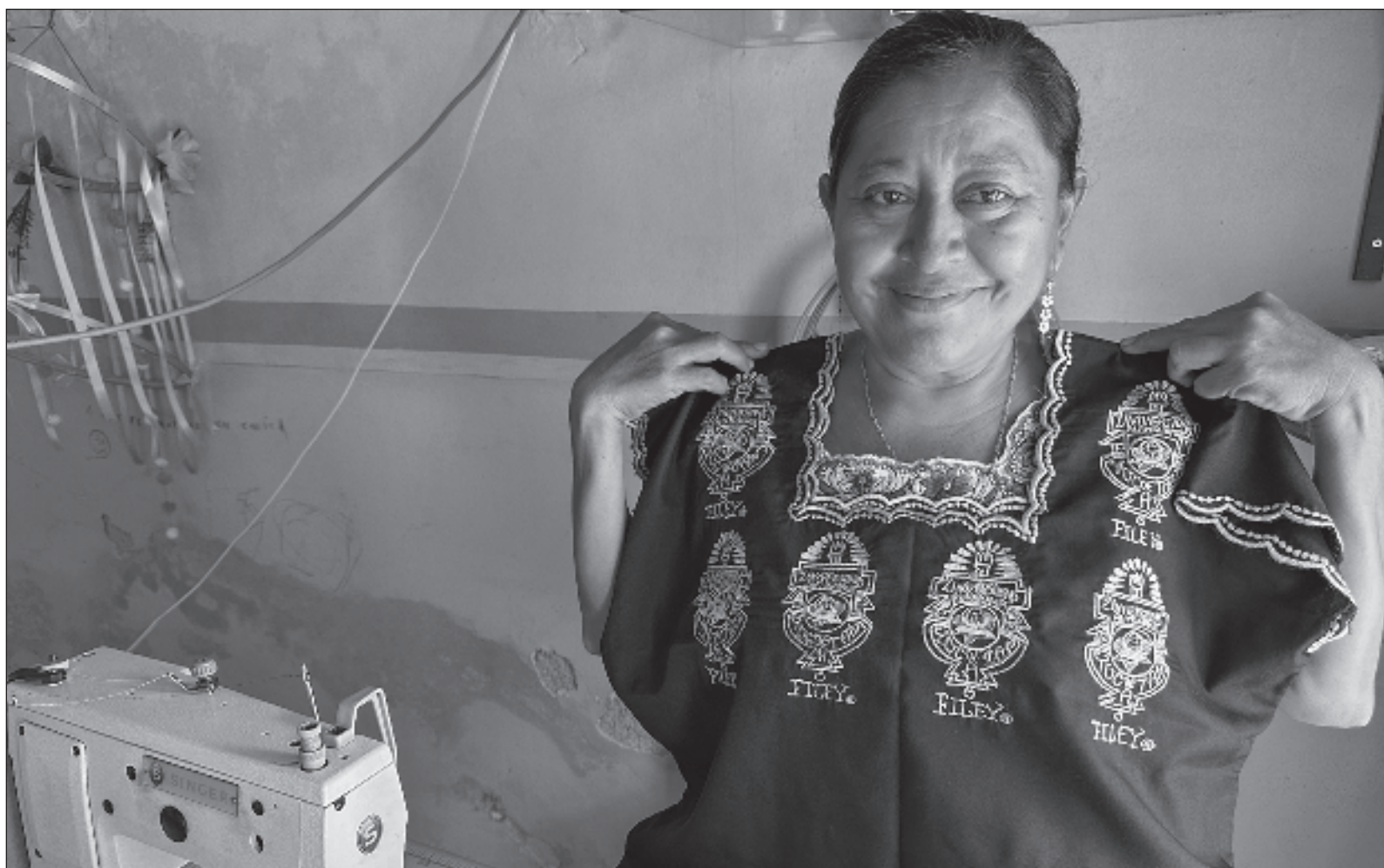
▲ “Pensé en las máquinas que ahora le están robando trabajo a las artesanas y que la gente las paga por baratas”.