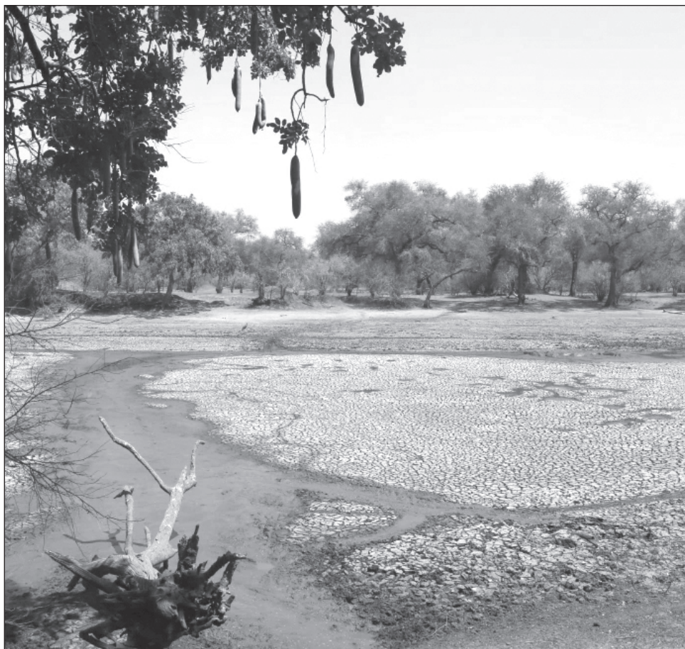
▲ La declaración del presidente Chakwera estimulará un programa de respuesta humanitaria “de gran alcance” que incluye 600 mil toneladas métricas de maíz para los hogares afectados.

El Niño es un cambio en las dinámicas atmosféricas ocasionado por el aumento en la temperatura del océano Pacífico. Mientras que la sequía sacude países como Malawi, Zambia o Zimbabue, este fenómeno meteorológico provocó en los últimos meses lluvias torrenciales en el este de África que dejaron centenares de muertos en Kenia, Tanzania, Somalia y Etiopía.