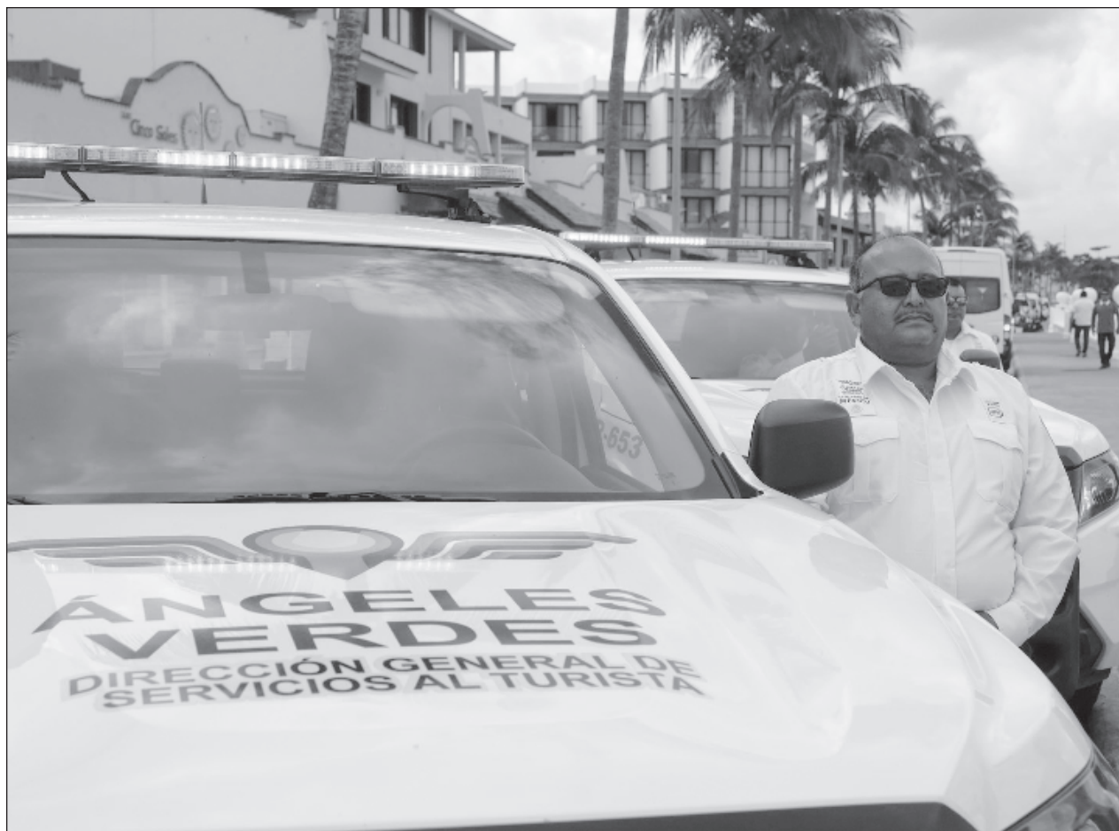
▲ Los Ángeles Verdes estarán apoyando en todo el estado en un horario de 8 a 20 de la noche.

Las más complicadas por sus características son playa Delfines, Marlin y Gaviota Azul, por la afluencia de gente, esperando hasta 70 mil personas durante toda la temporada, con un promedio de 10 a 20 mil diarias, considerando que hay playas como Delfines que llegan a recibir hasta 5 mil personas en una sola jornada.