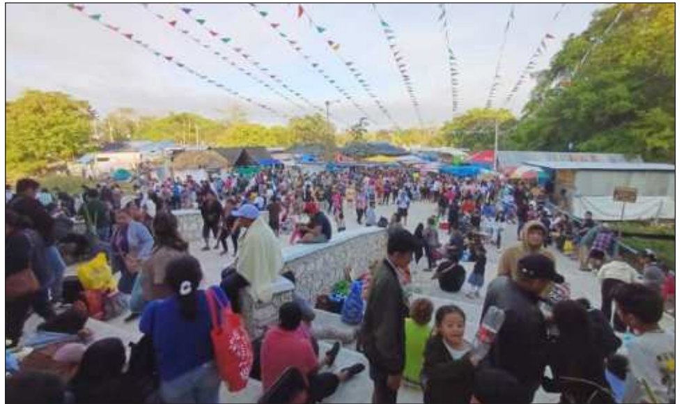
▲ Desde el viernes 27 de marzo inició el peregrinar de devotos al Santuario de la Virgen de Chuiná, mismo que se prolongará hasta el jueves Santo.

Los visitantes buscan áreas comunitarias para estacionar sus unidades, "colgar" sus hamacas de los árboles cercanos o instalar sus casas de campaña, para posteriormente acudir al Santuario de la Virgen de Chuiná, encender sus veladoras, aceites o entregar sus promesas.