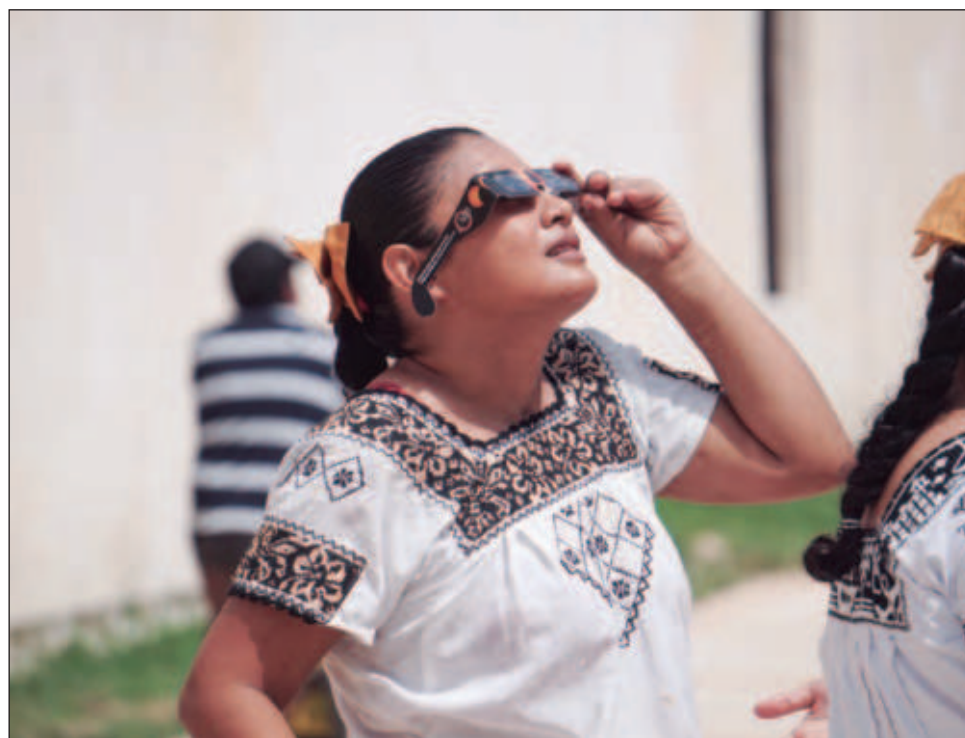
▲ Decenas de millones de espectadores actuarán como "científicos ciudadanos", ayudando a la NASA y otros grupos de investigación a comprender mejor nuestro planeta y nuestra estrella.

Al mismo tiempo, cohetes despegarán con instrumentos científicos hacia la porción de la atmósfera cargada eléctricamente cerca del borde del espacio conocida como ionosfera. Los pequeños cohetes despegarán desde Wallops Island, Virginia, a unas 400 millas de la totalidad pero con 81 por ciento del Sol oscurecido en un eclipse parcial. Se realizaron lanzamientos similares desde Nuevo México durante el eclipse solar del