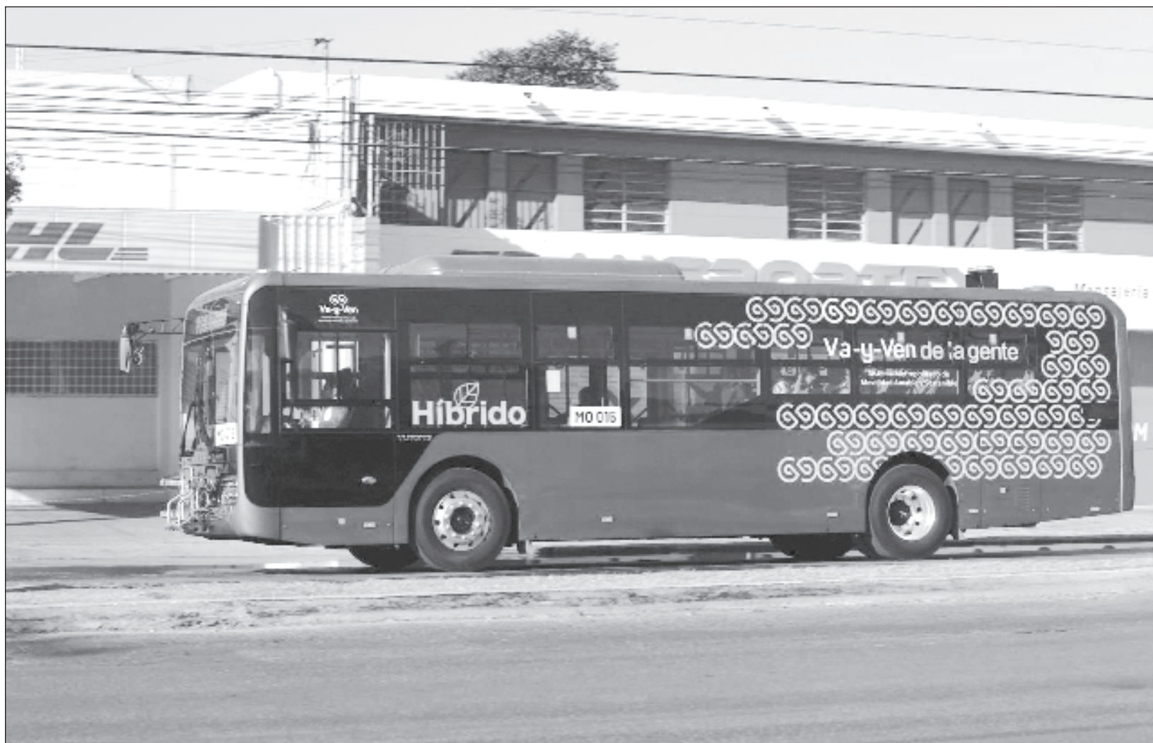
▲ Estos nuevos autobuses se suman a los 12, también híbridos, que el sábado comenzaron a funcionar en la ruta Centro-Canek-Almendros-UPY.