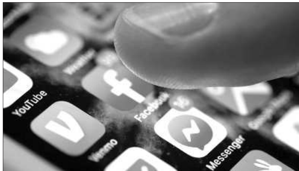
▲ La propuesta de Trump impedía al Ejecutivo y al Congreso ejercer autoridad sobre la regulación.

Las empresas que lucran con nuestros datos (incluidos los registros médicos, financieros y de geoposicio-