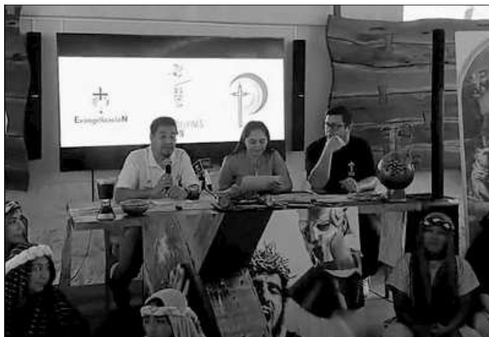
▲ En los últimos tres meses los cerca de 80 participantes voluntarios, que son familias cancenenses, han estado ensayando para el evento, al que se han sumado foráneos.

El año pasado, cuando se retomó el proyecto luego de la pandemia, se registraron