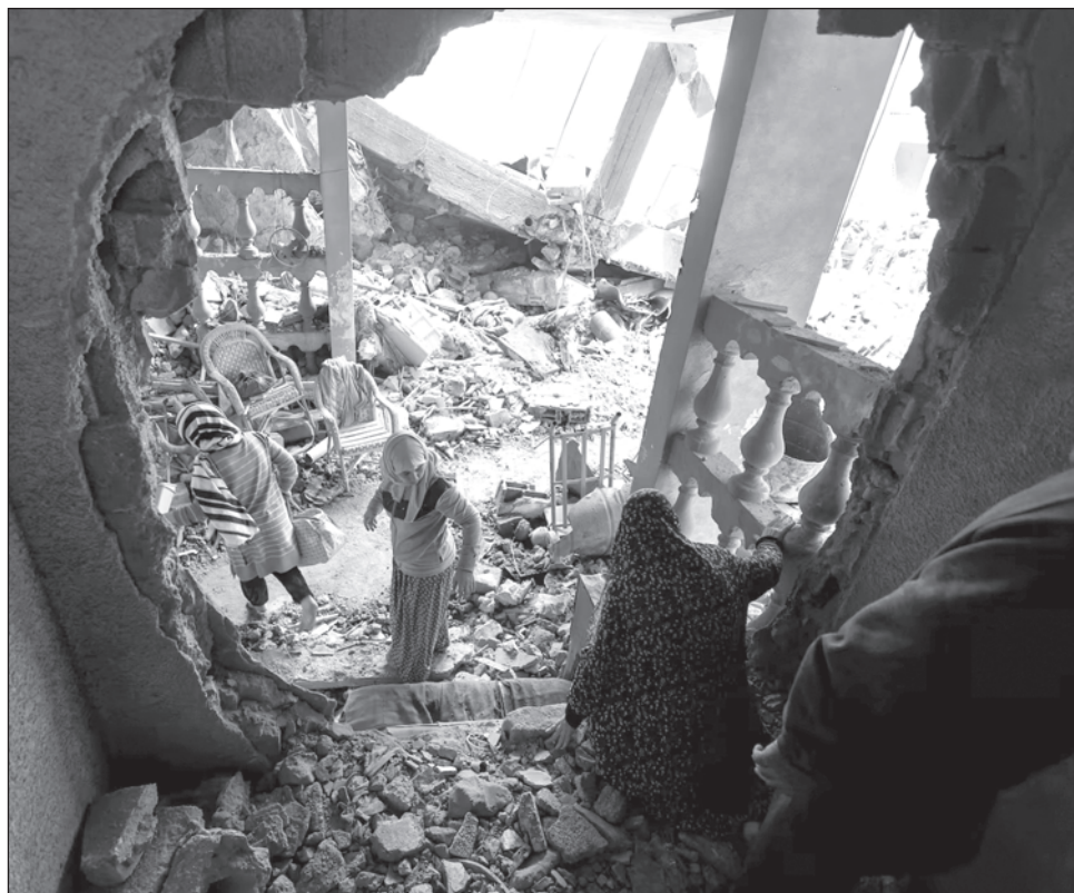
▲ António Guterres subrayó que “el mundo entero reconoce que ya es hora de silenciar las armas y garantizar un alto el fuego humanitario inmediato”.

El máximo responsable de la ONU pidió además un “alto el fuego humanitario