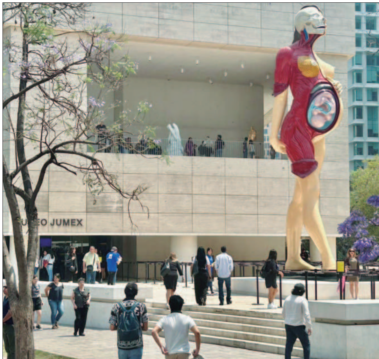
▲ La muestra Vivir para siempre (por un momento) revisa la práctica de Hirst de examinar la muerte desde múltiples puntos de vista y explorar los medios que encontramos para superar el agobio de su inevitabilidad.

Un globo suspendido de forma agónica en el aire entre afilados cuchillos; un extenso escritorio blanco con un cenicero, una caja de cigarrillos y un encendedor en una vitrina de cristal; una serie de hermosos cuadros de tipo gótico elaborados