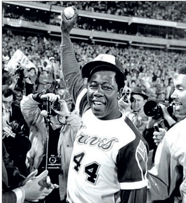
▲ Hank Aaron, famoso por romper la marca de jonrones de Babe Ruth, fue un ejemplo a seguir dentro y fuera de los diamantes.

Bonds cerró su trayectoria con 762, aunque Aaron nunca le tuvo rencor por romper su marca. Su lema: más de tres décadas como el rey fueron suficientes, es hora de que otro tenga la corona. Sin embargo, nadie podrá arrebatarle su legado. “Sólo traté de jugar este deporte de la forma que se supone que se juega”, subrayó Aaron. Su nombre aparece por todos lados en los récords del beisbol, y, de hecho, Aaron podía hacer de todo. ¿Batear con poder? Por