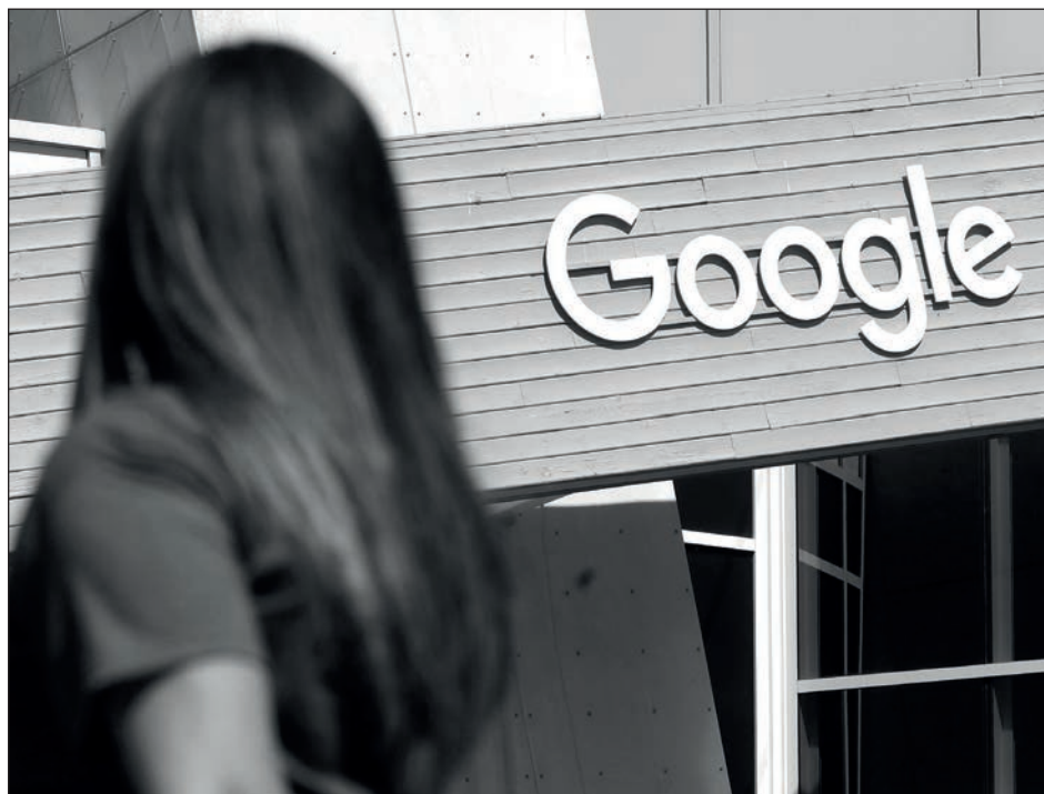
▲ La gerente de Google Australia, Mel Silva, calificó de "inviabile" el proyecto de ley mediante el cual la plataforma pagaría por contenido noticioso.

Código de Negociación busca eliminar desequilibrios entre medios y plataformas