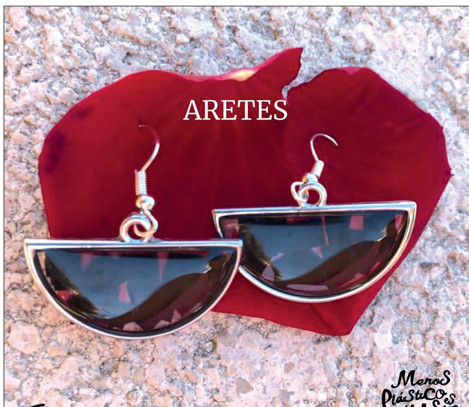
▲ La colección Joyas del Mar está inspirada en las tortugas marinas.