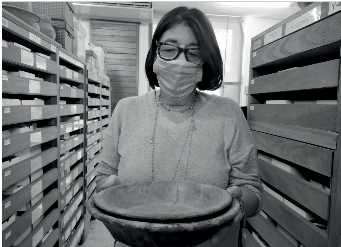
▲ Las piezas que conforman este acervo fueron las antiguas colecciones de la Carnegie Institution of Washington, rescatadas bajo el techo del Palacio G. Cantón

En sus más de 300 estantes, de 12 cajones cada uno, se conservan miles de fragmentos, vestigios que conforman más 300 colecciones de la cultura maya que datan de 1000 a.C. y se han descubierto durante estos años en todo el territorio yucateco, así como piezas de otras partes del país, incluso del siglo XVI de origen inglés o español.