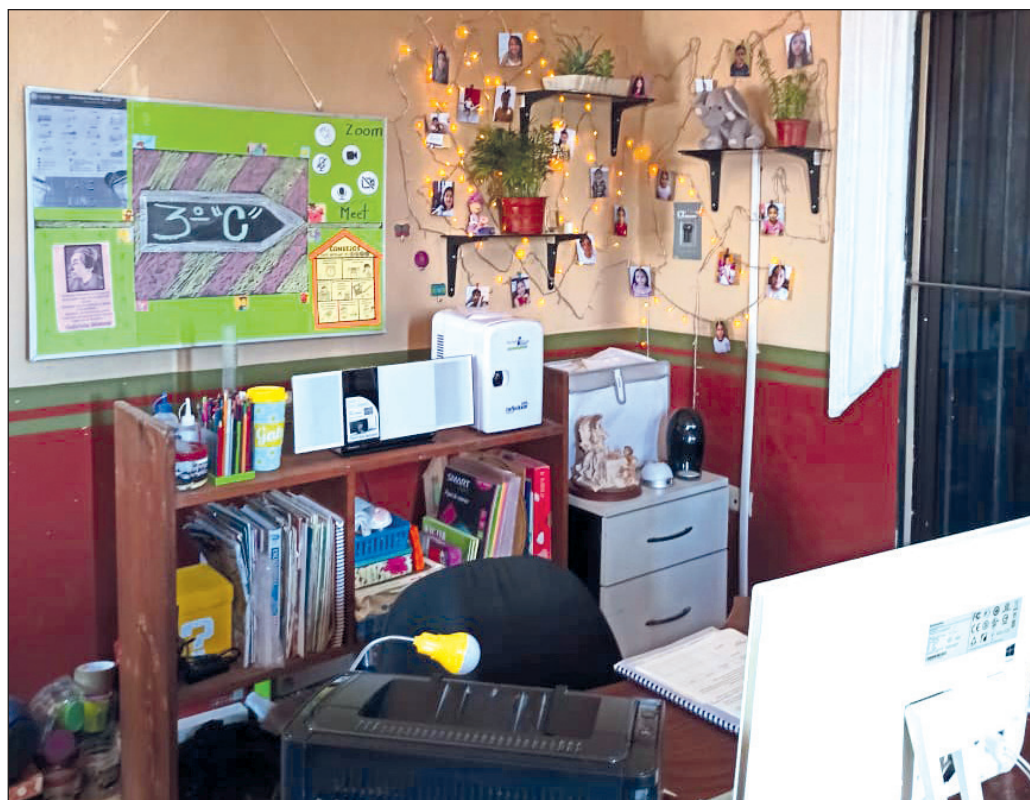
▲ La ONU alerta que un tercio de los mil 600 millones de estudiantes en el mundo no tiene acceso a la enseñanza a distancia.

Commemoramos el Día Internacional de la Educación, instituido hace apenas tres años por la Asamblea General de Naciones Unidas en reconocimiento a la importancia de este ámbito en cualquier esfuerzo para alcanzar los ambiciosos Objetivos de Desarrollo Sostenible adoptados el 25 de septiembre de 2015.