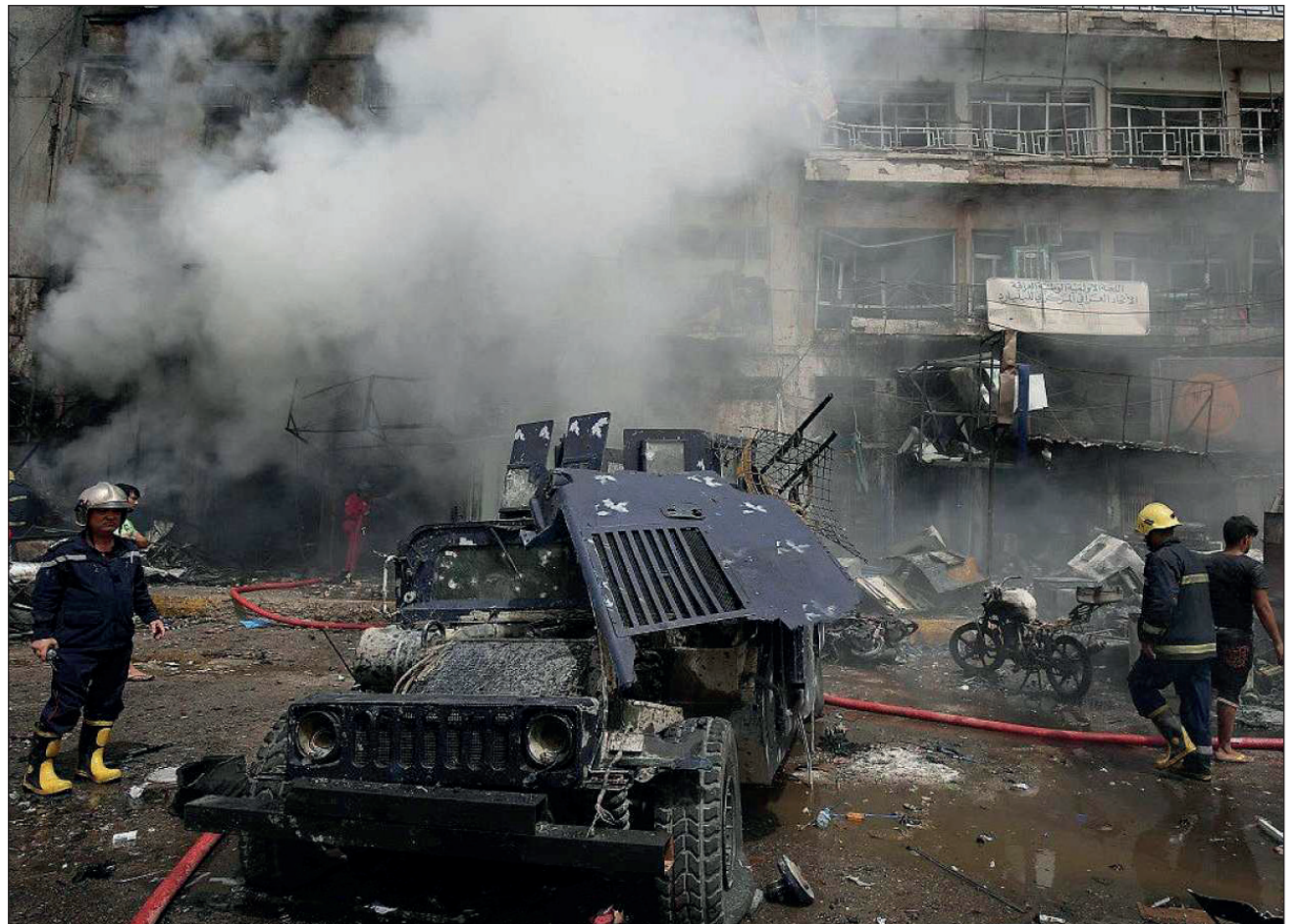
▲ La red del Estado Islámico para ataques urbanos en Bagdad parecía degradada, pero el pasado jueves demostró que encontró una brecha que explotar.

Irak declaró su victoria sobre el grupo EI a finales de 2017, reabrió calles y suprimió kilómetros de vallado en Bagdad. Se envió a las tropas más experimentadas en busca de las células durmientes de los yihadistas, en desiertos y montañas, y las ciudades quedaron en manos de unidades