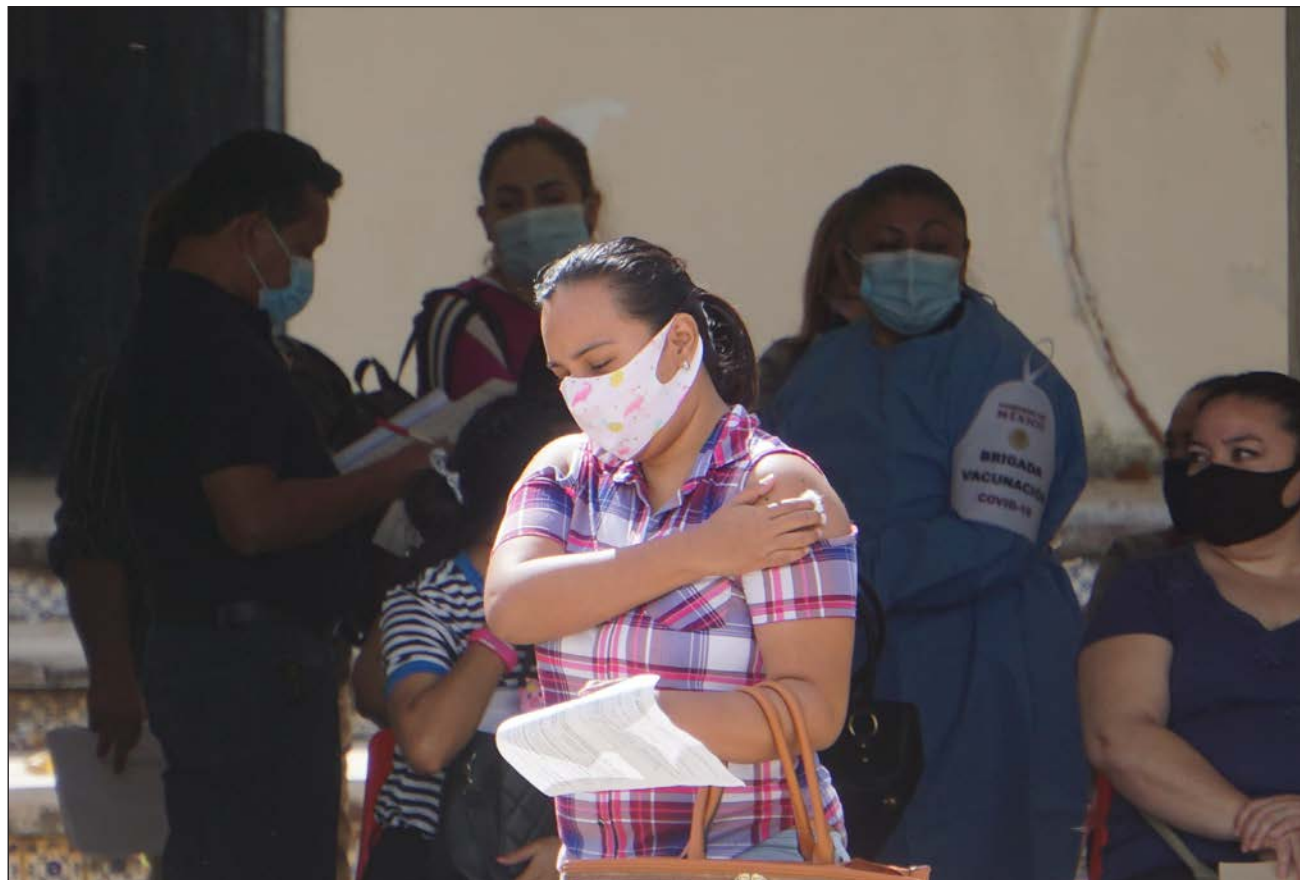
▲ Algunos docentes esperaban reacciones a la vacuna anti COVID, pero éstas no han pasado de alguna irritación como con cualquier otro inmunizante.

Las primeras horas de la jornada transcurrieron en calma, sin altercados ni manifestaciones de padres de familia, quienes son los más alterados por la decisión de vacunar a los maestros y que Campeche regrese a clases presenciales después de este paso.