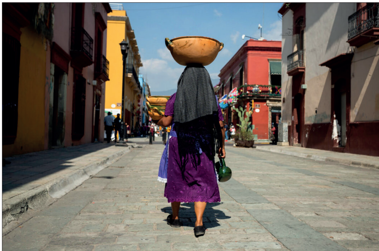
▲ Citlali Fabián, Eva Lépiz y Greta Rico documentaron el día a día y los desafíos que enfrentan artesanas indígenas de las comunidades Santa Cecilia Jalieza, Santa María Atzompa y Teotitlán del Valle.

Fabián, Lépiz y Rico documentaron el día a día y los desafíos que enfrentan artesanas indígenas en medio de la pandemia. Trabajaron en tres comunidades de los Valles Centrales de Oaxaca: Santa Cecilia Jalieza, Santa