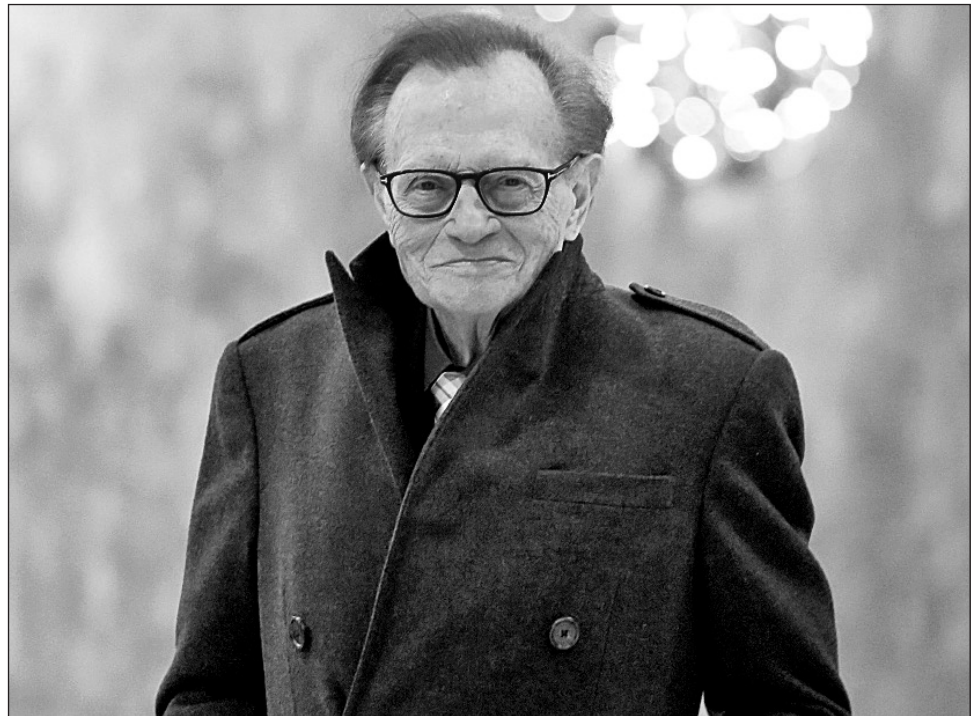
▲ King presumía que nunca se preparaba demasiado para una entrevista. Su estilo de evitar la confrontación relajaba a sus invitados y lo hacía cercano con su audiencia.

Mientras, los errores ocasionales lo hacían parecer fuera de la realidad o algo