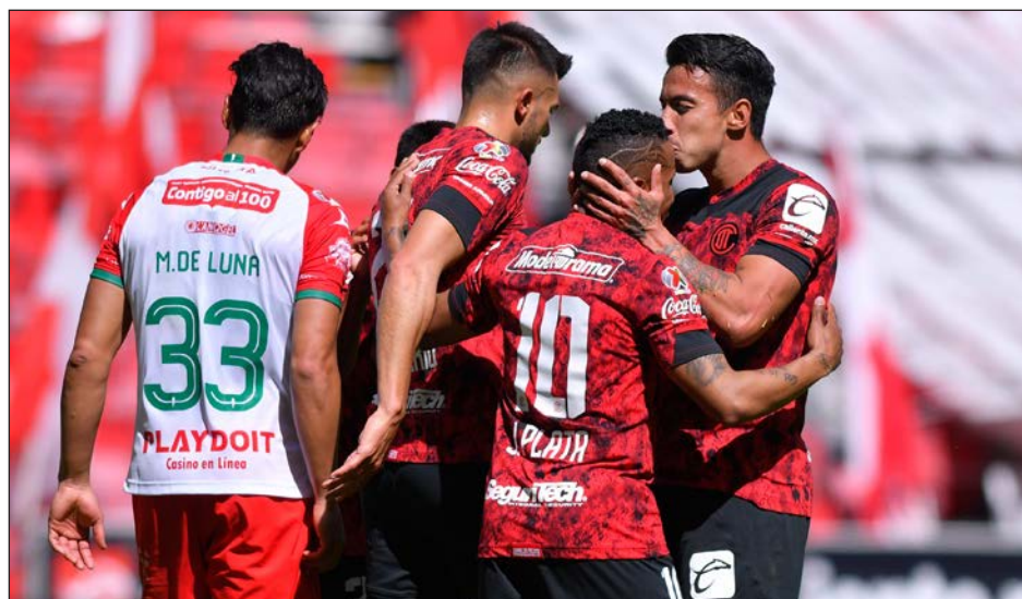
▲ Los Diablos van invictos en el comienzo del torneo Clausura de la Liga Mx.