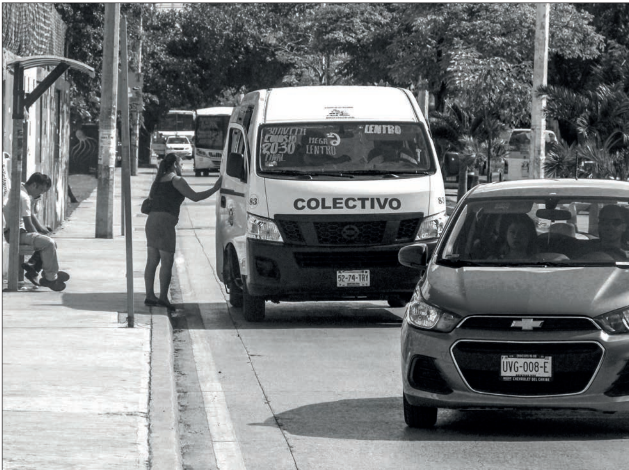
▲ La estrategia responde a las exigencias de las colectivas quintanarroenses por una Ley de Movilidad con perspectiva de género.

El Consejo General del INE aprobó la validez de las credenciales con vigencia 2019 y 2020 para ser utilizadas exclusivamente para votar el día de la jornada electoral del próximo 6 de junio.