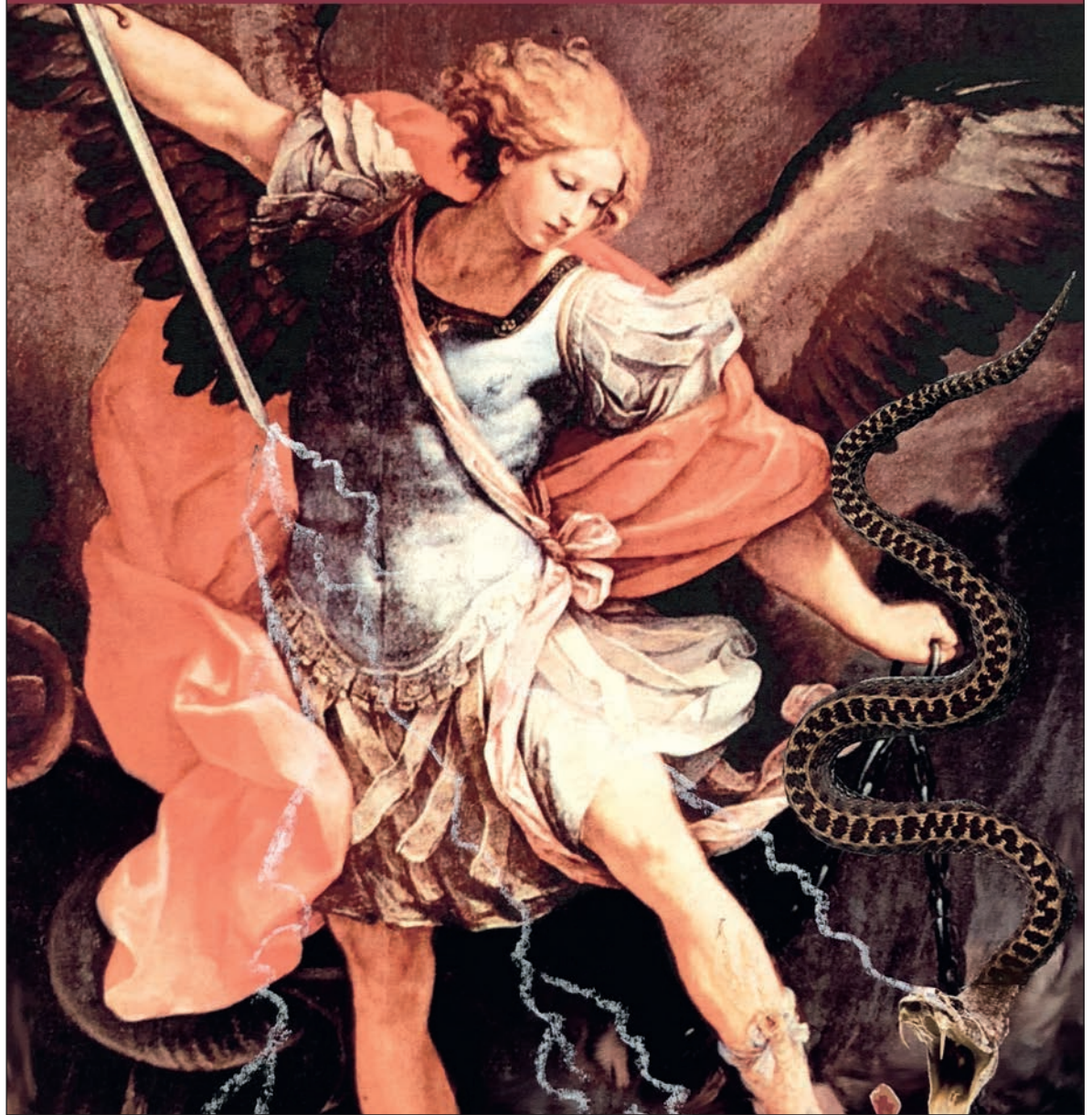
▲ En “Arcángel”, el primer cuento “Del aquí al ahora”, mismo que ilustra la portada, el escritor perfila a un hombre quien se cree San Miguel y asume la tarea de ángel vengador. Fragmento de la portada

“Tengo miedo a la inmortalidad”, refería Jorge Luis Borges a su sanción de ser Borges, esto mismo podríamos vislumbrar en Fernando Montero, el protagonista de “Final de serenata”, quien en una noche de parranda decide llevar sendas serenatas a su novia, amante y esposa y cuyo final pudo bien llevarlo a la conclusión de ya no querer seguir siendo el Montero de siempre. Quizá esa noche fue un día terminal en su larga carrera de casanova.