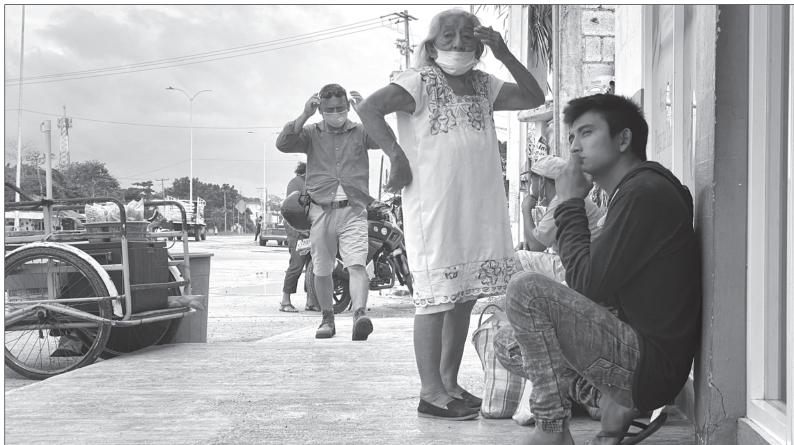
▲ La medicina tradicional y la milpa contribuyen para amortiguar los efectos negativos de la pandemia en los pueblos mayas.