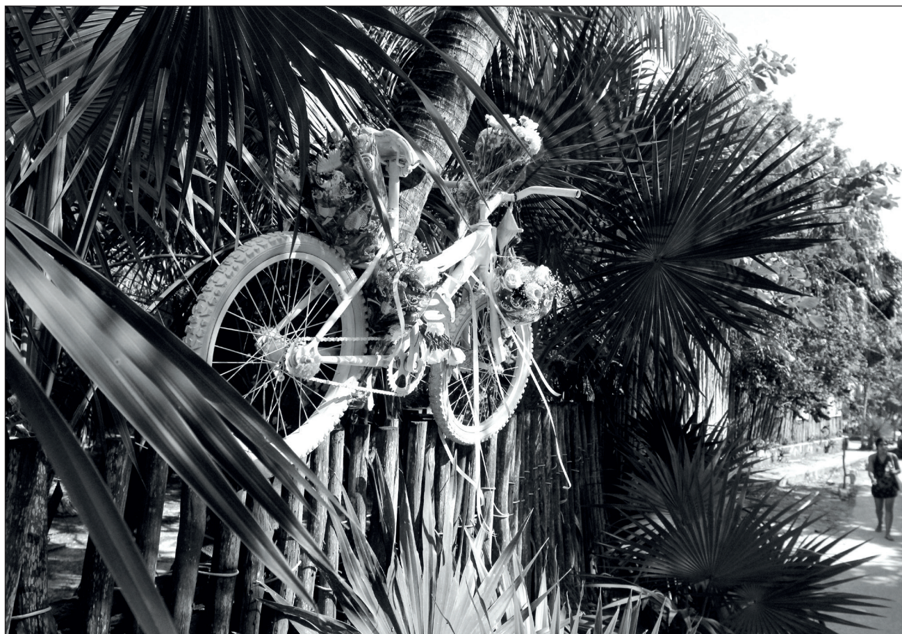
▲ El accidente ocurrido en la colonia Los Reyes, al oriente de Mérida, es el primero del año en el que un conductor de bicicleta pierde la vida.

El domingo 17 de enero, más de 100 ciclistas rodaron del Parque Ecológico de Poniente hasta Ciudad Caucel para exigir justicia por la muerte de Jacinto (occurrida hace un mes) y todos los ciclistas caídos en accidentes de tránsito, y reclamar espacios seguros para todos.