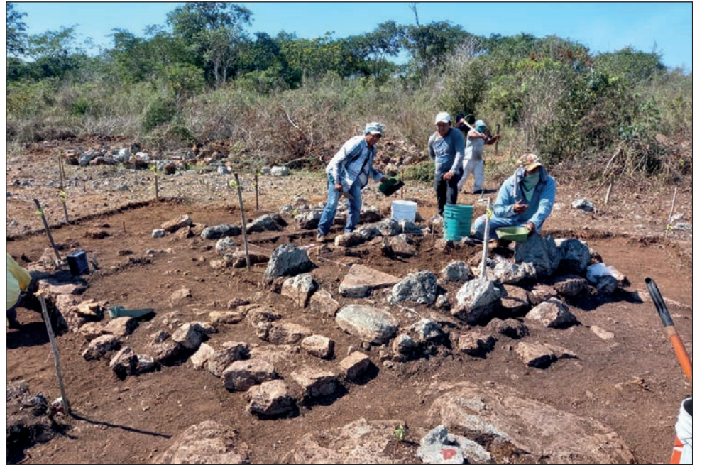
▲ Maanal 16 ja'abo'ob káajak u beeta'al u xaak'alil yéetel u meyajil Parmee' tí'al u kaláanta'al yéetel u xak'alta'al úuchben ba'alo'ob.

Le beetike', tu ya'alaj yéetel Parmee' táan u