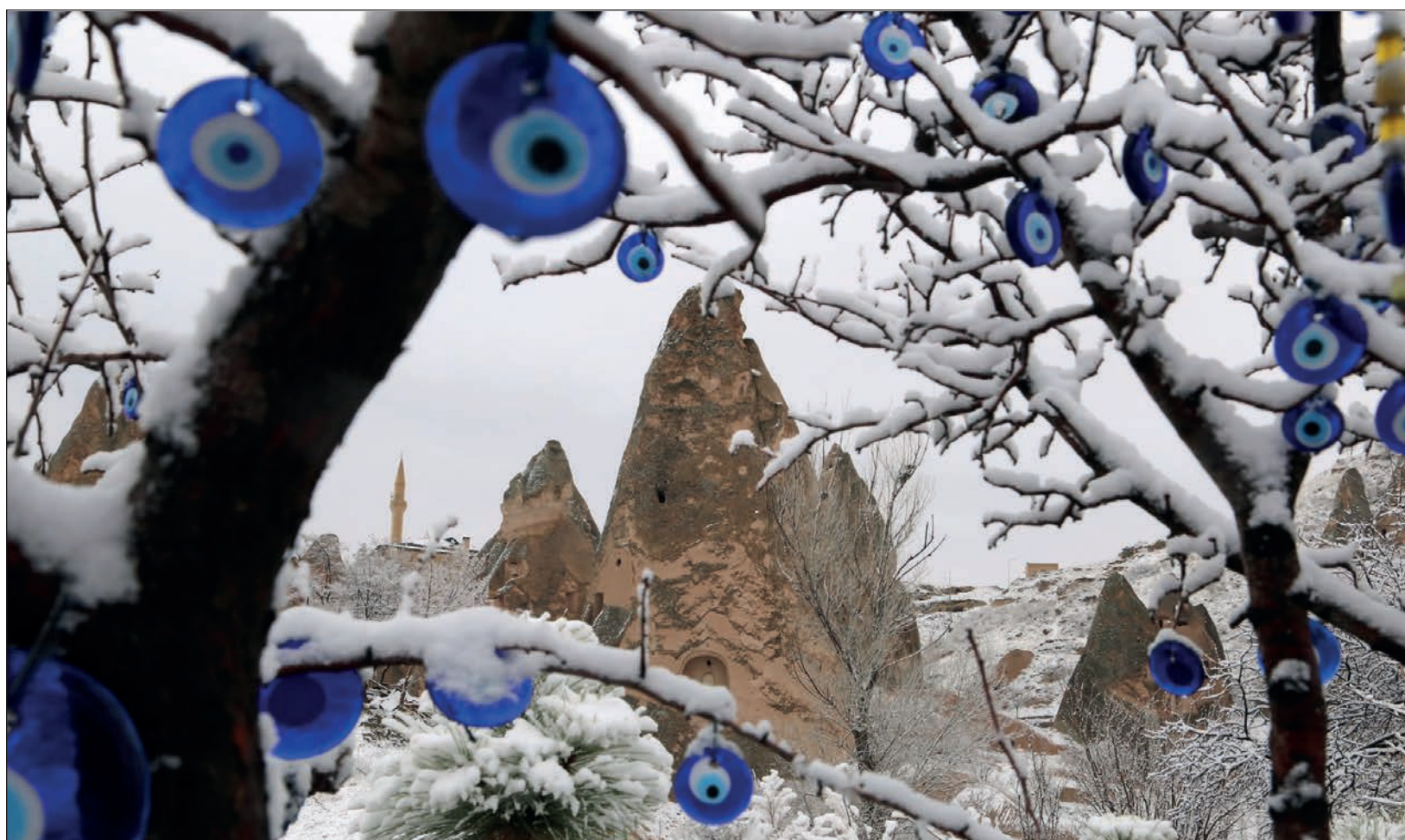
▲ El uso de los ojos de vidrio azul para conseguir protección es muy común dentro y fuera del país asiático.

La autoridad religiosa asegura que los nazar contradicen las enseñanzas del Corán