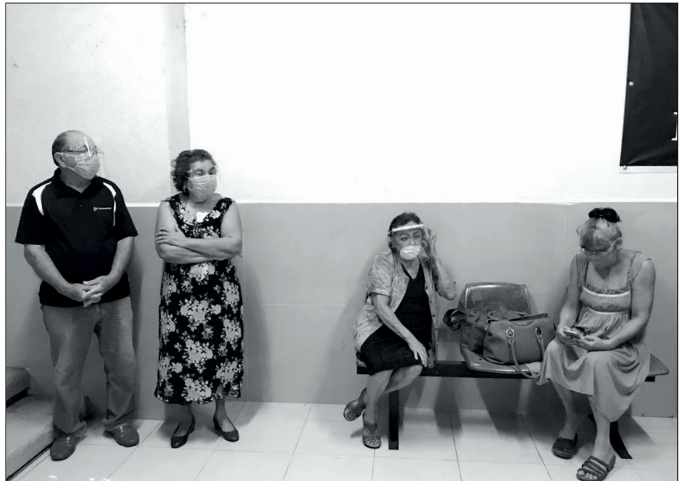
▲ A las personas adultas mayores se les pregunta si están de acuerdo en recibir la vacuna, lo que debe ocurrir a partir de febrero.

Piña Briceño admite que personal médico teme que no lleguen todas las vacunas esperadas.