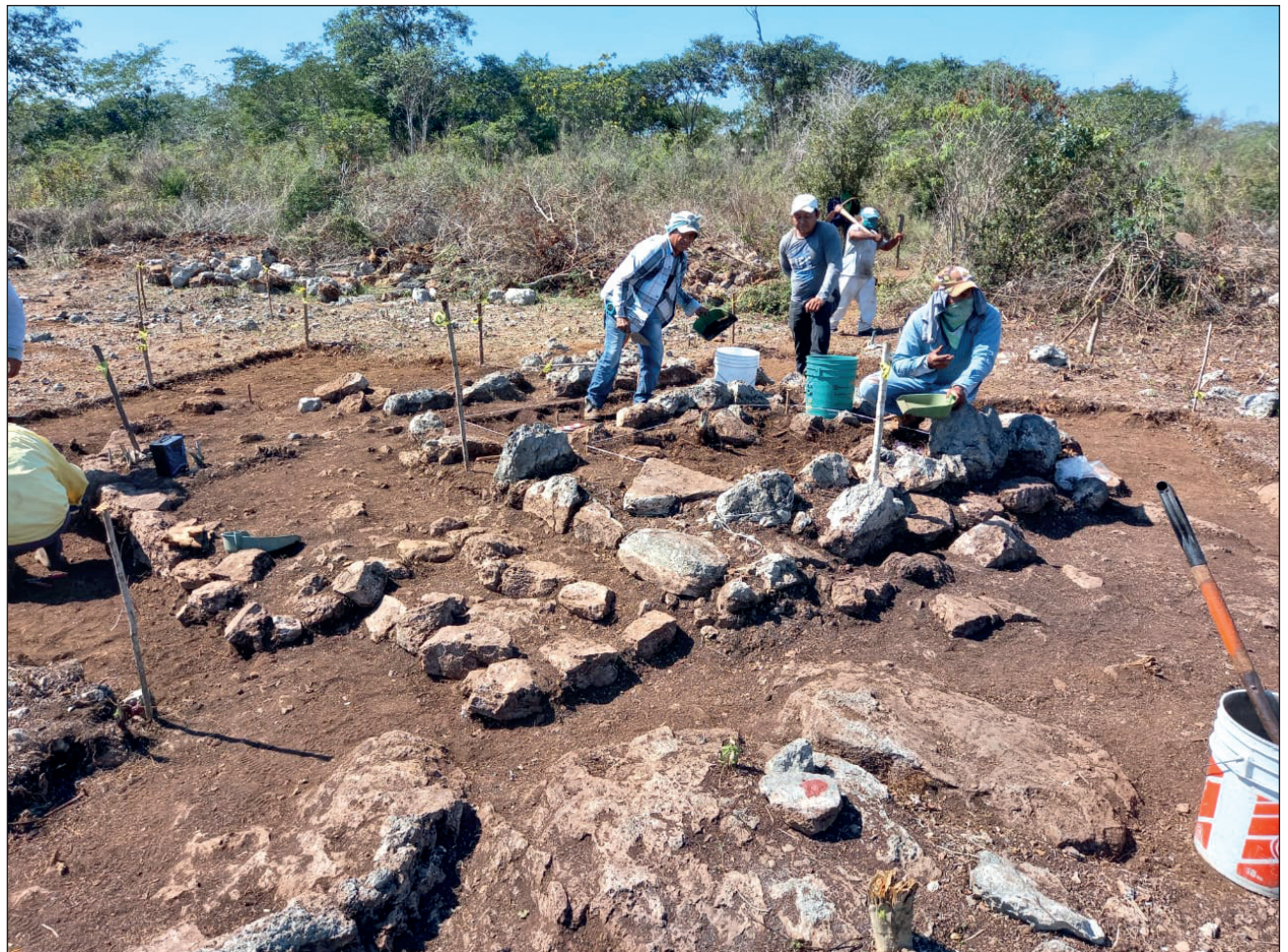
▲ En algunos fraccionamientos se ha destinado una reserva importante de montículos mayas, pero se requieren más espacios similares y que los vecinos los cuiden.