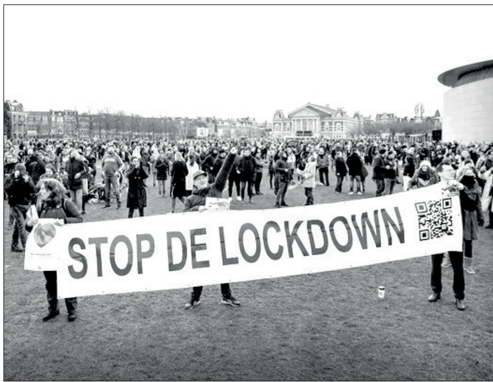
▲ Cientos de personas se congregaron en Ámsterdam y Eindhoven, donde la policía detuvo a al menos 30 manifestantes.

Entretanto, en Europa, que encabeza la lista de regiones más enlutadas con cerca de