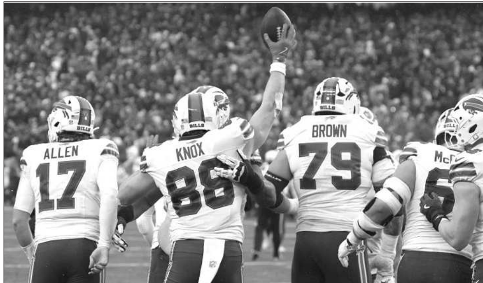
▲ Los Bills y el estelar quarterback Josh Allen estarán de nuevo en la posttemporada.

Los Bills, que no ganan un título de conferencia desde 1993 y nunca han conquistado el Súper Tazón, están a un juego del ya clasificado Nueva Inglaterra (12-3) en el Este, el mismo déficit que Los Ángeles tiene con respecto a los Broncos. Buffalo necesita ayuda para