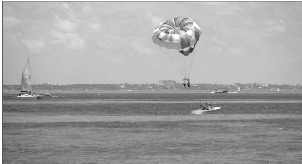
▲ Lezama explicó que el reporte de la TTW indica que para esta temporada invernal más de 122.4 millones de estadounidenses viajarán durante las vacaciones de fin de año, muchos de ellos buscando destinos cálidos y accesibles como Cancún gracias a sus bellezas naturales.

Agradeció a la plataforma digital B2B (empresa a empresa) Travel and Tour World (TTW) por posicionar a Cancún entre las y los estadounidenses y reconoció que mediante la Nueva Era de Turismo que se promueve en Quintana Roo se obtienen en estos resultados y gracias también a las y los miles de trabajadores de la industria turística como: meseros, camaristas, bartenders, jardineros, cocineros, chefs, quienes ofrecen sus servicios con gran calidad y calidez.