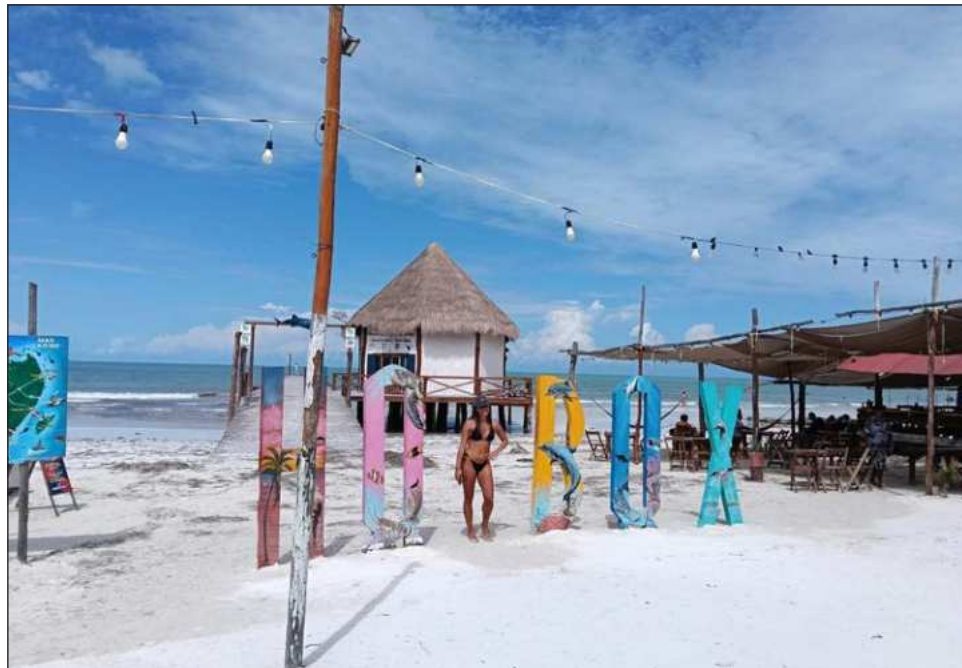
▲ Hoteleros subrayaron los avances logrados mediante la coordinación institucional para el fortalecimiento de la infraestructura de la isla, priorizando acciones orientadas a mejorar los servicios en general, la movilidad y la calidad de vida de la comunidad local.

En el comparativo anual, hasta ahora Holbox ha registrado un incremento del 10 por ciento en la ocupa-