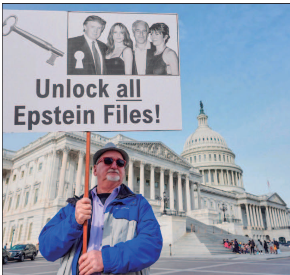
▲ La última publicación consta también de docenas de videoclips, incluyendo varios que supuestamente fueron grabados dentro de un centro de detención federal.

La Casa Blanca no respondió de inmediato a una solicitud de comentarios sobre el correo electrónico relativo a los presuntos vuelos de Trump con Epstein en la década de 1990.