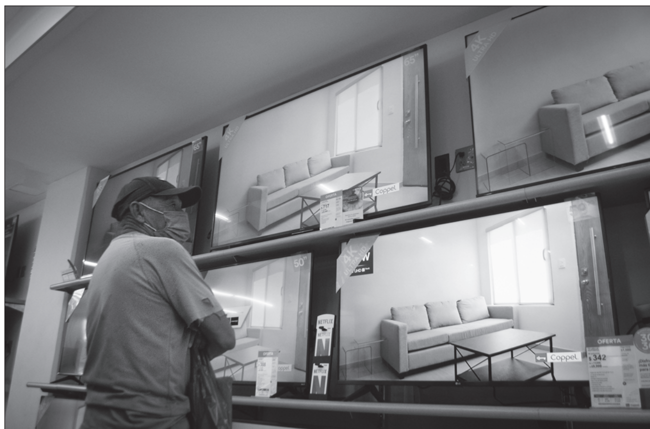
▲ Las exportaciones de equipo de computación, comunicación, medición y de otros equipos, componentes y accesorios electrónicos ocupan el segundo lugar con 24.8 por ciento y 37 mil 845.1 millones de dólares.

Agrega que por su variación anual, sobresalieron las exportaciones del sector