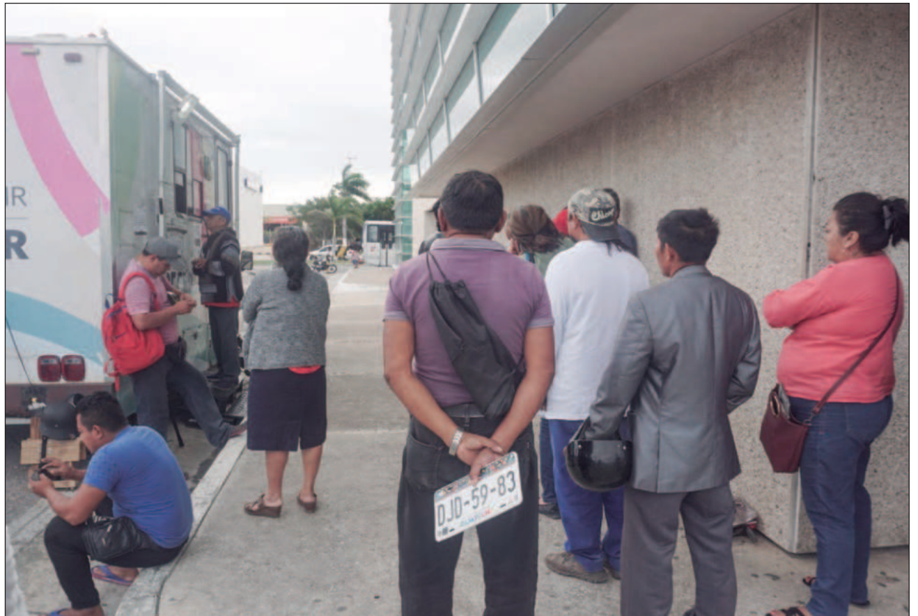
▲ El el remplacamiento se lleva a cabo cada tres años; en esta administración ya se realizaron dos procesos.

Las nuevas placas contarán con dos niveles de protección, anunció Camacho Galán