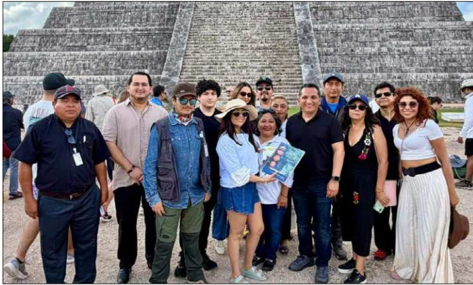
▲ La visitante, originaria de la Ciudad de México, dijo que llegó con su familia a una boda y no podían dejar pasar la oportunidad de conocer sitios arqueológicos como Chichén y los cenotes.

“No me esperaba esto, estoy muy emocionada de conocer Chichén Itzá y me parece un buen detalle que distingan a los visitantes con eventos como éste. No lo había visto antes en ningún