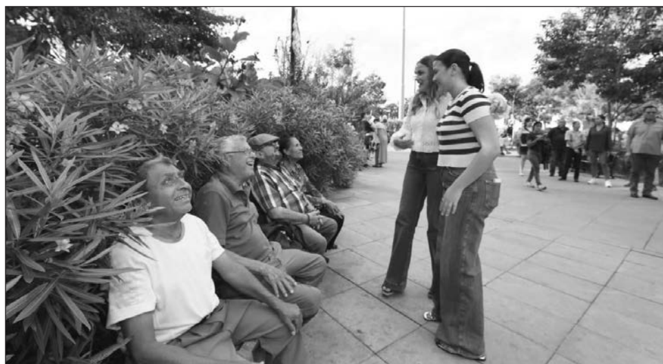
▲ Durante esta temporada vacacional, el Centro Histórico registra una afluencia de más de 400 mil personas al día, cifra que prácticamente duplica el flujo habitual que es entre 150 y 200 mil personas, lo que hace necesario fortalecer las acciones de vigilancia.

El despliegue del operativo contempla la participación de 180 elementos de la Policía Municipal más 50