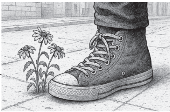
Imagen de Alfonso Arreola. Generado con IA.