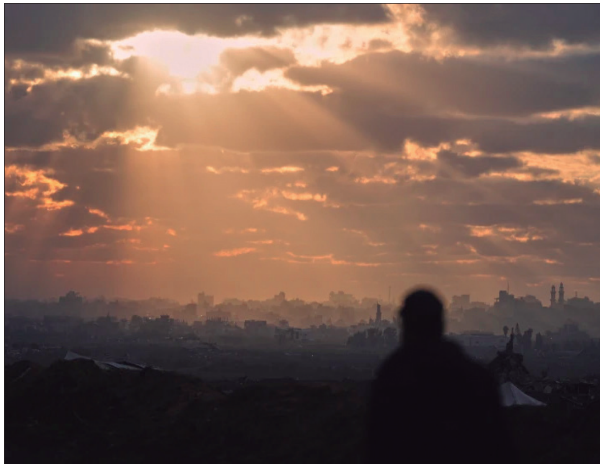
▲ “Palestina es el mayor ejemplo de degradación inhumana a manos del imperialismo que alimenta ideas y políticas como las que dan forma al sionismo, primero fue el imperialismo británico y ahora el estadounidense”.