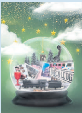
Portada. Collage digital de Rosario Mateo Calderón.