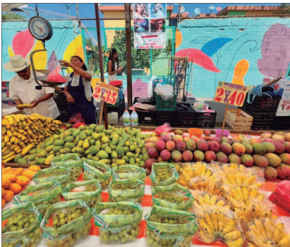
▲ En los primeros 15 días de diciembre de 2025, el Índice Nacional de Precios al Consumidor aumentó 0.17 por ciento quincenal, según datos del Inegi.

Por su parte, los precios subyacentes, que concentran alrededor de 76 por ciento del INPC y excluye los precios más volátiles, mostraron un incremento quincenal de 0.31 por ciento y una variación anual de 4.34 por ciento, inferior a 4.54 por ciento reportado en el periodo previo. La subyacente, que determina la trayectoria de la inflación en el largo plazo, acumuló 14 lecturas anuales arriba de 4 por ciento, fuera del objetivo de estabilidad de precios del banco central.