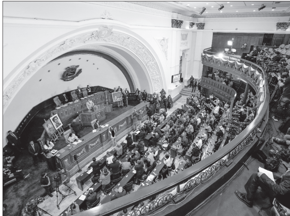
▲ El instrumento legal busca "hacer cumplir los convenios mundiales que prohíben el asalto de buques, la piratería y todos los delitos contra el comercio internacional".

Entre otras cosas, la nueva ley, que fue enviada al presidente, Nicolás Maduro, para su promulgación, establece que "toda persona que promueva, instigue, solicite, invoque, favorezca, facilite, respalde, financie o participe en acciones de piratería, bloqueo u otros ilícitos internacionales