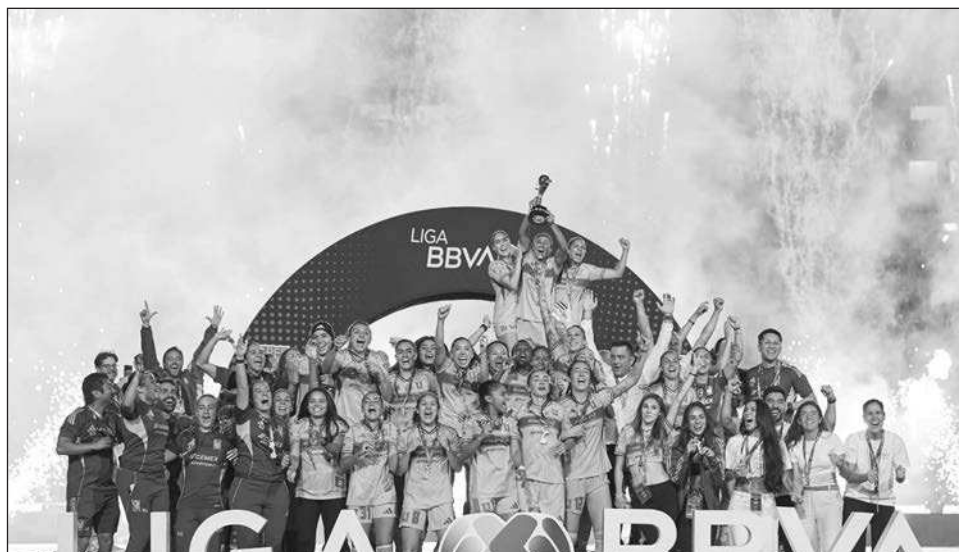
▲ El conjunto de la U.A.N.L. se coronó en el Apertura 2025 de la Liga Mx.

Por medio de una serie de encuestas a aficionados,