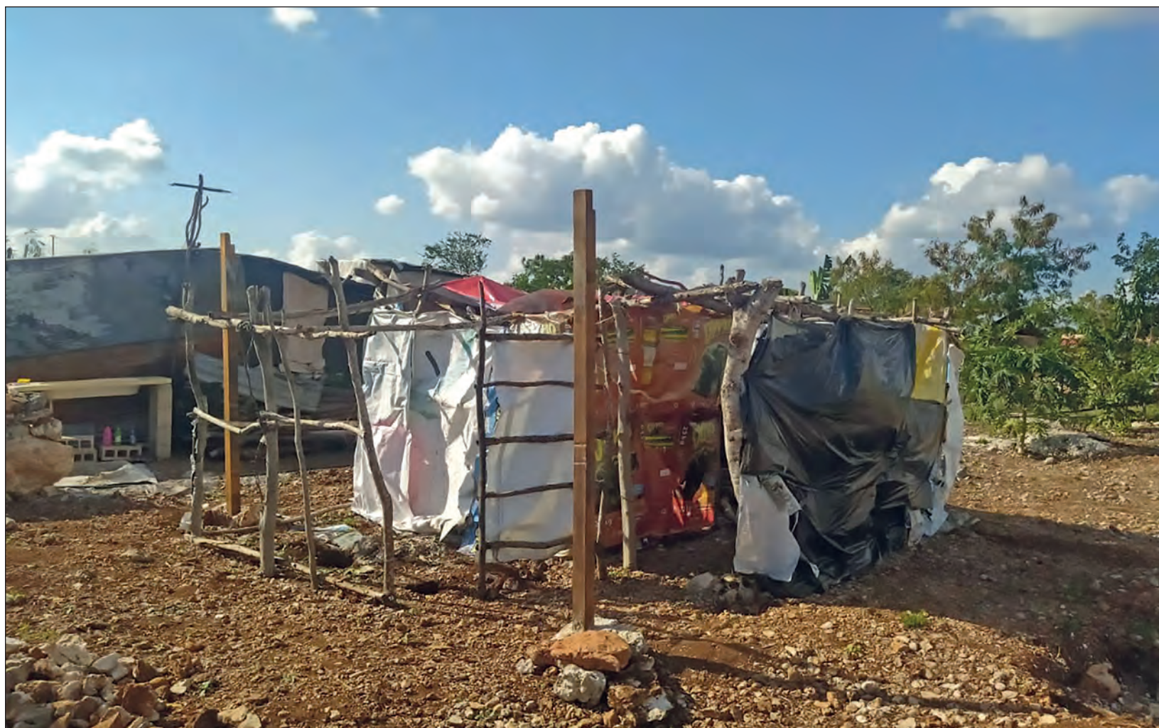
Pese a que el asentamiento está dentro de Mérida, no es sencillo llegar a El Roble Unión, donde habitan 745 personas.

Un boom inmobiliario que no distingue entre norte y sur, sino que se despliega por toda la urbe y que, como mencionó uno de los entrevistados, “tiene un sol que sale para todos”.