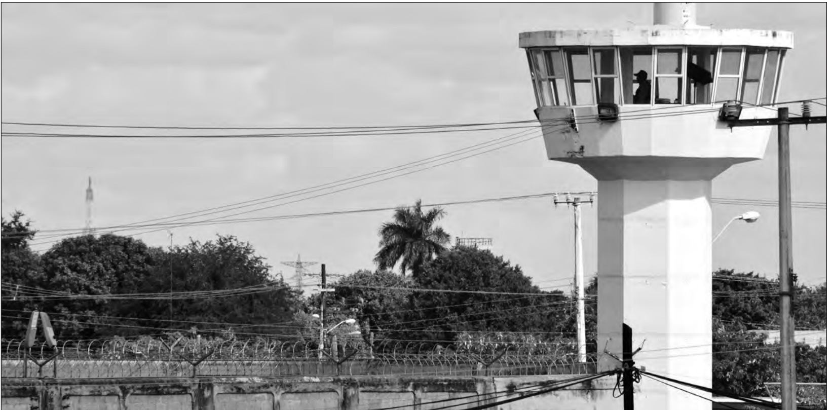
▲ En los centros de recoliación sólo se generaron "anexos" que fueron adaptados para población penitenciaria femenina.