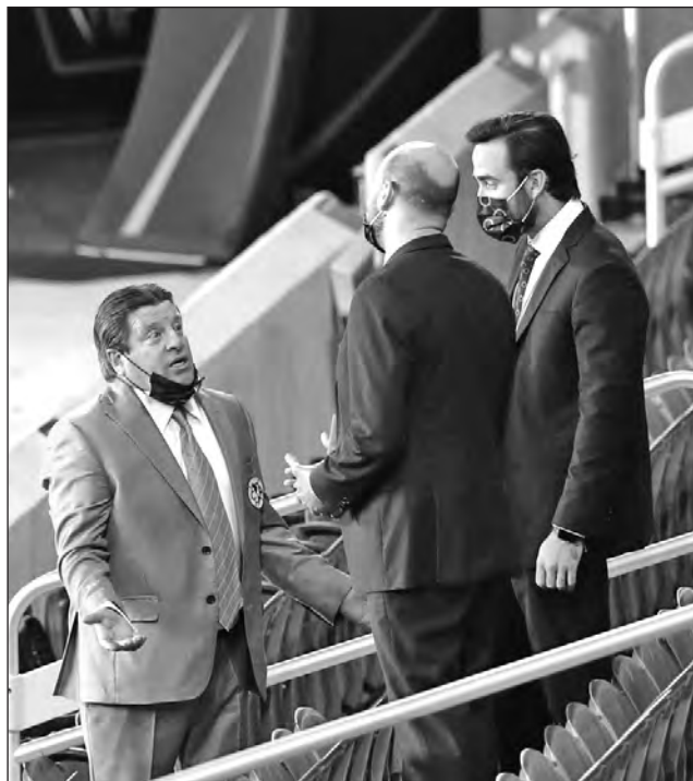
▲ Miguel Herrera, tras ser expulsado en la semifinal de la Liga de Campeones de la Concacaf contra Los Ángeles.

El otrora guardameta señaló también que la mala racha del cuadro azulcrema en el semestre anterior "no sólo fue responsabilidad de Miguel. Si bien es cierto que los jugadores acatan las órdenes que les da el entrenador, su obligación es hacer bien su trabajo dentro de la cancha, y en este caso, muchos dejaron de hacer cosas que finalmente perjudicaron al equipo, por eso, me parece que además del 'Piojo', deberían salir varios futbolistas que no rindieron como se esperaba".