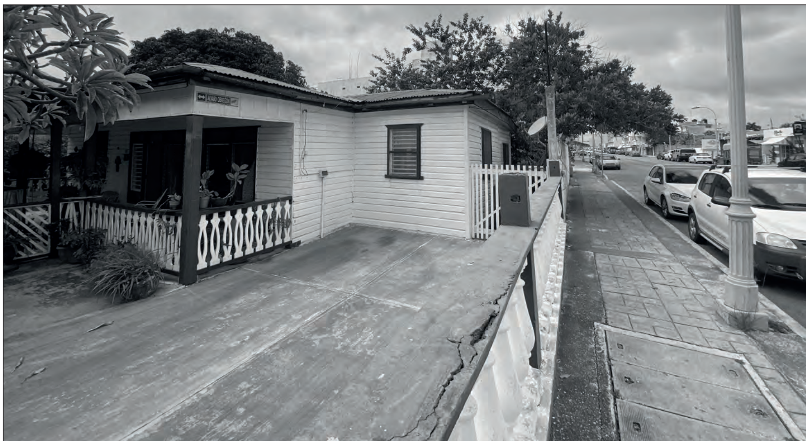
▲ La reciente asignación de créditos inmobiliarios no tuvo mayor impacto en la compraventa de casas en Chetumal, además de que los montos de créditos se redujeron al disminuir los salarios.

Este comportamiento, consideró, se debió a que muchas personas que trabajaban en otros estados o en la zona norte volvieron a Chetumal. “Muchos se quedaron sin trabajo o el home office permitió que regresaran a sus hogares, entonces por esa cuestión se movieron bastante los arrendamientos”.