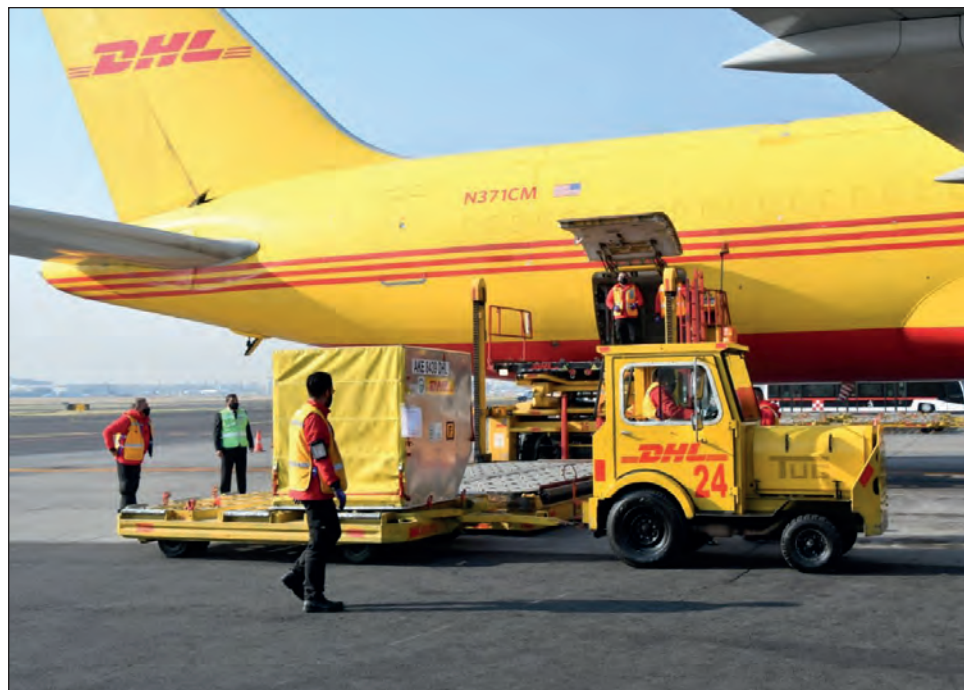
▲ El canciller señaló que cada martes llegarán embarques similares hasta completar un millón 420 mil 575 dosis a finales de enero.

Por su parte, el titular de la Secretaría de Hacienda y Crédito Público, Arturo Herrera, informó que ya se han firmado convenios para la adquisición de vacunas por un total de mil 669 millones de dólares, equivalentes a 33 mil millones de pesos, y anunció que para garantizar la compra,