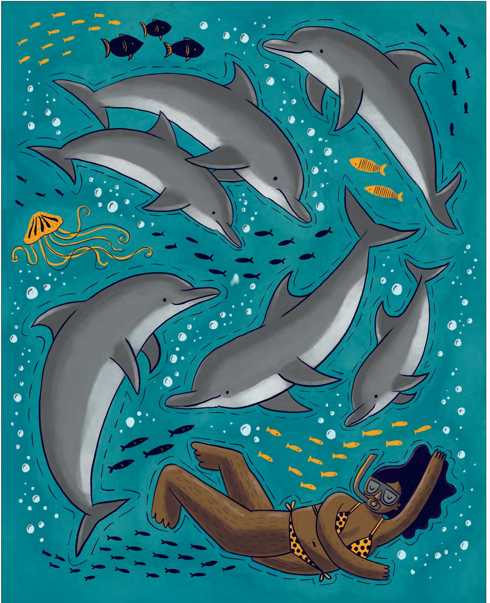
▲ Como parte de la sección Fauna nuestra , incluimos una plana de ilustraciones recortables alusivos a la especie estudiada en el número. En esta ocasión, es el turno del delfín. Ilustración @ca.ma.leon