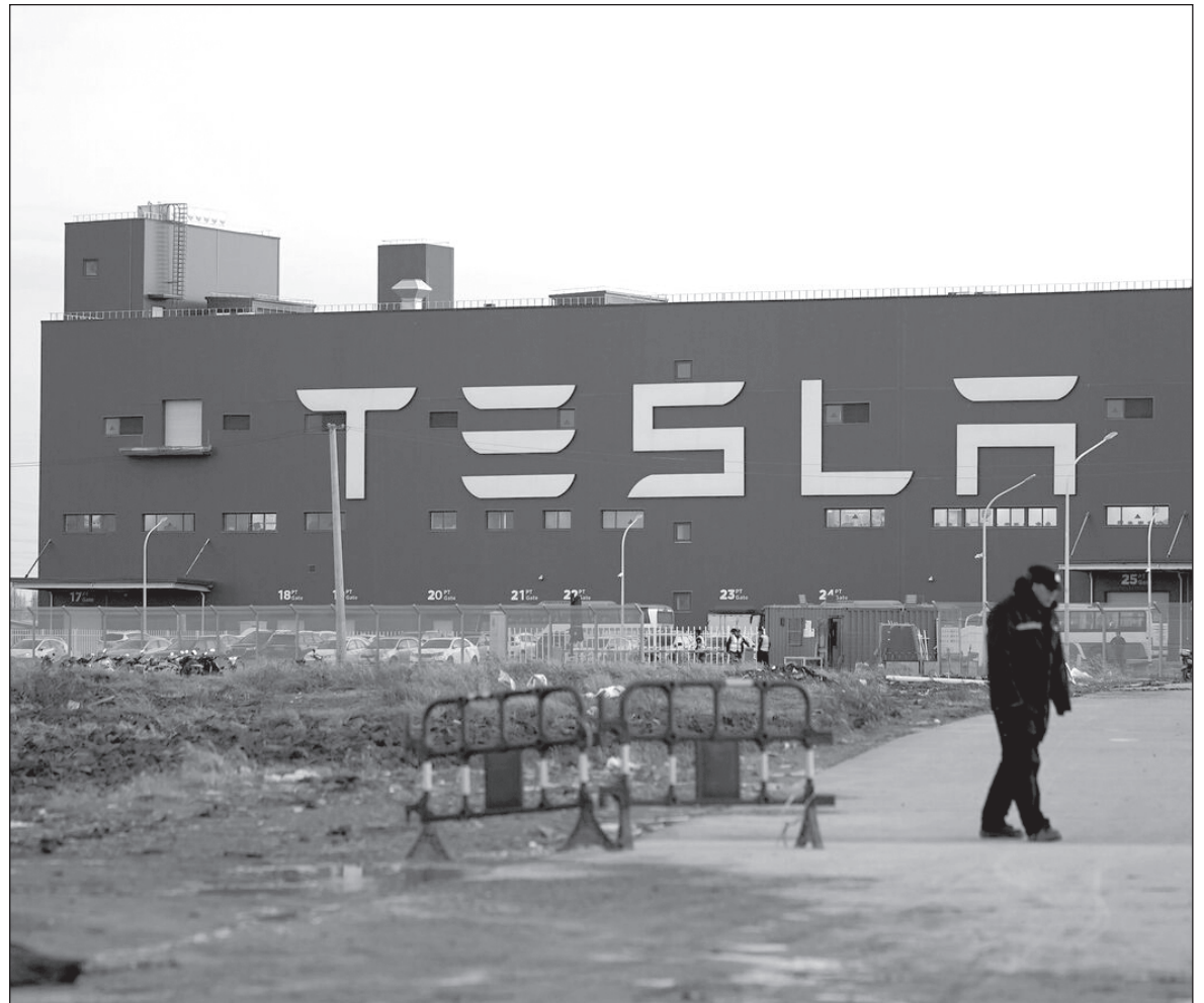
▲ Markets are betting on new technology to create new resources of energy. Tesla and a number of new electrical vehicle startups have catapulted in value.

LEADERS LIKE ANGELA Merkel and Justin Trudeau see a future not bound by fossil fuels (although they will continue to play a role in the near future) but, rather, an economy fueled by renewable and non-polluting resources.