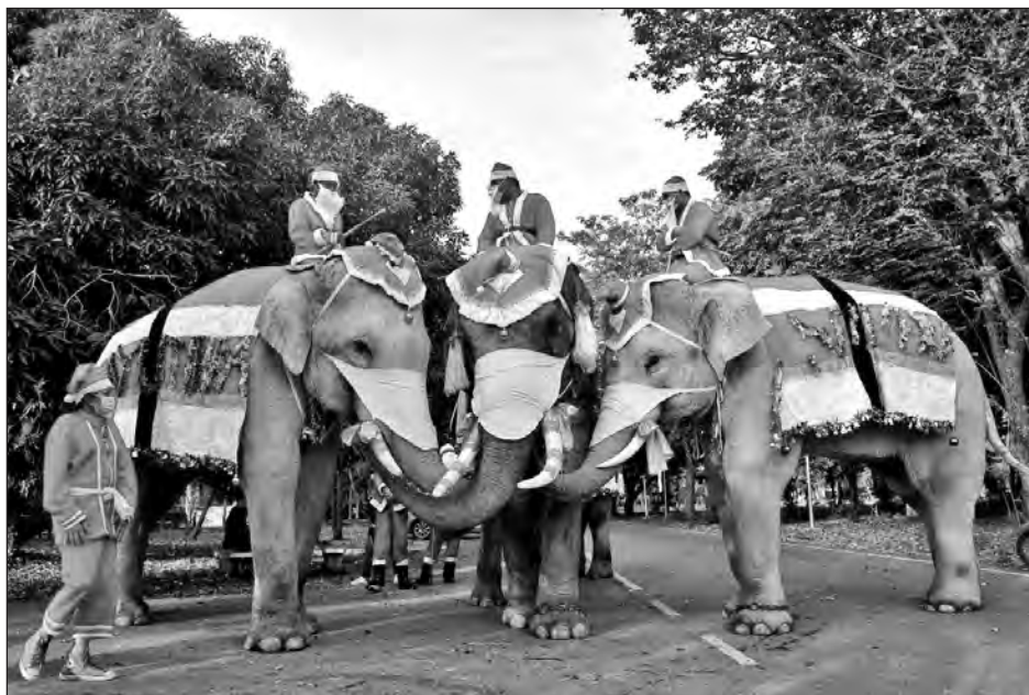
▲ Los elefantes han estado haciendo visitas de fin de año a escuelas de la zona durante dos décadas; normalmente regalan dulces y juguetes.

Personas disfrazadas con trajes de Papá Noel y sombreros se sentaron sobre los elefantes ataviados con decoraciones navideñas en la provincia central de Ayutthaya, distribuyendo mascarillas en canastas a los niños en edad escolar, motociclistas y conductores.