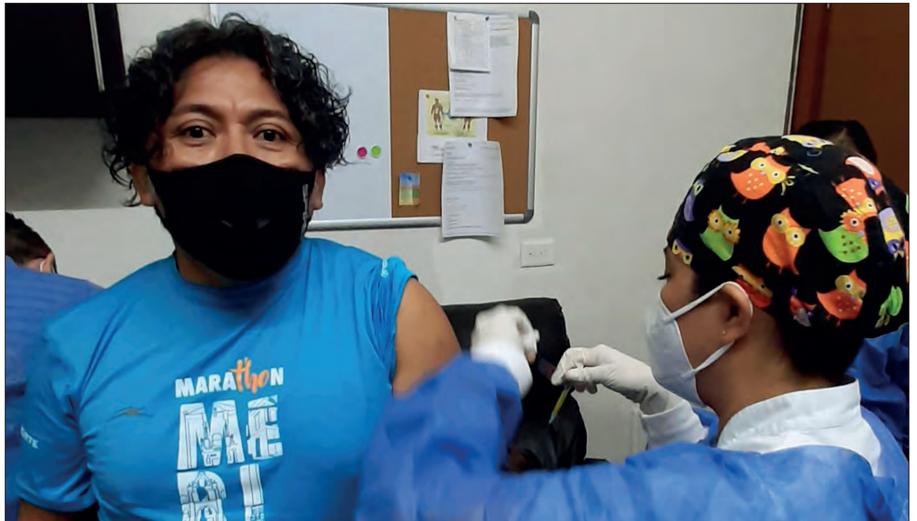
▲ El estudio Mosaico busca reunir a 3 mil 800 voluntarios para probar la vacuna contra VIH que desarrolla la farmacéutica Janssen, que es la primera en llegar a la etapa 3 de pruebas.

“El objetivo de este estudio es evaluar la eficiencia y seguridad de un régimen de vacunas para prevenir VIH y nos enorgullece poder comentar que en la Unamis fue aplicada la primera inyección de prueba para prevenir la enfermedad”, indicó.