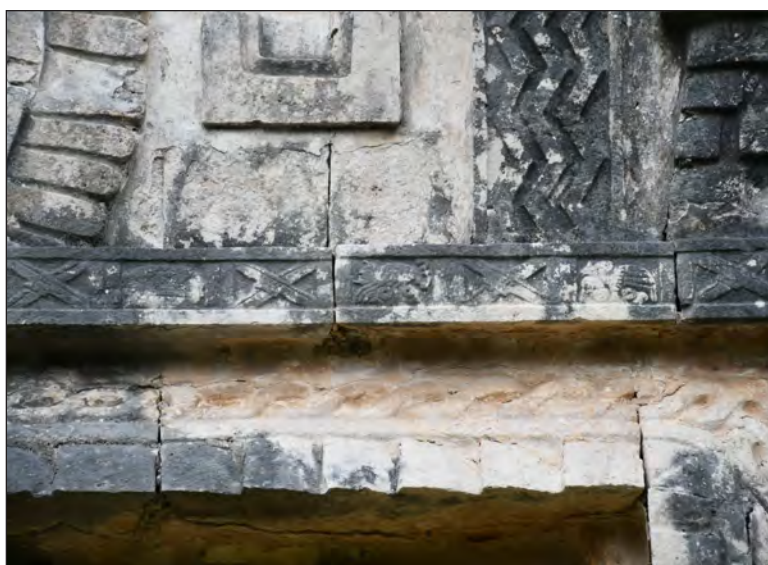
▲ A la izquierda, registro de planetas y constelaciones en el conjunto de las Monjas, Chichén Itzá. Algunos autores relacionan las representaciones de un escorpión, tortuga, ave y cruces con el nombre o deidad con el que se designaba a planetas y constelaciones.