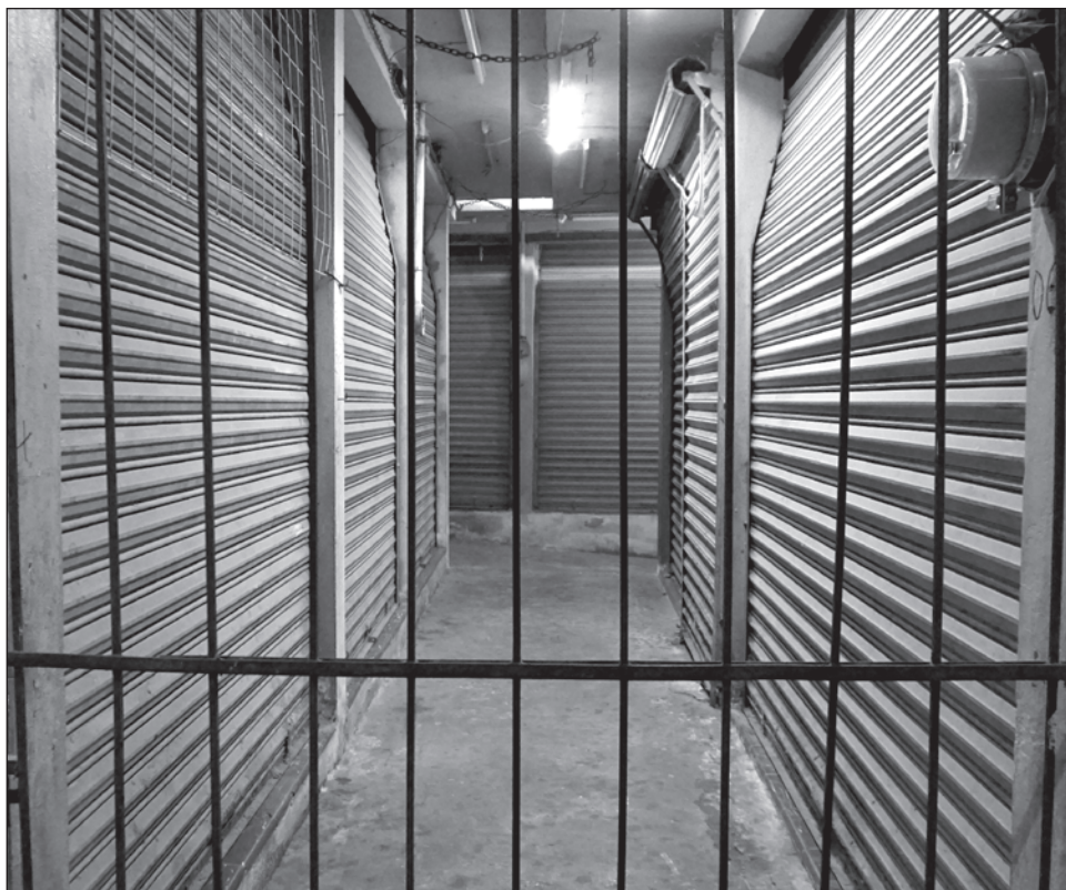
▲ Los intentos de reactivación económica han sido insuficientes, ante las rentas de locales.