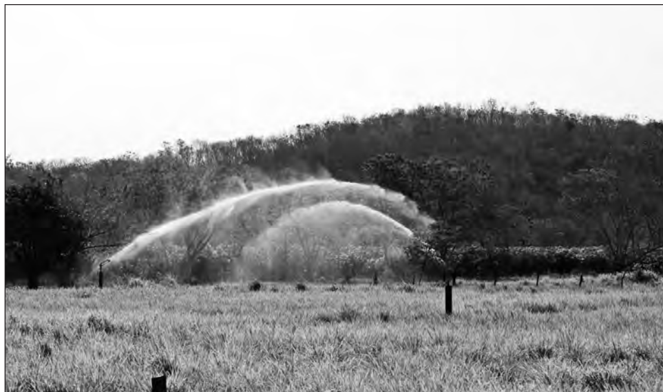
▲ El estado cuenta con recursos hídricos, tierra y clima para cultivar productos de alto valor comercial, señaló el coordinador estatal del Frente Nacional Socialista Institucional Mexicano.

"Es necesario que las autoridades de los tres niveles de gobierno impulsen proyec-