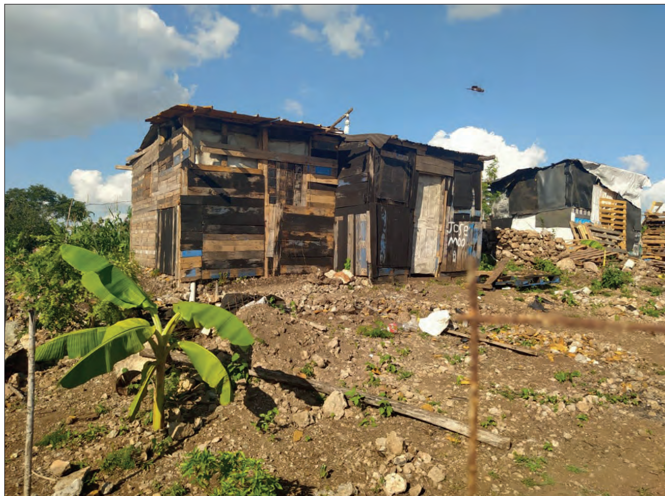
En El Roble Unión cada propiedad abarca una superficie de 10 por 20 metros.

Luego de que llegaron, recordó que otras perso-