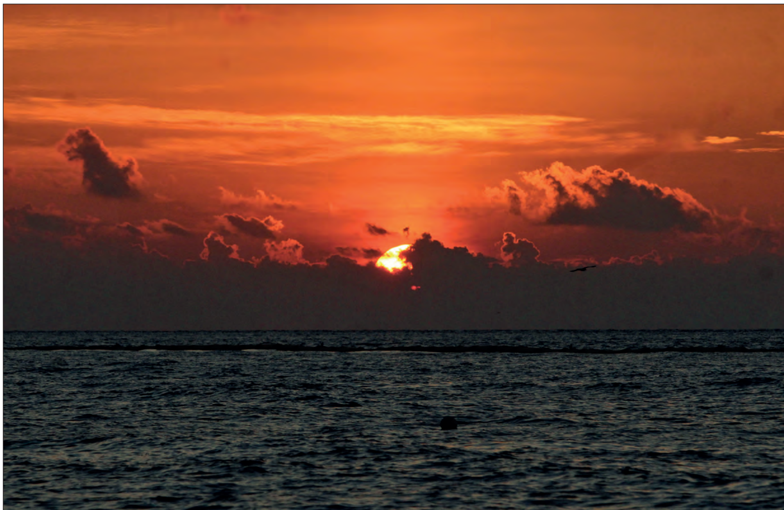
▲ Frente al mar, despojado de la grandeza del engaño, escucho al silencio que al nombrarlo reverdece similar a la esperanza, endeble y fragmentada, pero enraizada en quienes apostamos por un mejor porvenir para la humanidad.