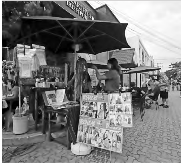
▲ En Playa del Carmen varios negocios pagan el arrendamiento de locales en dólares.

"El tema de las rentas en dólares es algo que está permitido en la ley; muchas veces, para no aumentarlas cada año éstas se tasan en dólares, y con la fluctuación del dólar no hay necesidad del incremento, que en ocasiones es de hasta 10 por ciento", mencionó.