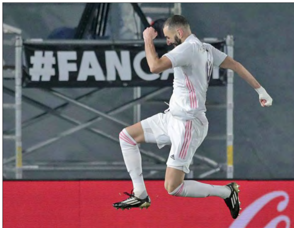
▲ Karim Benzema anotó de nuevo para un Real Madrid que continúa en ascenso.

"Quedan muchos partidos, pero ojalá podamos seguir con la racha de triunfos que ahora ya es de seis", dijo Casemiro.