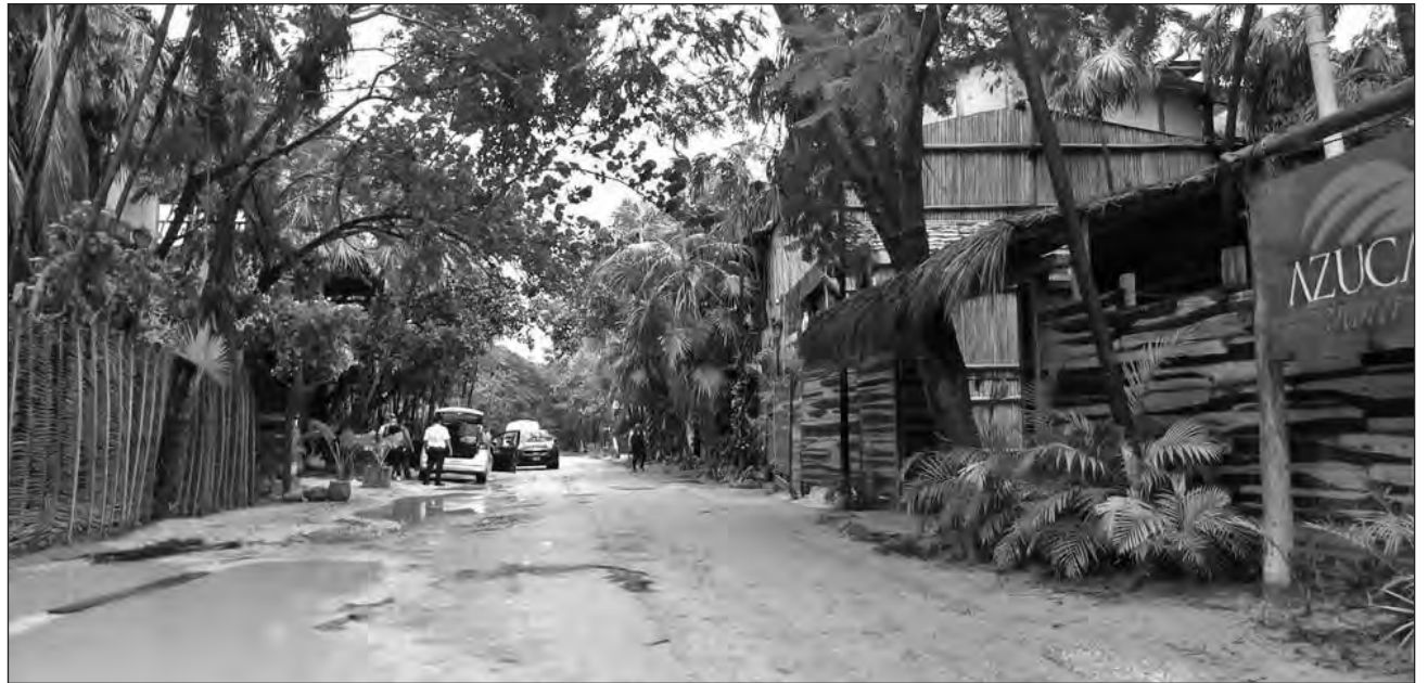
▲ Con el proyecto Ruta Mágica Tulum-Cobá, ejidatarios y pequeños comerciantes pretenden crear una identidad territorial turística dirigida a una oferta comercial y de desarrollo urbano planificado.

Recordó que sin un ordenamiento sustentable y planeado que permita que las diferentes zonas se desarrollen seguirán habiendo focos de sobredensificación y zonas ol-