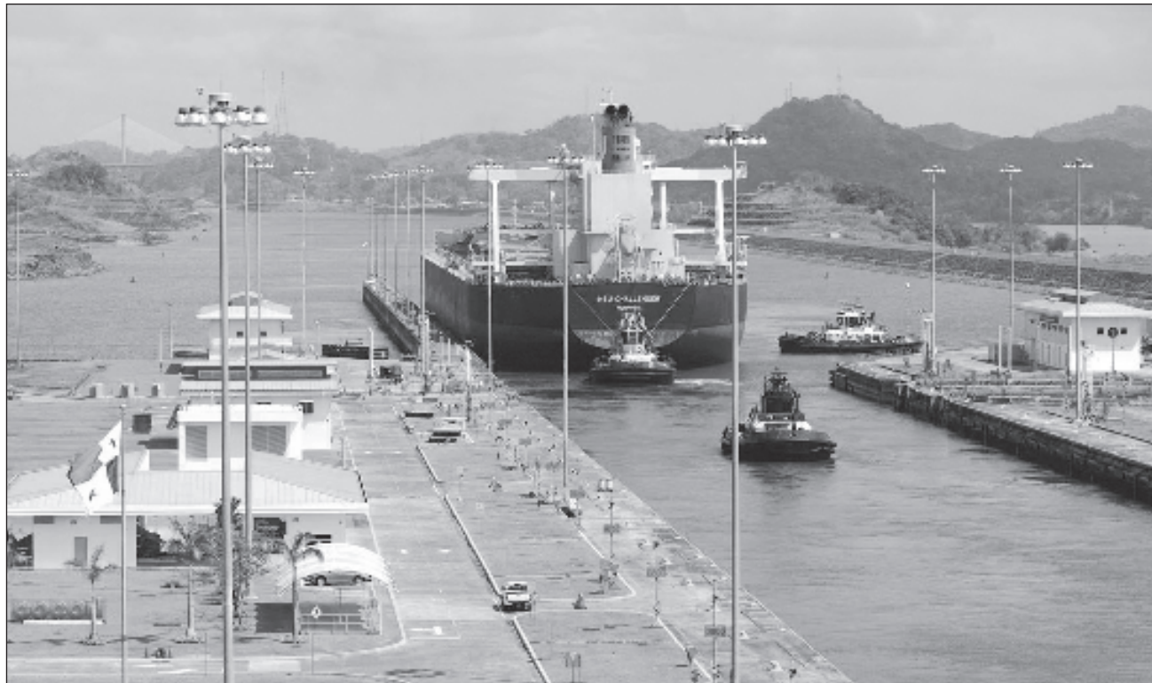
▲ La reacción del gobierno panameño se produce después de que Petro, en la red social X, dijera que el Canal de Panamá estaba cerrado por “la sequía”, un mensaje que acompañó con un video donde se pueden ver buques aparentemente detenidos.

El presidente de México, Andrés Manuel López Obrador, también se refirió el lunes, en su matutina conferencia de prensa, a la situación “especial” que atraviesa la ruta panameña, afectada por la escasez de agua producto de la sequía.