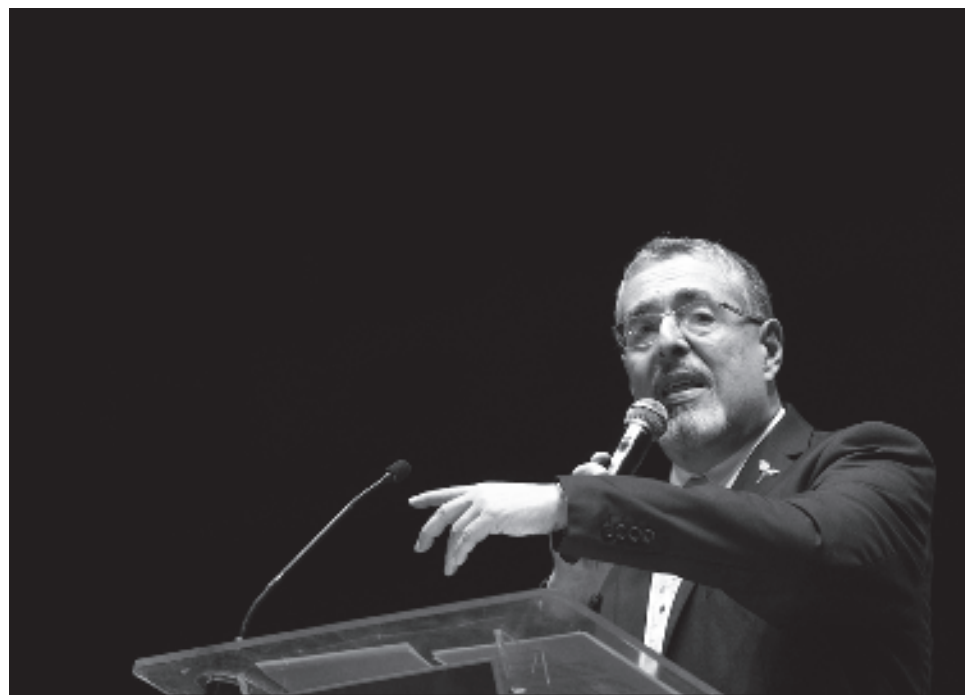
▲ Arévalo reconoce que hay un movimiento pendular en América Latina “porque los consensos básicos se han diluido (...) la democracia representativa ya no es suficiente”.

A raíz de que se perfiló este diplomático y académico de corte socialdemócrata como relevo del actual presidente Alejandro Giammattei, Guatemala volvió a atraer la atención del mundo. Sobre la forma como su país se insertará en el contexto latinoamericano, que se mueve constantemente entre el progresismo y el retroceso, Arévalo reconoce que hay un movimiento pendular en América Latina “porque los consensos básicos se han diluido, hay una