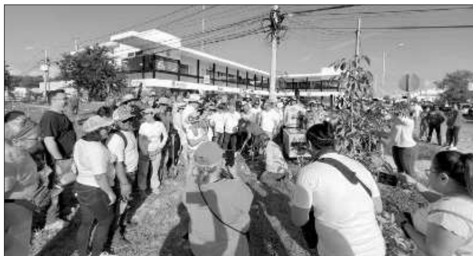
▲ Los vecinos de este municipio están conscientes de la necesidad de tener más sombra natural y de resarcir un poco el daño que ocasiona la plancha de cemento.

“La idea es que los árboles crezcan y den sombra a los transeúntes y a todos los que utilizan esa vía para hacer ejercicio o que usan