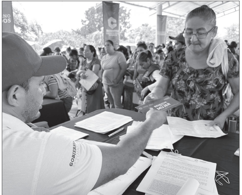
▲ Tan sólo en Candelaria, se destinó 1 millón 492 mil pesos para 746 mujeres de diversas comunidades, quienes recibieron 2 mil pesos de apoyo.

“Apoyar a las mujeres es apoyar el desarrollo de