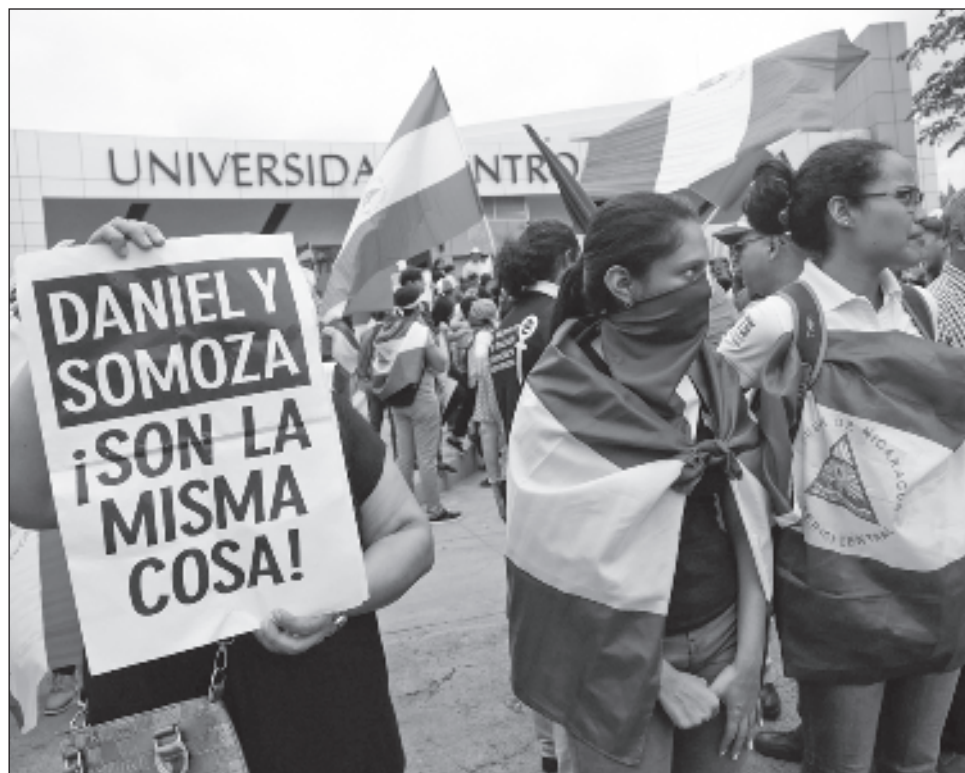
▲ El gobierno del presidente Daniel Ortega mantiene una conflictiva relación con la Iglesia católica y varios religiosos han sido conminados a abandonar el país o han sido acusados en tribunales.

El gobierno del presidente Daniel Ortega mantiene una