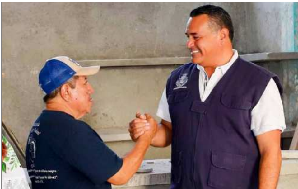
▲ “Los Centros de Desarrollo Integral nos permiten mantener ese vínculo cercano con la población y llegar a las personas que quieren seguir aprendiendo”: Renán Barrera.

Finalmente, informó que los cursos inician el 4 de septiembre. Para las inscripciones se deberá presentar la siguiente documentación en original y copia: 2 fotografías tamaño infantil (blanco y negro o a color) con fondo, cara descubierta, bien iluminada, comprobante de domicilio (vigencia no mayor a 3 meses), acta de nacimiento, INE (si es menor de edad identificación del tutor) y CURP. Las inscripciones se realizarán personalmente en cada uno de los CDI.