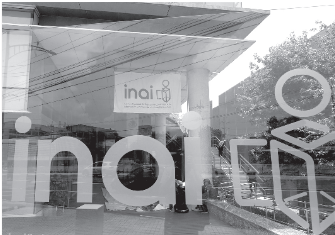
▲ En contra del proyecto sólo votó la ministra Yasmín Esquivel, a favor: los ministros Luis María Aguilar Morales, Alberto Pérez Dayán y el propio Laynez; La ministra Ortiz estuvo ausente por encontrarse de vacaciones.

En contra del proyecto solo votó la ministra Yasmín Esquivel, a favor los ministros Luis María Aguilar Morales, Alberto Pérez Dayán y el propio Laynez. La ministra Ortiz estuvo ausente por vacaciones.