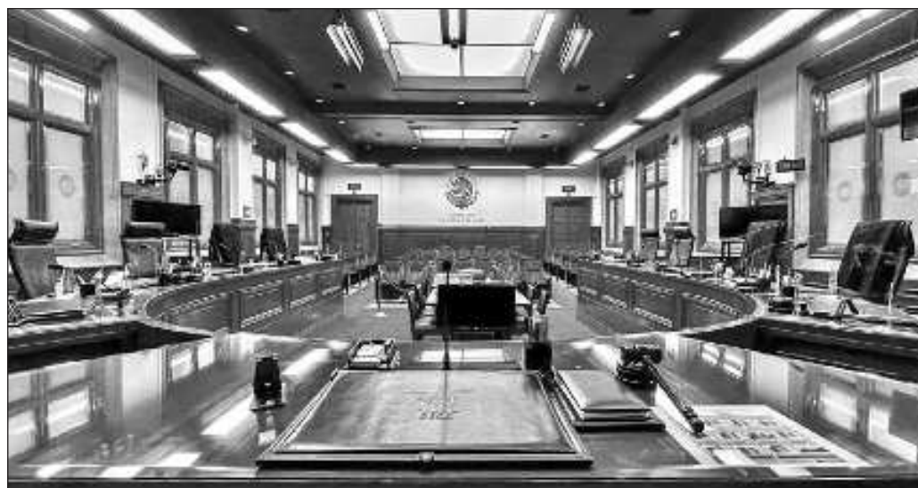
▲ La amenaza de parálisis total del INAI, por lo pronto, ha sido desvanecida por el Poder Judicial. Queda ahora en manos del Legislativo despejar las nubes de tormenta que aún pesan sobre el organismo.

La amenaza de parálisis total del INAI, por lo pronto, ha sido desvanecida por el Poder Judicial. Queda ahora en manos del Legislativo despejar las nubes de tormenta que aún pesan sobre el organismo. Sin embargo, aún quedan más jornadas de tensión en el Senado para garantizar la continuidad del INAI como órgano garante del derecho a la información pública y protección de datos personales. Mientras, los diferendos entre los tres poderes continuarán, como debe ser en toda república, pero queda también pendiente garantizar el recto proceder de los encargados de impartir justicia.