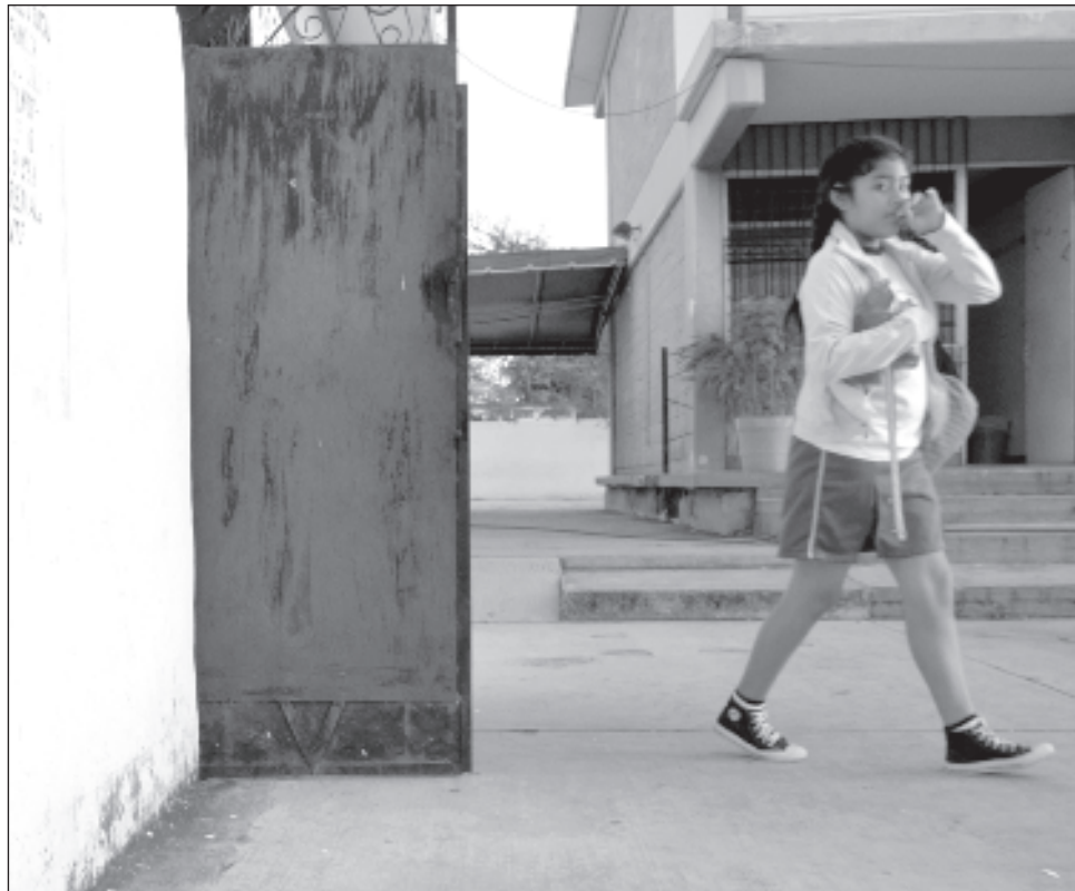
▲ En las estadísticas oficiales aparece Campeche ocupando el primer lugar a nivel nacional en lesiones dolosas contra las mujeres; en el primer semestre del año se hicieron 259 reportes por este tipo de casos.

El Secretariado tiene un registro de las 100 ciudades del país que tienen feminicidios, los tres estados de la península registran al menos una ciudad con índices altos, cuatro son