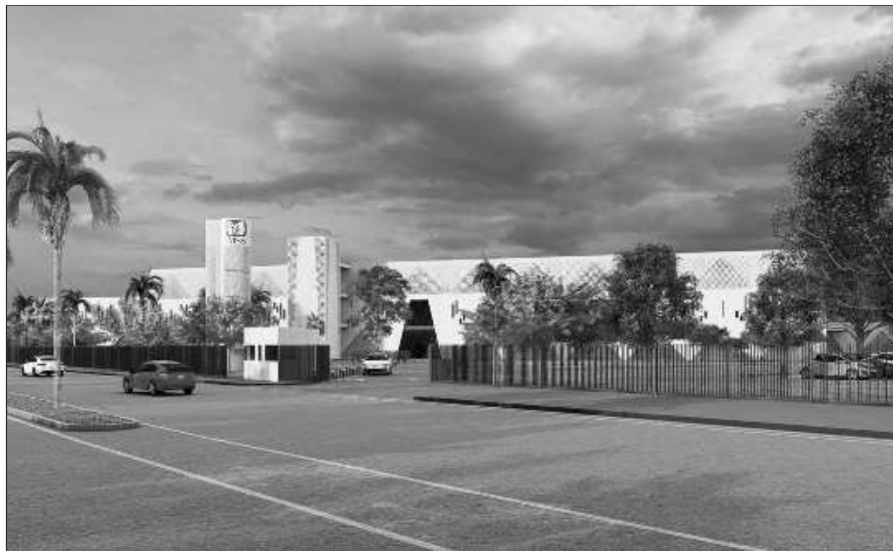
▲ El hospital ampliará los servicios de salud de la región con 70 camas y 15 especialidades.

Hay que recordar que, resultado de tres años de diálogo y gestiones de parte del gobernador Mauricio Vila Dosal ante la empresa