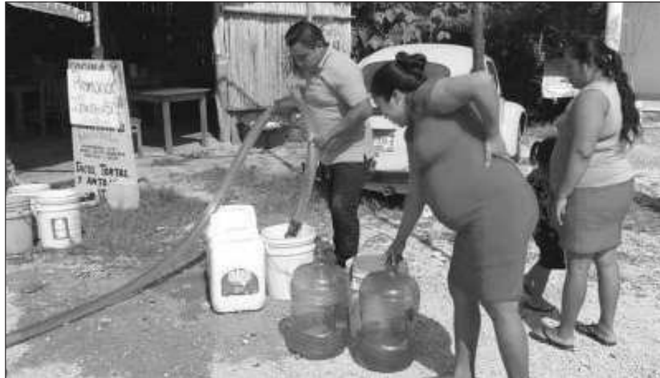
▲ Este año, la Semana Mundial del Agua se lleva a cabo en Estocolmo, Suecia, bajo el lema de Semillas del Cambio: Soluciones innovadoras para un Mundo Sabio .

El activista también señaló que se deberían aterrizar en la entidad las ideas y