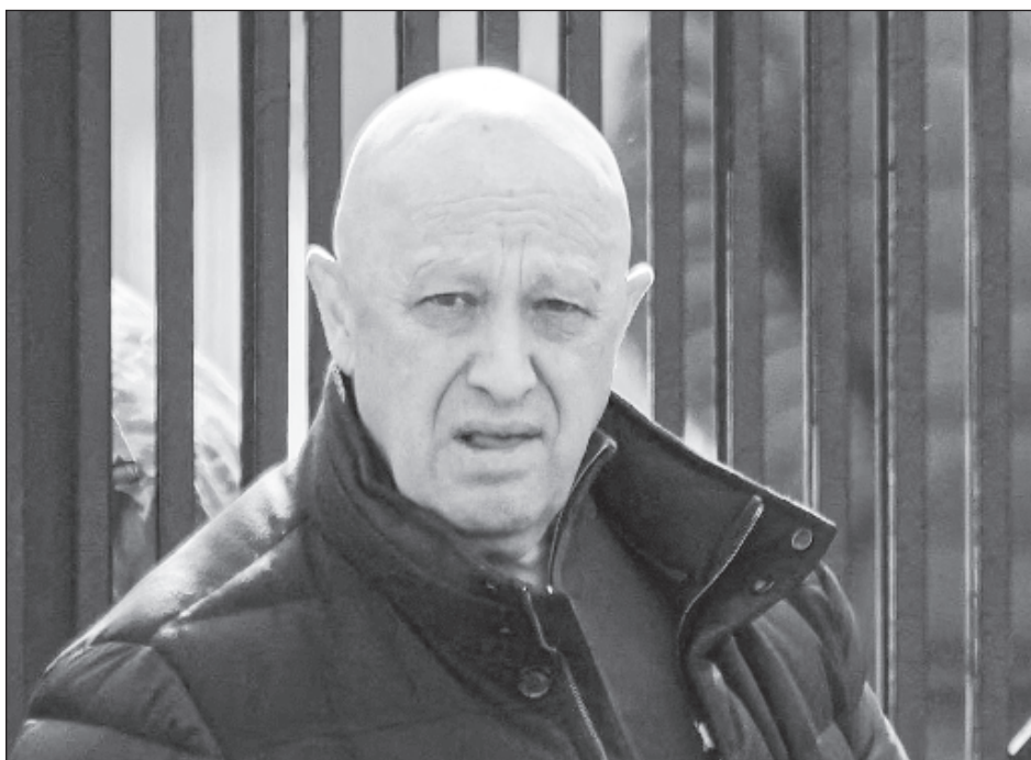
▲ Prigozhin, de 62 años, protagonizó hace dos meses una fallida rebelión militar contra el Kremlin en la que llegó a tomar una de las ciudades de Rusia, Rostov del Don.

La agenda de la actual cumbre de los BRICS, que representan 18 por ciento del comercio mundial, incluye la búsqueda de alternativas al dólar en sus transacciones comerciales.