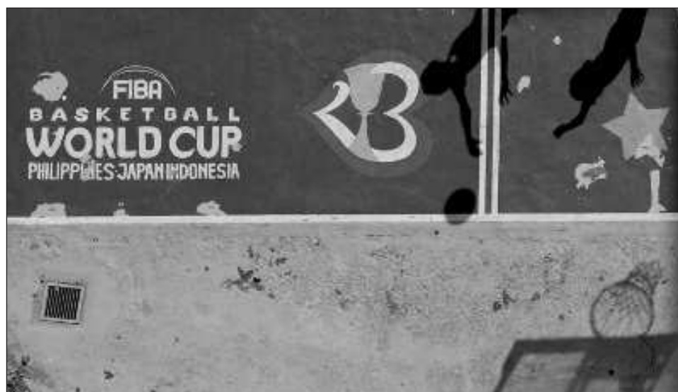
▲ Las sombras de dos jugadores se reflejan en una cancha con el logotipo del mundial de basquetbol en Taguig, Filipinas. México compite en el torneo y uno de sus objetivos es el boleto olímpico.

“Es algo muy grande, el que los jugadores vengan acá, a diferencia de China.