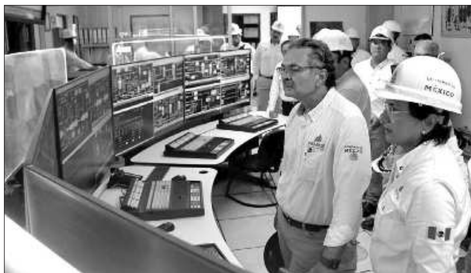
▲ López Obrador destacó que su gobierno dio un viraje en la política de exploración e inversión, pues en lugar de buscar petróleo en el norte y en aguas profundas se orientó hacia el sureste en tierra.

En contraste, el mandatario fustigó el fracaso de la reforma petrolera neoliberal, porque se entregaron 110 contratos a empresas privadas y hasta ahora solamente hay tres que están