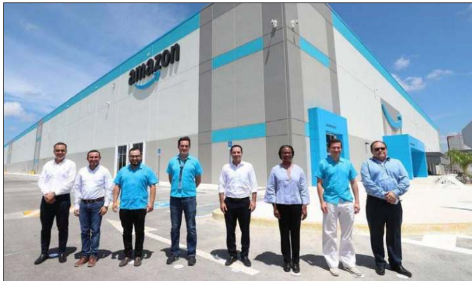
La entidad cuenta con un paquete de más de 200 proyectos de inversión, por arriba de los 100 mil millones de pesos, por parte de firmas como Amazon y Tesla.

En el mismo periodo, los países que destinaron mayor flujo de IED hacia Yucatán fueron Estados Unidos, Argentina y Francia.