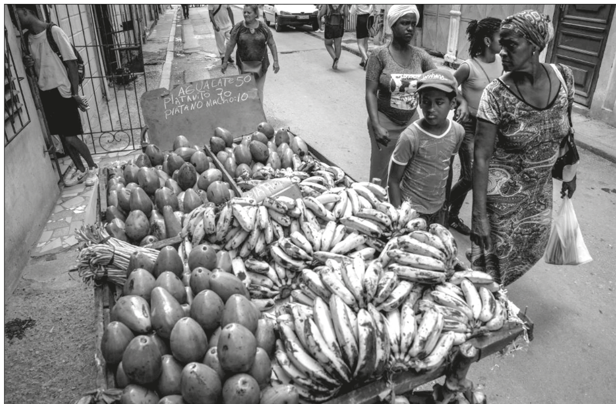
▲ El mercado cambiario estuvo cerrado por dos años en Cuba; ahora la población podrá comprar hasta 100 dólares diarios o su equivalente en otras monedas internacionales como euros, pesos mexicanos o libras esterlinas.

Al encarecerse las divisas en el mercado negro, los precios de los alimentos que se adquieren en las tiendas y los insumos traídos del extranjero se incrementaron.