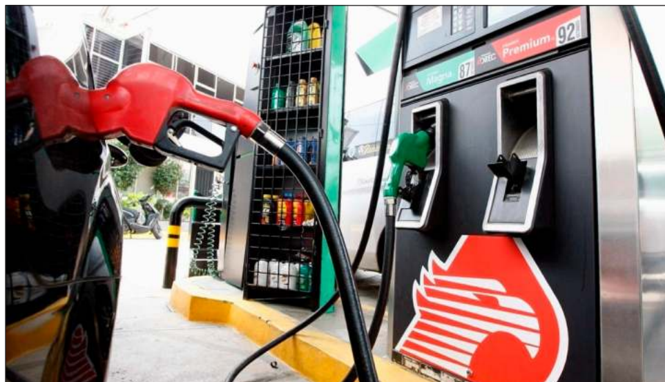
▲ De acuerdo con las más recientes proyecciones de la Comisión Económica para América Latina y el Caribe, la economía mexicana crecerá 1.9 por ciento este año.

De acuerdo con las más recientes proyecciones de la Cepal, la economía mexicana crecerá 1.9 por ciento este año. La cifra implica una revisión