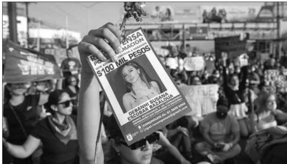
▲ El hallazgo reaviva la polémica sobre la muerte de Debanhi Escobar, que ha causado revuelo internacional por los presuntos fallos de la Fiscalía de Nuevo León.

El hombre que localizó los restos humanos en el terreno baldío prefirió no identificarse y dio a las