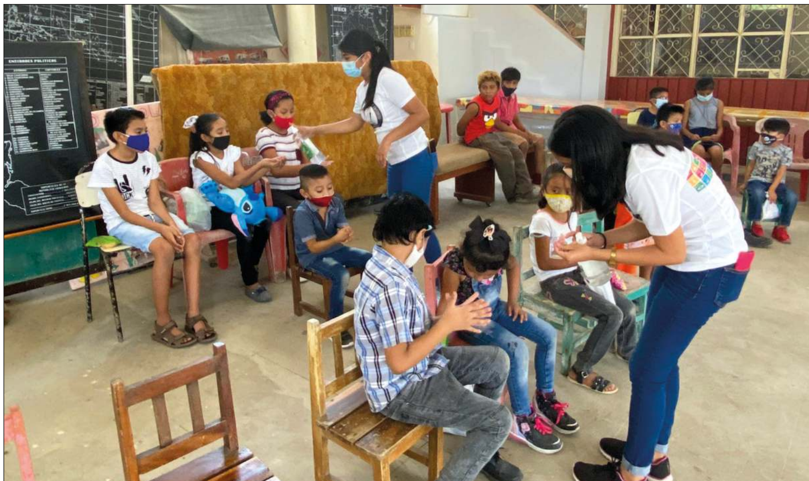
La Asociación Mexicana de Estudiantes de Enfermería ofrece educación continua al gremio y realiza labores de promoción de la salud.

La especialista concluye: La enfermería es muchas veces poner al paciente antes que a ti misma, dejar todos tus problemas para dar todo lo mejor de ti en el cuidado del paciente para que mejore su salud, se recupere o tenga una muerte solitaria, digna y acompañada.