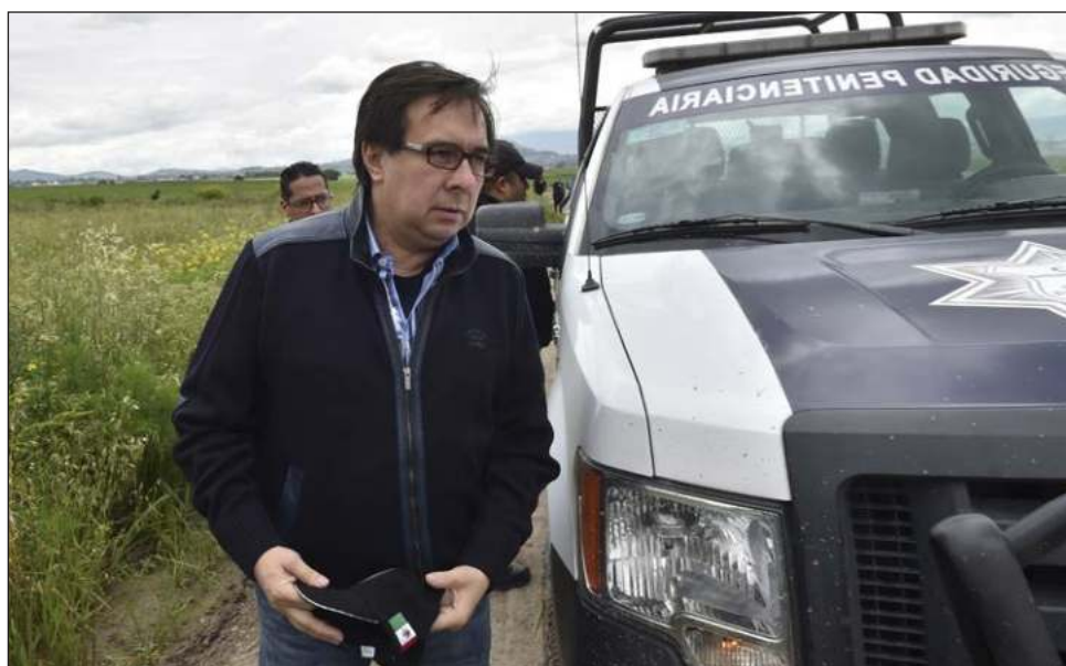
▲ Sobre Zerón pesa una orden de captura por tortura y delitos contra la administración de la justicia relacionados con la investigación de la desaparición de 43 normalistas.

El ex director de la AIC, quien está en Israel, es investigado por el caso Ayotzinapa