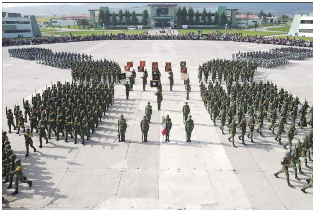
▲ Las órdenes de aprehensión contra los 20 miembros del Ejército dan cuenta de un avance significativo en los esfuerzos por el esclarecimiento y contra la impunidad.

Las órdenes de aprehensión contra los 20 miembros del Ejército dan cuenta de un avance significativo en los esfuerzos por el esclarecimiento y contra la impunidad, al tiempo que representan una prueba de fuego para determinar los alcances de la colaboración de las fuerzas armadas con la justicia. Es de esperarse que la respuesta consista en entregar a los señalados, sin distingo de rango, para que sean juzgados conforme a derecho, sin prejuzgar sobre su inocencia o culpabilidad y con la vista puesta en todo momento en coadyuvar a la resolución definitiva de lo que ya es reconocido como un crimen de Estado.