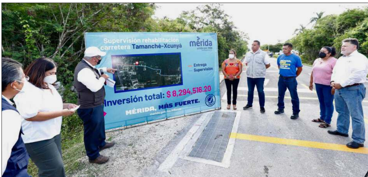
▲ El alcalde Renán Barrera supervisó en Tamanché los trabajos de mejoramiento de vialidades.