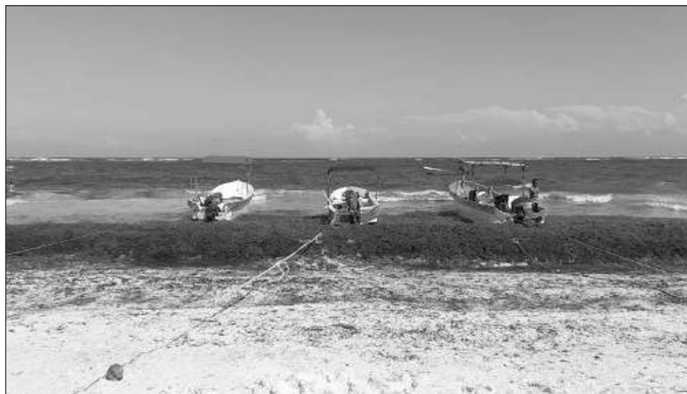
▲ Tulum seguirá siendo uno de los destinos de Quintana Roo más afectados por la talofita: los turistas optan por otras locaciones al ver las playas cubiertas de sargazo.

El hidrobiólogo dio a conocer que a todas luces el recalde del helecho marino ha sido muy intenso en cuanto a cantidad y además podría seguir llegando después de su temporada habitual.