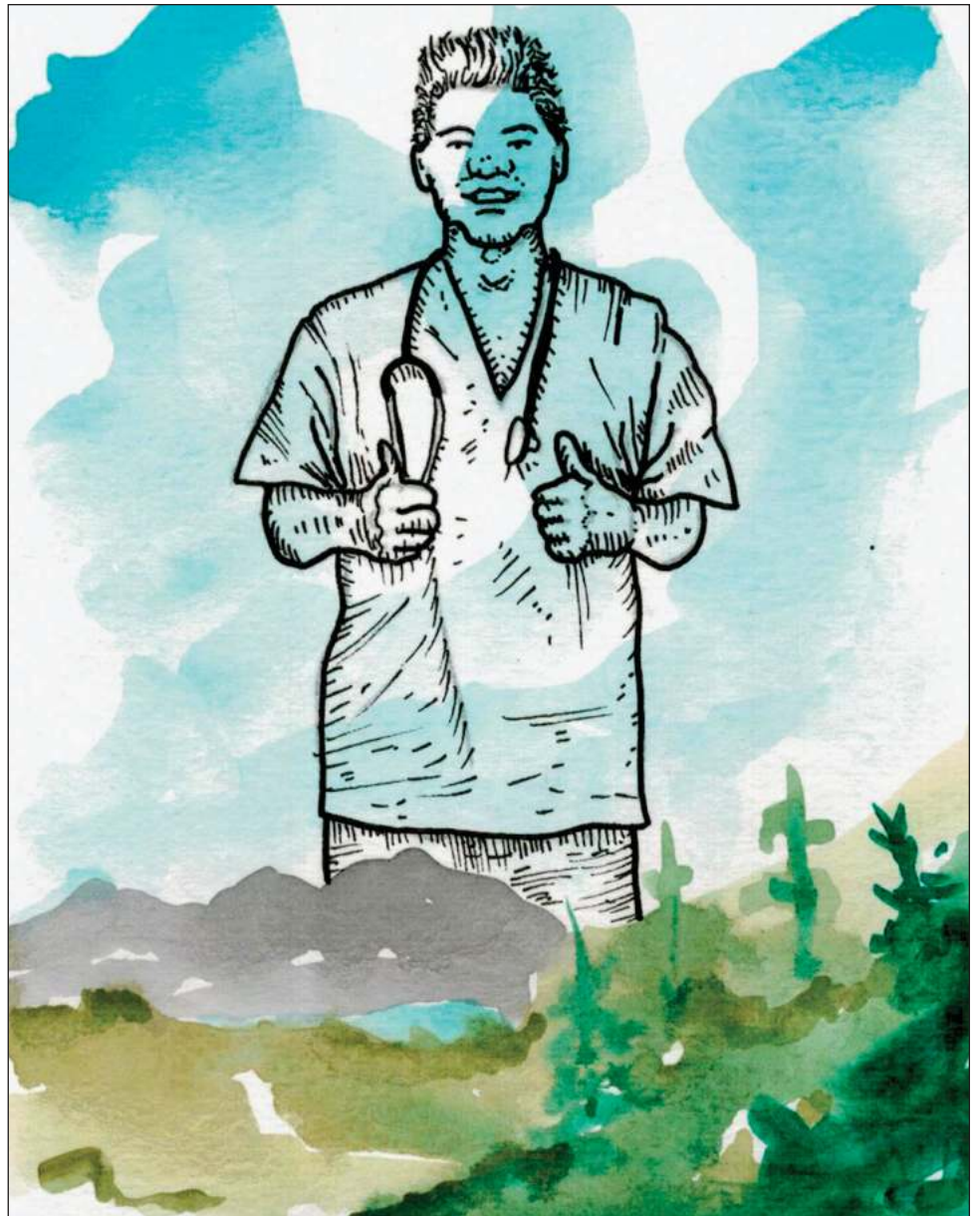
Los jóvenes de la llamada generación Cristal no se quieren casar, no quieren comprar una casa o un coche; no quieren nada que los ate. Ilustración Sergiopv @serpervil

“No se quieren casar, no quieren comprar una casa solamente donde vivir, no quieren comprar un coche,