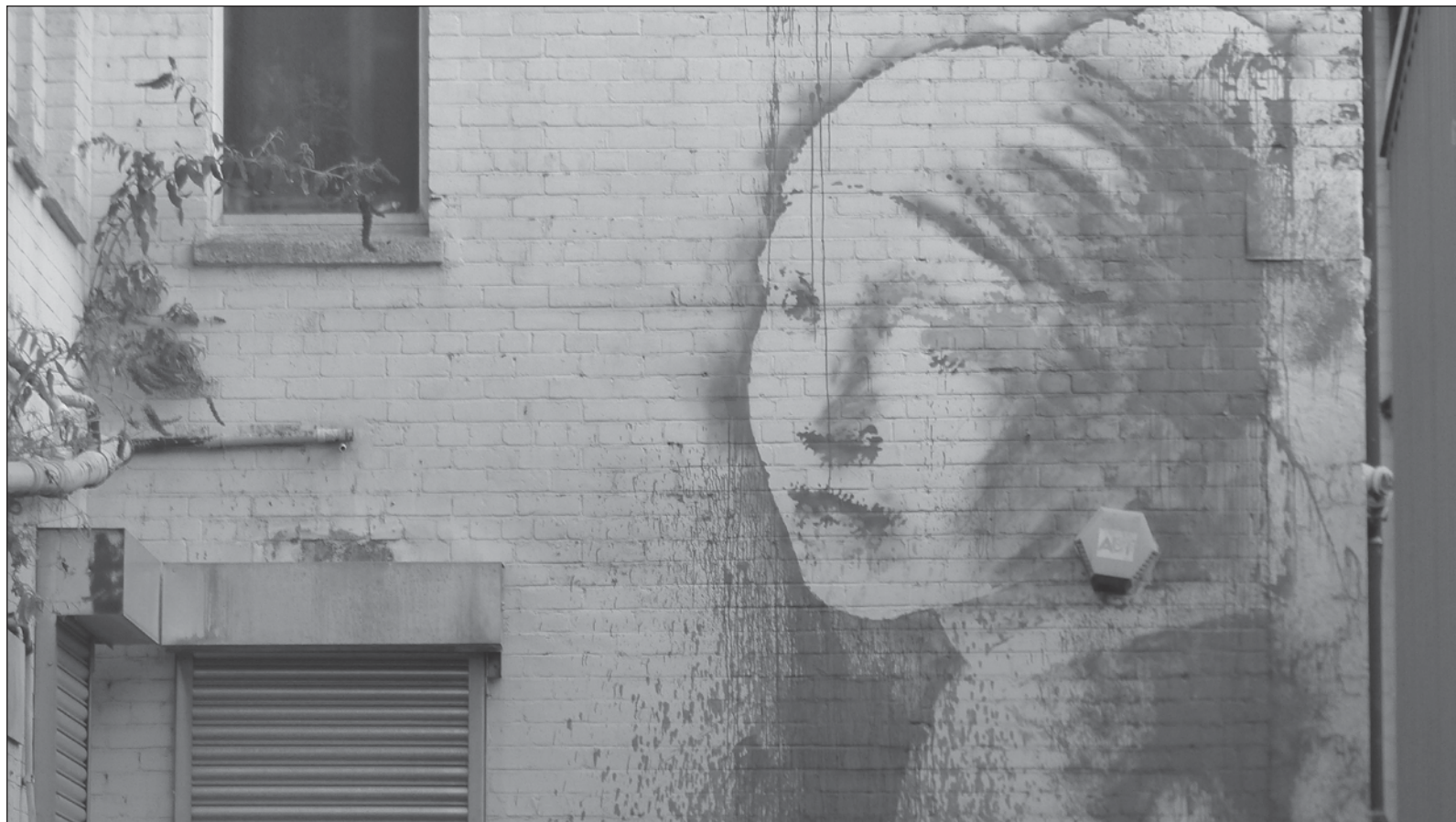
▲ "Además de la reinterpretación de La joven de la perla , Banksy muestra que el arte es humor con un amante colgado de una ventana, mientras el esposo engañado otea el horizonte, sospechando incluso de su sombra. Todo el mundo, menos él, se entera del adulterio.