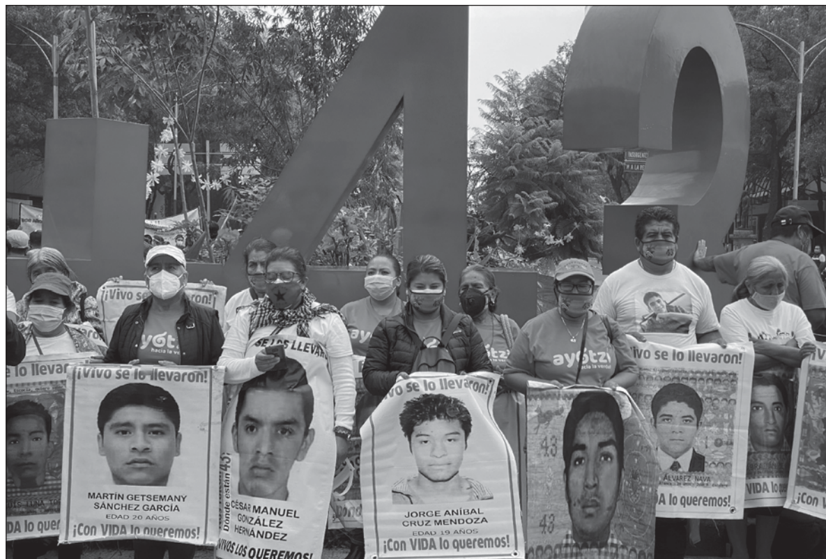
▲ “Si algo hizo posible que se derrumbara la ‘verdad histórica’ y pareciera abrirse una ventana para que asome la justicia, es la inauditable lucha de los padres de familia de los 43 estudiantes”.

Es falso que el informe no tenga nueva información y que todo lo que señala se supiera