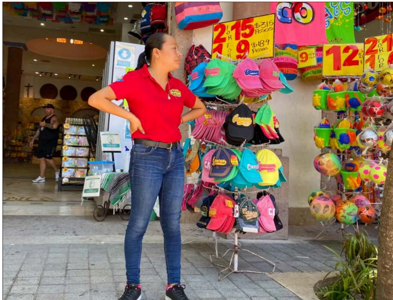
En la península, el sector terciario es el que más absorbe la fuerza laboral del sector juvenil.

En cuanto a las actividades secundarias, 12.8 por ciento se dedica a manufacturas y elaboración de textiles. Yucatán desempeña una mayor participación en este ramo, pues la mayoría de la materia prima