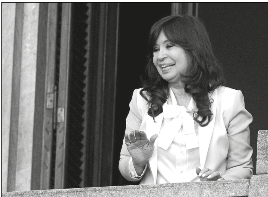
▲ Luego de un discurso de más de dos horas transmitido en sus redes sociales, Fernández de Kirchner salió al balcón del Congreso para saludar a los manifestantes que la esperaban.

Por otra parte, el destino de los prisioneros de guerra ucranianos también despertaba preocupación. La Alta Comisionada de la ONU para los Derechos Humanos, Michelle Bachelet, se mostró “preocupada por los reportes de que la Federación Rusia y los grupos armados afiliados en Donetsk están planeando — posiblemente en los próximos días — juzgar a los prisioneros de guerra ucranianos”. Bachelet agregó que se habla de un “tribunal internacional”, pero indicó que no se garantizaría el debido proceso ni un juicio justo.