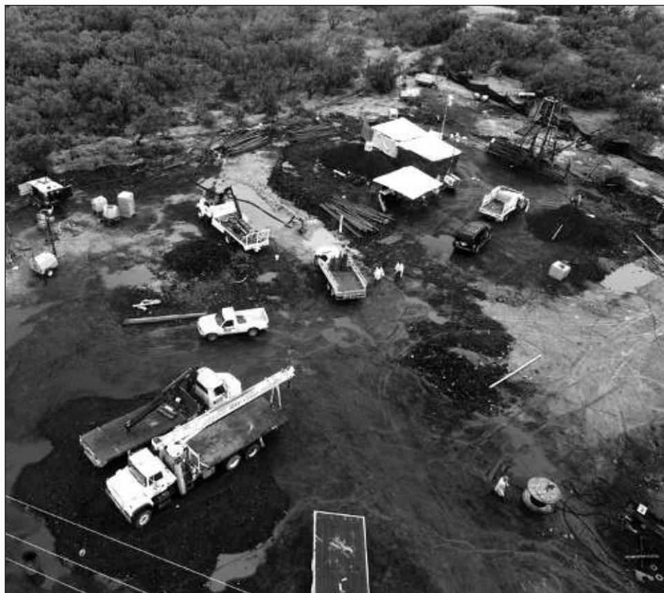
▲ La labor en la mina se ha complicado por la filtración de agua que provocó un nivel superior a los 20 metros en cada uno de los tres pozos por donde podrían acceder los rescatistas.

Hasta ahora se ha evacuado más de 759 mil metros cúbicos de agua, y tan solo este lunes se lograron extraer más de 53 mil metros cúbicos.