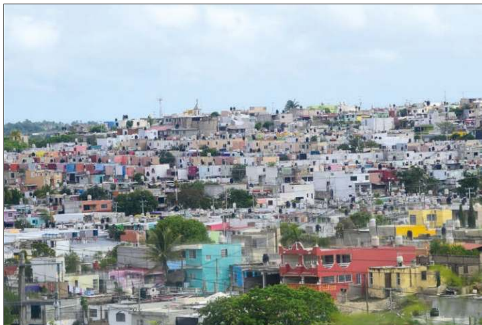
▲ La constructora Soltrex entregó más de 500 casas hace cinco años, en el Fraccionamiento Residencial San Francisco, el cual hasta ahora no está municipalizado.

Frente a representantes de cada edificio en el fraccionamiento, así como vecinos, Encalada Ortega habló aparentemente vía telefónica, pues esperaban al representante de Merino Sosa para