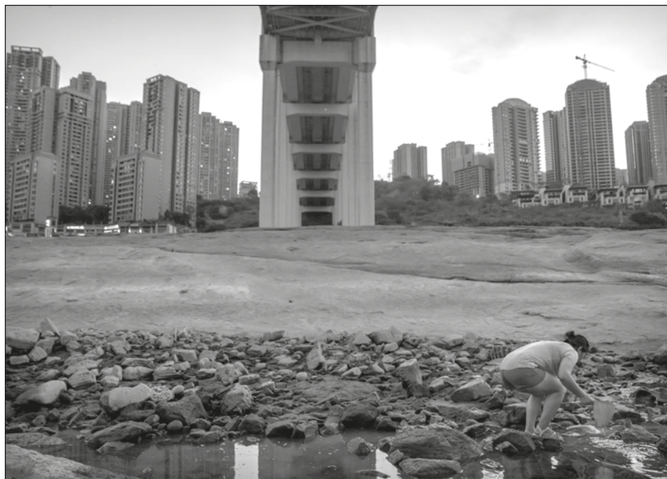
▲ La zona de San Luis y 88 por ciento de Kentucky pasaban por un período inusualmente seco cuando hubo un temporal con inundaciones que devastaron comunidades enteras.

El río Yangtsé de China se está secando, un año después de desbordarse. China soporta más de dos meses de una intensa sequía, con temperaturas que no bajan de los 35 grados Celsius (94.8 Fahrenheit) de noche en la ciudad de Chongqing. En el oeste del país, sin embargo, un repen-