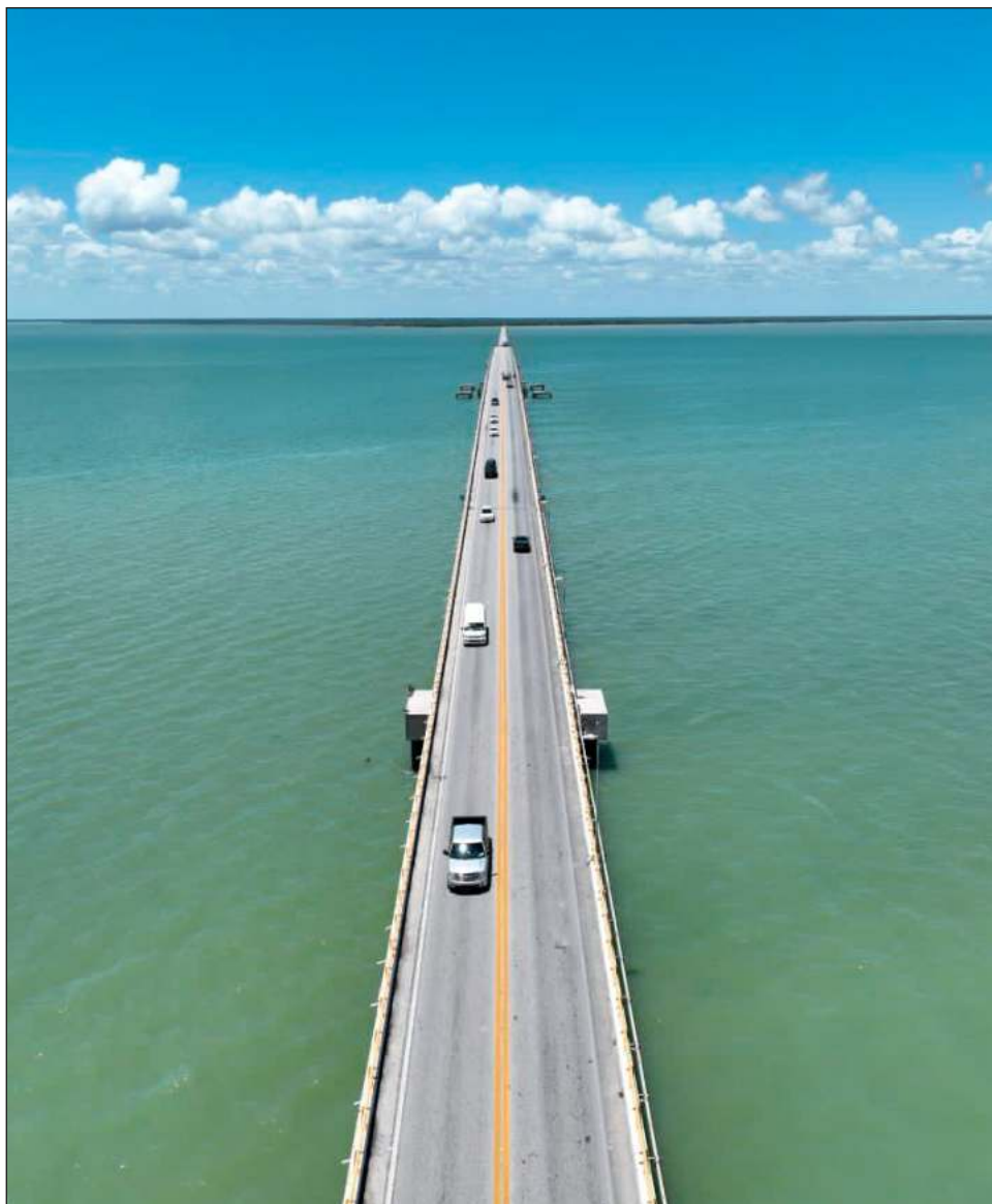
▲ El cambio de sitio de la caseta de peaje impulsaría la economía local.

“Para los productores sería muy positivo, ya que sin costo adicional estaríamos trayendo a Carmen nuestros productos”.