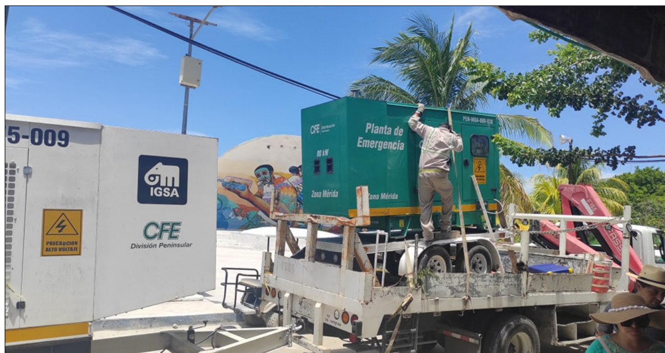
▲ El lunes llegaron a la isla 10 plantas de luz desde la ciudad de Chetumal.

“Los generadores dejaron de funcionar”, “hace mucho calor y todos quieren tener aire acondicionado”, se lee en diferentes comentarios de residentes de la isla en redes sociales, quienes destacan que la construcción de nuevos hoteles en la ínsula ha incrementado el consumo, más en esta temporada alta, donde miles de personas llegan a vacacionar y llenan esos centros de hospedaje. Incluso algunos hoteles han cancelado reservaciones al no poder operar; también hay restaurantes cerrados por el mismo motivo. La carencia de luz propicia la del