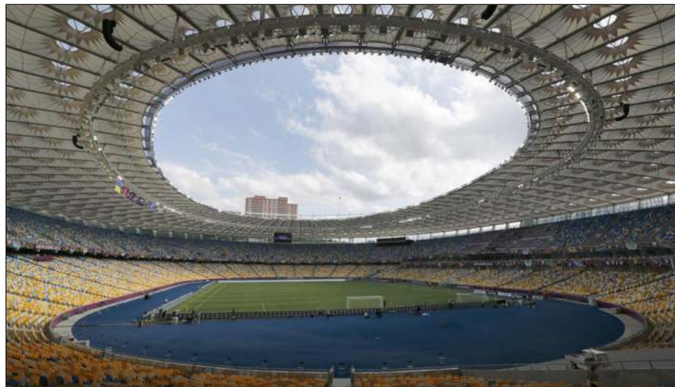
▲ El fútbol regresó a Ucrania con un partido en el Estadio Olímpico de Kiev.

Ucrania sigue bajo ley marcial. Se prohibieron las congregaciones masivas de público previo al feriado por el Día de la Independencia el miércoles debido al temor de un posible bombardeo ruso.