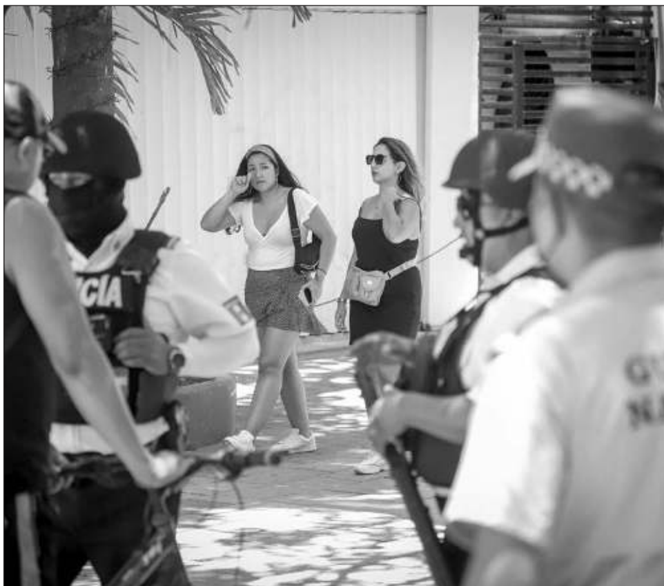
▲ El organismo empresarial solicitó a las autoridades no permitir que acciones violentas sigan ocurriendo en un lugar que es visitado anualmente por millones de turistas.

Cabe destacar que de acuerdo al gobierno de Solidaridad, se han realizado diversas detenciones de narcomenudistas en la Quintana avenida, la más reciente al interior de un bar frecuentado en su mayoría por turistas. Asimismo, la Fiscalía General del Estado trabaja en conjunto con los restaurantes afiliados a la Canirac para evitar la venta de drogas en sus establecimientos.