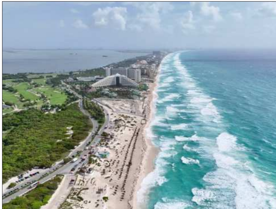
▲ Playacar, Akumal, Cancún y Playa del Carmen fueron los destinos quintanarroenses de playa con mayor ocupación hotelera en el primer cuatrimestre de 2024.

El titular de la dependencia, Miguel Torruco Marqués, indicó que la llegada de turistas a cuartos de hotel durante enero-abril de 2024 fue de 27.1 millones, de los cuales 19.2 millones fueron nacionales (70.7 por ciento), mientras que 7.9 millones fueron extranjeros (29.3 por ciento del total), en los 70 centros monitoreados por DataTur.