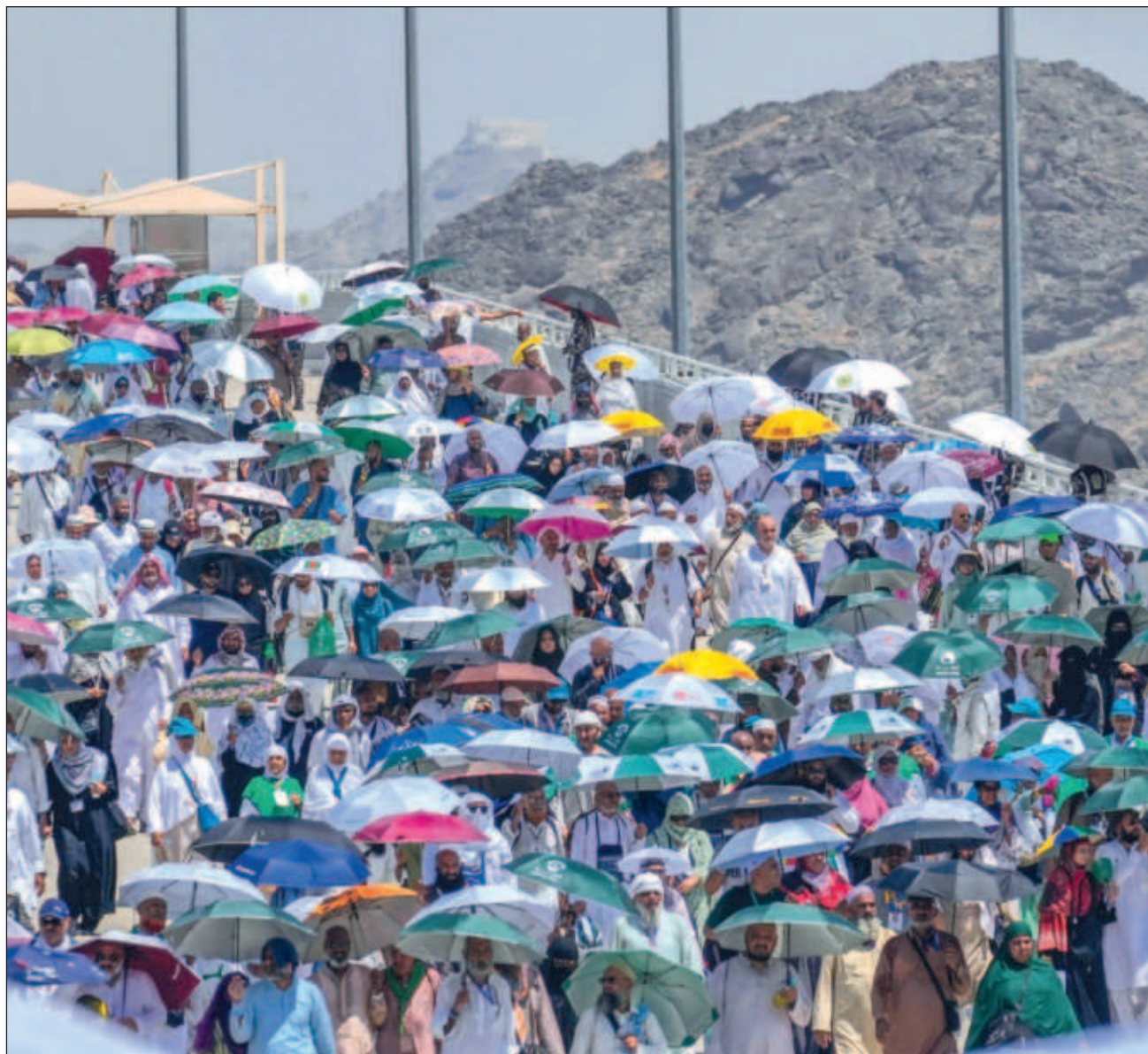
▲ Los fieles sufrieron temperaturas extremas en los lugares sagrados del islam en el reino desértico.

Sin embargo, un funcionario del gobierno informó de al menos 630 fallecidos más que viajaron a Arabia Saudí con visas de visita, la mayoría registrados en el Complejo de Emergencias en el vecindario de Al-Muaisem de La Meca. Un diplomático egipcio dijo que la mayoría de los muertos habían sido sepultados en Arabia Saudí.