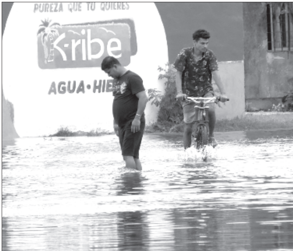
▲ Ante los estragos que han generado las lluvias de los últimos días, el gobierno del estado gestionó ante la Comisión Nacional del Agua (Conagua) el traslado e instalación de equipos de bombeo para desalojar el agua que inunda

calles y predios en diversas áreas de la unidad habitacional Siglo XXI. La ayuda también consistió en la distribución de despensas entre decenas de familias afectadas en la referida demarcación.