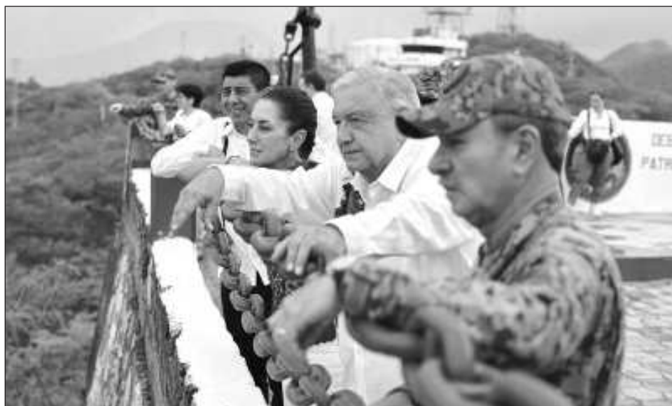
▲ La virtual presidenta electa y AMLO estuvieron presentes en la inauguración de las instalaciones de la Guardia Nacional en el municipio de Santa Cruz Xoxocatlán.

“Ya se pueden imaginar el gusto que me dio escuchar hace un momento que la presidenta de México, la presidenta electa de México, pronto presidenta constitucional y comandante suprema de las fuerzas armadas ha dado a conocer que la Guardia Nacional va como debe de ser a formar