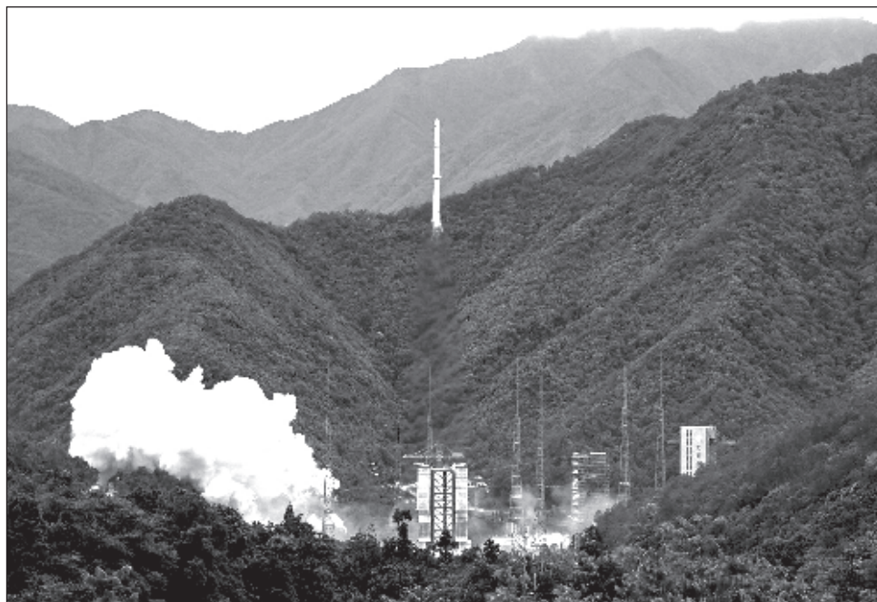
▲ Esta misión desarrollada por ingenieros de ambos países, conocida como Svom (Space Variable Objects Monitor), busca los llamados brotes de rayos gamma, fósiles luminosos que podrían contener información sobre la historia del universo.

Estos destellos, fruto de las explosiones más potentes del universo, desprenden una luminosidad colo-