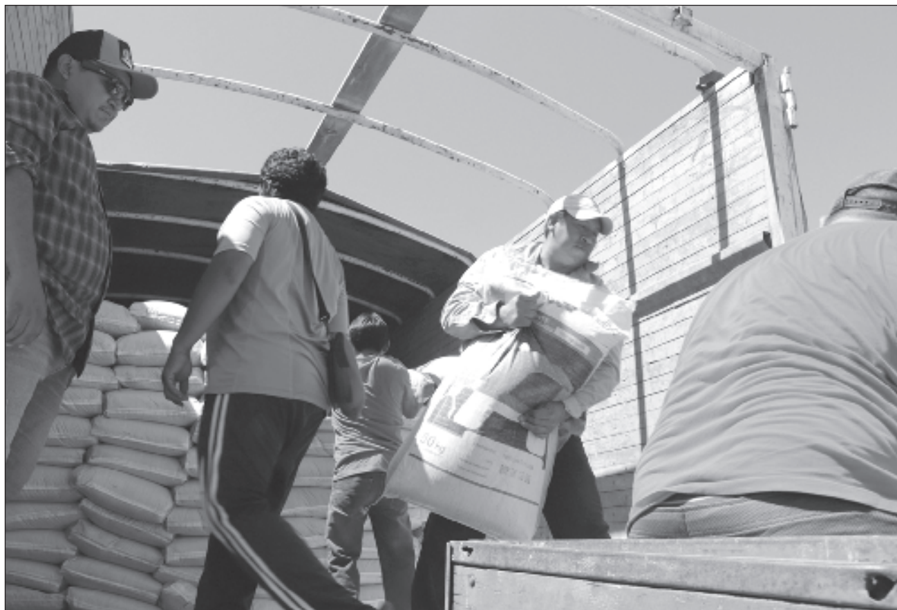
▲ Tras el paso de Alberto por Campeche, las comunidades de Bethania y Chemblas perdieron sus cultivos de rábano, cilantro, pepino, entre otros, por lo que la Secretaría de Desarrollo Agropecuario está apoyando a reparar los daños en la zona.

Destacó que en todo el estado es el único reporte de daños a cultivos debido a que aún no era la temporada de maíz, e incluso, afirmó que los maiceros esperaban estas lluvias para darle una revuelta más a la tierra y se preparen para que en una semana y días, ya comience el ciclo de siembra, hecho que aún no pueden considerarlo en riesgo pues ni es tiempo de siembra y tienen