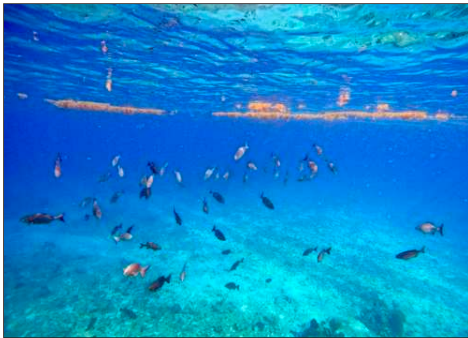
▲ El Danionella cerebrum es un pez que mide unos 12 milímetros, casi completamente transparente durante toda su vida, nativo de los arroyos del sur de Myanmar, tiene el cerebro vertebrado más pequeño conocido, sin embargo, muestra una serie de comportamientos complejos.

El profesor Benjamin Judkewitz, neurobiólogo de Charité-Universitätsmedizin Berlin, y su equipo utilizan a los diminutos peces como una ventana a cuestiones fundamentales, como la comunicación entre las células nerviosas.