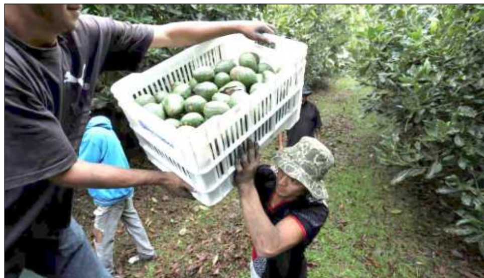
▲ Son de Michoacán un dólar de cada tres que ingresan al país por exportaciones agrícolas, convirtiéndolo en el líder en producción de agroexportación.

Ramírez Bedolla añadió que también será abordado