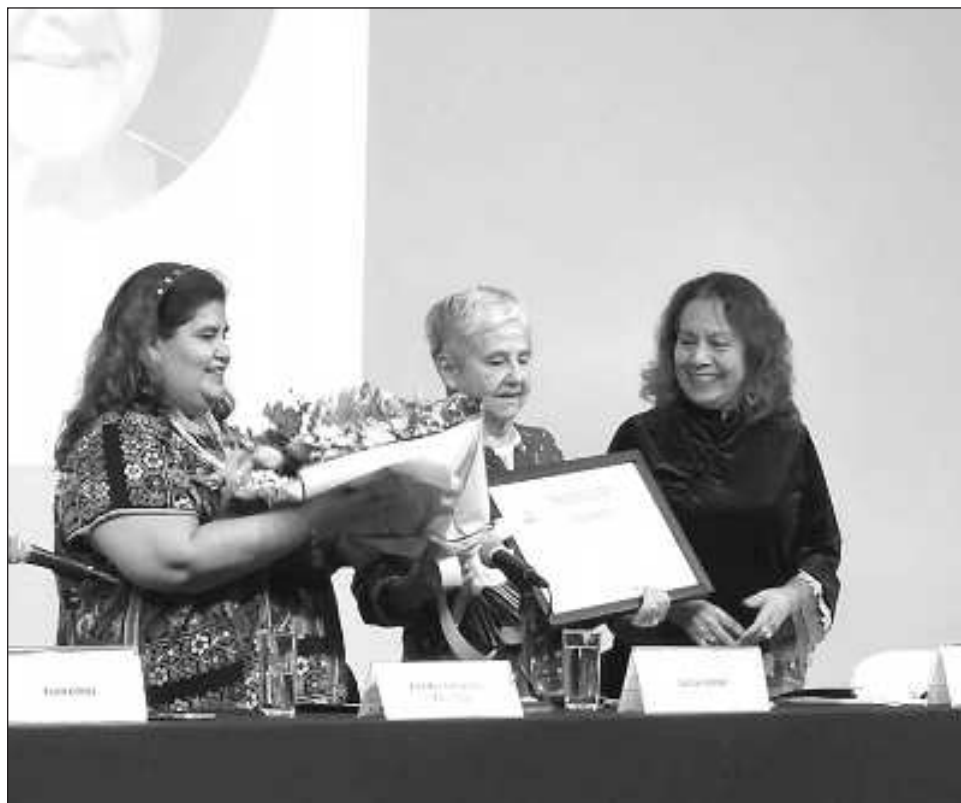
▲ La dramaturga es una mujer de teatro y de letras y cuenta con más de 20 premios y distinciones a escala nacional e internacional por su incansable trabajo.

Los pequeños "necesitan verse conmovidos por los hechos que transcurren en escena. Desde la seguridad de la butaca pueden presenciar acontecimientos temibles o dolorosos, sabiéndose a salvo.