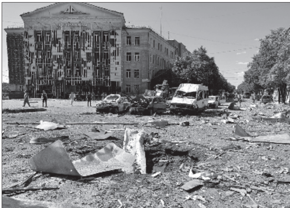
▲ La caída de fragmentos de cohetes provocó un incendio forestal de más de 150 metros cuadrados y prendió fuego a un edificio residencial, según RIA Novosti.

En Járkiv, un ataque dejó el domingo al menos un muerto y 11 heridos, según los funcionarios locales. El alcalde Ihor Terekhov dijo que la ciudad había sido atacada con una bomba teledirigida y que alrededor de la mitad de la ciudad se había quedado sin electricidad.