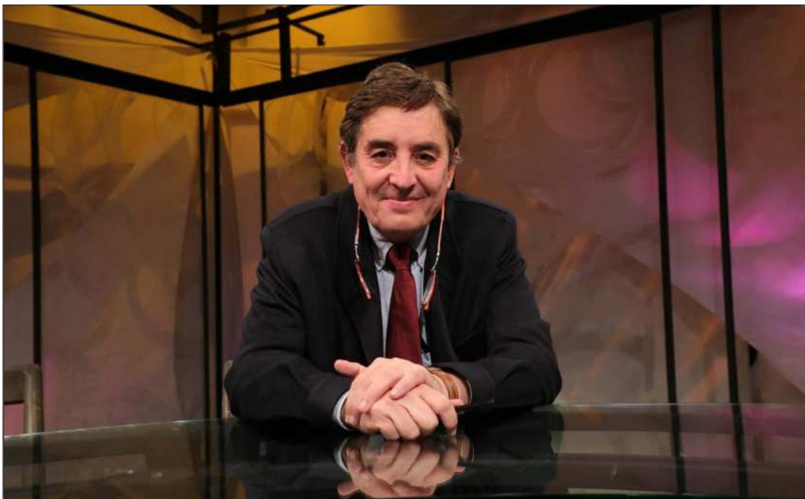
▲ "Para mí es una alegría recordar a García Montero con una guayabera blanca en la Ciudad de México y pensar en que fue el amoroso compañero de Almudena Grandes".