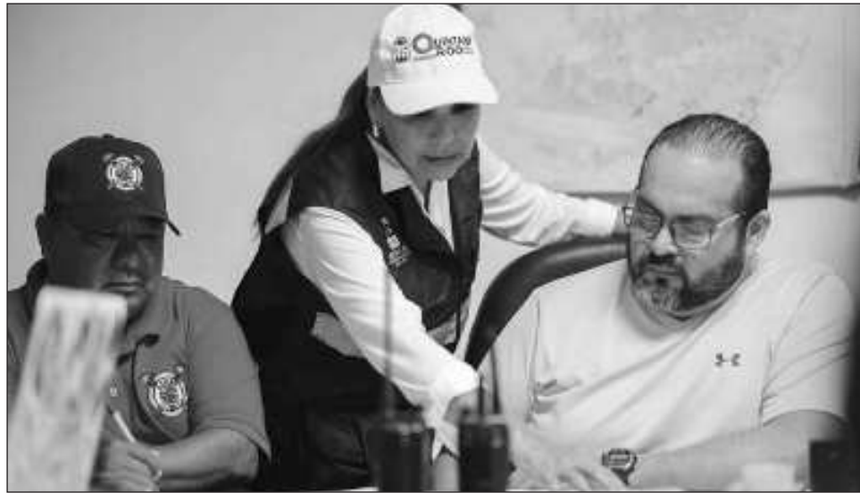
▲ La gobernadora de Quintana Roo reiteró la coordinación estrecha con las autoridades federales, estatales, municipales y la participación ciudadana, en trabajo las 24 horas del día, en auxilio de la población civil.

Por otro lado, la gobernadora Mara Lezama informó que este lunes se reanudan las clases en las escuelas públicas y particulares de todos los