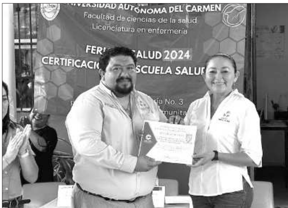
▲ El certificado fue entregado por la Secretaría de Salud, luego de que el plantel educativo cumpliera satisfactoriamente los lineamientos establecidos por el componente de escuela y bienestar.

Cabe señalar que, entre los criterios de evaluación para obtener esta certificación, destacan la cobertura de vacunación en los niños, eliminación de criaderos de mosquitos, alimentación sana, valoraciones de salud visual, auditiva, peso y talla, limpieza del entorno, entre otros lineamientos.