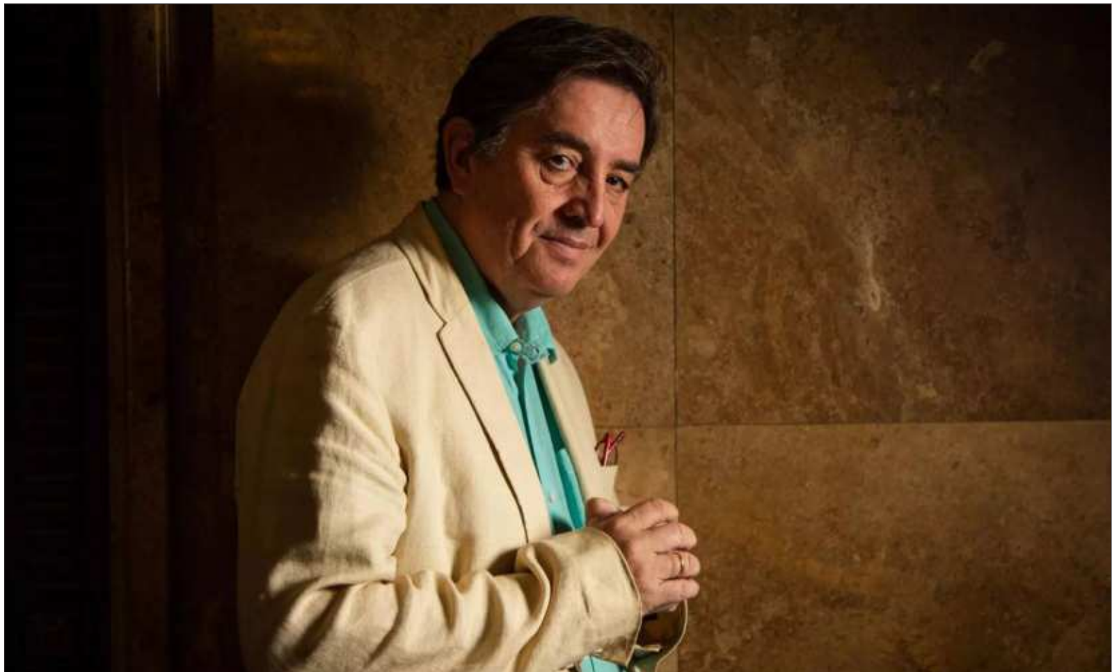
▲ "Así como Federico García Lorca, García Montero proviene de Granada y, así como él, transitó con su primer libro de poemas por los caminos de España".