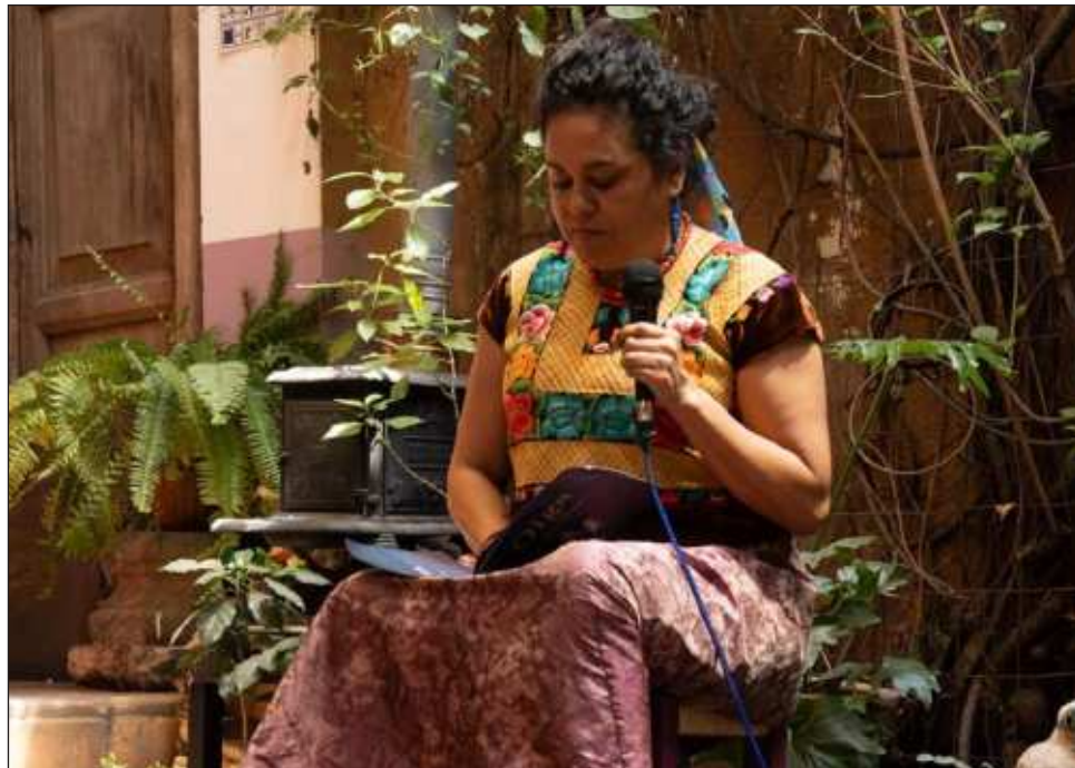
▲ La poeta rememora que en la comunidad zapoteca del Istmo, “nosotros hablamos con mucha libertad; de hecho, en el lenguaje tenemos mucho la presencia de la mierda porque le damos de comer mierda a cualquiera y nadie se ofende”.

“No tenemos la cultura de hablar de eso. Es como el sexo, todo mundo hace caca y coge, pero tenemos cuidado y precaución al comentarlo, más si hay pe-