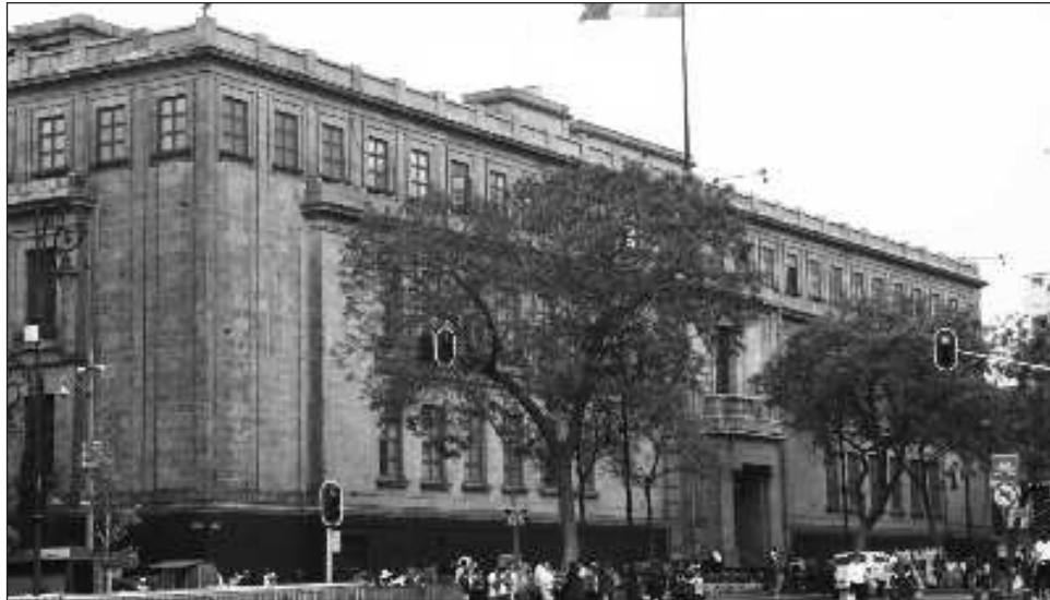
▲ Encima de la media, ministros de la SCJN cuentan con remuneraciones anuales que alcanzan 3 millones 793 mil 644 pesos libres de impuestos, y aún más altas son las de los miembros del CJF.

Muy por encima de la media, los ministros de la SCJN cuentan con remuneraciones anuales que alcan-