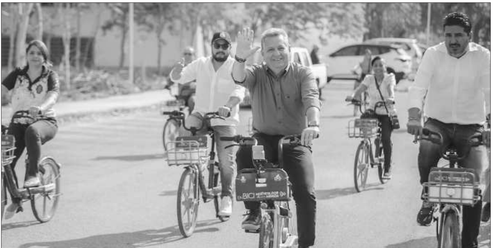
▲ El paso a seguir es consolidar polígonos que coincidan con los entornos escolares donde la mayoría de estudiantes puedan moverse con seguridad.

Finalmente, Ignacio Gutiérrez Solís, comentó que el paso a seguir por el Ayuntamiento es consolidar polígonos que coincidan con los entornos escolares donde la mayoría de las y los estudiantes puedan moverse con seguridad, pero al mismo tiempo motivar a que más ciudadanas y ciudadanos hagan uso de este vehículo durante sus traslados.