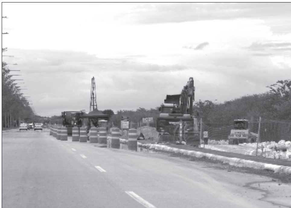
▲ Los hechos de romper los sellos de clausura de obra, bajo el consentimiento de la Sedena, conllevan a una multa por encima de los 18 millones de pesos.

En este caso, la denuncia ingresada el pasado viernes en la FGR, apenas será aceptada, por lo que no tiene folio. Sin embargo, la Smapac también está cuantificando los daños en este rubro para posteriormente dar los por menores a la agencia.