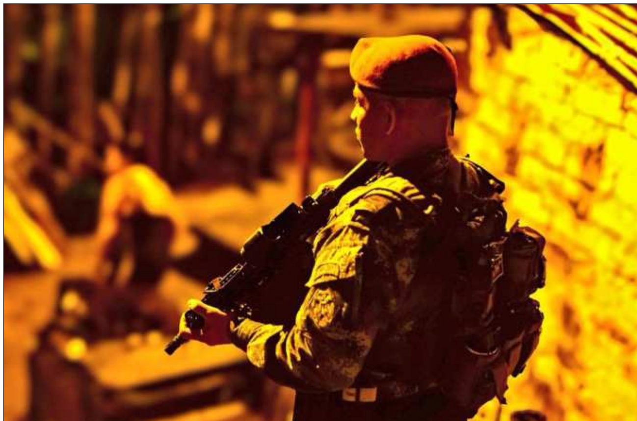
▲ El atentado con coche bomba en Nariño se registró en el municipio de Taminango, donde tiene “incidencia criminal” el frente Franco Benavides del Estado Mayor Central, grupo de la disidencia de las FARC.

Los ataques se producen a pocas horas de que delegados del gobierno co-