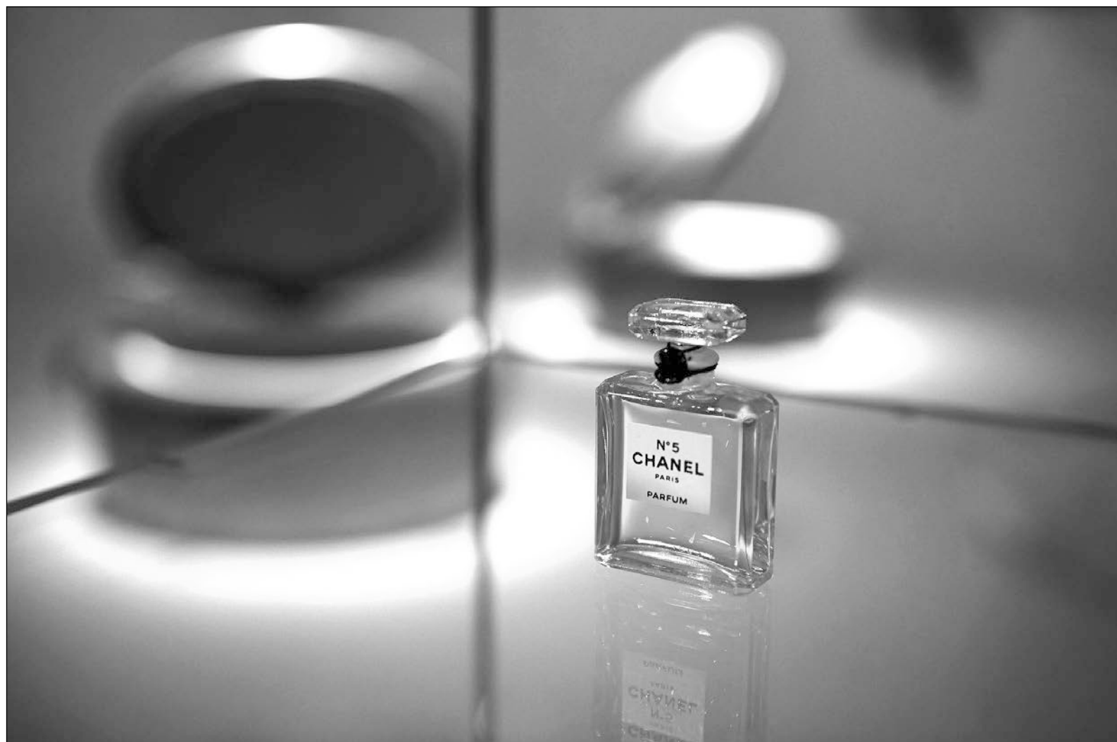
▲ Chanel N° 5 es el único perfume que ha trascendido el centenario con ligeras variaciones en la estética de su envase.