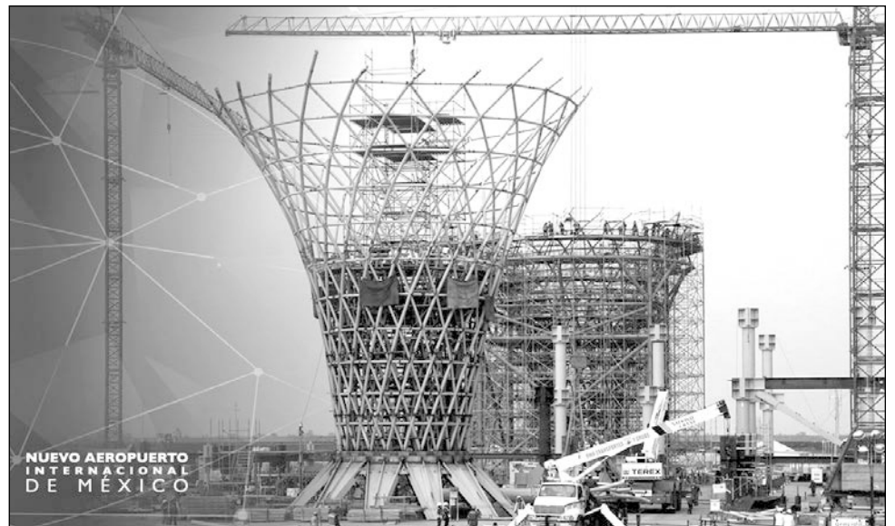
▲ Originalmente, el gobierno federal previó un costo de 100 mil millones de pesos por la cancelación del NAIM en Texcoco.

Agregó que preliminarmente que se ha detectado en la auditoría revisada que el costo estimado de la cancelación de la terminal aérea de Texcoco “considera los flujos pasados y futuros para llevar a cabo la cancelación