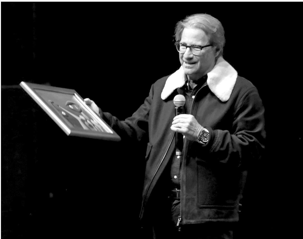
▲ La Universidad de Columbia, en Nueva York, borró al mexicano de su lista de académicos visitantes del Instituto de Estudios Latinoamericanos, donde aparecía hasta la semana pasada.

De la serie de tomos impresos con la máquina de Gutenberg sólo quedan tres copias perfectas en vitela, una de ellas está en la Biblioteca del Congreso de Estados Unidos, otra en la Biblioteca Nacional de Francia y el otro tomo en la Biblioteca Británica.