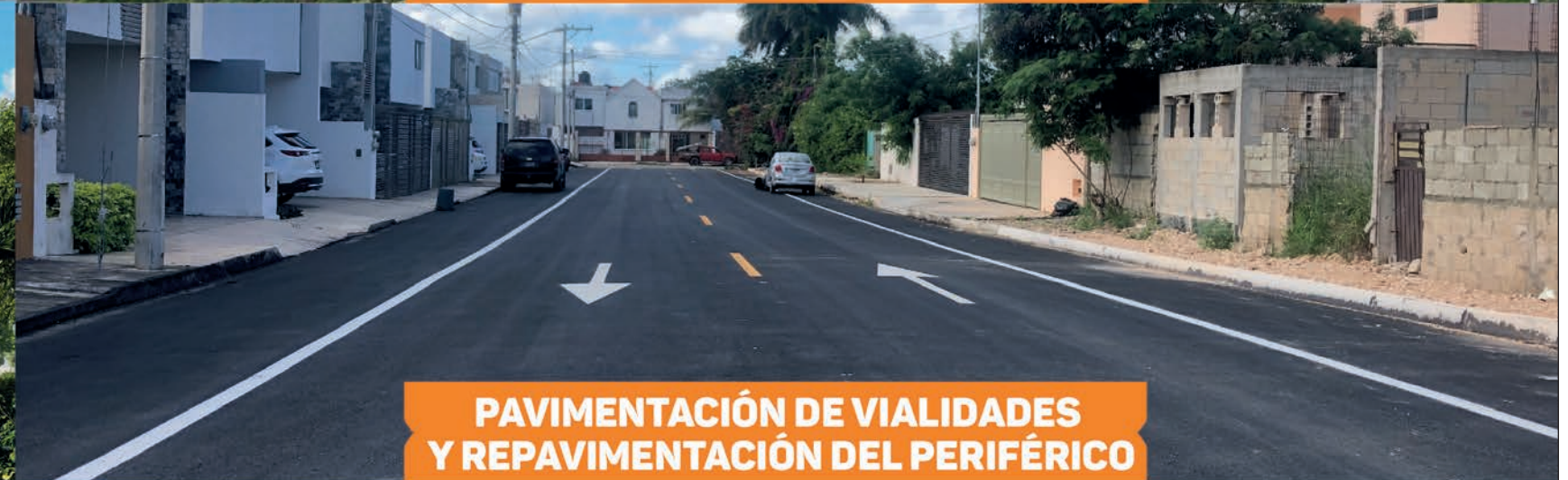
PAVIMENTACIÓN DE VIALIDADES Y REPAVIMENTACIÓN DEL PERIFÉRICO