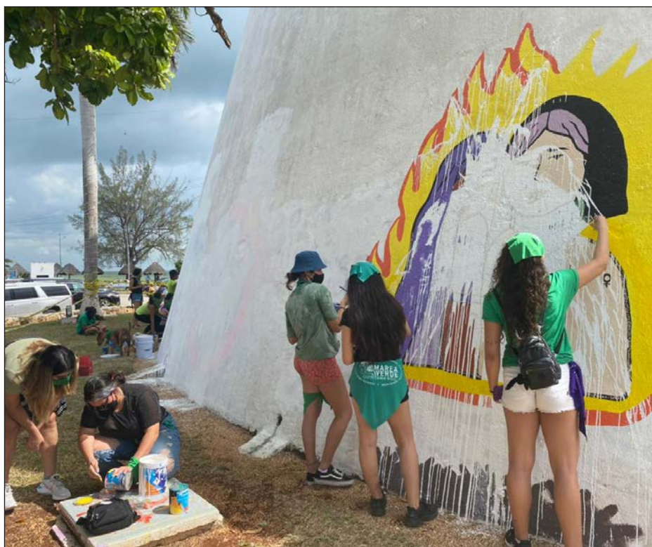
▲ Las activistas se reunieron a las afueras del Congreso para reponer los murales.

“Muchos han preguntado mi opinión y el sentido de mi voto, otros ya lo han afirmado sin preguntarme y para acabar con estas dudas quiero manifestar que después de analizar, estudiar y asesorarme respecto del tema y ser muy meticulosa en el mismo, hoy puedo afirmar que el sentido de mi voto será en contra de la reforma. Mi voto es con base a análisis jurídico, médico y social (sic)”, escribió.