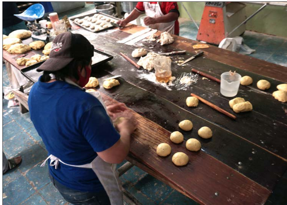
▲ El precio del pan se ha mantenido sin aumentos durante los últimos tres años.