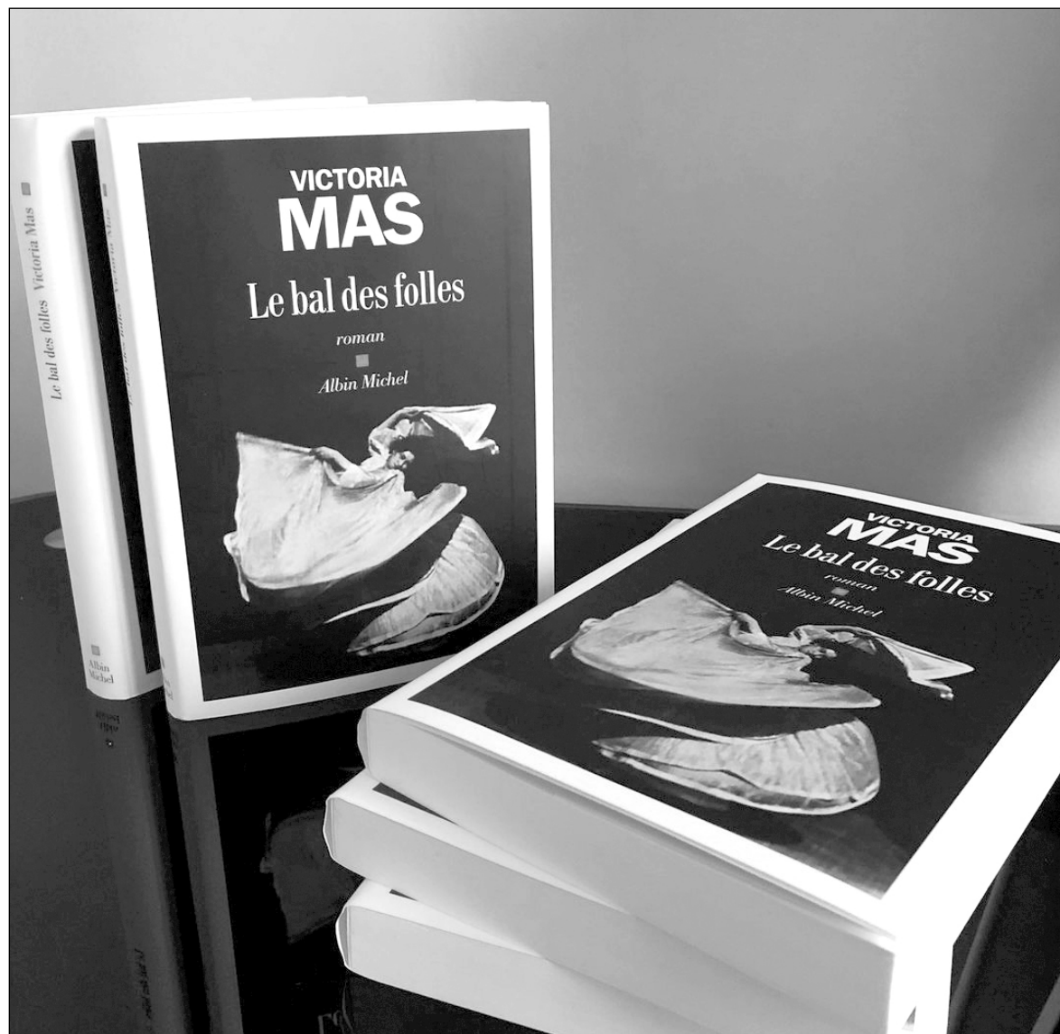
▲ El texto que arranca con toda la potencia de su tema central, va derivándose hacia algunas historias laterales.

VICTORIA MAS RELATA el escenario de aquellos espectáculos cuidadosamente prepara-