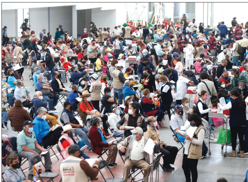
▲ El apoyo de los servidores de la nación para el registro de los adultos mayores resultó insuficiente en Ecatepec.

La mañana de este martes, aún priva el descon-