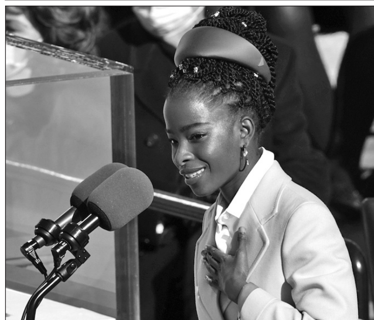
▲ Greta Thunberg, Malala Yusufzai and Amanda Gorman: each started out as individuals who concluded that they could make their mark and rose to the occasion.