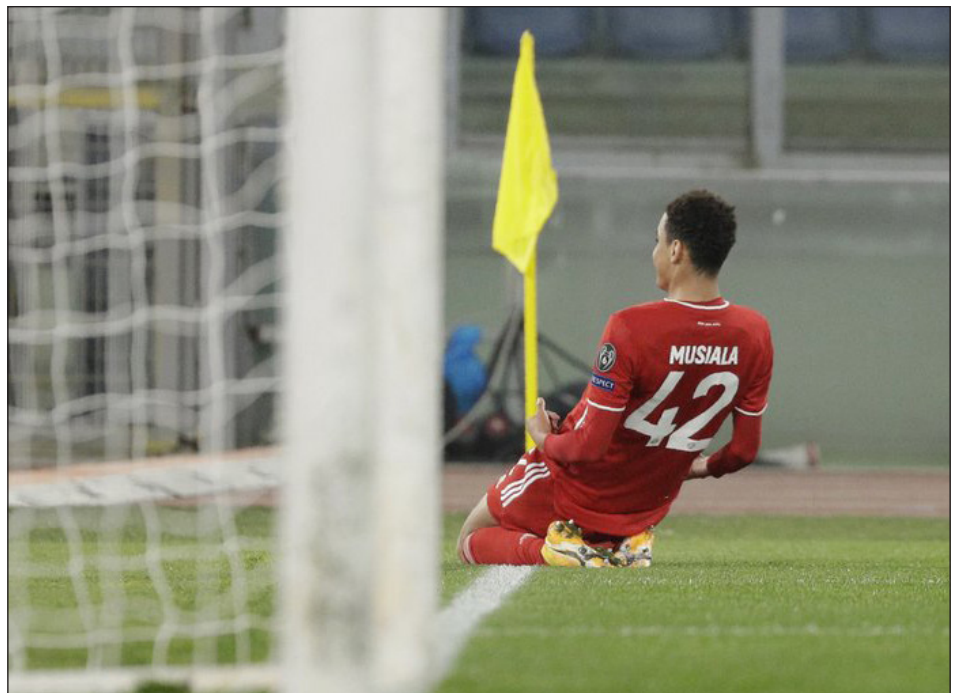
▲ Jamal Musiala, del Bayern Múnich, festeja luego de anotar el segundo tanto de su equipo ante la Lazio.

Francesco Acerbi marcó en su propia puerta en el comienzo del complemento, para poner el marcador en 4-0, durante una noche en la cual todo le salió mal a la