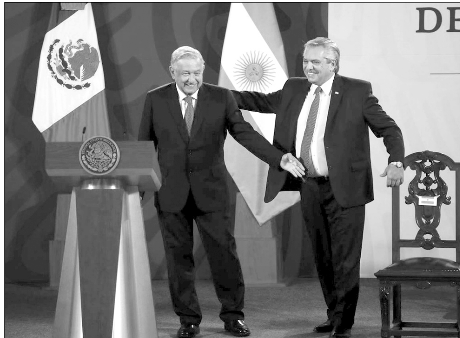
▲ El presidente argentino anunció su intención de acompañar la gestión de México en favor de la universalidad de la vacuna.

De igual manera -añadió- yo quiero acompañar la gestión de México en favor de la universalidad de la vacuna y quiero acompañar