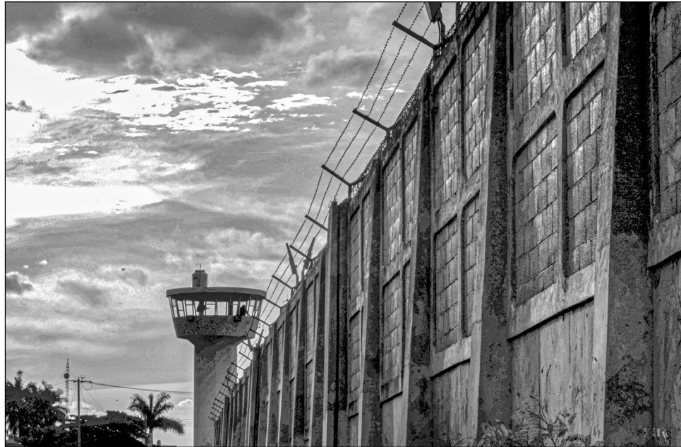
▲ La prohibición de visitas de familiares, según la secretaria General de Gobierno, ha contribuido para evitar la proliferación de contagios en los centros penitenciarios del estado.

Fritz Sierra explicó que dentro de las medidas sanitarias que han adoptado en los penales para prevenir los contagios, es que hay