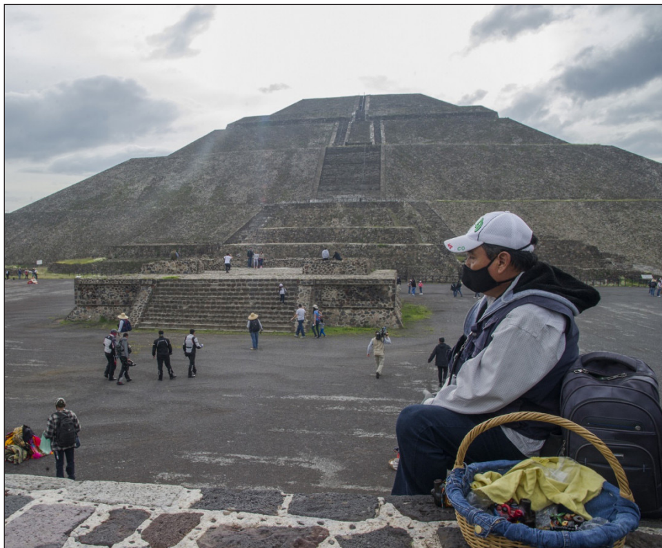
▲ El visitante deberá portar cubrebocas al llegar al sitio y durante todo su recorrido, para protección del personal.

En el interior del sitio sólo se podrán visitar la Calzada de los Muertos, plazas y explanadas. El ascenso a las pirámides del Sol y de la Luna, y al Templo de la Serpiente Emplumada, permanecerán cerrados, así como los complejos de Quetzalpapálotl, Río San Juan, los museos y palacios.