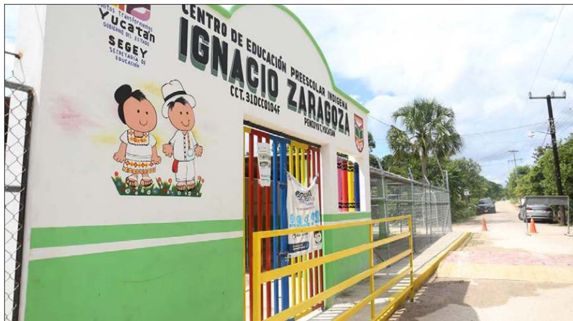
▲ En la comisaría tekaxéna de Pencuyut, Kekén y el ayuntamiento de Tekax entregaron banquetas alrededor del prescolar indígena Ignacio Zaragoza, así como un paso peatonal, señalética y una reja de protección.

“Veo que es una empresa que apoya mucho, igual cuando llega-