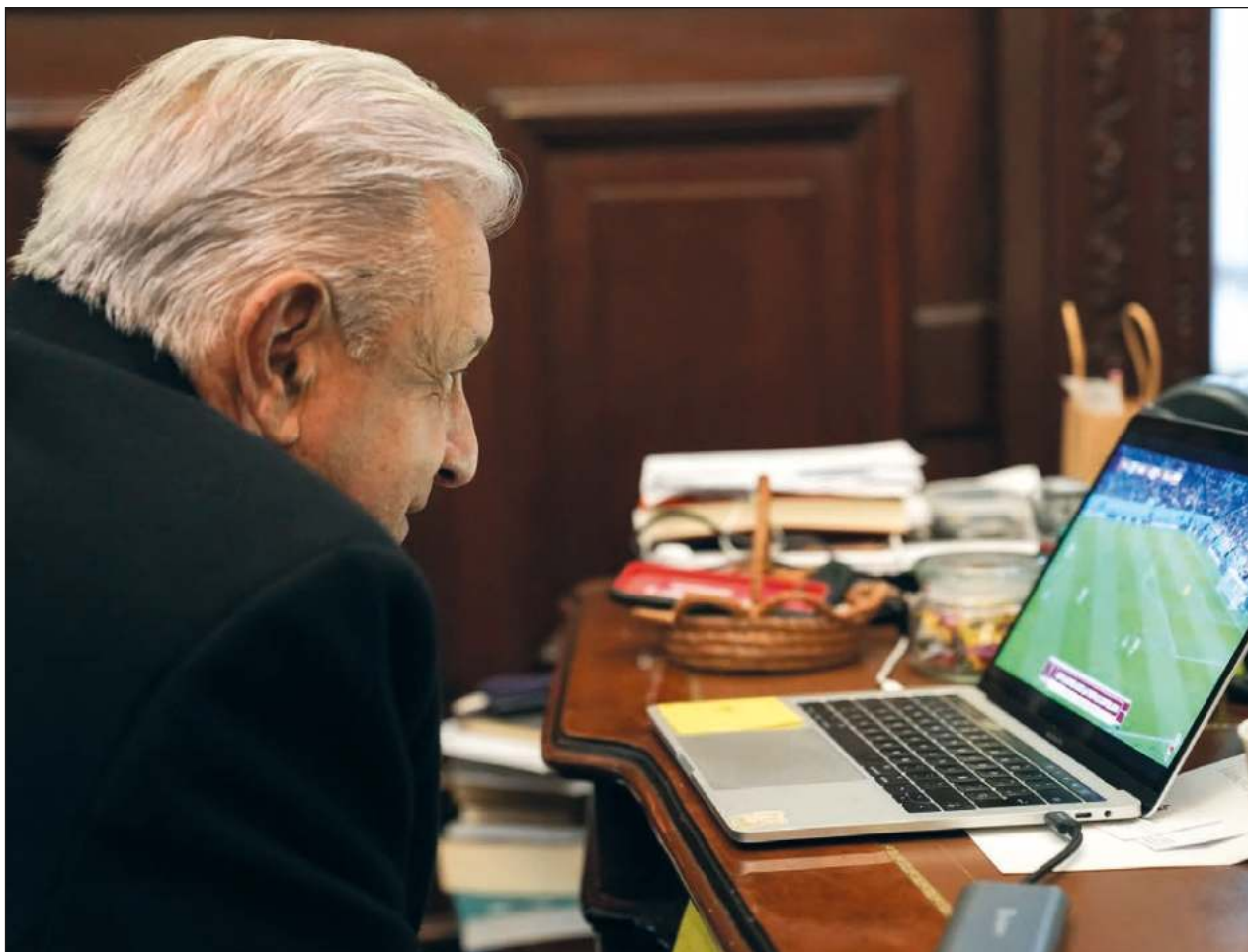
▲ C “Felicidades a la Selección Mexicana por alcanzar un punto obteniendo el empate. La diferencia, obviamente, se llama Memo Ochoa”, así expresó el presidente Andrés