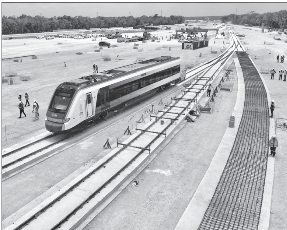
▲ Ya pueden entrar en función sistemas ferroviarios de Tren Maya, el de México-Toluca y el Interoceánico del Istmo, con la publicación en el Diario Oficial

Pese a ello, Grupo México mantiene operaciones "de manera ilegal".