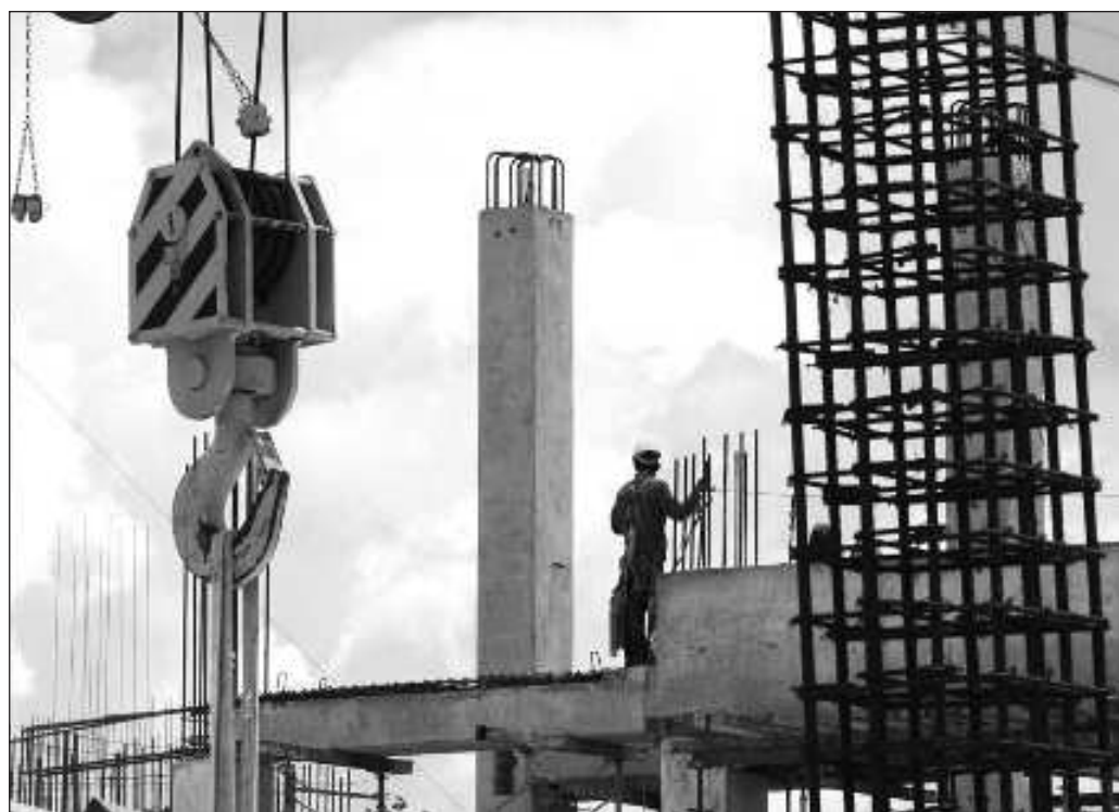
▲ El aumento poblacional de Yucatán, aunque con el histórico problema del crecimiento horizontal de sus asentamientos urbanos, hacen más difícil y costoso extender la red de servicios públicos.

Las vías, recordemos, van en ambas direcciones, por lo que una mejora en la infraestructura implica el acercamiento entre mercados regionales, y si entre mejores carreteras y un tren se disminuyen tiempos de traslado, la península podría hallar su destino como una zona de economía boyante.