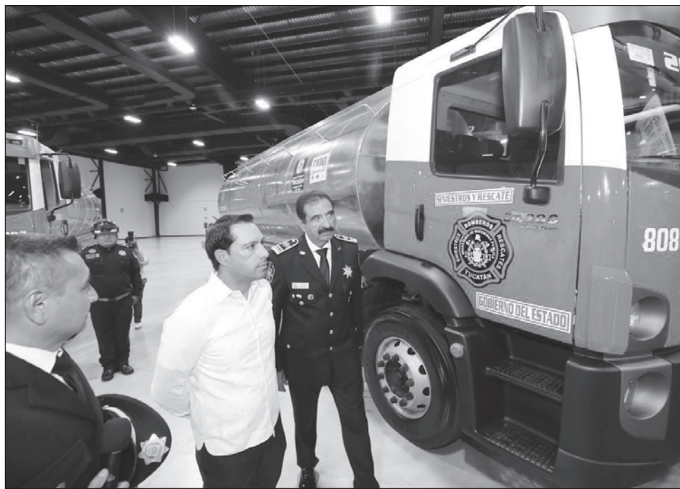
▲ El gobernador destacó que se está haciendo un esfuerzo sin precedentes para mejorar la infraestructura y fortalecer a la Secretaría de Seguridad Pública.

En ese sentido, el gobernador señaló que se está haciendo un esfuerzo sin precedentes para mejorar la in-