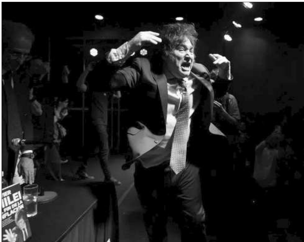
▲ El demente personaje, en los vídeos que circulan en redes sociales, además de gritar como un auténtico orate que se cree Savoranola redivivo dice, toda clase de groserías, sin que, obviamente, Tik Tok los elimine.

“Estoy pensando en convertirme al judaísmo y aspiro a llegar a ser el primer presidente judío de la historia argentina”, ha dicho en