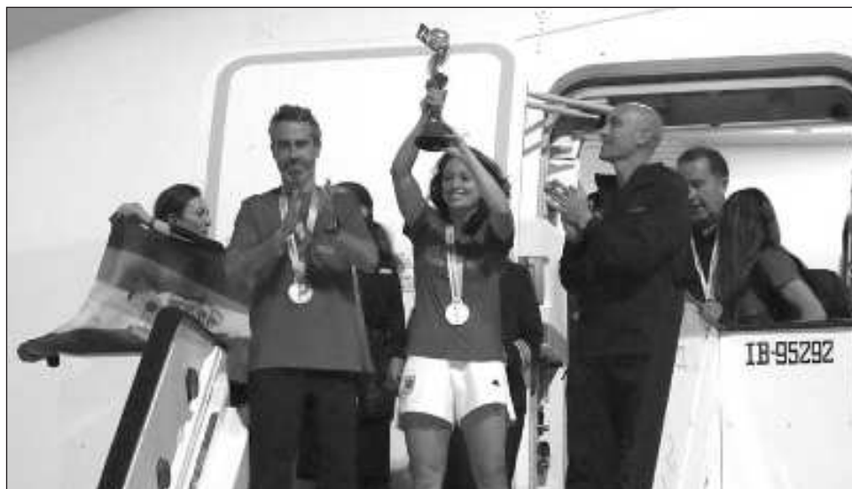
▲ La capitana de la selección española, Ivana Andrés, levanta el trofeo de la copa mundial, tras la llegada del equipo al aeropuerto internacional Madrid-Barajas. "La Roja" se impuso a Inglaterra en la final

El próximo torneo internacional de mujeres son los Olímpicos en París. Francia