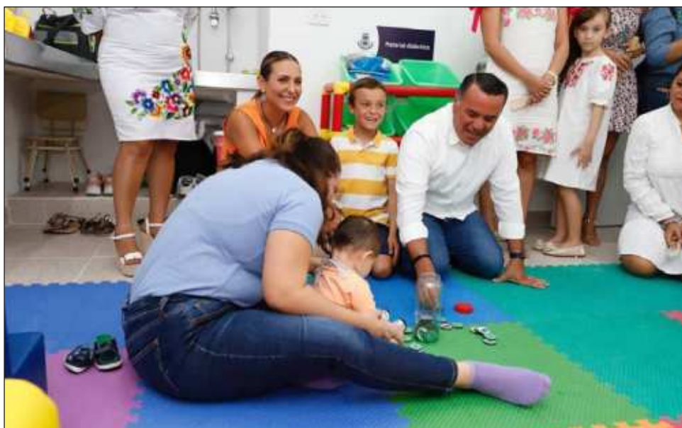
▲ El centro se ubica en la calle 60 por Calle 113 de la colonia Castilla Cámara, y forma parte de las acciones que se han concretado con apoyo del SIPPINA municipal.

El sitio brindará atención para el sano desarrollo prenatal y hasta los cinco años