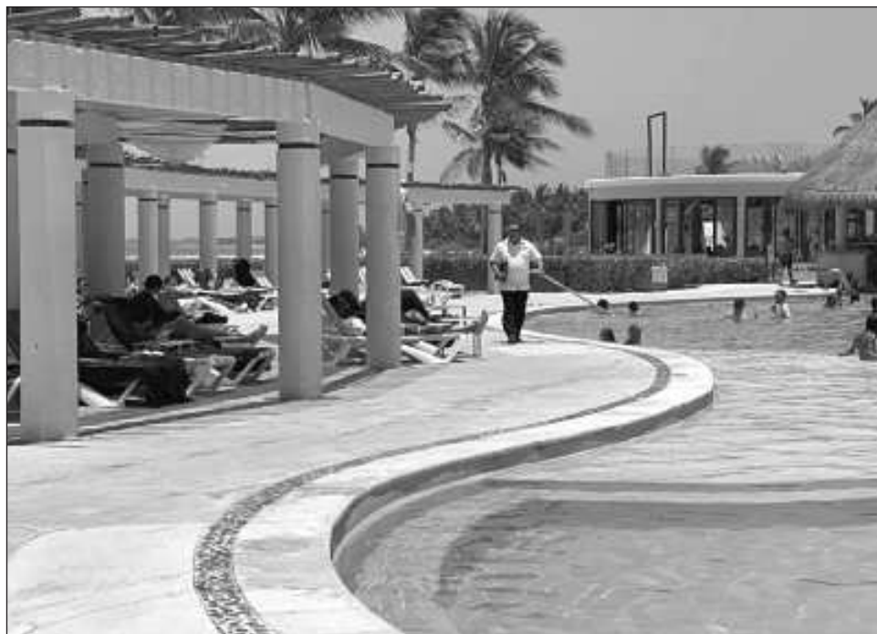
▲ El comisionado de la CROC puntualizó que 80 por ciento de la clase trabajadora es derechohabiente, pero no tiene atención digna de salud cercana y por ende tienen que desplazarse hasta Playa del Carmen o Cancún e incluso a Valladolid, Yucatán.

“Al gestionar con las empresarias y los empresarios directamente, se puede lograr un precio más justo; para que podamos ver estos productos exhibidos en tiendas departamentales, para verlos en restaurantes, en hoteles y en lugar de que lleguen a una central de abastos en la Ciudad de México y luego regresen acá y se compren a un precio mayor, mejor que se compren directamente y tener una mejor economía”, enfatizó.