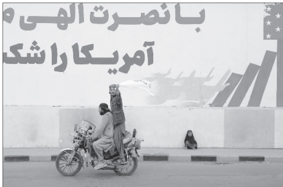
▲ El Alto Comisionado de la ONU para los Derechos Humanos, Volker Turk, subrayó que el documento “presenta una sombría imagen del trato a las personas relacionadas con el antiguo gobierno y las fuerzas de seguridad”.

El Talibán hizo un avance relámpago por Afganistán en las últimas semanas de retirada de las tropas estadounidenses y de la OTAN tras dos décadas de guerra. Las tropas afganas con for-