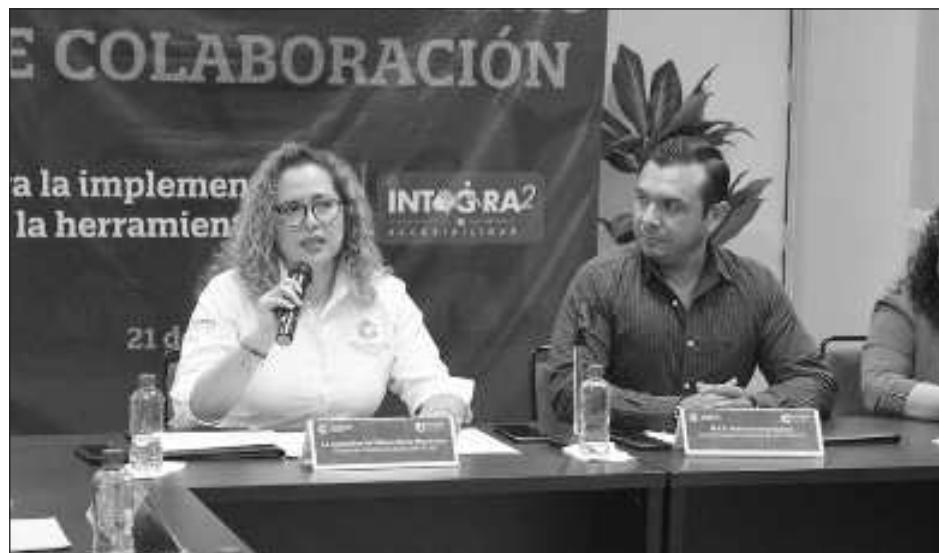
▲ Con la herramienta, a las personas con discapacidad auditiva, manual, visual, cognitiva, entre otras, se les facilitará la navegación en los portales web de instituciones públicas.

El software Integra2 es una herramienta creada por la Comisión Estatal de Acceso a la Información Pública del Estado de Sinaloa, para que las personas con discapacidad auditiva, manual, visual, cognitiva, entre otras, se les facilite el acceso o navegación en los portales web de las instituciones públicas. En este