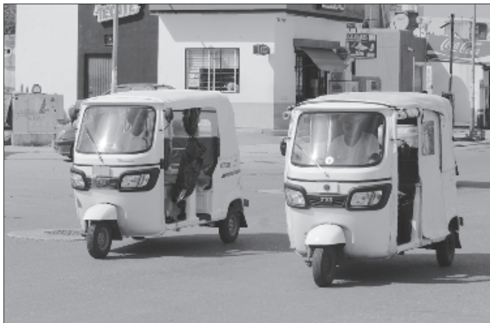
▲ El director del IET describió que los moto taxis serán para zonas y comunidades que no cuentan con transporte urbano, medida que desmienten transportistas.