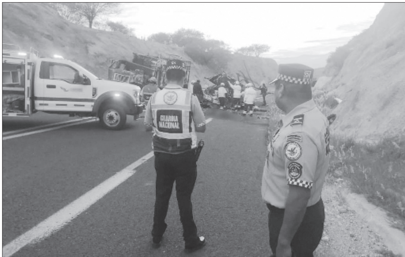
▲ El accidente ocurrió en el kilómetro 91 de la autopista, pasadas las 2 de la madrugada de este martes. Jesús Romero López, secretario de Gobierno de Oaxaca, indicó que el chofer del colectivo -propiedad de la empresa Servicios Integrales Blanesca SA de CV- se dio a la fuga.

Los agentes trasladaron los 16 cuerpos al descanso municipal de Tepelmeme, a unos 10 kilómetros del percance, mientras que llevaron a los más de 30 heridos a hospitales de Tehuacán, en el vecino estado de Puebla.