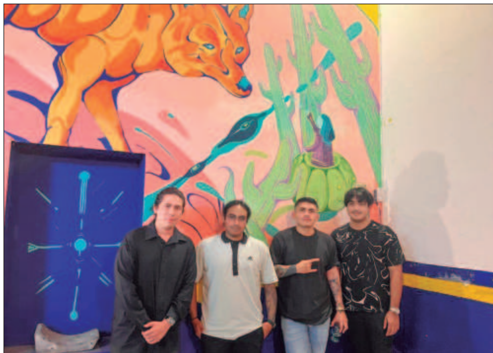
▲ "La invitación nos cayó en el momento que la banda estaba estancada porque ya habíamos hecho muchos intentos (...) ahora retomamos la motivación", dijo el bajista.

Ahora, luego de haber sido notificados de que participarán en el festival de metal, sienten la enorme responsabilidad de poner en alto el nombre de Yucatán.