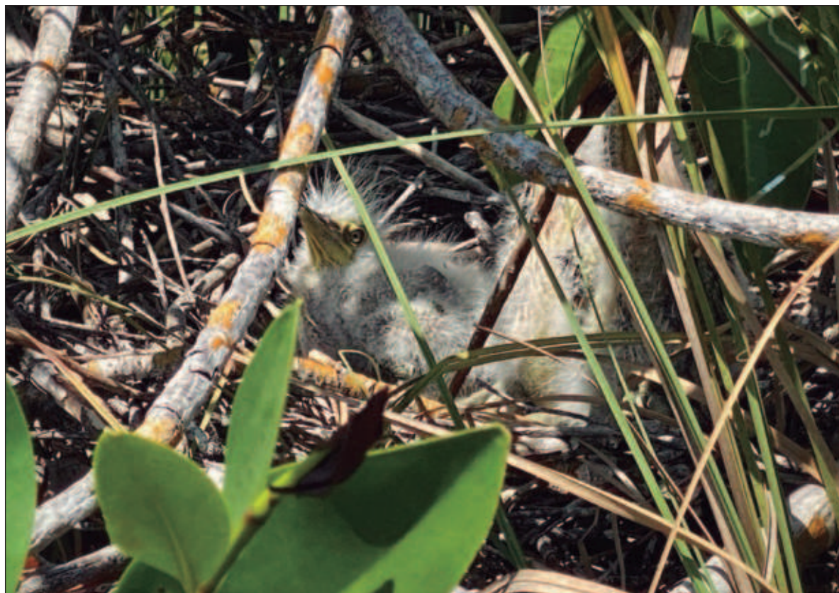
▲ La zona de protección de flora y fauna Manglares de Puerto Morelos es un ya vetusto proyecto, que nace de una propuesta con el propietario del Hotel El Cid.