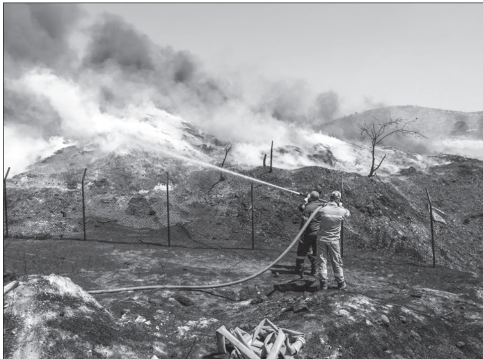
▲ Al no haber información de que residentes estén desaparecidos, es posible que se trate de extranjeros. La zona es un punto habitual de entrada de migrantes irregulares en Grecia.

El lunes fueron hallados muertos un presunto migrante y un pastor. Las llamas siguen propagándose