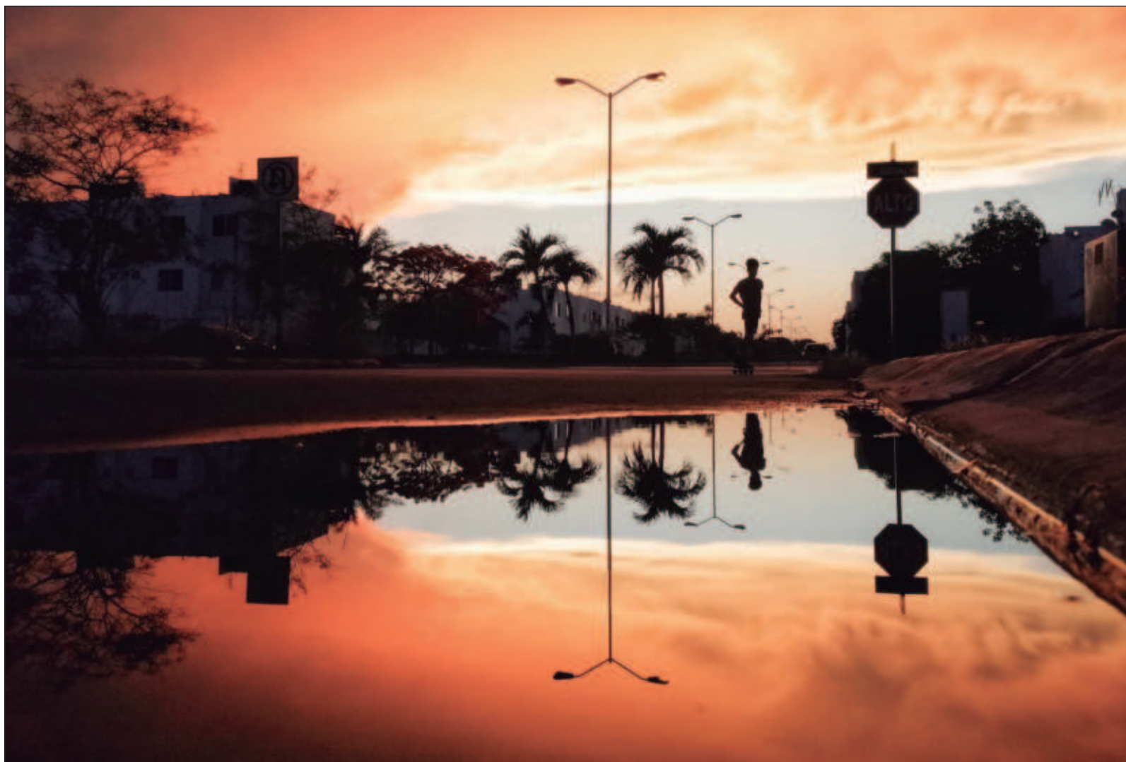
▲ "No hay atardeceres más bellos que los de Yucatán después de una lluvia, presumimos".

Aún sin viento, la alegría sigue moviendo la cola, animada por los suspiros que provoca la memoria; la felicidad de tener ahora más excusas para levantar la mirada y de sentirnos orgullosos de lo que fuimos, somos y seremos. Eso es vivir en este Estado de ánimo. Esto es Yucatán.