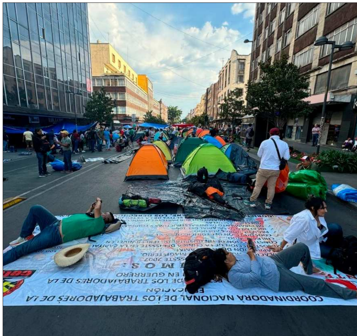
▲ "Desde hace unas semanas hemos visto el movimiento de la CNTE reclamando la erogación de la nueva forma de jubilación para regresar a la antigua. La respuesta del gobierno ha sido que no hay recursos suficientes".