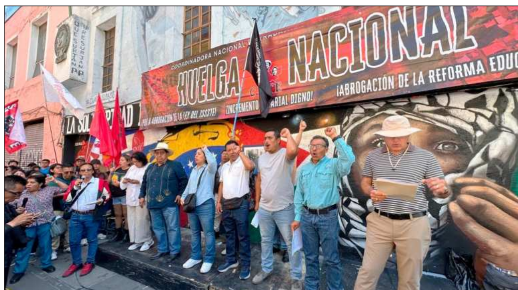
▲ El desarrollo de talentos difícilmente se dará en aulas con más de 50 alumnos o con profesores que deben atender a más de dos grupos en una jornada porque la escuela es multinivel.

Así, los 800 millones padecen ante las necesidades reales de la educación en México, que son también debilidades estructurales. El desarrollo de talentos difícilmente se dará en aulas con más de 50 alumnos o con profesores que deben atender a más de dos grupos en una jornada porque la escuela es multinivel. Agreguemos que hay zonas que se han despoblado y otras en las que no hay acceso a una primaria o secundaria, y lo que hace falta son docentes para atender a esas poblaciones en crecimiento. Para eso, 800 millones de pesos son a todas luces insuficientes, pero para varias generaciones pueden ser la diferencia entre una formación deficiente y un cambio en las posibilidades de desarrollo personal y comunitarios.