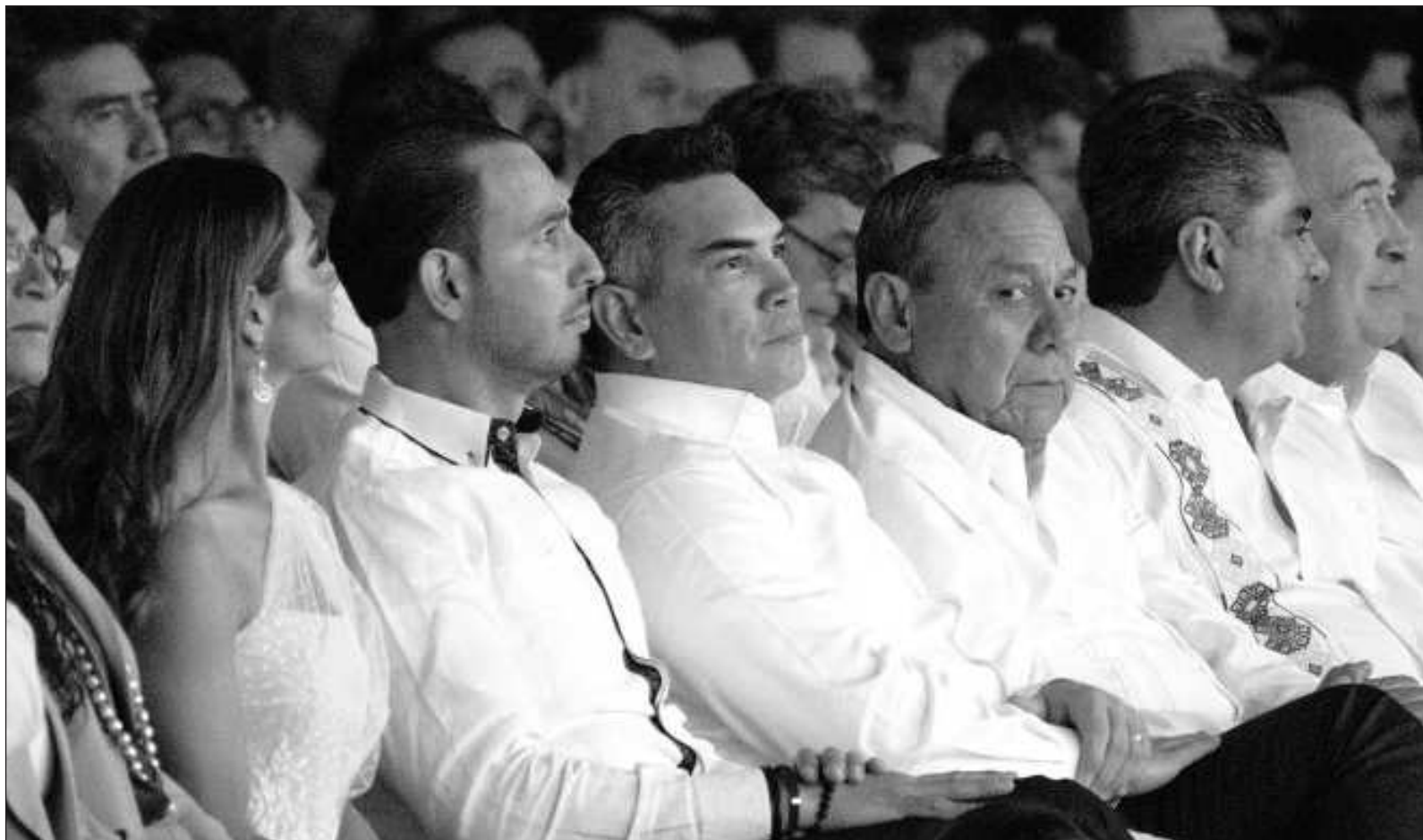
▲ "Los gobiernos de coalición han terminado en convertirse en simple repartición de un botín, más que ejercicios plurales del poder".