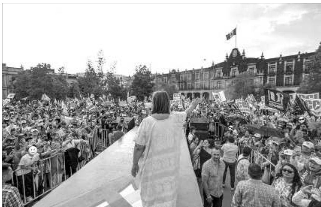
▲ No es la primera vez que la ex senadora y el personal de su campaña intentan engañar a la opinión pública con sondeos que no son lo que quieren hacer creer.

En lo que concierne a las acciones de la derecha mexicana y las elecciones del 2 de junio, lo importante es no perder de vista que lo que cuenta es el voto depositado en las urnas, así como atajar las pretensiones de estafar a la ciudadanía con estudios falsos o sacados de contexto que contradicen al resto de los sondeos. El Instituto Nacional Electoral ya dispone de herramientas para señalar qué encuestas carecen de metodologías válidas, pero está claro que se requiere reforzar la lucha contra la difusión de propaganda disfrazada de información. Ciertamente, el árbitro de los comicios es el primer responsable de dicho esfuerzo, pero cualquier avance será limitado mientras los candidatos, políticos y la pléyade de empresas a su servicio (agencias de publicidad, consultoras, despachos de relaciones públicas) insistan en fabricar falsificaciones del sentir ciudadano.