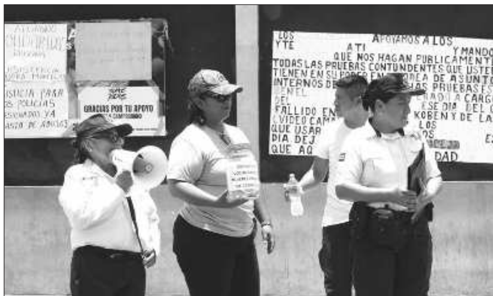
▲ Los elementos y ciudadanos, parados en las afueras de la SPSC han recibido agua, comida, refrescos, y hasta gasolina, lo necesario para continuar con sus labores.

Desde hace 60 días que la manifestación inició, el gobierno del estado los ha presionado reteniendo sus salarios, quitándoles las unidades, atacando a quienes han sido los voceros, e incluso dio de baja a siete elementos, y a algunos los acusó recientemente de recibir fuertes depósitos en cuentas bancarias personales como