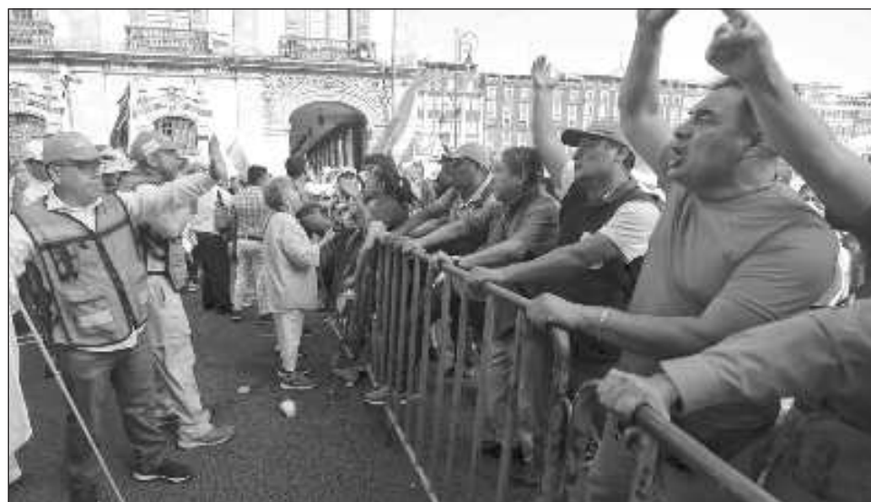
▲ “Imagínense la traición que significaría que nosotros, que siempre nos movilizamos en el Zócalo, ahora negando la posibilidad de que la gente se manifieste”, dijo el mandatario.

“¿Cómo voy a ordenar yo? Ni que estuviese también yo de ocioso, si tengo