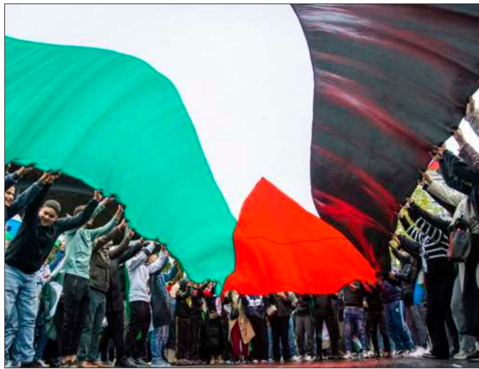
▲ El anuncio por triplicado y casi simultáneo podría generar algo de inercia para el reconocimiento de un Estado palestino por parte de otros países de la Unión Europea.

La decisión de la ONU de 1948 que creó Israel planteaba un Estado palestino contiguo, pero unos 70 años después, el control de los territorios palestinos sigue dividido y su candidatura a una membresía plena en Naciones Unidas ha sido rechazada.