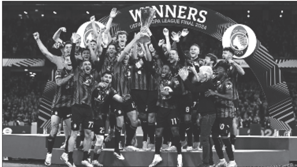
▲ Atalanta logró su primer título continental al derrotar con autoridad al Bayer Leverkusen.

El Atalanta y su técnico veterano Gian Piero Gasperini son protagonistas de una