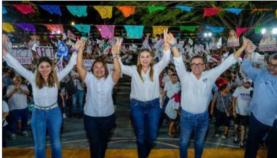
▲ La candidata a la alcaldía de Mérida participó en el cierre de campaña en el Distrito 1, donde urgió a los yucatecos a salir a votar este 2 de junio.

La aspirante a la alcaldía de Mérida dijo que al ejercer el voto tenemos la enorme responsabilidad de