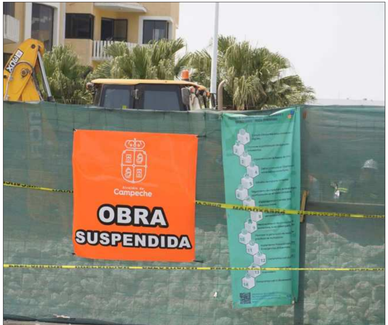
▲ La gobernadora añadió que es la Sedena el organismo a cargo de la obra, por lo que ya está estudiado el proyecto, es viable y sólo busca abonar a la ciudad, ya que la construcción y el mantenimiento de dicho Tren Ligero estará a cargo de la Federación.