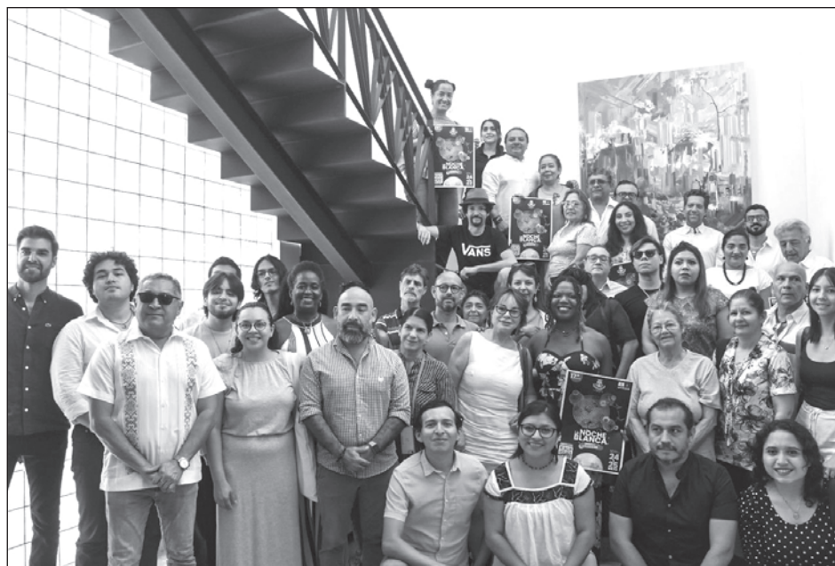
▲ Un total de 32 galerías de Mérida mostrarán la riqueza que ofrece el arte, a las que suman actividades de movilidad y charlas de aprendizaje.

En la Víspera de La Noche Blanca , participarán 32