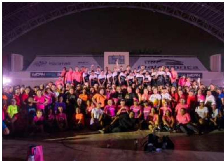
▲ La iniciativa de Fundación Bepensa ha beneficiado a más de 200 mil personas en los estados de Yucatán, Quintana Roo y Campeche.

El impacto de esta iniciativa es significativo, cubriendo 48 parques