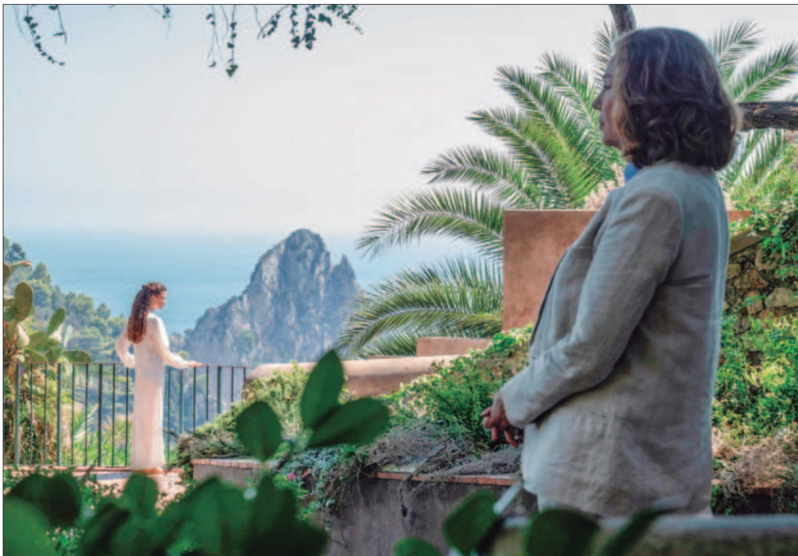
▲ "La cámara de Sorrentino es la primera en estar embelesada por la protagonista; en consecuencia, la narrativa sufre y la película se vuelve una colección de viñetas formalistas. También Nápoles se vuelve parte de esa mirada admirativa y Parténope podría funcionar como publicidad turística". Fotograma de Parténope