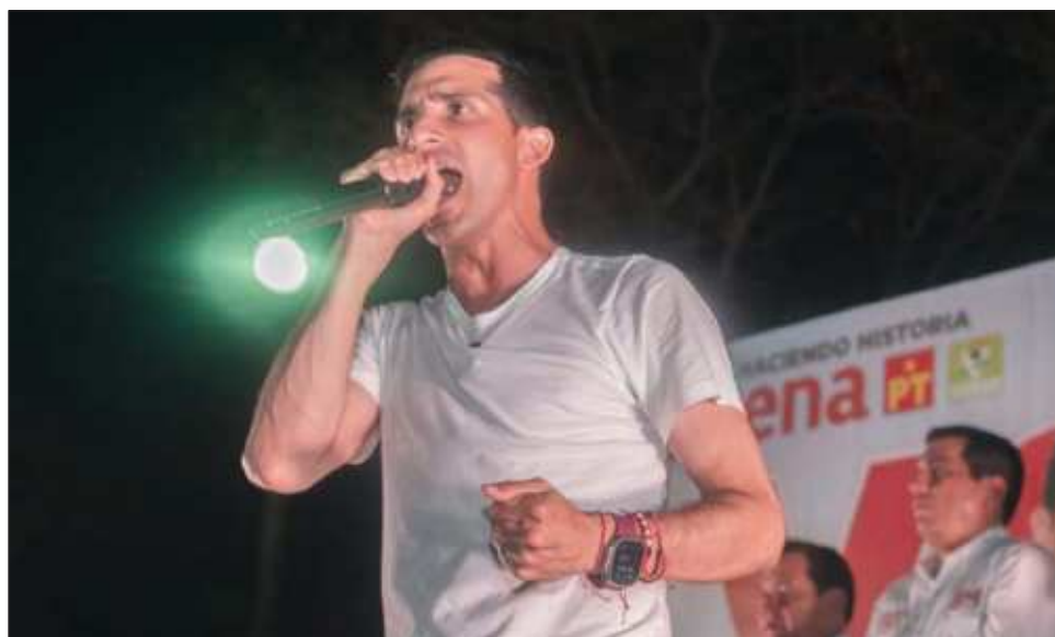
▲ La propuesta Una Gran Mérida Segura está dividida en cinco ejes que integran acciones orientadas a impulsar la sostenibilidad, orden, bienestar y competitividad.

“Brindaremos capacitación en inclusión y derechos humanos a los policías, fortaleceremos con tecnología y cámaras de videovigilancia para que nuestra ciudad siempre esté segura y programas de prevención de la violencia y el delito”, aseguró el abanderado de Morena, quien también presentó un modelo innovador de proximidad que pone a los ciudadanos como prioridad.