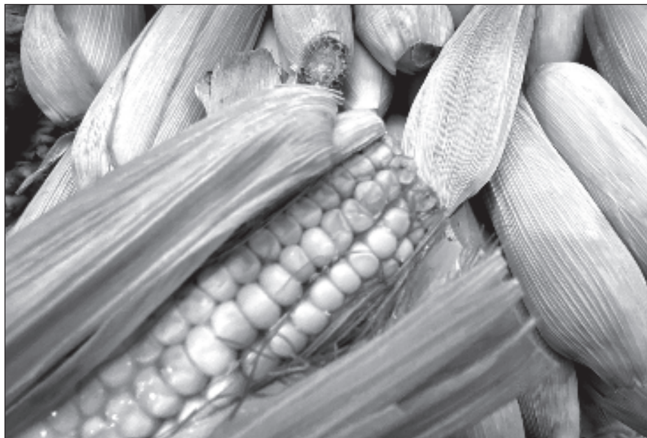
▲ La Octava Feria de las Semillas en el Santuario de Usos y Constumbres de Sacamuy, tiene como objetivo promover las tradiciones mayas y el intercambio de grano.

Dijo que a través de la feria de “podemos crear comunidad, se apoya a las tradiciones ancestrales y sobre todo al intercambio de semillas, que es importante en nuestros pueblos