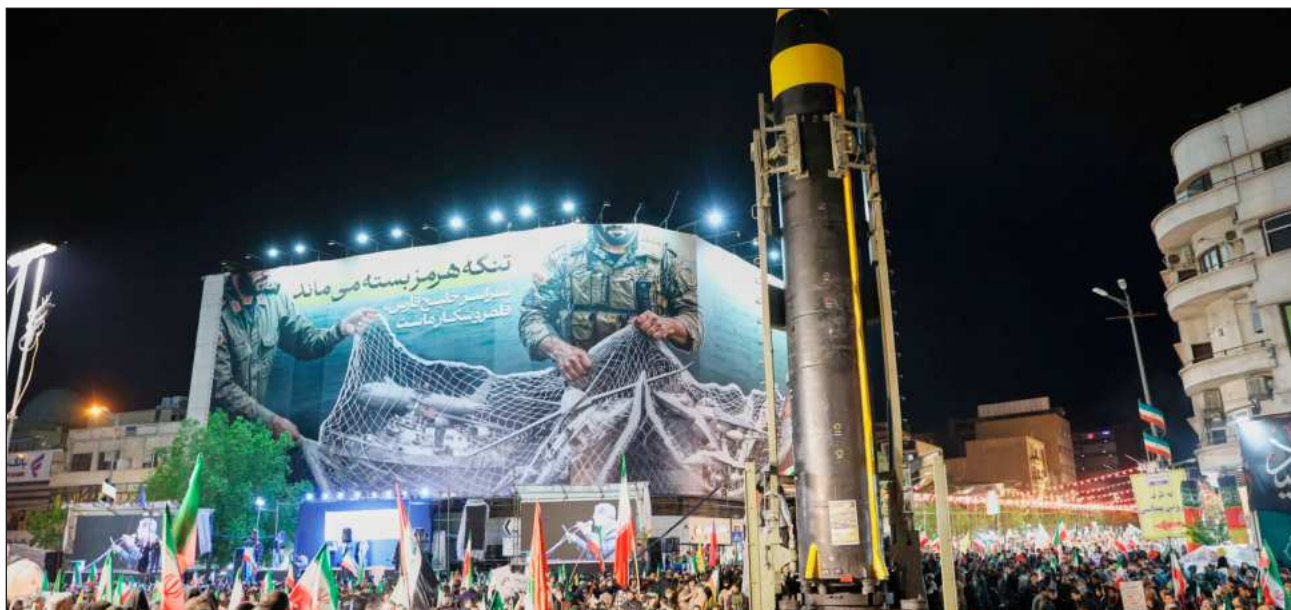
▲ En los hechos, el enfrentamiento entre EU e Irán ha estrangulado casi todas las exportaciones a través del estrecho.

Las fuerzas iraníes no violaron la tregua ya que las embarcaciones no eran de EU