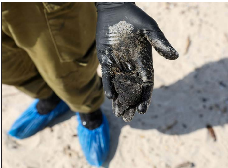
▲ Investigadores del Ministerio de Agricultura israelí reportan la muerte de miles de especies animales por intoxicación.

La Autoridad de Naturaleza y Parques de Israel ha