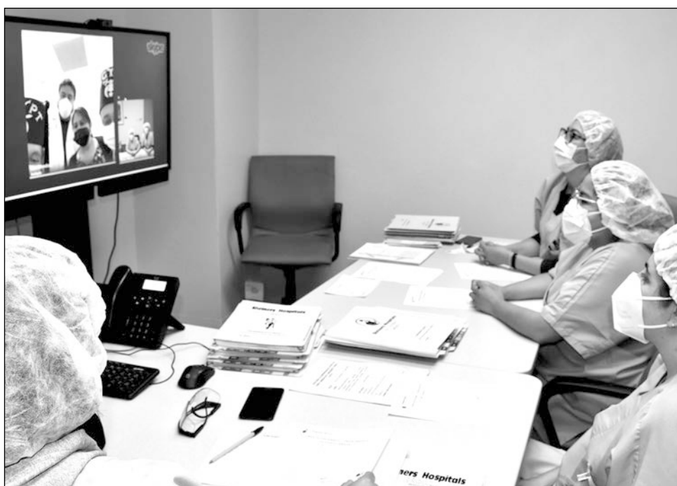
▲ La telemedicina busca acercar el hospital a más personas, evitando traslados a la Ciudad de México u otros lugares.