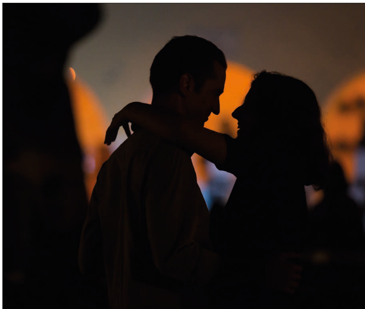
▲ En el Discurso sobre las pasiones del amor , Pascal plantea la idea de que, entre las grandes pasiones, el amor compite con la ambición aun cuando sea común relacionarlas entre sí.

Torri dice en uno de sus aforismos: "En el amor más espiritual hay algo de sensual. En el más sensual hay mucho de espiritualidad". Postular este equilibrio y vivirlo es un don superior a todas las pretensiones vanas y a las apariencias que confunden el juicio.