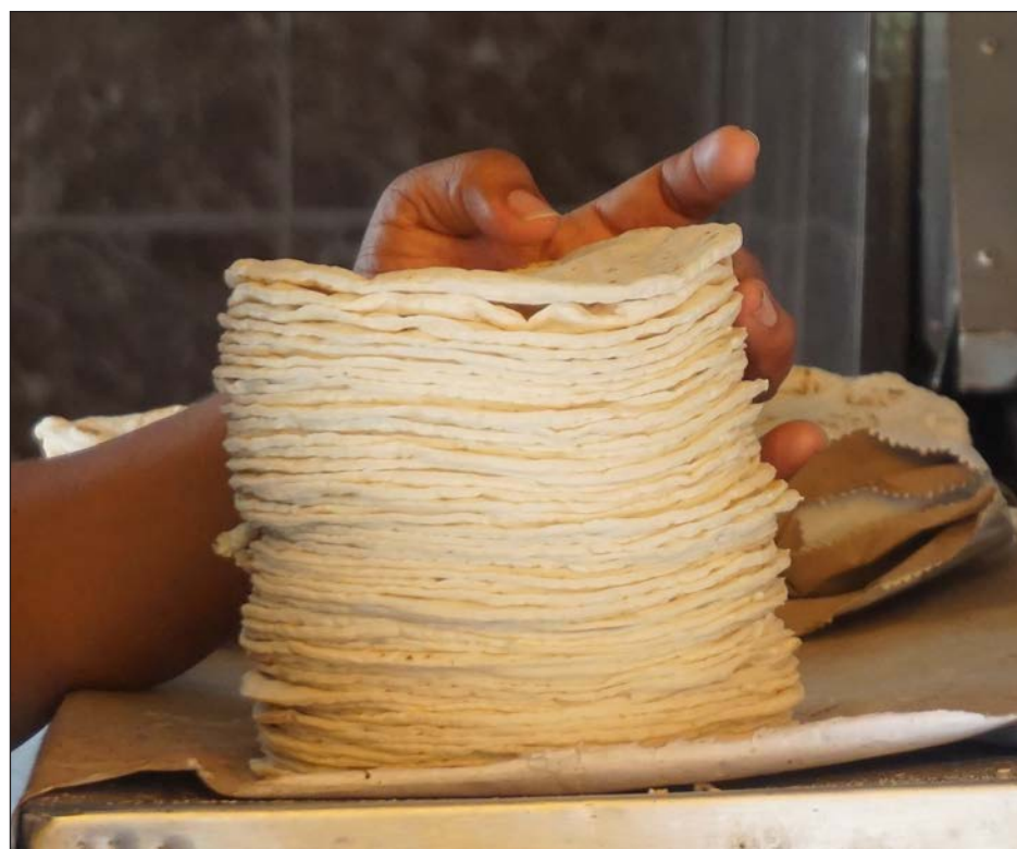
▲ El incremento de un peso por kilo de tortillas será absorbido por los consumidores finales, quienes tienen a este alimento dentro de la canasta básica.

Recordaron que tienen un permiso provisional acordado con el Ayuntamiento de Campeche para que cada molino y tortillería albergue a siete repartidores o mototortilleros, pero mencionaron que buscarán una reunión con la comuna para ampliar el registro de repartidores antes que comiencen con las revi-