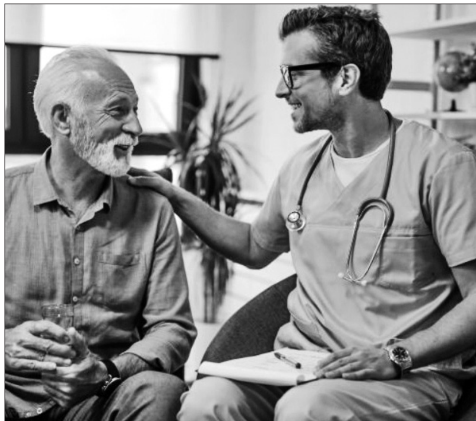
▲ La decisión coincide con la campaña publicitaria, de 20 millones de dólares, para convencer a la población de vacunarse y contrarrestar las teorías conspirativas contra la vacuna.

Se espera que el Parlamento apruebe esta semana la ley y se cree que ante lo inevitable, Face-