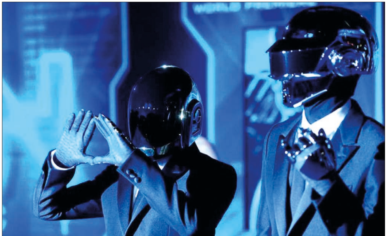
▲ El dueto francés deja una discografía de cuatro álbumes de estudio, tres extended play y otro material en directo y recopilatorio.

En 2001, el dúo francés lanzó Discovery , un álbum todavía más popular con canciones como One more time y Harder, better, faster, stronger .