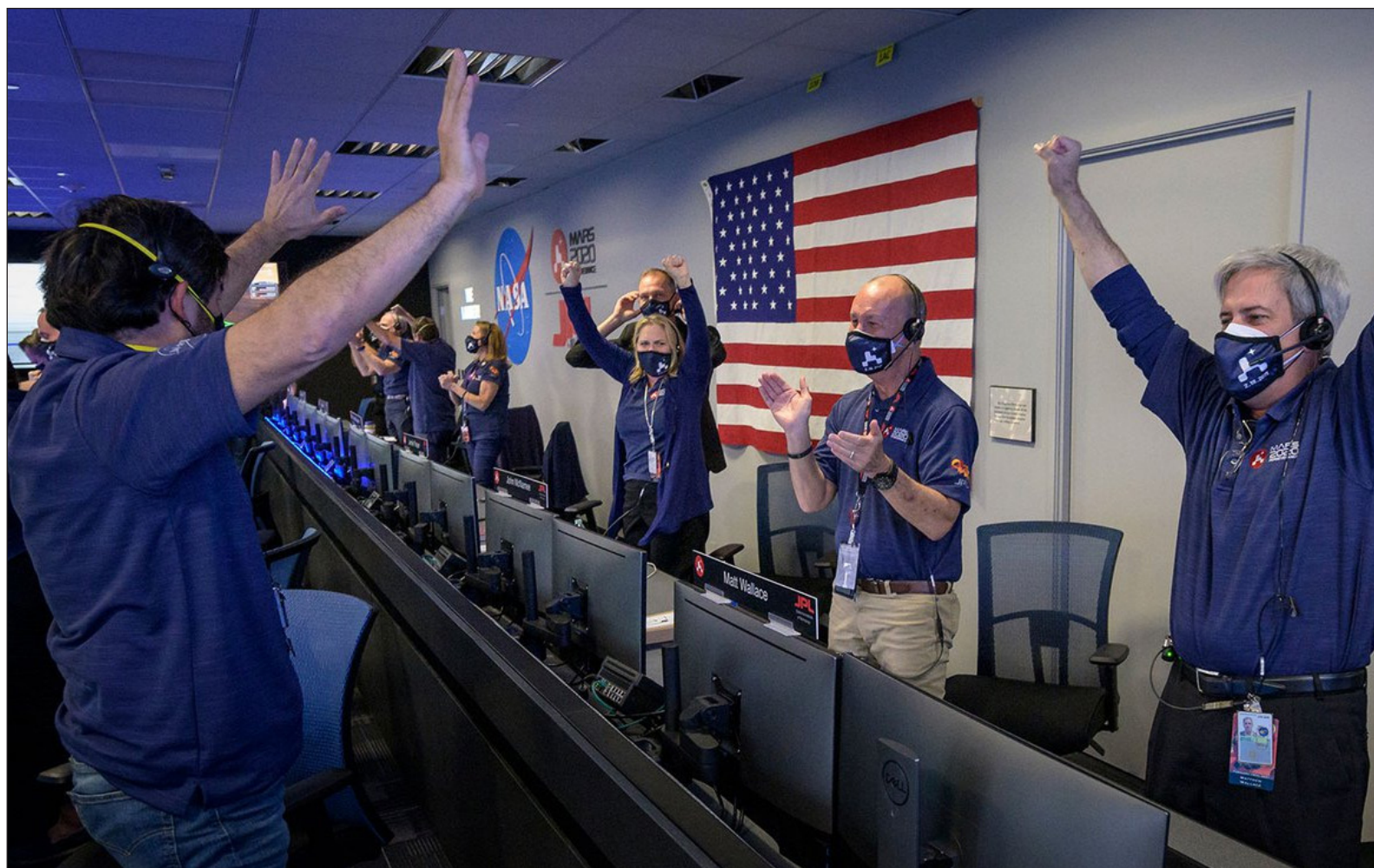
▲ La misión del Perseverance es una demostración de poderío en financiamiento, ciencia y tecnología que no están al alcance de varios países, incluyendo el nuestro.