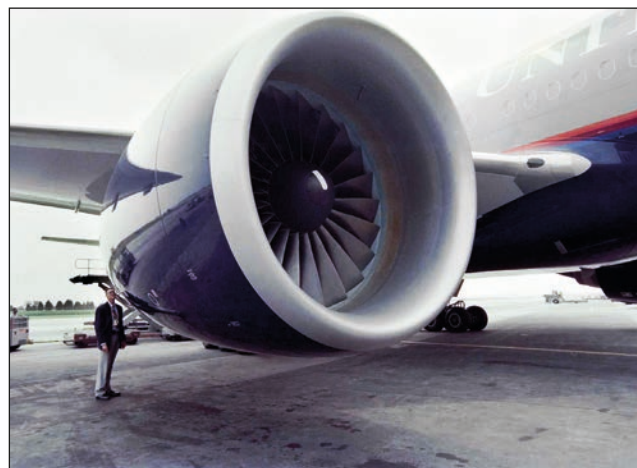
▲ La FAA de EU ordenó inspecciones adicionales en algunos aviones de pasajeros del modelo Boeing 777.

Japan Airlines (JAL) y All Nippon Airways (ANA)