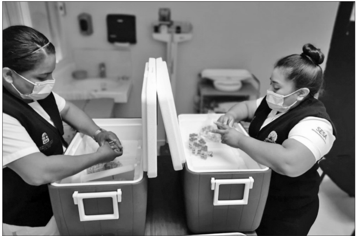
▲ El pasado 14 de febrero, el estado recibió un embarque de más de 6 mil dosis para personas mayores de 60 años de edad. El avance porcentual de la aplicación de las dosis recibidas es del 78%.