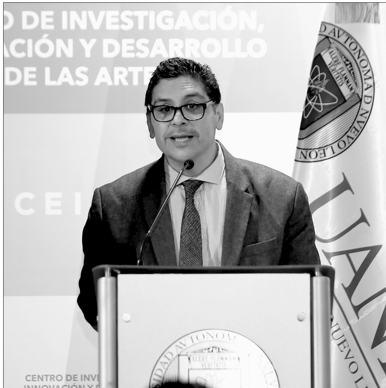
▲ La Secretaría de Extensión y Cultura de la UANL debió reestructurarse, particularmente en favor de los creadores artísticos, indicó su titular.

Esa casa de estudios, continúa Garza Acuña en entrevista con La Jornada, "ha sido un faro de la cultura nuevoleonense, que es abierta, plural y diversa. La cultura es el núcleo, el meollo de la vida universitaria, como planteaba Alfonso Reyes en su texto Voto por la Universidad del Norte: cultura y educación para todos. Así es. Así ha sido. Así debe ser hoy más que nunca, cuando las humanidades deben permear toda actividad para la formación de personas libres,