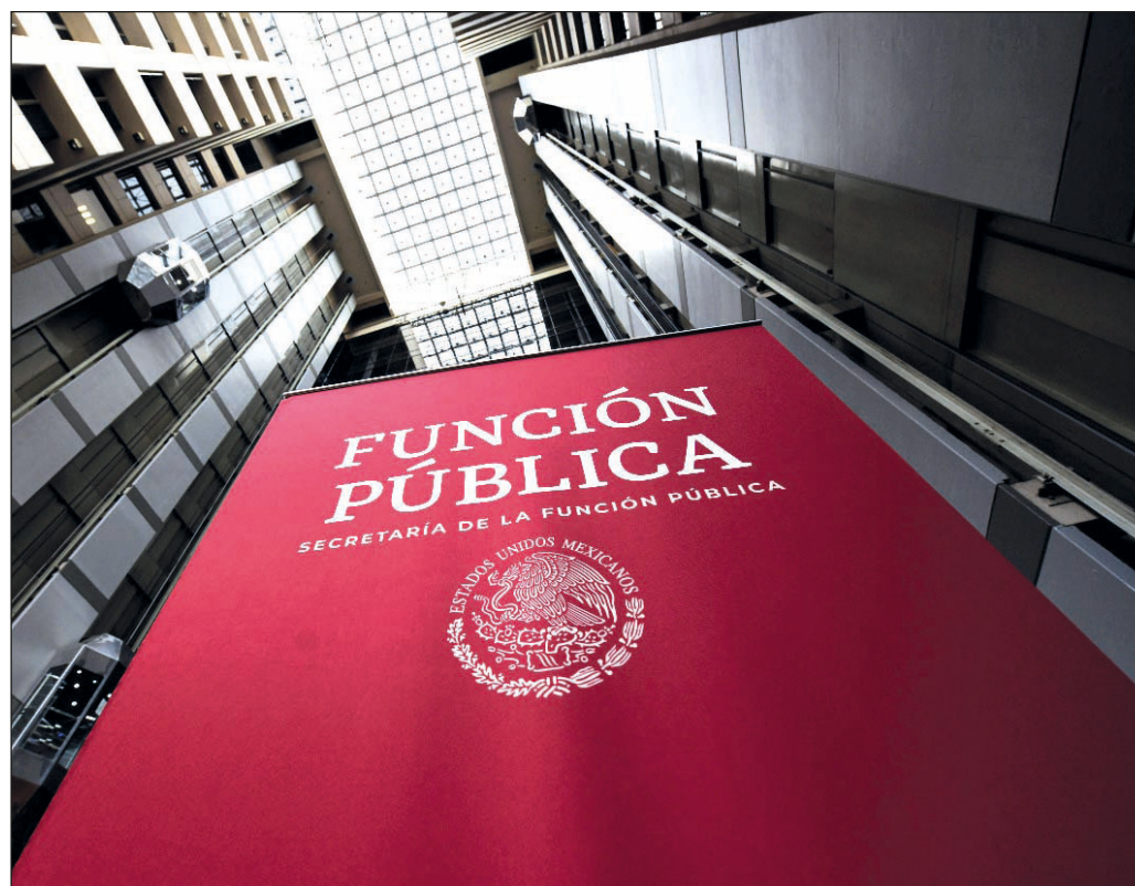
▲ La ASF de la Cámara de Diputados señaló que la Secretaría de la Función Pública mostró resistencias al proceso de fiscalización, al no permitir el acceso al equipo auditor a sus instalaciones.

En este sentido, la SFP debe tomar nota de los señalamientos y emprender las acciones necesarias, a fin de mejorar tanto su funcionamiento interno como su labor de control sobre el conjunto de la administración pública federal. En la observancia de esta función no debiera ser un obstáculo que la Función Pública forme parte del mismo aparato gubernamental al que vigila, pues resulta evidente que las irregularidades –presuntas o reales– llegarán al conocimiento de los ciudadanos más temprano que tarde, y que el intento de disimularlas no ayuda en nada a un proyecto que ha hecho del combate a la corrupción su principal bandera política.