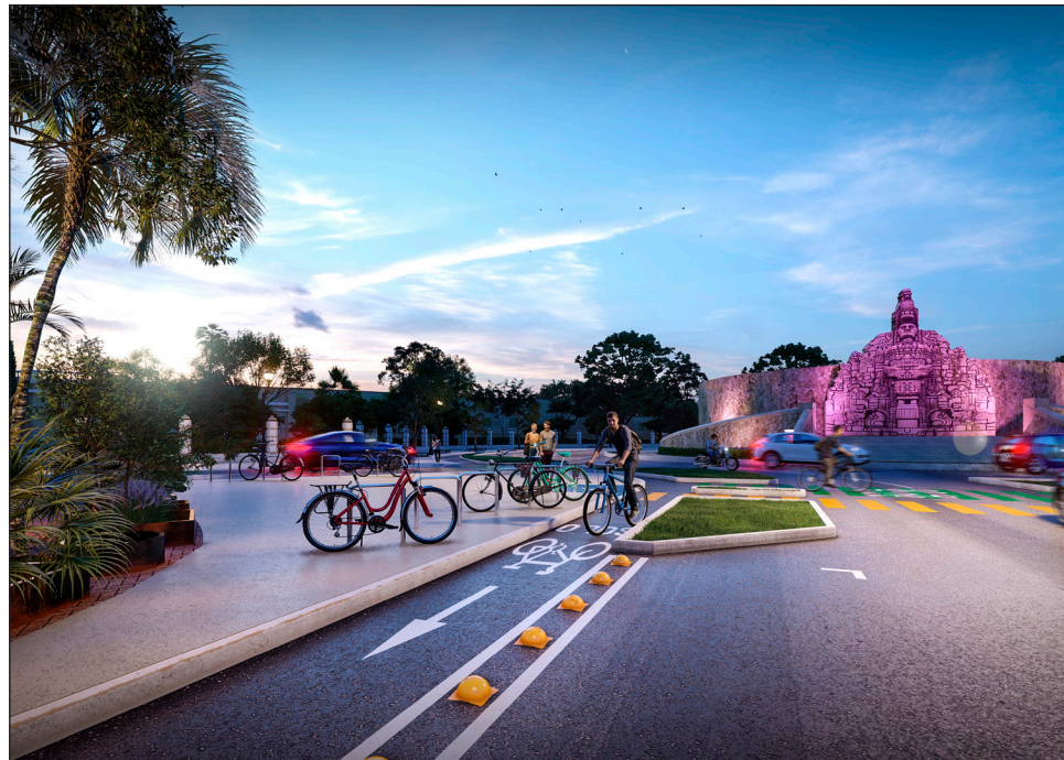
▲ Empresarios consideran que deben haber más espacios para estacionamiento de automóviles.

No obstante, el también dirigente del Consejo Empresarial Turístico de Yucatán (Cetur), aclaró que no están en contra de este proyecto en Paseo Montejo, sino que quieren que se haga sin