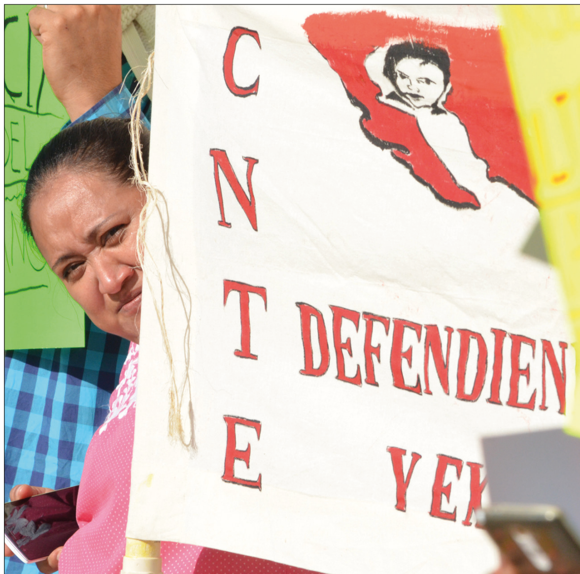
▲ Los docentes críticos deben enfrentar la ética de mercado, el entrenamiento que ha venido dominando al sistema educativo.

Fuera del magisterio, por ejemplo para un biólogo, es imprescin-