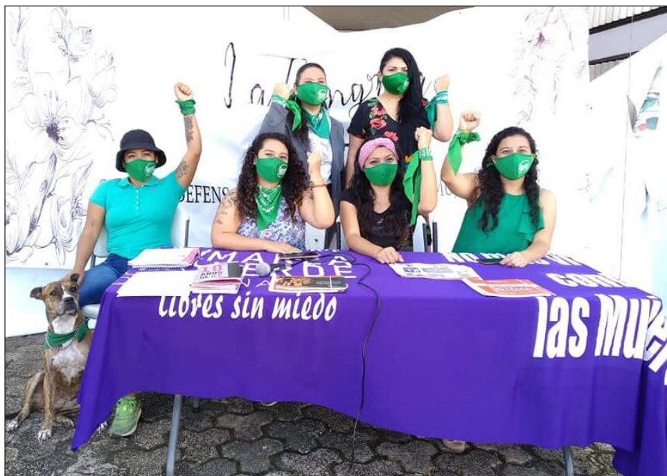
▲ Las integrantes de la RFQ responsabilizaron al Estado de impedir que escale la violencia.

Llamaron a las autoridades a tomar acciones en contra de quienes difundieron mensajes de odio y que criminalizan a las defensoras de derechos humanos; durante el fin de semana, grupos autodenominados “pro vida” repartieron panfletos en las