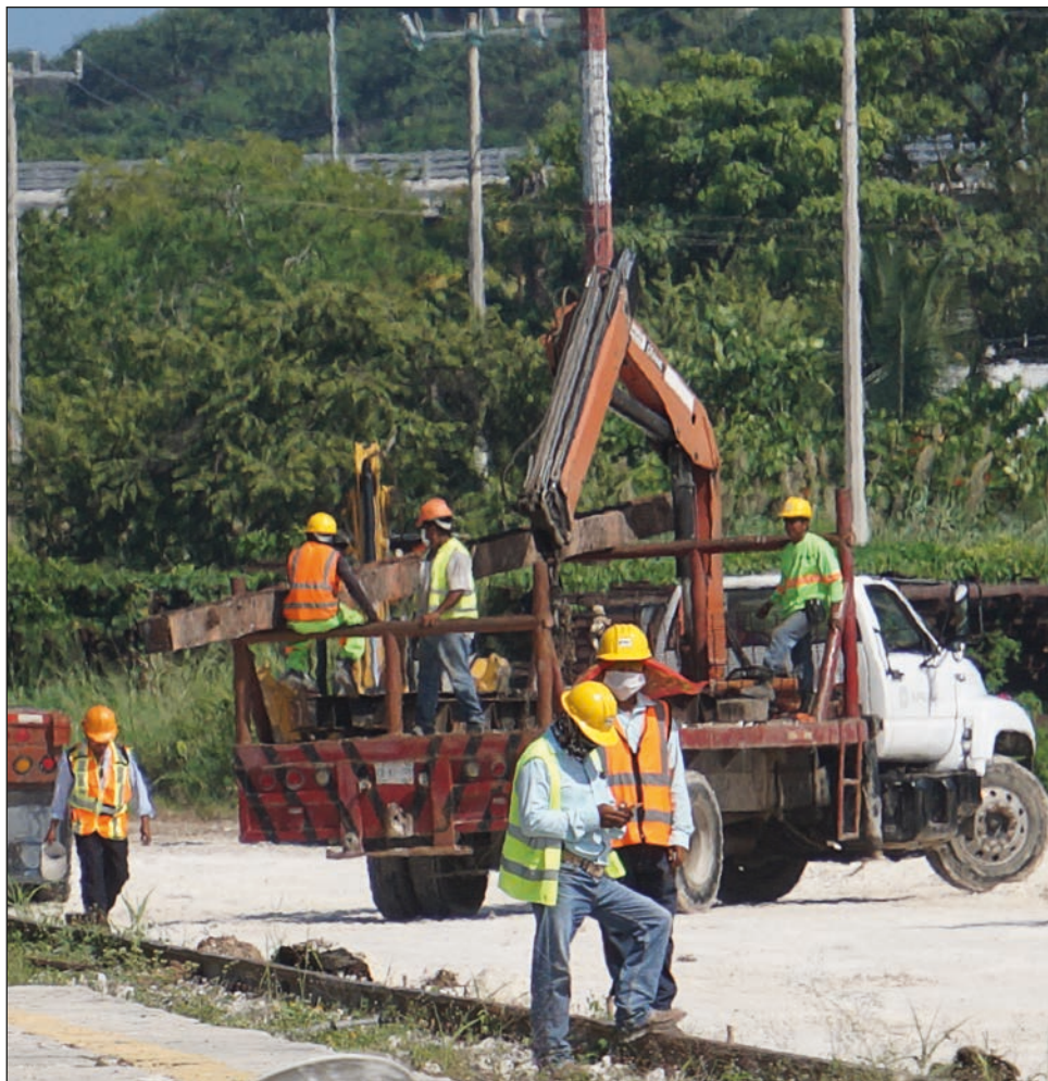
▲ Para el Colectivo Kanan, es importante que se detenga el proyecto y evitar daños irreparables a los derechos de todas las personas.

Por ahora, según explicaron, queda esperar a que las autoridades respondan la demanda y se dicte una sentencia, que esperan sea favorables en los próximos meses.