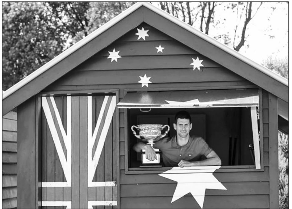
▲ Novak Djokovic, flamante monarca del Abierto de Australia.

Es algo que no se aparta de lo que el propio Federer