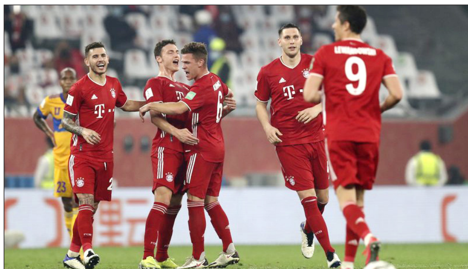
▲ El Bayern ha batallado desde que conquistó el Mundial de Clubes ante los Tigres.

La Lazio llega en buena forma antes de su primer