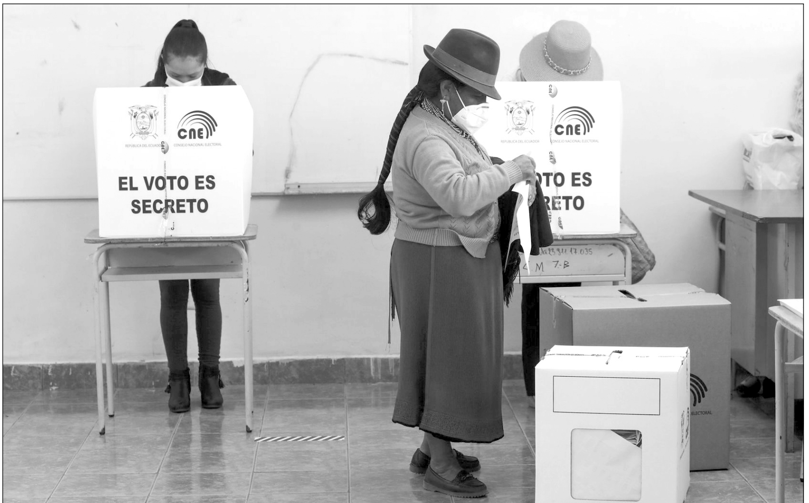
▲ En esta ocasión, las elecciones para la presidencia se vieron trastocadas por la pandemia.